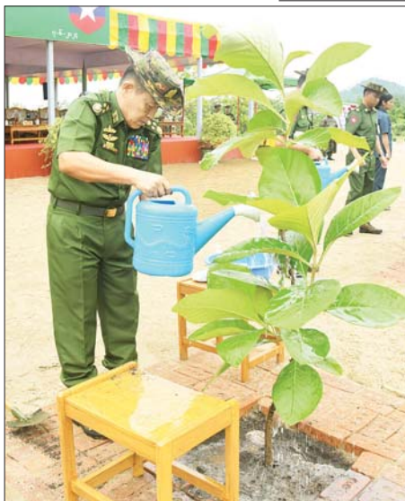
နိုင်ငံတော်စီမံအုပ်ချုပ်ရေးကောင်စီဒုတိယဥက္ကဋ္ဌ ဒုတိယတပ်မတော်ကာကွယ်ရေးဦးစီးချုပ် ကာကွယ်ရေးဦးစီးချုပ်(ကြည်း) ဒုတိယဗိုလ်ချုပ်မှူးကြီး စိုးဝင်း ရတနာတန်းဝင်ကျွန်းပင်ကို စိုက်ပျိုးပေးစဉ်။