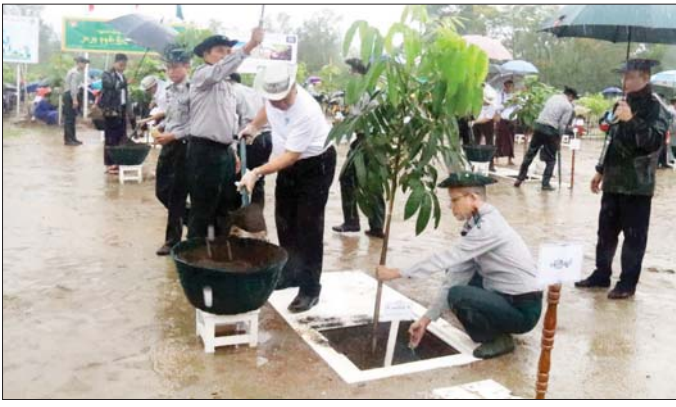
ခင်စန်းမြင့်(ပြန်/ဆက်)

အဆိုပါ အခမ်းအနားတွင် လူဝင်မှုကြီးကြပ်ရေးနှင့် ပြည်သူ့အင်အားဝန်ကြီးဌာန မြို့နယ်ဦးစီးမှူးရုံးမှ ဝန်ထမ်းများက ၂၀၂၄ ခုနှစ် ပြည်လုံးကျွတ် သန်းခေါင်စာရင်း ကောက်ယူရေး အသိပညာပေး လက်ကမ်းစာစောင်နှင့် အီလက်ထရောနစ် မှတ်ပုံတင်စနစ် e-ID အကြောင်းပါ အသိပညာပေး လက်ကမ်းစာစောင်များကို ပြည်သူများထံသို့ ဖြန့်ဝေပေးခဲ့ကြောင်း သိရသည်။