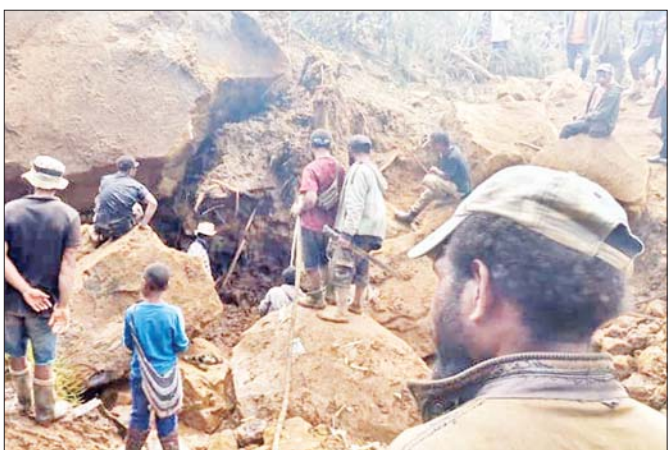
နေထိုင်နေကြသည့် ဒေသ ၁၀၀၀ ကျော်ကို တောင်းဆိုလျက်ရှိသည်။ ကယ်ဆယ်ရေးလုပ်ငန်း ပြည်နယ်အစိုးရက အင်နီအိတ်ချီက

ပို့တံမော့စတီ ဇွန် ၇ ပါပူအာနယူးဂီနီနိုင်ငံ၌ ကြောက်မက်ဖွယ် မြေပြိုမှု ဖြစ်ပေါ်ခဲ့ခြင်းဖြစ်သည်။ သေဆုံးသူ ၁၀ ဦးဟု အတည်ပြုခဲ့သော်လည်း မြေပြိုမှုပမာဏကြီးမားသည့်အတွက် အမှန်တကယ်သေဆုံးသူဦးရေကို သိရှိရန်ခက်ခဲသည်။ အပျက်အစီးများအောက်တွင် နှစ်မြှုပ်နေသည့် လူပေါင်း ၂၀၀၀ ထက်မနည်းရှိသည်ဟု အစိုးရက ပြောသည်။ အန္တရာယ်များပြားသည့် အခြေအနေများကြောင့် ကယ်ဆယ်ရေးလုပ်ငန်းများတွင် အဟန့်အတားများဖြစ်ပေါ်ခဲ့ရသည်။ အဓိကလမ်းကြောင်းနှင့် အခြားသောလမ်းများ ဆက်သွယ်ရေးပြတ်တောက်နေခြင်းမှာလည်း အဓိက အကြောင်းရင်းဖြစ်သည်။ အချို့သောသူများမှာ ပျောက်ဆုံးနေသည့် မိသားစုဝင်များကိုရှာဖွေရန် တုတ်ချောင်းတစ်မျိုးတည်းကိုသာ အသုံးပြုတုတ်ဖော် ရှာဖွေနေကြသည်ဟု ကယ်ဆယ်ရေးအဖွဲ့အစည်း တစ်ခုက ပြောသည်။ အန္တရာယ်များသည့်နေရာတွင်