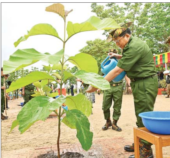
နိုင်ငံတော် စီမံအုပ်ချုပ်ရေးကောင်စီဥက္ကဋ္ဌ တပ်မတော်ကာကွယ်ရေးဦးစီးချုပ် ဗိုလ်ချုပ်မှူးကြီး မင်းအောင်လှိုင် ရတနာတန်းဝင်ကျွန်းပင်ကို ဦးဆောင်စိုက်ပျိုးပေးစဉ်။

ယနေ့တွင် ၂၀၂၄ ခုနှစ်၊ ကာကွယ်ရေးဦးစီးချုပ်ရုံး(ကြည်း၊ ရေ၊ လေ) မိသားစုများ၏ ပထမအကြိမ် မိုးရာသီသစ်ပင်စိုက်ပျိုးပွဲအခမ်းအနားကို နေပြည်တော်ဇေယျာသိရိမြို့နယ် ရေဆင်းဆည်အနီး၌ ကျင်းပပြုလုပ်ရာ