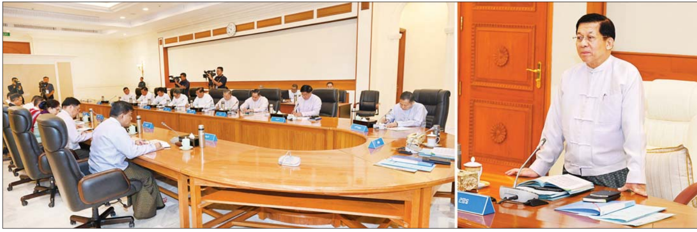
နိုင်ငံတော်စီမံအုပ်ချုပ်ရေးကောင်စီဥက္ကဋ္ဌ နိုင်ငံတော်ဝန်ကြီးချုပ် ဗိုလ်ချုပ်မှူးကြီး မင်းအောင်လှိုင် နိုင်ငံတော်စီမံအုပ်ချုပ်ရေးကောင်စီ အစည်းအဝေး(၃/၂၀၂၄)တွင် အမှာစကားပြောကြားစဉ်။