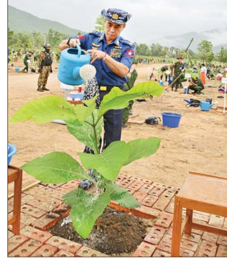
ကာကွယ်ရေးဦးစီးချုပ်(ရေ) ရတနာတန်းဝင် ကျွန်းပင်ကို စိုက်ပျိုးပေးစဉ်။