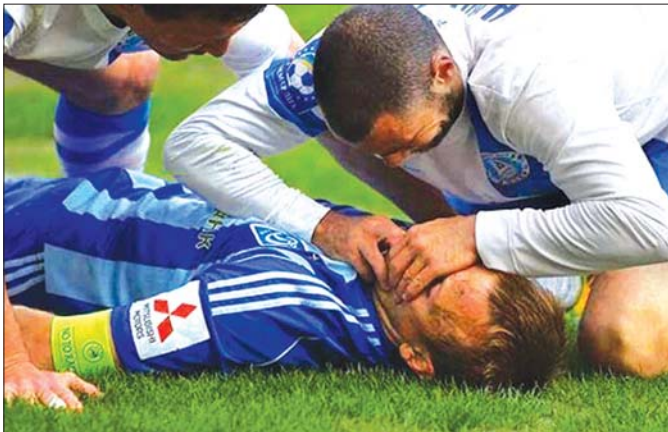
ကျော်ဂျီဟာဘောလုံးကစားသမားတစ်ဦး ဘောလုံးကွင်းအတွင်း လဲကျနေမှုကို အားကစားသမားအချင်းချင်း ကူညီရိုင်းပင်း ဆောင်ရွက်ပေးနေစဉ်။

သို့ဖြစ်၍ အမျိုးသားအားကစားပွဲတော်ကြီးတွင် ပါဝင်ဆင်နွှဲကြမည့် အားကစားမောင်မယ်များအနေဖြင့် ပြိုင်ပွဲများကို အားကစားစိတ်ဓာတ် အပြည့်အဝဖြင့် ပါဝင်ယှဉ်ပြိုင်ကြစေရေး၊ အားကစားနည်းအလိုက် ပြိုင်ပွဲ ပွဲစဉ်များကို အကဲဖြတ်သုံးသပ်ဆုံးဖြတ်ပေးရမည့် ခိုင်/ဂျူရီအဖွဲ့ဝင်များသည်လည်း စောင့်ထိန်းလိုက်နာရမည့် ကျင့်ဝတ်များနှင့်အညီ တရားမျှတစွာ သုံးသပ်ဆုံးဖြတ်နိုင်စေရေးနှင့် ပြိုင်ပွဲပွဲစဉ်များကို လာရောက်ကြည့်ရှုအားပေးကြမည့် ပရိသတ်များကလည်း နိုင်ငံကြီးသားပီသစွာ မျှမျှတတ အားပေးတတ်စေရေးတို့အတွက် ရည်ရွယ်၍ ဤဆောင်းပါးကို ရေးသားတင်ပြရခြင်းဖြစ်ပါသည်။