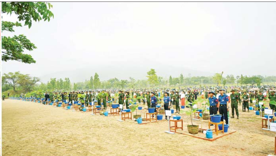
နိုင်ငံတော်စီမံအုပ်ချုပ်ရေးကောင်စီဥက္ကဋ္ဌ တပ်မတော်ကာကွယ်ရေးဦးစီးချုပ် ဗိုလ်ချုပ်မှူးကြီး မင်းအောင်လှိုင် ကာကွယ်ရေးဦးစီးချုပ်ရုံး(ကြည်း၊ ရေ၊ လေ) မိသားစုများ၏ ၂၀၂၄ ခုနှစ် ပထမအကြိမ် မိုးရာသီသစ်ပင်စိုက်ပျိုးပွဲအခမ်းအနားတွင် အမှာစကားပြောကြားစဉ်။