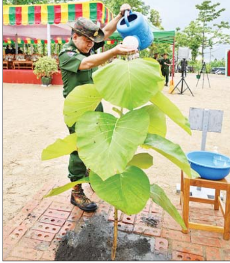
ညိုနှိုင်းကွမ်ကေးမှူး (ကြည်း၊ ရေ၊ လေ) ဗိုလ်ချုပ်ကြီး မောင်မောင်အေး ရတနာတန်းဝင်ကျွန်းပင်ကို စိုက်ပျိုးပေးစဉ်။

သစ်ပင်စိုက်ပျိုးပွဲတော် စုစုပေါင်း ၃၉ ကြိမ် ကျင်းပပြုလုပ်၍ ရတနာတန်းဝင် ပင်၊ နှစ်ရှည်သီးနှံပင်နှင့် အရိပ်ရလေကာပင် စုစုပေါင်း ၁၉၆၄၂၅ ပင်အား စိုက်ပျိုးခဲ့ပြီးဖြစ်သည်။ တပ်မတော်တစ်ရပ်လုံးအနေဖြင့် ယနေ့ထုတ် စုစုပေါင်းသစ်ပင် ၁၆၆၁၈၉ ပင်ကို စုပေါင်းစိုက်ပျိုးပေးနိုင်ခဲ့ အလားတူ တိုင်းစစ်ဌာနချုပ်နယ်မြေအသီးသီး၌လည်း မိုးရာသီသစ်ပင်စိုက်ပွဲများ ကျင်းပ၍ ရတနာတန်းဝင်ပင်၊ စက်မှုကုန်ကြမ်းသီးနှံပင်၊ နှစ်ရှည်စားသုံးသီးနှံပင်၊ အရိပ်ရလေကာပင်များကို စုပေါင်းစိုက်ပျိုးကြရာတွင် နေပြည်တော်တိုင်း စစ်ဌာနချုပ်၌ ၇၄၄၇ ပင်၊ မြောက်ပိုင်းတိုင်း စစ်ဌာနချုပ်၌ ၈၃၃၅ ပင်၊ အရှေ့မြောက်တိုင်းစစ်ဌာနချုပ်၌ ၇၂၀၂ ပင်၊ အရှေ့ပိုင်းတိုင်းစစ်ဌာနချုပ်၌ ၇၂၃၉ ပင်၊ အရှေ့အလယ်ပိုင်းတိုင်း စစ်ဌာနချုပ်၌ ၁၆၀၁၅ ပင်၊ ကြိတ်ဒေသတိုင်းစစ်ဌာနချုပ်၌ ၁၃၅၃၃ ပင်၊ အရှေ့တောင်တိုင်းစစ်ဌာနချုပ်၌ ၁၃၃၇၉ ပင်၊ ကမ်းရိုးတန်းဒေသတိုင်းစစ်ဌာနချုပ်၌ ၉၆၅၅ ပင်၊ ရန်ကုန်တိုင်းစစ်ဌာနချုပ်၌ ၁၇၄၈၆ ပင်၊ အနောက်တောင်တိုင်းစစ်ဌာနချုပ်၌ ၇၀၈၆ ပင်၊ အနောက်ပိုင်းတိုင်း စစ်ဌာနချုပ်၌ ၈၃၇၄ ပင်၊ အနောက်မြောက်တိုင်းစစ်ဌာနချုပ်၌ ၉၀၀၂ ပင်၊ အလယ်ပိုင်း တိုင်းစစ်ဌာနချုပ်၌ ၂၉၀၃၀ ပင်နှင့် တောင်ပိုင်းတိုင်းစစ်ဌာနချုပ်၌ ၉၈၅၂ ပင်တို့ကို တိုင်းများများနှင့် တာဝန်ရှိသူများက စုပေါင်းစိုက်ပျိုးခဲ့ကြပြီး ယနေ့တွင် တပ်မတော်အနေဖြင့် ကာကွယ်ရေးဦးစီးချုပ်ရုံး (ကြည်း၊ ရေ၊ လေ) မိသားစုဝင်များအပါအဝင် တိုင်းစစ်ဌာနချုပ်အသီးသီးနှင့် တပ်ရင်းတပ်ဖွဲ့များ၌ စုစုပေါင်း သစ်ပင် ၁၆၆၁၈၉ ပင်ကို စိုက်ပျိုးခဲ့ကြကြောင်း သတင်းရရှိသည်။ သတင်းစဉ်