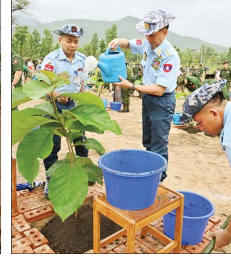
ကာကွယ်ရေးဦးစီးချုပ် (လေ) ရတနာတန်းဝင် ကျွန်းပင်ကို စိုက်ပျိုးပေးစဉ်။