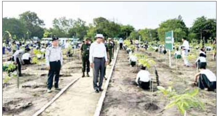
ရန်ကုန်တိုင်း ဒေသကြီး လူထုဖြန့်ဖြူးပေးပေးခြင်း ၄၅၀၀၀၀ သွားမည်ဖြစ်ကြောင်း သိရသစ်တောဦးစီးဌာန အနေဖြင့် ကို ၂၀၂၄ ခုနှစ် မိုးရာသီတွင် သည်။ အာကာလင်း

အသင်းအဖွဲ့များ၊ အခြေခံပညာကျောင်းသား ကျောင်းသူများနှင့် ဒေသပိုင်ပိုင်သူများ စုစုပေါင်း ၁၂၆၄ ဦးဖြင့် ပျိုးသက် နှစ်နှစ်နှင့်အထက် အပင်အမြင့် နှစ်ပေနှင့် အထက်ရှိသော ကျွန်း၊ ပျဉ်းကတီး၊ ပိတောက်၊ မဟော်ဂနီ၊ မန်ဂျန်ဂျား၊ စိန်ပန်း၊ ခရော့ မာလာ လူးကားနှင့် ပျဉ်းပ စုစုပေါင်း သစ်မျိုးကိုးမျိုး၊ ပျိုးပင် ၆၂၇၃ ပင်ကို စုပေါင်းစိုက်ပျိုးကြသည်။