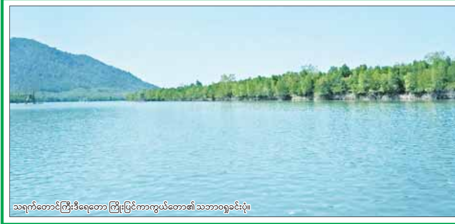
သရက်တောင်ကြီးဒီရေတော ကြိုးပြင်ကာကွယ်တော၏ သဘာဝရှုခင်းပုံ။

သရက်တောင်ကြီးဒီရေတော ကြိုးပြင်ကာကွယ်တောသတ်မှတ် ပြည်ထောင်စုသမ္မတမြန်မာနိုင်ငံတော်အစိုးရ သယံဇာတနှင့် သဘာဝပတ်ဝန်းကျင်ထိန်းသိမ်းရေးဝန်ကြီးဌာနသည် ၂၀၁၈ ခုနှစ်တွင် ပြဋ္ဌာန်းထားသည့် သစ်တောဥပဒေပုဒ်မ ၆၊ ပုဒ်မခွဲ(င) အရ အပ်နှံထားသော လုပ်ပိုင်ခွင့်များကိုကျင့်သုံးလျက် တနင်္သာရီတိုင်းဒေသကြီး ထားဝယ်ခရိုင် သရက်ချောင်းမြို့နယ်အတွင်း ကျရောက်နေသည့် ဧရိယာအကျယ်အဝန်း ၆၀၁ ဒသမ ၆ ဧကရှိသော နယ်မြေကို “သရက်တောင်ကြီး ဒီရေတောကြိုးပြင်ကာကွယ်တော” အဖြစ် အမိန့်ကြော်ငြာစာအမှတ် (၄၇၂/၂၄)အရ ၁၃၈၆၄၃၈ နယ်မြေအနား ၁ ရက် (၂၀၂၄ ခုနှစ်၊ ဇွန်လ ၇ ရက်) မှစ၍ သတ်မှတ်ကြောင်း ကြေညာလိုက်သည်။ စာမျက်နှာ ၁၂ ကော်လံ ၄ ❖