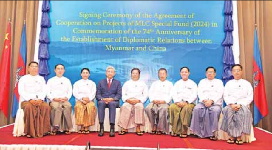
အတွဲ မဲခေါင်-လန်ချန်းပူးပေါင်းဆောင်ရွက်မှု၏ အောင်မြင်မှုကို အလေးပေးပြောကြားပြီး မဲခေါင်-

အခမ်းအနားတွင် ဒုတိယဝန်ကြီးချုပ်နှင့် ပြည်ထောင်စုဝန်ကြီး ဦးသန်းဆွေက ငြိမ်းချမ်းစွာ အတူယှဉ်တွဲနေထိုင်ရေးမူဝါဒ အပေါ်အခြေခံကာ ၂၀၁၁ ခုနှစ်တွင် နှစ်နိုင်ငံဆက်ဆံရေးကို ဘက်စုံ မဟာဗျူဟာမြောက် ပူးပေါင်းဆောင်ရွက်မှုသို့ မြှင့်တင်ခဲ့ပြီး ၂၀၂၀ ပြည့်နှစ်တွင် မြန်မာ-တရုတ် မျှဝေသော အနာဂတ်အသိုက်အဝန်းသို့ ဆက်လက် တိုးမြှင့်ခဲ့ကြောင်းနှင့် တရုတ်နိုင်ငံ၏ ရန်ပုံငွေထောက်ပံ့မှုဖြင့် ၂၀၁၇ ခုနှစ်တွင်စတင်ခဲ့သည့် မဲခေါင်-လန်ချန်း ပူးပေါင်းဆောင်ရွက်မှု အထူးရန်ပုံငွေ စီမံကိန်းများနှင့်