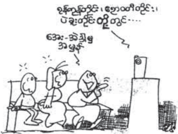
မြန်မာစာ မြန်မာစကားစာအုပ်မှ ကောက်နုတ်ဖော်ပြပါသည်။