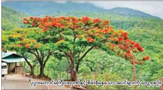
ပုပ္ပားတောင်မကြီးပရဝေဏ်နှင့် စိမ်းစိုနေသော အပင်များကို တွေ့ရစဉ်။

ရန်ကုန် ဇွန် ၁၄ အညာဒေသ၏ အိုအေစစ်ဖြစ်သော ပုပ္ပားတောင်မကြီးတွင် အရိပ်ရအပင် နှစ်ထောင် ထပ်မံစိုက်ပျိုးသွားမည်ဖြစ်ကြောင်း ရေနံသာ ဒင်းဂါးညီနောင်များအဖွဲ့ ပရဟိတအသင်းထံမှ သိရသည်။ ပြီးခဲ့သည့် ၂၀၁၉ ခုနှစ်မှစတင်ကာ ပုပ္ပားတောင်မကြီး၌ အရိပ်ရအပင် တစ်သောင်းခန့် စတင်စိုက်ပျိုးခဲ့ပြီး အချို့အပင်များမှာ လူတစ်ရပ်ခန့် ပမာဏအဖြစ်ရှိနေပြီဖြစ်ကာ ယခုထပ်မံစိုက်ပျိုးရန်အတွက် စီစဉ်နေခြင်းဖြစ်သည်။ စာမျက်နှာ ၃ ကော်လံ ၁