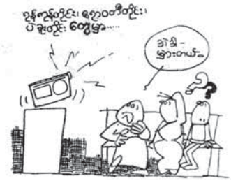
၂။ ရန်ကုန်တိုင်း၊ ဧရာဝတီတိုင်း၊ ပဲခူးတိုင်းတို့မှာ နေရာကွက်၍ မိုးရွာနိုင်ပါသည်။ (ရန်ကုန်တိုင်း၊ ဧရာဝတီတိုင်း၊ ပဲခူးတိုင်း ဟူသော တိုင်း ၃-တိုင်း စလုံးတွင် မိုးရွာနိုင်သည်ဟူသော အနက်အဓိပ္ပာယ်ရသည်။) (စာသင့်)