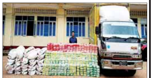
၂၀၂၃ ခုနှစ် ဒီဇင်ဘာလအတွင်း AA တပ်ဖွဲ့ဝင်များနှင့်အတူ ဖမ်းဆီးရမိသည့် မူးယစ်ဆေးဝါးများ။

အမှန်စင်စစ် ရခိုင်ပြည်နယ်အတွင်း ဘူးသီးတောင် မောင်တောဒေသက ဘင်္ဂါလီလူမျိုးတွေကိုသတ်ဖြတ်ကာ နေအိမ်များအား မီးရှို့ဖျက်ဆီးမှုတွေကို လုပ်ဆောင်လာလို့ ကမ္ဘာ့နိုင်ငံများက အာရုံစိုက်ခံနေရတဲ့ အကြမ်းဖက်သောင်းကျန်းသူ AA အဖွဲ့ဟာ မူးယစ်ဆေးဝါးနဲ့ ဘဏ္ဍာငွေရှာဖွေပြီး လက်နက်ကိုင်အကြမ်းဖက်လမ်းစဉ်ကို လုပ်နေတဲ့အဖွဲ့ဖြစ်လို့ လူသားမျိုးနွယ်တစ်ခုလုံးအတွက်ပါ အန္တရာယ်ရှိတဲ့ မူးယစ်ဆေးဝါးများဖြစ်ကြောင်း နိုင်ငံတကာကသိရှိအောင် မီးမောင်းထိုးပြခြင်း ဖြစ်ပါတယ်။