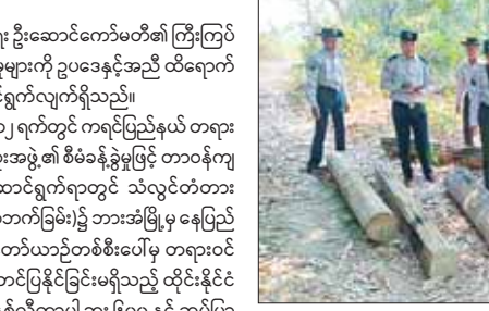
ပဲခူးတိုင်းဒေသကြီး၌ ဖမ်းဆီးရမိမှု။

နေပြည်တော် ဇွန် ၁၄ တရားမဝင်ကုန်သွယ်မှုတိုက်ဖျက်ရေး ဦးဆောင်ကော်မတီ၏ ကြီးကြပ်ကွပ်ကဲမှုဖြင့် တရားမဝင် ကုန်သွယ်မှုများကို ဥပဒေနှင့်အညီ ထိရောက်စွာတားဆီးအရေးယူနိုင်ရေး ဆောင်ရွက်လျက်ရှိသည်။ ထိုသို့ဆောင်ရွက်လျက်ရှိရာ ဇွန် ၁၂ ရက်တွင် ကရင်ပြည်နယ် တရားမဝင်ကုန်သွယ်မှု တိုက်ဖျက်ရေးအဖွဲ့အဖွဲ့၏ စီမံခန့်ခွဲမှုဖြင့် တာဝန်ကျပူးပေါင်းအဖွဲ့ က စစ်ဆေးမှုများ ဆောင်ရွက်ရာတွင် သံလွင်တံတားပူးပေါင်းစစ်ဆေးရေးဂိတ် (တရုတ်လက်ခြမ်း)၌ ဘားအံမြို့မှ နေပြည်တော်သို့ မောင်းနှင်လာသည့် မော်တော်ယာဉ်တစ်စီးပေါ်မှ တရားဝင်စာရွက်စာတမ်းအထောက်အထား တင်ပြနိုင်ခြင်းမရှိသည့် ထိုင်းနိုင်ငံထုတ် ပစ္စန်းနှစ်ကောင် စားအုန်းဆီ နှစ်လီတာပါ ဘူး ၆၀၀ နှင့် ဆပ်ပြာမူနီ ၂၅ ကီလိုဂရမ်ပါ ၁၈ အိတ်၊ Honda Motorcycle(Used) သုံးစီး အပါအဝင်ကုန်ပစ္စည်းလေးမျိုး (ခန့်မှန်းတန်ဖိုးငွေကျပ် ၁၁၃၅၀၀၀) နှင့် အဆိုပါပစ္စည်းများ တင်ဆောင်လာသည့် Higer Bus တစ်စီး (ခန့်မှန်းတန်ဖိုးငွေကျပ် ၃၅၀၀၀၀၀) စုစုပေါင်း ခန့်မှန်းတန်ဖိုးငွေကျပ် ၄၆၃၅၀၀၀ ကို ဖမ်းဆီးရမိခဲ့ပြီး အကောက်ခွန်လုပ်ထုံးလုပ်နည်းများနှင့်အညီ အရေးယူဆောင်ရွက်လျက်ရှိသည်။