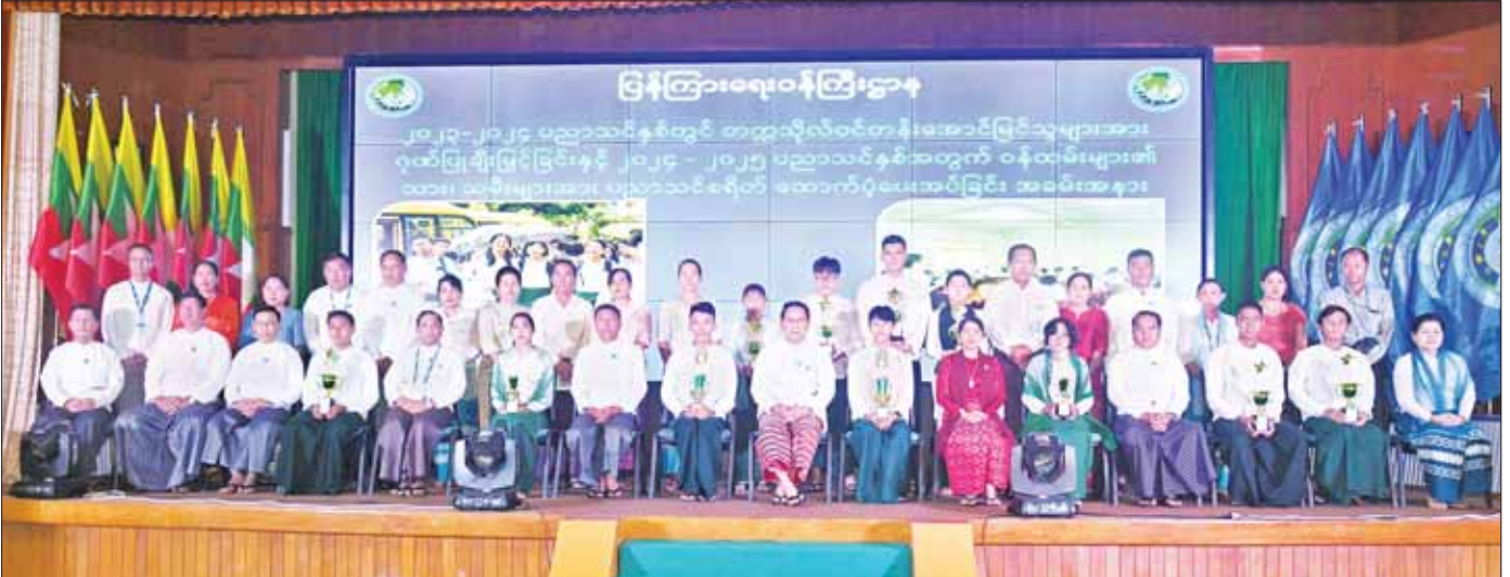
ပြည်ထောင်စုဝန်ကြီး ဦးမောင်မောင်အုန်းနှင့်ဇနီး၊ ဒုတိယဝန်ကြီး၊ ဌာနဆိုင်ရာအကြီးအကဲများ ကျောင်းသား ကျောင်းသူများ၊ ကျောင်းသားမိဘများနှင့်အတူ စုပေါင်းမှတ်တမ်းတင်ဓာတ်ပုံရိုက်စဉ်။