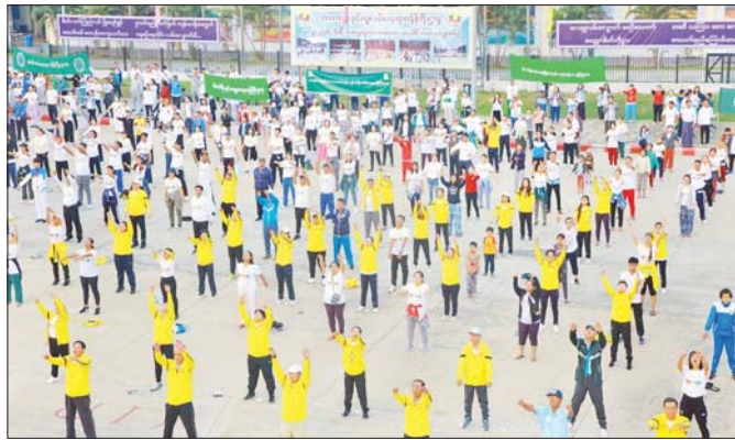
၂၀၂၃ ခုနှစ် ဒီဇင်ဘာလက လူထုစုပေါင်းအားကစားလှုပ်ရှားမှုများ ဆောင်ရွက်စဉ်။

အဆိုပါအားကစားနည်းတစ်ခုခုအား လေ့ကျင့် ကစားမည်ဆိုပါက အားကစားကွင်း၊ အားကစားရုံ၊ အားကစားအထောက်အကူပြုပစ္စည်းများ၊ ကစား ဖော်များ၊ ခိုင်လုံကြီးများ လိုအပ်မည်ဖြစ်သကဲ့သို့ အချိန်အတိုင်းအတာတစ်ခုအထိလည်း မိမိ၏