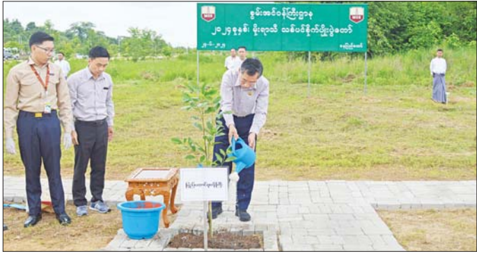
ရှင်သန်မှုအနေဖြင့် ၇၀ ရာခိုင်နှုန်း ရှိကြောင်းနှင့် ယနေ့သစ်ပင် စိုက်ပျိုးပွဲတော်တွင် ရတနာတန်း ဝင် ကျွန်းပင်နှင့် ပျဉ်းကတိုးပင် အပါအဝင် ခရေပင်၊ ကံကော်ပင်၊ မန်ကျည်းပင်၊ ဘုံမဲဇာပင်၊ မဲဇာလီပင်၊ စိန်ပန်းပင်နှင့် အရိပ်ရ လေကာပင် သစ်ပင် မျိုးစုံ စုစုပေါင်း ၆၈၀ စိုက်ပျိုးခဲ့ကြောင်း သတင်းရရှိ သည်။ သတင်းစဉ်

မှူးတို့က ကံကော်ပင်များကို စိုက်ပျိုးပေးကြကာ ဝန်ကြီးဌာန ကြီးကြပ်မှုအောက်ရှိ ဦးစီးဌာန/ လုပ်ငန်းများမှ အရာထမ်း၊ အမှုထမ်းများ၏ ရတနာတန်းဝင် ကျွန်းနှင့် ပျဉ်းကတိုး၊ မန်ကျည်း၊ ဘုံမဲဇာ၊ မဲဇာလီနှင့် စိန်ပန်းပင်များ စိုက်ပျိုးနေမှုကို ကြည့်ရှုအားပေး ကြသည်။