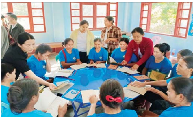
ရှမ်းပြည်နယ်(အရှေ့ပိုင်း) မြို့နယ်လေးခု အခြေခံစာတတ်မြောက်ရေးလုပ်ငန်း စာသင်ပိုင်းတစ်ခုတွင် ဒေသနေပြည်သူများ သင်ကြားသင်ယူနေကြစဉ်။

ထိုသို့ စာတတ်မြောက်မှုအခြေအနေ လိုအပ်ချက်များကို မြှင့်တင်ပေးရန် နိုင်ငံအတွင်း စာမတတ်သူဦးရေကို လျော့ချနိုင်ခြင်းနှင့်အတူ နိုင်ငံပွံ့ဖြိုးတိုးတက်ရေးကို ပိုမိုဆောင်ရွက်လာနိုင်မည်ဖြစ်သည့်အတွက် နိုင်ငံတော်စီမံအုပ်ချုပ်ရေးကောင်စီဥက္ကဋ္ဌ နိုင်ငံတော်ဝန်ကြီးချုပ် ဗိုလ်ချုပ်မှူးကြီး မင်းအောင်လှိုင်က နိုင်ငံတော်စီမံအုပ်ချုပ်ရေးကောင်စီ အစည်းအဝေးများ၊ ပြည်ထောင်စုအစိုးရအဖွဲ့ အစည်းအဝေးများနှင့် တွေ့ဆုံပွဲများတွင် “မိမိတို့အစိုးရအနေဖြင့် ပညာရေးကဏ္ဍတွင် ကျောင်းသင်ပညာရေးကို အလေးထားဆောင်ရွက်သကဲ့သို့ ကျောင်းပြင်ပ ပညာရေးကိုလည်း အလေးပေးဆောင်ရွက်လျက်ရှိကြောင်း၊ ကျောင်းသင်ပညာရေးစနစ်ဖြင့် သင်ကြားခွင့်ဆုံးရှုံးခဲ့ရသူများကို ကျောင်းပြင်ပပညာရေးနည်းလမ်းဖြင့် သင်ကြားပေးနိုင်ရေး” ကို တိုးချဲ့ဆောင်ရွက်သွားရန် အခါအားလျော်စွာ လမ်းညွှန်မှုများ ပြုထားသည်ကို ရပ်မြင်သကြားသတင်းများနှင့် နေ့စဉ်ထုတ်သတင်းစာများတွင် မကြာခဏ ဖော်ပြထားသည်ကို တွေ့မြင်ကြားသိနေရပါသည်။