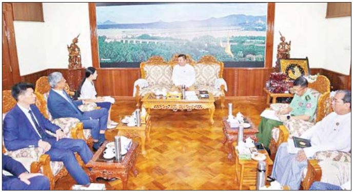
ပြုလုပ်ရာတွင် မြန်မာနိုင်ငံမှ ထွက်ရှိသည့် ရော်ဘာ ဆွေးနွေးကြသည်။ ကုန်ကြမ်း အသုံးပြုသွားနိုင်ရေး၊ နှစ်နိုင်ငံခရီးသွား လုပ်ငန်းများ အလေးထားဆောင်ရွက်သွားရေးနှင့် ပြည်သူ့သံမှတစ်ဆင့်သံရုံးတို့မှ တာဝန်ရှိသူများ စပ်လျဉ်း၍ ရင်းနှီးပွင့်လင်းစွာ အမြင်ချင်းဖလှယ် တက်ရောက်ကြသည်။ သက်နိုင်(မော်လမြိုင်)

များအား အမှုန်ပြုလုပ်ရန်အတွက် နည်းပညာ အကူအညီရရှိရေး၊ ကျေးရွာများတွင် မီးလင်းနိုင်ရေး လုပ်ငန်းများတွင် အထောက်အပံ့ရရှိရေး၊ မော်လမြိုင် တက္ကသိုလ်သည် ယခင်က တရုတ်နိုင်ငံနှင့် ပညာရေး ပူးပေါင်းဆောင်ရွက်မှုများ ရှိခဲ့သည့်အတွက် ယင်းတက္ကသိုလ်မှ ဆရာ ဆရာမများ ဖိုရမ် ကွန်ဖရင့်၊ သင်တန်းများနှင့် Scholarship ရရှိရေး၊ တရုတ်-မြန်မာကုန်သွယ်မှုလမ်းကြောင်းများ အမြန်ဆုံး ဖွင့်လှစ်နိုင်ရေး၊ မွန်ပြည်နယ်သည် တည်နေရာ ကောင်း၍ ဖွံ့ဖြိုးမှုရှိသည့် ပြည်နယ်တစ်ခုဖြစ်သည့် အားလျော်စွာ တရုတ်နိုင်ငံရှိ လုပ်ငန်းရှင်များ ရင်းနှီး မြှုပ်နှံနိုင်ရေး၊ တရုတ်နိုင်ငံမှ လျှပ်စစ်ကား(EV)များ ဖြန့်ဖြူးရောင်းချလျက်ရှိသဖြင့် ကားတာယာများ