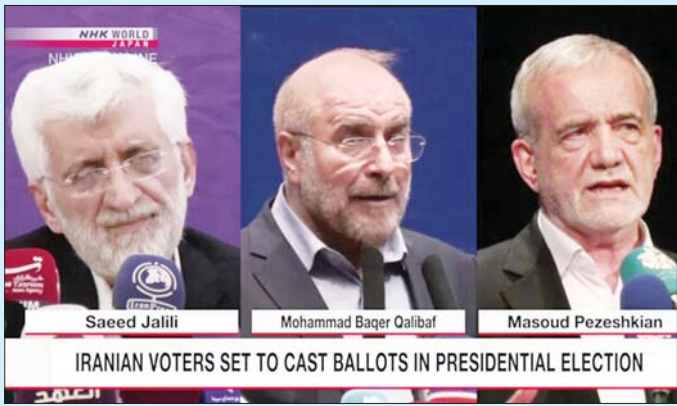
IRANIAN VOTERS SET TO CAST BALLOTS IN PRESIDENTIAL ELECTION

တီဟီရန် ဇွန် ၂၀ အီရန်နိုင်ငံမှ မဲဆန္ဒရှင်များသည် ၎င်းတို့၏ သမ္မတသစ်ကို ရွေးချယ်နိုင်ရန်အတွက် ဇွန် ၂၀ ရက်က စတင် ဆန္ဒမဲပေးနေကြပြီဖြစ်သည်။ ယခုရွေးကောက်ပွဲသည် ရှေးရိုးစွဲ ကွန်ဆာဗေးတစ်ဝါဒီ နှစ်ဦးနှင့် ပြုပြင်ပြောင်းလဲရေးဝါဒီ တစ်ဦးတို့ အဓိကပါဝင်ယှဉ်ပြိုင်သည့် ရွေးကောက်ပွဲဖြစ်သည်။ ပြီးခဲ့သည့်လက ရဟတ်ယာဉ်ပျက်ကျပြီး ပြောင်းလဲရေးသမား တစ်ဦးတို့ဖြစ်သည်။ သေဆုံးသွားခဲ့သည့် သမ္မတအီဗရာဟင်ရိုင်စီ၏ အဓိက ကိုယ်စားလှယ်လောင်းများထဲမှ တစ်ဦး နေရာကို ဆက်ခံမည့်သူကို ရွေးချယ်ရန် မဲပေးဆုံးဖြတ်မှုလည်းဖြစ်သည်။ မဲပေးဆုံးဖြတ်မှုလည်းဖြစ်သည်။ မဲပေးဆုံးဖြတ်မှုလည်းဖြစ်သည်။ မဲပေးဆုံးဖြတ်မှုလည်းဖြစ်သည်။ မဲပေးဆုံးဖြတ်မှုလည်းဖြစ်သည်။ မဲပေးဆုံးဖြတ်မှုလည်းဖြစ်သည်။ မဲပေးဆုံးဖြတ်မှုလည်းဖြစ်သည်။ မဲပေးဆုံးဖြတ်မှုလည်းဖြစ်သည်။ မဲပေးဆုံးဖြတ်မှုလည်းဖြစ်သည်။ မဲပေးဆုံးဖြတ်မှုလည်းဖြစ်သည်။ မဲပေးဆုံးဖြတ်မှုလည်းဖြစ်သည်။