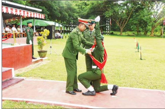
နယ်မြေခံသင်တန်းကျောင်း ကျောင်းအုပ်ကြီးက ထူးချွန်ဆုရရှိသူ သင်တန်းသား တစ်ဦးအား ဆုပေးအပ်ချီးမြှင့်စဉ်။