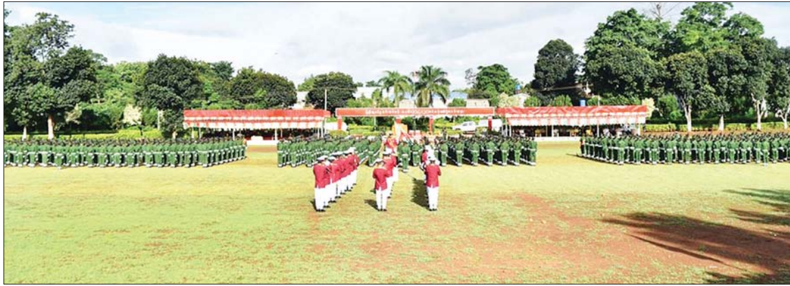
နယ်မြေခံသင်တန်းကျောင်း တစ်ကျောင်း၌ ပြည်သူ့စစ်မှုထမ်းသင်တန်းအမှတ်စဉ် (၁) သင်တန်းဆင်းပွဲကျင်းပစဉ်။

စိတ်ဓာတ်ရှိဖို့တွေ၊ စည်းလုံး ညီညွတ်အောင် သင်တန်းကနေ အားလုံး တိုက်ရည်ခိုက်ရည် ပြည့်ဝမှုတွေအများကြီး သင်ကြား ပေးပါတယ်။ အဖွဲ့အစည်းစိတ်ဓာတ် ရှိအောင်လည်း သူငယ်ချင်းတွေနဲ့ သေနတ်ပစ်တဲ့အခါ၊ ချောမွန်းရေး သွားတဲ့အခါ၊ ကိုယ်စီတိုက်တဲ့ အခါမှာ အကုန်လုံး ညီညီညွတ် ညွတ်နဲ့ တိုက်ပွဲတစ်ခုအောင်မြင် အောင် တိုက်လို့ရတဲ့အထိ သင်ကြားပေးပါတယ်။ အကုန်လုံး က စိတ်ဓာတ်နဲ့ ခံယူပြီးတော့ တိုက်ခိုက်မယ်ဆိုရင် ဘာပဲဖြစ်ဖြစ် အောင်မြင်မယ်လို့ ကျွန်တော် ယူဆပါတယ်။ နောက်ထပ်နောက် ထပ်လာတက်ရောက်မယ့် ညီငယ် တွေကိုလည်း စိတ်ခေါ်ပါတယ်။ ကျွန်တော်တို့လိုပဲ အကောင်းဆုံး ကြိုးစားနိုင်တဲ့ နိုင်ငံသားစစ်သား ကောင်းတစ်ယောက် ဖြစ်စေချင် ပါတယ်။ ပြည်သူ့စစ်မှုထမ်းကို ဦးနှောက်ထဲထည့်ပါနဲ့။ စစ်သား ကောင်း တစ်ယောက်ဖြစ်အောင် လိုပဲ ကြိုးစားစေချင်ပါတယ်။ အထက်လူကြီးရဲ့ စကားကို နားထောင်ပြီး ပေးအပ်တဲ့အမိန့်ကို တာဝန်ကျေပွန်စွာ ထမ်းဆောင် မယ်ဆိုရင် အောင်မြင်မယ်လို့ ကျွန်တော်ယူဆပါတယ်။