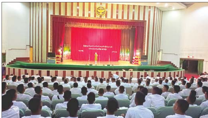
ပြည်သူ့စစ်မှုထမ်းသင်တန်း အမှတ်စဉ်(၁)မှ နိုင်ငံသားကောင်းစစ်သည်များအတွက် သင်တန်းဆင်း ဂုဏ်ပြုညစာစားပွဲတွင် မြဝတီတေးဂီတအဖွဲ့နှင့် နယ်လှည့်ပြည်သူ့ဆက်ဆံရေးအဖွဲ့များက တေးသီချင်း များဖြင့် ဂုဏ်ပြုသီဆို ဖျော်ဖြေကြစဉ်။

စာမျက်နှာ ၁၀ မှ အောင်မြင်စွာ ဖြတ်သန်းနိုင်ခဲ့ပါ တယ်။ အခုသင်တန်းပြီးဆုံးတဲ့ အတွက် နိုင်ငံတော်က ပေးအပ်တဲ့ မည်သည့်တာဝန်မဆို ကျေပွန်စွာ ထမ်းဆောင်သွားပါမယ်။ အဆိုပါ ညစာစားပွဲများတွင် ပြည်သူ့ဆက်ဆံရေးနှင့် စိတ်ဓာတ်