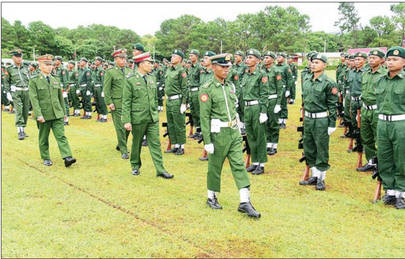
ကျောင်းအုပ်ကြီးကို အလေးပြုကြပြီး အလံကို အလေးပြုကြ၍ ကျောင်းကြည့်ရှုစစ်ဆေးသည်။ (အပေါ်ပုံ) ချီတက်အလေးပြု ဆက်လက်၍ သင်တန်းဆင်းတပ်ခွဲက

တက်ရောက် အခမ်းအနားသို့ ရှမ်းပြည်နယ် ဝန်ကြီးချုပ် ဦးအောင်အောင်၊ နယ်မြေခံ သင်တန်းကျောင်းမှ ကျောင်းအုပ်ကြီး ဗိုလ်မှူးချုပ်သိန်းနိုင်နှင့် တပ်မတော် အရာရှိကြီးများ၊ ပြည်နယ်စီးပွားရေးရာဝန်ကြီး၊ ပအိုဝ်းကိုယ်ပိုင်အုပ်ချုပ်ခွင့်ရဒေသ စီမံအုပ်ချုပ်ရေးအဖွဲ့ဥက္ကဋ္ဌနှင့် အဖွဲ့ဝင်များ၊ ဌာနဆိုင်ရာများ၊ ဖိတ်ကြားထားသော စည်သည်တော်များ၊ ဒေသခံ ပြည်သူများနှင့် ပြည်သူ့စစ်မှုထမ်း သင်တန်းသားများ တက်ရောက်ကြသည်။