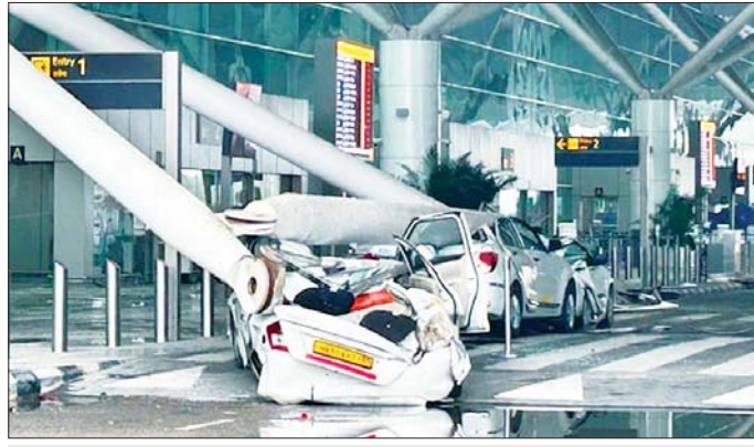
အင်ဒီရာဂန္တီအပြည်ပြည်ဆိုင်ရာလေဆိပ်၌ မျက်နှာကြက် ပြိုကျမှုကြောင့် ရပ်နားထားသည့် ကားများ ပျက်စီးနေမှုကို တွေ့ရစဉ်။

နယူးဒေလီ ဇွန် ၂၀ နယူးဒေလီမြို့အပြည်ပြည်ဆိုင်ရာ လေဆိပ်၌ ဇွန် ၂၀ ရက်နံနက်ပိုင်းက ခေါင်မိုးပြိုကျမှုဖြစ်ပွားခဲ့ရာ တစ်ဦးသေဆုံးခဲ့သည်ဟု သိရသည်။ အဆိုပါ ဖြစ်ရပ်နှင့် ပတ်သက်၍ မိုးသည်းထန်စွာ ရွာသွန်းခြင်းကြောင့်ဟု လေဆိပ်အော်ပရေတာက အဖြစ်တင်ထားသည်။ လေဆိပ်၏ ထွက်ခွာရာ ဂိတ်၁ ၌ မိုးသည်းထန်စွာ ခေါင်မိုးနေရာအနှံ့မှ ရေများကျဆင်းလာမှုဖြစ်ပေါ်ခဲ့သည်။ ခရီးသွားများ ကြိုပြုရာနေရာ၌ ခေါင်မိုးတိုင်များ ပြိုကျခဲ့ပြီး မော်တော်ယာဉ်အများအပြား ပျက်စီးခဲ့ရသည်။ အင်ဒီရာဂန္တီ အပြည်ပြည်ဆိုင်ရာ လေဆိပ်၌ ပြည်တွင်းခရီးသွားများ အသုံးပြုရာ အဓိကဂိတ်ပေါက်ရှိ မျက်နှာကြက် ပြိုကျခဲ့ခြင်းဖြစ်သည်။ ဒဏ်ရာရရှိသူများအပြား ရှိကြောင်း ပြည်တွင်းမီဒီယာများတွင် ဖော်ပြသည်။ လေဆိပ်ရှိအချို့သော ထွက်ခွာရေးဂိတ်များမှ သွားလာခွင့်ကို ဖျက်သိမ်းထားပြီး လေကြောင်းခရီးစဉ်များကိုလည်း ပြင်ဆင်ထားကြောင်း အော်ပရေတာက ပြောသည်။ ဇွန် ၂၇ ရက်မှ စတင်ကာ နယူးဒေလီမြို့ အနီးတစ်ဝိုက်တွင် မိုးအဆက်မပြတ် သည်းထန်စွာ ရွာသွန်းလျက်ရှိသည်။ မိုးသည်းထန်မှုကြောင့် လမ်းများ မရေလျှံနေပြီး အခြားသော ပျက်စီးဆုံးရှုံးမှုများ ဖြစ်ပေါ်လျက်ရှိသည်။ အင်န်အိတ်ချ်က