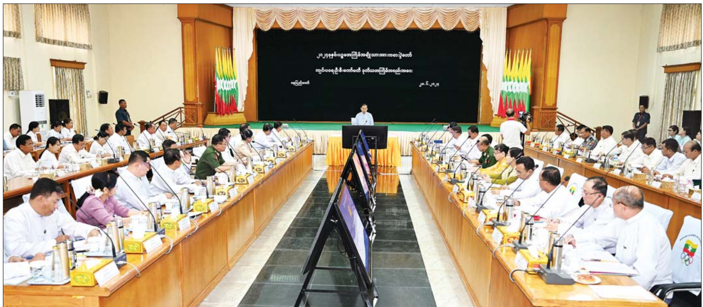
နိုင်ငံတော်စီမံအုပ်ချုပ်ရေးကောင်စီ ဒုတိယဥက္ကဋ္ဌ ဒုတိယဝန်ကြီးချုပ် ဒုတိယဗိုလ်ချုပ်မှူးကြီး စိုးဝင်း ၂၀၂၄ ခုနှစ် ပဉ္စမအကြိမ် အမျိုးသားအားကစားပွဲတော် ကျင်းပရေးဦးစီးကော်မတီ ဒုတိယအကြိမ် အစည်းအဝေးတွင် အမှာစကားပြောကြားစဉ်။