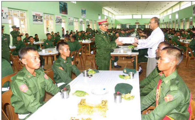
ရမ်းပြည်နယ်ဝန်ကြီးချုပ် ဦးအောင်အောင် သင်တန်းသားများအတွက် ဂုဏ်ပြုထောက်ပံ့ပေးအပ်စဉ်။

ပြည်သူ့စစ်မှုထမ်း သင်တန်း အမှတ်စဉ်(၁) တွင် တက်ရောက် ခဲ့ရသည့် အတွေ့အကြုံများ၊ သင်တန်းမှရရှိခဲ့သည့် အလေ့ အကျင့်ကောင်းများ၊ ယုံကြည် ချက်၊ ခံယူချက်များနှင့် သင်တန်း ဆင်းပြီးနောက် မိမိတို့တာဝန် ကျရာ တပ်ရင်း၊ တပ်ဖွဲ့များ၌ ဆက်လက် တာဝန်ထမ်းဆောင် သွားမည့် အခြေအနေများနှင့် ပတ်သက်၍ သင်တန်းဆင်း နိုင်ငံ သားကောင်း စစ်သည်များ၏ စကားသံများကိုလည်း ယခုလို ကြားသိရသည်... စစ်သင်တန်း ပြီးဆုံးသွားခဲ့ ပါပြီ။ ကျွန်တော်အခုဆိုရင် ပြည်သူ့စစ်မှုထမ်းရဲ့ အဆင့်မြင့်