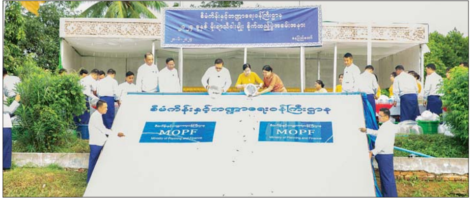
ပဲခူးပေးပို့ရေးနှင့် သက်ရှိလူသား သော ဂေဟစနစ် ရေရှည်တည်တံ့ ပြုစုပေးနိုင်ရေးအတွက် ရည်ရွယ်၍ နိုင်ငံစေရေးအတွက် ရည်ရွယ်၍ ငါးမျိုးစိုက်ထည့်ပွဲများကို နှစ်စဉ် ကျင်းပလျက်ရှိကြောင်း သတင်း ရရှိသည်။ သတင်းစဉ်

အခမ်းအနားတွင် ဒုတိယ ဝန်ကြီးချုပ်နှင့် ပြည်ထောင်စု ဝန်ကြီး၊ ဒုတိယဝန်ကြီး၊ ဌာန ဆိုင်ရာအကြီးအကဲများနှင့် အရာ ထမ်း၊ အမှုထမ်းများက မင်္ဂလာ ကန်အတွင်းသို့ ကြီးထွားနှုန်း မြန်ဆန်သည့် ငါးမြစ်ချင်းနှင့် ငါးနွဲ့မ သားပေါက်ကောင်ရေ ၃၅၀၀၀ ကျော် စိုက်ထည့်ပေးကြ သည်။ (အပေါ်ယာပုံ)