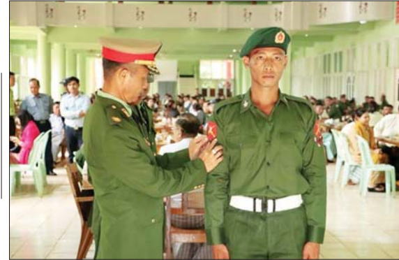
နယ်မြေခံသင်တန်းကျောင်း ကျောင်းအုပ်ကြီးက သင်တန်းသားတစ်ဦးအား အဆင့် တိုးမြှင့်တပ်ဆင်ပေးစဉ်။

စိတ်ဓာတ်ရှိဖို့တွေ၊ စည်းလုံး ညီညွတ်အောင် သင်တန်းကနေ အားလုံး တိုက်ရည်ခိုက်ရည် ပြည့်ဝမှုတွေအများကြီး သင်ကြား ပေးပါတယ်။ အဖွဲ့အစည်းစိတ်ဓာတ် ရှိအောင်လည်း သူငယ်ချင်းတွေနဲ့ သေနတ်ပစ်တဲ့အခါ၊ ချောမွန်းရေး သွားတဲ့အခါ၊ ကိုယ်စီတိုက်တဲ့ အခါမှာ အကုန်လုံး ညီညီညွတ် ညွတ်နဲ့ တိုက်ပွဲတစ်ခုအောင်မြင် အောင် တိုက်လို့ရတဲ့အထိ သင်ကြားပေးပါတယ်။ အကုန်လုံး က စိတ်ဓာတ်နဲ့ ခံယူပြီးတော့ တိုက်ခိုက်မယ်ဆိုရင် ဘာပဲဖြစ်ဖြစ် အောင်မြင်မယ်လို့ ကျွန်တော် ယူဆပါတယ်။ နောက်ထပ်နောက် ထပ်လာတက်ရောက်မယ့် ညီငယ် တွေကိုလည်း စိတ်ခေါ်ပါတယ်။ ကျွန်တော်တို့လိုပဲ အကောင်းဆုံး ကြိုးစားနိုင်တဲ့ နိုင်ငံသားစစ်သား ကောင်းတစ်ယောက် ဖြစ်စေချင် ပါတယ်။ ပြည်သူ့စစ်မှုထမ်းကို ဦးနှောက်ထဲထည့်ပါနဲ့။ စစ်သား ကောင်း တစ်ယောက်ဖြစ်အောင် လိုပဲ ကြိုးစားစေချင်ပါတယ်။ အထက်လူကြီးရဲ့ စကားကို နားထောင်ပြီး ပေးအပ်တဲ့အမိန့်ကို တာဝန်ကျေပွန်စွာ ထမ်းဆောင် မယ်ဆိုရင် အောင်မြင်မယ်လို့ ကျွန်တော်ယူဆပါတယ်။