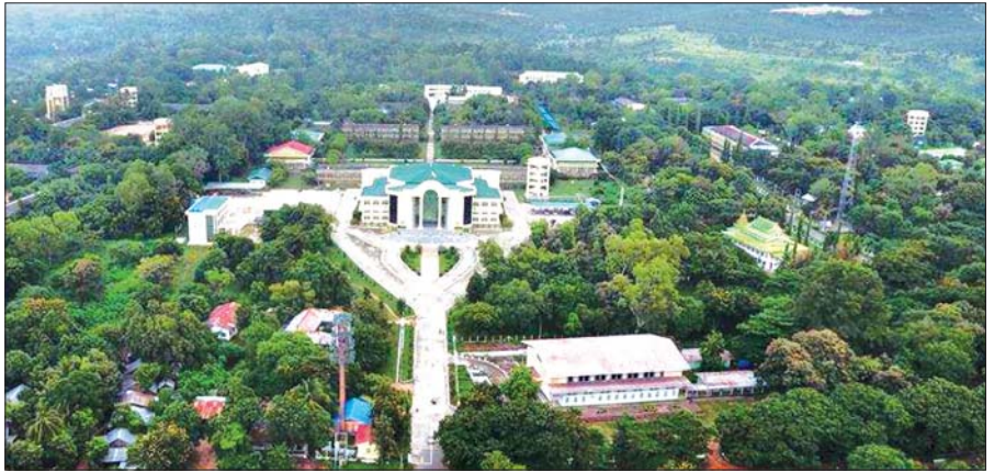
စိုက်ပျိုးရေးတက္ကသိုလ် (ရေဆင်း) ဘွဲ့နှင်းသဘင်ခန်းမနှင့် ကျောင်းဝင်းကြီးကို တွေ့ရစဉ်။

၁၉၇၇ ခုနှစ်မှ ၁၉၇၈ ခုနှစ်- စိုက်ပျိုးရေးမဟာသိပ္ပံဘွဲ့ သင်တန်း