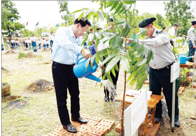
ပြည်ထောင်စုဝန်ကြီး ဦးမောင်မောင်အုန်း မဟော်ဂနီပင်ကို ဦးဆောင်စိုက်ပျိုးပေးစဉ်။

ယင်းနောက် ပြည်ထောင်စုဝန်ကြီးဦးမောင်မောင်အုန်းနှင့် ဇနီးတို့က မဟော်ဂနီပင်ကို ဦးဆောင်စိုက်ပျိုးပေးကြပြီး အမြတ်အေးအတွင်းဝန်၊ ဌာနဆိုင်ရာအကြီးအကဲများနှင့် တာဝန်ရှိသူများ၊ ဝန်ထမ်းများနှင့် မိသားစုဝင်များက သစ်ပင်/