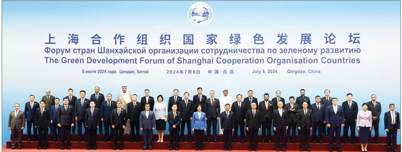
နိုင်ငံတော်စီမံအုပ်ချုပ်ရေးကောင်စီ ဒုတိယဥက္ကဋ္ဌ ဒုတိယဝန်ကြီးချုပ် ဒုတိယဗိုလ်ချုပ်မှူးကြီး စိုးဝင်း ရှန်ဟိုင်းပူးပေါင်းဆောင်ရွက်ရေးအဖွဲ့ (SCO) ၏ စီမံလမ်းညွှန်သည့် အဖွဲ့ဝင်နိုင်ငံများ၊ လေ့လာသူနိုင်ငံများနှင့်ဆွေးနွေးဖက်နိုင်ငံများမှ နိုင်ငံကိုယ်စားလှယ်များနှင့်အတူ စုပေါင်းမှတ်တမ်းတင်ဓာတ်ပုံရိုက်စဉ်။

၂၀၂၄ ခုနှစ် နိုင်ငံတော်စီမံအုပ်ချုပ်ရေးကောင်စီ ဒုတိယဥက္ကဋ္ဌ ဒုတိယဝန်ကြီးချုပ်သည် Qingdao International Conference Center ရှိ Shanghai ခန်းမသို့ရောက်ရှိပြီး ရှန်ဟိုင်းပူးပေါင်းဆောင်ရွက်ရေး အဖွဲ့ (SCO) ၏ စီမံလမ်းညွှန်သည့် အဖွဲ့ဝင်နိုင်ငံများ၊ လေ့လာသူနိုင်ငံများနှင့် ဆွေးနွေးဖက်နိုင်ငံများမှ နိုင်ငံကိုယ်စားလှယ်များနှင့်အတူ စုပေါင်းမှတ်တမ်းတင် ဓာတ်ပုံရိုက်သည်။