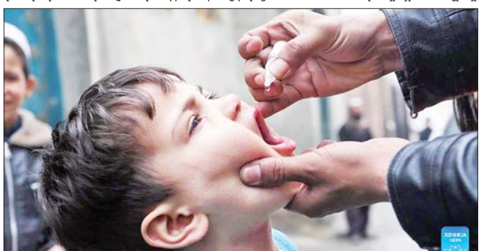
စွန့် ၃၀ ရက်က ကာဘူးလ်မြို့၌ ကလေးငယ်တစ်ဦး ပိုလီယိုကာကွယ်ဆေး တိုက်ကျွေးမှု ခံယူစဉ်။

အတွင်း အသက် ၆းနှစ်အောက် ကလေးငယ်ရစ်သန်းခန့်ကို ပိုလီယို ရောဂါကာကွယ်ဆေး တိုက်ကျွေး သွားမည်ဖြစ်ကြောင်း တိုလို နယူးစ်သတင်းဌာနက တနင်္လာနေ့တွင် ပြောသည်။ အာဖဂန် ကလေးငယ်များ ပိုလီယိုရောဂါ ဖြစ်ပွားခြင်းမှ ကာကွယ်ရန် စွန့် ၃ ရက်တွင် ဒုတိယအကြိမ် တစ်နိုင်ငံလုံးအနှံ့ ပိုလီယိုရောဂါ တိုက်ဖျက်ရေး လှုပ်ရှားမှုကို စတင်ခဲ့ကြောင်း သိရသည်။ အာဖဂန်နစ္စတန် နိုင်ငံသည် ပိုလီယိုရောဂါကို အမြစ်ပြတ်ရန် နိုးစပ်လာပြီဖြစ်ကြောင်း သိရသည်။ ဆင်ဟွာ