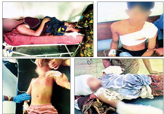
ကယားပြည်နယ် လွိုင်ကော်မြို့အတွင်းသို့ KNPP/KNDF အဖွဲ့နှင့် PDF အမည်ခံ အကြမ်းဖက်သမားများ ပူးပေါင်းအဖွဲ့တို့က လက်နက်ကြီးများဖြင့် ပစ်ခတ်တိုက်ခိုက်မှုကြောင့် ဒေသပြည်သူများ ထိခိုက်ဒဏ်ရာ ရရှိမှုကို တွေ့မြင်ရစဉ်။

ပြည်နယ် လွိုင်ကော်ဒေသအတွင်း အေးချမ်းစွာဖြင့် နေထိုင်လုပ်ကိုင် စားသောက်လျက်ရှိသည့် ဒေသခံ ပြည်သူများအား ကြောက်ရွံ့ ထိတ်လန့်စေရန်နှင့် အစိုးရ၏ အုပ်ချုပ်မှုယန္တရား ပျက်ပြားစေ ရန် ရည်ရွယ်ချက်ရှိရှိဖြင့် ယခု ကဲ့သို့ ပြည်သူလူထုနေထိုင်လျက် ရှိသည့် ရပ်ကွက်/ကျေးရွာများ အတွင်းသို့ လက်နက်ကြီးများဖြင့် ပစ်ခတ်တိုက်ခိုက်ခဲ့ခြင်း ဖြစ် ကြောင်းနှင့် လုံခြုံရေးတပ်ဖွဲ့ဝင် များအနေဖြင့် လွိုင်ကော်ဒေသ တည်ငြိမ်အေးချမ်းရေး၊ တရား ဥပဒေစိုးမိုးရေးအတွက် အကြမ်း ဖက်မှု တန်ပြန်ချေမှုန်းရေးကို ဒေသပြည်သူများနှင့်ပူးပေါင်း၍ ဆက်လက် ဆောင်ရွက်သွားမည် ဖြစ်ကြောင်း သတင်းရရှိသည်။ သတင်းစဉ်