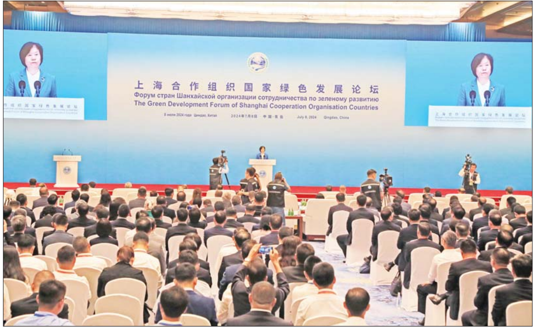
စိမ်းလန်းသောဖွံ့ဖြိုးမှုဖိုရမ် ဖွင့်ပွဲအခမ်းအနားတွင် တရုတ်ပြည်သူ့နိုင်ငံရေးအတိုင်ပင်ခံ ကွန်ဖရင့်၏ အမျိုးသားကော်မတီဒုတိယဥက္ကဋ္ဌနှင့် ရန်ဟိုင်းပူးပေါင်း ဆောင်ရွက်ရေးအဖွဲ့ (SCO) ၏ အိမ်နီးချင်းကောင်စီ၊ မိတ်ဆွေဆက်ဆံရေးနှင့် ပူးပေါင်းဆောင်ရွက်မှုကော်မရှင်ဥက္ကဋ္ဌ Mrs. Shen Yueyue အမှာစကားပြောကြားစဉ်။

အဆိုပါဆွေးနွေးပွဲများသို့ နိုင်ငံတော်စီမံအုပ်ချုပ် ရေးကောင်စီ ဒုတိယဥက္ကဋ္ဌ ဒုတိယဝန်ကြီးချုပ်နှင့် အတူ အဖွဲ့ဝင်အဖြစ်လိုက်ပါလာသည့် သယံဇာတနှင့်