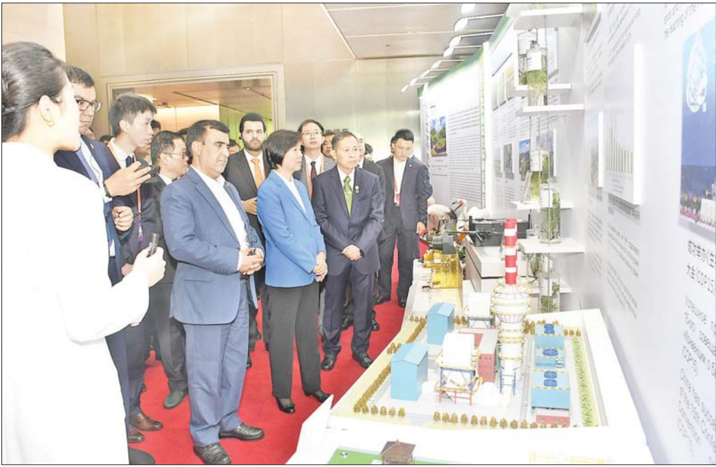
နိုင်ငံတော်စီမံအုပ်ချုပ်ရေးကောင်စီ ဒုတိယဥက္ကဋ္ဌ ဒုတိယဝန်ကြီးချုပ် ဒုတိယဗိုလ်ချုပ်မှူးကြီး ဖိုးဝင်း ဦးဆောင်သော မြန်မာ့ကိုယ်စားလှယ်အဖွဲ့ စီမံလမ်းညွှန်သော ဖွံ့ဖြိုးမှုဖိုရမ် အထိမ်းအမှတ်အဖြစ် နိုင်ငံအလိုက် ခင်းကျင်းပြသထားသည့် ရန်ဟိုင်းပူးပေါင်းဆောင်ရွက်ရေးအဖွဲ့ နိုင်ငံခေါင်းဆောင်များ ပြပွဲအတွင်း လှည့်လည် ကြည့်ရှုလေ့လာစဉ်။

အစိမ်းရောင်ခရီးသွားမြှင့်တင်ရေးကဏ္ဍ မြန်မာနိုင်ငံအနေဖြင့် ရည်လျားညွှန်ကမ်းရိုးတန်း ဒေသနှင့် ကျယ်ပြန့်သည့် အဏ္ဏဝါတို့ကို ပိုင်ဆိုင်ထား သော ပတ်ဝန်းကျင် အခြေခံကောင်းမွန်သည့် အတွက် အဏ္ဏဝါနှင့်ကမ်းရိုးတန်းအခြေပြု သယ်ဇာတ အရင်းအမြစ်များ ရေရှည်တည်တံ့စွာ ထုတ်ယူသုံးစွဲ နိုင်ရန် အပြာရောင်စီးပွားရေးကဏ္ဍ ဖွံ့ဖြိုးတိုးတက် ရေးသည်လည်း စဉ်ဆက်မပြတ် ဖွံ့ဖြိုးတိုးတက်မှု ပန်းတိုင်ရရှိစေရေး အဓိကအခွင့်အလမ်းတစ်ခုအနေ ဖြင့် အထောက်အကူပြုနိုင်မည်ဖြစ်ကြောင်း၊ ထို့ကြောင့် ပင်လယ်ကမ်းရိုးတန်းသယ်ဇာတ ဘက်စုံ စီမံအုပ်ချုပ်ခြင်းအစီအစဉ်ကို ပြဋ္ဌာန်းပြီး ကဏ္ဍ အလိုက် ပေါင်းစပ်အကောင်အထည်ဖော် ဆောင်ရွက် လျက်ရှိရာ တစ်ဖက်က ရေရှည်တည်တံ့စွာ ထုတ်ယူမှု စီမံထားသကဲ့သို့ တစ်ဖက်တွင်လည်း ရေအောက် အဖိုးတန် သဘာဝပတ်ဝန်းကျင် ထိန်းသိမ်းထားမှုနှင့် အတူ မြန်မာ့ပင်လယ်ပြင်၏ တောင်ပိုင်းတစ်လျှောက် ရေပေါ်ရေအောက် လှည့်လည်ကြည့်ရှုလေ့လာနိုင်ရေး ကိုလည်း အစိမ်းရောင်ခရီးသွားမြှင့်တင်ရေးကဏ္ဍ အဖြစ် စီမံဆောင်ရွက်ထားကြောင်းနှင့် လာရောက် လေ့လာနိုင်ပါကြောင်း။