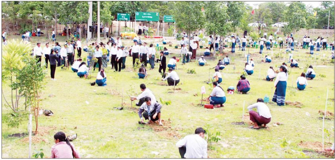
ပြန်ကြားရေးဝန်ကြီးဌာန ၂၀၂၄ ခုနှစ် မိုးရာသီသစ်ပင်စိုက်ပျိုးပွဲကို မြန်မာ့အသံနှင့် ရုပ်မြင်သံကြား မြေနေရာ၌ ကျင်းပစဉ်။

ထို့နောက် မြန်မာ့အသံနှင့် ရုပ်မြင်သံကြား Auditorium ခန်းမ၌ မြန်မာ့အသံနှင့်ရုပ်မြင်သံကြားမှ ဝန်ထမ်းများက “အားလုံးချစ်သည့် MRTV”၊ “သီချင်းများပေါင်းစပ်ဟာသတစ်ခန်းရုပ်” တေးသရုပ်ဖော်နှင့် “MRTV နှင့် ကောင်းသောနေ့” တေးသီချင်းတို့ဖြင့် ဖျော်ဖြေတင်ဆက်မှုကို လည်းကောင်း၊ “ချစ်စရာအရွယ်ကစားကြမယ်” ကလေးများ အစီအစဉ် ရိုက်ကူးထုတ်လွှင့်နိုင်ရန် ကြိုတင်ပြင်ဆင်လေ့ကျင့်မှုနှင့် စမ်းသပ်ရိုက်ကူးမှုကိုလည်းကောင်း ကြည့်ရှုအားပေးကြပြီး ပြိုင်ပွဲဝင် မူကြိုကလေးငယ်များအား အမှတ်တရ လက်ဆောင်ပစ္စည်းများ ပေးအပ်ခဲ့သည်။ သတင်းစဉ်