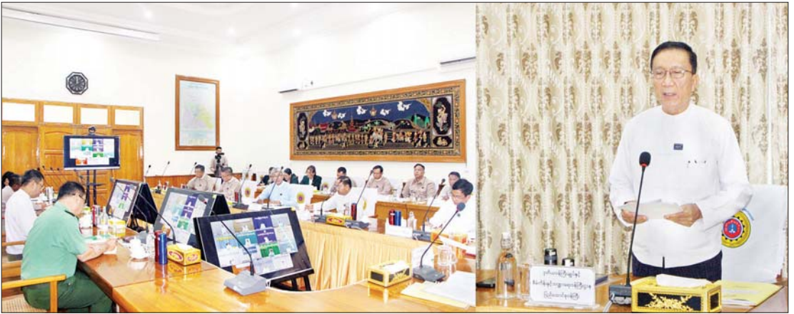
ဒုတိယဝန်ကြီးချုပ်နှင့် ပြည်ထောင်စုဝန်ကြီး ဦးဝင်းရှိန် ပြည်ထောင်စုအဆင့် အခွန်ကောက်ခံမှုအထောက်အကူပြုအဖွဲ့နှင့် အထောက်အကူပြုအဖွဲ့အဆင့်ဆင့် ဆောင်ရွက်ရမည့်လုပ်ငန်းတာဝန်များ အကောင်အထည်ဖော်ဆောင်ရွက်နိုင်ရေးအတွက် (၁/၂၀၂၄) ကြိမ်မြောက် လုပ်ငန်းညှိနှိုင်းအစည်းအဝေးတွင် အမှာစကားပြောကြားစဉ်။

နိုင်ငံတော်စီမံအုပ်ချုပ်ရေးကောင်စီဥက္ကဋ္ဌ နိုင်ငံတော်ဝန်ကြီးချုပ်က ပြည်ထောင်စုအစိုးရအဖွဲ့အစည်းအဝေးတွင် “အခွန်ကောက်ခံရာတွင် အခွန်နှုန်းထားကို တိုးမြှင့်ကောက်ခံခြင်းမရှိဘဲ ရသင့်ရထိုက်သည့် အခွန်နှုန်းထားကို ချဲ့ထွင်၍ ထိထိရောက်ရောက် ဆောင်ရွက်ခဲ့သည့်အတွက် အခွန်ရရှိမှု တိုးတက်လာသည်ကို တွေ့ရကြောင်း၊ အခွန်နှင့်ပတ်သက်ပြီး တာဝန်ရှိသည့် ဝန်ကြီးဌာနများအနေဖြင့်လည်း နိုင်ငံတော်က ရသင့်ရထိုက်သည့် အခွန်အများကို ပြည့်ပြည့်ဝဝရရှိအောင် ကောက်ခံပေးရန်လိုကြောင်း၊ အခွန်အများကောက်လျရာတွင် အခွန်အား တိုးမြှင့်ကောက်ခံခြင်းမပြုလုပ်ဘဲ ယခင်ရှိပြီး အခွန်နှုန်းထားများအတိုင်း ရသင့်ရထိုက်သော နယ်ပယ်အလိုက် မကျန်ရှိအောင် ကောက်ခံခြင်းများကို ပြုလုပ်ကြပ်မတ်ဆောင်ရွက်ကြရန်လိုကြောင်း” လမ်းညွှန်မှု ပြုထားပါကြောင်း။ ကြပ်မတ်ဆောင်ရွက် ယခုဖွဲ့စည်းထားသည့် အခွန်ကောက်ခံမှု အထောက်အကူပြုအဖွဲ့များတွင် ပြည်ထောင်စုအဆင့် အဖွဲ့အနေဖြင့် အခွန်အပြည့်အဝရရှိစေရေးနှင့် ဆောင်ရွက်ရမည့်လုပ်ငန်းစဉ်များ သတ်မှတ်ပေးရန်၊ သက်ဆိုင်ရာဌာနအသီးသီး ပူးပေါင်းဆောင်ရွက်နိုင်စေရန်၊ အခွန်ပညာပေးလုပ်ငန်းများ ဆောင်ရွက်နိုင်ရေးအတွက် ကြီးကြပ်ပေးရန်နှင့် ဆောင်ရွက်ခဲ့သည့်