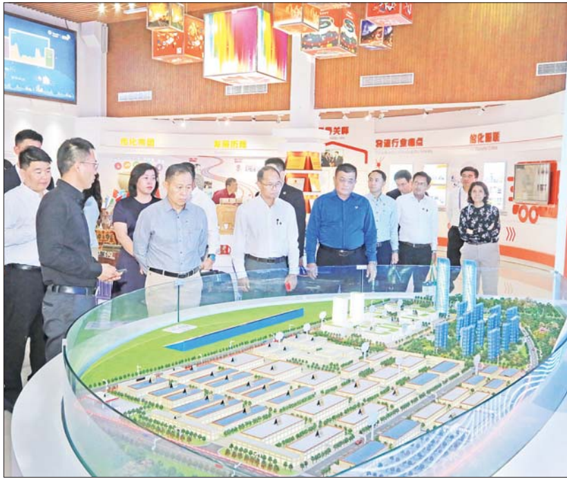
နိုင်ငံတော်စီမံအုပ်ချုပ်ရေးကောင်စီ ဒုတိယဥက္ကဋ္ဌ ဒုတိယဝန်ကြီးချုပ် ဒုတိယဗိုလ်ချုပ်မှူးကြီး စိုးဝင်း ဦးဆောင်သော မြန်မာကိုယ်စားလှယ်အဖွဲ့ ရှန်ဟိုင်းပူးပေါင်းဆောင်ရွက်ရေးအဖွဲ့ (SCO)၏ အောင်မြင်မှုပြယုဂ်တစ်ရပ်ဖြစ်သည့် China Transfer (SCO) အပြည်ပြည်ဆိုင်ရာ ထောက်ပံ့ပို့ဆောင်ရေးဆိပ်ကမ်းစီမံကိန်း၌ ကြည့်ရှုလေ့လာစဉ်။

ဆက်လက်၍ နိုင်ငံတော်စီမံအုပ်ချုပ်ရေးကောင်စီ ဒုတိယဥက္ကဋ္ဌ ဒုတိယဝန်ကြီးချုပ် ဦးဆောင်သော မြန်မာကိုယ်စားလှယ်အဖွဲ့သည် ရှန်ဟိုင်းပူးပေါင်းဆောင်ရွက်ရေးအဖွဲ့ (SCO)၏ အောင်မြင်မှုပြယုဂ်တစ်ရပ်ဖြစ်သည့် China Transfer (SCO) အပြည်ပြည်ဆိုင်ရာ ထောက်ပံ့ပို့ဆောင်ရေးဆိပ်ကမ်းစီမံကိန်း (China Transfer (SCO) International Logistic Port Project) သို့ သွားရောက်ကြည့်ရှုသည်။