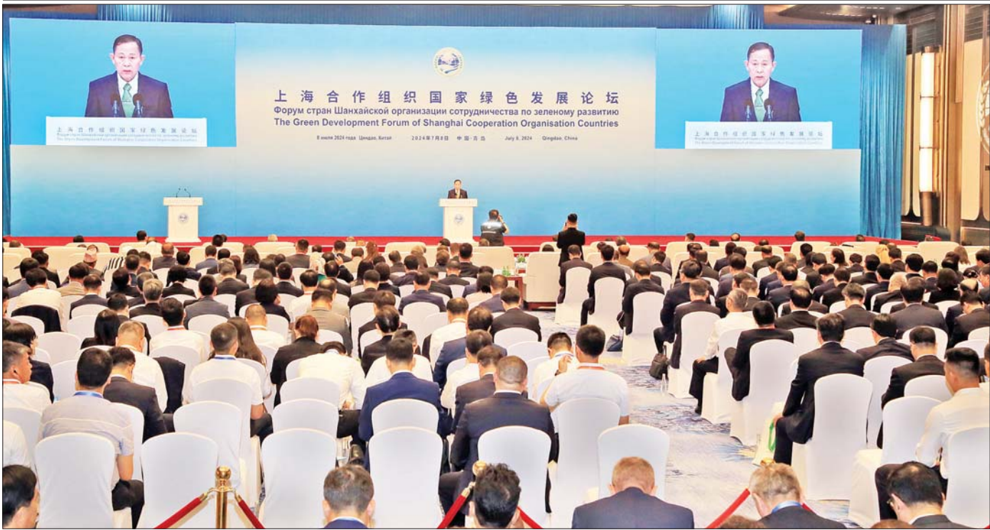
နိုင်ငံတော်စီမံအုပ်ချုပ်ရေးကောင်စီ ဒုတိယဥက္ကဋ္ဌ ဒုတိယဝန်ကြီးချုပ် ဒုတိယဗိုလ်ချုပ်မှူးကြီး စိုးဝင်း ရန်ဟိုင်းပူးပေါင်းဆောင်ရွက်ရေးအဖွဲ့ (SCO)၏ စိမ်းလန်းသော ဖွံ့ဖြိုးမှုဖိုရမ်တွင် မိန့်ခွန်းပြောကြားစဉ်။