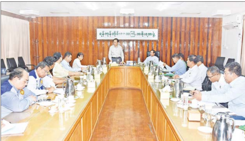
ပြည်ထောင်စုဝန်ကြီး ပါမောက္ခဒေါက်တာသက်ခိုင်ဝင်း၊ ရန်ကုန်တိုင်းဒေသကြီးဝန်ကြီးချုပ် ဦးစိုးသိန်းနှင့် တိုင်းဒေသကြီးအစိုးရအဖွဲ့ဝင်များအားတွေ့ဆုံပြီး ပြင်းထန်ဝမ်းပျက်ဝမ်းလျှောရောဂါ ကာကွယ်ထိန်းချုပ်ရေးဆိုင်ရာလုပ်ငန်းများ ပိုမိုထိရောက်စွာ ဆောင်ရွက်ရေးကိစ္စရပ်များကို ဆွေးနွေးစဉ်။

ရန်ကုန် ဇူလိုင် ၈ ကျန်းမာရေးဝန်ကြီးဌာန ပြည်ထောင်စုဝန်ကြီး ပါမောက္ခဒေါက်တာသက်ခိုင်ဝင်းသည် ရန်ကုန်တိုင်းဒေသကြီးဝန်ကြီးချုပ် ဦးစိုးသိန်း၊ တိုင်းဒေသကြီးအစိုးရအဖွဲ့ဝင်ဝန်ကြီးများ၊ ပြည်သူ့ကျန်းမာရေးဦးစီးဌာန ညွှန်ကြားရေးမှူးချုပ်၊ ပါမောက္ခချုပ်/ဆေးရုံအုပ်ကြီး၊ ရန်ကုန်ပြည်သူ့ဆေးရုံအုပ်ကြီး၊ ပြည်သူ့ကျန်းမာရေးဦးစီးဌာန ဒုတိယညွှန်ကြားရေးမှူးချုပ်များ၊ တာဝန်ရှိသူများနှင့်အတူ ယနေ့နံနက်ပိုင်းတွင် သာကေတမြို့နယ် (သပေါရုံ)ရပ်ကွက်ရှိ စံပြုယာဉ်ဈေးသို့ရောက်ရှိပြီး ဈေးအတွင်း အသားငါးများ ရောင်းချနေရာများ၊ အခြားဈေးဆိုင်များနှင့် ဈေးအတွင်းသို့ ရေပေးဝေသည့် ရေသိုလှောင်ကန်တို့ကို လှည့်လည်ကြည့်ရှုကာ သန့်ရှင်းမှုအခြေအနေ၊ ယင်မနားအောင်ဆောင်ရွက်ရောင်းချနေမှု ရှိ/မရှိနှင့် ရေသိုလှောင်ဖြန့်ဖြူးမှုစနစ်များကို ကြည့်ရှုစစ်ဆေးသည်။ (အောက်ယာဉ်)