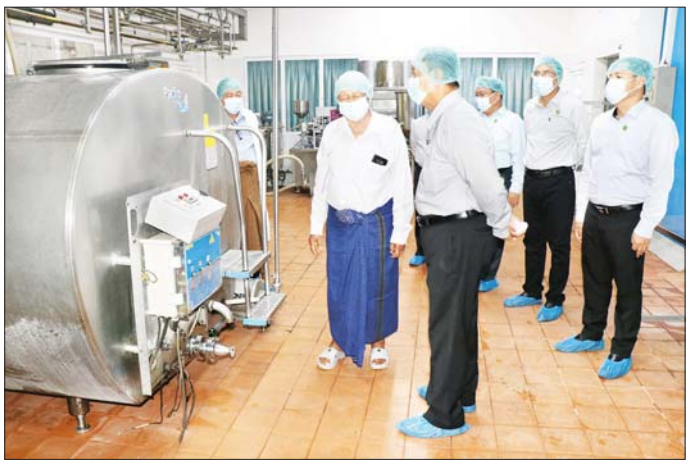
ပြည်ထောင်စုဝန်ကြီး ဦးလှမိုး ငွေစင်ပုလဲ နို့နှင့် နို့ထွက်ပစ္စည်း ထုတ်လုပ်ရေးစက်ရုံအတွင်း လှည့်လည်ကြည့်ရှုစစ်ဆေးစဉ်။

လုပ်ငန်းများ စနစ်တကျ တိုးချဲ့ဆောင်ရွက်ရန်လိုအပ်ကြောင်း၊ ဝန်ကြီးဌာနအနေဖြင့်လည်း တောင်သူများ သမဝါယမစနစ်ဖြင့် မွေးမြူနိုင်ရေးလိုအပ်သည့် မျိုးကောင်းမျိုးသန့်များ၊ အစာများရရှိရေး သက်ဆိုင်ရာ ဌာနများနှင့် ပေါင်းစပ်ဖြည့်ဆည်း ဆောင်ရွက်ပေးလျက်ရှိကြောင်း၊ ထွက်ရှိလာသော ကုန်ကြမ်းများကို နို့ထွက်ပစ္စည်းထုတ်လုပ်သည့် စက်ရုံများနှင့် ချိတ်ဆက်ဆောင်ရွက်ပေးလျက်ရှိကြောင်း၊ အခက်အခဲများရှိပါက ပေါင်းစပ်ဖြည့်ဆည်း ဆောင်ရွက်ပေးမည်ဖြစ်ကြောင်းပြောကြားပြီး စက်ရုံအတွင်း လှည့်လည်ကြည့်ရှုစစ်ဆေးသည်။ ထို့နောက် ပြည်ထောင်စုဝန်ကြီးနှင့် အဖွဲ့သည် မင်္ဂလာဒုံမြို့နယ် အမှတ်(၁၆) အခြေခံပညာ မူလတန်းကျောင်းသို့ ရောက်ရှိပြီး ဆရာ ဆရာမများနှင့် တွေ့ဆုံ၍ ကျောင်း၏ လိုအပ်ချက်များကို ပေါင်းစပ်ဖြည့်ဆည်းဆောင်ရွက်ပေးကာ ကျောင်းသားကျောင်းသူ ၈၀၀ ကျော်အတွက် အာဟာရဒါနအဖြစ် နွားနို့များ လျှော့ဒါနတိုက်ရွှေးခဲ့ကြောင်း သတင်းရရှိသည်။ သတင်းစဉ်