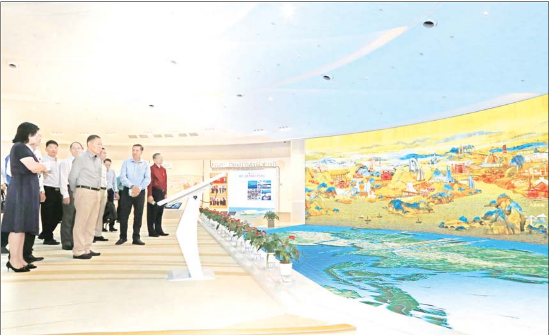
နိုင်ငံတော်စီမံအုပ်ချုပ်ရေးကောင်စီ ဒုတိယဥက္ကဋ္ဌ ဒုတိယဝန်ကြီးချုပ် ဒုတိယဗိုလ်ချုပ်မှူးကြီး စိုးဝင်း ဦးဆောင်သော မြန်မာကိုယ်စားလှယ်အဖွဲ့ ချင်းတောင်-SCO ပုလဲအပြည်ပြည်ဆိုင်ရာ ကုန်စည်ပြင်ပစင်တာအတွင်း လှည့်လည်ကြည့်ရှုလေ့လာစဉ်။

စင်တာအတွင်း လှည့်လည်ကြည့်ရှုထိန်းသွားစဉ် နိုင်ငံတော်စီမံအုပ်ချုပ်ရေးကောင်စီဒုတိယဥက္ကဋ္ဌ ဒုတိယဝန်ကြီးချုပ် ဦးဆောင်သော မြန်မာကိုယ်စားလှယ်အဖွဲ့သည် စင်တာအတွင်း လှည့်လည်ကြည့်ရှုအဖွဲ့ဝင် တစ်နိုင်ငံချင်းစီ၏ ယဉ်ကျေးမှုဆောင်ရွက်မှုအဖွဲ့ ဖွဲ့စည်းတက်ရောက်ရေးစနစ် တရုတ်ကွန်မြူနစ်ပါတီ လုပ်ငန်းကော်မတီအဖွဲ့ဝင် မစ္စ ဗူကျူဟွန်နှင့် တာဝန်ရှိသူများ