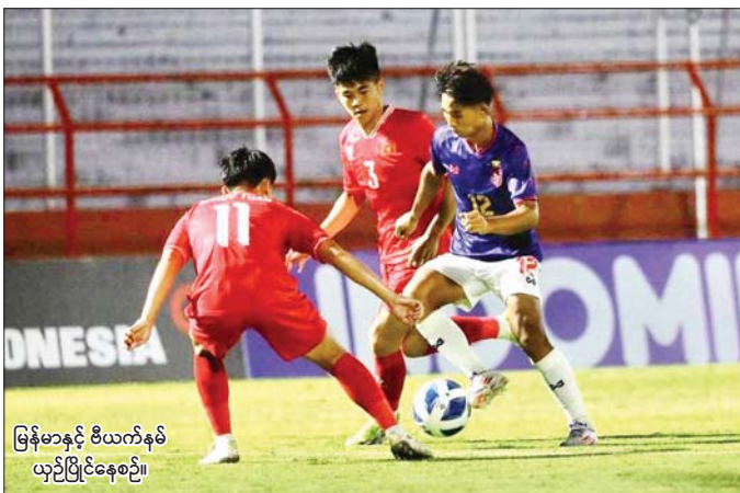
မြန်မာနှင့် ဗီယက်နမ် ယှဉ်ပြိုင်နေစဉ်။

ရန်ကုန် ဇူလိုင် ၁၈ အာဆီယံ ယူ-၁၉ ချန်ပီယံရှစ်ပြိုင်ပွဲ အုပ်စု (ခ) ပထမနေ့ကို ဇူလိုင် ၁၈ ရက်က အင်ဒိုနီးရှားနိုင်ငံ၌ ကျင်းပရာ မြန်မာအသင်း သရေကျခဲ့သည်။ အုပ်စု(ခ) ပထမနေ့တွင် မြန်မာနှင့် ဗီယက်နမ်အသင်း တစ်ဂိုးစီသရေကျခဲ့ပြီး ဩစတြေးလျအသင်းက လာအိုအသင်းကို ခြောက်ဂိုးပြတ် အနိုင်ရခဲ့သည်။ မြန်မာအသင်းသည် ဦးဆောင်ဂိုးစတင်ရရှိခဲ့သော်လည်း ချောပဂိုး ပြန်ပေးခဲ့ရာဖြင့် သရေရလဒ်ဖြင့် ကျေနပ်ခဲ့ခြင်းဖြစ်သည်။ စာမျက်နှာ ၁၄ ကော်လံ ၆ ❖