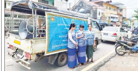
ဆန်းကျော်ဦး(ပြန်/ဆက်)