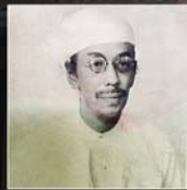
ဒီးဒုတ်ဦးဘချို