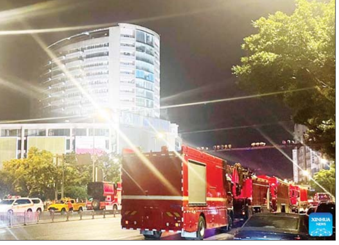
နှစ်နာရီအကြာတွင် မီးငြိမ်း သတ်နိုင်ခဲ့သည်။ ဇူလိုင် ၁၈ ရက် နံနက်ပိုင်းမတိုင်မီအထိ ကယ်ဆယ် ရေးလုပ်ငန်းများကို ဆက်လက် လုပ်ဆောင်ခဲ့သည်။ ကနဦး စုံစမ်းစစ်ဆေးမှုများ အရ ဆောက်လုပ်ဆဲဖြစ်သည့် ဆောက်လုပ်ရေး လုပ်ငန်းခွင်မှ စတင်ကာ မီးလောင်ခြင်းဖြစ်သည် ဟု ဒေသခံအာဏာပိုင်များက ပြော သည်။ ဆင်ယွာ၊ အင်န်အိတ်ချီကေ

စီချွမ်း ဇူလိုင် ၁၈ တရုတ်နိုင်ငံ အနောက်တောင်ပိုင်း ပြည်နယ်ဖြစ်သည့် စီချွမ်းပြည်နယ် ရှိ ကျိုခေါင်မြို့တွင် ဇူလိုင် ၁၇ ရက် ညနေ ၆ နာရီဝန်းကျင်တွင် မီး လောင်မှုဖြစ်ပွားခဲ့ကြောင်း သိရ သည်။ ဇူလိုင် ၁၈ ရက် နံနက် ၃ နာရီဝန်းကျင်အထိ သေဆုံးသူ ၁၆ ဦးအထိ ရှိလာကြောင်း ဒေသခံမီးသတ်နှင့်ကယ်ဆယ်ရေး ဌာန၏ ပြောကြားချက်အရ သိရ သည်။ အထပ် ၁၄ ထပ် မြင့်သည့် အဆောက်အအုံတွင် မီးလောင်မှု ဖြစ်ပွားခဲ့ခြင်းဖြစ်ပြီး အဆောက် အအုံအတွင်းမှ မီးခိုးမကြီးများ လိုဗိုတက်လာသည်ကို စီဒီယို မှတ်တမ်းတွင် တွေ့မြင်ရသည်။ ခေါင်မိုးပေါ်မှနေ၍ အကူအညီ တောင်းနေသည့် လူများကိုလည်း စီဒီယိုတွင် တွေ့မြင်ရသည်။