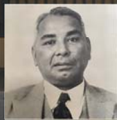
ဦးရာဇော်