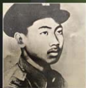
ရဲဘော်ကိုထွေး