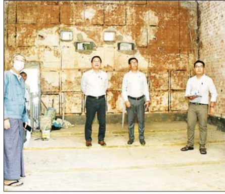
ဆွေးနွေးမှာကြားကာ အဆောက် အအုံ ပြင်ဆင်ထိန်းသိမ်းမှု အခြေ အနေများကို လှည့်လည်ကြည့်ရှု စစ်ဆေးသည်။ (အပေါ်ပုံ) မော်ကွန်းရုပ်ရှင် ရုံးခွဲ

ရန်ကုန် ဇူလိုင် ၁၈ ပြန်ကြားရေးဝန်ကြီးဌာန ပြည်ထောင်စုဝန်ကြီး ဦးမောင်မောင်အုန်း သည် ယနေ့နံနက်ပိုင်းတွင် ရန်ကုန်မြို့၊ ဗဟန်းမြို့နယ် မဟာမည် သာသနာ့ရိပ်သာလမ်းရှိ ယခင်မော်ကွန်းရုပ်ရှင် ရုံးခွဲအဆောက်အအုံ ပြင်ဆင်ထိန်းသိမ်းထားရှိမှုကို သွားရောက်ကြည့်ရှု၍ ရုပ်ရှင်လောက ဖွံ့ဖြိုးတိုးတက်ရေးဆိုင်ရာကိစ္စများကို ဆွေးနွေးမှာကြားသည်။ ရှေးဦးစွာ မော်ကွန်းရုပ်ရှင်ရုံးခွဲ အဆောက်အအုံသည် နှစ်ပေါင်း အဆောက်အအုံ အစည်းအဝေး ၁၀၀ ခန့် သက်တမ်းရှိသည့် ခန်းမ၌ တာဝန်ရှိသူများက ရေးဟောင်းအဆောက်အအုံကြီး မော်ကွန်းရုပ်ရှင်ရုံးခွဲ၏ တည် ဖြစ်သဖြင့် တန်ဖိုးထားထိန်းသိမ်း နေရာအနေအထားနှင့် မြေပိုင်ဆိုင် မှုအခြေအနေ ရုပ်ရှင်ကဏ္ဍဖွံ့ဖြိုး တိုးတက်ရေးအတွက် စီစဉ်ဆောင် ရွက်ရန် လျာထားသည့် အခြေ အနေနှင့် အဆောက်အအုံကြီး ကို ရှေးမှရှေးဟန်မပျက် ပြင်ဆင် ထိန်းသိမ်းလျက်ရှိသည့် အခြေ အနေများကို ရှင်းလင်းတင်ပြရာ ပြည်ထောင်စုဝန်ကြီးက ယခု