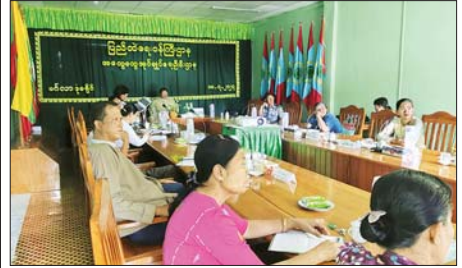
မင်္ဂလာဒုံမြို့နယ်တွင် ခရိုင်သန်းခေါင်စာရင်းကော်မတီ လုပ်ငန်းညှိနှိုင်းအစည်းအဝေးကျင်းပ

မြန်မာနိုင်ငံအပေါ် နိုင်ငံရေးသွတ်သွင်းမှုများစွာ ပါဝင်ပါသည်။ မြန်မာနိုင်ငံအနေဖြင့် နိုင်ငံရေးရက်စွဲရပ်များကို ဆောင်ရွက်ရာတွင် ၂၀၀၈ ခုနှစ်၊ ဖွဲ့စည်းပုံအခြေခံဥပဒေ၊ တည်ဆဲဥပဒေများ၊ မြန်မာနိုင်ငံ ၏ အခြေခံဥပဒေတို့အရ တည်ဆဲဥပဒေများနှင့်အညီသာ ဆောင်ရွက်သွား မည်ဖြစ်ကြောင်း ထပ်လောင်းဖော်ပြအပ်ပါသည်။