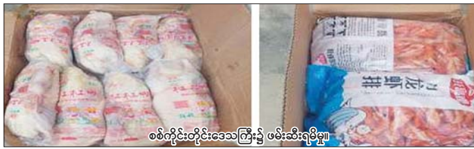
စစ်ကိုင်းတိုင်းဒေသကြီး၌ ဖမ်းဆီးရမိမှု။

နေပြည်တော် ဇူလိုင် ၁၈ တရားမဝင်ကုန်သွယ်မှုတိုက်ဖျက်ရေး ဦးဆောင် ကော်မတီ၏ ကြီးကြပ်ကွပ်ကဲမှုဖြင့် တရားမဝင် ကုန်သွယ်မှုများကို ဥပဒေနှင့်အညီ ထိရောက်စွာ တားဆီးအရေးယူနိုင်ရေး ဆောင်ရွက်လျက်ရှိရာ ဇူလိုင် ၁၆ ရက်တွင် နေပြည်တော်ကောင်စီတရား မဝင်ကုန်သွယ်မှုတိုက်ဖျက်ရေးအထူးအဖွဲ့၏ စီမံ ခန့်ခွဲမှုဖြင့် တာဝန်ကျပူးပေါင်းအဖွဲ့များက စစ်ဆေးမှု များဆောင်ရွက်ခဲ့ရာ လယ်ဝေးခရိုင်နှင့် ဥက္ကဋ္ဌရပ် ခရိုင်တို့အတွင်း၌ တရားမဝင်ကျွန်းသစ် ၁ ဒသမ ၈၁၄ တန်၊ အခြားသစ် တန် ၁ ဒသမ ၁၄၀ စုစုပေါင်း ခန့်မှန်းတန်ဖိုးငွေကျပ် ၅၄၇၀၇၂ ကို ဖမ်းဆီးရမိခဲ့ပြီး သစ်တောဥပဒေနှင့်အညီ အရေးယူဆောင်ရွက်လျက် ရှိသည်။