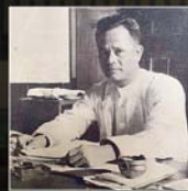
မန်းဘခိုင်