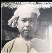
စဝ်စံထွန်း