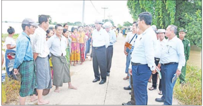
လျှပ်စစ်ကိုချွေတာသုံးစွဲခြင်းဖြင့် မိတာခများများ ကျသင့်ခြင်းမှ ရှောင်ရှားပါ

များ ပြောကြားသည်။ ဦးစိုးသိန်းဝန်ကြီး ချုပ်နှင့် အဖွဲ့အဖွဲ့ဝင်များသည် ရေပြန်ကျေးရွာရှိ ဒေသခံပြည်သူ များနှင့် အခြေခံပညာမူလတန်း ကျောင်းရှေ့တွင် တွေ့ဆုံ၍ အားပေးစကားပြောကြားပြီး အခြေခံ စားသောက်ကုန်ပစ္စည်း များအား ထောက်ပံ့ပေးအပ် ကြသည်။ ထို့နောက် တိုင်းဒေသကြီး ဝန်ကြီးချုပ်နှင့် အဖွဲ့သည် ဝန်ကြီးချုပ်မြို့၊ ငွေဥဒေါင်းခန်းမ၌ ရေပေါ်သောင်ကျေးရွာ အုပ်စု အလယ်ကင်းကျေးရွာ၊ ရေပြန် ကျေးရွာ၊ မအူကုန်းကျေးရွာ၊ ရေပေါ်သောင်ကျေးရွာရှိ အိမ်ခြေ ၇၂၆ အိမ်၊ အိမ်ထောင်စု ၇၅၃ စုနှင့် အုန်းပင်းကွင်းကျေးရွာ အုပ်စု အုန်းပင်းကွင်းကျေးရွာ၊ ရေလဲကြီး ကျေးရွာ၊ သံပုရာကုန်းကျေးရွာ၊ သာရဝေကျေးရွာ၊ ရေပြန်ကျေးရွာ တို့မှ အိမ်ခြေ ၆၅၂ အိမ်၊ အိမ် ထောင်စု ၇၅၉ စုတို့မှ မိသားစုဝင် များနှင့် တွေ့ဆုံပြီး အားပေး စကားများပြောကြား၍ ကျန်းမာ