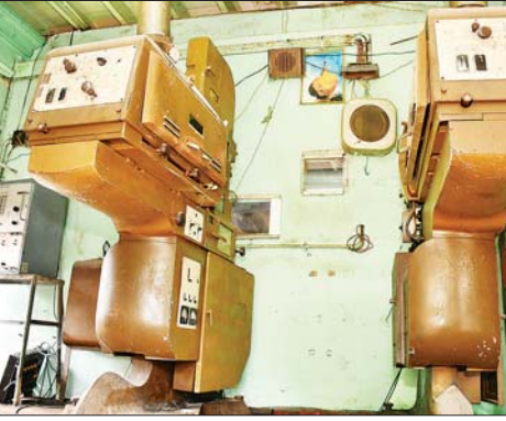
အဆောက်အအုံသည် ၁၉၅၅ ခုနှစ် တွင် တည်ဆောက်ခဲ့သည့် အဆောက်အအုံဖြစ်ပြီး ယခင်က မော်ကွန်းရုပ်ရှင်ကားများ ရိုက်ကူး တည်းဖြတ်၊ ထုတ်လုပ်ခြင်း၊ ရုပ်ရှင်