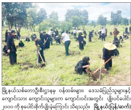
မြို့နယ်သစ်တောဦးစီးဌာနမှ ဝန်ထမ်းများ၊ ဒေသခံပြည်သူများနှင့် ကျောင်းသား ကျောင်းသူများက ကျောင်းဝင်းအတွင်း ပျိုးပင်ပင်များ ၂၀၀၀ ကို စုပေါင်းစိုက်ပျိုးခဲ့ကြောင်း သိရသည်။ မြို့နယ်(ပြန်/ဆက်)