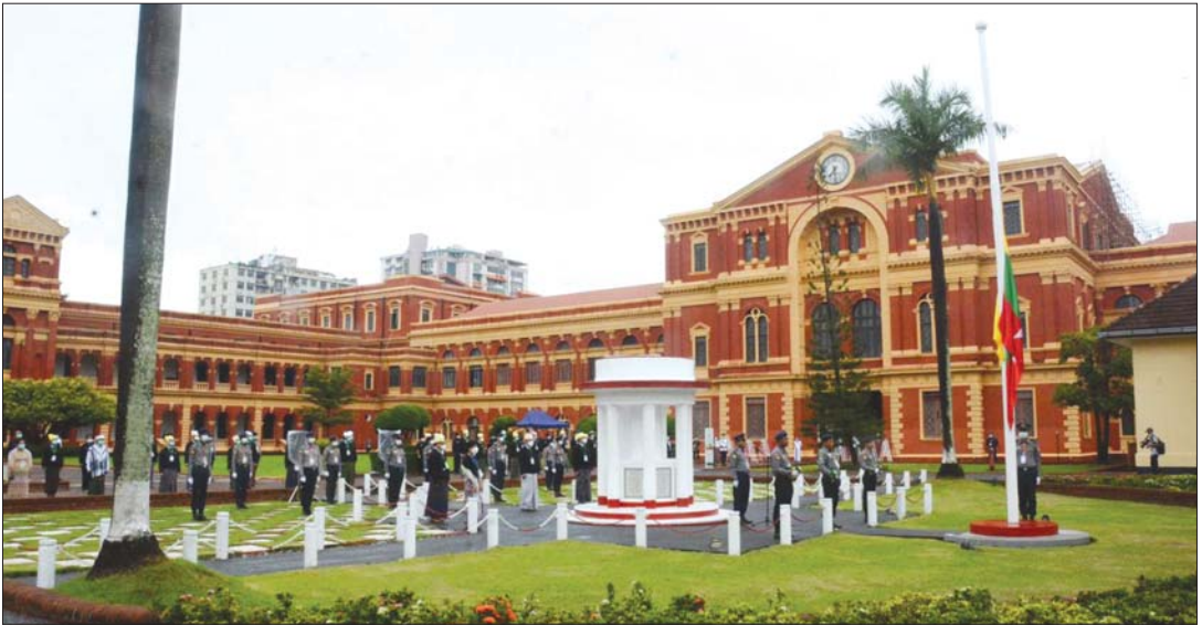
၁၉-၇-၂၀၂၂ ရက်နေ့က (၇၇)နှစ်မြောက် အာဇာနည်နေ့အခမ်းအနားကို အတွင်းဝန်ရုံး(ယခင်ဝန်ကြီးရုံး)၌ ကျင်းပရာ တက်ရောက်လာကြသူများက နိုင်ငံတော်အလံတိုင်ဝက်လွင့်ထူ အလေးပြုကြစဉ်။

လူ၏အသက်ဖြင့် တွက်စစ်လျှင် လူ့သက်တမ်းတစ်ခုမျှ ကြာမြင့်ခဲ့ပြီဖြစ်သည်။ အချိန်ကာလကြာခဲ့ပြီဖြစ်သော်လည်း တိုင်းပြည်အနေဖြင့်၊ ပြည်သူတို့အနေဖြင့် ယနေ့ထက်တိုင်အောင် မမေ့နိုင်သေးပါ။ ဗိုလ်ချုပ်အောင်ဆန်း၏ တိုင်းပြည်နှင့် လူမျိုးအတွက် သူမတူအောင် စွမ်းဆောင်ခဲ့သည့် ဆောင်ရွက်ချက်များ စွဲထင်ကျန်နေသေးသည်။ ဗိုလ်ချုပ်အောင်ဆန်းကို မမေ့နိုင်သလို ဗိုလ်ချုပ်ချမှတ်ခဲ့သည့်လမ်းစဉ်များ၊ မျှော်မှန်းချက်များကို လိုက်နာဆောင်ရွက်ကြပါ၏လားဟု ပြန်လည်ဆန်းစစ်ကြရမည်ဖြစ်သည်။ ငြိမ်းချမ်းသာယာသည့် လူ့ဘောင်သစ်