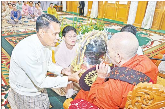
ကာကွယ်ရေးဦးစီးချုပ် (ရေ)နှင့်ဇနီးတို့ ဆရာတော်ထံ ဝါဆိုသင်္ကန်းနှင့် လှူဖွယ်ပစ္စည်းများ ဆက်ကပ်လှူဒါန်းစဉ်။