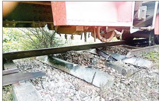
အကြမ်းဖက်သောင်းကျန်းမှုအဖွဲ့က မိုင်းဖောက်ခွဲဖျက်ဆီးခဲ့သဖြင့် ရထားလမ်းပျက်စီးပြီး ပဲခူး-မော်လမြိုင်လမ်းပိုင်း သိမ်ဆိပ်ဘူတာနှင့် ဒုံဝန်းဘူတာအကြား အမှတ်(၈၂)အစုန် လူစီးအမြန်ရထား လမ်းချော်ကျမှုအခြေအနေကို တွေ့ရစဉ်။

အတွက် ကျိုက်ထိုတွင် ရောက်ရှိနေသော အမှတ်(၈၁)အစုန် လူစီးအမြန်ရထားသည် ရထားလမ်းချော်ကျသည့် နေရာသို့ ရောက်ရှိပြီး ညနေ ၄ နာရီခွဲတွင် ခရီးသည်များအား ရထားကူးပြောင်းပြီးစီး၍ ညနေ ၅ နာရီခွဲတွင် အမှတ်(၈၂) အစုန် လူစီးအမြန်ရထားအဖြစ် ရန်ကုန်မြို့သို့ ဆက်လက်ပို့ဆောင်ပေးနိုင်ခဲ့သည်။ အမှတ်(၈၁)အစုန် လူစီးအမြန်ရထားမှ ခရီးသည်များ ဆက်လက်ထွက်ခွာနိုင်ရေးအတွက် လမ်းချော်ကျသော အမှတ်(၈၂) အစုန် တွဲဆိုင်း၏ လမ်းချော်မကျသောတွဲများဖြင့် ခရီးသည်များကို ကူးပြောင်းပြီး ညနေ ၅ နာရီ ၁၅ မိနစ်တွင် သထုံဘူတာဘက်သို့ ဆက်လက်ထွက်ခွာပေးနိုင်ခဲ့သည်။ အဆိုပါခရီးသည်များ အဆင်ပြေစွာ ဆက်လက်ပို့ဆောင်ပေးနိုင်ရေးအတွက် မော်လမြိုင်တွင်ရှိသော စက်ခေါင်းနှင့် အရန်တွဲဆိုင်းဖြင့် သထုံ