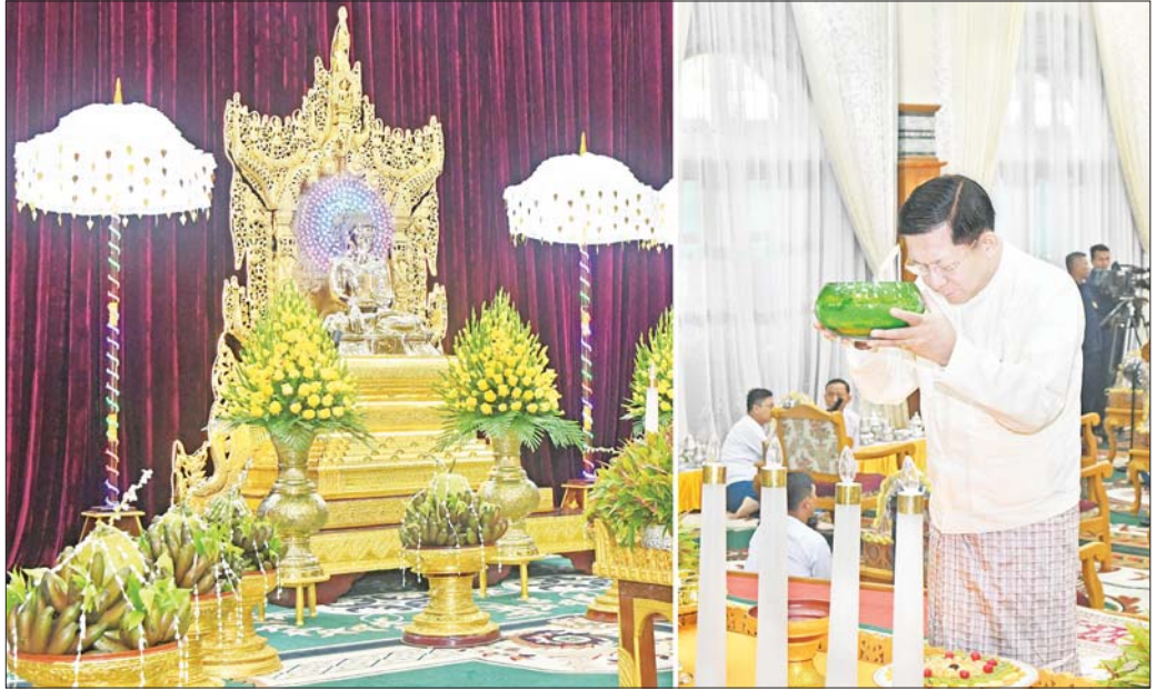
နိုင်ငံတော်စီမံအုပ်ချုပ်ရေးကောင်စီဥက္ကဋ္ဌ တပ်မတော်ကာကွယ်ရေးဦးစီးချုပ် ဗိုလ်ချုပ်မှူးကြီး မင်းအောင်လှိုင် အနော်ရထာခန်းမအတွင်းရှိ ဗုဒ္ဓရုပ်ပွားတော်မြတ်အား ဖူးမြော်ကြည်ညို၍ မြသပိတ်ဆွမ်းတော်၊ သစ်သီး၊ ပန်း၊ သောက်တော်ရေချမ်းနှင့် ဆီမီးတို့ကို ကပ်လှူပူဇော်စဉ်။

ထို့နောက် နိုင်ငံတော်စီမံအုပ်ချုပ်ရေးကောင်စီဥက္ကဋ္ဌ တပ်မတော်ကာကွယ်ရေးဦးစီးချုပ်နှင့် ဇနီးတို့က နိုင်ငံတော်သံဃမဟာနာယကအဖွဲ့ဥက္ကဋ္ဌ သန့်လှိုင်