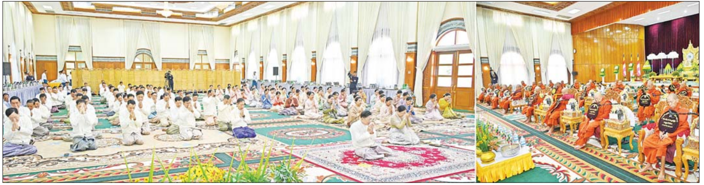
နိုင်ငံတော်စီမံအုပ်ချုပ်ရေးကောင်စီဥက္ကဋ္ဌ တပ်မတော်ကာကွယ်ရေးဦးစီးချုပ် ဗိုလ်ချုပ်မှူးကြီး မင်းအောင်လှိုင်နှင့်ဇနီး ဒေါ်ကြူကြူလှ၊ အခမ်းအနားတက်ရောက်လာကြသူများ နိုင်ငံတော်သံဃမဟာနာယကအဖွဲ့ ဥက္ကဋ္ဌ သန့်လျင်မြို့ မင်းကျောင်းပထမပြန်စာသင်တိုက် ပဓာနနာယက အဂ္ဂမဟာပဏ္ဍိတ အဂ္ဂမဟာသဒ္ဓမ္မဇောတိကဓဇ ဒေါက်တာဘဒ္ဒန္တစန္ဒိမာဘိဝံသထံမှ ကိုးပါးသီလခံယူဆောင်တည်ကြစဉ်။