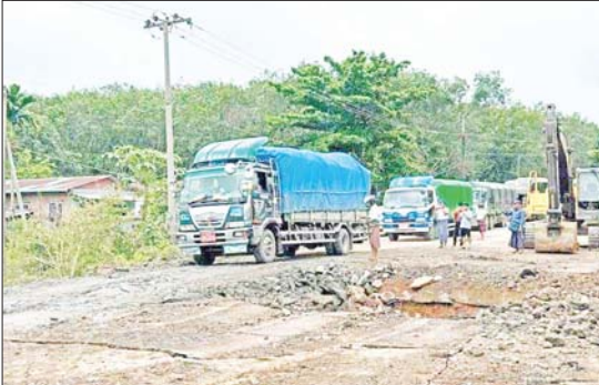
မွန်ပြည်နယ် သထုံမြို့နယ် ကရင်လေးဆိပ်ကျေးရွာအနီးရှိ တံတားကို မော်တော်ယာဉ် များ ဖြတ်သန်းသွားလာနိုင်ရေး ယာယီတံတားဆောင်ရွက်ပေးထားမှုကို တွေ့ရစဉ်။

○ ကျော့ဖိုးမှ ရှိသော နေအိမ်များ၊ လမ်း၊ တံတားများ အား မီးရှို့ဖျက်ဆီးခြင်း၊ မိုင်းထောင် ဖောက်ခွဲခြင်း၊ ကျေးရွာများအတွင်း Drop Bomb များ ကြွချတိုက်ခိုက်ခြင်းစသည့် အကြမ်းဖက်လုပ်ရပ်များကို နည်းလမ်း မျိုးစုံဖြင့် လုပ်ဆောင်ခဲ့ကြသည်။