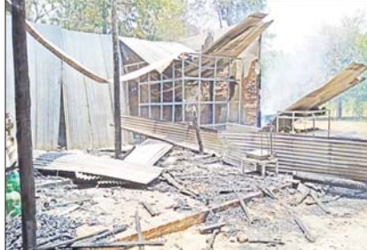
PDF အမည်ခံအကြမ်းဖက်သမားများက ပခုက္ကူမြို့ အောင်သာကျေးရွာအတွင်းရှိ နေအိမ်များကို မီးလောင်ပျက်စီးခဲ့ရသည့် နေအိမ်များကို တွေ့မြင်ရစဉ်။

ကျွန်ုပ်တို့ကန့်ကွက် ချလျက် ရှိကြောင်းနှင့် ခြင်းကြောင့် ပြည်သူလူထု၏ အသက်အိုးအိမ် စည်းစိမ်များ ပျက်စီးဆုံးရှုံးခဲ့ရပြီး ထိုသို့ အကြမ်းဖက်သမားများ၏ လုပ်ပိုင်ဆောင်ရွက်လျက်ရှိကြောင်း သတင်းရရှိများကို ဒေသခံပြည်သူလူထုမှ လုံးဝလက်ခံနိုင်ခြင်းမရှိဘဲ ပြင်းထန်စွာ ကန့်ကွက်ရှုတ်ချလျက် ရှိကြောင်းနှင့် လုံခြုံရေးတပ်ဖွဲ့ဝင်များက လိုအပ်သည့် လုံခြုံရေးလုပ်ငန်းများ တိုးမြှင့်ဆောင်ရွက်လျက်ရှိကြောင်း သတင်းရရှိသည်။ သတင်းစဉ်