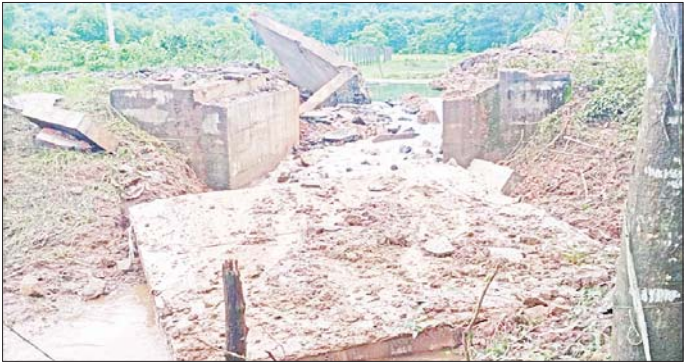
KNLA အဖွဲ့မှ အကြမ်းဖက်မှုကို လိုလားသူများနှင့် PDF အမည်ခံအကြမ်းဖက်ပူးပေါင်းအဖွဲ့တို့မှ မိုင်းထောင်ဖောက်ခွဲဖျက်ဆီးမှုကြောင့် ပျက်စီးခဲ့သည့် တံတားကို တွေ့ရစဉ်။

နေပြည်တော် ဇူလိုင် ၁၇ အကြမ်းဖက် အဖွဲ့အစည်းများ ဖြစ်သည့် NUG၊ CRPH တို့၏ လက်ဝေခံ PDF အမည်ခံအကြမ်း ဖက်သမားများနှင့် အကြမ်းဖက် မှုကို လိုလားသော တိုင်းရင်းသား လက်နက်ကိုင်အဖွဲ့ အချို့သည် တိုင်းပြည် တည်ငြိမ်အေးချမ်းမှုနှင့် တရားဥပဒေစိုးမိုးမှုကို ပျက်ပြား စေရန်ရည်ရွယ်ချက်ဖြင့် ရုံးဌာန အဆောက်အအုံများ၊ စာသင် ကျောင်းများ၊ အများပြည်သူ သွားလာနေထိုင် အသုံးပြုလျက် စာမျက်နှာ ၁၄ ကော်လံ ၁ ၀