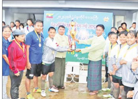
၁၇ ရက်အထိ ကျင်းပခဲ့ပြီး ခရိုင်အတွင်းရှိ ပဲခူး၊ သနပ်ပင်၊ ကဝ၊ ဝေါမြို့နယ် လေးမြို့နယ်မှ ပြိုင်ပွဲဝင်အသင်း လေးသင်းပါဝင်ကာ အုပ်စု ပတ်လည်ယှဉ်ပြိုင်ကစားခဲ့ကြောင်း သိရသည်။ သက်ထက်

အဆိုပါ ယူ-၂၀ အမျိုးသမီးဘောလုံးပြိုင်ပွဲအား ဇူလိုင် ၁၀ ရက်မှ