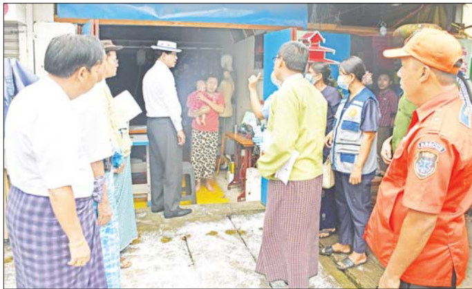
များကိုလည်းကောင်း၊ တာဝန်ရှိသူများက လုပ်ငန်း ဆောင်ရွက်လျက်ရှိသည့်များကို လည်းကောင်း ရှင်းလင်းတင်ပြကြသည်။

ဦးစွာ တိုင်းဒေသကြီးဝန်ကြီးချုပ်နှင့် အဖွဲ့အား မြို့နယ်အထွေထွေအုပ်ချုပ်ရေးဦးစီးဌာနရုံး အစည်း အဝေးခန်းမ၌ မြို့နယ်စီမံအုပ်ချုပ်ရေးအဖွဲ့ဥက္ကဋ္ဌက ဝမ်းပျက်၊ ဝမ်းလျှောရောဂါကာကွယ်ထိန်းချုပ်ခြင်း လုပ်ငန်းများဆောင်ရွက်ရန် ရပ်ကွက်ပေါင်း ၁၄ ရပ်ကွက်တွင် ၁၄ ဖွဲ့ ဖွဲ့စည်း၍ လုပ်ငန်းဆောင်ရွက် နေမှုများကိုလည်းကောင်း၊ မြို့နယ်ပြည်သူ့ကျန်းမာ ရေးဦးစီးဌာနမှူးက ဖွဲ့စည်းထားရှိသည့် ၁၄ ဖွဲ့နှင့် ရောဂါဖြစ်ပွားသည့် ရပ်ကွက်အတွင်း ကာကွယ် ထိန်းချုပ်ရေးလုပ်ငန်းများ ဆောင်ရွက်မှုအခြေအနေ