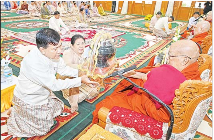
ညှိနှိုင်းကွပ်ကဲရေးမှူး (ကြည်း၊ ရေ၊ လေ) ဗိုလ်ချုပ်ကြီး မောင်မောင်အေးနှင့် ဇနီးတို့ ဆရာတော်ထံ ဝါဆိုသင်္ကန်းနှင့် လှူဖွယ်ပစ္စည်းများ ဆက်ကပ်လှူဒါန်းစဉ်။