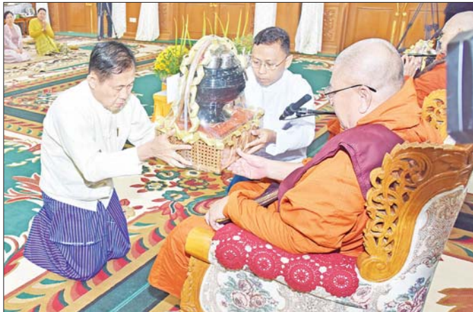
နိုင်ငံတော်စီမံအုပ်ချုပ်ရေးကောင်စီဒုတိယဥက္ကဋ္ဌ ဒုတိယတပ်မတော်ကာကွယ်ရေးဦးစီးချုပ် ကာကွယ်ရေးဦးစီးချုပ် (ကြည်း) ဒုတိယဗိုလ်ချုပ်မှူးကြီး စိုးဝင်း၊ နိုင်ငံတော်သံဃမဟာနာယကအဖွဲ့ အကျိုးတော်ဆောင် မစိုးရိမ်တို့က သစ်ဆရာတော်ကြီးထံ ဝါဆိုသင်္ကန်းနှင့် လှူဖွယ်ပစ္စည်းများ ဆက်ကပ်လှူဒါန်းစဉ်။

တိုက်သစ်ဆရာတော်ကြီးထံ ဝါဆိုသင်္ကန်းနှင့်လှူဖွယ်ပစ္စည်းများကို ဆက်ကပ်လှူဒါန်းသည်။ စာမျက်နှာ ၄ သို့