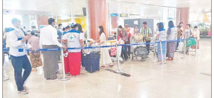
ဆိပ်ကမ်းနှင့် ချယ်ရီ - ၃ ရေယာဉ်ပေါ်၌ နံရံကပ် ဝမ်းလျှောရောဂါကြိုတင်ကာကွယ်ရေး အသိပေး ပိုစတာများ ကပ်ခြင်း၊ ခရီးသွားပြည်သူများအား ကြော်ငြာခြင်းလုပ်ငန်းများကို ဆောင်ရွက်ခဲ့ကြောင်း လက်ကမ်းစာစောင်များ ဝေငှခြင်း၊ ဝမ်းပျက် သတင်းရရှိသည်။ သတင်းစဉ်

အလားတူ ပန်းဆိုးတန်း - ၃လ ဆိပ်ကမ်းတွင် ကူးတိုလမ်းပြေးဆွဲနေသော ချယ်ရီ-၃ ရေယာဉ်ပေါ် ၌လည်း ပြင်းထန်ဝမ်းပျက်ဝမ်းလျှောရောဂါနှင့် ပတ်သက်သည့် အသိပညာပေးဟောပြောပွဲကို ဆောင်ရွက်ပြီး ပြည်သူ့ကျန်းမာရေးဦးစီးဌာန၊ လူဝင်မှုဆိုင်ရာ ဆိပ်ကမ်းကျန်းမာရေးဌာန၊ ကြက်ခြေနီ တပ်ဖွဲ့ဝင်များနှင့် ပြည်တွင်းရေးကြောင်းဦးဆောင် ရေးမှ တာဝန်ရှိသူများက ပန်းဆိုးတန်း - ၃လ