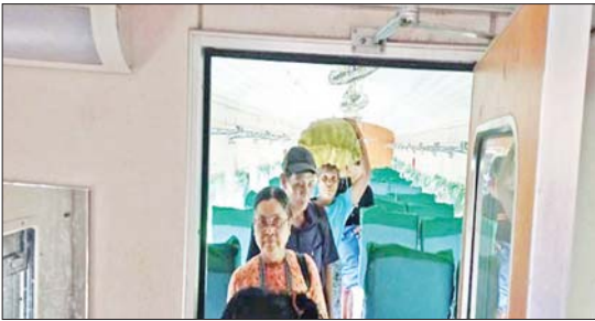
ပဲခူး-မော်လမြိုင်လမ်းပိုင်း သိမ်ဆိပ်ဘူတာနှင့် ဒုံဝန်းဘူတာအကြား ရထားလမ်းချော်ကျသည့် အမှတ်(၈၂)အစုန် ရထားပေါ်မှ ခရီးသည်များ ရထားကူးပြောင်းနေစဉ်။

နေပြည်တော် ဇူလိုင် ၁၇ ယနေ့ မော်လမြိုင်မှထွက်ခွာလာသည့် အမှတ်(၈၂)အစုန် မော်လမြိုင် - ရန်ကုန် လူစီးအမြန်ရထားသည် မွန်ပြည်နယ် သထုံမြို့နယ် သိမ်ဆိပ်ဘူတာနှင့် ဒုံဝန်းဘူတာအကြား မိုင်တိုင် အမှတ် ၁၂၃/၀၇-၀၅ သို့ နံနက် ၁၁ နာရီ ၁၀ မိနစ်အချိန် ရထားရောက်ရှိပြန်သည့်အခါ အဆိုပါ နေရာ၌ ရထားလမ်းပိုင်းပေါက်ကွဲထားခြင်းကြောင့် သံလမ်းတစ်ပေခွဲခန့် ပြတ်တောက်နေသဖြင့် စက်ခေါင်းနှင့်အတူ ရထားတွဲဆိုင်းတွင်ပါရှိသော လူစီးတွဲနှစ်တွဲ လမ်းချော်ကျမှု ဖြစ်ပွားသည်။ ရထားလမ်းချော်ကျမှုကြောင့် ခရီးသည်နှင့် ဝန်ထမ်းထိခိုက်မှုမရှိဘဲ သိမ်ဆိပ်-ဒုံဝန်း လမ်းပိုင်းကို နံနက် ၁၁ နာရီ ၁၃ မိနစ်တွင် ယာယီပိတ်ထားခဲ့ရသည်။ လမ်းပိုင်းပိတ်ဆို့မှုကြောင့် ယနေ့ နံနက်ပိုင်းတွင် ရန်ကုန်မှ ပုံမှန်ထွက်ခွာလာသော အမှတ်(၈၁)အစုန် လူစီးရထားသည် နံနက် ၁၁ နာရီ ၄၄ မိနစ်အချိန်တွင် ကျိုက်ထိုသို့ ရောက်ရှိနေပြီး အဆိုပါ ရထားတွင် ရိုးရိုးတန်းခရီးသည် ၄၆၀ နှင့် အထက်တန်းခရီးသည် ၂၅၅ ဦး စုစုပေါင်း ၆၅၅ ဦး ပါရှိကြောင်း သိရှိရသည်။ ဆက်လက်ပို့ဆောင် လမ်းချော်ကျသည့် မော်လမြိုင်မှ ထွက်ခွာလာသော အမှတ်(၈၂)အစုန် လူစီးအမြန်ရထားပေါ်တွင် လိုက်ပါလာသည့် ရိုးရိုးတန်းခရီးသည် ၃၁၃ ဦးနှင့် အထက်တန်းခရီးသည် ၁၄၆ ဦး စုစုပေါင်း ၄၅၉ ဦးအား ဆက်လက်ထွက်ခွာနိုင်ရေး