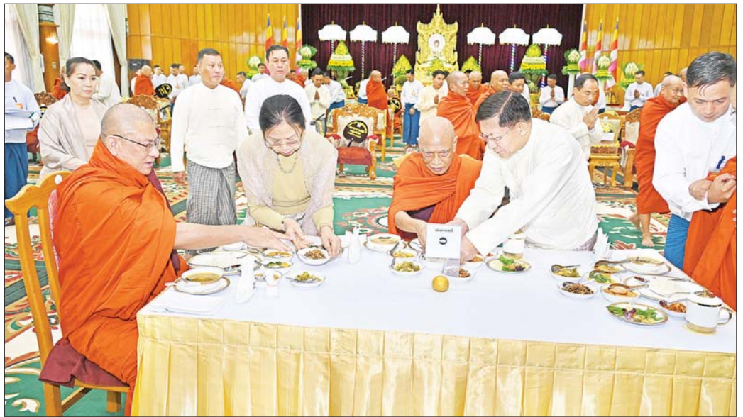
နိုင်ငံတော်စီမံအုပ်ချုပ်ရေးကောင်စီဥက္ကဋ္ဌ တပ်မတော်ကာကွယ်ရေးဦးစီးချုပ် ဗိုလ်ချုပ်မှူးကြီး မင်းအောင်လှိုင်နှင့်ဇနီး ဒေါ်ကြူကြူလှတို့ သန့်လျင်မင်းကျောင်း ဆရာတော်ကြီး အမှူးပြုသည့် ဆရာတော်၊ သံဃာတော်များအား နေ့ဆွမ်းဆက်ကပ်လှူဒါန်းစဉ်။