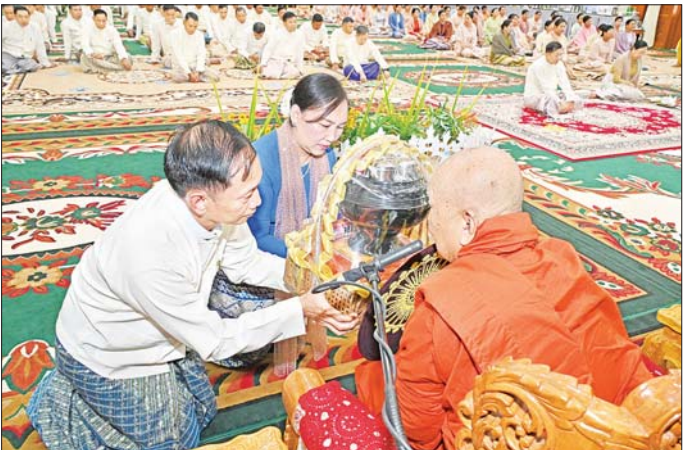
ကာကွယ်ရေးဦးစီးချုပ်(လေ)နှင့် ဇနီးတို့ ဆရာတော်ထံ ဝါဆိုသင်္ကန်းနှင့် လှူဖွယ်ပစ္စည်းများ ဆက်ကပ်လှူဒါန်းစဉ်။