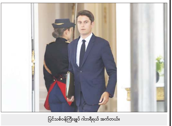
ပြင်သစ်ဝန်ကြီးချုပ် ဂါဘရီရယ် အက်တယ်။

အက်တယ်သည် ဇူလိုင် ၁၆ ရက်က ရုပ်မြင်သံကြားဖန်သားပြင်ပေါ်၌ ထွက်ပေါ်လာခဲ့သည်။ ဝန်ကြီးချုပ်သစ်ခန့်အပ်ရန် နောက်ထပ်ရက်သတ္တပတ်များစွာ ကြာမြင့်ခဲ့ပြီးမည်ဟု သမ္မတ မက်ခရူန့်က ၎င်းကိုပြောကြားထားကြောင်း ၎င်းက ပြောသည်။ ပြင်သစ်နိုင်ငံ၌ ပါရီအိုလံပစ် ဖွင့်ပွဲမတိုင်မီ နိုင်ငံရေးအခြေအနေမှာ မတည်မငြိမ်ဖြစ်နေဆဲဖြစ်သည်။ အင်နီအိတ်ချီက