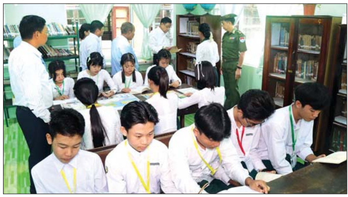
ဖွံ့ဖြိုးတိုးတက်ရေးနှင့် စာဖတ်ရိုက်မြှင့်တင်ရေးပွဲတော်အတွင်း ခင်းကျင်းပြသထားသည့် လှပသာယာပြည်မြန်မာ ရောင်စုံစာတိုပုံများ၊ စကားရည်လူပြိုင်ပွဲ၊ အထက်တန်းအဆင့်နှင့် အလယ်တန်းအဆင့် ကျုပ်နံးစကားပြောပြိုင်ပွဲများ၊ ပုံပြင်ပြောပြိုင်ပွဲ၊ ကဗျာရွတ်ဆိုပြိုင်ပွဲ၊ အထက်တန်းအဆင့်နှင့် အလယ်တန်း

ထားဝယ် ဇူလိုင် ၁၇ ကျောင်းစာကြည့်တိုက်များ ဖွံ့ဖြိုးတိုးတက်စေရန်၊ ကျောင်းသား ကျောင်းသူများ စာအုပ်စာပေ လေ့လာဖတ်ရှုနိုင်ရန် စာပေလေ့လာဖတ်ရှုခြင်းမှ ရရှိသော အသိပညာဟုသုတများကို ပြန့်ပွားအသုံးပြုမှုပေးနိုင်ရန်၊ ကျောင်းသား ကျောင်းသူများ ကျန်းမာကြံ့ခိုင်သန်စွမ်းစေရန် ရည်ရွယ်၍ တနင်္သာရီတိုင်းဒေသကြီးအစိုးရအဖွဲ့၏ စီမံမှုဖြင့် ပြန်ကြားရေးနှင့် ပြည်သူ့ဆက်ဆံရေးဦးစီးဌာနနှင့် အခြေခံပညာဦးစီးဌာနတို့ ပူးပေါင်းကျင်းပသော ကျောင်းစာကြည့်တိုက်များ ဖွံ့ဖြိုးတိုးတက်ရေးနှင့် စာဖတ်ရိုက်မြှင့်တင်ရေးပွဲတော်ကို ယနေ့နံနက်ပိုင်းက ထားဝယ်မြို့ အမှတ် (၂) အခြေခံပညာအထက်တန်းကျောင်း၌ ကျင်းပသည်။