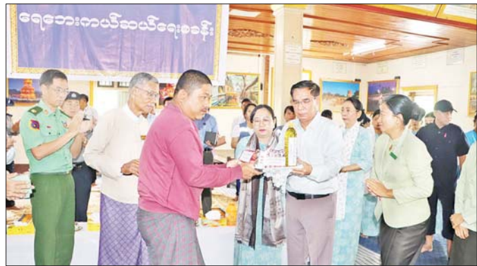
တာဝန်ရှိသူများအား မှာကြားသည်။ ယင်းနောက် တိုင်းဒေသကြီး ဝန်ကြီးချုပ်သည် ပန်းတောင်းမြို့နယ် ရွှေကျောင်းကုန်းကျေးရွာ၌ ပေါင်ကြီးတင်စနစ်ဖြင့် မိုးနှမ်း(ဆင်းရတနာ-၃) ၁၀ ဧက စိုက်ပျိုးအောင်မြင်ဖြစ်ထွန်းနေမှုကို ကြည့်ရှုအားပေးပြီး ဒေသခံတောင်သူများနှင့် တွေ့ဆုံအမှာစကား ပြောကြားခဲ့ကြောင်း သိရသည်။ တိုင်းဒေသကြီး(ပြန်/ဆက်)

ထို့နောက် တိုင်းဒေသကြီး ဝန်ကြီးချုပ်နှင့်အဖွဲ့သည် ပန်းတောင်းမြို့နယ် ဧရာဝတီမြစ်ကမ်းဘေး မြေနိမ့်ပိုင်းရှိ ရပ်ကွက်/ကျေးရွာများအတွင်း ရေဝင်ရောက်နေမှုအား လိုက်လံကြည့်ရှုစစ်ဆေးပြီး ရေဝင်ရောက်ခဲ့သည့် ဌာနဆိုင်ရာများအတွက် ထောက်ပံ့ငွေများ ပေးအပ်သည်။ ယင်းနောက် ပန်းတောင်း-ဥသျှစ်ပင်မြို့ ကားလမ်းတစ်လျှောက် ဧရာဝတီမြစ်ရေဝင်ရောက်မှု အခြေအနေများကို လှည့်လည်ကြည့်ရှုခဲ့ပြီး ရေအမြန်ဆုံး ပြန်လည်ကျဆင်းစေရေးနှင့် ရေဝင်ကျန်ရှိမှုမရှိစေရေး စစ်ဆေးဆောင်ရွက်ရန်