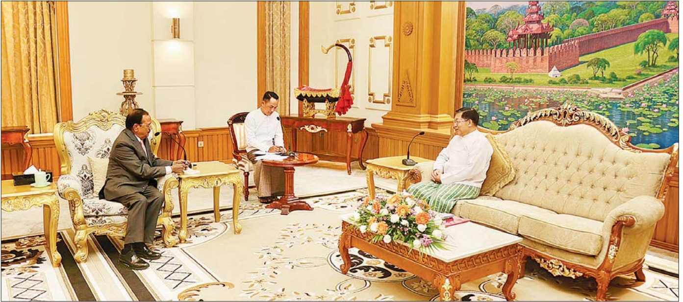
နိုင်ငံတော်စီမံအုပ်ချုပ်ရေးကောင်စီဥက္ကဋ္ဌ နိုင်ငံတော်ဝန်ကြီးချုပ် ဗိုလ်ချုပ်မှူးကြီး မင်းအောင်လှိုင် အိန္ဒိယနိုင်ငံ၊ အမျိုးသားလုံခြုံရေးဆိုင်ရာ အကြံပေးပုဂ္ဂိုလ် H.E. Shri Ajit Doval အား လက်ခံတွေ့ဆုံစဉ်။

“မြန်မာနိုင်ငံ၏ နိုင်ငံရေးဖြစ်ပေါ် တိုးတက်မှုအခြေအနေများနှင့် လွတ်လပ်၍ တရားမျှတသည့် ပါတီစုံ ဒီမိုကရေစီ အထွေထွေရွေးကောက်ပွဲ ကျင်းပနိုင်ရေး ကြိုတင်ပြင်ဆင်ဆောင်ရွက်လျက်ရှိသည့် အခြေအနေများ အမြင်ချင်းဖလှယ်”