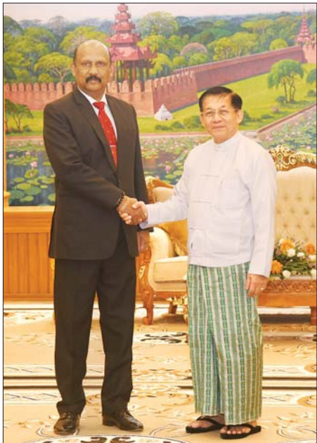
နိုင်ငံတော်စီမံအုပ်ချုပ်ရေးကောင်စီဥက္ကဋ္ဌ နိုင်ငံတော်ဝန်ကြီးချုပ် ဗိုလ်ချုပ်မှူးကြီး မင်းအောင်လှိုင် သီရိလင်္ကာနိုင်ငံ၊ ကာကွယ်ရေးဝန်ကြီးဌာန၏ အတွင်းဝန် General Kamal Gunaratne (Retd) အား ရင်းရင်းနှီးနှီးနှုတ်ဆက်စဉ်။

အတွင်းဝန်တို့သည် အမှတ်တရ လက်ဆောင်ပစ္စည်းများ အပြန်အလှန်ပေးအပ်ပြီး စုပေါင်းမှတ်တမ်းတင်စာတံပုံရိုက်ခဲ့ကြကြောင်း သတင်းရရှိသည်။ သတင်းစဉ်