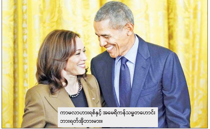
ကာမလာဟားရစ်နှင့် အမေရိကန် သမ္မတဟောင်း ဘားရတ်အိုဘားမား။

ဖုန်းပြောဆိုခဲ့သည့် ဒီဇီယိုဖိုင်ကို လူမှုမီဒီယာပလက်ဖောင်း X တွင် အိုဘားမားက ဖော်ပြခဲ့သည်။