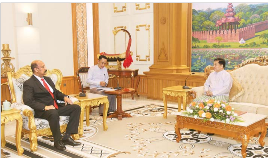
နိုင်ငံတော်စီမံအုပ်ချုပ်ရေးကောင်စီဥက္ကဋ္ဌ နိုင်ငံတော်ဝန်ကြီးချုပ် ဗိုလ်ချုပ်မှူးကြီး မင်းအောင်လှိုင် သီရိလင်္ကာနိုင်ငံ၊ ကာကွယ်ရေးဝန်ကြီးဌာန၏ အတွင်းဝန် General Kamal Gunaratne (Retd) ကို လက်ခံတွေ့ဆုံစဉ်။

Ponnampereuma နှင့် တာဝန်ရှိသူများ တက်ရောက်ကြသည်။ အမြင်ချင်းဖလှယ်ဆွေးနွေး ထိုသို့တွေ့ဆုံရာတွင် နှစ်နိုင်ငံ ချစ်ကြည်ရင်းနှီးမှုနှင့် သံတမန် ဆက်ဆံရေးဆိုင်ရာ ကိစ္စရပ်များ၊ ဘာသာရေးဆိုင်ရာများတွင် အတူ တကွ အပြန်အလှန် ပူးပေါင်း ဆောင်ရွက်လျက်ရှိမှု အခြေအနေများ၊ နှစ်နိုင်ငံ တပ်မတော်နှစ်ရပ် အကြား သင်တန်းသားများ စေလွှတ်ရေးနှင့် ပူးပေါင်းဆောင်ရွက်မှုများ တိုးမြှင့်ရေးဆိုင်ရာ ကိစ္စရပ်များ၊ နှစ်နိုင်ငံအကြား စီးပွားရေးဖွံ့ဖြိုးတိုးတက်မှုအတွက် ပူးပေါင်းဆောင်ရွက်မှုများ မြှင့်တင် ရေးဆိုင်ရာကိစ္စရပ်များ၊ ဘင်းမိ စတက်အမျိုးသားလုံခြုံရေးဆိုင်ရာ အကြီးအကဲများ အစည်းအဝေး ကျင်းပခဲ့မှု အခြေအနေများနှင့် မြန်မာနိုင်ငံအနေဖြင့် နိုင်ငံအားလုံးနှင့် တက်တက်ကြွကြွ ပါဝင်ဆောင်ရွက်လျက်ရှိမှု အခြေအနေများနှင့် နှစ်နိုင်ငံအကြား ကာကွယ်ရေးစုံတွင် ပူးပေါင်းဆောင်ရွက်မှုများ မြှင့်တင်ဆောင်ရွက်ရေး ဆိုင်ရာ ကိစ္စရပ်များနှင့် ပတ်သက်၍ ရင်းနှီးပွင့်လင်းစွာ အမြင်ချင်း