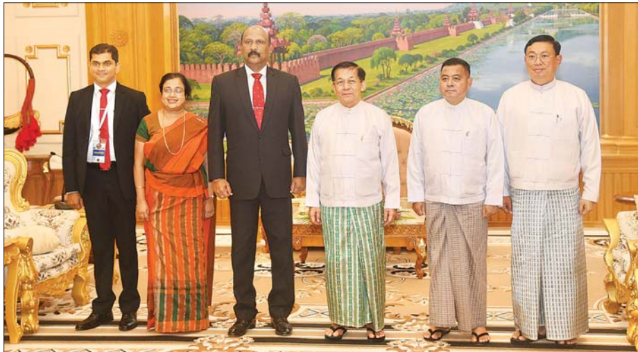
နိုင်ငံတော်စီမံအုပ်ချုပ်ရေးကောင်စီဥက္ကဋ္ဌ နိုင်ငံတော်ဝန်ကြီးချုပ် ဗိုလ်ချုပ်မှူးကြီး မင်းအောင်လှိုင်နှင့်အဖွဲ့ဝင်များ သီရိလင်္ကာနိုင်ငံ၊ ကာကွယ်ရေးဝန်ကြီးဌာန၏ အတွင်းဝန် General Kamal Gunaratne (Retd) နှင့် အဖွဲ့ဝင်များနှင့်အတူ စုပေါင်းမှတ်တမ်းတင်စာတံပုံရိုက်စဉ်။