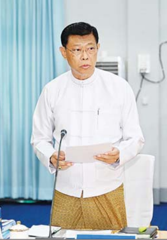
e-Government ဦးဆောင်ကော်မတီဥက္ကဋ္ဌ ပြည်ထောင်စုဝန်ကြီး ဗိုလ်ချုပ်ကြီး မြထွန်းဦး ရှင်းလင်းတင်ပြစဉ်။

လျင်မြန်စွာဖွံ့ဖြိုးတိုးတက်လာနေသည့်ကို အထင် အရာ တွေ့မြင်ရကြောင်း၊ နိုင်ငံတစ်ခု၏ စီးပွားရေး ဖွံ့ဖြိုးတိုးတက်မှုသည် နိုင်ငံ၏ပိုမိုကျယ်ပြန့်ပြီး ပိုမိုလုံခြုံစိတ်ချရသည့် ဒစ်ဂျစ်တယ်ဝန်ဆောင်မှုများ ပေးနိုင်ခြင်းဆိုသည့် အချက်ပေါ်တွင် မှီတည်နေ ကြောင်း၊ ဒစ်ဂျစ်တယ်အစိုးရဆိုသည်မှာ ဒစ်ဂျစ်တယ် စွမ်းရည်နှင့် ဒစ်ဂျစ်တယ် ရင့်ကျက်ပြည့်စုံမှုများဆီကို ဦးတည်ရမည်ဖြစ်ခြင်းကြောင့် ယခင်ဆယ်စုနှစ် များက ကြိုးပမ်းအကောင်အထည်ဖော်ခဲ့သည့် e-Government ၏ ပုံရိပ်ကို တိုးမြှင့်ပြီး နိုင်ငံတကာ နှင့် ရင်ပေါင်တန်းနိုင်အောင် ဆောင်ရွက်သွားကြရန် လိုအပ်ကြောင်း၊ ထို့ကြောင့် မိမိတို့ မျှော်မှန်းသည့် Digital အခွင့်အလမ်းများကို အမိအရဆုပ်ကိုင်နိုင်