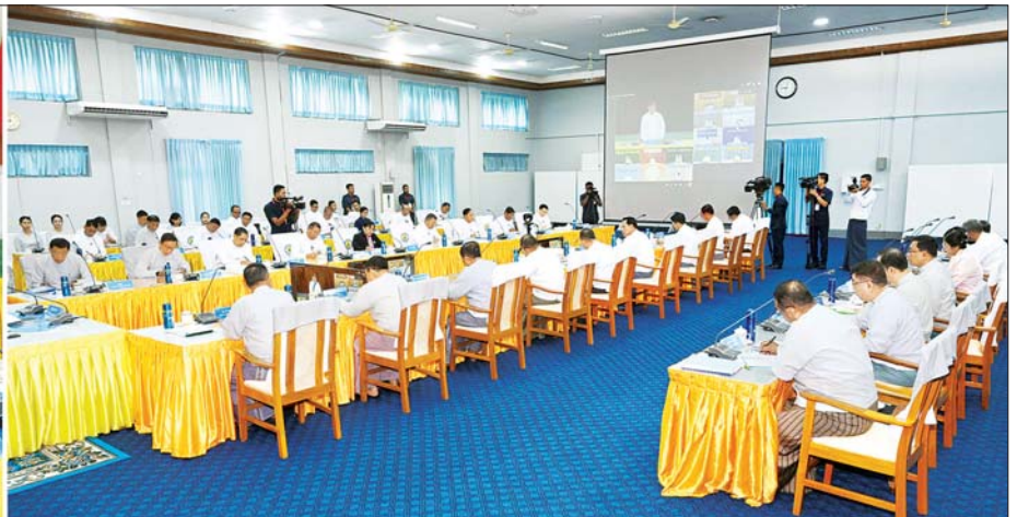
နိုင်ငံတော်စီမံအုပ်ချုပ်ရေးကောင်စီဥက္ကဋ္ဌ နိုင်ငံတော်ဝန်ကြီးချုပ် ဗိုလ်ချုပ်မှူးကြီး မင်းအောင်လှိုင် e - Government ဦးဆောင်ကော်မတီ၏ (၁/၂၀၂၄) လုပ်ငန်းညှိနှိုင်းအစည်းအဝေးတွင် အမှာစကားပြောကြားစဉ်။