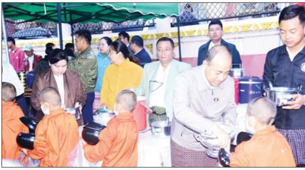
သာမဏေအပါး ၇၈၀ တို့အား ဆွမ်းနှင့် အဆင့် ဌာနဆိုင်ရာများနှင့် မိသားစုဝင်များ၊ ဆွမ်းဟင်းများ၊ အချိုပွဲများ၊ သစ်သီးများ၊ ဒေသခံပြည်သူများက ဆက်လက်၍ ခေါက်ဆွဲခြောက်များ လောင်းလှူကြပြီး ဆွမ်းလောင်းလှူသွားမည်ဖြစ်ကြောင်း သိရ တွင်းကာလတွင် ရှမ်းပြည်နယ်အစိုးရအဖွဲ့ရှိ ဝန်ကြီးဌာနများ၊ ပြည်နယ်၊ ခရိုင်၊ မြို့နယ်

တောင်ကြီး ဇူလိုင် ၂၈ တောင်ကြီးမြို့ပေါ်ရှိ စာသင်တိုက်ကျောင်း ၁၀၄ ကျောင်းမှ ဆရာတော်၊ သံဃာတော်များ အား ဆွမ်းနှင့်ဆွမ်းဟင်းများ လောင်းလှူပွဲကို ရှမ်းပြည်နယ်အစိုးရအဖွဲ့က ကြီးမှူး၍ ဇူလိုင် ၂၈ ရက်က တောင်ကြီးမြို့သာသနာလင်္ကာရ ကမ္ဘောဇသာသနာ့စာအုပ်ကျောင်းရှေ့၌ ကျင်းပ သည်။