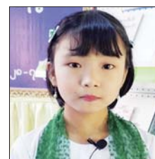
မခေတ်ကေရီစံ