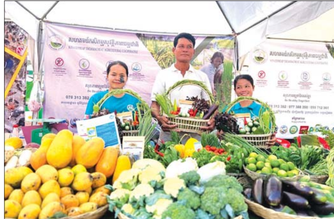
စိုက်ပျိုးရေးဆိုင်ရာ သမဝါယမအသင်းတစ်ခု၏ ထုတ်ကုန်သစ်သီးဝလံများအား တွေ့ရစဉ်။

အခြေခံလူတန်းစားပြည်သူများနှင့် လုပ်ကွက်ငယ်တောင်သူများအတွက် ငွေကြေးဝန်ဆောင်မှုများ ရရှိနိုင်စေရန် လူထုအခြေပြုဘဏ္ဍာရေးသမဝါယမ အသင်းများ အားကောင်းလာစေရေး အလေးပေးဆောင်ရွက်ခဲ့သည်ကို တွေ့ရသည်။ သမဝါယမကဏ္ဍ