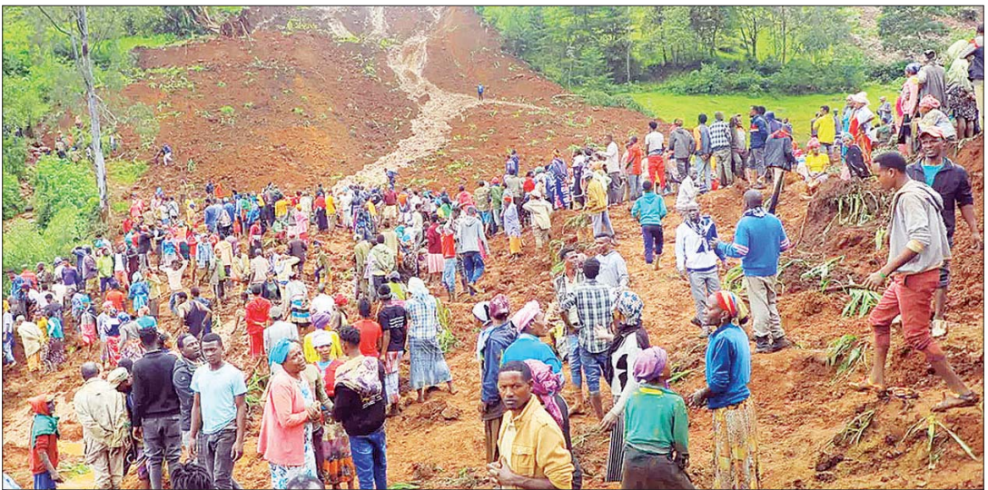
အိသီယိုးပီးယားနိုင်ငံတောင်ပိုင်း ဂိုဏ်းခရိုင် မြေပြိုမှုဖြစ်ပွားသည့်နေရာကို တွေ့ရစဉ်။

အိသီယိုးပီးယားနိုင်ငံသည် အာဖရိက ဦးချိုဒေသတွင်တည်ရှိသော ကုန်းတွင်း ပိတ်နိုင်ငံဖြစ်သည်။ ယင်းနိုင်ငံသည် အာဖရိကတွင် ဒုတိယလူဦးရေအများဆုံးနိုင်ငံဖြစ်ပြီး လူဦးရေ ၅၅ ဒသမ ၂ သန်းခန့်ရှိသည်။ ယခုအခါ နိုင်ငံတော်ပိုင်း ဂိုဏ်းခရိုင် ကန်ချိုရာခါဂေါဒါဒါဒါရွာ၌ ဇူလိုင် ၂၀ ရက်ညပိုင်းနှင့် ၂၂ ရက် နံနက်ပိုင်းတို့တွင် မိုးသည်းထန်စွာ ရွာသွန်းမှုကြောင့် ဖြစ်ပွားခဲ့သည့် မြေပြိုမှုများကြောင့် လူပေါင်းရာနှင့်ချီ သေဆုံးမှုဖြစ်ပေါ်ခဲ့သည်။