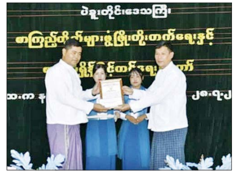
အဆိုပါပွဲတော်ကို မြို့နယ် အတွင်းရှိ အခြေခံပညာကျောင်း ၁၀၀၀ ခန့် ပျော်ရွှင်စွာပါဝင်ပေါင်း ၄၆ ကျောင်းနှင့် ကိုယ်ပိုင် ကျောင်းများမှ စုစုပေါင်း ကျောင်းသား ကျောင်းသူ အင်အား ဆင်နွှဲခဲ့ကြောင်း သိရသည်။ မြို့နယ်(ပြန်/ဆက်)

ငွေများကိုလည်းကောင်း ပေးအပ်သည်။ ထို့နောက် တိုင်းဒေသကြီး လူမှုရေးရာဝန်ကြီးနှင့် တာဝန်ရှိသူများ၏ ဘက်စုံပညာနှင့် ပတ်သက်သည့် ပြိုင်ပွဲဝင်နေမှုများ၊ ဂိမ်းကစားမှုအပြင် စိတ်ဝင်စားဖွယ် ရာ ကလေးစာဖတ်ခန်း၊ နံရံကပ်စာစောင်နှင့် စာအုပ်စာစောင်ပြပွဲ၊ ရောင်စုံစာတတ်ပုံပြပွဲ၊ မြန်မာနိုင်ငံရဲတပ်ဖွဲ့နှင့် မီးသတ်တပ်ဖွဲ့တို့၏ ပြခန်းများ၊ စာအုပ်စာစောင်ရောင်းဆိုင်များနှင့် စတုဒ္ဒိသာကျေးမွေးခြင်းတို့ကို လှည့်လည်ကြည့်ရှုအားပေးကြောင်း သိရသည်။