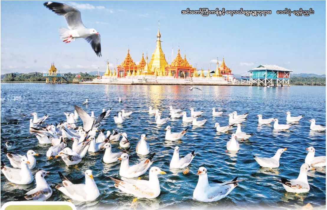
အင်းတော်ကြီးကန်ရှိ ရေလယ်ရွှေဥယျာဉ်၊ ခေတ်မီ-ရွှေရိုးညွှန်း

ဘေးမှတော၏ ၅၀ ရာခိုင်နှုန်းကို ရွက်ကြွေတောများဖြင့် ဖုံးလွှမ်းထားပြီး ကျန် ၃၀ ရာခိုင်နှုန်းကို စိမ့်မြေတောများ ဖြင့် ဖုံးလွှမ်းထားသည်။ အခြားသစ်တော အမျိုးအစားများမှာ အမြဲစိမ်းတော၊ ရွက်ကြွေတော၊ တောင်ပေါ်တော ထင်းရှူးဖြစ်သည်။ စာရင်းစယားများအရ ၁၆၅ မျိုးသော သစ်ပင်နှင့် ဆေးဖက်ဝင် သစ်ပင်မျိုးစိတ်များ၊ နို့တိုက်သတ္တဝါ ၃၈ မျိုး၊ ငှက်မျိုးစိတ် ၄၄၈ မျိုး၊ တွားသွား သတ္တဝါ ၄၁ မျိုး၊ ကုန်းနေရေနေသတ္တဝါ ၃၄ မျိုးနှင့် လိပ်ပြာအမျိုးပေါင်း ၅၀ ကျော် ရှိသည်။ မျိုးသုဉ်းလုနီးအန္တရာယ်နှင့် ရင်ဆိုင်နေရသည့် လင်းတကျောဖြူ နှင့် မြန်မာနိုင်ငံ၌သာ တွေ့ရသော မျိုးစိတ်ဖြစ်သည့် နဖားကြိုးအမြီး ပိုင်းငှက်တို့ အပါအဝင် ရှားပါးကုန်းမျိုး စိတ် ၁၀ မျိုး ကျက်စားလျက်ရှိသည်။ ထို့အတူ အင်းတော်ကြီး တောရိုင်း တိရစ္ဆာန် ဘေးမှတောဥယျာဉ်တွင် နှစ်စဉ် ဆောင်းခိုငှက်မျိုးစိတ် ၃၀ ကျော်၊ ဌာနေငှက်မျိုးစိတ် ၂၀၀ ကျော်နှင့်အတူ ငှက်ကောင်ရေ စုစုပေါင်း ၂၀၀၀၀ ဝန်းကျင် ပုံမှန်နားထိုင်ကျက်စားနေထိုင် လျက်ရှိသည်။