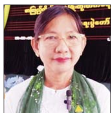
အလွင်လှိုင်ကျော်

နတ်တလင်း ဇူလိုင် ၂၈ စာကြည့်တိုက်များ ဖွံ့ဖြိုးတိုးတက်ရေးနှင့် စာဖတ်ရိုက်မြှင့်တင်ရေးပွဲတော်ကို ပဲခူးတိုင်းဒေသကြီး နတ်တလင်းခရိုင် နတ်တလင်းမြို့ အ.ထ.ကကျောင်းတွင် ဇူလိုင် ၂၈ ရက်က ဟောပြောပွဲများ၊ ကျပန်းစကားပြောပြိုင်ပွဲ၊ ပုံပြင်ပြောပြိုင်ပွဲ၊ စာဖတ်စွမ်းရည်ပြိုင်ပွဲ၊ ကဗျာရွတ်ဆိုပြိုင်ပွဲ၊ ပုံပြောပြိုင်ပွဲ၊ စကားပုံဆက်ပြိုင်ပွဲ၊ အရုပ်ဆက်ပြိုင်ပွဲ၊ ပန်းချီပြိုင်ပွဲ၊ အားကစားပြိုင်ပွဲများ၊ ပြခန်းများ၊ စာအုပ်အရောင်းဆိုင်များနှင့် စတုဒ္ဒိသာကျေးမွေးခြင်းများဖြင့် စည်ကားသိုက်မြိုက်စွာ ကျင်းပပြုလုပ်ခဲ့ရာ စာကြည့်တိုက်များ ဖွံ့ဖြိုးတိုးတက်ရေးနှင့် စာဖတ်ရိုက်မြှင့်တင်ရေးပွဲတော်နှင့် ပတ်သက်၍ ပါဝင်လှုပ်ရှားသူများ၏ ရင်တွင်းစကားသံများ ယခုလိုကြားသိရပါသည်။