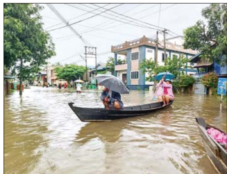
မိုးသည်းထန်စွာရွာသွန်းပြီး အထွတ်အမြတ်ရေမြင့်တက်မှုကြောင့် ကျိုက်မရေမြို့နယ်၌ ရေကြီးရေလျှံမှုများဖြစ်ပေါ်

အဖွဲ့က ကွင်းဆင်းကြည့်ရှုစစ်ဆေးပြီး လိုအပ်သည်များ ဆောင်ရွက် ပေးသည်။ နေ့စဉ်မိုးသည်းထန်စွာရွာသွန်းခြင်းနှင့် ဒါးကမြစ်ရေမြင့်တက်မှု တို့ကြောင့် ကန်ကြီးထောင်မြို့နယ် ဒါးက-ဘဲဂရက်လမ်းပိုင်း မိုင်တိုင် (၁၇၁/၇-၈) တံတားအမှတ်(၉၇)(၄x၂၀) တံတားမှာ တံတားသံပေါင် ကို တစ်ပေခန့် ရေထိုးလျက်ရှိကြောင်း၊ ဒါးက-ဘဲဂရက် လမ်းပိုင်း မိုင်တိုင်(၁၇၁/၉-၁၀) တံတားအမှတ်(၉၇-က)(၁x၄၀) ခန့်ဖွင့်တံတား မှာ တံတားသံပေါင်ကို ငါးလက်မခန့်ရေထိုးလျက်ရှိကြောင်း၊ ဒါးက ကျေးရွာအနီး(ပုသိမ်-ကြာခင်း)ရထားလမ်း မိုင်တိုင်အမှတ်(၁၇၁/၆)နှင့် (၁၇၁/၈)ကြားတွင် လေးလက်မခန့်ရထားလမ်း ရေကျော်မှုဖြစ်ပွားလျက် ရှိပြီး တာဝန်ရှိသူများ ကွင်းဆင်းကြည့်ရှုစစ်ဆေးကြောင်း သိရသည်။ ကျော်စင်စိုး(ပြန်/ဆက်)