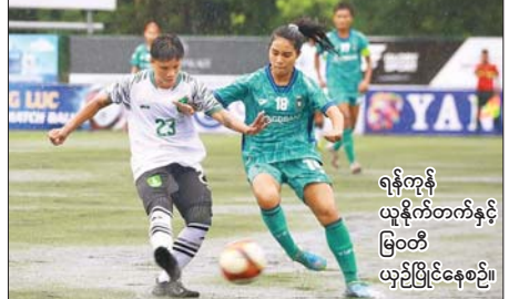
ရန်ကုန် ယူနိုက်တက်နှင့် မြဝတီ ယှဉ်ပြိုင်နေစဉ်။