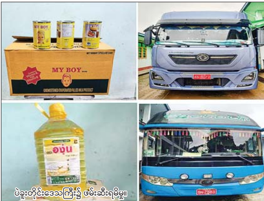
ပဲခူးတိုင်းဒေသကြီး၌ ဖမ်းဆီးရမိမှု။ စစ်ဆေးမှုများဆောင်ရွက်ခဲ့ရာ ကျွတ်တပ်စစ်ဆေးရေးစခန်း၌ မော်တော်ယာဉ်တစ်စီးပေါ်မှ သွင်းကုန်ကြေညာလွှာတွင် ကြေညာထားသည့်နှင့် ကွဲလွဲစွာပါရှိလာသည့် 60% Cotton 40% Polyester Pique ဖိဝင်္ဂျာလီလီရမ် (ခန့်မှန်းတန်ဖိုးငွေကျပ် ၃၈၀၆၄၀၀) နှင့် အဆိုပါပစ္စည်းများ တင်ဆောင်လာသည့် Nissan Diesel Truck တစ်စီး (ခန့်မှန်းတန်ဖိုးငွေကျပ် ၅၅၀၀၀၀၀) စုစုပေါင်း ခန့်မှန်းတန်ဖိုးငွေကျပ် ၁၁၃၀၆၄၀၀၀ ကို ဖမ်းဆီးရမိခဲ့ပြီး အကောက်ခွန်လုပ်ထုံးလုပ်နည်းများနှင့်အညီ အရေးယူဆောင်ရွက်လျက်ရှိပါသည်။ ထို့အတူ ပဲခူးတိုင်းဒေသကြီး တရား

နေပြည်တော် ဇူလိုင် ၂၈ တရားမဝင် ကုန်သွယ်မှုတိုက်ဖျက်ရေးဦးဆောင်ကော်မတီ၏ ကြီးကြပ်ကွပ်ကဲမှုဖြင့် တရားမဝင်ကုန်သွယ်မှုများကို ဥပဒေနှင့်အညီ ထိရောက်စွာ တားဆီးအရေးယူနိုင်ရေး ဆောင်ရွက်လျက်ရှိရာ ဇူလိုင် ၂၅ ရက်တွင် အကောက်ခွန်ဦးစီးဌာန၏ စီမံခန့်ခွဲမှုဖြင့် တာဝန်ကျပေးပေါင်းအဖွဲ့များက စစ်ဆေးမှုများ ဆောင်ရွက်ခဲ့ရာ မြန်မာ့စက်မှုဆိုင်ကမ်း၌ ကုန်သေတ္တာတစ်လုံးအတွင်းမှ သွင်းကုန်ကြေညာလွှာတွင် ကြေညာထားခြင်းမရှိသည့် Shoe Making Machinery and Equipment တစ်လုံး အပါအဝင် ကုန်ပစ္စည်း နှစ်မျိုးစုစုပေါင်းခန့်မှန်းတန်ဖိုးငွေကျပ် ၂၆၄၂၂၃၂ ကို ဖမ်းဆီးရမိခဲ့ပြီး အကောက်ခွန်လုပ်ထုံးလုပ်နည်းများနှင့်အညီ အရေးယူဆောင်ရွက်လျက်ရှိပါသည်။ ထို့အပြင် ဇူလိုင် ၂၆ ရက်တွင် မန္တလေးတိုင်းဒေသကြီး တရားမဝင်ကုန်သွယ်မှုတိုက်ဖျက်ရေး အဖွဲ့၏ စီမံခန့်ခွဲမှုဖြင့် တာဝန်ကျပေးပေါင်းအဖွဲ့က