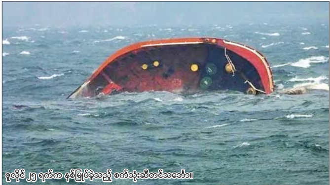
ဇူလိုင် ၂၇ ရက်က နှစ်မြုပ်ခဲ့သည့် စက်သုံးဆီတင်သင်္ဘော။

သုံးစင်း သွားရောက်ခဲ့ပြီး အဆိုပါဧရိယာတွင် ဆီများယိုဖိတ်နေသဖြင့် ယင်းတို့ကို မပျံ့နှံ့စေရေး လုပ်ဆောင်နေကြောင်း ၎င်းက ဆက်လက်ပြော သည်။ ကယ်ဆယ်ရေးလုပ်ငန်းကို မကြာမီစတင်တော့ မည်ဖြစ်ပြီး တစ်ပတ် သို့မဟုတ် နှစ်ပတ်ခန့်ကြာမြင့် မည်ဟု မျှော်လင့်ထားကြောင်း ဖိလစ်ပိုင်ကမ်းခြေ စောင့်တပ်ပို့ဒ်၏ ဒုတပ်မှူး မိုက်ကယ်ဂျွန်အန်နီစ်နာ က ပြောကြားသည်။ ဘာထန်ပြည်နယ် လီမေမြို့အနီး ဇူလိုင် ၂၇ ရက်က နှစ်မြုပ်ခဲ့သည့် ဖိလစ်ပိုင် ရေနံတင်သင်္ဘောမှ ယိုစိမ့်နေသည့် စက်မှုလောင်စာဆီတိုင်ကိုကူးခဲ့၏