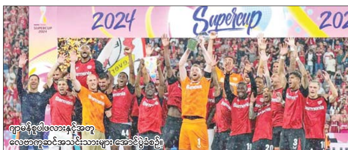
ဂျာမနီစူပါဖလားနှင့်အတူ လေဗာကူဆင်အသင်းသားများ အောင်ပွဲစဉ်။

ပယ်နယ်တီ အဆုံးအဖြတ် တွင် လေဗာကူဆင်အသင်းက လေးဂိုး-သုံးဂိုးဖြင့် နိုင်ပွဲရရှိခဲ့ခြင်း ဖြစ်သည်။ လေဗာကူဆင်အသင်း သည် ဂျာမနီစူပါဖလားကို အသင်း သမိုင်းတစ်လျှောက် ပထမဆုံး အကြိမ် ဆွတ်ခူးရရှိခဲ့ခြင်းလည်း ဖြစ်သည်။ လေဗာကူဆင်အသင်း သည် ဘွန်ဒလီဂါအဖွင့်ပွဲစဉ် အဖြစ် ဩဂုတ် ၂၄ ရက်တွင် မိုးချန် ဂလာဘတ်နှင့် ယှဉ်ပြိုင်ကစား ရမည်ဖြစ်သည်။ ပြိုင်ဘက် စတု ဂတ်အသင်းက မရိုင်းဘတ်အသင်း နှင့် ယှဉ်ပြိုင်ကစားရမည်ဖြစ် သည်။ အောင်ဇော်