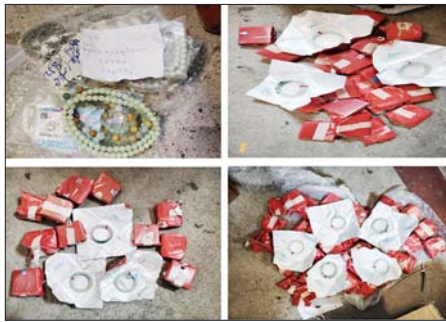
ရန်ကုန်လေဆိပ်(ကုန်လှောင်ရုံ)၌ ဖမ်းဆီးရမိမှု။

ထို့အတူ ဩဂုတ် ၁၆ ရက်တွင် ရှမ်းပြည်နယ်တရားမဝင်ကုန်သွယ်မှု တိုက်ဖျက်ရေးအထူးအဖွဲ့၏ စီမံခန့်ခွဲမှုဖြင့် တာဝန်ကျပူးပေါင်းအဖွဲ့က စစ်ဆေးမှုများ ဆောင်ရွက်ခဲ့ရာ တာချီလိတ်မြို့နယ် မယ်ယန်းပူးပေါင်း စစ်ဆေးရေးဂိတ်၌ တရားဝင်စာရွက်စာတမ်းအထောက်အထား တင်ပြနိုင်ခြင်းမရှိသည့် Foam Slipper ဖိနပ်အရံ ၂၀၀၀ အပါအဝင်