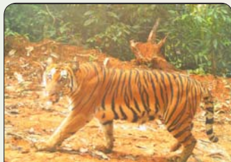
ထမံသီတောရိုင်းတိရစ္ဆာန်ဘေးမဲ့တော