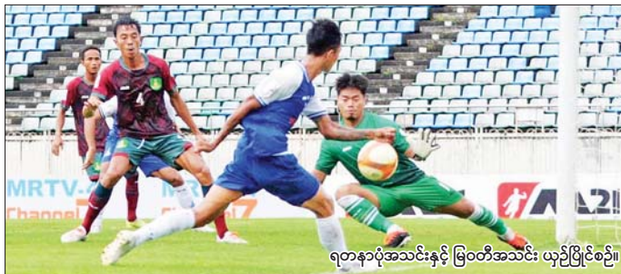
ရတနာပုံအသင်းနှင့် မြဝတီအသင်း ယှဉ်ပြိုင်စဉ်။

ပွဲစဉ် (၇) နောက်ဆုံးနေ့ကို ဩဂုတ် ၁၉ ရက် (ယနေ့) တွင် YUSC ကွင်း၌ ဆက်လက်ကျင်းပ မည်ဖြစ်ပြီး မဟာယူနိုက်တက် အသင်းနှင့် သစ္စာအားမာန်အသင်း ယှဉ်ပြိုင်ကစားမည်ဖြစ်သည်။ ရဲရင့်လွင်၊ ဓာတ်ပုံ - MNL