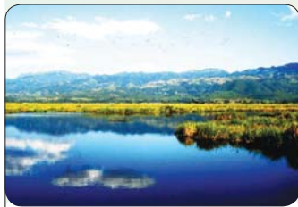
အင်းလေးကန်တောရိုင်းတိရစ္ဆာန်ဘေးမဲ့တော