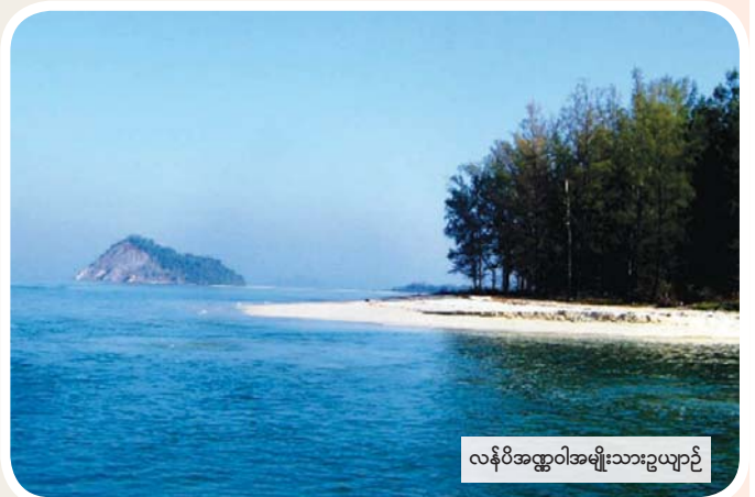
လန်ပီအက္ကဝါအမျိုးသားဥယျာဉ်