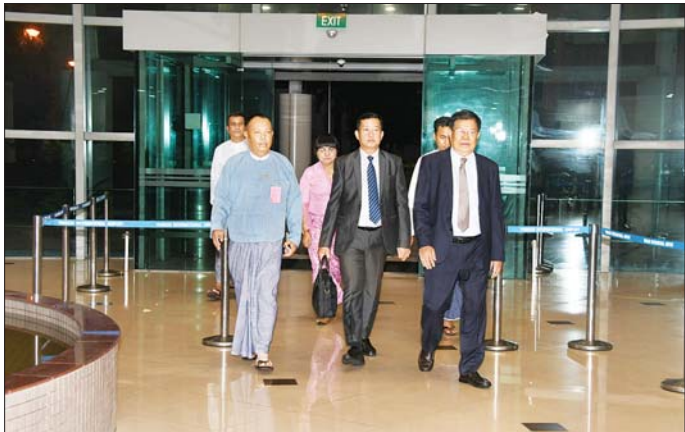
ဒုတိယဝန်ကြီးချုပ်နှင့် နိုင်ငံခြားရေးဝန်ကြီးဌာန ပြည်ထောင်စုဝန်ကြီး ဦးသန်းဆွေ ခေါင်းဆောင်သည့် ကိုယ်စားလှယ်အဖွဲ့အား ရန်ကုန်အပြည်ပြည်ဆိုင်ရာလေဆိပ်၌ တာဝန်ရှိသူများက ကြိုဆိုစဉ်။

၀ ရှေ့ဖူးမှ ထိုသို့စစ်ဆေးရာတွင် တိုင်း ဒေသကြီး ဝန်ကြီးချုပ်နှင့်အဖွဲ့ အား ကုမ္ပဏီမှ တာဝန်ရှိသူများက ပစ္စည်း တစ်ခုချင်းအလိုက် တပ်ဆင်နေမှုများနှင့် လျှပ်စစ်သုံး နှစ်ဘီး၊ သုံးဘီးဆိုင်ကယ်အမျိုး အစားများ ထုတ်လုပ်ဆောင်ရွက် နေမှုများ၊ လျှပ်စစ်စက်ဘီး (E-Bike)နှင့် နှစ်ဘီးဆိုင်ကယ်၊ သုံးဘီးဆိုင်ကယ်များ ထုတ်လုပ် အသုံးပြုခြင်းအားဖြင့် စက်သုံးဆီ သုံးစွဲမှုကို လျှော့ချနိုင်မှု၊ ကျောင်းသား ကျောင်းသူများ