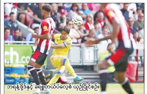
ဘရန့်ဖိုဒ်နှင့် ခရစ္စတယ်ပဲလွေစ ယှဉ်ပြိုင်စဉ်။

ချယ်ဆီးနှင့် မန်စီးတီးပွဲတွင် အသင်းကြီးများပီပီ နှစ်သင်းစလုံး အကြိတ်အနယ်ယှဉ်ပြိုင်ကစားခဲ့ပြီး မန်စီးတီးက နှစ်ဂိုး - ဂိုးမရှိဖြင့် အနိုင်ရခဲ့သည်။ မန်စီးတီးအတွက် ဟာလန်းနှင့် ကိုဗာဆစ်တို့က သွင်းယူ ပေးခဲ့သည်။ ပရီမီယာလိဂ်ပွဲစဉ် (၁) မှ အခြားသော ပွဲစဉ်ရလဒ်များတွင် အာဆင်နယ်က ဝုစ်ကို နှစ်ဂိုး-ဂိုးမရှိ၊ ဘရိုက်တန်က အဲဗာတန်ကို သုံးဂိုး-ဂိုးမရှိ၊ နယူးကာသယ်က ဆောက်သစ်တန်ကို တစ်ဂိုး-ဂိုးမရှိ၊ အက်စ်တွန်ဗီလာက ဝက်စ်ဟမ်းကို နှစ်ဂိုး - တစ်ဂိုးဖြင့် အနိုင်ရရှိခဲ့ပြီး နေ့တိုင်ပစ်ဖော့ရက်စ်နှင့် ဘုန်းမောက်အသင်းပွဲစဉ်တွင် တစ်ဖက် တစ်ဂိုးစီ သရေကျခဲ့သည်။ အောင်ဇော်