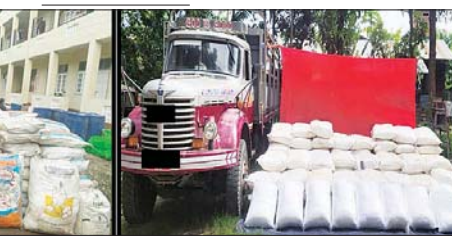
ကလေးမြို့တွင် သိမ်းဆည်းရမိသည့် ထိန်းချုပ်စာတုပစ္စည်း ကဖင်းများနှင့် ဖြစ်မှုကျူးလွန်သူများ။

ကျောပိုးမှ ပွဲစဉ်များကို ယနေ့နံနက် ၈ နာရီမှစတင်၍ ဝဏ္ဏသိဒ္ဓိအားကစားကွင်းရှိ ဖူဆယ်အားကစားရုံ၌ ကျင်းပသည်။ ယနေ့ အကြံဉာဏ်လှပ ပွဲစဉ်များကို ယှဉ်ပြိုင်ကစားခဲ့ရာ (အမျိုးသမီး) အကြံဉာဏ်လှပ ပွဲစဉ်တွင် ရန်ကုန်တိုင်းဒေသကြီးအသင်းက စစ်ကိုင်းတိုင်းဒေသကြီးအသင်းကို ၁၂ ဂိုး - ၇ ဂိုးဖြင့်လည်းကောင်း၊ ကချင်ပြည်နယ်အသင်းက ရှမ်းပြည်နယ်အသင်းကို ၁၀ ဂိုး - ၃ ဂိုးဖြင့်