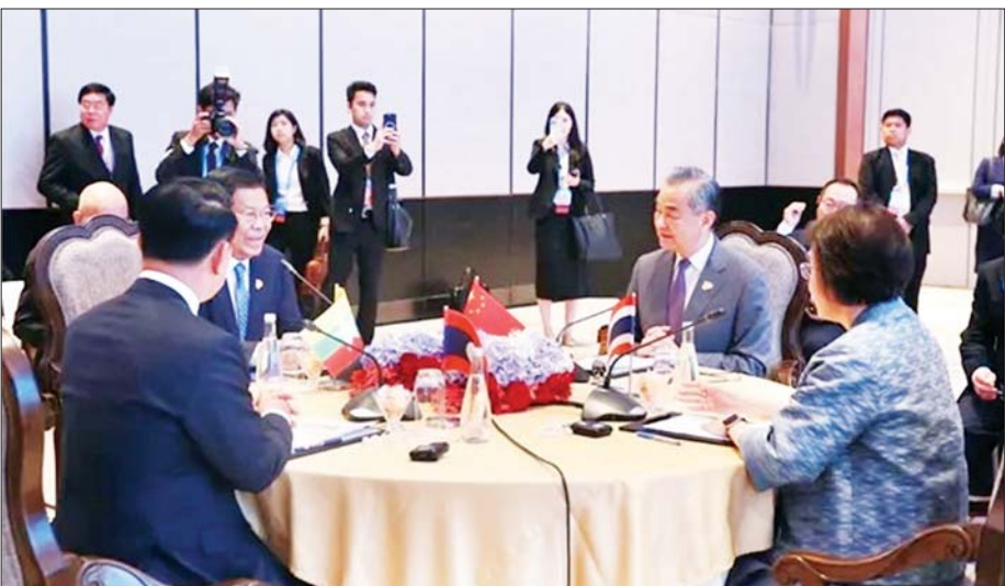
တရုတ် - လာအို - မြန်မာ - ထိုင်း လေးနိုင်ငံ အလွတ်သဘောအစည်းအဝေး ကျင်းပစဉ်။

အဝေးသို့ တရုတ်ကုန်ဖြန့်ချိမှုဗဟို ဗဟိုကော်မတီ၊ နိုင်ငံရေးရာဇဝါဒီ အဖွဲ့ဝင်နှင့် နိုင်ငံခြားရေးဝန်ကြီး မစ္စတာဝမ်ယီ၊ လာအိုဒုတိယ ဝန်ကြီးချုပ်နှင့် နိုင်ငံခြားရေး ဝန်ကြီး မစ္စတာ ဆလုံဆိုင်း ခွန်မဆစ်နှင့် ထိုင်းနိုင်ငံခြားရေး ဝန်ကြီးဌာန အမြဲတမ်းအတွင်းဝန် မစ္စစ် အက်စီရီပင်တာရုချီတို့