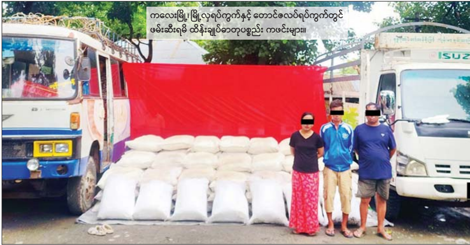
ကလေးမြို့၊ မြို့လုပ်ကွက်နှင့် တောင်ဇလပ်ရပ်ကွက်တွင် ဖမ်းဆီးရမိ ထိန်းချုပ်ဓာတုပစ္စည်း ကဖင်းများ။

စစ်ကိုင်းမြို့နယ်နှင့် ကလေးမြို့နယ်တို့တွင် ငွေကျပ် ၄ ဒသမ ၂ ဘီလီယံကျော်တန်ဖိုးရှိ တရားမဝင်သယ်ဆောင်လာသည့် ထိန်းချုပ်ဓာတုပစ္စည်းကဖင်း ၁၃ ဒသမ ၉၇၅ တန်၊ အမိုနီယမ်ကလိုရိုဒ် ၂ ဒသမ ၃ တန်ကျော်နှင့် ဓာတုပစ္စည်း PROPIOPHENONE လီတာ ၁၀၂၀ ဖမ်းဆီးရမိ