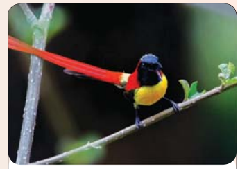
နတ်မတောင် အမျိုးသားဥယျာဉ်