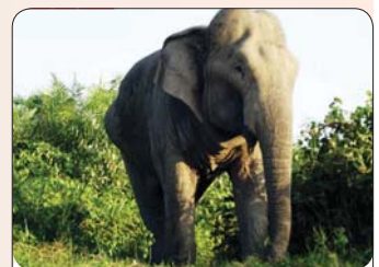
မိန်းမလူကျွန်း တောရိုင်းတိရစ္ဆာန်ဘေးမဲ့တော