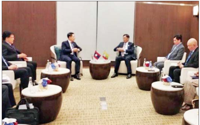
ဒုတိယဝန်ကြီးချုပ်နှင့် နိုင်ငံခြားရေးဝန်ကြီးဌာန ပြည်ထောင်စုဝန်ကြီး ဦးသန်းဆွေနှင့် လာအိုနိုင်ငံ ဒုတိယဝန်ကြီးချုပ်နှင့် နိုင်ငံခြားရေးဝန်ကြီး မစ္စတာ ဆလုံဆိုင်း ခွန်မဆစ်တို့ တွေ့ဆုံဆွေးနွေးစဉ်။

မည့် အခြေအနေများကိုလည်း ကောင်း၊ မြန်မာနိုင်ငံ၏ရှေ့လုပ်ငန်း စဉ်(၅)ရပ်နှင့် အာဆီယံ၏ တူညီ ဆန္ဒ (၅)ချက်တို့ အပြန်အလှန် လိုက်လျောညီစွာ အကောင် အထည်ဖော် ဆောင်ရွက်သွားနိုင် မည့် အလားအလာများကိုလည်း ကောင်း ဆွေးနွေးခဲ့ကြသည်။ သတင်းစဉ်