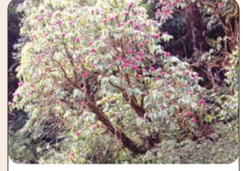
ခါကာတိုရာဇီ အမျိုးသားဥယျာဉ်