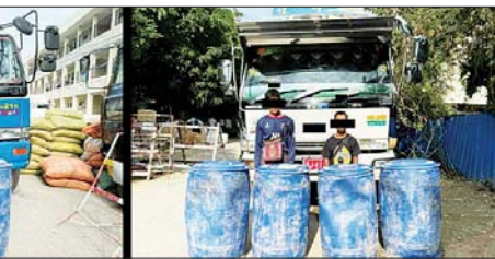
စစ်ကိုင်းမြို့ ရတနာပုံတံတားတွင် သိမ်းဆည်းရမိသည့် စာတုပစ္စည်းများနှင့် ဖြစ်မှုကျူးလွန်သူများ။

စာတုပစ္စည်းများနှင့် အခြားစာတုပစ္စည်းများကို မြန်မာ-အိန္ဒိယ နယ်စပ်မှ ကလေးမြို့သို့ သယ်ဆောင်ပြီး မန္တလေးတိုင်းဒေသကြီး မှတစ်ဆင့် မူးယစ်ဆေးဝါး ထုတ်လုပ်ရာတွင် အသုံးပြုရန် ရှမ်းပြည်နယ်သို့ တရားမဝင်