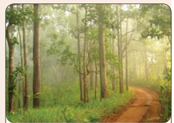
အလောင်းတော်ကသုပ အမျိုးသားဥယျာဉ်

(၁) သယံဇာတနှင့် ပတ်ဝန်းကျင်ထိန်းသိမ်းရေး ဦးစီးဌာန၊ သစ်တောကြေးမုံဂျာနယ်များ။