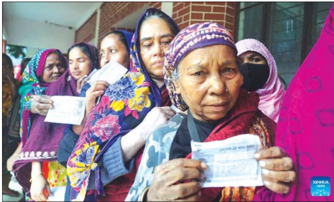
ယခုနှစ် ဇန်နဝါရီ ၇ ရက်က ကျင်းပခဲ့သည့် ဘင်္ဂလားဒေ့ရှ် ပါလီမန်ရွေးကောက်ပွဲတွင် ဒါကာမြို့ရှိ ဆန္ဒမဲပေးခဲ့ကြသူများကို မြင်တွေ့ရစဉ်။

ဤသို့ဖြင့် ဘင်္ဂလားဒေ့ရှ်၏ နှစ်ပါတီနိုင်ငံရေးဘဝတစ်ပြန်၊ ကျားတစ်ပြန် အုပ်စိုးမှု (Dupopoly) မှာ အာဏာရပါတီက လွှတ်တော်၌ တစ်ဖက်သတ်အုပ်စိုးထားချိန်တွင် အတိုက်အခံပါတီက လွှတ်တော်ကို သပိတ်မှောက်၊ ရွေးကောက်ပွဲကို သပိတ်မှောက်၊ တစ်နိုင်ငံလုံး အိမ်ထဲမှ အပြင်မထွက်ရဟု အတင်းအကျပ် အကြမ်းဖက်ပိတ်ဆို့သည့် ဟာတာလ် (Hate)ခေါ် အထွေထွေသပိတ်ပြုလုပ်