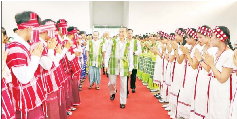
နိုင်ငံတော်စီမံအုပ်ချုပ်ရေးကောင်စီအဖွဲ့ဝင် မန်းငြိမ်းမောင် ကရင်တိုင်းရင်းသား/တိုင်းရင်းသားများအား ရင်းရင်းနှီးနှီးနှုတ်ဆက်စဉ်။

နှင့် လက်ချည်ဖွဲ့မည့် ပစ္စည်းများကို သတ်မှတ်နေရာများသို့ သယ်ဆောင်ခြင်း၊ ဘိုးဘွားများနေရာယူခြင်းတို့ ဆောင်ရွက်ကြသည်။