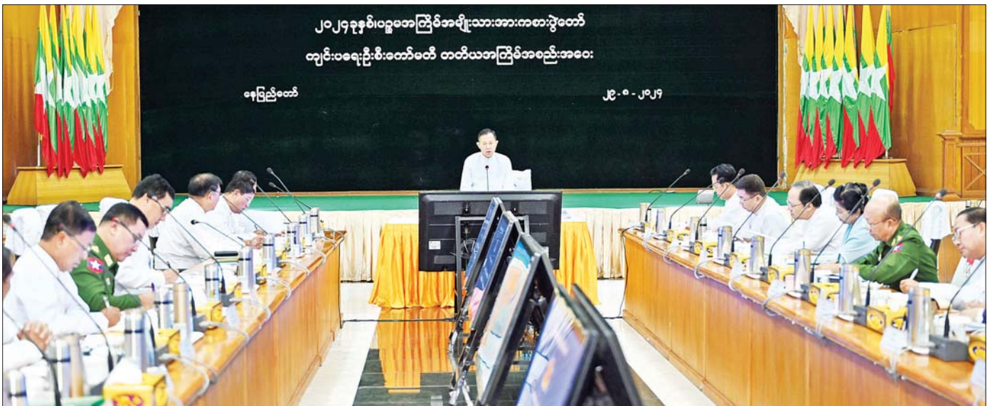
နိုင်ငံတော်စီမံအုပ်ချုပ်ရေးကောင်စီ ဒုတိယဥက္ကဋ္ဌ ဒုတိယဝန်ကြီးချုပ် ဒုတိယဗိုလ်ချုပ်မှူးကြီး စိုးဝင်း ၂၀၂၄ ခုနှစ် ဝဋ္ဋမ္မာကြိမ် အမျိုးသားအားကစားပွဲတော် ကျင်းပရေးဦးစီးကော်မတီ တတိယအကြိမ် အစည်းအဝေးတွင် အမှာစကားပြောကြားစဉ်။

နိုင်ငံတော်စီမံအုပ်ချုပ်ရေးကောင်စီ ဒုတိယဥက္ကဋ္ဌ ဒုတိယဝန်ကြီးချုပ် ဒုတိယဗိုလ်ချုပ်မှူးကြီး စိုးဝင်း ၂၀၂၄ ခုနှစ် ဝဋ္ဋမ္မာကြိမ် အမျိုးသားအားကစားပွဲတော် ကျင်းပရေးဦးစီးကော်မတီ တတိယအကြိမ်အစည်းအဝေးသို့ တက်ရောက်အမှာစကားပြောကြား ထူးချွန်အောင်မြင်စွာ ထွက်ပေါ်လာမည့် အားကစားသမားများကို ထိုက်တန်စွာ ဂုဏ်ပြုချီးမြှင့်သွားကြရမည်