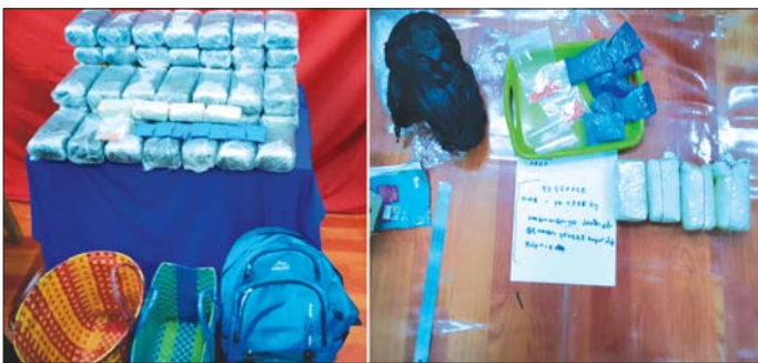
အမှတ်(၁၂)အစုန် လူစီးအမြန်ရထားပေါ်မှ ဖမ်းဆီးရမိ စိတ်ကြွေးယစ်ဆေးဝါးများကို တွေ့ရစဉ်။

နေပြည်တော် ဩဂုတ် ၂၉ မန္တလေးမှ ရန်ကုန်သို့ ထွက်ခွာလာ သည့် အမှတ်(၁၂)အစုန် လူစီး အမြန် ရထားပေါ်မှ WY စာတန်းပါ စိတ်ကြွေး ဖူးယစ်ဆေးပြားများ သိမ်းဆည်းရမိခဲ့ကြောင်း မြန်မာ့ မီးရထားမှ သတင်းရရှိသည်။ ဖြစ်စဉ်မှာ ဩဂုတ် ၂၇ ရက် မွန်းလွဲ ၁၂ နာရီ မိနစ် ၅၀ တွင် မန္တလေးမှ ရန်ကုန်သို့ ထွက်ခွာလာ သည့် အမှတ်(၁၂) အစုန် လူစီး အမြန်ရထားသည် ပျဉ်းမနားနှင့် ပြည်ဝင်ဘူတာကြား ရောက်ရှိ စဉ်ရထား၏ အထက်တန်းတွဲ(၁)၊ ခုံအမှတ် A-3, A-4 ၏ အပေါ်ဘက် ပစ္စည်းတင်စင်နှင့် ထိုင်ခုံ၏ ရှေ့တံ တွင် ကျောပိုးအိတ် နှစ်လုံးနှင့် မြွေရေခွံအိတ်များ ထည့်ထားသည့် ခြင်း နှစ်လုံးတို့ကို ပိုင်ရှင်ခွဲတွေ့ရှိ ရသဖြင့် မသင်္ကာ၍ ရထားလုံခြုံ ရေးရဲတပ်ဖွဲ့နှင့် မြန်မာ့မီးရထား တာဝန်ရှိသူများက စစ်ဆေးခဲ့ရာ WY စာတန်းပါ စိတ်ကြွေးဖူးယစ် ဆေးပြားများ ထည့်ထားသည့်