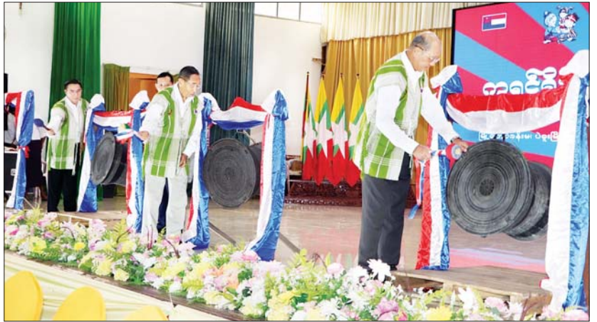
နိုင်ငံတော်စီမံအုပ်ချုပ်ရေးကောင်စီအဖွဲ့ဝင် မန်းငြိမ်းမောင်၊ တိုင်းရင်းသားလူမျိုးများရေးရာဝန်ကြီးဌာန ပြည်ထောင်စုဝန်ကြီး Jeng phang နော်တောင်နှင့် ပဲခူးတိုင်းဒေသကြီးဝန်ကြီးချုပ် ဦးမျိုးဆွေဝင်းတို့က ကရင်ဟီးစည်အား(၉)ချက်တီး၍ အခမ်းအနားကို ဖွင့်လှစ်ပေးစဉ်။

နှုတ်ခွန်းဆက်စကားပြောကြား ထိုးနောက် နိုင်ငံတော်စီမံအုပ်ချုပ်ရေး ကောင်စီအဖွဲ့ဝင် မန်းငြိမ်းမောင်က အဖွင့်အမှာစကား ပြောကြားပြီး တိုင်းရင်းသား လူမျိုးများရေးရာဝန်ကြီးဌာန ပြည်ထောင်စုဝန်ကြီး Jeng phang နော်တောင်နှင့် မောင်မယ်များက ကရင်အမျိုးသားအလံ