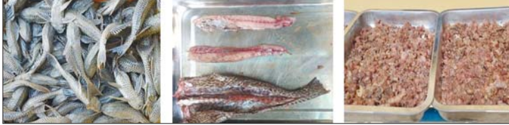
စုပုံခွက်ငါးများ။ အသားခြောက်ထုတ်ခြင်း။ နေရောင်ဖြင့် အခြောက်လှန်းခြင်း။

သော အစားထိုးပမာဏအသီးသီးဖြင့် ထည့်သွင်း ဖော်စပ်အစာများကို အစာညစ်စက်အတွင်းထည့်ကာ ရေမြုပ်အစာတောင့်များရရှိစေရန် နေရောင်ဖြင့် နှစ်ရက်ကြာ အခြောက်ခံပြီးနောက် ငါးခွေမျိုးစိတ် များကိုကျွေးမွေး၍ သုတေသနပြုစမ်းသပ်ခဲ့ပါ သည်။ အစာဖော်စပ်ပုံနည်းလမ်း၊ ထည့်သွင်းအသုံး ပြုသည့်ပမာဏနှင့် အသုံးပြုသည့် အစာအမျိုးအစား များကို (ဇယား ၁)တွင်လည်းကောင်း၊ ငါးခွေမျိုး၏ ကြီးထွားရှင်သန်နှုန်းနှင့် အစာမှ အသားပြောင်းလဲ နှုန်းတို့ကို (ဇယား ၂)တွင်လည်းကောင်း ဖော်ပြထား ပါသည်။