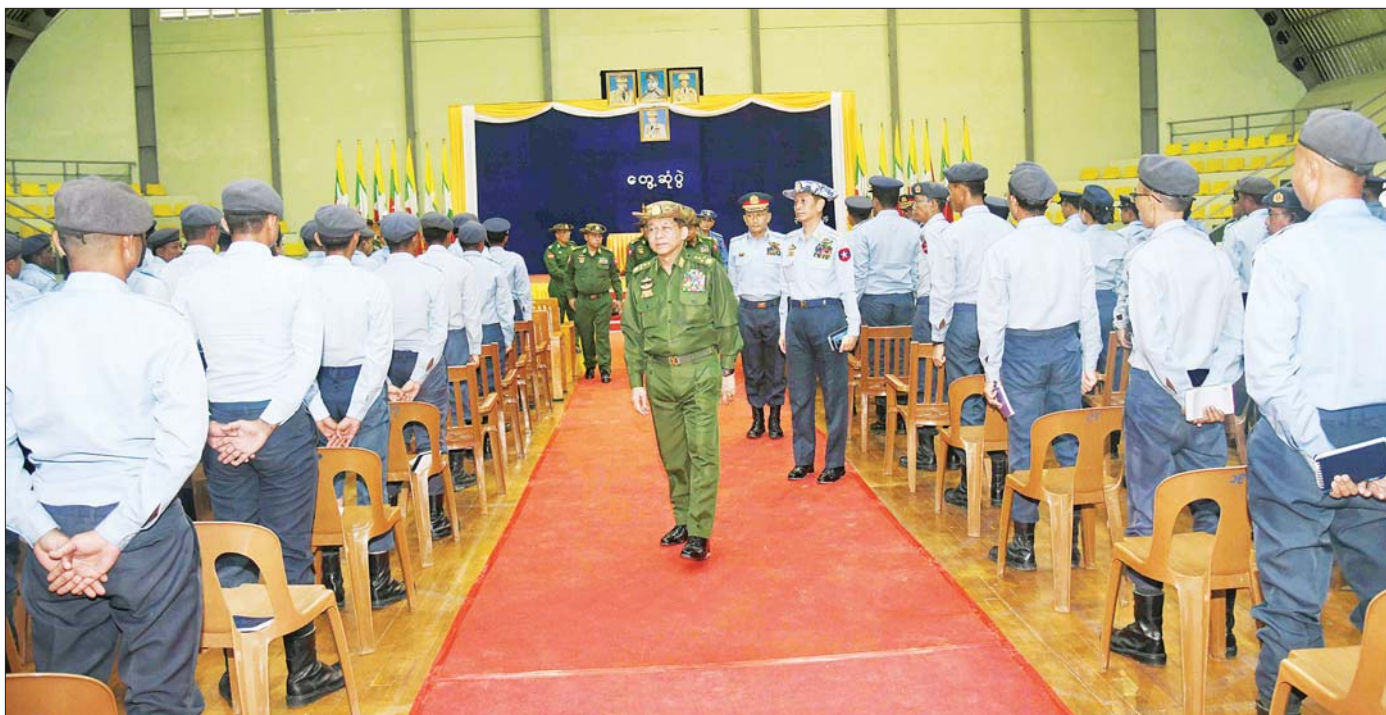
နိုင်ငံတော်စီမံအုပ်ချုပ်ရေးကောင်စီဥက္ကဋ္ဌ တပ်မတော်ကာကွယ်ရေးဦးစီးချုပ် ဗိုလ်ချုပ်မှူးကြီး မင်းအောင်လှိုင် တွေ့ဆုံပွဲသို့ တက်ရောက်လာကြသည့် မှော်ဘီလေတပ်စခန်းဌာနချုပ်မှ အရာရှိ၊ စစ်သည်များအား ရင်းရင်းနှီးနှီးနှုတ်ဆက်စဉ်။