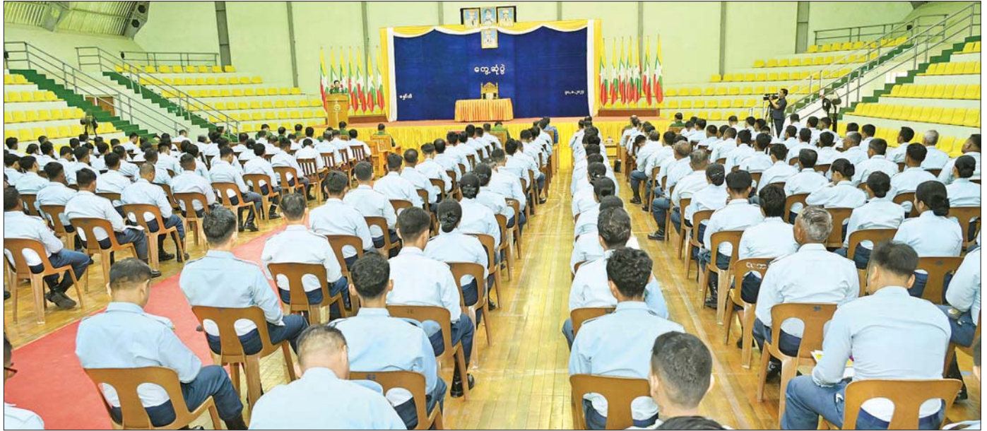
နိုင်ငံတော်စီမံအုပ်ချုပ်ရေးကောင်စီဥက္ကဋ္ဌ တပ်မတော်ကာကွယ်ရေးဦးစီးချုပ် ဗိုလ်ချုပ်မှူးကြီး မင်းအောင်လှိုင် မှော်ဘီလေတပ်စခန်းဌာနချုပ်မှ အရာရှိ၊ စစ်သည်များအား တွေ့ဆုံအမှာစကားပြောကြားစဉ်။

၀ ရှေ့ဖို့မှ အဆိုပါ တွေ့ဆုံပွဲသို့ နိုင်ငံတော်စီမံအုပ်ချုပ်ရေးကောင်စီဥက္ကဋ္ဌ တပ်မတော်ကာကွယ်ရေးဦးစီးချုပ်နှင့်အတူ နိုင်ငံတော်စီမံအုပ်ချုပ်ရေးကောင်စီဝင်၊ ညှိနှိုင်းကွပ်ကဲရေးမှူး (ကြည်း၊ ရေလေ) ဗိုလ်ချုပ်ကြီး မောင်မောင်အေး၊ ကာကွယ်ရေးဦးစီးချုပ် (ရေ) ဒုတိယဗိုလ်ချုပ်ကြီး ထိန်ဝင်း၊ ကာကွယ်ရေးဦးစီးချုပ် (လေ) ဗိုလ်ချုပ်ကြီး ထွန်းအောင်နှင့် ကာကွယ်ရေးဦးစီးချုပ်ရုံးမှ အဆင့်မြင့်တပ်မတော်အရာရှိကြီးများ၊ ရန်ကုန်တိုင်း စစ်ဌာနချုပ်တိုင်းမှူး၊ ဗိုလ်ချုပ်ဇော်ဟိန်း၊ မှော်ဘီလေတပ်စခန်းဌာနချုပ်မှ အရာရှိ၊ စစ်သည်များ၊ တပ်မတော် (ကြည်း) ဗိုလ်သင်တန်းကျောင်း(မှော်ဘီ) ကျောင်းအုပ်ကြီး၊ နည်းပြအရာရှိများ၊ အမျိုးသမီးဗိုလ်လောင်း သင်တန်းသူများနှင့် အမျိုးသမီးအရာရှိ မြေလျင်တပ်စုမှူးသင်တန်းမှ သင်တန်းသူများ တက်ရောက်ကြသည်။