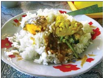
လူတို့၏ စေ့စပ်အာဟာရဓာတ်ထွက် ငါးပေါင်မွန်

စုပ်ခွက်ငါးမျိုးစိတ်၏ ဆိုးကျိုးများ စုပ်ခွက်ငါးမျိုးစိတ်သည် မျိုးစု (Genus) စာမျက်နှာ ၁၇ သို့