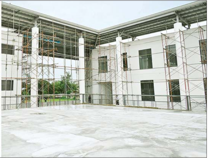
နိုင်ငံတော်စီမံအုပ်ချုပ်ရေးကောင်စီဥက္ကဋ္ဌ နိုင်ငံတော်ဝန်ကြီးချုပ် ဦးလှိုင်အောင်၊ ရန်ကုန်အနောက်ပိုင်းနည်းပညာတက္ကသိုလ်အတွင်း စာသင်ဆောင်အသစ် ဆောက်လုပ်နေမှုကို ကြည့်ရှုစစ်ဆေးစဉ်။

စာမျက်နှာ ၆ မှ သာယာလှပရေးနှင့် လိုအပ်သည်များ မှာကြားခဲ့သည်။ ရန်ကုန်အနောက်ပိုင်း နည်းပညာ တက္ကသိုလ် ကြည့်ရှုစစ်ဆေး ယင်းနောက် နိုင်ငံတော်စီမံ