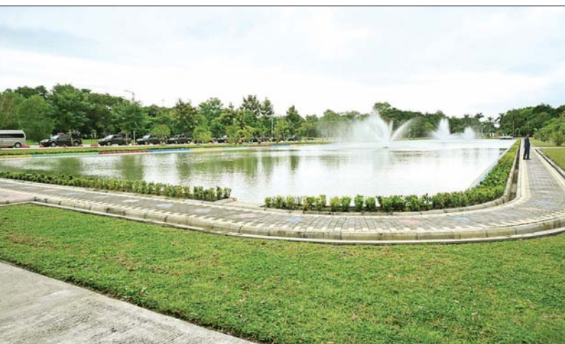
နိုင်ငံတော်စီမံအုပ်ချုပ်ရေးကောင်စီဥက္ကဋ္ဌ နိုင်ငံတော်ဝန်ကြီးချုပ် ဗိုလ်ချုပ်မှူးကြီး မင်းအောင်လှိုင် ရန်ကုန်အနောက်ပိုင်းတက္ကသိုလ် ပင်မလေးထပ်ဆောင်အရှေ့ရှိ ရေကန်တူးဖော်ပြီးစီးမှုနှင့် ရေကန်ပတ်လည်စိမ်းလန်းစိုပြည်ရေး ဆောင်ရွက်ထားရှိမှု ကြည့်ရှုစစ်ဆေးစဉ်။