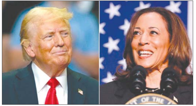
လက်လျှော့ခဲ့ပြီး ထရမ်ကို ထောက်ခံခဲ့သူလည်း ဖြစ် သည့် ဒေါ်နယ်ထရမ်သာ နိုဝင်ဘာလရွေးကောက်ပွဲ တွင် အနိုင်ရရှိခဲ့ပါက ထရမ်၏ သမ္မတ အကူး ဖြစ်သည်။

ရန် အရေးကြီးသည်ဟု ဟားရစ်က မြေကြားခဲ့သည်။ ရီပတ်ဘလီကန် တစ်ဦးကို ၎င်း၏အစိုးရအဖွဲ့ တွင် ခန့်အပ်ခြင်းသည် အမေရိကန်လူထု၏အကျိုး အတွက်ဖြစ်ကြောင်း ဟားရစ်က ပြောသည်။ ဒေါ်နယ်ထရမ်သည် ၎င်း၏ရီပတ်ဘလီကန် ပါတီပြင်ပမှဝန်ထမ်းများကို ထရမ်ကခေါ်ယူနေ ကြောင်း အမေရိကန်မီဒီယာများတွင် ဖော်ပြသည်။ ၎င်း၏မဲဆွယ်စည်းရုံးမှုတွင် ရောဘတ်အက်ဖ် ကနေဒီဂျူနီယာနှင့် ဒီမိုကရက်တစ်ဟောင်းတစ်ဦး ဖြစ်သူ တွာဆီဂက်ဘာ့ကိုပါ အဖွဲ့ထဲသို့ ပေါင်းထည့် ထားကြောင်း ၎င်း၏မဲဆွယ်စည်းရုံးမှုအဖွဲ့က ပြောသည်။ ကနေဒီသည် မကြာသေးမီက တစ်သီးပုဂ္ဂလ အဖြစ် သမ္မတလောင်းဝင်ရောက် ယှဉ်ပြိုင်မှု