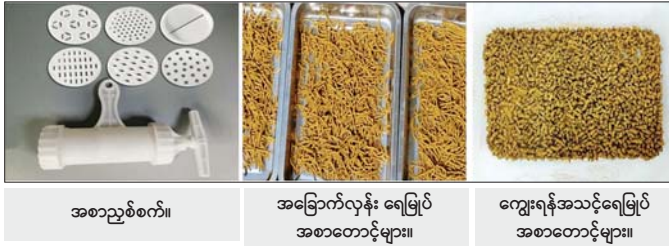
အစာညစ်စက်။ အခြောက်လှန်း ရေမြုပ် အစာတောင့်များ။ ကျွေးရန်အသင့်ရေမြုပ် အစာတောင့်များ။

အပူချိန် ၄၁ စင်တီဂရိတ်ရှိသော သဘာဝနေရောင် အောက်တွင် နှစ်ရက်ကြာအခြောက်လှန်းရပါမည်။ ထို့နောက် စုပုံခွက်ငါးအသားမှုန့်များ သီးသန့်ရရှိ စေရန်နှင့် ငါးစာတွင် ထည့်သွင်းရောစပ်ပါက အစာ ခြေဖျက်နှုန်း ကောင်းမွန်စေရန်အတွက် ကြိုတင်ခြေ စက်ဖြင့် ကြိုတင်ခြေပြီးနောက် ဆန်ခါတိုက်ရပါမည်။ အစား ၀.၄ စီလီမီတာဖြင့် ဆန်ခါတိုက်ရပါမည်။ ရရှိလာသော စုပုံခွက်ငါးအသားမှုန့်များကို လေလုံ အိတ်ထဲထည့်၍ အစာအရည်အသွေး မပြောင်း လဲစေရန် အပူချိန် ၇ စင်တီဂရိတ်ရှိ ရေခဲသေတ္တာ အတွင်း၌ သိမ်းဆည်းရပါမည်။ ထုတ်လုပ်ရရှိနိုင်မှု အနေဖြင့် စုပုံခွက်ငါး အသားအစုံ ၁ ကီလိုဂရမ် (၆၁.၃ ကျပ်သား)တွင် အသားမှုန့် ၂၀၀ ဂရမ်(၁၂.၃