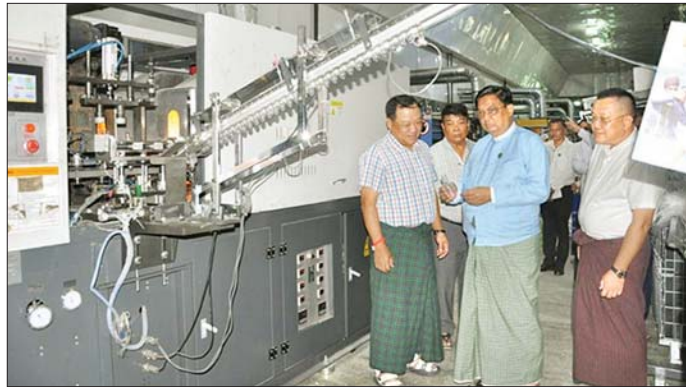
ပွင့်ပွင့်လင်းလင်း တင်ပြပေးစေလိုကြောင်း၊ စွန့်ပစ်ပလတ်စတစ်ပစ္စည်းများကို ပြန်လည်အသုံးပြုပြီး လုပ်ငန်းကုန်ပစ္စည်းများ ထုတ်လုပ်နိုင်ရေးဆောင်ရွက်ရမည်ဖြစ်ကြောင်း၊ လုပ်ငန်းများကို ဆန်းသစ်တီထွင်၍ ဆောင်ရွက်ရမည်ဖြစ်ကြောင်း၊ စက်ရုံငှားရမ်း ကုမ္ပဏီအနေဖြင့် ဝန်ထမ်းများ၏ လူမှုတာဝန်သို့ လုပ်ငန်းများ (CSR) ကို ဆောင်ရွက်ပေးရမည်ဖြစ်ကြောင်း၊ တာဝန်များနှင့် လုပ်ငန်းရှင်များ၏ တင်ပြချက်များကို ပေါင်းစပ်ညှိနှိုင်း ဆောင်ရွက်ပေးခဲ့ကြောင်း သိရသည်။ သတင်းစဉ်

အဆင့်ဆင့်တို့ကို လှည့်လည်ကြည့်ရှုစစ်ဆေးသည်။ ထို့နောက် စက်ရုံအစည်းအဝေးခန်းမ၌ အမှတ် (၂) အကြီးစားစက်မှုလုပ်ငန်း ဦးဆောင်ညွှန်ကြားရေးမှူး၊ စက်ရုံတာဝန်ခံနှင့် စက်ရုံငှားရမ်းကုမ္ပဏီမှ လုပ်ငန်းရှင်များကိုတွေ့ဆုံ၍ လုပ်ငန်းများ တိုးတက်အောင် ဆောင်ရွက်နိုင်ရန်နှင့် လုပ်ငန်းများဆောင်ရွက်နေစဉ် ကြုံတွေ့ရသည့် အခက်အခဲများရှိပါက ကူညီဖြေရှင်း ဆောင်ရွက်ပေးနိုင်ရေးအတွက် လာရောက်ခြင်းဖြစ်ကြောင်း၊ စက်ရုံ၌ တပ်ဆင်ထားရှိသည့် စက်ပစ္စည်းများ၏ စက်စွမ်းအားပြည့် လည်ပတ်ထုတ်လုပ်နိုင်ရေး ကြိုးစားဆောင်ရွက်ရမည်ဖြစ်ကြောင်း၊ ထုတ်လုပ်မှုလွယ်ကူမှုအား မျှော်မှန်းပြီး ပြည်သူများ လွယ်ကူစွာ ဝယ်ယူသုံးစွဲနိုင်မည်ဖြစ်ကြောင်း၊ ထို့ကြောင့် ထုတ်လုပ်မှုလုပ်ငန်းများကို တိုးမြှင့်ဆောင်ရွက်နိုင်ရေး စီမံဆောင်ရွက်ရမည်ဖြစ်ကြောင်း၊ ထုတ်လုပ်မှုလုပ်ငန်းများ ဆောင်ရွက်ခြင်းဖြင့် ပြည်ပမှ တင်သွင်းရမှု လျော့ချနိုင်မည်ဖြစ်ကြောင်း၊ ထုတ်လုပ်ရေးလုပ်ငန်းများ တိုးမြှင့်ဆောင်ရွက်နိုင်ရေးအတွက် လိုအပ်ချက်များရှိပါက