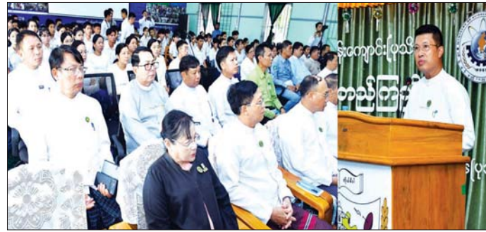
လူငယ်စကားပိုင်းကို ဆက်လက် ကျင်းပရာ စကားပိုင်းသို့ တက် ရောက်လာသူများက သိရှိလိုသည့် များကို မေးမြန်းဆွေးနွေးကြပြီး အစိုးရနည်းပညာ အထက်တန်း ကျောင်း(ပုသိမ်) ကျောင်းအုပ်ကြီး တိုင်းဒေသကြီး (ပြန်/ဆက်)

ကို တိုင်းဒေသကြီး/ပြည်နယ်များ ရှိ အစိုးရနည်းပညာ တက္ကသိုလ် များ၊ အစိုးရနည်းပညာ ကောလိပ် များနှင့် အစိုးရစက်မှုလက်မှု သိပ္ပံကျောင်းများတွင် လက်ခံ ကျင်းပခြင်းအားဖြင့် ပညာ သင်ကြားနေကြသည့်ကျောင်းသား ကျောင်းသူများသည် ကျောင်းနှင့် လူမှုပတ်ဝန်းကျင် နေ့စဉ်ဘဝ များတွင် အကောင်းအဆိုး၊ အကြောင်းအကျိုးကို မှန်ကန်စွာ ပိုင်းခြားပေးနိုင်ခြင်းဖြင့် ဖြောင့်မတ် တည်ကြည်မှုကို ကိုယ်ပိုင်အသိ တရားဖြင့် လက်တွေ့ကျင့်သုံး လာနိုင်စေမည်ဖြစ်ပြီး အခြေခံ စည်းကမ်းမူဘောင်များ၊ ကျင့်ဝတ် များ၊ ကိုယ်ကျင့်တရား ပျက်ယွင်း ခြင်း၏ အကြောင်းရင်းများနှင့် အဂတိလိုက်စားမှု အန္တရာယ်များ ကို သိရှိနားလည်နိုင်မည် ဖြစ် ကြောင်း၊ ထို့ကြောင့် အသိပညာ ပေးလုပ်ငန်းများကို ကဏ္ဍစုံ၊ ထောင့်စုံမှ ကျယ်ပြန့်စွာဆောင်ရွက် ပေးနေခြင်းဖြစ်ကြောင်း အမှာ စကားပြောကြားသည်။ (ယာဝု) ထို့နောက် အဂတိလိုက်စားမှု တိုက်ဖျက်ရေး ကော်မရှင်အဖွဲ့ဝင် က အမှာစကား ပြောကြား သည်။ ယင်းနောက် လူငယ် နှင့် ဖြောင့်မတ်တည်ကြည်မှု