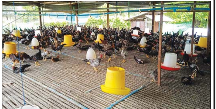
ဧဒင်တိုင်းရင်းကြက်မွေးမြူရေးဌာန အဖွဲ့ရစဉ်။

“နိုင်ငံတော်က မွေးမြူရေးကို အားပေးတယ်။ လုပ်ငန်းရှင်တွေအနေနဲ့လည်း လုပ်ချင်ကြပါတယ်။ ကိုယ့်ရပ်ကိုယ့်ဒေသမှာ မွေးမြူပြီး ထုတ်လုပ်ရောင်းချတော့ မွေးတဲ့သူရာ စားသုံးတဲ့သူပါ အဆင်ပြေတာပေါ့။ ဒါပေမယ့် လက်ရှိမှာက မွေးမြူရေးလုပ်ငန်းရှင် တော်တော်များများက တိရစ္ဆာန်အစာ၊ လုပ်ငန်းအတွက် လိုအပ်တဲ့ လျှပ်စစ်မီး အခက်အခဲရှိကြတာများတယ်။ နိုင်ငံတော်က