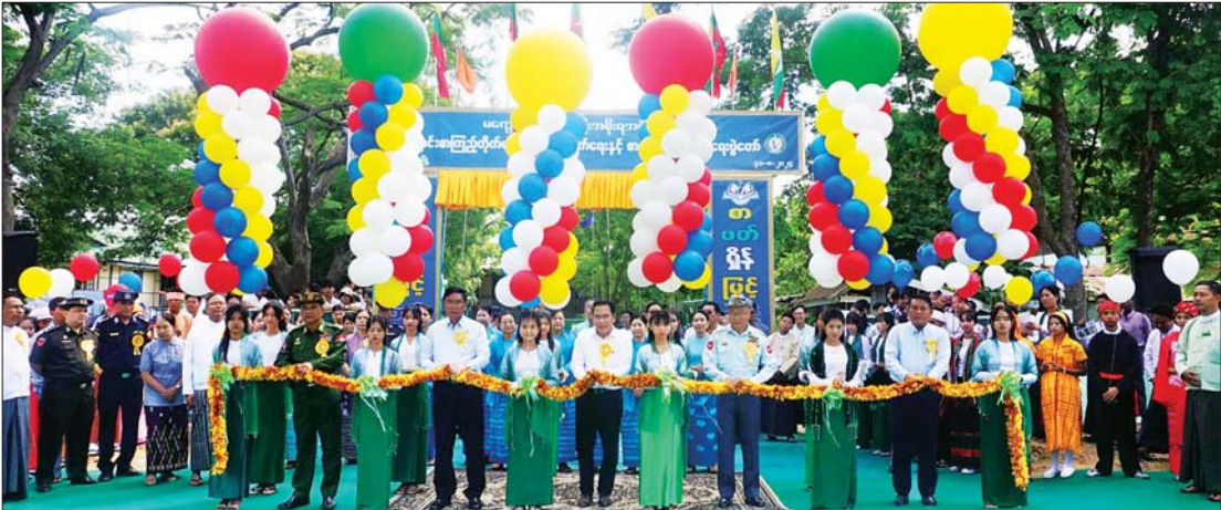
ပြည်ထောင်စုဝန်ကြီး ဦးမောင်မောင်အုန်း၊ မကွေးတိုင်းဒေသကြီးဝန်ကြီးချုပ် ဦးတင်လွင်၊ နယ်မြေခံတပ်နယ်မှ ဗိုလ်မှူးချုပ် သိန်းထွန်းဦး၊ လုံခြုံရေးနှင့် နယ်စပ်ရေးရာဝန်ကြီး ဗိုလ်မှူးကြီး မိုးမင်းသိန်းနှင့် လူမှုရေးရာဝန်ကြီး ဦးမျိုးမြင့်တို့က ကျောင်းစာကြည့်တိုက်များ ဖွံ့ဖြိုးတိုးတက်ရေးနှင့် စာဖတ်ရရှိနိုင်ခြင်းပွဲတော်ဖွင့်ပွဲအခမ်းအနားကို ဖွဲ့စည်းပေးသည့်ပေးစဉ်။

မင်းဘူး၊ ဩဂုတ် ၃၁ ကျောင်းစာကြည့်တိုက်များ ဖွံ့ဖြိုးတိုးတက်စေရန်၊ ကျောင်းသား ကျောင်းသူများ စာအုပ်စာပေ လေ့လာဖတ်ရှုနိုင်ရန်နှင့် စာပေလေ့လာဖတ်ရှုခြင်းမှ ရရှိသော အသိပညာဗဟုသုတများကို ပြန့်လှည့်အသုံးပြုပေးနိုင်ရန် ရည်ရွယ်၍ ကျောင်းစာကြည့်တိုက်များ ဖွံ့ဖြိုးတိုးတက်ရေးနှင့် စာဖတ်ရရှိနိုင်ခြင်းပွဲတော်ဖွင့်ပွဲအခမ်းအနား၊ နိုင်ငံတော်စီမံအုပ်ချုပ်ရေးကောင်စီဥက္ကဋ္ဌ နိုင်ငံတော်ဝန်ကြီးချုပ် ဗိုလ်ချုပ်မှူးကြီး မင်းအောင်လှိုင်နှင့် ဇနီး ဒေါ်ကြူကြူလှ မိသားစုက မကွေးတိုင်းဒေသကြီးအတွင်းရှိ စာကြည့်တိုက်များအတွက် ငွေကျပ် သိန်း ၃၀ နှင့် လူထုသိပ္ပံကျမ်းစာအုပ်နှင့် သုတ၊ ရသ စာအုပ်စာစောင်မျိုးစုံ လှူဒါန်းပွဲကို ယနေ့နံနက်ပိုင်းတွင် မင်းဘူးမြို့ အမှတ် (၁) အခြေခံပညာအထက်တန်းကျောင်း၌ ကျင်းပသည်။