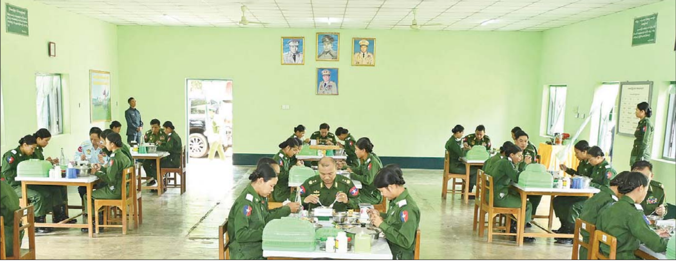
နိုင်ငံတော်စီမံအုပ်ချုပ်ရေးကောင်စီဥက္ကဋ္ဌ တပ်မတော်ကာကွယ်ရေးဦးစီးချုပ် ဗိုလ်ချုပ်မှူးကြီး မင်းအောင်လှိုင်နှင့် အဖွဲ့ဝင်များ တပ်မတော်(ကြည်း) ဗိုလ်သင်တန်းကျောင်း(မှော်ဘီ)မှ အမျိုးသမီးဗိုလ်လောင်းသင်တန်းသူများနှင့် အမျိုးသမီးအရာရှိကြေညာပေးသောပုံစံမျိုးသင်တန်းမှ သင်တန်းသူများနှင့်အတူ နေ့လယ်စာကို အတူတကွ သုံးဆောင်ကြစဉ်။

ဖြစ်သဖြင့် အမှားခံ၍ ရမည်မဟုတ်ကြောင်း၊ ထို့ကြောင့် လုပ်ငန်းတာဝန်များကို ထမ်းဆောင်ရာတွင် တစ်ဦးချင်း၏ အရည်အချင်းများ တိုးတက်မှုရှိစေရေး အမြဲမပြတ်လေ့ကျင့်ဆောင်ရွက်ရန်နှင့် သမားစဉ်လုပ်ငန်းများကို မှန်မှန်ကန်ကန်နှင့် တိတိကျကျ Check | Recheck | Counter check များဖြင့် ဆောင်ရွက်သွားရန်လိုကြောင်း။ မိမိတို့ ဆောင်ရွက်နေရသည့် သမားစဉ်လုပ်ငန်းများကို မှန်မှန်ကန်ကန်ဖြင့် ဆောင်ရွက်နေမည်ဆိုပါက တစ်ဦးချင်း အရည်အချင်းများပြည့်ဝပြီး တာဝန်ထမ်းဆောင်မှုများကို အောင်မြင်စွာဆောင်ရွက်နိုင်မည်ဖြစ်ကြောင်း၊ လေ့ကျင့်သားပြည့်ဝနေမှသာလျှင် မိမိကိုယ်ကိုနှင့် မိမိလက်နက်အပေါ် ယုံကြည်စိတ်ဖြင့်မားမည်ဖြစ်ကာ ရည်မှန်းချက်တာဝန်များကို အောင်မြင်အောင်ထမ်းဆောင်နိုင်မည်ဖြစ်ကြောင်း၊ ထို့ကြောင့် လေ့ကျင့်ရေးလုပ်ငန်းများကို အလေးထားဆောင်ရွက်သွားမည်ဆိုပါက လုပ်ငန်းတာဝန်များကို အောင်မြင်စွာဖြင့် ထူးချွန်စွာဆောင်ရွက်နိုင်မည် တပ်ဖွဲ့တစ်ခုဖြစ်လာမည်ဖြစ်ပြီး နိုင်ငံတော်ကာကွယ်ရေးတာဝန်များကို စွမ်းစွမ်းတစ်ဆောင်ရွက်နိုင်သည့် တပ်ဖွဲ့တစ်ခုဖြစ်လာမည်ဖြစ်ကြောင်း။ သက်သာချောင်ချိရေးနှင့် စိတ်ဓာတ်မြှင့်မားရေး သက်သာချောင်ချိရေးနှင့် ပတ်သက်၍လည်း တပ်မတော်အနေဖြင့် တတိန်သရွေ့ ဖြည့်ဆည်းဆောင်ရွက်ပေးလျက်ရှိပြီး စာမျက်နှာ ၅ သို့