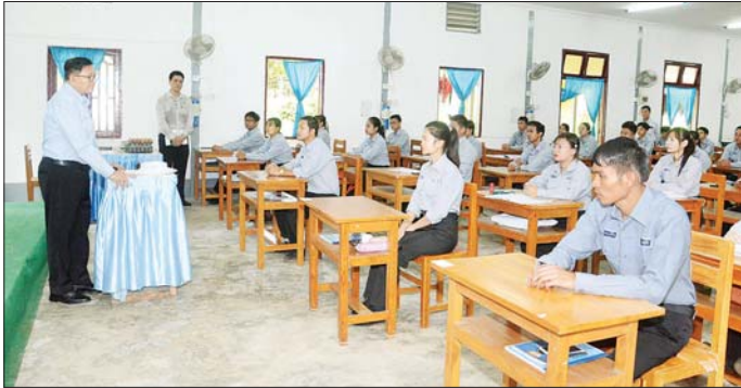
ရန် လေ့ကျင့်ပေးထားခြင်းဖြစ်ပါကြောင်း၊ ဒေသအသီးသီးမှ လာရောက် သင်ယူလေ့လာကြသော သင်တန်းသား သင်တန်းသူများအနေဖြင့် စွမ်းဆောင်ရည်ပြည့်ဝသော လူ့စွမ်းအားအရင်းအမြစ်များအဖြစ် မွေးမြူရေးကဏ္ဍအတွက် ခေါင်းဆောင်ကောင်းများ ဖြစ်လာစေရေး ကြိုးပမ်းအားထုတ်ကြစေ လိုကြောင်း ဆွေးနွေးမှာကြားပြီး (အပေါ်ပုံ) သင်တန်းသား သင်တန်းသူများအတွက် အာဟာရဖြည့်စွက်စာနှင့် ကြက်ဥများကို ပေးအပ်သည်။ ဆက်လက်၍ အစည်းအဝေးခန်းမတွင် ကျောင်းအုပ်ကြီးနှင့် ဆရာ ဆရာမများကို တွေ့ဆုံ၍ ဒုတိယဝန်ကြီးက သင်တန်းသင်ရိုးညွှန်းတမ်းများ ခေတ်ကာလနှင့်အညီ ဖြစ်စေရေး၊ နည်းပညာသင်ကြားမှုနှင့်အတူ စဉ်ဆက်မပြတ်လေ့လာမှု အလေ့အကျင့်နှင့် ကျွမ်းကျင်မှုအရည်အသွေးမြှင့်တင်နိုင်ရေးကို ထည့်သွင်းစဉ်းစားဆောင်ရွက်ပေးရန် လိုအပ်ချက်များ၊ ဆရာ ဆရာမများကိုယ်တိုင် သင်ကြားရင်းလေ့လာလေ့လာရင်း သင်ကြားခြင်းဖြင့် တိရစ္ဆာန်ကျန်းမာရေးစောင့်ရှောက်မှုဆိုင်ရာ လူ့စွမ်းအားအရင်းအမြစ်

နေပြည်တော်၊ ဩဂုတ် ၃၁ စိုက်ပျိုးရေး၊ မွေးမြူရေးနှင့် ဆည်မြောင်းဝန်ကြီးဌာန ဒုတိယဝန်ကြီး ဒေါက်တာ အောင်ကြီးသည် ယနေ့မနန်းလှည့်ပိုင်းတွင် ရန်ကင်းတိုင်းဒေသကြီး အင်းစိန်မြို့နယ်ရှိ တိရစ္ဆာန်ဆေးကုသပုံ ဒီပလိုမာသင်တန်းကျောင်း၏ သင်ကြားသင်ယူရေး လုပ်ငန်းများကို ကြည့်ရှုစစ်ဆေးပြီး သင်တန်းသားသင်တန်းသူများနှင့် တွေ့ဆုံသည်။