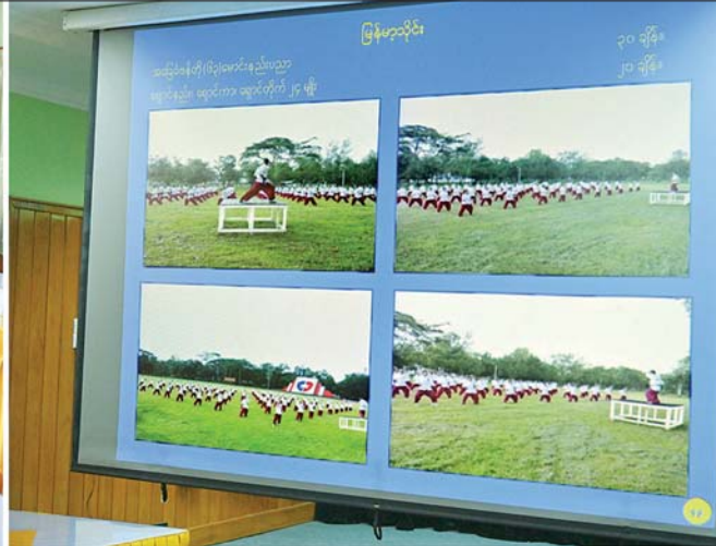
နိုင်ငံတော်စီမံအုပ်ချုပ်ရေးကောင်စီဥက္ကဋ္ဌ တပ်မတော်ကာကွယ်ရေးဦးစီးချုပ် ဗိုလ်ချုပ်မှူးကြီး မင်းအောင်လှိုင် အား တပ်မတော်(ကြည်း) ဗိုလ်သင်တန်းကျောင်း(မှော်ဘီ)မှ ကျောင်းအုပ်ကြီးက သင်တန်းများ ဖွင့်လှစ်သင်ကြားပေးလျက်ရှိမှုအခြေအနေများနှင့်ပတ်သက်၍ ရှင်းလင်းတင်ပြစဉ်။

စာမျက်နှာ ၄ မှ အုပ်ချုပ်သူအဆင့်ဆင့်မှလည်း မိမိတို့တပ်ဖွဲ့များ၏ သက်သာချောင်ချိရေးလုပ်ငန်းများကို ဆောင်ရွက် ပေးရန်လိုကြောင်း၊ ကျန်းမာကြံ့ခိုင်မှုရှိစေရေး၊ အသင်းအဖွဲ့ဖြင့် ဆောင်ရွက်တတ်စေရေးအတွက် အားကစားပွဲများ၊ လျှော့ပွဲအားပေးပေးခြင်း၊ အသိပညာဗဟုသုတနှင့် ခံယူချက်ကောင်းများ ရရှိစေရေးအတွက် ဟောပြောဆွေးနွေးပွဲများ ပြုလုပ် ပေးခြင်းတို့ကို ဆောင်ရွက်ပေးရန်လိုကြောင်း၊ စစ်သည်တစ်ဦးချင်းစီနှင့် ၎င်းတို့၏မိသားစုဝင်များ ၏လူမှုရေးအခက်အခဲအကျပ်အတည်းများကိုလည်း မိမိတို့တတ်စွမ်းသည့်ဘက်မှ ကူညီဖြေရှင်းဆောင် ရွက်ပေးရန်လိုကြောင်း၊ စစ်သည်တစ်ဦးချင်းအလိုက် စိတ်ဓာတ်နှင့် ခံယူချက်များ ကောင်းမွန်မည်ဆိုပါက တပ်၏ အရည်အချင်းများ မြင့်မားလာမည်ဖြစ် ကြောင်း၊ တပ်မတော်(ကြည်း) ရေ လေရှိ တပ်ဖွဲ့ဝင်