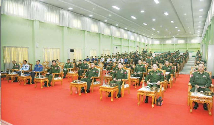
နိုင်ငံတော်စီမံအုပ်ချုပ်ရေးကောင်စီဥက္ကဋ္ဌ တပ်မတော်ကာကွယ်ရေးဦးစီးချုပ် ဗိုလ်ချုပ်မှူးကြီး မင်းအောင်လှိုင် တပ်မတော်(ကြည်း) ဗိုလ်သင်တန်းကျောင်း(မှော်ဘီ)မှ အမျိုးသမီးဗိုလ်လောင်းသင်တန်းသူများနှင့် အမျိုးသမီးအရာရှိကြေညာပေးသောပုံစံမျိုးသင်တန်းမှ သင်တန်းသူများအား တွေ့ဆုံအမှာစကားပြောကြားစဉ်။

စာမျက်နှာ ၃ မှ အမိဋ္ဌာန်ပြုပါ၏” ဆိုသည့် သစ္စာဆိုချက်အတိုင်း စောင့်ထိန်းဆောင်ရွက်သွားကြရန် လိုကြောင်း၊ ထိုကဲ့သို့ နိုင်ငံတော်အပေါ် သစ္စာဆိုထားသည့် တပ်မတော်သားတစ်ဦးချင်းစီအနေဖြင့် မိမိကိုယ်ကို၊ မိမိအဖွဲ့အစည်းနှင့် နိုင်ငံတော်အပေါ်သစ္စာရှိရမည် ဖြစ်ပြီး ခံယူချက်ကောင်းရမည်ဖြစ်ကြောင်း၊ မိမိတို့၏ စိတ်ဓာတ်၊ သစ္စာရှိမှုများဖြင့် ပေးအပ်လာသည့် တာဝန်များကို ကျေပွန်အောင်ထမ်းဆောင်ကြစေလိုကြောင်း၊ တပ်မတော်သည် နိုင်ငံတော်၏အစိတ်အပိုင်းတစ်ခုဖြစ်သကဲ့သို့ တပ်မတော်သားများသည်လည်း ပြည်သူများ၏ အစိတ်အပိုင်းတစ်ခုပင်ဖြစ်ကြောင်း၊ တပ်မတော်သားများသည် ပြည်သူများမှ ပေါက်ဖွားလာကြသူများဖြစ်ပြီး နိုင်ငံတော်ကာကွယ်ရေးတာဝန်များကို အသက်စွန့်၍ တာဝန်ထမ်းဆောင်ရန် သစ္စာဆိုတိုင်တည်ထားသည့် အဖွဲ့အစည်းဖြစ်သဖြင့် နိုင်ငံတော်အတွက် အမြင့်ဆုံးအဖွဲ့အစည်းဖြစ်ကြောင်း၊ ထို့ကြောင့် တပ်မတော်သားတစ်ဦးချင်းစီအနေဖြင့် မိမိတို့ကိုယ်ကို ဂုဏ်ယူ၍ တာဝန်ကို ထမ်းဆောင်ကြရန်လိုပြီး နိုင်ငံတော်နှင့် တပ်မတော်အပေါ် သစ္စာစောင့်သိရန်လိုကြောင်း၊ ထို့ပြင် တပ်မတော်သားများသည် နိုင်ငံတော်ထမ်းဆောင်မှုဖြစ်သဖြင့် ဝါတီနိုင်ငံရေးကင်းရှင်းစွာဖြင့် တာဝန်ထမ်းဆောင်ကြရန်လိုပြီး နိုင်ငံရေးနှင့်ပတ်သက်၍ နိုင်ငံအရေး၊ အမျိုးသားအရေးကို ဆောင်ရွက်သွားရမည်သာဖြစ်ကြောင်း။