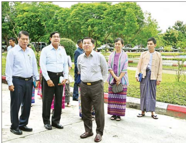
နိုင်ငံတော်စီမံအုပ်ချုပ်ရေးကောင်စီဥက္ကဋ္ဌ နိုင်ငံတော်ဝန်ကြီးချုပ် ဗိုလ်ချုပ်မှူးကြီး မင်းအောင်လှိုင် ရန်ကုန်အနောက်ပိုင်းတက္ကသိုလ် ပင်မလေးထပ်ဆောင်အား ကြည့်ရှုစစ်ဆေးစဉ်။