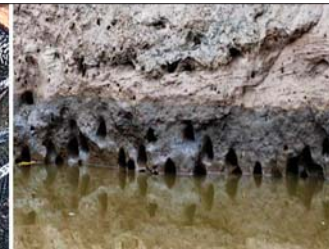
ကန်အောက်ခြေများရှိ တွင်းများ

ပြီး မွေးမြူထားသောငါးများ၏ အစာမှ အသား ပြောင်းလဲနှုန်းသည် ကျဆင်းနေသဖြင့် ငါးမွေးမြူ ရေးထွက်ကုန်များနည်းပါး၍ စီးပွားရေးကျဆင်း လျက်ရှိကြောင်း စုံစမ်းသိရှိရပါသည်။ စုပ်ခွက်ငါး မျိုးစိတ် (Pterygoplichthys spp: Sucker-mouth armored catfish) သည် ငါးမွေးမြူထုတ်လုပ်ရေး သာမက သဘာဝဂေဟဗေဒစနစ်အပေါ် ဆိုးကျိုး သက်ရောက်မှုများရှိပါသည်။ တည်ဆဲငါးမွေးမြူ ခြင်းဆိုင်ရာဥပဒေများတွင် ခွင့်ပြုချက်မရှိဘဲ ငါးအရွယ်ကို ပြည်ပမှ ပြည်တွင်းသို့တင်သွင်းခြင်း၊ ပြည်တွင်းမှ ပြည်ပသို့တင်ပို့ခြင်းဆိုသော တားမြစ် ချက်ကို ဖော်ပြထားပြီးဖြစ်သလို စုပ်ခွက်ငါးမျိုးစိတ် အား အန္တရာယ်ရှိသော ကျူးကျော်ငါးမျိုးအဖြစ် သတ်မှတ်၍ ၎င်းငါးမျိုးစိတ်သည် မြန်မာနိုင်ငံ အတွင်းရှိ ရေချိုရေပြင်ဂေဟစနစ်တစ်ခုလုံးကို ဖျက်စီးစေနိုင်သည့်အပြင် တိုင်းရင်းငါးမျိုးစိတ်တို့ကို လည်း ဆိုးကျိုးသက်ရောက်စေနိုင်သဖြင့် စုပ်ခွက် ငါးမျိုးစိတ်နှင့် ပတ်သက်၍ ပြည်ပမှတင်သွင်းခြင်း၊ သားဖောက်ခြင်း၊ မွေးမြူခြင်း၊ တင်ပို့ခြင်း၊ သို့လှောင် ခြင်း၊ ရောင်းဝယ်ခြင်းနှင့် သဘာဝရေပြင်များ အတွင်းသို့ လွှတ်ခြင်းများနှင့်ပတ်သက်၍ အများ ပြည်သူများ သိရှိလိုက်နာရန်အတွက် တားမြစ်ချက် များ၊ ကြေညာစာများလည်း ထုတ်ပြန်ခဲ့ပြီးဖြစ် ပါသည်။