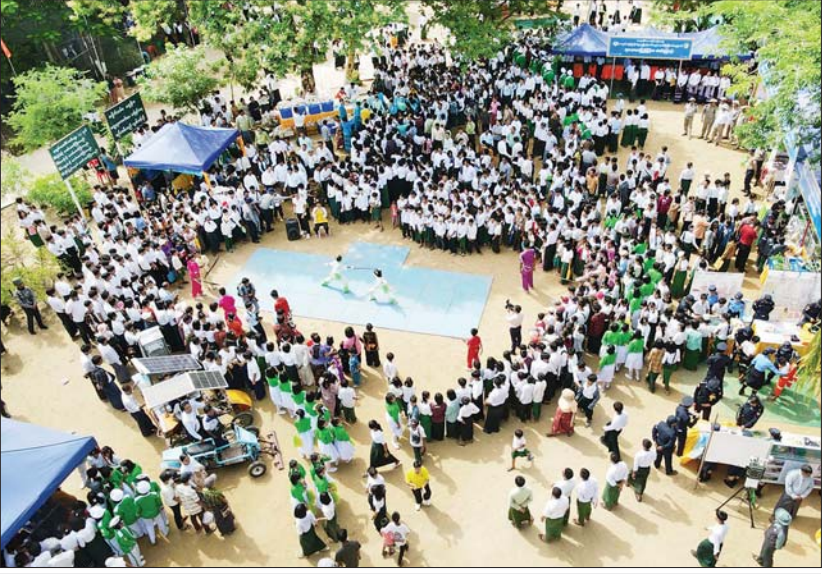
မင်းဘူးမြို့ ကျောင်းစာကြည့်တိုက်များ ဖွံ့ဖြိုးတိုးတက်ရေးနှင့် စာဖတ်ရရှိနိုင်ခြင်းပွဲတော်ဖွင့်ပွဲအခမ်းအနား အတွင်း ကျောင်းသားကျောင်းသူများဖြင့် စည်သင်းသိုက်မြိုက်စွာ တွေ့ရစဉ်။