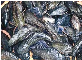
စုပ်ခွက်ငါးများ

Pterygoplichthys နှင့် မျိုးရင်း (Family) Lori- cariiidae တွင်ပါဝင်ကာ ဒေသရင်းမဟုတ်သော ငါးအုပ်စုတွင် ပါဝင်ပြီး (Exotic fish groups) အပူပိုင်းဒေသနှင့် အပူလျော့ပိုင်းဒေသများတွင် (Tropical and Subtropical) ပျံ့နှံ့ကျက်စားကြပါ သည်။ ၎င်းတို့၏မူရင်းဒေသသည် တောင်အမေရိက တိုက် (အဓိကအားဖြင့် ဘရာဇီးနှင့် ပီရူးနိုင်ငံတို့ရှိ အမေရိန်မြစ်ဝှမ်းဒေသ)ဖြစ်ပြီး သူတော်သန်စစ်တမ်း များအရ တိုက်ကြီး(၅)တိုက်နှင့် မြန်မာနိုင်ငံ အပါအဝင်နိုင်ငံပေါင်း ၂၁ နိုင်ငံသို့ အလှူမွေးငါးမွေး မြူရေးဝယ်ရေး (Aquarium trade)မှ တစ်ဆင့် ကန်သန့်ရှင်းရေးငါးအဖြစ် ရောက်ရှိလာကြောင်း ဖော်ပြထားသည်ကို တွေ့ရှိရပါသည်။ စုပ်ခွက်ငါးမျိုး စိတ်တွင် မျိုးစိတ်ပေါင်း ၉၈၃ မျိုးခန့်ရှိကာ အစုစား သတ္တဝါမျိုးစိတ်ဖြစ်ပြီး အလွန်တရာရေညစ်ညမ်း သည့် ပတ်ဝန်းကျင်အခြေအနေမှာပင် ရှင်သန် နိုင်စွမ်းရှိကြပါသည်။ ၎င်းတို့ ရောက်ရှိရင်သန့် ပေါက်ပွားနေထိုင်ကြသည့် ရေပြင်များအတွင်းရှိ အခြားသောငါးမျိုးစိတ်များ၏ ဥများ၊ သားလောင်း များကိုလည်း စားသောက်ကြပါသည်။ ထို့အတူ စုပ်ခွက်ငါးများသည် ဒေသရင်း ငါးမျိုးစိတ်များ၏ ငါးနေငါးထိုင်ခရီးယာများ၊ ဥချသားပေါက်ရာ နေရာများ၊ ဂေဟဗေဒစနစ်အရ အရေးပါသော