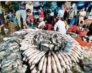
ငါးစားသုံးခြင်း အလေ့အထ

စုပ်ခွက်ငါးမျိုးစိတ်၏ ဆိုးကျိုးများ စုပ်ခွက်ငါးမျိုးစိတ်သည် မျိုးစု (Genus) စာမျက်နှာ ၁၇ သို့