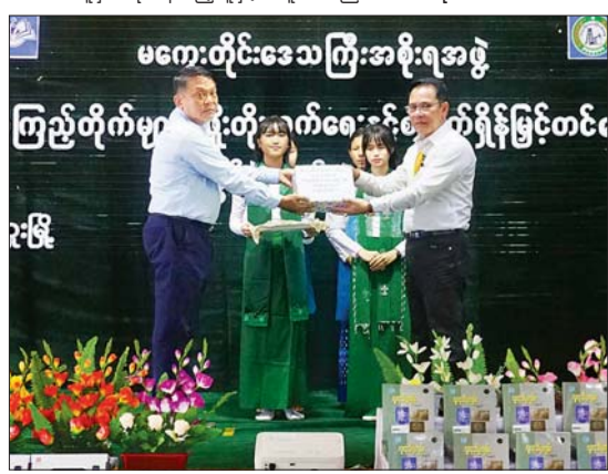
မကွေးတိုင်းဒေသကြီးအစိုးရအဖွဲ့ ကြည့်တိုက်များဖွံ့ဖြိုးတိုးတက်ရေးနှင့် စာဖတ်ရရှိနိုင်ခြင်းပွဲတော်ဖွင့်ပွဲအခမ်းအနားအတွင်း မင်းဘူးမြို့ အခြေခံပညာအထက်တန်းကျောင်းမှ ကျောင်းသားကျောင်းသူများအနေဖြင့် စာလည်းတတ်၊ စာလည်းဖတ်ပြီး အသိပညာဗဟုသုတပြည့်ဝစွာဖြင့် အနာဂတ်ကို လျှောက်လှမ်းနေကြရမည်ဖြစ်ကြောင်း၊ မိမိတို့အား စာသင်ကြားပေးနေသည့် ဆရာဆရာမများကို ရိုသေလေးစားတန်ဖိုးထားကြစေလိုကြောင်း၊ ဆရာဆရာမများသည် မိမိတို့ဘဝ တိုးတက်အောင် သင်ကြားပြသ မီးမောင်းထိုးပြပေးနေသူများဟု မှတ်ယူကြစေလိုကြောင်း ပြောကြားသည်။ ထို့နောက် နိုင်ငံတော်စီမံအုပ်ချုပ်ရေး ယင်းနောက် ပြန်ကြားရေးဝန်ကြီးဌာန ပြည်ထောင်စုဝန်ကြီးက မင်းဘူးမြို့ပေါ်ရှိ အခြေခံပညာအထက်တန်းကျောင်းနှင့် အလယ်တန်းကျောင်းများအတွက် DTH စလောင်း၊ ငါးစုံနှင့် DVB T2 Set Top Box ၁၅ လုံးတို့အား ပေးအပ်လှူဒါန်းရာ တိုင်းဒေသကြီးပညာရေးမှူးက လက်ခံရယူသည်။ ဆက်လက်၍ မကွေးတိုင်းဒေသကြီးအတွင်း ထပ်မံဆောက်လုပ်မည့် စာကြည့်တိုက် အဆောက်အအုံအသစ် လေးတိုက်အတွက် အလှူငွေကျပ်သိန်း ၆၀၀ အား တိုင်းဒေသကြီးဝန်ကြီးချုပ်က ပေးအပ်လှူဒါန်းရာ ပြည်ထောင်စုဝန်ကြီးက လက်ခံရယူသည်။ စာမျက်နှာ ၉ သို့

ကောင်စီဥက္ကဋ္ဌ နိုင်ငံတော်ဝန်ကြီးချုပ် ဗိုလ်ချုပ်မှူးကြီး မင်းအောင်လှိုင်နှင့် ဇနီး ဒေါ်ကြူကြူလှ မိသားစုက မကွေးတိုင်းဒေသကြီးအတွင်းရှိ စာကြည့်တိုက်များအတွက် လှူဒါန်းသော အလှူငွေကျပ်သိန်း ၃၀၊ လူထုသိပ္ပံကျမ်းစာ အတွဲ(၆)နှင့် အတွဲ(၇) အုပ်စုပေါင်း ၁၂၂ အုပ်နှင့် သုတ၊ ရသ စာအုပ်စာစောင်မျိုးစုံ ၂၃၃ အုပ်တို့အား ပြည်ထောင်စုဝန်ကြီးက ပေးအပ်ရာ လက်ခံရယူသည်။ (အောက်ပုံ)