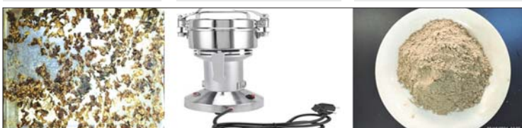
စုပုံခွက်ငါးအသားခြောက်များ။ ကြိုတင်ခြေစက်ဖြင့် အမှုန့်ကြိတ်ခြင်း။ ဆန်ခါတိုက်စုပုံခွက်ငါးအသားမှုန့်များ။