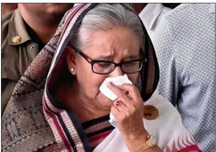
ဘင်္ဂလားဒေ့ရှ်ဝန်ကြီးချုပ်(ဟောင်း) ရိုတ်ဟာဆီနာ ရာထူးမှ နုတ်ထွက်ပြီးနောက် ပြည်ပသို့ မထွက်ခွာမီ တွေ့ရပုံ။

ထိုနှစ်နိုင်ငံနည်းတူ အိန္ဒိယနိုင်ငံမှာလည်း တိုက်တိုက်ဆိုင်ဆိုင် နိုင်ငံတစ်ဝန်း ဆန္ဒပြပွဲတွေ ဖြစ်ခဲ့တယ်။ အိမ်ခြံမြေမာနိုင်ငံ အခြေအနေကြည့် ပြန်ရင်လည်း ဘက်စုံထောင်စုံက တိုက်ခိုက်ခံနေရချိန်၊ ပြည်တွင်း ပြည်ပ ဖိအားအမျိုးမျိုးအောက်မှာ သွေးခွဲခံနေရချိန်၊ ပြည်တွင်းစည်းလုံးညီညွတ်မှုအားကို အရယူကြိုးစားတည်ဆောက်နေရချိန်၊ ပြည်ပက မိတ်ဆွေစစ်စစ် မဟာမိတ်တွေရဲ့ အားကို အရယူနေရတဲ့ အခြေအနေမှာ အစစအရာရာ ဘက်ပေါင်းစုံက သုံးသပ်ဆောင်ရွက်နေရတဲ့ အနေအထားလည်း ဖြစ်နေတယ်။