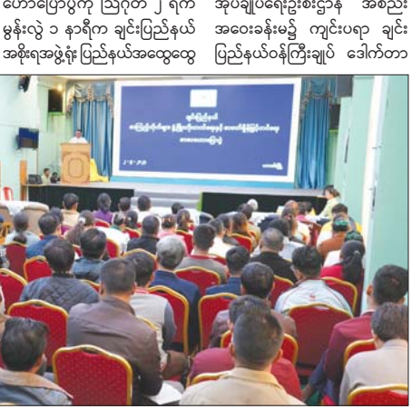
ဟောပြောပွဲကို ဩဂုတ် ၂ ရက် မွန်းလွဲ ၁ နာရီက ချင်းပြည်နယ် အစိုးရအဖွဲ့ရုံး ပြည်နယ်အထွေထွေ အုပ်ချုပ်ရေးဦးစီးဌာန အစည်း အဝေးခန်းမ၌ ကျင်းပရာ ချင်း ပြည်နယ်ဝန်ကြီးချုပ် ဒေါက်တာ

ဟားခါး စက်တင်ဘာ ၂ စာကြည့်တိုက်များဖွံ့ဖြိုးတိုးတက် ရေးနှင့် စာဖတ်ရိုက်မြှင့်တင်ရေး