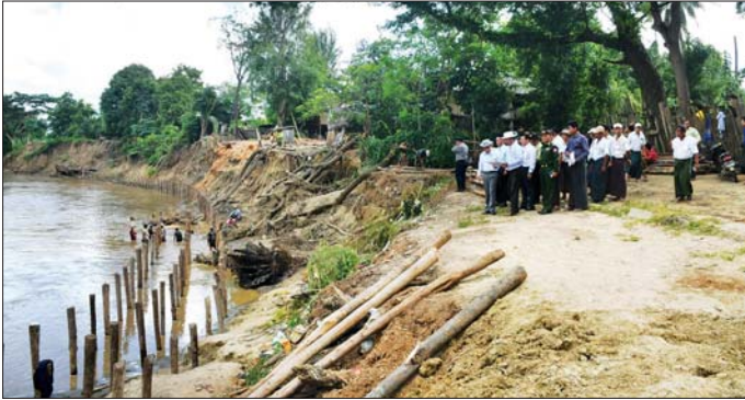
နေပြည်တော်ကောင်စီဥက္ကဋ္ဌ ဦးသန်းထွန်းဦး ကမ်းပြိုကာကွယ်ရေးလုပ်ငန်းများအား ကြည့်ရှုစစ်ဆေးစဉ်။

နေပြည်တော် စက်တင်ဘာ ၂ ပြည်ထောင်စုနယ်မြေ နေပြည်တော် လယ်ဝေးမြို့နယ် သစ်ဆိမ့်ပင်ကျေးရွာအုပ်စု ခရမ်းကိုင်ကွင်း ဧက ၂၀၀ ရှိမ်းလင်းဆောင်ရွက်ခဲ့ပြီးလျှင် ဦးစပါးအတွက် ယူရီးယားဓာတ်မြေဩဇာ ထောက်ပံ့ပေးအပ်ခြင်းနှင့် တောင်သူတွေဆုံပွဲအခမ်းအနားကို ယမန်နေ့က နေပြည်တော်ကောင်စီဥက္ကဋ္ဌ ဦးသန်းထွန်းဦး၊ နေပြည်တော်ကောင်စီဝင်များ၊ နေပြည်တော်အဆင့်ဌာနဆိုင်ရာ တာဝန်ရှိသူများနှင့် တောင်သူများ တက်ရောက်ကြသည်။