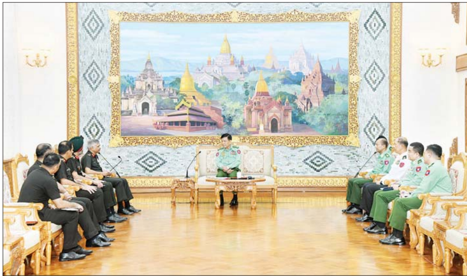
နိုင်ငံတော်စီမံအုပ်ချုပ်ရေးကောင်စီအဖွဲ့ဝင် ညှိနှိုင်းကွပ်ကဲရေးမှူး(ကြည်း၊ ရေ၊ လေ) ဗိုလ်ချုပ်ကြီး မောင်မောင်အေး အိန္ဒိယနိုင်ငံ နယူးဒေလီမြို့ရှိ National Defence College မှ အကြီးတန်းနည်းပြအရာရှိ(Senior Directing Staff) ဖြစ်သူ Major General Ajay Kumar Singh, AVSM, SM ဦးဆောင်သော ကိုယ်စားလှယ်အဖွဲ့အား လက်ခံတွေ့ဆုံစဉ်။

တွေ့ဆုံပွဲသို့ နိုင်ငံတော်စီမံအုပ်ချုပ်ရေးကောင်စီအဖွဲ့ဝင်၊ ညှိနှိုင်းကွပ်ကဲရေးမှူး(ကြည်း၊ ရေ၊ လေ)နှင့်အတူ ကာကွယ်ရေးဦးစီးချုပ်ရုံး(ကြည်း)မှ တပ်မတော်လေ့ကျင့်ရေးအရာရှိချုပ် ဒုတိယဗိုလ်ချုပ်ကြီး ထိန်ဝင်းနှင့် တာဝန်ရှိသူများ တက်ရောက်ကြပြီး အိန္ဒိယနိုင်ငံ National Defence College မှ အကြီးတန်းနည်းပြအရာရှိ(Senior Directing Staff) ဖြစ်သူနှင့်အတူ သင်တန်းသားအရာရှိကြီးများ၊ မြန်မာနိုင်ငံဆိုင်ရာ အိန္ဒိယစစ်သံမှူးနှင့် တာဝန်ရှိသူများ တက်ရောက်ခဲ့ကြောင်း သတင်းရရှိသည်။