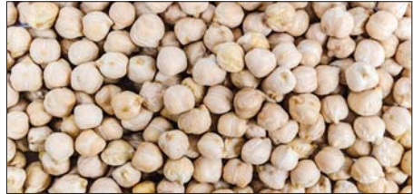
၂ - ၉ - ၂၀၂၄ ရက်နေ့ တိုင်းဒေသကြီးနှင့် ပြည်နယ် မြို့နယ်အလိုက် ဆန်၊ ဆီ၊ မီးဖိုချောင်သုံးပစ္စည်းများ၊ သားငါးဈေးနှုန်းများ

ဆုံးပတ်တွင် အရောင်းအဝယ်ဖြစ်သည့်ဈေးနှုန်းအနေဖြင့် ကုလားပဲပေါက်ဈေးဖြင့် ရောင်းချလျက်ရှိရာ ၁၈ သိန်းခန့် အကျိုးအမြတ်ရရှိကြောင်း၊ ဈေးကွက်အနေဖြင့် ကုလားပဲများကို ပဲပွဲစားများထံသို့ ရောင်းချမှုများ ရှိသည့်အပြင် ချောက်မြို့ပေါ်ရှိ ပဲရုံများသို့လည်း တင်ပို့ ရောင်းချလျက်ရှိကြောင်း သိရသည်။ ယခုနှစ်တွင် ကုလားပဲဈေးနှုန်းမြင့်တက်ပြီး အထွက်နှုန်းကောင်းမွန်၍ စိုက်တောင်သူများ အကျိုးအမြတ်ရရှိကြောင်း သိရသည်။ DOCA (မကွေး)