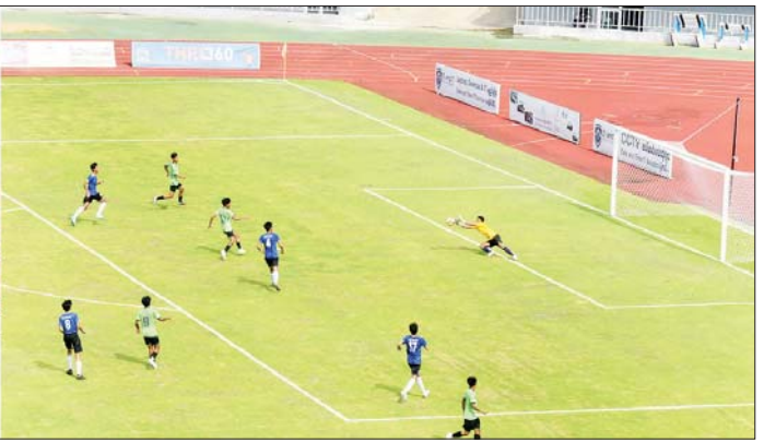
နိုင်ငံတော်စီမံအုပ်ချုပ်ရေးကောင်စီအဖွဲ့ဝင်များ သမဝါယမနှင့် ကျေးလက်ဖွံ့ဖြိုးရေးဝန်ကြီးဌာနကိုယ်စားပြု ဘောလုံးအသင်းနှင့် သယံဇာတနှင့် သဘာဝပတ်ဝန်းကျင်ထိန်းသိမ်းရေးဝန်ကြီးဌာနကိုယ်စားပြု ဘောလုံးအသင်းတို့ အကြိတ်အနယ်ယှဉ်ပြိုင်ကစားနေမှုကို ကြည့်ရှုအားပေးစဉ်။