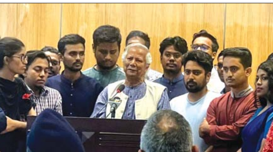
ကြားဖြတ်ဝန်ကြီးချုပ်ဖြစ်လာသူ မိုဟာမင်ယူနွတ် ဒါကာ၌ မီဒီယာများနှင့် တွေ့ဆုံစဉ်။