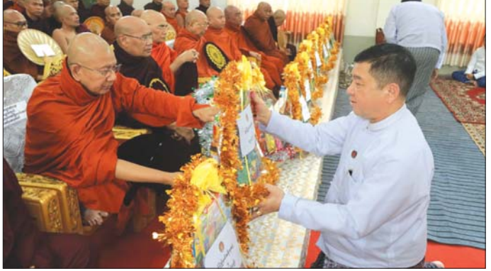
ကာ ဗုဒ္ဓသာသနံ စိရံ တိဋ္ဌတု သုံးကြိမ်ရွတ်ဆိုကာ သော ဆရာတော် သံဃာတော် အပါး ၁၀၀၀၀ ကျော် အခမ်းအနားကို ဝိတ်သိမ်းခဲ့သည်။ တို့ကို ဆေးဝါးနှင့် ဝတ္ထုငွေ စုစုပေါင်း ကျပ်သိန်း ၁၃၀၀ ကျော်ကို လှူဒါန်းခဲ့ကြောင်း သိရ သည်။ အဆိုပါ (၁၃၉) ကြိမ်မြောက် ဆေးပဋ္ဌာန်းလှူဒါန်း ပွဲကို မွန်ပြည်နယ် ၁၀ မြို့နယ်အတွင်းရှိ ဘုန်းတော် ကြီးကျောင်းပေါင်း ၁၁၀ တွင် သီတင်းသုံးတော်မူ စည်သူ(ပြန်/ဆက်)