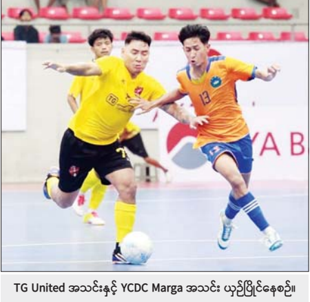
TG United အသင်းနှင့် YCDC Marga အသင်း ယှဉ်ပြိုင်နေစဉ်။

ရန်ကုန် စက်တင်ဘာ ၂ ၂၀၂၄ MFF ဖူဆယ်ချန်ပီယံရှစ်ပြိုင်ပွဲ ရှုံးထွက်ပွဲစဉ် (ပထမနေ့) ကို စက်တင်ဘာ ၂ ရက်က ရန်ကုန်မြို့ သုဝဏ္ဏဘေလုံးကွင်းရှိ MFF ဖူဆယ်အားကစားရုံ၌ ကျင်းပရာ ပြည့်စုံအသင်း၊ TG United အသင်း၊ Winner Soccer အသင်းနှင့် MH Dream Team အသင်းတို့ကွာတားဖိုင်နယ် တက်ရောက်ခဲ့သည်။ ရှုံးထွက်အဆင့် ပထမနေ့ပွဲစဉ်များတွင် ပြည့်စုံအသင်းက Power HBI အသင်းကို သုံးဂိုး-နှစ်ဂိုး၊ TG United အသင်းက YCDC Marga အသင်းကို တစ်ဂိုး-တစ်ဂိုး၊ Winner Soccer အသင်းက M-Million အသင်းကို သုံးဂိုး-တစ်ဂိုး၊ MH Dream Team အသင်းက UPK အသင်းကို ခြောက်ဂိုး-တစ်ဂိုးဖြင့် အနိုင်ရခဲ့သည်။ စာမျက်နှာ ၂၃ ကော်လံ ၁