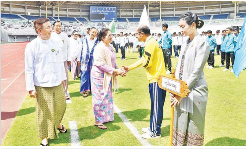
နိုင်ငံတော်စီမံအုပ်ချုပ်ရေးကောင်စီအဖွဲ့ဝင် ဒေါ်ခွဲဘျာနှင့်အဖွဲ့ဝင်များ ပြိုင်ပွဲဝင်အားကစားသမားများအား ရင်းရင်းနှီးနှီး လိုက်လံ နှုတ်ဆက်စဉ်။

နေပြည်တော် စက်တင်ဘာ ၂ ၂၀၂၄ ခုနှစ် ဝန်ကြီးဌာနပေါင်းစုံ တက္ကသိုလ်များ ဘောလုံးပြိုင်ပွဲဖွင့်ပွဲ အခမ်းအနားကို ယနေ့မွန်းလွဲပိုင်းတွင် နေပြည်တော်ရှိ ဝဏ္ဏသိဒ္ဓိဘောလုံးကွင်း၌ ကျင်းပရာ နိုင်ငံတော်စီမံအုပ်ချုပ်ရေး ကောင်စီအဖွဲ့ဝင်များ တက်ရောက် ကြည့်ရှုအားပေးကြသည်။ အခမ်းအနားသို့ နိုင်ငံတော်စီမံ အုပ်ချုပ်ရေးကောင်စီအဖွဲ့ဝင်များဖြစ်ကြ သည့် ဒေါ်ခွဲဘျာ၊ ပိုးရယ်အောင်သိန်း၊ မန်းငြိမ်းမောင်၊ ဒေါက်တာမူဝင်း၊ ဒေါက်တာ ဘရွှေ၊ ဦးရန်ကျော်၊ ပြည်ထောင်စုဝန်ကြီး များ၊ ဒုတိယဝန်ကြီးများ၊ ဌာနဆိုင်ရာ တာဝန်ရှိသူများ၊ ပါမောက္ခချုပ်များ၊ ကျောင်းအုပ်ကြီးများ၊ ဆရာ ဆရာမများ၊ ဖိတ်ကြားထားသည့်စည်ပည့်သင်တန်းများ၊ ပြိုင်ပွဲဝင်အသင်းများမှ အုပ်ချုပ်သူ/ နည်းပြများနှင့် အားကစားသမားများ တက်ရောက်ကြသည်။