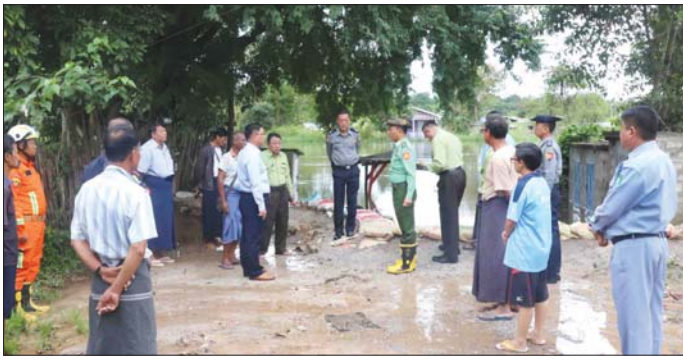
နေပြည်သူများက နေအိမ်များ အတွင်း ရေထပ်မံမဝင်ရောက်နိုင် ရေးအတွက် စီမံဆောင်ရွက်ထား ရှိမှုများကို သွားရောက်ကြည့်ရှု စစ်ဆေးကြပြီး ကယ်ဆယ်ရေး လုပ်ငန်းများအတွက် အသင့် ပြင်ဆင်ထားရှိသော စီးသတ် တပ်ဖွဲ့ဝင်များကို ထောက်ပံ့ငွေ များ ပေးအပ်သည်။ ထို့နောက် ပြည်နယ်ဝန်ကြီး ချုပ်နှင့် တာဝန်ရှိသူများသည် နမ့်ကွတ်ရပ်ကွက် ရေစီးကျေ၊ ဒေါနိုးကူးတံတား၊ ရှမ်းပိုင်း တံတား၊ ကန္တရတ်တံတားများသို့ သွားရောက်၍ ဘီလူးချောင်းရေ မြင့်တက်မှု အခြေအနေကို ကြည့်ရှု၍ ရေနစ်မြုပ်မှုမရှိရန် ကာရံထားသည့် မြေထိန်းနံရံများ

လွိုင်ကော် စက်တင်ဘာ ၂ ကယားပြည်နယ် ဝန်ကြီးချုပ် ဦးစော်မျိုးတင်သည် ပြည်နယ် အစိုးရအဖွဲ့ဝင်များနှင့်အတူ ယနေ့ နံနက်ပိုင်းက ဘီလူးချောင်းရေ မြင့်တက်မှုကြောင့် ရေဝင်ရောက် လျက်ရှိသည့် နမ့်ကွတ်ရပ်ကွက် အတွင်းရှိ နေအိမ်များ၊ ရေစီးကျေ၊ ဒေါနိုးကူးတံတား၊ ရှမ်းပိုင်း တံတားနှင့် ကန္တရတ်တံတားတို့၌ ဘီလူးချောင်းရေ မြင့်တက်မှု အခြေအနေများကို သွားရောက် ကြည့်ရှုစစ်ဆေးသည်။(ယာဝုံ) ရှေးဦးစွာ ပြည်နယ်ဝန်ကြီး ချုပ်နှင့် တာဝန်ရှိသူများသည် နမ့်ကွတ်ရပ်ကွက်အတွင်းရှိ နေအိမ် အချို့၌ ဘီလူးချောင်းရေဝင်ရောက် မှုအခြေအနေများ၊ သက်ဆိုင်ရာ တာဝန်ရှိသူများနှင့် ရပ်ကွက်