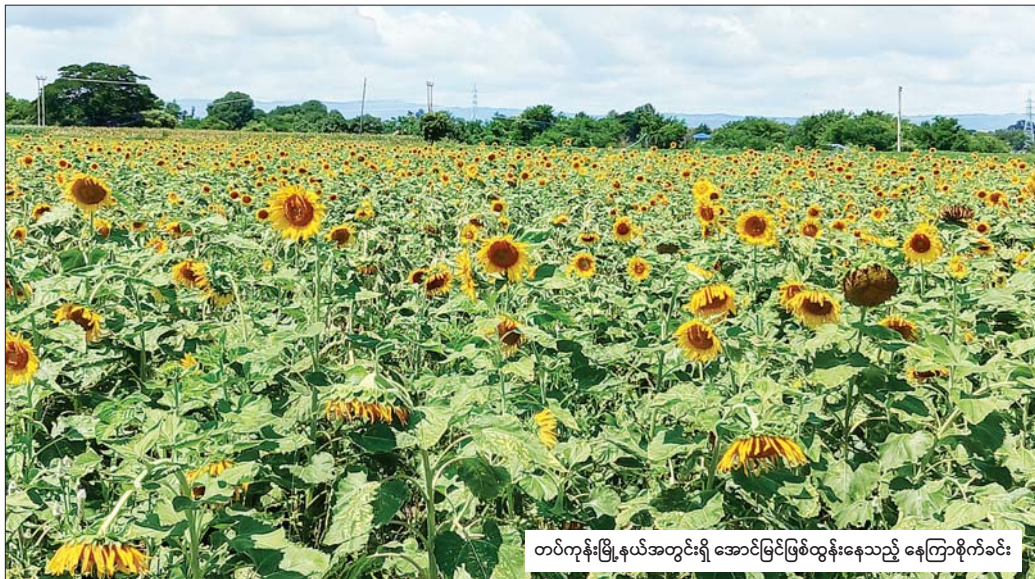
တပ်ကုန်းမြို့နယ်အတွင်းရှိ အောင်မြင်ဖြစ်ထွန်းနေသည့် နေကြာစိုက်ခင်း

နေပြည်တော် စက်တင်ဘာ ၂ ပြည်တွင်းစားသုံးဆီ ဖူလုံရေးအတွက် တိုင်းဒေသကြီးနှင့် ပြည်နယ်အသီးသီးတွင် နေကြာ သီးနှံ ဧကသုံးသန်းကျော် စိုက်ပျိုးသွားရန် လျာထား ဆောင်ရွက်လျက်ရှိရာ ယခုနှစ်က နေကြာသီးနှံဧက ၁ ဒသမ ၀၈ သန်း စိုက်ပျိုးခဲ့ပြီး ယခုနှစ်ဆောင်းရာသီ တွင် ဧက ၁၄၇၀၀ တိုးချဲ့စိုက်ပျိုးသွားမည်ဖြစ် ကြောင်း စိုက်ပျိုးရေး၊ မွေးမြူရေးနှင့် ဆည်မြောင်း ဝန်ကြီးဌာနမှ သိရသည်။ နေကြာသီးနှံသည် ဆီထွက်သီးနှံများတွင် စိုက်ပျိုး ရသော မျိုးစေ့ပမာဏနှင့် ထွက်ရှိသော မျိုးစေ့ပမာဏ အချိုးအစားမြင့်မားခြင်း၊ တိုင်းဒေသကြီးနှင့် ပြည်နယ်များတွင် ကာလတိုအတွင်း တိုးချဲ့စိုက်ပျိုး ရန် အလားအလာကောင်းခြင်း၊ အခြားဆီထွက်သီးနှံ များနှင့် နှိုင်းယှဉ်ပါက ဆီထွက်ရာခိုင်နှုန်း ပိုမိုများပြား ခြင်း စသည့်အားသာချက်များကြောင့် တိုးချဲ့စိုက်ပျိုး ရန် ဆောင်ရွက်နေခြင်းဖြစ်သည်။ “ဆီထွက်သီးနှံ နေကြာဧက သုံးသန်းကျော် စိုက်ပျိုးဆောင်ရွက်ဖို့အတွက် စီမံဆောင်ရွက်လျက် ရှိပါတယ်။ စာမျက်နှာ ၃ ကော်လံ ၁ ❖