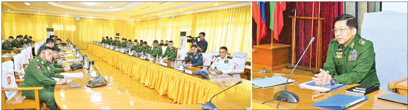
နိုင်ငံတော်စီမံအုပ်ချုပ်ရေးကောင်စီဥက္ကဋ္ဌ တပ်မတော်ကာကွယ်ရေးဦးစီးချုပ် ဗိုလ်ချုပ်မှူးကြီး မင်းအောင်လှိုင် အရှေ့ပိုင်းတိုင်းစစ်ဌာနချုပ်နယ်မြေအတွင်း နယ်မြေလုံခြုံရေးနှင့် တည်ငြိမ်အေးချမ်းရေးဆိုင်ရာများနှင့် ပတ်သက်၍ လိုအပ်သည်များကို လမ်းညွှန်မှာကြားစဉ်။