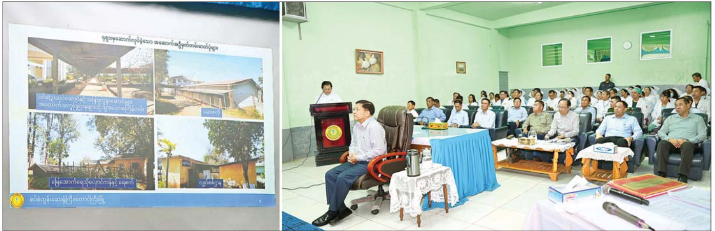
နိုင်ငံတော်စီမံအုပ်ချုပ်ရေးကောင်စီဥက္ကဋ္ဌ နိုင်ငံတော်ဝန်ကြီးချုပ် ဗိုလ်ချုပ်မှူးကြီး မင်းအောင်လှိုင် အား ဆေးရုံအုပ်ကြီး ဒေါက်တာဝင်းမော်ဦးက စစ်တုံ့နိုးဆေးရုံ၏ သမိုင်းအကျဉ်း၊ အဆောက်အအုံများ ဆောက်လုပ်ထားရှိမှုနှင့် လုပ်ငန်းဆောင်ရွက်မှုအခြေအနေများ ရှင်းလင်းတင်ပြစဉ်။

စာမျက်နှာ ၇ မှ လူဦးရေကို တွက်ချက်၍ ဆောင်ရွက်ပေးရမည်ဖြစ်ကြောင်း၊ ဆေးရုံ တိုးချဲ့တည်ဆောက်ရန် အတွက် လိုအပ်သည့်မြေနေရာများကိုလည်း စဉ်းစားဆောင်ရွက်ရန်လိုကြောင်း၊ ဆေးရုံများတွင် ကျန်းမာရေး ဝန်ထမ်းများ၏ နေအိမ်များ ထည့်သွင်းတည်ဆောက်ပေးထားရန် လိုကြောင်း၊ ဆေးရုံများအတွက် လိုအပ်သည့် ပါရဂူများကိုလည်း ခန့်အပ်တာဝန်ပေးရမည်ဖြစ်ကြောင်း ပြောကြား၍ ဆေးရုံ၏ လိုအပ်ချက်များကို မေးမြန်းဖြည့်ဆည်း ဆောင်ရွက်ပေးသည်။ သန့်ရှင်းသပ်ရပ်နေရန်လို ဆက်လက်၍ နိုင်ငံတော်စီမံအုပ်ချုပ်ရေးကောင်စီဥက္ကဋ္ဌ နိုင်ငံတော်ဝန်ကြီးချုပ်က အမှာစကား ပြောကြားရာတွင် ပြည်သူတိုင်း ကျန်းမာရေးလိုကြောင်း၊ ကျန်းမာမှ ပညာသင်ကြားနိုင်မည်၊