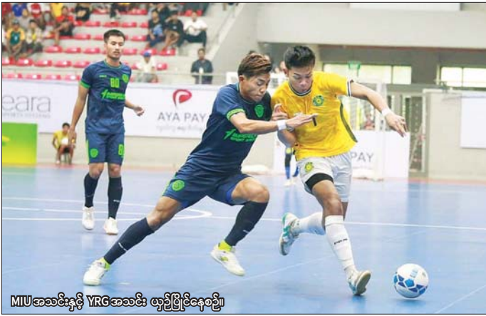
MIUအသင်းနှင့် YRGအသင်း ယှဉ်ပြိုင်နေစဉ်။

ရန်ကုန် စက်တင်ဘာ ၃ ၂၀၂၄ MFF ဖူဆယ်ချန်ပီယံရှစ် ဖြိုင်ပွဲ ရှုံးထွက်ပွဲစဉ် ဒုတိယနေ့ကို စက်တင်ဘာ ၃ ရက်က ရန်ကုန်မြို့ သုဝဏ္ဏဘောလုံးကွင်းရှိ MFF ဖူဆယ်အားကစားရုံ၌ ကျင်းပသည်။ ဒုတိယနေ့ပွဲစဉ်များ အပြီးတွင် လက်ရှိချန်ပီယံ VUC အပါအဝင် MIU၊ Futsal-19 နှင့် Seven အသင်းကွာတားပိုင်နယ်သို့ ထပ်မံတက်ရောက်ခဲ့သည်။ ရှုံးထွက်ပွဲစဉ် ဒုတိယနေ့တွင် လက်ရှိချန်ပီယံ VUC အသင်းက Generations အသင်းကို ငါးဂိုး- တစ်ဂိုး၊ စာမျက်နှာ ၁၂ ကော်လံ ၅ ၀