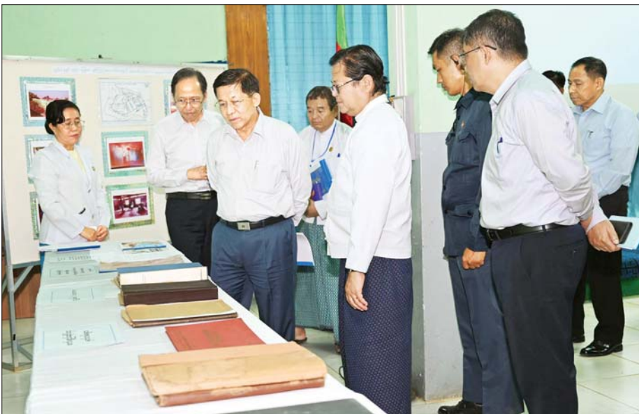
နိုင်ငံတော်စီမံအုပ်ချုပ်ရေးကောင်စီဥက္ကဋ္ဌ နိုင်ငံတော်ဝန်ကြီးချုပ် ဗိုလ်ချုပ်မှူးကြီး မင်းအောင်လှိုင် စစ်ထွန်းဆေးရုံကြီး အဆောက်အဦများ၊ စက်ပစ္စည်းများနှင့် ပတ်သက်သော ခင်းကျင်းပြသထားသည့် မှတ်တမ်းစာအုပ်များအား ကြည့်ရှုစစ်ဆေးစဉ်။

ဆောင်ရွက်နိုင်မှုနှင့် ကင်ဆာကုသ ခြင်းလုပ်ငန်းအတွက် စက် ကိရိယာများ ထပ်မံလိုအပ်မှုအခြေ အနေများကို ရှင်းလင်းတင်ပြ သည်။ ကုသမှုများ စနစ်တကျဆောင်ရွက်ရန်လို ရှင်းလင်းတင်ပြမှုများအပေါ် နိုင်ငံတော်စီမံအုပ်ချုပ်ရေးကောင်စီ ဥက္ကဋ္ဌ နိုင်ငံတော်ဝန်ကြီးချုပ်က လိုအပ်သည့် စက်ကိရိယာများကို ဖြည့်ဆည်း ဆောင်ရွက်ပေးသွား မည်ဖြစ်ကြောင်း၊ စက်ပစ္စည်းများ အသုံးပြု၍ ကုသမှုများဆောင်ရွက် ရာတွင်လည်း စနစ်တကျဖြင့် ဆောင်ရွက်ရန်လိုကြောင်း၊ ရှမ်း ပြည်နယ်အတွင်းရှိ ဆေးရုံများ အနက် လိုအပ်ချက်ရှိသည့် ဆေးရုံ များကို အဆင့်မြှင့်တင်မှုများနှင့် တိုးချဲ့မှုများ ဆောင်ရွက်ပေးရမည် ဖြစ်ကြောင်း၊ ထိုသို့ဆောင်ရွက်ရာ တွင်လည်း နယ်မြေအတွင်း နေထိုင်သည့် ပြည်သူများ၏ စာမျက်နှာ ၈ သို့