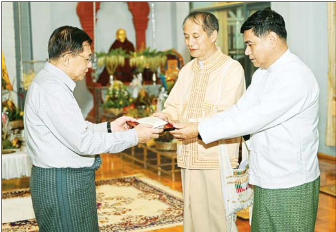
နိုင်ငံတော်စီမံအုပ်ချုပ်ရေးကောင်စီဥက္ကဋ္ဌ နိုင်ငံတော်ဝန်ကြီးချုပ် ဗိုလ်ချုပ်မှူးကြီး မင်းအောင်လှိုင် ရွှေဘုန်းပွင့်စေတီတော်မြတ်ကြီးအတွက် ဘက်စုံအလှူငွေများ ပေးအပ်လှူဒါန်းစဉ်။

အဆောက်အဦများကို အသုံးပြုခြင်း၊ အပြစ်မပြည်သူ လူထုတို့ကို လူသားတံတိုင်းအဖြစ် အသုံးပြုနိုင်ရေး ယာယီနေရပ်စွန့်ခွာနေရသူများကို ပြန်လည်နေထိုင် ရန် ဆွဲဆောင်စည်းရုံးခြင်း၊ အတင်းအဓမ္မလူသစ် စုဆောင်းခြင်းများကို လုပ်ဆောင်လျက်ရှိမှု၊ တပ်မတော်အနေဖြင့် နိုင်ငံတော်၏ အချုပ်အခြာ အာဏာကို မဖြစ်မနေကာကွယ်စောင့်ရှောက်သွား မည်ဖြစ်ပြီး အဆိုပါ လက်နက်ကိုင်အကြမ်းဖက် သောင်းကျန်းသူများ၏ သတင်းရရှိမှုနှင့်အခြေအနေ အရပ်ရပ်အပေါ်မှတည်၍ လိုအပ်သလို တုံ့ပြန် ဆောင်ရွက်သွားမည်ဖြစ်သဖြင့် ၎င်းတို့အဓမ္မဝင်ရောက် နေထိုင်လျက်ရှိသည့် ဖြို့၊ ရွာများရှိ ပြည်သူများအနေ ဖြင့် ၎င်းတို့၏အသုံးချမှုမခံရစေရေးနှင့် ဘေးကင်း