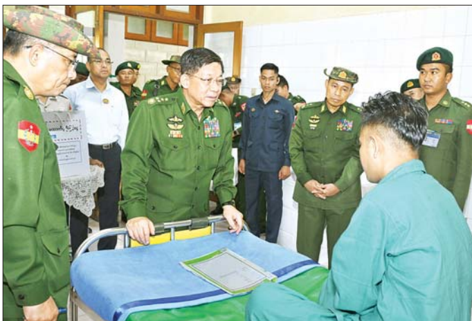
နိုင်ငံတော်စီမံအုပ်ချုပ်ရေးကောင်စီဥက္ကဋ္ဌ တပ်မတော်ကာကွယ်ရေးဦးစီးချုပ် ဗိုလ်ချုပ်မှူးကြီး မင်းအောင်လှိုင် အောင်ပန်းမြို့ရှိ နယ်မြေတပ်မတော်ဆေးရုံ၌ ဆေးကုသမှုခံယူနေသည့် အရာရှိ၊ စစ်သည်များအား ရင်းနှီးနှေးကွေးစွာ မေးမြန်းအားပေးစကားပြောကြားစဉ်။

နိုင်ငံတော်၊ တပ်မတော်နှင့်လက်တွဲရှင်းလင်းတင်ပြမှုများအပေါ် နိုင်ငံတော်စီမံအုပ်ချုပ်ရေးကောင်စီဥက္ကဋ္ဌ တပ်မတော်ကာကွယ်ရေးဦးစီးချုပ်က ပြည်သူများ၏ အသက်အိုးအိမ်စည်းစိမ်များ လုံခြုံရေးအတွက် နယ်မြေတည်ငြိမ်အေးချမ်းရေးလုပ်ငန်းများကို စနစ်တကျဆောင်ရွက်နေရန်လိုကြောင်း၊ နယ်မြေတည်ငြိမ်အေးချမ်းရေးနှင့် လုံခြုံရေးလုပ်ငန်းများကို ဆောင်ရွက်ရာတွင် လုံခြုံရေးနှင့်ပတ်သက်သည့်သတင်းများ စဉ်ဆက်မပြတ်ရရှိအောင် သတင်းရယူတည်ဆောက်ပြီး ဆောင်ရွက်သွားရန်လိုကြောင်း၊ အများပြည်သူများ သွားလာလျက်ရှိသည့် လမ်းတံတားများ ထိခိုက်ပျက်စီးမှုများ မရှိအောင် ဆောင်ရွက်နေရန်လိုကြောင်း၊ အလားတူ နယ်မြေဖွံ့ဖြိုးတိုးတက်ရေး လုပ်ငန်းများကိုလည်း ဆောင်ရွက်ပေးရမည်ဖြစ်ကြောင်း၊ ပအိုဝ်းကိုယ်ပိုင်အုပ်ချုပ်ခွင့်ရဒေသအနေဖြင့် ယခင်ကတည်းကပင် ငြိမ်းချမ်းရေးရယူခဲ့ပြီး ဒေသတည်ငြိမ်အေးချမ်းမှုများကို နိုင်ငံတော်၊ တပ်မတော်နှင့်လက်တွဲ၍ ဆောင်ရွက်နေခြင်းဖြစ်ကြောင်း၊ ၎င်းတို့၏ ဒေသများ