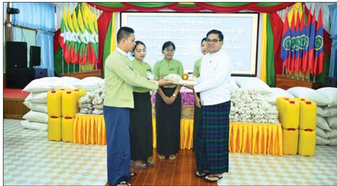
ပြည်နယ်ဝန်ကြီးချုပ် ဦးခက်ထိန်နန် ကချင်ပြည်နယ်အတွင်း တာဝန်ထမ်းဆောင်နေသော ဝန်ထမ်းများအတွက် အခြေခံစားသောက်ကုန်များ ထောက်ပံ့ပေးအပ်စဉ်။

အခမ်းအနားတွင် ပြည်နယ်ဝန်ကြီးချုပ် ဦးခက်ထိန်နန်က ယခုအချိန်ကာလသည် ဒေသအခြေအနေအရ မော်တော်ယာဉ်လမ်းများပိတ်ပြီး ကုန်ဈေးနှုန်းမြင့်မားနေချိန်ဖြစ်သည့်အတွက် ဝန်ထမ်းများတစ်ဖက်တစ်လမ်းက အထောက်အကူဖြစ်စေရေး၊ ဝန်ထမ်းများအနေဖြင့် နေ့မအား၊ ညမအား အားကြီးမာန်တက်တာဝန်သိသိ၊ သစ္စာရှိရှိဖြင့် အလုပ်ကြိုးစားဆောင်ရွက်မှုကိုလည်း အသိအမှတ်ပြုသည့်အနေဖြင့် ထောက်ပံ့မှုများ ဆောင်ရွက်ပေးခြင်းဖြစ်ကြောင်း၊ ဝန်ထမ်းများအနေဖြင့် လုပ်ငန်းခွင်အတွင်း အချင်းချင်း ချစ်ခင်စည်းလုံးစွာ၊ ပျော်ရွှင်စွာဖြင့် ယခုထက်ပိုပြီး မိမိတို့၏ လုပ်ငန်းတာဝန်များကို ကြိုးစားထမ်းဆောင်ကြရန် လိုအပ်ကြောင်း တိုက်တွန်းအားပေးသည်။