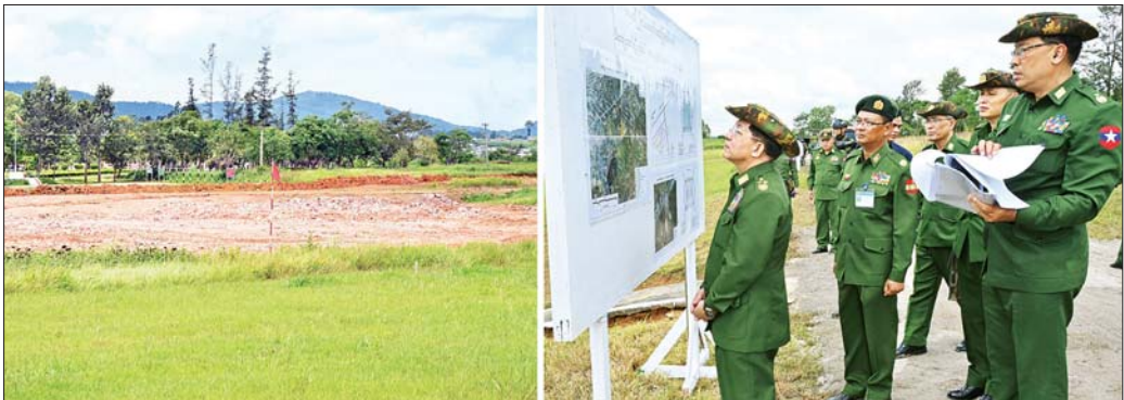
နိုင်ငံတော်စီမံအုပ်ချုပ်ရေးကောင်စီဥက္ကဋ္ဌ တပ်မတော်ကာကွယ်ရေးဦးစီးချုပ် ဗိုလ်ချုပ်မှူးကြီး မင်းအောင်လှိုင် ဆေးရုံအတွင်း မိတာ(၄၀၀)ပြေးလမ်းပါဘောလုံးကွင်း တည်ဆောက်ရန် ဆောင်ရွက်နေမှုအခြေအနေများကို ကြည့်ရှုစစ်ဆေးပြီး လိုအပ်သည်များ လမ်းညွှန်မှာကြားစဉ်။

ဆက်လက်၍ နိုင်ငံတော်စီမံအုပ်ချုပ်ရေးကောင်စီဥက္ကဋ္ဌ တပ်မတော်ကာကွယ်ရေးဦးစီးချုပ်သည် ဆေးရုံအတွင်း မိတာ(၄၀၀)ပြေးလမ်းပါဘောလုံးကွင်းတည်ဆောက်ရန် ဆောင်ရွက်နေမှုအခြေအနေများကို ကြည့်ရှုစစ်ဆေးပြီး တာဝန်ရှိသူများ၏ တင်ပြချက်များအပေါ် လိုအပ်သည်များ လမ်းညွှန်မှာကြားခဲ့ကြောင်းသတင်းရရှိသည်။ သတင်းစဉ်