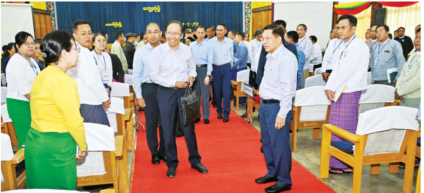
နိုင်ငံတော်စီမံအုပ်ချုပ်ရေးကောင်စီဥက္ကဋ္ဌ နိုင်ငံတော်ဝန်ကြီးချုပ် ဗိုလ်ချုပ်မှူးကြီး မင်းအောင်လှိုင် ရှမ်းပြည်နယ်အစိုးရအဖွဲ့ဝင်များ၊ ပြည်နယ်နှင့် ခရိုင်အဆင့်ဌာနဆိုင်ရာတာဝန်ရှိသူများအား ရင်းရင်းနှီးနှီး နှုတ်ဆက်စဉ်။

အဆိုပါတွေ့ဆုံပွဲသို့ နိုင်ငံတော်စီမံအုပ်ချုပ်ရေး ကောင်စီဥက္ကဋ္ဌ နိုင်ငံတော်ဝန်ကြီးချုပ်နှင့်အတူ ကောင်စီတစ်ဖက်အတွင်းရေးမှူး ဗိုလ်ချုပ်ကြီး ရဲဝင်းဦး၊ ကောင်စီဝင်များဖြစ်ကြသည့် ဒုတိယ ဗိုလ်ချုပ်ကြီး ရာပြည့်၊ ပိုးရယ်အောင်သိန်း၊ ခွန်စံလွင်၊ ပြည်ထောင်စုဝန်ကြီးများဖြစ်ကြသည့် ဒုတိယ ဗိုလ်ချုပ်ကြီး ထွန်းထွန်းနောင်၊ ဒေါက်တာသက်ခိုင် ဝင်း၊ ဦးမျိုးသန့်၊ ရှမ်းပြည်နယ်ဝန်ကြီးချုပ် ဦးအောင် အောင်၊ ကာကွယ်ရေးဦးစီးချုပ်ရှုံးမှ အဆင့်မြင့် တပ်မတော်အရာရှိကြီးများ၊ အရှေ့ပိုင်းတိုင်းစစ်ဌာန ချုပ်တိုင်းမှူး၊ ဒုတိယဝန်ကြီးများ၊ ရှမ်းပြည်နယ်အစိုးရ အဖွဲ့ဝင်များ၊ ပြည်နယ်နှင့် ခရိုင်အဆင့်ဌာနဆိုင်ရာ တာဝန်ရှိသူများ တက်ရောက်ကြသည်။