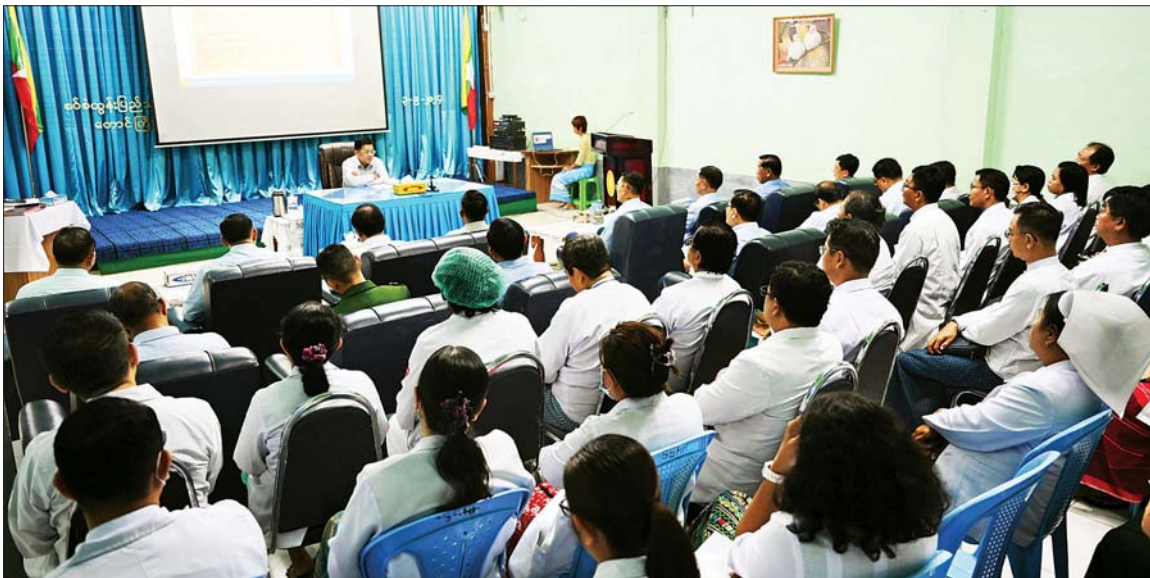
နိုင်ငံတော်စီမံအုပ်ချုပ်ရေးကောင်စီဥက္ကဋ္ဌ နိုင်ငံတော်ဝန်ကြီးချုပ် ဗိုလ်ချုပ်မှူးကြီး မင်းအောင်လှိုင် တောင်ကြီးမြို့ စစ်ထွန်းပြည်သူ့ဆေးရုံကြီးမှ ကျန်းမာရေးဝန်ထမ်းများအား တွေ့ဆုံအမှာစကားပြောကြားစဉ်။

နေပြည်တော် စက်တင်ဘာ ၃ နိုင်ငံတော်စီမံအုပ်ချုပ်ရေးကောင်စီ ဥက္ကဋ္ဌ နိုင်ငံတော်ဝန်ကြီးချုပ် ဗိုလ်ချုပ်မှူးကြီး မင်းအောင်လှိုင် သည် ခရီးစဉ်တွင် လိုက်ပါလာ သည့် အဖွဲ့ဝင်များနှင့်အတူ ယနေ့ ညနေပိုင်းတွင် ရှမ်းပြည်နယ် (တောင်ပိုင်း) တောင်ကြီးမြို့ရှိ စစ်ထွန်းပြည်သူ့ဆေးရုံကြီးသို့ သွားရောက်ကြည့်ရှု စစ်ဆေးပြီး ကျန်းမာရေး ဝန်ထမ်းများအား တွေ့ဆုံအမှာစကား ပြောကြား သည်။ ဦးစွာ နိုင်ငံတော်စီမံအုပ်ချုပ် ရေးကောင်စီ ဥက္ကဋ္ဌ နိုင်ငံတော် ဝန်ကြီးချုပ်နှင့် အဖွဲ့ဝင်များသည် စစ်ထွန်းပြည်သူ့ဆေးရုံကြီးသို့ ရောက်ရှိကြရာ ဆေးရုံအုပ်ကြီး ဒေါက်တာဝင်းမော်ဦးနှင့် ပါမောက္ခ များ၊ အထူးကုဆရာဝန်ကြီးများနှင့် သူနာပြုများက ကြိုဆိုနှုတ်ဆက် ကြသည်။