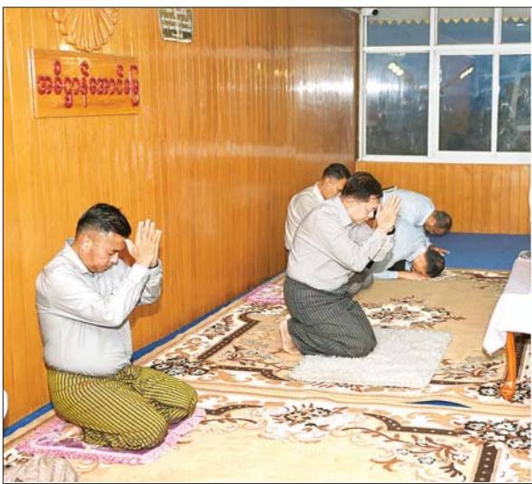
နိုင်ငံတော်စီမံအုပ်ချုပ်ရေးကောင်စီဥက္ကဋ္ဌ နိုင်ငံတော်ဝန်ကြီးချုပ် ဗိုလ်ချုပ်မှူးကြီး မင်းအောင်လှိုင် တောင်ကြီးမြို့ ကျက်သရေဆောင် ရွှေဘုန်းပွင့်စေတီတော် မြတ်ကြီးအား ဖူးမြော်ကြည့်ညှိစဉ်။