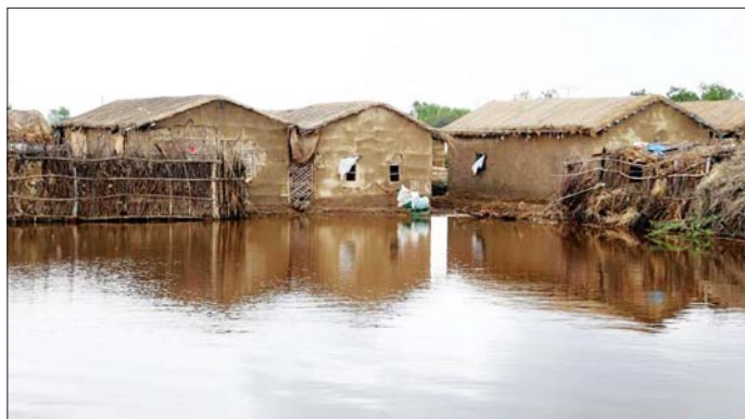
ပါကစ္စတန်နိုင်ငံတောင်ပိုင်း ဆင်းဒါပြည်နယ် ဒါဒရရိုင်ရှိ ရေကြီးနှစ်မြုပ်မှုဖြစ်ပွားသော နေရာတစ်ခုကို စက်တင်ဘာ ၂ ရက်က တွေ့ရစဉ်။