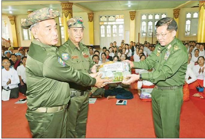
နိုင်ငံတော်စီမံအုပ်ချုပ်ရေးကောင်စီဥက္ကဋ္ဌ နိုင်ငံတော်ဝန်ကြီးချုပ် ဗိုလ်ချုပ်မှူးကြီး မင်းအောင်လှိုင် ပြည်သူ့စစ်(ဌာန)တပ်ဖွဲ့ဝင်များအတွက် စားသောက်ဖွယ်ရာများနှင့် ထောက်ပံ့ရေးပစ္စည်းများ ပေးအပ်စဉ်။

များကို လုပ်ဆောင်ခဲ့ခြင်းကြောင့် ဒေသတွင်း တည်ငြိမ်အေးချမ်းမှုပျက်ပြားခဲ့ပြီး ဒေသခံပြည်သူ များ၏ လူမှုစီးပွားဘဝများ ထိခိုက်ဆုံးရှုံးခဲ့ရသည်။ ထို့ကြောင့် PNLO အကြမ်းဖက်အဖွဲ့၏ မိမိလူမျိုးချင်း အပေါ် သစ္စာမဲ့စွာလုပ်ဆောင်ခဲ့သည့် အကြမ်းဖက် လုပ်ရပ်များအပေါ် မည်သို့မျှလက်ခံနိုင်ခြင်း မရှိသဖြင့် ဆီဆိုင်မြို့ပတ်ဝန်းကျင်ရှိ ကျေးရွာများမှ ပအိုဝ်း တိုင်းရင်းသားများအနေဖြင့် ရွာလုံးကျွတ်နိုးပါး အင်အားစုစည်း၍ တပ်မတော်၊ ပြည်သူ့စစ်(ဌာန) တပ်ဖွဲ့ဝင်များနှင့်ပူးပေါင်းလက်တွဲပြီး အကြမ်းဖက် ပူးပေါင်းအဖွဲ့များ၏လက်မှ ဆီဆိုင်ဒေသကို အမြန် ဆုံးပြန်လည်ရယူ ထိန်းချုပ်နိုင်ခဲ့ခြင်းဖြစ်ပြီး နိုင်ငံတော်အစိုးရနှင့် တပ်မတော်အနေဖြင့် ဆီဆိုင် ဒေသ ပြန်လည်ထူထောင်ရေးလုပ်ငန်းများကို ဆောင်ရွက်ပေးလျက်ရှိကာ အကြမ်းဖက်ဖြစ်စဉ်များ ကြောင့် ယာယီနေရပ်စွန့်ခွာနေထိုင်ရလျက်ရှိသည့် ဒေသခံတိုင်းရင်းသားပြည်သူများ အနေဖြင့်လည်း ပြန်လည်ဝင်ရောက်နေထိုင်၍ အေးချမ်းစွာဖြင့် နေထိုင်လုပ်ကိုင်လျက်ရှိကြောင်း သတင်းရရှိသည်။ သတင်းစဉ်