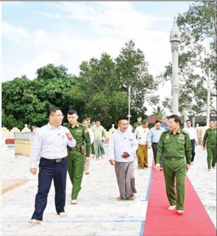
နိုင်ငံတော်စီမံအုပ်ချုပ်ရေးကောင်စီဥက္ကဋ္ဌ နိုင်ငံတော်ဝန်ကြီးချုပ် ဗိုလ်ချုပ်မှူးကြီး မင်းအောင်လှိုင် လှိုင်ကော်မြို့ကျက်သရေဆောင် သမိုင်းဝင် ဆုတောင်းပြည့် မြို့နယ်ရွှေစေတီတော်မြတ်ကြီးအား လက်ယာရစ်လှည့်လည် ဖူးမြော်ကြည့်ညိစဉ်။

ရေးကောင်စီဥက္ကဋ္ဌ နိုင်ငံတော်ဝန်ကြီးချုပ်က ပြည်နယ်၏မြို့တော်ရှိ ဈေးဖြစ်သဖြင့် တည်ဆောက် ရာတွင် အဆင့်မီသည့် ဈေးကြီးတစ်ခုအဖြစ် တည်ဆောက်နိုင်ရေး စနစ်တကျ ဒီဇိုင်းရေးဆွဲ တည်ဆောက်သွားရန်လိုကြောင်း၊ ဆိုင်ခန်းများ၊ ကားရပ်နားရန်နေရာများ စနစ်တကျတည်ဆောက် ရန်နှင့် ရေပေးဝေမှုစနစ်များ၊ အမှိုက်စွန့်ပစ်မှုစနစ်များ စနစ်တကျရှိစေရေး ကြိုတင်တွက်ချက်ဆောင်ရွက် သွားရန်နှင့်အခြားလိုအပ်သည်များကို လမ်းညွှန် မှာကြားသည်။