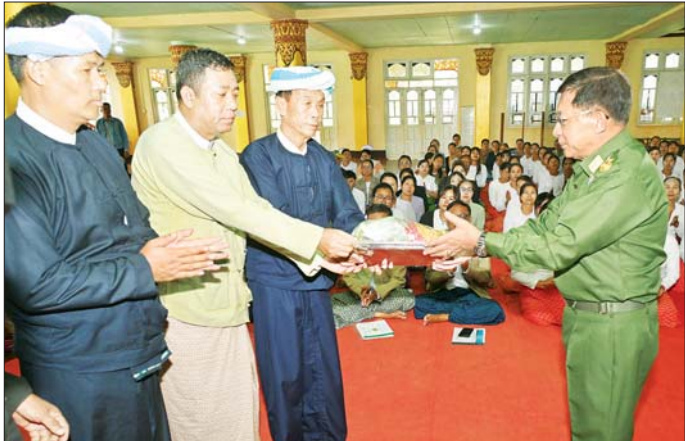
နိုင်ငံတော်စီမံအုပ်ချုပ်ရေးကောင်စီဥက္ကဋ္ဌ နိုင်ငံတော်ဝန်ကြီးချုပ် ဗိုလ်ချုပ်မှူးကြီး မင်းအောင်လှိုင် နယ်မြေခံတပ်မတော်သားများနှင့် မိသားစုဝင်များ၊ ဒေသခံပြည်သူများအတွက် စားသောက်ဖွယ်ရာများနှင့် ထောက်ပံ့ရေးပစ္စည်းများ ပေးအပ်စဉ်။