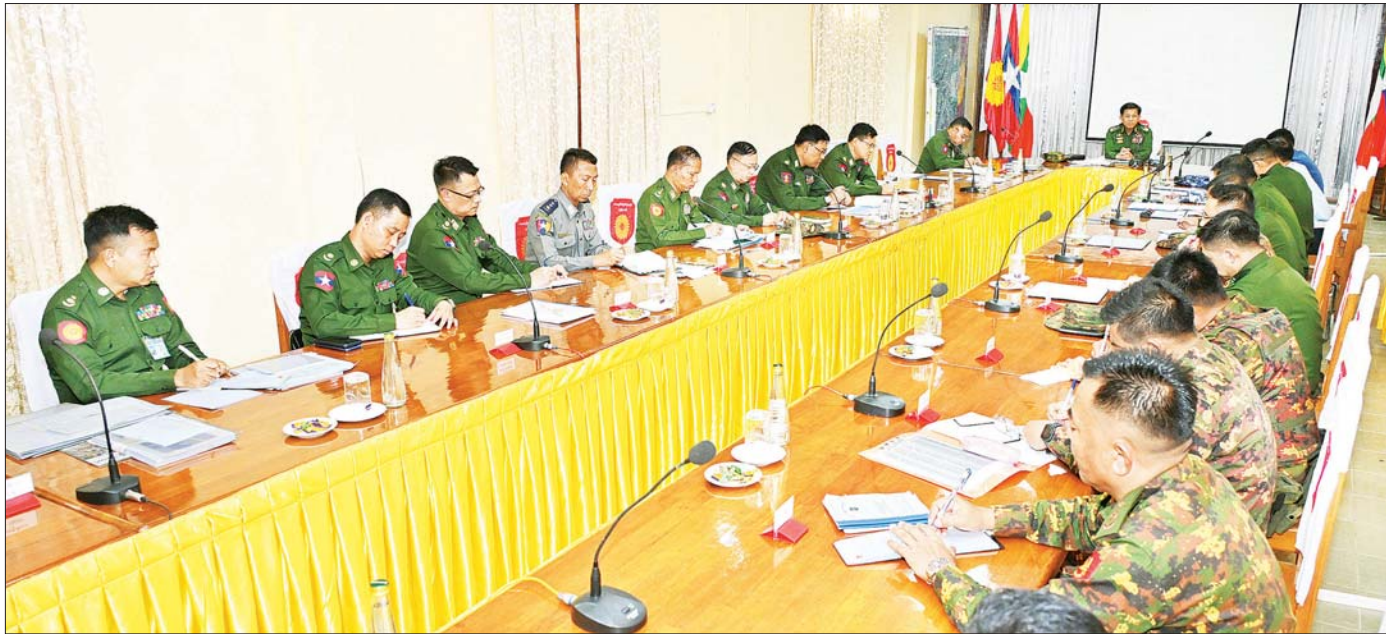
နိုင်ငံတော်စီမံအုပ်ချုပ်ရေးကောင်စီဥက္ကဋ္ဌ တပ်မတော်ကာကွယ်ရေးဦးစီးချုပ် ဗိုလ်ချုပ်မှူးကြီး မင်းအောင်လှိုင် ဒေသကွပ်ကဲမှုစစ်ဌာနချုပ်(လွိုင်ကော်)နယ်မြေအတွင်း နယ်မြေဒေသလုံခြုံရေးနှင့် တည်ငြိမ်အေးချမ်းရေး ဆိုင်ရာများနှင့်ပတ်သက်၍ လိုအပ်သည်များကို လမ်းညွှန်မှာကြားစဉ်။