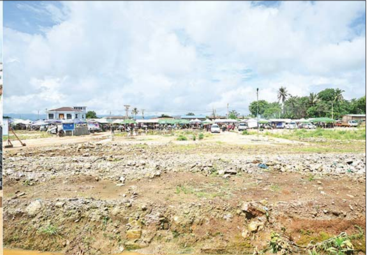
နိုင်ငံတော်စီမံအုပ်ချုပ်ရေးကောင်စီဥက္ကဋ္ဌ နိုင်ငံတော်ဝန်ကြီးချုပ် ဗိုလ်ချုပ်မှူးကြီး မင်းအောင်လှိုင် ဆီဆိုင်မြို့၌ အသစ်ပြန်လည်တည်ဆောက်မည့် မြို့မဈေးနေရာကို ကြည့်ရှုစစ်ဆေးစဉ်။