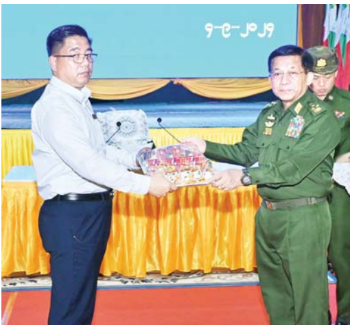
နိုင်ငံတော်စီမံအုပ်ချုပ်ရေးကောင်စီဥက္ကဋ္ဌ နိုင်ငံတော်ဝန်ကြီးချုပ် ဗိုလ်ချုပ်မှူးကြီး မင်းအောင်လှိုင် ကယားပြည်နယ်အစိုးရအဖွဲ့ဝင်များ၊ ယာယီနေရပ်စွန့်ခွာပြည်သူများအတွက် စားသောက်ဖွယ်ရာပစ္စည်းများကို ပြည်နယ်ဝန်ကြီးချုပ်နှင့် တာဝန်ရှိသူများထံ ပေးအပ်စဉ်။

နေပြည်တော် စက်တင်ဘာ ၄ နိုင်ငံတော်စီမံအုပ်ချုပ်ရေးကောင်စီဥက္ကဋ္ဌ နိုင်ငံတော်ဝန်ကြီးချုပ် ဗိုလ်ချုပ်မှူးကြီး မင်းအောင်လှိုင်သည် ယနေ့မနက် ၈ နာရီခွဲတွင် ကယားပြည်နယ်အစိုးရအဖွဲ့ဝင်များ၊ ပြည်နယ်အဆင့် ဌာနဆိုင်ရာတာဝန်ရှိသူများ၊ မြို့မိမြို့ဖများနှင့် ဒေသခံပြည်သူများအား ကယားပြည်နယ်အစိုးရအဖွဲ့ရုံး၌တွေ့ဆုံ၍ ဒေသဖွံ့ဖြိုးတိုးတက်ရေးဆိုင်ရာများ ဆွေးနွေးပြောကြားသည်။ အဆိုပါတွေ့ဆုံပွဲသို့ နိုင်ငံတော်စီမံအုပ်ချုပ်ရေးကောင်စီဥက္ကဋ္ဌ နိုင်ငံတော်ဝန်ကြီးချုပ်နှင့်အတူ ကောင်စီတွဲဖက်အတွင်းရေးမှူး ဗိုလ်ချုပ်ကြီး ရဲဝင်းဦး၊ ကောင်စီဝင်များဖြစ်ကြသည့် ဒုတိယဗိုလ်ချုပ်ကြီး ရာပြည့်၊ ပိုးရယ်အောင်သိန်း၊ ခွန်စံလွင်၊ ပြည်ထောင်စုဝန်ကြီးများဖြစ်ကြသည့် ဒုတိယဗိုလ်ချုပ်ကြီး ထွန်းထွန်းနောင်၊ ဒေါက်တာ သက်ခိုင်ဝင်း၊ ဦးမျိုးသန့်၊ ကယားပြည်နယ်ဝန်ကြီးချုပ် ဦးစောမျိုးတင်၊ ကာကွယ်ရေးဦးစီးချုပ်မှူးမှ အဆင့်မြင့်တပ်မတော်အရာရှိကြီးများ၊ အရှေ့ပိုင်းတိုင်းစစ်ဌာနချုပ်တိုင်းမှူး၊ ဒုတိယဝန်ကြီးများ၊ ကယားပြည်နယ်အစိုးရအဖွဲ့ဝင်များ၊ ပြည်နယ်အဆင့် ဌာနဆိုင်ရာတာဝန်ရှိသူများ၊ မြို့မိမြို့ဖများနှင့် ဒေသခံပြည်သူများ တက်ရောက်ကြသည်။ ဒေသဆိုင်ရာအချက်အလက်များနှင့် ဒေသဖွံ့ဖြိုးတိုးတက်ရေးဆောင်ရွက်ရေးများအား ရှင်းလင်းတင်ပြ ဦးစွာ ပြည်နယ်ဝန်ကြီးချုပ်က ဒေသဆိုင်ရာအချက်အလက်များ၊ လှိုင်ကော်မြို့အတွင်း ယာယီနေရပ်စွန့်ခွာပြည်သူများ ပြန်လည်ဝင်ရောက်နေထိုင်လျက်ရှိမှု၊ လူနေရပ်ကွက်များအတွင်း မိုင်းရှင်းလင်းရေးလုပ်ငန်းများ ဆောင်ရွက်လျက်ရှိမှု၊ စိုက်ပျိုးမွေးမြူရေးလုပ်ငန်းများ ဆောင်ရွက်လျက်ရှိမှု၊ နှစ်ရပ်ပြင်များစိုက်ပျိုးထားရှိမှု၊ ဒေသတွင်း ဆန်နှင့်ဆီဖူလုံမှု၊ သီးနှံစိုက်ပျိုးမှုများ အထွက်နှုန်းတိုးတက်ရေးဆောင်ရွက်လျက်ရှိမှု၊ နိုင်ငံ့စီးပွားဖြစ်တင်ရေး