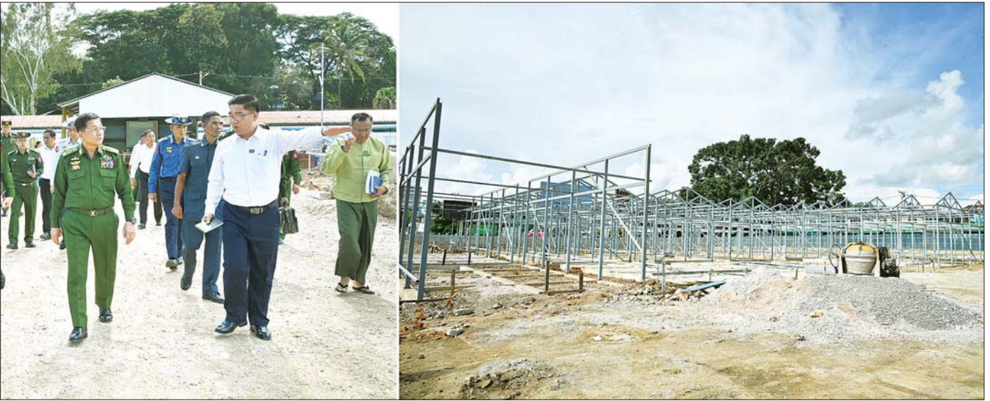
နိုင်ငံတော်စီမံအုပ်ချုပ်ရေးကောင်စီဥက္ကဋ္ဌ နိုင်ငံတော်ဝန်ကြီးချုပ် ဗိုလ်ချုပ်မှူးကြီး မင်းအောင်လှိုင် အကြမ်းဖက်သမားများ၏ အကြမ်းဖက်လုပ်ရပ်များကြောင့် ပျက်စီးခဲ့ရသည့် လျှင်ကော်မြို့သီရိမင်္ဂလာဈေးအား အဆင့်မြှင့်သိရီမင်္ဂလာဈေးအသစ်အဖြစ် တည်ဆောက်နေမှုအခြေအနေအား ကြည့်ရှုစစ်ဆေးစဉ်။

စာမျက်နှာ ၇ မှ တိုက်ခိုက်သည့်လုပ်ရပ်ဖြစ်သဖြင့် ဆိုးရွားသည့် လုပ်ရပ်များပင်ဖြစ်ကြောင်း၊ ဒေသတစ်ခုဖွံ့ဖြိုး တိုးတက်ရေး၊ တည်ငြိမ်အေးချမ်းရေးအတွက် ၎င်းဒေသတွင် နေထိုင်သူများကပင် လုပ်ဆောင်ကြခြင်းဖြစ်ပြီး ဒေသ၏ ဖွံ့ဖြိုးတိုးတက်မှုနောက်ကျစေရန်နှင့် တည်ငြိမ်အေးချမ်းမှု ပျက်ပြားစေရန် လုပ်ဆောင်သည်မှာလည်း ဒေသခံများပင်ဖြစ်ကြောင်း၊ ထိုသို့အကြမ်းဖက်တိုက်ခိုက်မှုများ လုပ်ဆောင်ခြင်းသည် နိုင်ငံရေးအရ ရင့်ကျက်မှုမရှိခြင်းပင်ဖြစ်ကြောင်း။