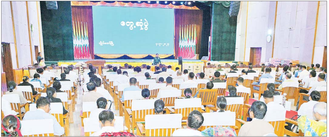
နိုင်ငံတော်စီမံအုပ်ချုပ်ရေးကောင်စီဥက္ကဋ္ဌ နိုင်ငံတော်ဝန်ကြီးချုပ် ဗိုလ်ချုပ်မှူးကြီး မင်းအောင်လှိုင် ကယားပြည်နယ်အစိုးရအဖွဲ့ဝင်များ၊ ပြည်နယ်အဆင့် ဌာနဆိုင်ရာတာဝန်ရှိသူများ၊ မြို့မိမြို့ဖများနှင့် ဒေသခံပြည်သူများအား တွေ့ဆုံအမှာစကားပြောကြားစဉ်။