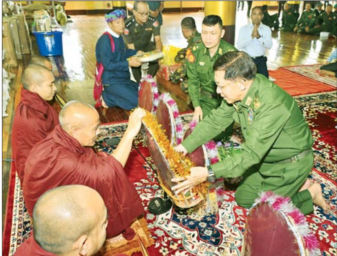
နိုင်ငံတော်စီမံအုပ်ချုပ်ရေးကောင်စီဥက္ကဋ္ဌ နိုင်ငံတော်ဝန်ကြီးချုပ် ဗိုလ်ချုပ်မှူးကြီး မင်းအောင်လှိုင် ဇနကာမကျောင်းတိုက် လက်ထောက်ကျောင်းထိုင်ဆရာတော် ဘဒ္ဒန္တပညာသီလထံ လှူဖွယ်ပစ္စည်းများ ဆက်ကပ်လှူဒါန်းစဉ်။

တည်ငြိမ်အေးချမ်းရေး၊ တရားဥပဒေစိုးမိုးရေးနှင့် ဖွံ့ဖြိုးတိုးတက်ရေးလုပ်ငန်းများကို ဒေသတွင်တာဝန် ထမ်းဆောင်လျက်ရှိသည့် ဌာနဆိုင်ရာဝန်ထမ်းများ၊ အုပ်ချုပ်ရေးအဖွဲ့အစည်းများ၊ လုံခြုံရေးတပ်ဖွဲ့ဝင် များဖြင့် အတူတကွ ဝိုင်းဝန်းဖော်ဆောင်ကြရမည် ဖြစ်ကြောင်း၊ ဒေသ၏အကျိုးကို အမြင်ကျယ်ကျယ် ဖြင့်ကြည့်၍ အသိဉာဏ်ပွင့်လင်းပြီး အပြုသဘော ဆောင်သည့်လုပ်ဆောင်မှုများဖြင့် ဖော်ဆောင်ကြရန် လိုကြောင်း။ ဖွံ့ဖြိုးတိုးတက်ရေးကိုဖော်ဆောင် ဌာနဆိုင်ရာဝန်ထမ်းများအနေဖြင့်လည်း မိမိတို့ တာဝန်ထမ်းဆောင်နေရသည့် ဒေသ၏ပညာရေး၊ ကျန်းမာရေးအပါအဝင် လူမှုစီးပွားဘဝများ ဖွံ့ဖြိုး တိုးတက်ရေးကို ဖော်ဆောင်ပေးရန်လိုကြောင်း၊ အသိပညာ၊ အတတ်ပညာများ ဖွံ့ဖြိုးတိုးတက်မှုသာ လျှင် ဒေသဖွံ့ဖြိုးတိုးတက်မှုကို ပိုမိုဆောင်ရွက်နိုင် မည်ဖြစ်သဖြင့်ဒေသခံများ ပညာရေးကို အားပေး ကြစေရေး ဆောင်ရွက်ပေးရမည်ဖြစ်ပြီး ဒေသ၏ အနာဂတ်ကောင်းမွန်အောင် ဆောင်ရွက်ပေးရမည် ဖြစ်ကြောင်း၊ အကြမ်းဖက်သမားများ၏ အကြမ်းဖက် လုပ်ရပ်များကြောင့် ထိခိုက်ပျက်စီးခဲ့ရသည့် ဆီဆိုင် မြို့အပါအဝင် ပတ်ဝန်းကျင်ရှိ ကျေးရွာများ၏ ပြန်လည်ထူထောင်ရေးလုပ်ငန်းများအား နိုင်ငံတော် အစိုးရနှင့် တပ်မတော်မှတတ်စွမ်းသရွေ့ ဆောင်ရွက် ပေးသွားမည်ဖြစ်ပြီး ဒေသခံပြည်သူလူထုတို့မှလည်း ဝိုင်းဝန်းပါဝင်ဆောင်ရွက်ကြရန်လိုကြောင်း၊ ရှေ့သို့ မတိုးနိုင်ဘဲ ရပ်တန့်နေခြင်းသည် ဒေသနှင့်နိုင်ငံတော် အတွက် ဆုံးရှုံးမှုပင်ဖြစ်သဖြင့် မိမိတို့ဒေသဖွံ့ဖြိုး တိုးတက်ရေး၊ တည်ငြိမ်အေးချမ်းရေးကို ဝိုင်းဝန်း ကြိုးပမ်းဆောင်ရွက်သွားကြရန် တိုက်တွန်းမှာကြား