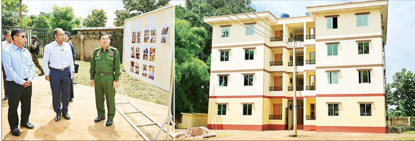
နိုင်ငံတော်စီမံအုပ်ချုပ်ရေးကောင်စီဥက္ကဋ္ဌ နိုင်ငံတော်ဝန်ကြီးချုပ် ဗိုလ်ချုပ်မှူးကြီး မင်းအောင်လှိုင် ဆီဆိုင်မြို့ရှိ ပျက်စီးခဲ့သည့် ဝန်ထမ်းအိမ်ရာများ ပြန်လည်ပြုပြင်ပြီးစီးမှုကို ကြည့်ရှုစစ်ဆေးစဉ်။