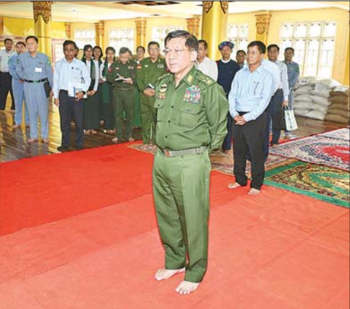
နိုင်ငံတော်စီမံအုပ်ချုပ်ရေးကောင်စီဥက္ကဋ္ဌ နိုင်ငံတော်ဝန်ကြီးချုပ် ဗိုလ်ချုပ်မှူးကြီး မင်းအောင်လှိုင် ဆီဆိုင်မြို့မှ ဌာနဆိုင်ရာတာဝန်ရှိသူများ၊ နယ်မြေခံတပ်မတော်သားများနှင့် မိသားစုဝင်များ၊ မြန်မာနိုင်ငံရဲတပ်ဖွဲ့ဝင် များ၊ ပြည်သူ့စစ်(ဌာန)တပ်ဖွဲ့ဝင်များ၊ မြို့မိမြို့ဖများနှင့် တာဝန်ရှိသူများအား ရင်းရင်းနှီးနှီး တွေ့ဆုံအမှာစကားပြောကြားစဉ်။