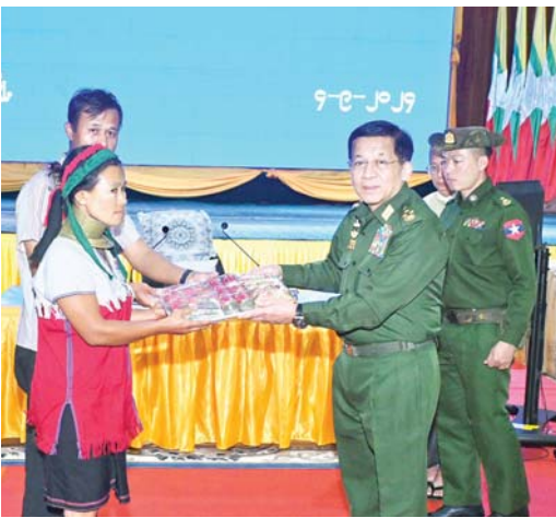
နိုင်ငံတော်စီမံအုပ်ချုပ်ရေးကောင်စီဥက္ကဋ္ဌ နိုင်ငံတော်ဝန်ကြီးချုပ် ဗိုလ်ချုပ်မှူးကြီး မင်းအောင်လှိုင် ကယားပြည်နယ်အစိုးရအဖွဲ့ဝင်များ၊ ယာယီနေရပ်စွန့်ခွာပြည်သူများအတွက် စားသောက်ဖွယ်ရာပစ္စည်းများကို ပြည်နယ်ဝန်ကြီးချုပ်နှင့် တာဝန်ရှိသူများထံ ပေးအပ်စဉ်။

ရန်ပုံငွေများထုတ်ချေးပေးထားမှု၊ လှိုင်ကော်စက်မှုဇုန် ပြန်လည်ဆောင်ရွက်လျက်ရှိမှု၊ စိုက်ပျိုးရေးလုပ်ငန်းများအတွက်လိုအပ်သည့် မြေဩဇာများနှင့် အစေ့ချက်ရှိယာများကို သက်သာသောဈေးနှုန်းများဖြင့် ရောင်းချပေးလျက်ရှိမှု၊ ပြည်သူများ၏ ကျန်းမာရေးကဏ္ဍ မြှင့်တင်ပေးနိုင်ရေး ဆောင်ရွက်လျက်ရှိမှု၊ လှိုင်ကော်မြို့ရှိ အခြေခံပညာကျောင်းများ၊ ကောလိပ်နှင့် တက္ကသိုလ်များ ပြန်လည်ဖွင့်လှစ်နိုင်ရေး ဆောင်ရွက်လျက်ရှိမှု၊ ပြန်လည်ထူထောင်ရေးလုပ်ငန်းများ ဆောင်ရွက်လျက်ရှိမှု၊ ဌာနဆိုင်ရာအဆောက်အအုံများအား ဦးစားပေးအလုပ်ပြင်ဆင်ဆောင်ရွက်ပေးလျက်ရှိမှု၊ သောက်သုံးရေးလှေလောက်စွာ ရရှိရေး စီမံဆောင်ရွက်ပေးလျက်ရှိမှု၊ ဓာတ်အားခွဲရုံများနှင့် ဓာတ်အားလှိုင်းများ ပျက်စီးခဲ့မှုနှင့် ပြန်လည်ပြင်ဆင်ရေးလုပ်ငန်းများ ဆောင်ရွက်ပေးလျက်ရှိမှု၊ လှိုင်ကော်