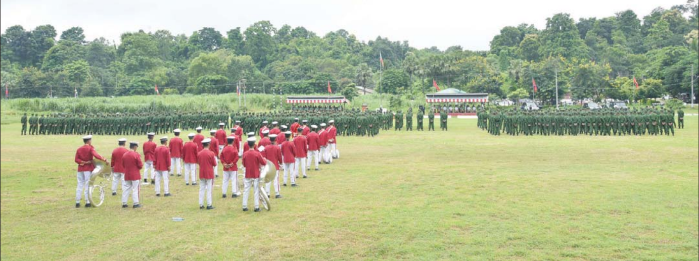
နေပြည်တော်တိုင်းစစ်ဌာနချုပ် နယ်မြေခံသင်တန်းကျောင်း၌ ပြည်သူ့စစ်မှုထမ်းသင်တန်း အမှတ်စဉ်(၅) သင်တန်းဖွင့်ပွဲ ကျင်းပစဉ်။

ဝါရီလ ၁၀ ရက်တွင် စတင်အာဏာ တည်စေခဲ့ပြီး ပြည်သူ့စစ်မှုထမ်းသင်တန်း များကို ဖွင့်လှစ်သင်ကြားပေးခဲ့သည်။ ပြည်သူ့စစ်မှုထမ်းသင်တန်း အမှတ်စဉ်(၁) ကို ၂၀၂၄ ခုနှစ်၊ ဧပြီ ၈ ရက်မှစတင်၍ ဖွင့်လှစ်သင်ကြားပေးခဲ့ရာ ယခုအခါ ပြည်သူ့စစ်မှုထမ်း သင်တန်းအမှတ်စဉ်(၅) ကို ဖွင့်လှစ်ခဲ့ခြင်းဖြစ်ပြီး သင်တန်းဆင်းခဲ့ သည့် ပြည်သူ့စစ်မှုထမ်း နိုင်ငံသားကောင်း များသည် တာဝန်ကျရာ တပ်ရင်း/တပ်ဖွဲ့ အသီးသီးတွင် နိုင်ငံတော်ကာကွယ် ရေးနှင့် စာမျက်နှာ ၉ သို့