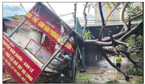
အင်န်အိတ်ချီကေ

တနင်္ဂနွေနေ့က အဆိုပါတိုင်ဖွန်းမုန်တိုင်းသည် အပူပိုင်းလေဖိအား နည်းရပ်ဝန်းအဖြစ် ပြောင်းလဲခဲ့ကြောင်း ဂျပန်မိုးလေဝသအချက်အလက် ဖော်ပြခဲ့သည်။