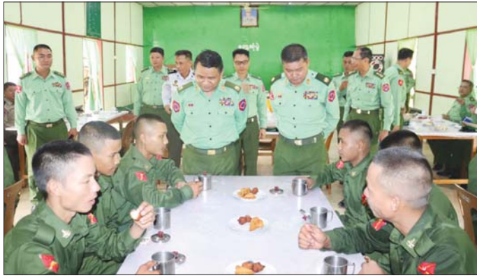
အနောက်မြောက်တိုင်းစစ်ဌာနချုပ် နယ်မြေခံသင်တန်းကျောင်း၌ သင်တန်းသားများအား တာဝန်ရှိသူများက ရင်းရင်းနှီးနှီး အားပေးစကား ပြောကြားစဉ်။