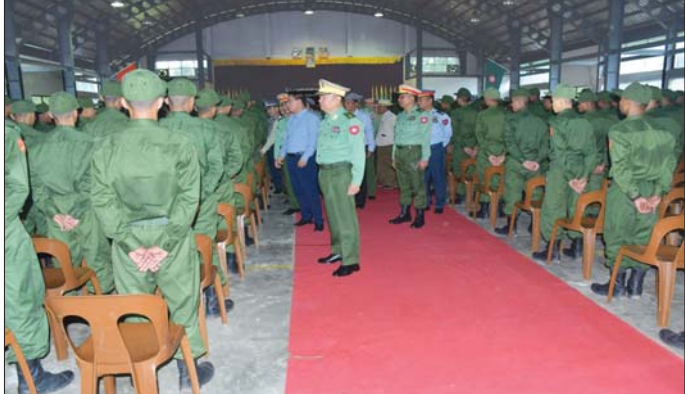
ပဲခူးတိုင်းဒေသကြီး ဝန်ကြီးချုပ် သင်တန်းသားများအား ရင်းရင်းနှီးနှီး အားပေးစကားပြောကြားစဉ်။

ပြည်သူ့စစ်မှုထမ်းသင်တန်း အမှတ်စဉ်(၅) မှ သင်တန်းသားများအား တွေ့ဆုံကာ သင်တန်းသားများအတွက် ဂုဏ်ပြုချီးမြှင့် ငွေများနှင့် ထောက်ပံ့ပစ္စည်းများ ပေးအပ် ကြပြီး သင်တန်းသားများအား ရင်းရင်း နှီးနှီး လိုက်လံနှုတ်ဆက် အားပေး