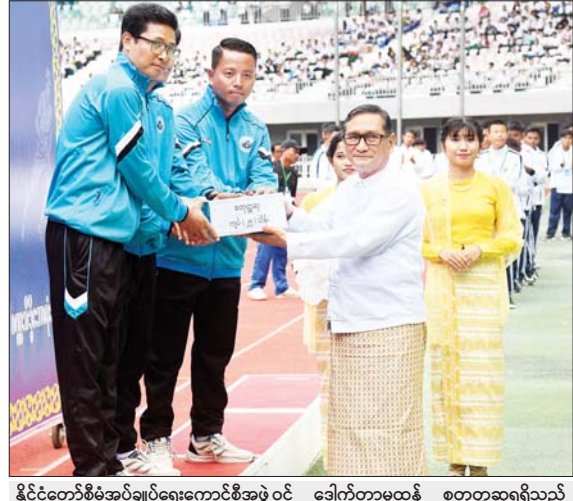
နိုင်ငံတော်စီမံအုပ်ချုပ်ရေးကောင်စီအဖွဲ့ဝင် ဒေါက်တာမူဝန် စတုတ္ထဆုရရှိသည့် သိပ္ပံနှင့်နည်းပညာဝန်ကြီးဌာန ကိုယ်စားပြုအသင်းကို တစ်ဦးချင်းဆုတံဆိပ်များနှင့် ဂုဏ်ပြုဆုငွေများ ပေးအပ်ချီးမြှင့်စဉ်။