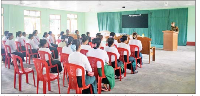
ထိုနေ့က တိုင်းမှူးနှင့် တာဝန်ရှိသူများက ဆရာ ဆရာမများအတွက် ဆန်၊ ဆီ၊ ကြက်ဥများနှင့် စားသောက်ဖွယ်ရာများကို ထောက်ပံ့ပေးအပ်ရာ ဆရာမ တစ်ဦးကလက်ခံရယူသည်။ ယင်း နောက် တိုင်းမှူးနှင့် တာဝန်ရှိသူများက ဆရာ ဆရာမများအား အတွက် ဆန်၊ ဆီ၊ ကြက်ဥ ချက်များအပေါ် လိုအပ်သည်များ ပေါင်းစပ်ညှိနှိုင်း ဆောင်ရွက်ပေးသည်။ သတင်းစဉ်

နေပြည်တော် စက်တင်ဘာ ၉ ကယားပြည်နယ် လှိုင်ကော်မြို့ နမ့်ကွတ်ရပ်ကွက် အခြေခံပညာ အထက်တန်းကျောင်း (ခွဲ) (နမ့်ကွတ်)ရှိ ဆရာ ဆရာမများအား ဆန်၊ ဆီ၊ ကြက်ဥများနှင့် စားသောက်ဖွယ်ရာများ ထောက်ပံ့ပေးအပ်ခြင်းကို ယနေ့နံနက်ပိုင်းက အဆိုပါကျောင်းရှိ အမေ့မေတ္တာအဆောင်၌ ပြုလုပ်ရာ အရှေ့ပိုင်းတိုင်း စစ်ဌာနချုပ် တိုင်းမှူး ဗိုလ်ချုပ်ဇော်မင်းလတ် နှင့် တာဝန်ရှိသူများ၊ ဆရာ ဆရာမများ တက်ရောက်ကြသည်။