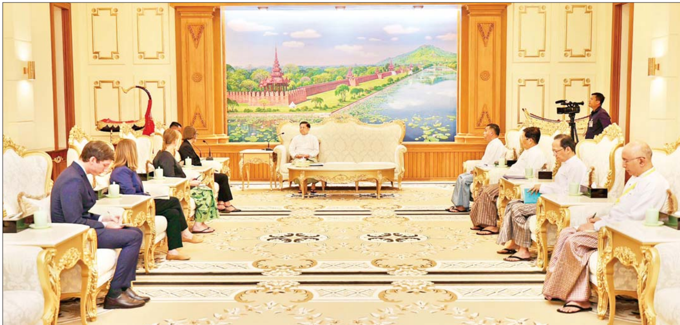
နိုင်ငံတော်စီမံအုပ်ချုပ်ရေးကောင်စီဥက္ကဋ္ဌ နိုင်ငံတော်ဝန်ကြီးချုပ် ဗိုလ်ချုပ်မှူးကြီး မင်းအောင်လှိုင် ထံ အပြည်ပြည်ဆိုင်ရာကြက်ခြေနီကော်မတီ (International Committee of the Red Cross- ICRC) ဥက္ကဋ္ဌ Ms. Mirjana Spoljaric Egger ဦးဆောင်သည့် ကိုယ်စားလှယ်အဖွဲ့ လာရောက်ဂါရဝပြုတွေ့ဆုံစဉ်။

နိုင်ငံတော်စီမံအုပ်ချုပ်ရေးကောင်စီဥက္ကဋ္ဌ နိုင်ငံတော်ဝန်ကြီးချုပ် ဗိုလ်ချုပ်မှူးကြီး မင်းအောင်လှိုင် ထံ အပြည်ပြည်ဆိုင်ရာ ကြက်ခြေနီကော်မတီ (International Committee of the Red Cross- ICRC) ဥက္ကဋ္ဌ ဦးဆောင်သည့် ကိုယ်စားလှယ်အဖွဲ့က လာရောက်ဂါရဝပြုတွေ့ဆုံ တပ်မတော်အနေဖြင့် ဂျီနီဗာကွန်ပင်းရှင်းနှင့်အညီ ဆောင်ရွက်လျက်ရှိမှုအခြေအနေများနှင့်ပတ်သက်၍ အမြင်ချင်းဖလှယ်ဆွေးနွေး