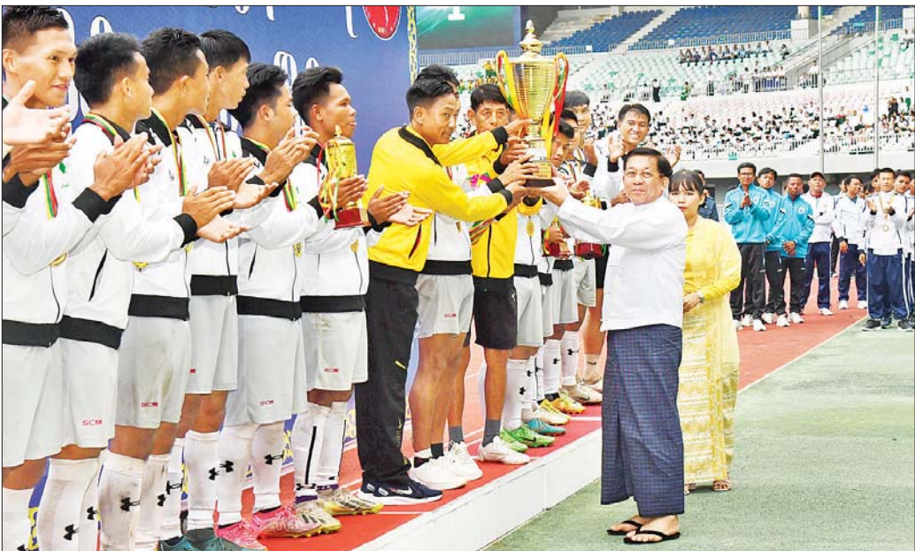
နိုင်ငံတော်စီမံအုပ်ချုပ်ရေးကောင်စီဥက္ကဋ္ဌ နိုင်ငံတော်ဝန်ကြီးချုပ် ဗိုလ်ချုပ်မှူးကြီး မင်းအောင်လှိုင် ပထမဆုရရှိသည့် နယ်စပ်ရေးရာဝန်ကြီးဌာန ကိုယ်စားပြုအသင်းအား တံခွန်စိုက်ဆုပေးပေးအပ်ချီးမြှင့်စဉ်။

နေပြည်တော် စက်တင်ဘာ ၉ ၂၀၂၄ ခုနှစ်၊ ဝန်ကြီးဌာနပေါင်းစုံ တက္ကသိုလ်များ ဘောလုံးပြိုင်ပွဲ ဗိုလ်လုပွဲနှင့် ဆုချီးမြှင့်ခြင်းအခမ်းအနားကို ယနေ့မနက်လွှဲပိုင်းတွင် နေပြည်တော်ရှိ ဝတ္ထုသိဒ္ဓိ အားကစားကွင်း၌ ကျင်းပပြုလုပ်ရာ နိုင်ငံတော်စီမံအုပ်ချုပ်ရေးကောင်စီဥက္ကဋ္ဌ နိုင်ငံတော်ဝန်ကြီးချုပ် ဗိုလ်ချုပ်မှူးကြီး မင်းအောင်လှိုင် တက်ရောက်ကြည့်ရှုအားပေးပြီး ဆုများ ပေးအပ်ချီးမြှင့်သည်။