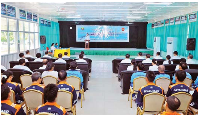
ရောရာဝန်ကြီးဌာန ညွှန်ကြားရေးမှူးချုပ်များနှင့် တာဝန်ရှိသူများ၊ မြန်မာနိုင်ငံရိုးရာခြင်းလုံးအဖွဲ့ချုပ် ဥက္ကဋ္ဌနှင့်အမှုဆောင်များ၊ သင်တန်းနည်းပြဆရာများနှင့် သင်တန်းသားများ တက်ရောက်ကြသည်။

နေပြည်တော် စက်တင်ဘာ ၉ အားကစားနှင့် လူငယ်ရေးရာ ဝန်ကြီးဌာန အားကစားနှင့်ကာယပညာဦးစီးဌာနနှင့် မြန်မာနိုင်ငံ ရိုးရာခြင်းလုံးအဖွဲ့ချုပ်တို့ ပူးပေါင်း ဖွင့်လှစ်သည့် ခြင်းလုံးနည်းပြနှင့် ဒိုင်လူကြီးသင်တန်းဖွင့်ပွဲ အခမ်းအနားကို ယနေ့နံနက် ၉ နာရီတွင် နေပြည်တော်အားကစားလေ့ကျင့်ရေးစခန်း (Gold Camp) ရှိ Multipurpose Hall ၌ ကျင်းပသည်။ အခမ်းအနားသို့ အားကစားနှင့် လူငယ်ရေးရာဝန်ကြီးဌာန ပြည်ထောင်စုဝန်ကြီး ဦးမင်းသိန်း၊ ဒုတိယဝန်ကြီးများ၊ မြန်မာနိုင်ငံ ရိုးရာခြင်းလုံးအဖွဲ့ချုပ် နာယက ဦးစိုးတင့်၊ အားကစားနှင့် လူငယ်