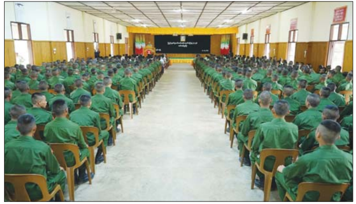
တြိဂံဒေသတိုင်းစစ်ဌာနချုပ် နယ်မြေခံသင်တန်းကျောင်း၌ဖွင့်လှစ်သည့် ပြည်သူ့စစ်မှုထမ်းသင်တန်းအမှတ်စဉ်(၅) ဖွင့်ပွဲတွင် သင်တန်းကျောင်းအုပ်ကြီးက အမှာစကားပြောကြားစဉ်။

စာမျက်နှာ ၈ မှ လုံခြုံရေးတာဝန်များကို ဦးလည်မသုန် ကျေပွန်စွာ ထမ်းဆောင်နေကြပြီ ဖြစ်သည်။ ယနေ့တွင် ဖွင့်လှစ်လိုက်သည့် ပြည်သူ့စစ်မှုထမ်းသင်တန်း အမှတ်စဉ် (၅) မှ နိုင်ငံသားကောင်းလူငယ်များအဖြစ် နိုင်ငံတော်ကာကွယ်ရေးနှင့် လုံခြုံရေး တာဝန်များကို ဂုဏ်ယူစွာထမ်းဆောင်ရန် သင်တန်းတက်ရောက်ကြမည့် သင်တန်း သားများ၏ စကားသံများကိုလည်း ယခုလို ကြားသိရသည်။ “ကျွန်တော် အမှတ်စဉ် (၅) မှာ တက်ရတဲ့ အကြောင်းရင်းက ကျွန်တော့်မှာ ရည်ရွယ်ချက်တွေ အများကြီးရှိပါတယ်။ နိုင်ငံကို ကာကွယ်ဖို့အတွက်၊ ကျွန်တော့်