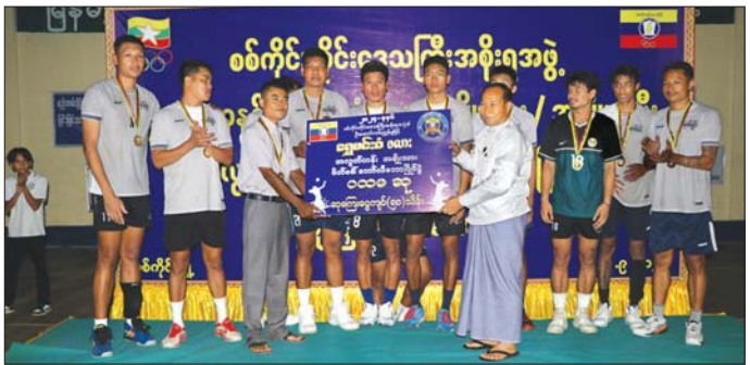
တစ်ဦးချင်းဆုတံဆိပ်၊ ဆုငွေကျပ်သိန်း ၅၀ နှင့် သမားများအား ရင်းရင်းနှီးနှီး လိုက်လံနှုတ်ဆက်ခဲ့ ဆုဖလားတို့ကို အသင်းအုပ်ချုပ်သူများနှင့် တာဝန်ကြောင်း သိရသည်။ ရှိသူများထံ ပေးအပ်ပြီး(အပေါ်ပုံ) ပြိုင်ပွဲဝင်အားကစား တိုင်းဒေသကြီး(ပြန်/ဆက်)

ကစားနေမှုများကိုလည်းကောင်း ကြည့်ရှုအားပေးကြသည်။ ဆက်လက်၍ ဆုချီးမြှင့်ပွဲအခမ်းအနားကို ကျင်းပရာ အမျိုးသမီး တတိယဆုရရှိသော အားကစားနှင့်ကာယပညာသိပ္ပံ(မန္တလေး)အသင်း၊ အမျိုးသား တတိယဆုရရှိသော လက်ပန်လှအသင်း၊ အမျိုးသမီး ဒုတိယဆုရရှိသော ပျဉ်းမနားအသင်း၊ အမျိုးသား ဒုတိယဆုရရှိသော ရွှေခြင်းလုံးအသင်းတို့ကို တိုင်းဒေသကြီးဝန်ကြီးများနှင့် တာဝန်ရှိသူများက ဆုများ ချီးမြှင့်ပေးပြီး တိုင်းဒေသကြီးလူမှုရေးရာဝန်ကြီးက အမျိုးသမီး ပထမဆုရရှိသော စစ်ကိုင်းလူငယ်အသင်းကို ဆုချီးမြှင့်ပေးသည်။ ထို့နောက် တိုင်းဒေသကြီး ဝန်ကြီးချုပ်က အမျိုးသား ပထမဆုရရှိသော ယမန်အိမ်ရှိုင်းအသင်းကို