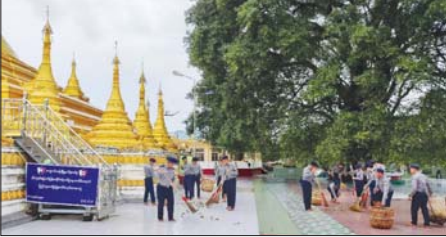
နှစ်(၆၀)ပြည့် မြန်မာနိုင်ငံရဲတပ်ဖွဲ့နေ့ကို ကြိုဆိုဂုဏ်ပြုသောအားဖြင့် ရန်ကုန်တိုင်းဒေသကြီး သန့်လျှင်ခရိုင် ကျောက်တန်းမြို့နယ် ရဲတပ်ဖွဲ့မှ ခေတ္တမြို့နယ်ရဲတပ်ဖွဲ့မှူး ဒုရဲမှူး မျိုးလှိုင် ဦးစီးရဲတပ်ဖွဲ့ဝင်များ စက်တင်ဘာ ၉ ရက်က ကျောက်တန်းမြို့ စံချိန်စီရင်ကွက် မင်းကျောင်းလမ်းမရှိ ရှေးဟောင်းသမိုင်းဝင် ကျိုက်ပြသဒိတနွဲ့ ဆုတောင်းပြည့် မင်းကျောင်းစေတီတော်ရှင်ပြင်၌ စုပေါင်းသန့်ရှင်းရေး ဆောင်ရွက်စဉ်။ (၂၀၂၄)