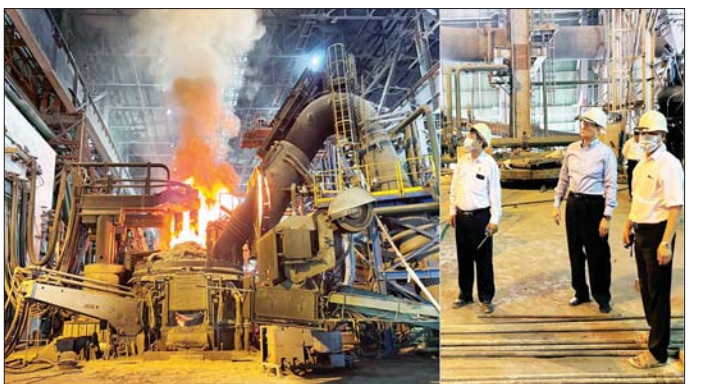
ပစ္စည်းများနှင့် စက်အရန်ပစ္စည်းများကို ကြိုတင်ဝယ်ယူပြည့်တင်းထားရန် လုပ်ငန်းဆောင်ရွက်ရန် ကင်းရှင်းရေးအတွက် ဝန်ထမ်း တစ်ဦးချင်းစီအနေဖြင့် သတ်မှတ်စည်းကမ်းများ၊ လမ်းညွှန်ချက်များနှင့်အညီ စနစ်တကျလိုက်နာမှာကြားပြီး ဝန်ထမ်းများ၏ တင်ပြချက်များကို ဖြည့်ဆည်းဆောင်ရွက်ပေးခဲ့ကြောင်း သတင်းရရှိသည်။ သတင်းစဉ်

နိုင်ရေးအတွက် ဆက်လက် ဆောင်ရွက်မည့် စီမံကိန်းလုပ်ငန်းများကို လှည့်လည်ကြည့်ရှု စစ်ဆေးသည်။ ထို့နောက် ဒုတိယဝန်ကြီးသည် စက်ရုံအစည်းအဝေးခန်းမ၌ စက်ရုံမှူး၊ တာဝန်ရှိသူများနှင့် တွေ့ဆုံ၍ အမှတ်(၁)သံမဏိစက်ရုံ (မြင်းခြံ)သည် နိုင်ငံပိုင်သံမဏိစက်ရုံဖြစ်၍ ထုတ်လုပ်သည့် သံမဏိချောင်းများ၏ အရည်အသွေးအား သတ်မှတ်စံချိန်စံညွှန်းများနှင့် ညီညွတ်မှုရှိစေ ရေးအတွက် ထုတ်လုပ်မှုနည်းစဉ် တစ်လျှောက်ရှိ စနစ်တကျ စစ်ဆေးဆောင်ရွက်ရန်နှင့် စက်ရုံမှ ထုတ်လုပ်သော လေးထောင့်ပုံ သံမဏိချောင်းများမှ တစ်ဆင့် ဆောက်လုပ်ရေး လုပ်ငန်းသုံး သံမဏိချောင်း အမျိုးမျိုး ဆက်လက် ထုတ်လုပ်သွားမည် ဖြစ်၍ အရည်အသွေးကောင်းမွန်စေရေး အလေးထားဆောင်ရွက်ရန်၊ ကုန်ထုတ်လုပ်မှုလုပ်ငန်းများ စဉ်ဆက်မပြတ် ဆောင်ရွက်နိုင်ရေးအတွက် လိုအပ်သောကုန်ကြမ်း