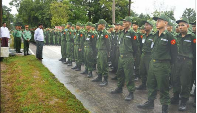
ရန်ကုန်တိုင်းဒေသကြီး ဝန်ကြီးချုပ် သင်တန်းသားများအား ရင်းရင်းနှီးနှီး အားပေးစကားပြောကြားစဉ်။