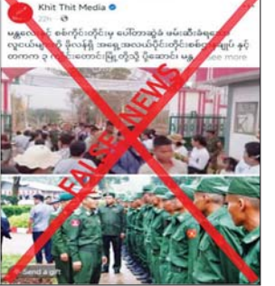
လုပ်ကြံရေးသား ဝါဒဖြန့်ဝေနေခြင်းသာ ဖြစ်ကြောင်း သတင်းရရှိသည်။ သတင်းစဉ်

အကြမ်းဖက်လုပ်ရပ်များ လုပ်ဆောင်မှုမရှိစေရေးအတွက် လိုအပ်သည့် နယ်မြေလုံခြုံရေးဆောင်ရွက်ခြင်း၊ ရှောင်တခင် စစ်ဆေးခြင်းနှင့် လှည့်ကင်း၊ ပတ်ကင်းများကို တာဝန်သိပြည်သူများနှင့် ပူးပေါင်းဆောင်ရွက်ခြင်းသာ ဖြစ်ကြောင်း၊ စစ်မှုထမ်းဆောင်ခြင်းနှင့် ပတ်သက်၍ ပြည်သူ့စစ်မှုထမ်းဥပဒေကို အတည်ပြုပြဌာန်းထားပြီး သက်ဆိုင်ရာအဖွဲ့အစည်းများမှ လုပ်ထုံးလုပ်နည်းများနှင့်အညီ ဆောင်ရွက်လျက်ရှိကြောင်းနှင့် တရားမဝင်ပြည်ပျက်မီဒီယာများက မြို့အတွင်း တည်ငြိမ်ရေးအချမ်းပျက်ပြားစေရန် ရည်ရွယ်ချက်ဖြင့် ယခုကဲ့သို့ ဓာတ်ပုံအဟောင်းများကို အသုံးပြု၍ အခြေအမြစ်မရှိသည့် သတင်းအမှားများဖြင့်