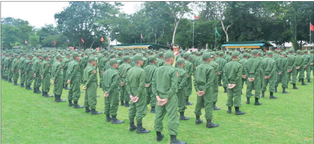
နိုင်ငံတော်ကာကွယ်ရေးနှင့် လုံခြုံရေးတာဝန်ထမ်းဆောင်နိုင်ရန်အတွက် ပြည်သူ့စစ်မှုထမ်းသင်တန်း အမှတ်စဉ်(၅) သင်တန်းဖွင့်ပွဲကို သင်တန်းကျောင်းတစ်ခု၌ ကျင်းပစဉ်။

နေပြည်တော် စက်တင်ဘာ ၉ နိုင်ငံတော်ကာကွယ်ရေးနှင့် လုံခြုံရေး တာဝန် ထမ်းဆောင်နိုင်ရန်အတွက် ပြည်သူ့စစ်မှုထမ်းသင်တန်းအမှတ်စဉ်(၅) တွင် ပါဝင်တက်ရောက်ကြမည့် အရည် အချင်းကိုက်ညီသူ နိုင်ငံသားကောင်းများ သည် သက်ဆိုင်ရာတိုင်းစစ်ဌာနချုပ် နယ်မြေများရှိသင်တန်းကျောင်းအသီးသီး သို့ ရောက်ရှိ၍ လိုအပ်သည့်ကြိုတင် ပြင်ဆင်မှုများကို ဆောင်ရွက်ခဲ့ကြပြီး ယနေ့နံနက်ပိုင်းတွင် အဆိုပါသင်တန်း ကျောင်းအသီးသီး၌ ပြည်သူ့စစ်မှုထမ်း သင်တန်းအမှတ်စဉ်(၅) သင်တန်းဖွင့်ပွဲ များ ပြုလုပ်ကြသည်။ သင်တန်းဖွင့်ပွဲများ တွင် သင်တန်းကျောင်းများအလိုက် ကျောင်းအုပ်ကြီးများက သင်တန်းဖွင့် အမှာစကားများ ပြောကြားကြသည်။ အဆိုပါ သင်တန်းဖွင့်ပွဲများသို့ နေပြည်တော်ကောင်စီဥက္ကဋ္ဌ တိုင်းဒေသ ကြီးနှင့် ပြည်နယ်ဝန်ကြီးချုပ်များ၊ တိုင်းမှူး များနှင့် တာဝန်ရှိသူများ တက်ရောက်၍