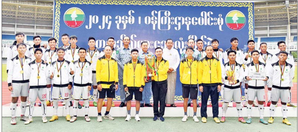
ပထမဆုရရှိသည့် နယ်စပ်ရေးရာဝန်ကြီးဌာန ကိုယ်စားပြုအသင်း တံခွန်စိုက်ဆုပေးလားနှင့်အတူ စုပေါင်းမှတ်တမ်းတင်ဓာတ်ပုံရိုက်စဉ်။

အဆိုပါ ဘောလုံးပြိုင်ပွဲတွင် နယ်စပ်ရေးရာ ဝန်ကြီးဌာန၊ စိုက်ပျိုးရေး၊ မွေးမြူရေးနှင့် ဆည်မြောင်း ဝန်ကြီးဌာန၊ သမဝါယမနှင့် ကျေးလက်ဖွံ့ဖြိုးရေး ဝန်ကြီးဌာန၊ သယ်ယူပို့ဆောင်ရေးဝန်ကြီးဌာန၊ ပညာရေးဝန်ကြီးဌာန၊ သိပ္ပံနှင့်နည်းပညာဝန်ကြီးဌာနနှင့် ကျန်းမာရေး ဝန်ကြီးဌာနတို့မှ သက်ဆိုင်ရာဝန်ကြီးဌာန ကိုယ်စားပြု တက္ကသိုလ်များ ဘောလုံးအသင်း (ခုနစ်သင်း) တို့ ပါဝင်ပြီး ဩဂုတ် ၃၁ ရက်မှ စက်တင်ဘာ ၉ ရက်အထိ ယှဉ်ပြိုင်ကစားခဲ့ကြခြင်းဖြစ်ကြောင်း သတင်းရရှိ သည်။ သတင်းစဉ်