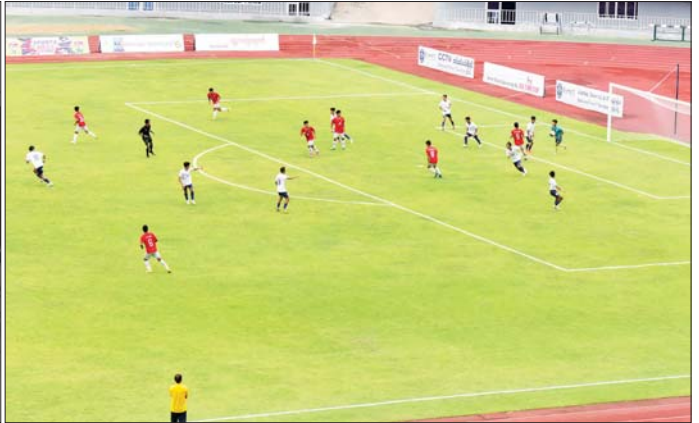
နိုင်ငံတော်စီမံအုပ်ချုပ်ရေးကောင်စီဥက္ကဋ္ဌ နိုင်ငံတော်ဝန်ကြီးချုပ် ဗိုလ်ချုပ်မှူးကြီး မင်းအောင်လှိုင်နှင့်အဖွဲ့ဝင်များ ၂၀၂၄ ခုနှစ်၊ ဝန်ကြီးဌာနပေါင်းစုံတက္ကသိုလ်များ ဘောလုံးပြိုင်ပွဲ ဗိုလ်လုပွဲအဖြစ် ပညာရေးဝန်ကြီးဌာန ကိုယ်စားပြုအသင်းနှင့် နယ်စပ်ရေးရာဝန်ကြီးဌာန ကိုယ်စားပြုအသင်းတို့ ယှဉ်ပြိုင်ကစားမှုကို ကြည့်ရှုအားပေးစဉ်။