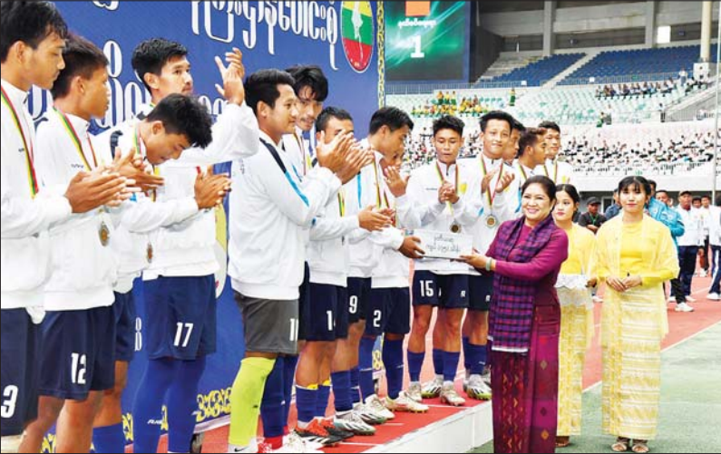
နိုင်ငံတော်စီမံအုပ်ချုပ်ရေးကောင်စီအဖွဲ့ဝင် ဒေါ်ဒိဒုတ် ဒုတိယဆုရရှိသည့် ပညာရေးဝန်ကြီးဌာန ကိုယ်စားပြုအသင်းကို တစ်ဦးချင်းဆုတံဆိပ်များနှင့် ဂုဏ်ပြုဆုငွေများ ပေးအပ်ချီးမြှင့်စဉ်။

အဆိုပါ ဗိုလ်လုပွဲသို့ နိုင်ငံတော်စီမံအုပ်ချုပ်ရေးကောင်စီ တွဲဖက်အတွင်းရေးမှူး ဗိုလ်ချုပ်ကြီး ရဲဝင်းဦး၊ ကောင်စီအဖွဲ့ဝင်များ၊ ပြည်ထောင်စုဝန်ကြီးများနှင့် ပြည်ထောင်စုအဆင့်ပုဂ္ဂိုလ်များ၊ နေပြည်တော်ကောင်စီဥက္ကဋ္ဌ၊ ကာကွယ်ရေးဦးစီးချုပ်ရုံးမှ အဆင့်မြင့်တပ်မတော်အရာရှိကြီးများ၊ နေပြည်တော်တိုင်းစစ်ဌာနချုပ်တိုင်းမှူး၊ ဒုတိယဝန်ကြီးများ၊ ဌာနဆိုင်ရာတာဝန်ရှိသူများ၊ ပြိုင်ပွဲကျင်းပရေးကော်မတီဝင်များနှင့် တာဝန်ရှိသူများ၊ ပြိုင်ပွဲဝင်အသင်းများမှ အုပ်ချုပ်သူနှင့် နည်းပြများ၊ အားကစားသမားများ၊ ဝန်ကြီးဌာနပေါင်းစုံတက္ကသိုလ်များမှ ကျောင်းသား၊ ကျောင်းသူများနှင့် ဆရာဆရာမများ၊ ဝန်ကြီးဌာနများမှ ဝန်ထမ်းမိသားစုများ၊ အားကစားဝါသနာရှင်ပြည်သူများ တက်ရောက်ကြည့်ရှုအားပေးကြသည်။ စာမျက်နှာ ၅ သို့