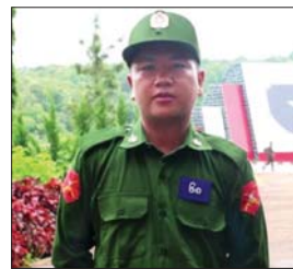
ပြည်သူ့စစ်မှုထမ်းသင်တန်း အမှတ်စဉ်(၅) သင်တန်းသားများ။

နိုင်ငံသားတိုင်း ထမ်းဆောင်သင့်တဲ့ ပြည်သူ့စစ်မှုထမ်းဖို့ နိုင်ငံတော်ကာကွယ် ဖို့ နိုင်ငံသားတစ်ယောက်အနေနဲ့ ကျေပွန် အောင်ထမ်းဆောင်ချင်လို့ ဒီသင်တန်းကို တက်ရောက်ခဲ့ပါတယ်။ အားကြီးမာန