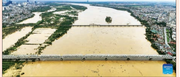
ရေမြင့်တက်မှုကြောင့် မြစ်ကမ်းပါးရေယာတစ်လျှောက် ရေကြီးရေလျှံဖြစ်ပွားမှုကို စက်တင်ဘာ ၁၀ ရက်က တွေ့ရစဉ်။

ဟန့်ရှင်း စက်တင်ဘာ ၁၁ ဗီယက်နမ်နိုင်ငံတွင် ဗုဒ္ဓဟူးနေ့ မုန်လွှဲပိုင်းအထိ တိုင်ဖွန်းမုန်တိုင်း ယာဂီနှင့်ဆက်စပ်မြေပြိုမှု၊ ရေကြီးရေလျှံမှုများကြောင့် လူပေါင်း ၁၇၉ ဦး သေဆုံးပြီး အခြား ၁၄၅ ဦး ထိခိုက်ဒဏ်ရာရရှိကြောင်း စိုက်ပျိုးရေးနှင့် ကျေးလက်ဖွံ့ဖြိုးတိုးတက်ရေးဝန်ကြီးဌာနက ထုတ်ပြန်ကြေညာသည်။ နိုင်ငံ၏ မြို့တော်ဟန့်ရှင်းရှိ မြစ်နီမြစ်၏ ရေမျက်နှာပြင်သည် စိုးရိမ်ရေအမှတ်အဆင့် (၃) အနက် အဆင့် (၂) ကို ကျော်လွန်လာပြီဖြစ်ကြောင်း၊ အမြင့်ဆုံးအဆင့်အထိ ရောက်ရှိဖွယ်ရှိကြောင်း ရေအားလျှပ်စစ်နှင့်မိုးလေဝေခန့်မှန်းချက် အမျိုးသားဗဟိုဌာန၏ ထုတ်ပြန်ချက်အရ သိရသည်။ ဆင်ဟွာ