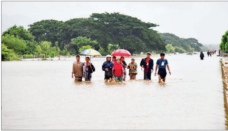
တပ်ကုန်းမြို့နယ်တွင် ရေကြီးရေလျှံမှုကြောင့် ပြည်သူများကို ရေဘေးလွတ်ရာသို့ ကူညီဆောင်ရွက်ပေးစဉ်။

ထိုသို့ မိုးအဆက်မပြတ် ရွာသွန်းမှုများကြောင့် ချောင်းရေနှင့် မြစ်ရေများ အဆက်မပြတ် မြင့်တက်လာမှုနှင့်အတူ နေပြည်တော်ကောင်စီနယ်မြေအတွင်း ရေကြီးရေလျှံမှုများဖြစ်ပေါ်ခဲ့ပြီး တပ်ကုန်းမြို့နယ်တွင် ယနေ့နံနက်ပိုင်းမှစတင်၍ ရေများမြင့်တက်လာခဲ့ကြောင်း ဘုရင့်နေောင်ရပ်ကွက်၊ အနော်ရထာရပ်ကွက်နှင့် ကျေးရွာအချို့တွင် ရေကြီးရေလျှံမှုများ ဖြစ်ပေါ်ခြင်း၊ တံတားအချို့ရေတိုက်စားပျက်စီးခြင်း၊ ရန်ကုန်-မန္တလေးလမ်းဟောင်း အချို့နေရာများတွင် ရေကျော်ခြင်းများ ဖြစ်ပေါ်လျက်ရှိသည်။