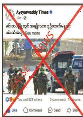
ချက်ဖြင့် ယခုကဲ့သို့ သတင်းအမှားများဖြင့် ရည်ရွယ်ချက်ရှိရှိ လုပ်ကြံရေးသား ဝါဒဖြန့်ဝေနေခြင်းသာ ဖြစ်ကြောင်း သတင်းရရှိသည်။ သတင်းစဉ်

လုပ်ဆောင်မှုမရှိစေရေးအတွက် လိုအပ်သည့် နယ်မြေလုံခြုံရေးဆောင်ရွက်ခြင်း၊ ရှောင်တခင်စစ်ဆေးခြင်းနှင့် လှည့်ကင်း/ပတ်ကင်းများကို မင်းတပ်မြို့မှ တာဝန်ရှိသူများနှင့် ပူးပေါင်းဆောင်ရွက်နေခြင်းသာ ဖြစ်ကြောင်း၊ စစ်မှုထမ်းဆောင်ခြင်းနှင့်ပတ်သက်၍ ပြည်သူ့စစ်မှုထမ်းဥပဒေကို အတည်ပြုပြဋ္ဌာန်းထားပြီး သက်ဆိုင်ရာအဖွဲ့အစည်းများမှ လုပ်ထုံးလုပ်နည်းများနှင့်အညီ ဆောင်ရွက်လျက် ရှိကြောင်း၊ တရားမဝင် ပြည်ပျက်မိဒီယာများက မင်းတပ်မြို့အတွင်း တည်ငြိမ်အေးချမ်းမှုပျက်ပြားစေရန် ရည်ရွယ်