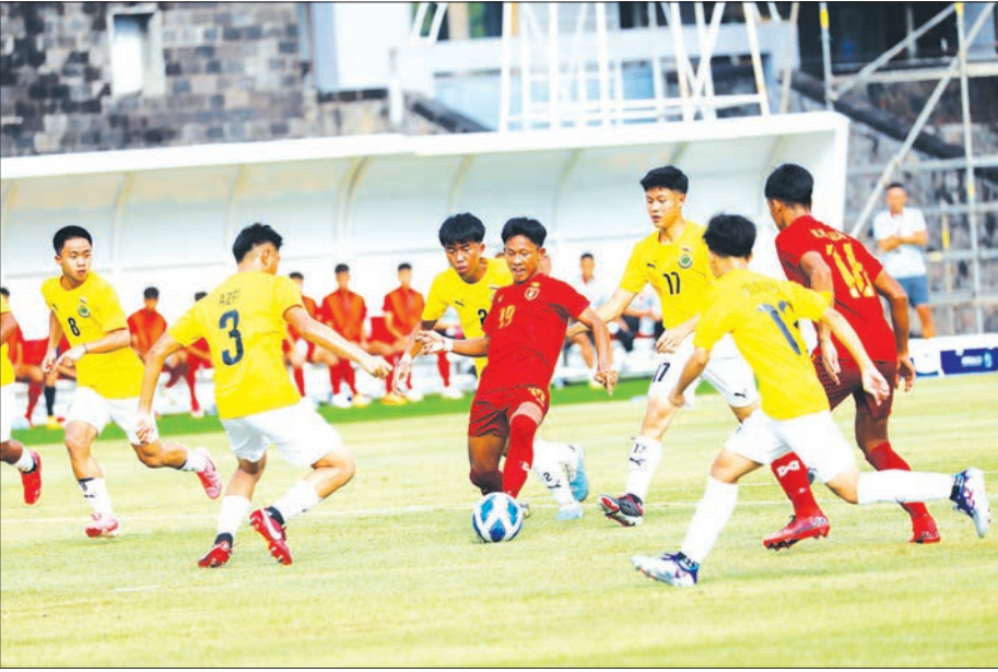
၂၀၂၄ အာဆီယံ ယူ-၁၆ ပြိုင်ပွဲတွင် မြန်မာ့လက်ရွေးစင် ယူ-၁၆ အသင်းနှင့် ဘရူနိုင်း ယူ-၁၆ အသင်း ယှဉ်ပြိုင်စဉ်။

ဘောလုံးအားကစားနည်းသည် ဘောလုံးနည်း စနစ်/နည်းပညာ Technical နှင့် ခန္ဓာကိုယ်ပိုင်း ဆိုင်ရာ Physical တို့ကို သဘာဝတရား Match ဖြစ် အောင် ပေါင်းစပ်ကစားရသော အားကစားနည်း တစ်ခု ဖြစ်သည်။ Technical ပိုင်းတွင် ဘောလုံး ကန်ခြင်း (Kicking)၊ ဘောလုံးဖမ်းခြင်း (Receiving)၊ ဘောလုံးသယ်ဆောင်ခြင်း (Dribbling)၊ ဘောလုံး