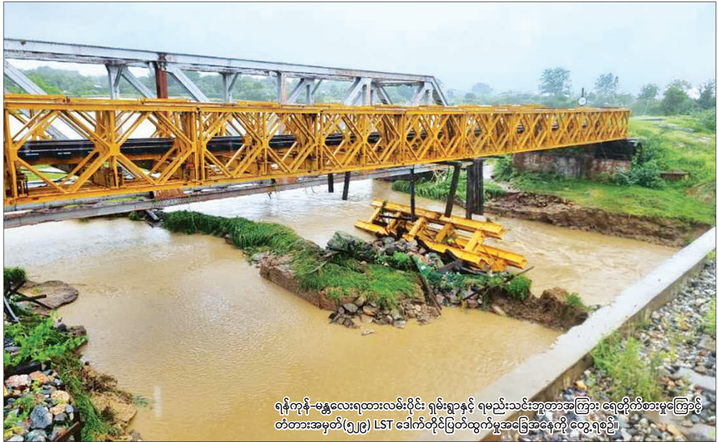
ရန်ကုန်-မန္တလေးရထားလမ်းပိုင်း ရှမ်းရွာနှင့် ရမည်းသင်းဘူတာအကြား ရေတိုက်စားမှုကြောင့် တံတားအမှတ်(၅၂၉) LST ဒေါက်တိုင်ပြတ်ထွက်မှုအခြေအနေကို တွေ့ရစဉ်။

ယခုနှစ်မိုးရာသီအတွင်း မြန်မာပြည်အနှံ့အပြား တွင် မိုးသည်းထန်စွာရွာသွန်းပြီး ရေကြီးရေလျှံမှုများ ကြောင့် ရန်ကုန်-မန္တလေးလမ်းပိုင်းရှိ တပ်ကုန်း-မကျည်းပင်၊ မကျည်းပင်-ညောင်လွန်၊ ရမည်းသင်း-အင်ကြင်းကန်၊ ပျော်ဘွယ်-ရှမ်းရွာ၊ သပြေတောင်း-သဲတောဘူတာအကြားနှင့် သာစည်-ရွှေညောင်-တောင်ကြီးလမ်းပိုင်းရှိ သာစည်-လှိုင်းတက်၊ လှိုင်းတက်-ဘုရားငါးဆူ၊ ဘုရားငါးဆူ-ယင်းမာပင်၊ မြင်းဒိုက်-ကလေး၊ ကလေး-အောင်ပန်း၊ ထီသိမ်-ပေါမူ ဘူတာအကြားလမ်းပိုင်းများနှင့် အောင်ပန်းဘူတာယာဒ်ဝင်းတို့တွင် ရေကြီးနစ်မြုပ်မှုများဖြစ်ပေါ်၍ တံတားများရေတိုက်စားပြီး ရထားလမ်းရေကျော်မှုများကြောင့် ရန်ကုန်-မန္တလေးနှင့် သာစည်-ရွှေညောင် ရထားခရီးစဉ်များကို စက်တင်ဘာ ၁၁ ရက်မှစတင်၍ ယာယီရပ်နားထားကြောင်း သတင်းရရှိသည်။