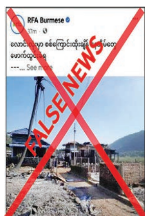
အတွက် လုပ်ကြံရေးသားပြီး ဝါဒဖြန့်ဝေနေခြင်းသာဖြစ်ကြောင်း သတင်းရရှိသည်။ သတင်းစဉ်

ချက်အရ သဘော့ဆိပ်ကျေးရွာနှင့် ပြင်ကြီးကျေးရွာတို့ကို လုံခြုံရေးတပ်ဖွဲ့ဝင်များမှ မီးရှို့ပျက်ဆီးခြင်းနှင့် အဖိုးတန်ပစ္စည်းများကို ယူဆောင်သွားသည်မှာ မှန်ကန်မှုမရှိကြောင်းနှင့် PDF အမည်ခံအကြမ်းဖက် သမားများက လောင်းလုံးမြို့နယ်ရှိ ကျေးရွာအချို့ကို မီးရှို့ပျက်ဆီးခြင်းနှင့် ပြည်သူပိုင်ပစ္စည်းများကို အဓမ္မယူဆောင်နေသည့်အတွက် လုံခြုံရေးတပ်ဖွဲ့ဝင်များက လိုအပ်သည့် နယ်မြေလုံခြုံရေး ဆောင်ရွက်လျက်ရှိသည်ကို တရားမဝင်ပြည်ပျက်မိဒီယာများက ပြည်သူများ အထင်အမြင်လွှဲမှားစေရန်