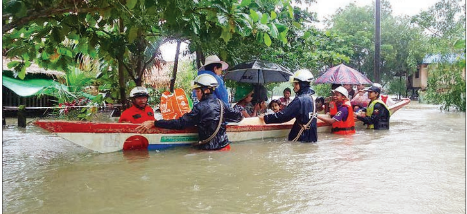
ကျိုက်ထိုမြို့နယ်တွင် ရေကြီးရေလျှံမှုကြောင့် ဒေသခံပြည်သူများကို ရေဘေးလွတ်ရာသို့ ပြောင်းရွှေ့ကူညီဆောင်ရွက်ပေးစဉ်။