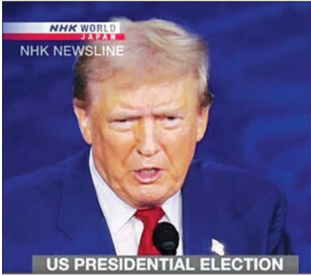
NHK WORLD NEWSLINE US PRESIDENTIAL ELECTION

ရေးရှင်းကြီးများအတွက် အခွန်ဖြတ်တောက်မှုကို ပံ့ပိုးလုပ်ဆောင်ရန်ဖြစ်ကြောင်း ဟားရစ်က ပြောကြားလိုက်သည်။ တိုင်းပြည်၏အဖျက်ရန်သူ၊ နိုင်ငံများကို ကွဲပြားစေသူဟု လူသိများသည့် ငွေကြေးဖောင်းပွမှုကြောင့် မိမိတို့တွင် အလွန်ဆိုးရွားသည့် စီးပွားရေးနှင့် ကြုံတွေ့နေရကြောင်း၊ လူနည်းစုသာ တွေ့ကြုံဖူးသည့် ကြောက်မက်ဖွယ် ငွေကြေးဖောင်းပွမှုဖြစ်ပေါ်နေကြောင်း၊ နိုင်ငံသမိုင်းတွင် အကောင်းဆုံး စီးပွားရေးကို ဖန်တီးပေးခဲ့ကြောင်း၊ ယခုလည်း ထိုသို့ အကောင်းဆုံးဖြစ်အောင် လုပ်ဆောင်သွားမည်ဖြစ်ကြောင်းနှင့် ယခင်ထက်ပင် ပိုကောင်းရမည်ဖြစ်ကြောင်း ထရမ်က ပြောကြားလိုက်သည်။ ထို့အပြင် ပြိုင်ဘက်နှစ်ဦးသည် လူဝင်မှုကြီးကြပ်ရေးတွင်လည်း သူတင်ကိုယ်တင် အပြိုင်ကြုံခဲ့ကြသည်။ အမေရိကန်သမ္မတ ဘိုင်ဒင်လက်ထက်တွင် အမေရိကန်နယ်စပ်ကို ဖြတ်ကျော်ပြီး လူတွေအလုံးအရင်းနှင့် ဝင်လာသည်ဟု ထရမ်က ပြစ်တင်ပြောကြားလိုက်သည်။ သူတို့က ရာဇဝတ်သမားတွေကို ဝင်ခွင့်ပြုခဲ့ကြောင်း၊ ရာဇဝတ်သမားတွေ အများကြီးဝင်ခွင့်ပြုခဲ့