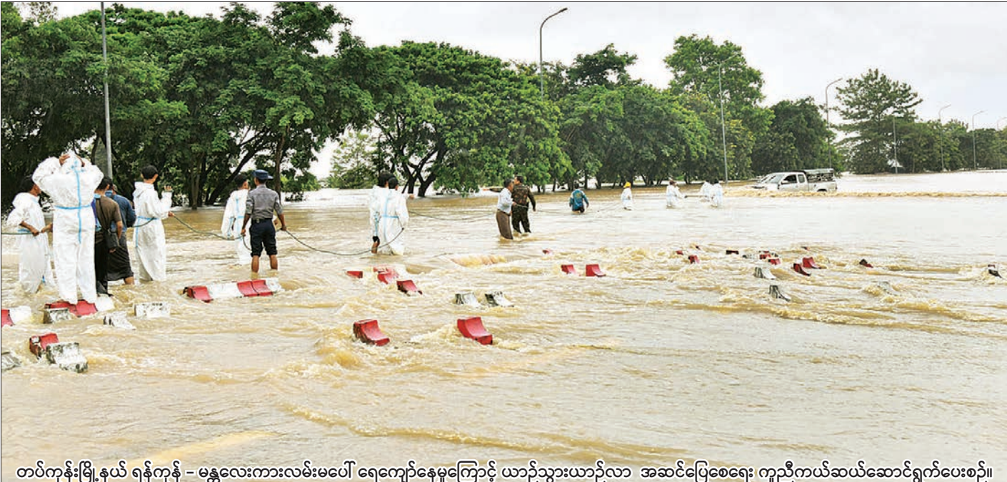
တပ်ကုန်းမြို့နယ် ရန်ကုန် - မန္တလေးကားလမ်းမပေါ် ရေကျော်နေမှုကြောင့် ယာဉ်သွားယာဉ်လာ အဆင်ပြေစေရေး ကူညီကယ်ဆယ်ဆောင်ရွက်ပေးစဉ်။