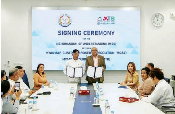
မြန်မာ့ခရီးသွားဘဏ် (MTB) နှင့် မြန်မာနိုင်ငံအကောက်ခွန် ဝန်ဆောင်မှုလုပ်ငန်းရှင်များအသင်းတို့ နားလည်မှုစာချုပ်သဘောတူစာ MoU လက်မှတ်ရေးထိုးစဉ်။

မြန်မာ့ခရီးသွားဘဏ် (Myanmar Tourism Bank) နှင့် မြန်မာနိုင်ငံ အကောက်ခွန်ဝန်ဆောင်မှု လုပ်ငန်းရှင်များအသင်း (Myanmar Customs Brokers Association - MCBA) တို့သည် နိုင်ငံအတွင်း အကောက်ခွန်ဝန်ဆောင်မှုလုပ်ငန်းရှင်များ၏ အသက်မွေးဝမ်းကျောင်း လုပ်ငန်းကို ပိုမိုမြှင့်တင်နိုင်ရန်၊ နိုင်ငံတကာအကောက်ခွန်ဝန်ဆောင်မှု လုပ်ငန်းအသင်းအဖွဲ့များနှင့် ဆက်သွယ်ပူးပေါင်းကာ အတွေ့အကြုံ၊ နည်းပညာများ ရရှိပြန့်ပွားစေရန်အတွက် ကျယ်ကျယ်ပြန့်ပြန့် နှီးနှော