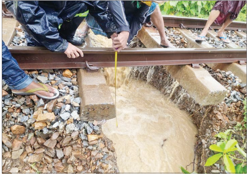
ရန်ကုန်-မန္တလေးရထားလမ်းပိုင်း ရှမ်းရွာနှင့် ပျော်ဘွယ်ဘူတာအကြား ရထားလမ်းတာပေါင်များ ရေတိုက်စားပြီး ထူးပေါက်မှုအခြေအနေ။

ပေးခဲ့သည်။ ရထားလမ်းပိုင်းအတွင်း ရေကြီးရေလျှံမှုနှင့် တံတားများ ရေထိုးမှုများဖြစ်ပေါ်လျက်ရှိပြီး ရေကျသွားသည့်အချိန်တွင် ရထားလမ်းမြေသားတာပေါင်နှင့် တံတားများအား အသေးစိတ်ကြည့်ရှုစစ်ဆေးပြီး ကြိုခိုင်ရေးလုပ်ငန်းများအား ဆက်လက်ဆောင်ရွက်သွားမည်ဖြစ်ကြောင်းနှင့် ရထားလမ်းပိုင်းနှင့် တံတားများ စစ်ဆေးပြုပြင်ပြီးပါက ရထားများ ပုံမှန်အတိုင်း ပြန်လည်ပြေးဆွဲပေးသွားမည်ဖြစ်ကြောင်း မြန်မာ့မီးရထားမှ သတင်းရရှိသည်။ သတင်းစဉ်