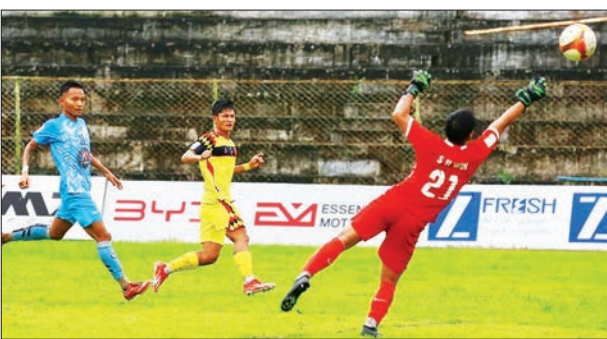
ရာမညယူနိုက်တက်နှင့် ဧရာဝတီရိန်းဂျားအသင်း ယှဉ်ပြိုင်စဉ်။

၄ ဒသမ ၂၁ လက်မ အထိရွာသွန်းခဲ့ကာ နေပြည်တော်ကောင်စီနယ်မြေအတွင်း ဖြတ်သန်းစီးဆင်းလျက်ရှိသည့် ငလိုင်ချောင်း၊ ဆင်သေချောင်းနှင့် ပေါင်းလောင်းမြစ်တို့တွင် မြစ်ရေများအဆက်မပြတ် မြင့်တက်လျက်ရှိသည်။ စာမျက်နှာ ၉ ကော်လံ ၁၀