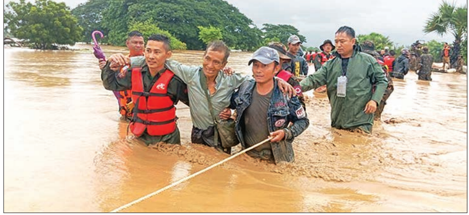
ပုဗ္ဗသီရိမြို့နယ် ဆင်တဲကြီးရွာနှင့် ဇေယျာသီရိမြို့နယ် သိုက်ချောင်းကျေးရွာသို့ ဆက်သွယ်ထားသော ကွန်ကရစ်လမ်း(မြို့ပတ်လမ်း) ရေကျော်သဖြင့် နယ်မြေခံတပ်မတော်သားများက ကူညီကယ်ဆယ်ရေးလုပ်ငန်းများ ဆောင်ရွက်ပေးစဉ်။