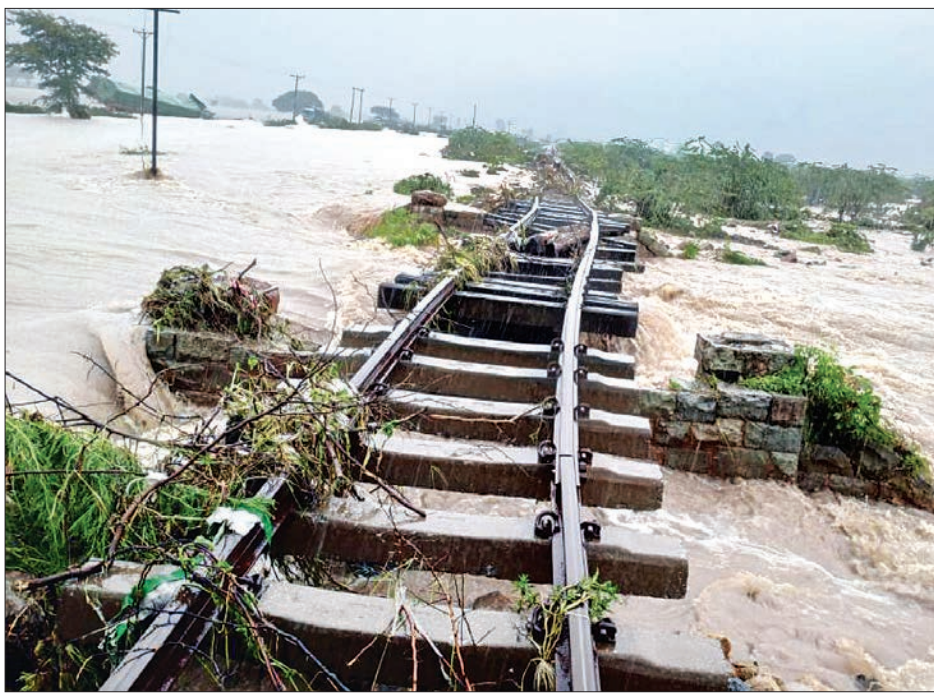
သာစည်-ရွှေညောင်လမ်းပိုင်း၊ လှိုင်းတက်နှင့်ဘုရားငါးဆူကြား တံတားရေတိုက်စားမှုအခြေအနေ။

အမှတ်(၃၄)နှင့်(၃၅)တို့၏ တံတားတာပေါင်များ ရေတိုက်စားနေခြင်း၊ ဘုရားငါးဆူ-ယင်းမာပင်ဘူတာအကြား တံတားအမှတ် (၄၈)၏ ရွှေညောင်ဘက်ကမ်းကပ်ခုံ ရေတိုက်စားခြင်းနှင့် ရထားလမ်းတာပေါင်အား ရေတိုက်စားနေခြင်း၊ ကလော-မြင်းဒိုက်ဘူတာအကြား(၆)နေရာတွင် ရထားသံလမ်းပေါ်ရေကျော်နေခြင်း၊ အောင်ပန်းဘူတာယာဒ်ဝင်းအတွင်း သံလမ်းမျက်နှာပြင်အထက် ၁၀ လက်မခန့် ရေကျော်နေခြင်းတို့ကြောင့် ယနေ့နံနက်ပိုင်းမှ စတင်၍ ရထားလမ်းပိုင်းများအား ယာယီပိတ်သိမ်းခဲ့ရသည်။ ထို့အတူ တောင်ကြီးမြို့နယ်အတွင်း စက်တင်ဘာ ၉ ရက်မှစ၍ မိုးသည်းထန်စွာ ရွာသွန်းမှုကြောင့် ရွှေညောင်-တောင်ကြီးလမ်းပိုင်း ထိသိမ်းပေါမှုဘူတာအကြား တောင်ကြီးမြို့သို့ ရေပေးဝေသည့် ထိသိမ်းကန်မှ ရေများလျှံပြီး ရထားလမ်းတူးမြောင်းတာပေါင်ရေတိုက်စားမှုကြောင့် တာပေါင်ပြိုကျပြီး ရထားလမ်းပိတ်ဆို့ခြင်းတို့ဖြစ်ပေါ်ခဲ့သည်။ ရထားလမ်းပိုင်းပိတ်သိမ်းမှုကြောင့် ယနေ့နံနက် ၆ နာရီတွင် ရန်ကုန်မှ ပုံမှန်ထွက်ခွာလာသည့် အမှတ် (၁၁)အဆန်ရထားသည် နေပြည်တော်ဘူတာသို့ ယနေ့ ညနေ ၅ နာရီ ၂၂ မိနစ်တွင် ရောက်ရှိပြီး ရထားဖြင့်လိုက်ပါလာသည့် ခရီးသည် ၁၈၈ ဦးအား နေပြည်တော်ဘူတာမှတစ်ဆင့် မန္တလေးသို့ မော်တော်ယာဉ်သုံးစီးဖြင့် ညနေ ၆ နာရီတွင် ဆက်လက်ပို့ဆောင်