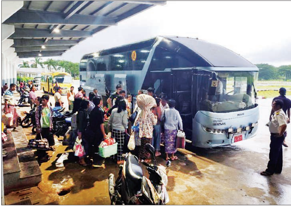
ရန်ကုန်-မန္တလေး အမှတ်(၁၁)အဆန် လူစီးအမြန်ရထားစီးခရီးသည်များအား နေပြည်တော်ဘူတာမှ မန္တလေးသို့ မော်တော်ယာဉ်များဖြင့် ပို့ဆောင်ပေးနေစဉ်။