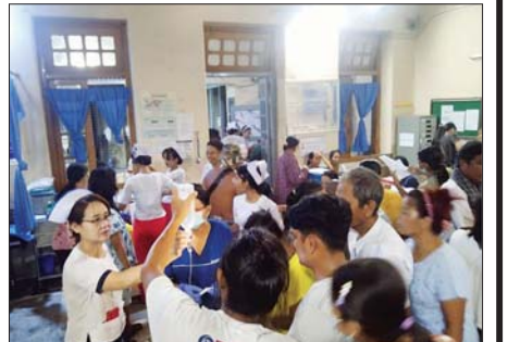
ပြည်သူ့ဆေးရုံကြီး တောင်ငူမြို့တွင် လူနာများ ဆေးကုသမှုခံယူစဉ်။