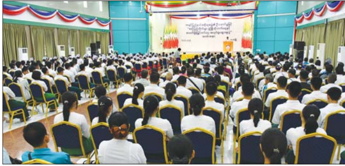
ဆွေးနွေးပွဲလုပ်ငန်းစဉ်ကို ရှင်းလင်းတင်ပြသည်။ ဖွံ့ဖြိုးတိုးတက်ရေး၊ ရပ်ကွက်၊ ကျေးရွာ ပြည်သူ့ယနေ့အလုပ်ရုံဆွေးနွေးပွဲတွင် အုပ်စုသုံးစုခွဲ၍ စာကြည့်တိုက်များ ရှင်သန်ဖွံ့ဖြိုးတိုးတက်ရေး၊ အခြေခံပညာကျောင်းများ စာကြည့်တိုက်ရှင်သန်စာဖတ်ရရှိမှုမြှင့်တင်ရေးဆိုင်ရာများကို အုပ်စုလိုက်

ဘားအံ စက်တင်ဘာ ၁၉ ကရင်ပြည်နယ်အတွင်း စာကြည့်တိုက်များ ဖွံ့ဖြိုးတိုးတက်ရေးနှင့် စာဖတ်ရရှိမှုမြှင့်တင်ရေးအလုပ်ရုံဆွေးနွေးပွဲကို စက်တင်ဘာ ၁၉ ရက်က ဘားအံမြို့၊ ဇွဲကပင်ခန်းမ၌ ကျင်းပသည်။ အဆိုပါအလုပ်ရုံဆွေးနွေးပွဲကို ကရင်ပြည်နယ် အစိုးရအဖွဲ့၏ဦးဆောင်မှုဖြင့် မြန်ကြားရေးနှင့် ပြည်သူ့ဆက်ဆံရေးဦးစီးဌာနနှင့် ကရင်ပြည်နယ် စာကြည့်တိုက်များ ဖောင်ဒေးရှင်းတို့ ပူးပေါင်းကျင်းပခြင်းဖြစ်ပြီး ကရင်ပြည်နယ်ဝန်ကြီးချုပ် ဦးစောမြင့်ဦးက အမှာစကားပြောကြားသည်။ (ယာဝု) ထို့နောက် ပြည်နယ်ဝန်ကြီးချုပ်က အလုပ်ရုံဆွေးနွေးပွဲအတွက် ငွေကျပ် ၅၇၅၅၀၀၀ ကို ထောက်ပံ့ပေးအပ်ပြီး မြန်ကြားရေးနှင့် ပြည်သူ့ဆက်ဆံရေးဦးစီးဌာန ပြည်နယ်ဦးစီးမှူးက အလုပ်ရုံ