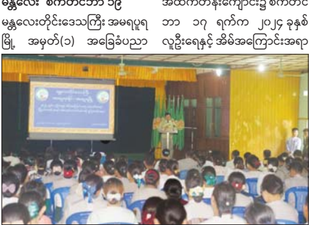
အမရပူရမြို့နယ်၌ လူဦးရေနှင့် အိမ်အကြောင်းအရာ သန်းခေါင်စာရင်းကောက်ယူရေး နည်းပြသင်တန်းဖွင့်