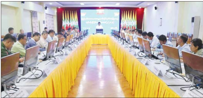
ထို့နောက် ပြည်နယ်အဆင့် ဌာနဆိုင်ရာများ က သဘာဝဘေးအန္တရာယ်များနှင့် စပ်လျဉ်း၍ အရေးပေါ်တုံ့ပြန်ရေးဆောင်ရွက်ထားရှိသည့် အစီအမံ များနှင့် ကြိုတင်စီမံဆောင်ရွက်ထားရှိမှု အခြေအနေ များကို ဆွေးနွေးတင်ပြကြပြီး ပြည်နယ်အစိုးရအဖွဲ့ဝင် များက လိုအပ်သည်များကို ဖြည့်စွက်မှာကြားသည်။ ယင်းနောက် ပြည်နယ်ဝန်ကြီးချုပ်က ဆွေးနွေးတင်ပြ မှုများအပေါ် ဆောင်ရွက်ပေးမည့်အခြေအနေများ၊ ပေါင်းစပ်ဆောင်ရွက်ရမည့်လုပ်ငန်းများနှင့် စပ်လျဉ်း ၍ မှာကြားကြောင်း သိရသည်။

လွိုင်ကော် စက်တင်ဘာ ၁၉ ကယားပြည်နယ် သဘာဝဘေးအန္တရာယ်ဆိုင်ရာ စီမံခန့်ခွဲမှုအဖွဲ့ လုပ်ငန်းညှိနှိုင်းအစည်းအဝေး (၂/၂၀၂၄) ကို ယနေ့နေ့စွဲနံနက် ၉ နာရီခွဲတွင် ကြည့်ရှုနိုင်ရန်အတွက် အစည်းအဝေးခန်းမ၌ ကျင်းပခဲ့သော သဘာဝဘေးအန္တရာယ်ဆိုင်ရာစီမံခန့်ခွဲမှုအဖွဲ့ ညှိနှိုင်းအစည်းအဝေး ချုပ် ဦးစေခန်းမရှိ တင်ကြား လက်ရှိဖြစ်ပေါ်နေသော ရေကြီးရေလျှံဖြစ်ပွားမှုများအတွက် ချက်ချင်းတုံ့ပြန် ဆောင်ရွက်နိုင်ရန်နှင့် ပြည်သူများဆုံးရှုံးမှု အနည်းဆုံး ဖြစ်စေရေး ကျော်လွှားနိုင်ရေး ဆောင်ရွက်ရမည့် လုပ်ငန်းစဉ်များကို ပြင်ဆင်ဆောင်ရွက်ကြရန် လိုကြောင်း၊ ရေများထပ်မံမြင့်တက်မှုရှိပါက ပြည်သူ များအား ကြိုတင်အသိပေးခြင်း၊ ကူညီကယ်ဆယ်ခြင်း၊ ရေဘေးလွတ်ရာ ယာယီရေဘေးကယ်ဆယ်ရေး စခန်းများသို့ ရွှေ့ပြောင်းနိုင်ရေးနှင့် ရပ်ကွက်အလိုက် ရေဘေးကွပ်ကဲရေး ရုံးများဖွင့်လှစ်နိုင်ရေး မှာကြား သည့်။ (အပေါ်ယာပုံ)