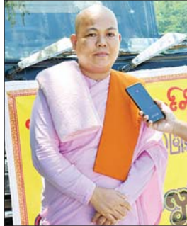
ဒေါ်ကောမလသိင်္ဂီ

နိုင်ငံတော်အစိုးရနှင့်အတူ မြန်မာနိုင်ငံအရပ်ရပ်မှ ပြည်သူများက သဘာဝဘေးဒဏ်ခံပြည်သူများအတွက် ကူညီထောက်ပံ့မှုများကို အင်တိုက်အားတိုက် ပါဝင်ဆောင်ရွက်လျက်ရှိသည်။ ထို့အတူ ပြည်ထောင်စုနယ်မြေ နေပြည်တော်အတွင်းရှိ ရေဘေးဒဏ်ခံပြည်သူများအတွက် မြန်မာနိုင်ငံအရပ်ရပ်မှ ပြည်သူများက လာရောက်လှူဒါန်းလျက်ရှိရာ ကူညီထောက်ပံ့လှူဒါန်းပေးကြသူများ၏ စကားသံများကို ဖော်ပြအပ်ပါသည်။