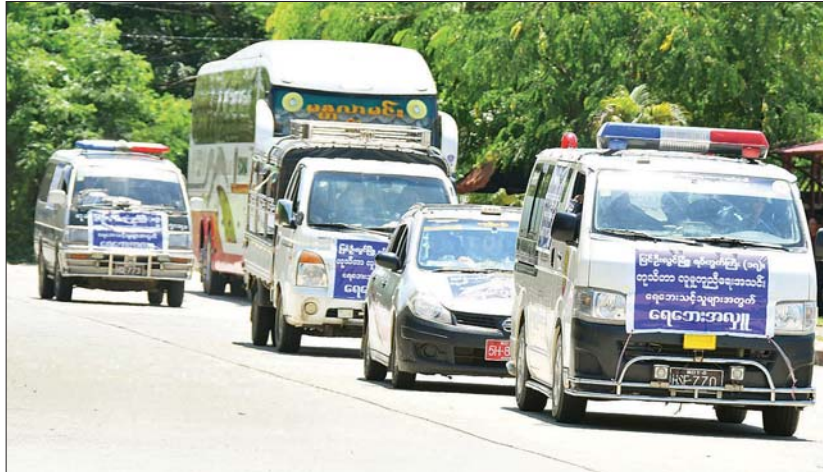
ရေဘေးသင့်ပြည်သူများအတွက် ကူညီထောက်ပံ့ရေးပစ္စည်းများ သယ်ဆောင်လာသည့် ယာဉ်များကို တွေ့ရစဉ်။

မိုးရွာတဲ့အခါမှာ ထမင်းထုပ်တွေ၊ ပစ္စည်းတွေ ပျက်စီးတာရှိပါတယ်။ အခုအချိန်က စားသောက်ဖို့နဲ့ အဝတ်အထည်တွေ လိုအပ်နေပေမယ့် ပြန်လည်ထူထောင်ရေးအတွက်လည်း လိုအပ်မှုတွေ ရှိနေပါသေးတယ်။ အခုလို သွားရောက်လှူဒါန်းတဲ့အခါ တစ်ခုတွေ့မြင်ခဲ့တာက အသင်းအဖွဲ့တွေအတွက် လိုအပ်ချက်ဖြစ်ပါတယ်။ အသင်းအဖွဲ့တွေဆီ ပြည်သူတွေက စုပေါင်းပြီး တစ်ဆင့်လှူဒါန်းတာရှိပါတယ်။ ပြည်သူတွေဆီ လှူဒါန်းတာ ဖြစ်တဲ့အတွက် လှူဒါန်းတဲ့ပစ္စည်း၊ ငွေကြေးက ပြည်သူတွေဆီပဲ ပေးအပ်လှူဒါန်းကြရပါတယ်။ သွားရောက်လှူဒါန်းပေးတဲ့ အသင်းအဖွဲ့အစည်းတွေ၊ ကူညီကယ်ဆယ်ရေး အဖွဲ့တွေအတွက် အစားအစာနဲ့ သွားလာစရိတ် အခက်အခဲ ဖြစ်နေတာ တွေ့ရပါတယ်။ အဲဒါကြောင့် လှူဒါန်းတဲ့အခါ အသင်းအဖွဲ့အစည်းတွေအတွက် ခရီးသွားစရိတ်နဲ့ အစားအစာအတွက်ပါ လှူဒါန်းပေးကြဖို့ အကြံပြုလိုပါတယ်။