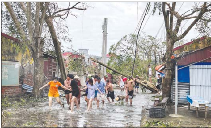
သတိပေးထားသည်။ စက်တင်ဘာအစောပိုင်းတွင် တိုင်ဖွန်းမုန်တိုင်း ရာဂီကြောင့် ဗီယက်နမ်နိုင်ငံမြောက်ပိုင်းတွင် ရေကြီး သတိပေးထားသည်။ ၂၉၀ ကျော်သေဆုံးခဲ့ကာ ဒါဇင်နှင့်ချီ ပျောက်ဆုံးခဲ့ အင်န်အိတ်ချ်ကော

ဒေသအများအပြားရှိ ပြည်သူများကို လျှပ် တစ်ပြက် ရေကြီးရေလျှံဖြစ်ခြင်း၊ မြေပြိုခြင်းများကို