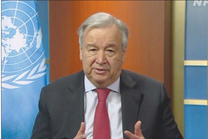
ကုလသမဂ္ဂ အထွေထွေအတွင်းရေးမှူးချုပ် အန်တိုနီယိုဂူတာရပ်စ်။

စက်တင်ဘာ ၁၇ ရက်က လက်ကိုင်ပေဂျာစက်များ ပေါက် ကွဲမှုတွင် ၁၂ ဦး သေဆုံးပြီး ၂၇၀၀ ကျော် ဒဏ်ရာရရှိခဲ့သည်။အဆိုပါ