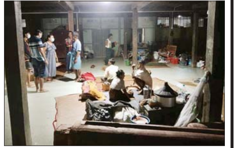
ဝက်ဖြူကျွန်းကျေးရွာ ရွှေမြူရတနာစာသင်တိုက်သို့ ကွင်းဆင်းကြည့်ရှုစဉ်။