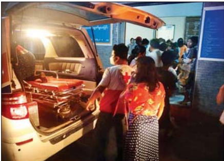
ပြည်သူ့ဆေးရုံကြီး တောင်ငူမြို့သို့ လူနာများ ရောက်ရှိလာစဉ်။