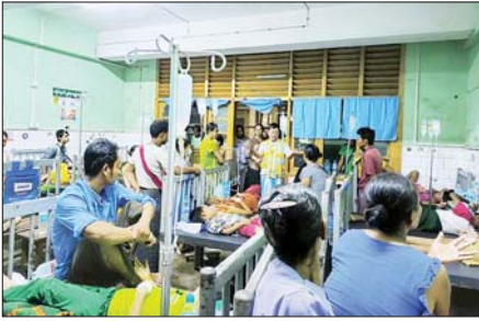
ပဲခူးတိုင်းဒေသကြီး ပြည်သူ့ကျန်းမာရေးနှင့်ကုသရေးဦးစီးဌာနမှ ကွင်းဆင်းကြည့်ရှုစဉ်။