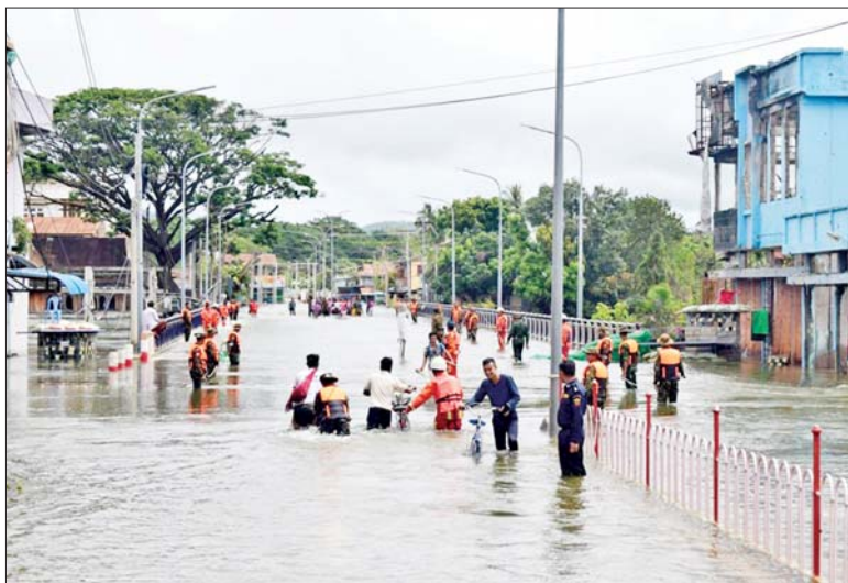
ရေဘေးသင့်ပြည်သူများအား ကူညီကယ်ဆယ်ရေးလုပ်ငန်းများ ဆောင်ရွက်ပေးစဉ်။

★ ရှေ့ဖိုးမှ ထို့ပြင် ယာယီရေဘေးရှောင်စခန်းများတွင် ရေဘေးသင့်ပြည်သူများအား ကျန်းမာရေးအဖွဲ့များက လိုအပ်သည့် ကျန်းမာရေး စောင့်ရှောက်မှု လုပ်ငန်းများနှင့် ကျန်းမာရေး အသိပညာပေးဟောပြောဆွေးနွေးခြင်းများ ဆောင်ရွက်ပေးပြီး တပ်မတော် (ကြည်း၊ ရေ၊ လေ) မိသားစုများ၊ ဌာနဆိုင်ရာများ၊ အသင်းအဖွဲ့များနှင့် အလှူရှင်များက ထောက်ပံ့ပစ္စည်းများ၊ အဝတ် အထည်များ၊ အသုံးအဆောင်ပစ္စည်းများ၊ စားသောက်ဖွယ်ရာများနှင့် အလှူငွေများကို အားတက်သရောပေးအပ်လှူဒါန်းခြင်းနှင့် သံဃာတော်များအား လှူဖွယ်ပစ္စည်းများ ဆက်ကပ်လှူဒါန်းခြင်းများ ဆောင်ရွက်ပေးလျက်ရှိသည်။ ယနေ့တွင် ကာကွယ်ရေးဦးစီးချုပ်ရုံး(ကြည်း) မှ ဒုတိယဗိုလ်ချုပ်ကြီး ဖုန်းမြတ်၊ နေပြည်တော် တိုင်းစစ်ဌာနချုပ် တိုင်းမှူး ဗိုလ်ချုပ်စိုးမင်းနှင့်