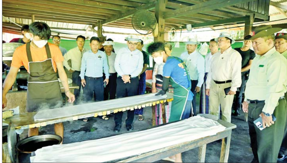
သွားရောက်ပြီး ဆန်ခေါက်ဆွဲစက်လည်ပတ်ထုတ်လုပ်သည့် လုပ်ငန်းအဆင့်ဆင့်ကို ကြည့်ရှုစစ်ဆေးကာ ဈေးကွက်ဖြန့်ဝေရောင်းချနိုင်မှု အခြေအနေများကို မေးမြန်းဆွေးနွေးပြီး ခေါက်ဆွဲစက်အဆင့်မြှင့်တင်လည်ပတ်နိုင်ရေးနှင့် နည်းပညာကူညီ

မြစ်ကြီးနား စက်တင်ဘာ ၂၃ ကချင်ပြည်နယ် ပူတာအိုခရိုင်အတွင်း စားရေရိက္ခာဖူလုံရေးအတွက် ဆန်နှင့် ဆီထွက်သီးနှံများ ပိုမိုတိုးချဲ့စိုက်ပျိုးထုတ်လုပ်နိုင်ရေး ပူတာအိုမြို့၌ ရောက်ရှိနေသော ပြည်နယ်ဝန်ကြီးချုပ် ဦးခင်ထိန်နန်သည် တာဝန်ရှိသူများနှင့်အတူ စက်တင်ဘာ ၂၂ ရက်နံနက် ၈ နာရီတွင် ပူတာအိုမြို့နယ်အတွင်း ကွင်းဆင်းစစ်ဆေးသည်။ ဦးစွာ ပြည်နယ်ဝန်ကြီးချုပ်နှင့် ပြည်နယ် သယံဇာတရေးရာဝန်ကြီး ဦးတိန်ဆောင်၊ ပြည်နယ် လမ်းပန်းဆက်သွယ်ရေးဝန်ကြီး ဦးတင်မောင်ထွေး၊ ပြည်နယ်အဆင့် ဌာနဆိုင်ရာတာဝန်ရှိသူများသည် စစ်ဗျူဟာအဖွဲ့ (အခြေချ) ပူတာအို စစ်ဗျူဟာမှူး ဗိုလ်မှူးကြီး ရဲဟိန်း၊ ခရိုင်/ မြို့နယ်စီမံအုပ်ချုပ်ရေးအဖွဲ့ဝင်များ၊ ခရိုင်အဆင့်ဌာနဆိုင်ရာတာဝန်ရှိသူများနှင့်အတူ ပူတာအိုမြို့ ပန်းလှိုင်ရပ်ကွက်အတွင်း ပြည်နယ်အစိုးရအဖွဲ့က နိုင်ငံ့စီးပွားမြှင့်တင်ရေးရန်ပုံငွေ ဒုတိယနှစ်စက်ဝန်းမှ လုပ်ငန်းပုံမှန်လည်ပတ်နိုင်ရေး မတည်ငွေကျပ်သိန်း ၂၀၀ ပံ့ပိုးမတည်ပေးထားသည့် ရွှေတောင်ခေါက်ဆွဲလုပ်ငန်းသို့