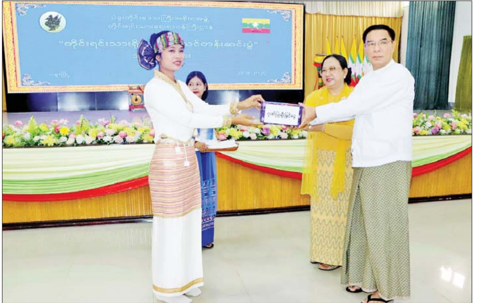
ရိုးရာ အက၊ ရှမ်းတိုင်းရင်းသားရိုးရာသင်ကြန်အက သား အကအဖွဲ့များ အား ဂုဏ်ပြုချီးမြှင့်ငွေပေးအပ် တို့ဖြင့် ဧည့်ခံဖျော်ဖြေတင်ဆက်ကြသည်။ ထို့နောက် ခွဲကြောင်း သိရသည်။ တိုင်းဒေသကြီးဝန်ကြီးချုပ်နှင့်ဇနီးတို့က တိုင်းရင်း တိုင်းဒေသကြီး(ပြန်/ဆက်)

တိုးတက်ရေးအတွက် အလေးထားဆောင်ရွက်ပေးလျက်ရှိကြောင်း၊ ယခုသင်တန်း ဖွင့်လှစ်ပေးခဲ့ခြင်းကြောင့် မိမိတို့တိုင်းရင်းသားများ၏ရိုးရာအကများကို မပျောက်ပျက်အောင် ထိန်းသိမ်းစောင့်ရှောက်နိုင်ခြင်း၊ တိုင်းရင်းသားလူငယ်များအနေဖြင့် မိမိတို့ရိုးရာအကများကို စဉ်ဆက်မပြတ်စေရန် သင်ကြားပေးနိုင်ခြင်း စသည့်အကျိုးကျေးဇူးများရရှိခဲ့ကြောင်း၊ သင်တန်းသား သင်တန်းသူများအနေဖြင့် မိမိတို့၏ရိုးရာအကများကို လက်ဆင့်ကမ်းသယ်ဆောင်ပြီး ပဲခူးတိုင်းဒေသကြီး၏ နေထူးနေမြတ်အခမ်းအနားများ၊ ဖျော်ဖြေရေးလုပ်ငန်းများတွင် တိုင်းရင်းသားများအားလုံး ချစ်ခင်ရင်းနှီးစွာ ပူးပေါင်းပါဝင်ဆောင်ရွက်နိုင်ကြမည်ဖြစ်ကြောင်း အမှာစကားပြောကြားသည်။ ထို့နောက် သင်တန်းသား သင်တန်းသူများက ချင်းတိုင်းရင်းသားရိုးရာအက၊ ကရင်တိုင်းရင်းသား