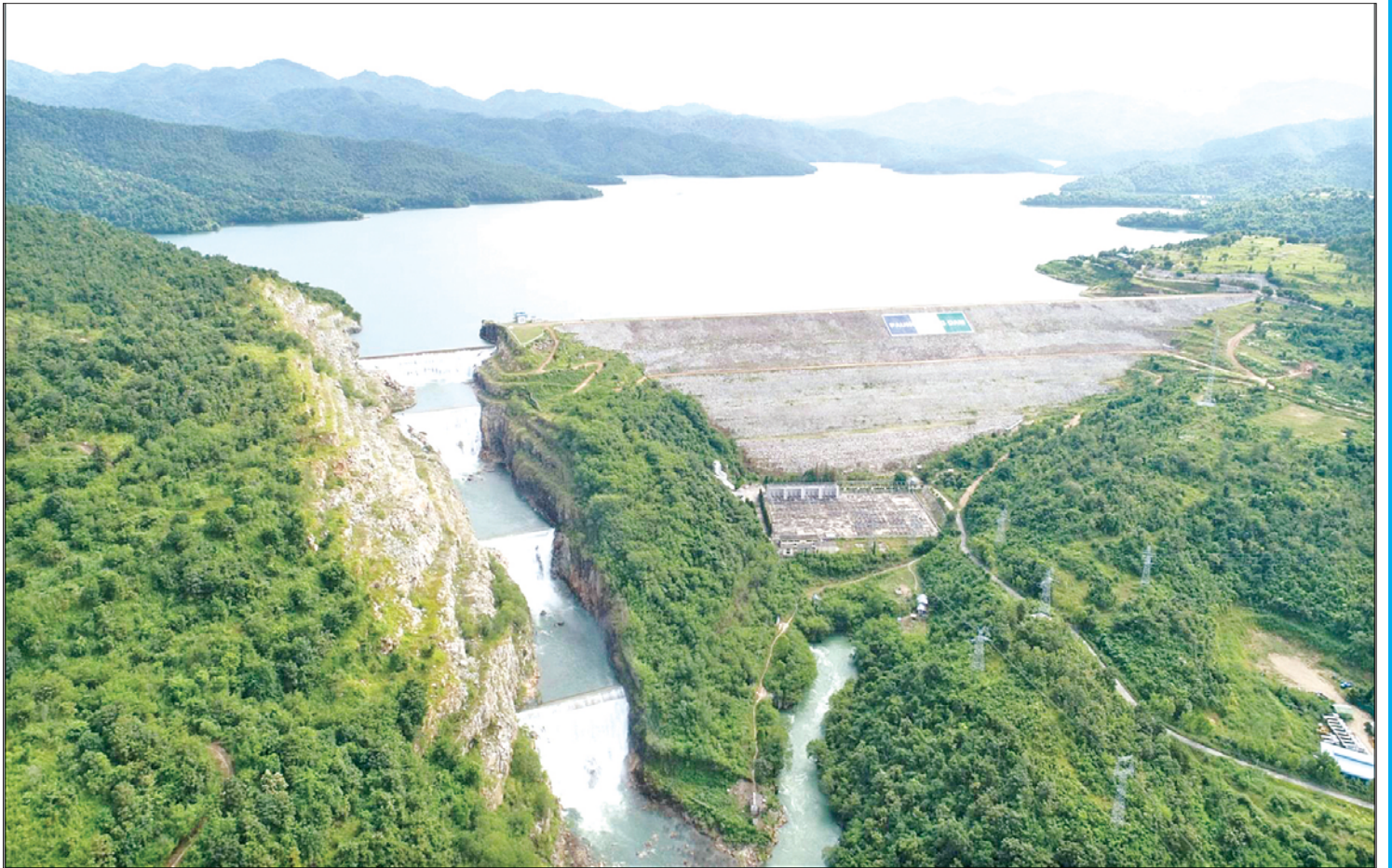
ပေါင်းလောင်းရေလှောင်တံ၏ ရေပိုလွှဲမှ ရေကျော်စီးဆင်းမှုကို တွေ့ရစဉ်။

ရေလှောင်တံတည်ဆောက်ရာတွင် ရေဆင်းစရိတ်တစ်ခုလုံးမှ စီးဝင်ရေအားလုံးကို တစ်အတွင်း ထိန်းချုပ်သို့လှောင်မည်ဆိုပါက ကြီးမားသော တစ်ခွင်အစားအတွက် ကုန်ကျစရိတ်များပြားခြင်း၊ အောက်ဘက်မြစ်ချောင်းများအတွင်းသို့ ရေစီးဆင်းမှုရပ်တန့်သွားမည်ဖြစ်သဖြင့် မြစ်၏ ဂေဟစနစ်ပျက်စီးလာခြင်းများ ဖြစ်ပေါ်လာနိုင်သောကြောင့် ရေပေးဝေမည့် စိုက်ပျိုးစရိယာ (သို့မဟုတ်) ရေအားလျှပ်စစ်ထုတ်လုပ်မှုအတွက် လိုအပ်သော ရေပမာဏအချို့