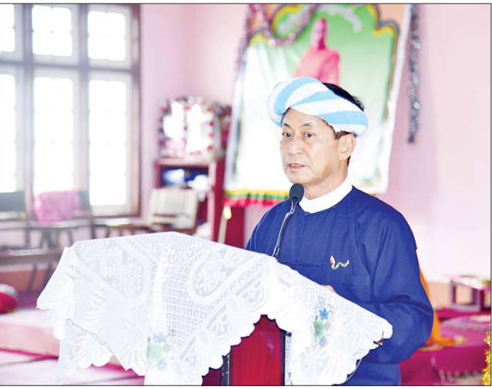
နိုင်ငံတော်စီမံအုပ်ချုပ်ရေးကောင်စီအဖွဲ့ဝင် ခွန်စုံလွင် ဟိုပုံးမြို့နယ် စံဖူးကျေးရွာ ဘုန်းတော်ကြီးကျောင်း၌ ရေဘေးသင့်ပြည်သူများကို တွေ့ဆုံအားပေးစကားပြောကြားစဉ်။

လှူဖွယ်ဝတ္ထုပစ္စည်းများ ဆက်ကပ် ဦးစွာ ဟိုပုံးမြို့ နောင်တောင်း ပရဟိတ တပ်ဦးကျောင်းတိုက် ပဓာန နာယက ဆရာတော် ဘဒ္ဒန္တရာဇိန္ဒထံမှ ငါးပါးသီလခံယူ ဆောက်တည်ကြပြီး ပရိတ် တရားတော်များ နာယူကြကာ ဆရာတော်၊ သံဃာတော်များအား နိုင်ငံတော်စီမံအုပ်ချုပ်ရေးကောင်စီ