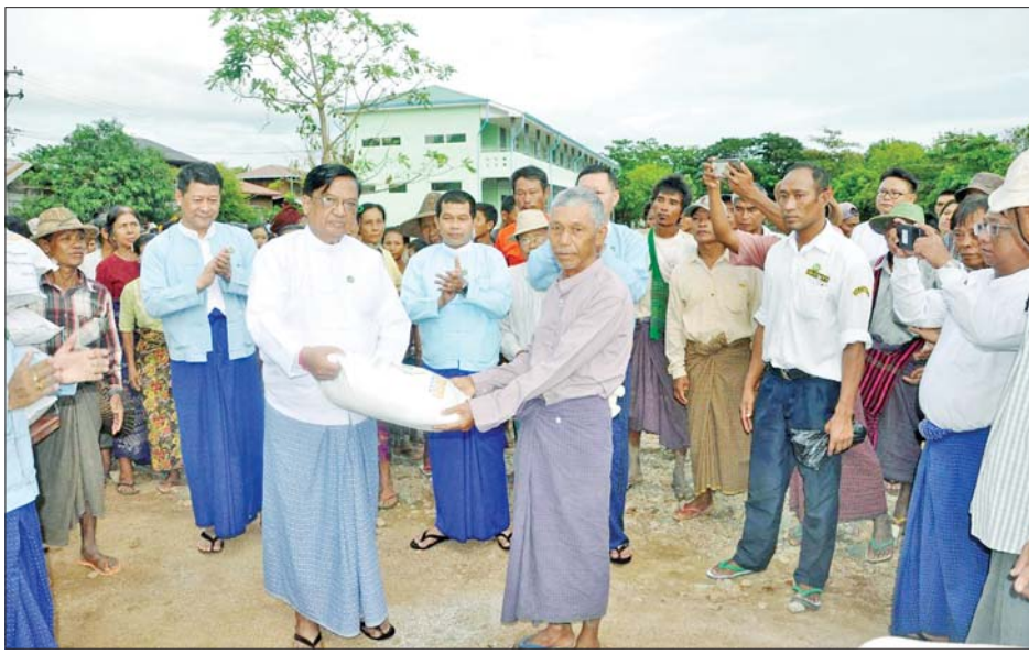
အားပေးသည်။ ထို့နောက် ပြည်ထောင်စုဝန်ကြီးသည် ရေဘေးသင့်ပြည်သူများ၏ အုပ်ချုပ်မှုဆိုင်ရာ ကိစ္စရပ်များကို ဆောင်ရွက်ပေးနေသည့် တာဝန်ရှိသူများနှင့်တွေ့ဆုံ၍ သတင်းစဉ်

နေပြည်တော် စက်တင်ဘာ ၂၃ စက်မှုဝန်ကြီးဌာန ပြည်ထောင်စုဝန်ကြီး ဒေါက်တာချာလီသန်းသည်ဝန်ကြီးဌာနသဘာဝဘေးအန္တရာယ်ဆိုင်ရာ စီမံခန့်ခွဲရေးအဖွဲ့ဝင်များ၊ တာဝန်ရှိသူများနှင့်အတူ ယနေ့နံနက်ပိုင်းတွင် နေပြည်တော်ကောင်စီနယ်မြေအတွင်း မိုးအဆက်မပြတ်ရွာသွန်းပြီး ရေကြီးရေလျှံမှုများကြောင့် ရေဘေးသင့်ခဲ့သည့် အိမ်ထောင်စု ၅၈၅ စု၊ လူဦးရေ ၅၀၀ ခန့်ရှိ လယ်ဝေးမြို့နယ် ပိတောက်ချောင်ကျေးရွာအုပ်စု ကွမ်းခြံကျေးရွာသို့ သွားရောက်ပြီး ပြည်သူများနှင့် တွေ့ဆုံ၍ အားပေးစကားပြောကြားသည်။ ထိုသို့တွေ့ဆုံစဉ် ရေကြီးရေလျှံဖြစ်ပေါ်ခဲ့မှု၊ ပျက်စီးဆုံးရှုံးခဲ့မှု၊ ကျန်းမာရေးကိစ္စရပ်များ၊ ပြန်လည်ထူထောင်ရေးလုပ်ငန်းစဉ်များ ဆောင်ရွက်နေမှုတို့ကို ဆွေးနွေးမေးမြန်းပြီး ကျေးရွာရှိ အခြေခံပညာအထက်တန်းကျောင်းခွဲ ပြန်လည်ဖွင့်လှစ်နိုင်ရေးအတွက် သန့်ရှင်းရေးပြုလုပ်နေမှု၊ ရေကောင်းရေးသန့်များရရှိရေး ဆောင်ရွက်ပေးနေမှုတို့ကို ကြည့်ရှု