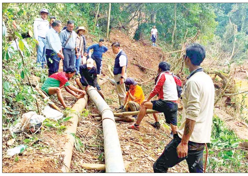
နေမှုများကို ကွင်းဆင်းစစ်ဆေးပြီး အမြန်ဆုံး ပြန်လည်ပြင်ဆင်ဆောင်ရွက်ကြရန် လမ်းညွှန် မှာကြားသည်။ ကလေးမြို့နယ် စည်ပင်သာယာ ရေးဌာနက ရေအေးကန်သည်မှ မြို့နေပြည်သူ လူထုသို့ သောက်သုံးရေ ပြန်လည်ဖြန့်ဝေ ပေးနိုင်ရေးအတွက် အမြန်ဆုံး ပြင်ဆင်ဆောင် ရွက်လျက်ရှိကြောင်း သိရသည်။ မြို့နယ်(ပြန်/ဆက်)

ကလေး စက်တင်ဘာ ၂၃ ရှမ်းပြည်နယ်(တောင်ပိုင်း) ကလေးမြို့ တွင် စက်တင်ဘာ ၁၀ ရက်မှ ၁၂ ရက်အထိ ရေကြီးရေလျှံမှုများဖြစ်ပွားခဲ့ပြီး သောက်သုံးရေ ဖြန့်ဝေပေးလျက်ရှိသည့် ရေအေးကန်သည်မှ ပိုက်လိုင်းပျက်စီးမှု အခြေအနေများကို စက်တင်ဘာ ၂၂ ရက် နံနက်ပိုင်းက ရှမ်းပြည်နယ် စီးပွားရေးရာဝန်ကြီးက ကွင်းဆင်း စစ်ဆေးသည်။