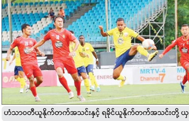
ဟံသာဝတီယူနိုက်တက်အသင်းနှင့် ရခိုင်ယူနိုက်တက်အသင်းတို့ ယှဉ်ပြိုင်နေစဉ်။

ပြီဖြစ်သော်လည်း မိုးသည်းထန်စွာရွာသွန်းမှုကြောင့် ရွှေ့ဆိုင်းထားရသည့် ရတနာပုံ အသင်းနှင့် အား/ကာသိပွဲအသင်းတို့၏ လက်ကျန် ဒုတိယပိုင်း ၄၅ မိနစ်ကို စက်တင်ဘာ ၂၆ ရက်တွင် သုဝဏ္ဏကွင်း၌ ပြန်လည်ကျင်းပမည်ဖြစ်သည်။ ပထမ အကျော့အပြီးတွင် ရှမ်းယူနိုက်တက် အသင်းက ၃၁ မှတ်ဖြင့် ရာသီဝက်ချန်ပီယံ ဖြစ်ခဲ့ပြီး ဟံသာဝတီအသင်းက ၂၈ မှတ်၊ ရန်ကုန်ယူနိုက်တက်အသင်းက ၂၇ မှတ်၊ ဒဂုံစတား ယူနိုက်တက်အသင်းက ၂၃ မှတ်၊ ရတနာပုံအသင်းက ၁၇ မှတ်၊ မဟာ ယူနိုက်တက်အသင်းက ၁၆ မှတ်၊ အား/ ကာသိပွဲအသင်းက ၁၃ မှတ်၊ Dagon Port အသင်းက ၁၂ မှတ်၊ သစ္စာအားမာန် အသင်းက ၃ နှစ်မှတ်၊ ဧရာဝတီယူနိုက်တက် အသင်းက ငါးမှတ်၊ မြဝတီအသင်းက လေးမှတ်၊ ရခိုင်ယူနိုက်တက်အသင်းက နှစ်မှတ် ရရှိထားသည်။ သတင်း-ကိုညီလေး