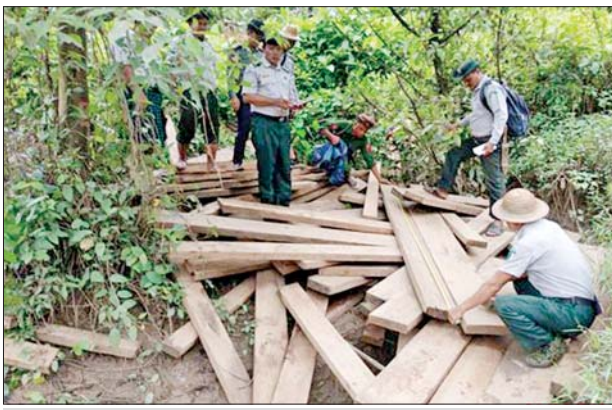
ပဲခူးတိုင်းဒေသကြီး၌ ဖမ်းဆီးရမိမှု။

နေပြည်တော် စက်တင်ဘာ ၂၃ တရားမဝင် ကုန်သွယ်မှု တိုက်ဖျက်ရေး ဦးဆောင်ကော်မတီ ၏ ကြီးကြပ်ကွပ်ကဲမှုဖြင့် တရားမဝင် ကုန်သွယ်မှုများကို ဥပဒေနှင့် အညီ ထိရောက်စွာ တားဆီးအရေး ယူနိုင်ရေး ဆောင်ရွက်လျက်ရှိရာ စက်တင်ဘာ ၂၀ ရက်တွင် မကွေးတိုင်းဒေသကြီး တရားမဝင် ကုန်သွယ်မှုတိုက်ဖျက်ရေးအထူးအဖွဲ့၏ စီမံခန့်ခွဲမှုဖြင့် တာဝန်ကျ ပူးပေါင်းအဖွဲ့များက စစ်ဆေးမှုများ ဆောင်ရွက်ခဲ့ရာ မကွေးခရိုင်၊ မင်းဘူးခရိုင်နှင့် သရက်ခရိုင်တို့ အတွင်း၌ လိုင်စင်မဲ့ဆိုင်ကယ် ငါးစီး (ခန့်မှန်းတန်ဖိုးငွေကျပ် ၁၅၃၀၀၀၀)ကို ပို့ကုန်သွင်းကုန် ဥပဒေအရလည်းကောင်း၊ မကွေးခရိုင်၊ နတ်မောက်မြို့နယ်၌ တရားမဝင် အခြားသစ် သုည ဒသမ ၅၁၆ တန် (ခန့်မှန်းတန်ဖိုးငွေကျပ် ၉၂၄၄၇)ကို သစ်တောဥပဒေအရ လည်းကောင်း စုစုပေါင်းခန့်မှန်း တန်ဖိုးငွေကျပ် ၁၆၂၂၄၄၇ ကို သိမ်းဆည်းအရေးယူဆောင်ရွက် လျက်ရှိသည်။