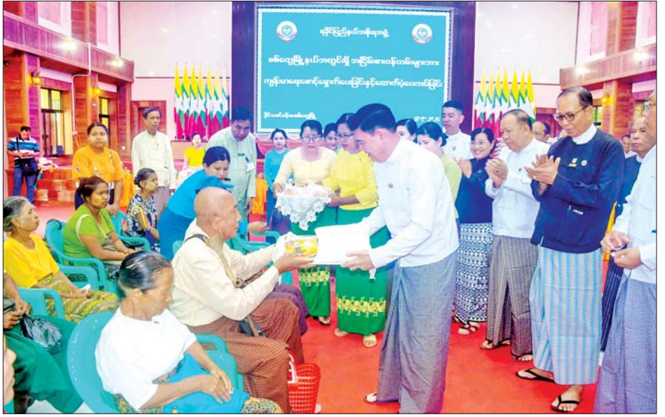
အငြိမ်းစားဝန်ထမ်းများ ပင်စင်လစာငွေများထုတ်ယူရာတွင် အဆင်ပြေချောမွေ့စေရန်အတွက် ရုံးဖွင့်ရက်များတွင် နံနက် ၇ နာရီမှစတင်၍ ပင်စင်လစာငွေများကို ထုတ်ပေးလျက်ရှိသည်။ စစ်တွေမြို့နယ်အတွင်းရှိ အငြိမ်းစားဝန်ထမ်းများအား ရခိုင်ပြည်နယ်အစိုးရအဖွဲ့၏ ကြီးကြပ်