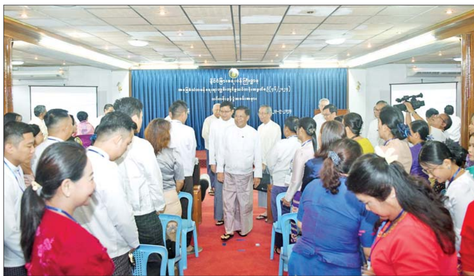
များ၊ ဝါရင့်သံတမန်များ၊ ဘာသာရပ်ဆိုင်ရာကျွမ်းကျင်သူများ၊ တက္ကသိုလ်များမှ ပါမောက္ခဆရာကြီး၊ ဆရာမကြီးများ၊ သင်တန်းသား သင်တန်းသူများ တက်ရောက်ကြသည်။ သတင်းစဉ်

အခမ်းအနားများသို့ နိုင်ငံခြားရေးဝန်ကြီးဌာန ဒုတိယဝန်ကြီး၊ အမြဲတမ်းအတွင်းဝန်၊ ပြည်ထောင်စုဝန်ကြီးရုံးနှင့် ဦးစီးဌာနများမှ ညွှန်ကြားရေးမှူးချုပ်များနှင့် တာဝန်ရှိသူများ၊ အငြိမ်းစားသံအမတ်ကြီးများ၊ ဝါရင့်သံတမန်များ၊ ဘာသာရပ်ဆိုင်ရာကျွမ်းကျင်သူများ၊ တက္ကသိုလ်များမှ ပါမောက္ခဆရာကြီး၊ ဆရာမကြီးများ၊ သင်တန်းသား သင်တန်းသူများ တက်ရောက်ကြသည်။ သတင်းစဉ်