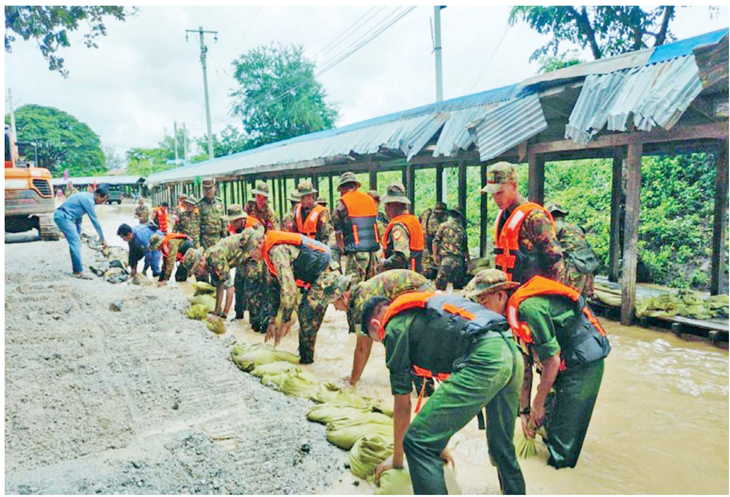
ရေကြီးရေလျှံမှုဖြစ်ပေါ်ခဲ့သည့်နေရာ၌ တပ်မတော်သားများနှင့်တာဝန်ရှိသူများက ပြန်လည်ထူထောင်ရေးလုပ်ငန်းများ ဆောင်ရွက်စဉ်။

နေပြည်တော် စက်တင်ဘာ ၂၃ နေပြည်တော်ကောင်စီနယ်မြေ အပါအဝင် တိုင်းဒေသကြီးနှင့် ပြည်နယ်များရှိ ရေကြီးရေလျှံမှု ဖြစ်ပေါ်ခဲ့သည့် ရပ်ကွက်/ကျေးရွာများတွင် ကူညီကယ်ဆယ်ရေးလုပ်ငန်းများနှင့် ပြန်လည်ထူထောင်ရေးလုပ်ငန်းများကို အင်တိုက်အားတိုက် တက်ကြွစွာ ပူးပေါင်းဆောင်ရွက်ပေးလျက်ရှိသည်။ တက်ကြွစွာဆောင်ရွက်ပေးလျက်ရှိ ယနေ့တွင်လည်း နေပြည်တော်ကောင်စီနယ်မြေ ဇေယျာသီရိမြို့နယ်၊ ပျဉ်းမနားမြို့နယ်၊ တပ်ကုန်းမြို့နယ်၊ လယ်ဝေးမြို့နယ်၊ ပုဗ္ဗသီရိမြို့နယ်တို့တွင် လည်းကောင်း၊ ရှမ်းပြည်နယ်(တောင်ပိုင်း) ကလေးမြို့နယ်တွင်လည်းကောင်း၊ ကယားပြည်နယ်လွိုင်ကော်မြို့နယ်နှင့် လွိုင်လင် လေးမြို့နယ်တို့တွင်လည်းကောင်း ဘုန်းတော်ကြီးကျောင်းများ၊ စာသင်ကျောင်းများ၊ ဆေးရုံ၊ ဆေးခန်းများ၊ ဌာနဆိုင်ရာအဆောက်အအုံများတွင် လိုအပ်သည်များ ကူညီရွှေ့ပြောင်းပေးခြင်းနှင့် သန့်ရှင်းရေးလုပ်ငန်းများ ဆောင်ရွက်ပေးခြင်း၊ လမ်း၊ တံတားများ၊ ရပ်ကွက်၊ ကျေးရွာများအတွင်း၌ တင်ကျန်ခဲ့သည့်နွမ်းနယ်မှု၊ သစ်ပင်သစ်ကိုင်းများ ဖယ်ရှားပေးခြင်းအပါအဝင် အခြားလိုအပ်သည်များကို တပ်မတော်သားများ၊ မြန်မာနိုင်ငံရဲတပ်ဖွဲ့ဝင်များ၊ မီးသတ်တပ်ဖွဲ့ဝင်များ၊ ကြက်ခြေနီတပ်ဖွဲ့ဝင်များနှင့် လူမှုဝန်ထမ်းကယ်ဆယ်ရေးအဖွဲ့များက ဒေသခံပြည်သူများနှင့်ပူးပေါင်း၍ တက်ကြွစွာဆောင်ရွက်ပေးလျက်ရှိသည်။ စာမျက်နှာ ၅ ကော်လံ ၁ သို့ ။