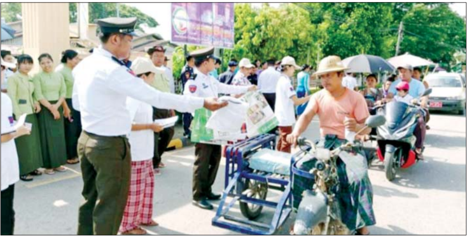
သန်းခေါင်စာရင်းကောက်ယူခြင်းအကြောင်း သိကောင်းစရာ လက်ကမ်းစာစောင်များ ဖြန့်ဝေပေးနေစဉ်။

အင်္ဂလိပ်အစိုးရသည် မြန်မာနိုင်ငံတွင် သန်းခေါင်စာရင်းကောက်ယူခြင်းလုပ်ငန်းကို ၁၈၇၂ ခုနှစ်မှ စတင်၍ ကောက်ယူခဲ့ပြီး ၁၀ နှစ်တစ်ကြိမ် ပုံမှန် ကောက်ယူခဲ့ပါသည်။ မှတ်တမ်းများအရ ၁၈၇၂ ခုနှစ်တွင် အောက်မြန်မာပြည် လူဦးရေ ၂ ဒသမ ၇၅ သန်း၊ ၁၈၈၁ ခုနှစ်တွင် ၃ ဒသမ ၇၄ သန်း ကောက်ယူရရှိခဲ့ပြီး ၁၈၉၁ ခုနှစ်မှစ၍ မြန်မာတစ်နိုင်ငံလုံးအတိုင်းအတာဖြင့် ကောက်ယူခဲ့ရာ ၁၈၉၁ ခုနှစ်တွင် ၇ ဒသမ ၇၃ သန်း၊ ၁၉၀၁ ခုနှစ်တွင် ၁၀ ဒသမ ၅ သန်း၊ ၁၉၁၁ ခုနှစ်တွင် ၁၂ ဒသမ ၁၁ သန်း၊ ၁၉၂၁ ခုနှစ်တွင် ၁၃ ဒသမ ၂၁ သန်း၊ ၁၉၃၁ ခုနှစ်တွင် ၁၄ ဒသမ ၆၇ သန်း၊ ၁၉၄၁ ခုနှစ်တွင် ၁၆ ဒသမ ၈၂ သန်း ကောက်ယူရရှိခဲ့ပါသည်။