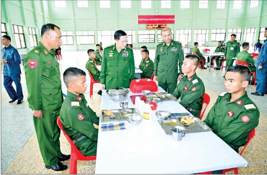
နိုင်ငံတော်စီမံအုပ်ချုပ်ရေးကောင်စီဥက္ကဋ္ဌ တပ်မတော်ကာကွယ်ရေးဦးစီးချုပ် ဗိုလ်ချုပ်မှူးကြီး မင်းအောင်လှိုင် တပ်မတော်နည်းပညာတက္ကသိုလ် ဗိုလ်လောင်းသင်တန်း အမှတ်စဉ်(၂၇) သင်တန်းသား ဗိုလ်လောင်းများအား ရင်းရင်းနှီးနှီးနှုတ်ဆက်စဉ်။