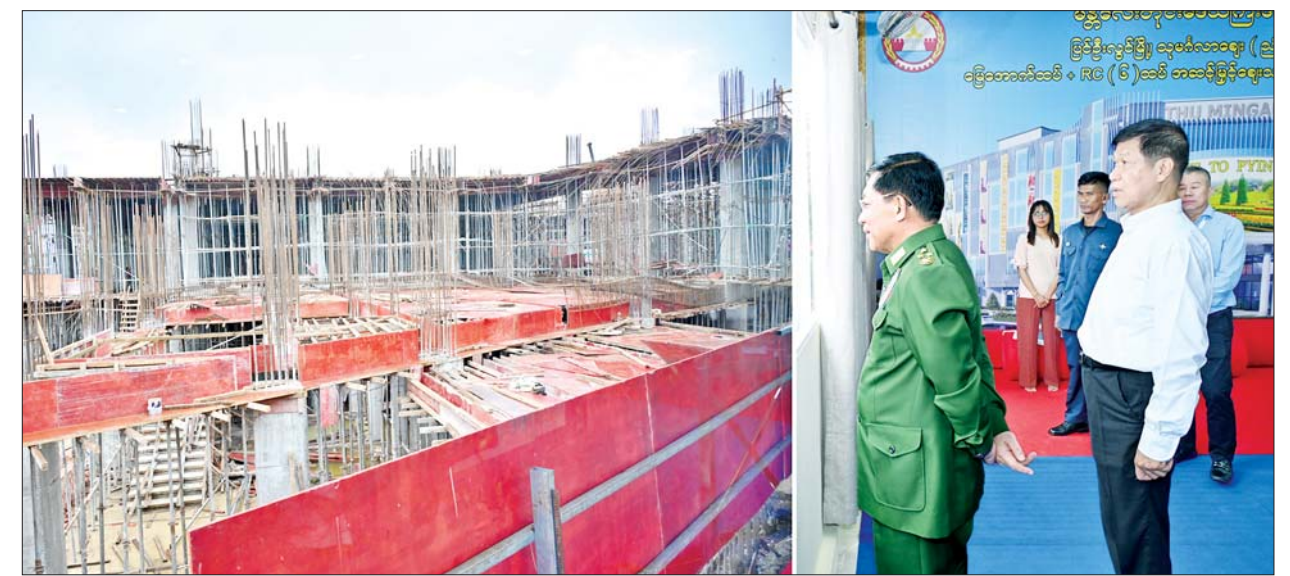
နိုင်ငံတော်စီမံအုပ်ချုပ်ရေးကောင်စီဥက္ကဋ္ဌ တပ်မတော်ကာကွယ်ရေးဦးစီးချုပ် ဗိုလ်ချုပ်မှူးကြီး မင်းအောင်လှိုင် ပြင်ဦးလွင်မြို့ သုမင်္ဂလာဈေး (ညံတောဈေး) ခြောက်ထပ်အဆင့်မြင့်ဈေးသစ် တည်ဆောက်ရေးစီမံကိန်းသို့ သွားရောက်ကြည့်ရှုစစ်ဆေးစဉ်။

အကြမ်းဖက်သောင်းကျန်းသူများထံမှ လက်နက်ခဲယမ်းများ သိမ်းဆည်းရမိမှု အခြေအနေများကို ရှင်းလင်းတင်ပြကြသည်။ ရှင်းလင်းတင်ပြမှုများအပေါ် နိုင်ငံတော် စီမံအုပ်ချုပ်ရေးကောင်စီဥက္ကဋ္ဌ တပ်မတော်ကာကွယ်ရေးဦးစီးချုပ်က ပြင်ဦးလွင်တပ်နယ်အနေဖြင့် နယ်မြေလုံခြုံရေးနှင့် တည်ငြိမ်အေးချမ်းရေးလုပ်ငန်းများကို စနစ်တကျ ဆောင်ရွက်သွားရန် လိုကြောင်း၊ တပ်နယ်အတွင်း နယ်မြေစည်းရုံးရေးလုပ်ငန်းများနှင့် နယ်မြေစိုးမိုးရေးလုပ်ငန်းများ ဆောင်ရွက်ရာတွင်လည်း မိမိတို့ တာဝန်ထမ်းဆောင်ရသည့် နယ်မြေအလိုက် ဒေသ၏ နယ်မြေဒေသအခြေအနေများ၊ ဒေသဆိုင်ရာအချက်အလက်များကို ခြေခြေမြစ်မြစ် သိရှိထားရမည် ဖြစ်ကြောင်း၊ နယ်မြေခံတပ်များနှင့် ဒေသခံများ တစ်သားတည်း ဖြစ်နေရမည်ဖြစ်ပြီး အပြန်အလှန်ရိုင်းပင်း ကူညီခြင်း၊ ပူးပေါင်းဆောင်ရွက်ခြင်းတို့ဖြင့် နယ်မြေလုံခြုံရေး၊ ဒေသခံများ၏ လုံခြုံရေးကို အတူတကွ ဝိုင်းဝန်းပူးပေါင်း ဆောင်ရွက်သွားကြရန် လိုကြောင်း မှာကြားခဲ့သည်။