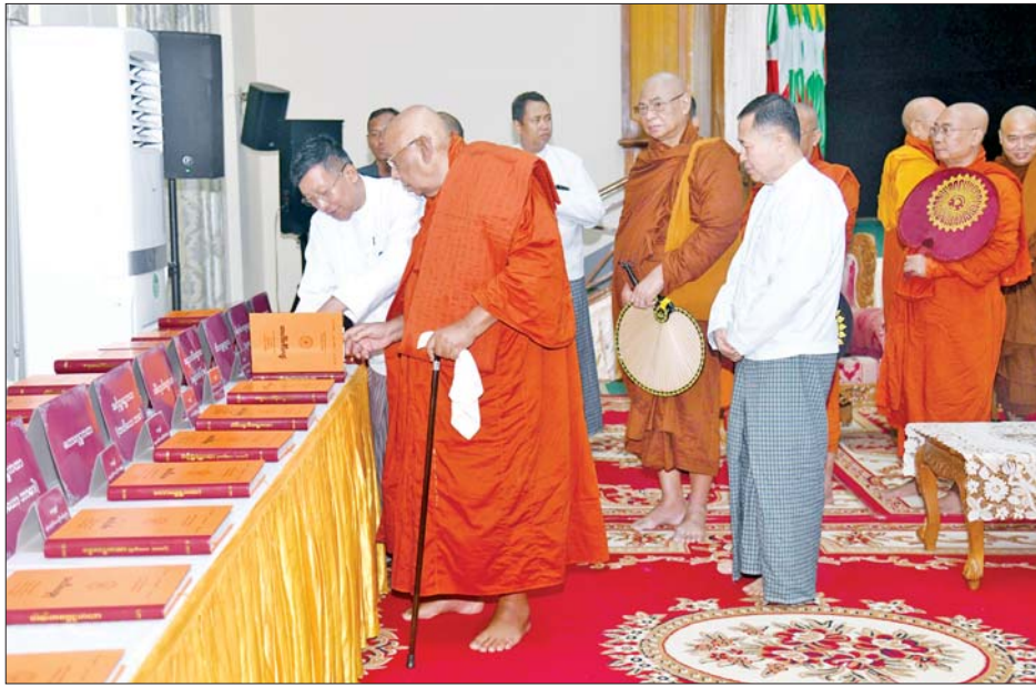
သီတဂူဆရာတော် ဒေါက်တာဘဒ္ဒန္တဏှာဏီသာရ သာသနာရေးနှင့်ယဉ်ကျေးမှုဝန်ကြီးဌာနက ခင်းကျင်း ပြသထားသည့် စာအုပ်များကို ကြည့်ရှုစဉ်။

ရေကြီးရေလျှံဖြစ်ပွားခဲ့သည့် ဒေသများရှိ ရေဘေးသင့်ပြည်သူများကို သီတဂူဆရာတော်ကြီး အနေဖြင့် အမေရိကန်ဒေါ်လာ ၁၀၀၀၀ အား လည်းကောင်း၊ ကွန်းခိုရာ ကုမ္ပဏီမိသားစုက ငွေကျပ် သိန်း ၁၀၀၀ လှူဒါန်းသည့်အတွက်လည်းကောင်း နိုင်ငံတော်စီမံအုပ်ချုပ်ရေးကောင်စီအနေဖြင့် အထူး ကျေးဇူးတင်ရှိပါကြောင်း၊ ရေဘေးသင့်ပြည်သူများ