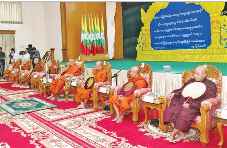
အမျိုးသားသဘာဝဘေးအန္တရာယ်ဆိုင်ရာ စီမံခန့်ခွဲမှုကော်မတီဥက္ကဋ္ဌ နိုင်ငံတော်စီမံအုပ်ချုပ်ရေးကောင်စီ ဒုတိယဥက္ကဋ္ဌ ဒုတိယဝန်ကြီးချုပ် ဒုတိယဗိုလ်ချုပ်မှူးကြီးစိုးဝင်းနှင့် အခမ်းအနားတက်ရောက်လာကြသူများက သီတဂူဆရာတော်ကြီးထံမှ ငါးပါးသီလခံယူဆောက်တည်ကြစဉ်။