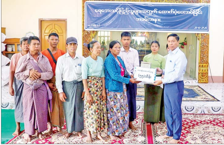
ပုဗ္ဗသီရိမြို့နယ်မှ သေဆုံးသူ ၁၁ ဦးအတွက် အမျိုးသားသဘာဝဘေးအန္တရာယ်ဆိုင်ရာ စီမံခန့်ခွဲမှု ကော်မတီမှ တစ်ဦးလျှင် ငွေကျပ် ငါးသိန်းကို မိသားစုဝင်များထံ ထောက်ပံ့ပေးအပ်စဉ်။