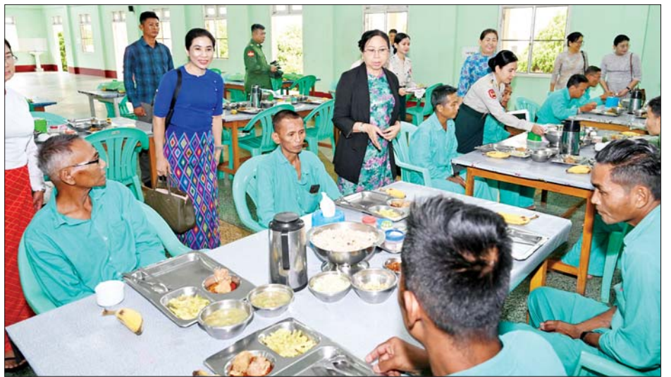
နိုင်ငံတော်စီမံအုပ်ချုပ်ရေးကောင်စီဥက္ကဋ္ဌ တပ်မတော်ကာကွယ်ရေးဦးစီးချုပ် ဗိုလ်ချုပ်မှူးကြီး မင်းအောင်လှိုင်၏ဇနီးဒေါ်ကြူကြူလှ ပြင်ဦးလွင်မြို့ နယ်မြေခံတပ်မတော်ဆေးရုံ အာဟာရဌာနခွဲ၌ အရာရှိ စစ်သည်များ၏ နေ့လယ်စာအာဟာရသုံးဆောင်နေမှုကို ကြည့်ရှုအားပေးစဉ်။

၎င်း စာမျက်နှာ ၃ မှ ထို့နောက် နိုင်ငံတော်စီမံအုပ်ချုပ်ရေးကောင်စီ ဥက္ကဋ္ဌ တပ်မတော်ကာကွယ်ရေး ဦးစီးချုပ်သည် ဆေးရုံ၏လိုအပ်ချက်များအား မေးမြန်း၍ တာဝန်ရှိသူများ၏ တင်ပြချက်များအပေါ် လိုအပ်သည်များ ဖြည့်ဆည်းဆောင်ရွက်ပေးခဲ့သည်။ ယင်းနောက် နိုင်ငံတော်စီမံ