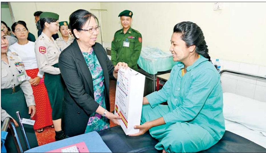
နိုင်ငံတော်စီမံအုပ်ချုပ်ရေးကောင်စီဥက္ကဋ္ဌ တပ်မတော်ကာကွယ်ရေးဦးစီးချုပ် ဗိုလ်ချုပ်မှူးကြီး မင်းအောင်လှိုင်၏ ဇနီးဒေါ်ကြူကြူလှ ပြင်ဦးလွင်မြို့ နယ်မြေခံတပ်မတော်ဆေးရုံ သားဖွားမီးယပ်နှင့် ကလေးကုသဆောင် ဌာန ဆေးရုံတက်ရောက်ကုသမှုခံယူနေသူတစ်ဦးအား စားသောက်ဖွယ်ရာပစ္စည်းများပေးအပ်စဉ်။