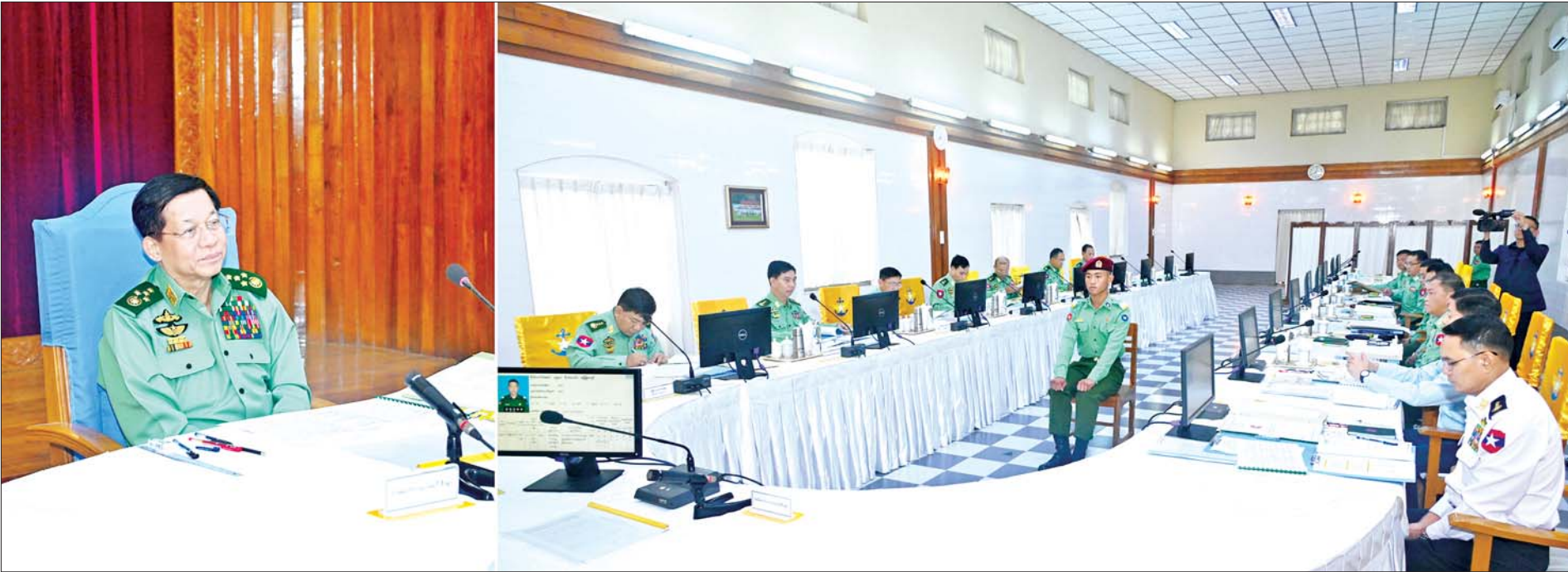
နိုင်ငံတော်စီမံအုပ်ချုပ်ရေးကောင်စီဥက္ကဋ္ဌ တပ်မတော်ကာကွယ်ရေးဦးစီးချုပ် ဗိုလ်ချုပ်မှူးကြီးမင်းအောင်လှိုင် စစ်တက္ကသိုလ်ဗိုလ်လောင်းသင်တန်းအမှတ်စဉ်(၆၇) စစ်လက်ရုံးရွေးချယ်ပွဲသို့ တက်ရောက်စိစစ်ရွေးချယ်စဉ်။