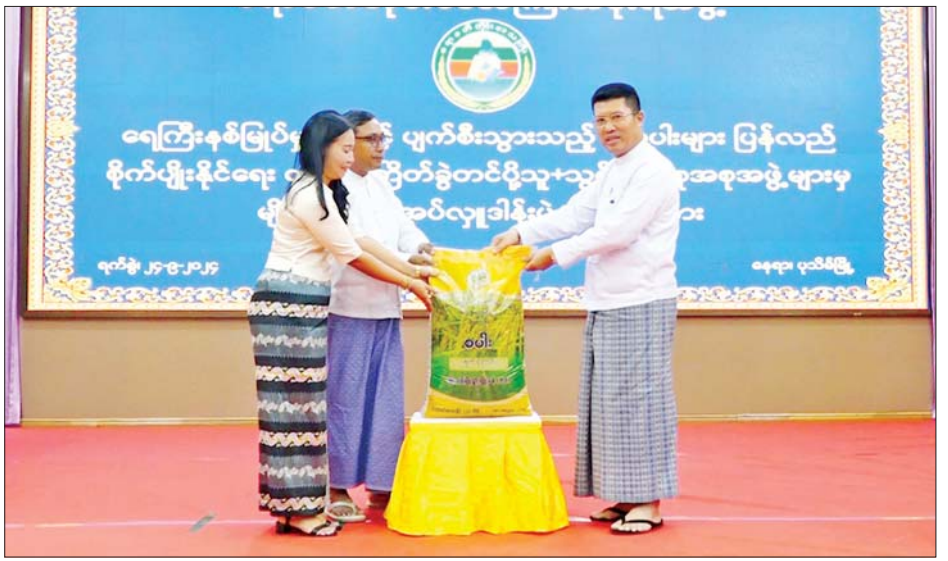
အစုအဖွဲ့များက ပထမအကြိမ်အဖြစ် ရက် ၉၀ ၁၆၀၀၀ ကျော် ထောက်ပံ့ပေးအပ်ခဲ့ကြောင်း သိရ မျိုးစပါးနှင့် သီးထပ်ရင်မျိုးစပါး စုစုပေါင်းတင်း သည်။ တိုင်းဒေသကြီး(ပြန်/ဆက်)

ပျက်စီး၊ ပြန်လည်စိုက်ပျိုးထားရှိမှုကိုလည်းကောင်း၊ စိုက်ပျိုးရေးဦးစီးဌာန တိုင်းဒေသကြီးဦးစီးမှူးက ရေကြီးနစ်မြုပ်မှုကြောင့် ထိခိုက်ပျက်စီးသွားသော မိုးစပါးများ ပြန်လည်စိုက်ပျိုးနိုင်ရေး ဝယ်ယူကြိုက်ခွဲ တင်ပို့သူများက မျိုးစပါးပေးအပ်လှူဒါန်းမှု အခြေ အနေကိုလည်းကောင်း ရှင်းလင်းတင်ပြပြီး ရေကြီး နစ်မြုပ်မှုကြောင့် ထိခိုက်ပျက်စီးသွားသော မိုးစပါး များ ပြန်လည်စိုက်ပျိုးနိုင်ရေးအတွက် ဝယ်ယူကြိုက်ခွဲ တင်ပို့သူများက မျိုးစပါးပေး အပ်လှူဒါန်းရာ တိုင်းဒေသကြီးဝန်ကြီးချုပ်နှင့် တာဝန်ရှိသူများက လက်ခံရယူကြသည်။ ရေကြီးနစ်မြုပ်မှုကြောင့် ထိခိုက်ပျက်စီးသွားသည့် မိုးစပါးများ ပြန်လည် စိုက်ပျိုးနိုင်ရေး ဝယ်ယူကြိုက်ခွဲတင်ပို့သူ၊ သွင်းအားစု