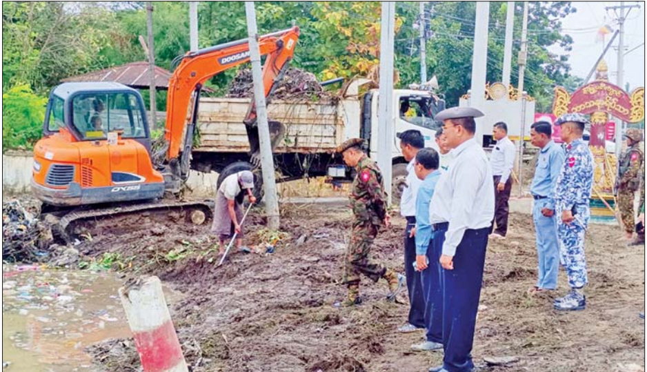
ထိုသို့ ဆောင်ရွက်ရာတွင် မိုးအဆက်မပြတ် သည်းထန်စွာ

တောင်ငူ စက်တင်ဘာ ၂၄ ပဲခူးတိုင်းဒေသကြီး တောင်ငူမြို့နယ်၌ စစ်တောင်းမြစ်ရေပြန်လည်ကျဆင်းသွားပြီဖြစ်သည့် အတွက် ပဲခူးတိုင်းဒေသကြီး ဝန်ကြီးချုပ်၏ လမ်းညွှန်မှုဖြင့် မြို့သန့်ရှင်း သာယာလှပရေးလုပ်ငန်းများအား စက်တင်ဘာ ၂၃ ရက်မှစတင်၍ ရေကြီးရေလျှံမှုဖြစ်ခဲ့ပြီး ရေဘေးသင့်ခဲ့သည့် ရပ်ကွက်/ကျေးရွာ၊ စာသင်ကျောင်း၊ ဘုန်းတော်ကြီးကျောင်း၊ ဆေးရုံ၊ ဆေးခန်း၊ သာသနိကအဆောက်အအုံများအား မြို့လုံးကျွတ် စုပေါင်းလုပ်အားပေးဆောင်ရွက်လျက်ရှိသည်။