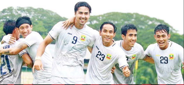
အာဆီယံကလပ်ပြိုင်ပွဲတွင် အဝေးကွင်း ထပ်မံကစားရမည့် ရှမ်းယူနိုက်တက်အသင်း ကစားသမားများကို တွေ့ရစဉ်။

ရန်ကုန် စက်တင်ဘာ ၂၄ ၂၀၂၄-၂၀၂၅ ရာသီ အာဆီယံကလပ် ချန်ပီယံရှစ်ပြိုင်ပွဲ အုပ်စုဒုတိယပွဲကို စက်တင်ဘာ ၂၅ ရက်နှင့် ၂၆ ရက်တွင် ကျင်းပမည်ဖြစ်ပြီး မြန်မာကလပ် ရှမ်းယူနိုက်တက်အသင်းသည် အဝေးကွင်းထပ်မံကစားရမည်ဖြစ်သည်။ စာမျက်နှာ ၁၉ ကော်လံ ၃ သို့ ❖