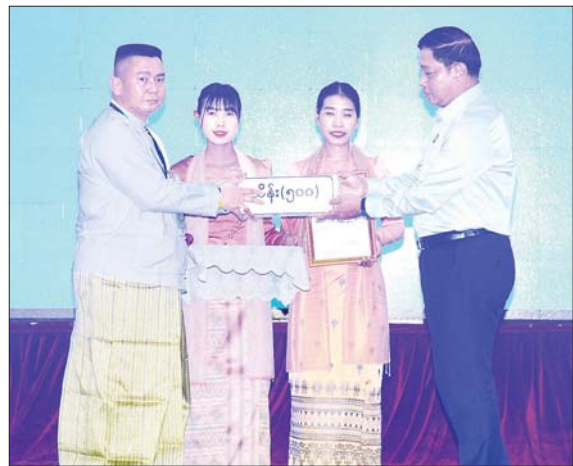
နိုင်ငံတော်စီမံအုပ်ချုပ်ရေးကောင်စီအဖွဲ့ဝင် ဗိုလ်ချုပ်ကြီး တင်အောင်စန်း ရေဘေးဒဏ် သင့်ခဲ့ရသည့်ဒေသများ၌ ကူညီကယ်ဆယ်ရေးနှင့် ပြန်လည်ထူထောင်ရေးလုပ်ငန်းများ ဆောင်ရွက်ရန်အတွက် စေတနာရှင်၊ အလှူရှင်များက ပေးအပ်လှူဒါန်းသည့် အလှူငွေ များကို လက်ခံရယူစဉ်။