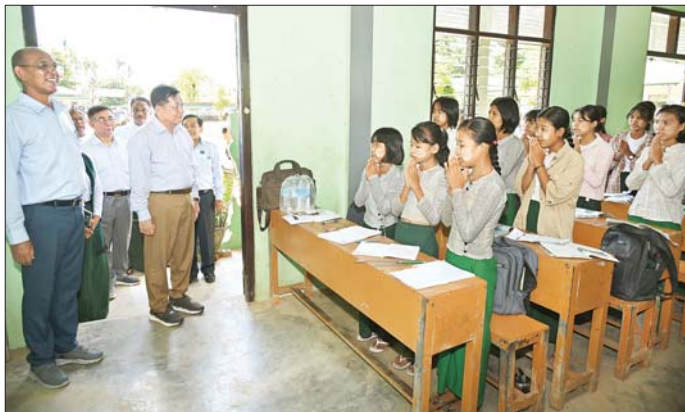
နိုင်ငံတော်စီမံအုပ်ချုပ်ရေးကောင်စီဥက္ကဋ္ဌ နိုင်ငံတော်ဝန်ကြီးချုပ် ဗိုလ်ချုပ်မှူးကြီး မင်းအောင်လှိုင် ဇေယျာသီရိမြို့နယ် ကျောက်ချက်ကျေးရွာ အခြေခံပညာအထက်တန်းကျောင်း၌ ပညာသင်ကြားနေသည့် ကျောင်းသား ကျောင်းသူများအား ကြည့်ရှုအားပေးစဉ်။

အထက်တန်းကျောင်းသို့ ရောက်ရှိပြီး ရေဝင်ရောက်မှုများအား ပြန်လည်ရှင်းလင်း ဆောင်ရွက်ထားရှိမှု၊ ကျောင်းသား ကျောင်းသူများ ပညာသင်ကြားနေမှု၊ ပညာရေးဝန်ကြီးဌာနမှ စာရေးကိရိယာ များနှင့် ကျောင်းသုံးစာအုပ်များ ထောက်ပံ့ ပေးထားမှု အခြေအနေများကို ကြည့်ရှု စစ်ဆေးပြီး ကျောင်းအုပ်ဆရာမကြီးနှင့် တာဝန်ရှိသူများ၏ တင်ပြချက်များအပေါ်