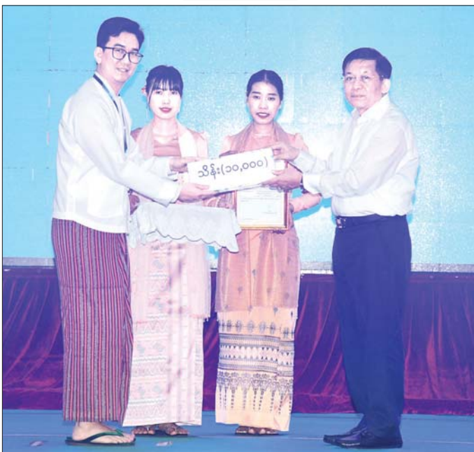
နိုင်ငံတော်စီမံအုပ်ချုပ်ရေးကောင်စီဥက္ကဋ္ဌ နိုင်ငံတော်ဝန်ကြီးချုပ် ဗိုလ်ချုပ်မှူးကြီး မင်းအောင်လှိုင် ရေးဘေးဒဏ်သင့်ခဲ့ရသည့်ဒေသများ၌ ကူညီကယ်ဆယ်ရေးနှင့် ပြန်လည်ထူထောင်ရေးလုပ်ငန်းများ ဆောင်ရွက်ရန်အတွက် စေတနာရှင်၊ အလှူရှင်များက ပေးအပ်လှူဒါန်းသည့် အလှူငွေများကို လက်ခံရယူစဉ်။

ဦးစွာ ရာဂီမုန်တိုင်းနှင့် ဆက်စပ်ဖြစ်ပွားသော ရေးဘေးကြောင့် သဘာဝဘေးအန္တရာယ်ကျရောက်ခဲ့မှု အခြေအနေများ၊ ရှာဖွေကယ်ဆယ် ထောက်ပံ့ရေးလုပ်ငန်းများ ဆောင်ရွက်ခဲ့မှုအခြေအနေများကို မှတ်တမ်းတင်ထားသည့် “သဘာဝဘေးဒဏ်ကြုံကြံခံရင်ဆိုင်ကျော်လွှားမှုနှင့် အတူပြန်လည်ထူထောင်ရေးမှာတက်ညီလက်ညီ ဝိုင်းဝန်းကူညီဆောင်ရွက်ကြပါစို့” Video Clip ကို ဖွင့်လှစ်ပြသသည်။