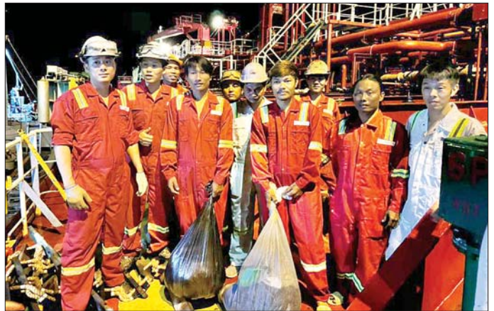
ပင်လယ်ပြင်အတွင်း မျောပါနေသော မြန်မာနိုင်ငံသား သုံးဦးကို ဗီယက်နမ်နိုင်ငံ အလံတင်သင်္ဘောက ကယ်ဆယ်ထားစဉ်။

ဗီယက်နမ်နိုင်ငံ အလံတင်စားအုန်းဆီတင်သင်္ဘော M.T PVT NEPTUNE သည် တိုင်းနိုင်ငံဖူးခက် (Phuket) ဆိပ်ကမ်းမှ အိန္ဒိယနိုင်ငံ ဟာလဒီးယာ (Halidra) စာမျက်နှာ ၁၁ ကော်လံ ၄ *