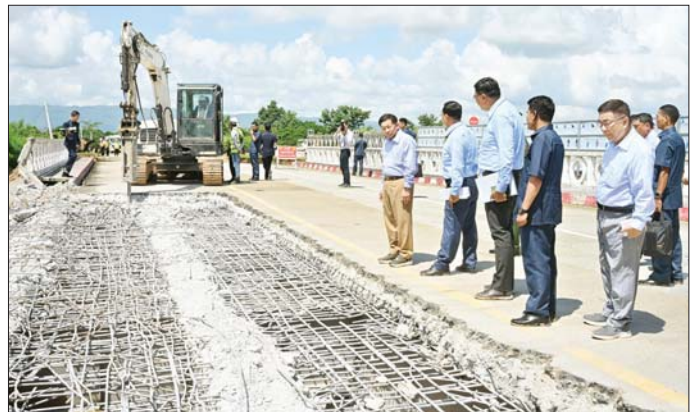
နိုင်ငံတော်စီမံအုပ်ချုပ်ရေးကောင်စီဥက္ကဋ္ဌ နိုင်ငံတော်ဝန်ကြီးချုပ် ဗိုလ်ချုပ်မှူးကြီး မင်းအောင်လှိုင် ပုဗ္ဗသီရိ မြို့ပတ်လမ်းပေါ်ရှိ သိုက်ချောင်းတံတား(ဆင်သေချောင်းကူး) ပြန်လည်ပြင်ဆင်နေမှုကို ကြည့်ရှု စစ်ဆေးစဉ်။