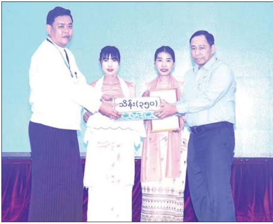
နိုင်ငံတော်စီမံအုပ်ချုပ်ရေးကောင်စီအဖွဲ့ဝင် ဒုတိယဗိုလ်ချုပ်ကြီး ရာပြည့် ရေဘေးဒဏ် သင့်ခဲ့ရသည့်ဒေသများ၌ ကူညီကယ်ဆယ်ရေးနှင့် ပြန်လည်ထူထောင်ရေးလုပ်ငန်းများ ဆောင်ရွက်ရန်အတွက် စေတနာရှင်၊ အလှူရှင်များက ပေးအပ်လှူဒါန်းသည့် အလှူငွေ များကို လက်ခံရယူစဉ်။