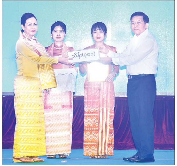
နိုင်ငံတော်စီမံအုပ်ချုပ်ရေးကောင်စီဥက္ကဋ္ဌ နိုင်ငံတော်ဝန်ကြီးချုပ် ဗိုလ်ချုပ်မှူးကြီး မင်းအောင်လှိုင် ရေးဘေးဒဏ်သင့်ခဲ့ရသည့်ဒေသများ၌ ကူညီကယ်ဆယ်ရေးနှင့် ပြန်လည်ထူထောင်ရေးလုပ်ငန်းများ ဆောင်ရွက်ရန် အတွက် ဝန်ကြီးဌာနများမှ စေတနာရှင်၊ အလှူရှင်များက ပေးအပ်လှူဒါန်းသည့် အလှူငွေများကို လက်ခံရယူစဉ်။

အခမ်းအနားသို့ အမျိုးသား သဘာဝဘေးအန္တရာယ်ဆိုင်ရာစီမံခန့်ခွဲမှုကော်မတီ ဥက္ကဋ္ဌ၊ နိုင်ငံတော် စီမံအုပ်ချုပ်ရေးကောင်စီ ဒုတိယဥက္ကဋ္ဌ ဒုတိယဝန်ကြီးချုပ် ဒုတိယ ဗိုလ်ချုပ်မှူးကြီး စိုးဝင်း၊ ကောင်စီတွဲဖက်အတွင်းရေးမှူး၊ ကောင်စီဝင်များ၊ ပြည်ထောင်စုဝန်ကြီးများနှင့် ပြည်ထောင်စုအဆင့်ပုဂ္ဂိုလ်များ၊ ကာကွယ်ရေးဦးစီးချုပ်ရုံးမှ အဆင့်မြင့်တပ်မတော် အရာရှိကြီးများ၊ နေပြည်တော် တိုင်းစစ်ဌာနချုပ် တိုင်းမှူး၊ ဒုတိယဝန်ကြီးများ၊ စေတနာရှင်အလှူရှင်များ၊ ဝန်ကြီးဌာနများမှ ဌာနဆိုင်ရာတာဝန်ရှိသူများ၊ လူမှုရေးအသင်းအဖွဲ့များ တက်ရောက်ကြသည်။