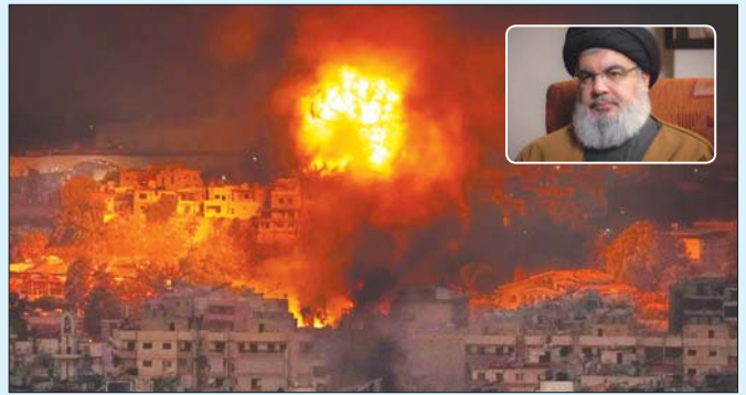
လေကြောင်း တိုက်ခိုက်မှုများ ဆက်တိုက်ပြုလုပ် ခဲ့ပြီး လက်ဘနွန်တောင်ပိုင်းတွင် လေကြောင်း လုပ်ဆောင်ခဲ့ကြောင်း သတင်းရင်းမြစ်များက တိုက်ခိုက်မှု အကြိမ် ၁၀၀ ကျော်နှင့် အရှေ့ပိုင်းရှိ မြို့ရွာ ၅၀ ခန့်ကို လေကြောင်းတိုက်ခိုက်မှုများ လုပ်ဆောင်ခဲ့ကြောင်း သတင်းရင်းမြစ်များက ပြောကြားသည်။ ဆင်ဟွာ

များအရ အစ္စရေးလေတပ်၏ တိုက်လေယာဉ်များက ဘေရွတ်မြို့ ဆင်ခြေဖုံးဒါဟီမှ နေအိမ်အဆောက် အအုံအောက် မြေအောက်တွင်တည်ရှိသည့် ဟစ်ဘိုလာတို့၏ ဗဟိုဌာနချုပ်တွင် ၎င်းအဖွဲ့၏ ထိပ်တန်းတပ်မှူးများရှိနေစဉ် တိုက်ခိုက်မှု လုပ်ဆောင်ခဲ့ကြောင်း ထုတ်ပြန်ချက်တွင် ဖော်ပြ ထားသည်။ အစ္စရေးတပ်ဖွဲ့က စက်တင်ဘာ ၂၃ ရက် ကတည်းက လက်ဘနွန်နိုင်ငံတစ်ဝန်း လေ ကြောင်းတိုက်ခိုက်မှုများ အပြင်းအထန်ပြုလုပ် ခဲ့ပြီး ၂၀၀၆ ခုနှစ်နောက်ပိုင်း ဒေသတွင်းအကြီး ဆုံးသော စစ်ဆင်ရေးအဖြစ် မှတ်တမ်းဝင်ခဲ့သည်။ အစ္စရေးတပ်မတော် လေယာဉ်များက လက်ဘနွန်တောင်ပိုင်းနှင့် အရှေ့ပိုင်းရှိ ဟစ်ဘို လာတပ်ဖွဲ့ တည်နေရာများနှင့် မြို့ရွာများကို စက်တင်ဘာ ၂၈ ရက် နံနက်အစောပိုင်းကတည်းက