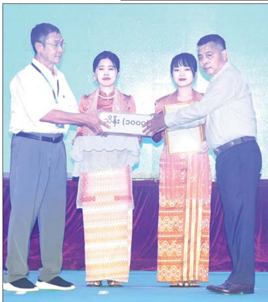
နိုင်ငံတော် စီမံအုပ်ချုပ်ရေး ကောင်စီ တွဲဖက်အတွင်း ရေးမှူး ဗိုလ်ချုပ် ကြီး ရဲဝင်းဦး ရေဘေးဒဏ်သင့် ခဲ့ရသည့် ဒေသ များ၌ ကူညီ ကယ်ဆယ်ရေး နှင့် ပြန်လည် ထူထောင်ရေး လုပ်ငန်းများ ဆောင်ရွက်ရန် အတွက် စေတနာရှင်၊ အလှူရှင်များက ပေးအပ်လှူဒါန်း သည့် အလှူငွေ များကို လက်ခံရယူစဉ်။