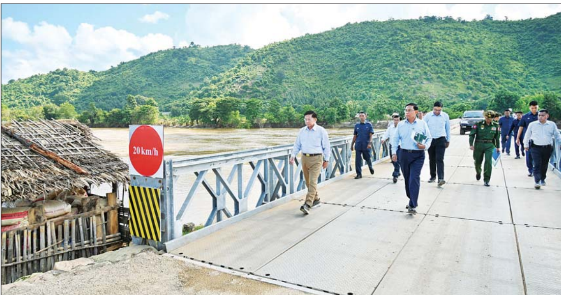
နိုင်ငံတော်စီမံအုပ်ချုပ်ရေးကောင်စီဥက္ကဋ္ဌ နိုင်ငံတော်ဝန်ကြီးချုပ် ဗိုလ်ချုပ်မှူးကြီး မင်းအောင်လှိုင် ပေါင်းလောင်းမြစ်ကူးတံတား(အဝေရာ) နှစ်လွှာတစ်ထပ် ယာယီဘေးလိတ်တားထိုး၍ ပြင်ဆင်ပြီးစီးမှု အခြေအနေကို ကြည့်ရှုစစ်ဆေးစဉ်။

နေပြည်တော် စက်တင်ဘာ ၂၈ နိုင်ငံတော်စီမံအုပ်ချုပ်ရေးကောင်စီ ဥက္ကဋ္ဌ နိုင်ငံတော်ဝန်ကြီးချုပ် ဗိုလ်ချုပ်မှူးကြီး မင်းအောင်လှိုင်သည် ယနေ့နံနက်ပိုင်းတွင် ကောင်စီတွဲဖက်အတွင်းရေးမှူး ဗိုလ်ချုပ်ကြီး ရဲဝင်းဦး၊ ပြည်ထောင်စုဝန်ကြီးများဖြစ်ကြသည့် ဦးမျိုးသန့်၊ ဒေါက်တာညွန့်ဖေ၊ နေပြည်တော်ကောင်စီဥက္ကဋ္ဌ ဦးသန်းထွန်းဦး၊ ကာကွယ်ရေးဦးစီးချုပ်ရုံးမှ အဆင့်မြင့် တပ်မတော်အရာရှိကြီးများ၊ နေပြည်တော်တိုင်းစစ်ဌာနချုပ်တိုင်းမှူးနှင့် တာဝန်ရှိသူများ လိုက်ပါ၍ နေပြည်တော် ကောင်စီနယ်မြေအတွင်း မိုးအဆက်မပြတ် ရွာသွန်းမှုကြောင့် ပျက်စီးမှုများဖြစ်ပေါ်ခဲ့မှုအပေါ် ပြန်လည်ထူထောင်ရေးလုပ်ငန်း ဆောင်ရွက်နေမှုအခြေအနေများအား လိုက်လံကြည့်ရှုစစ်ဆေးသည်။