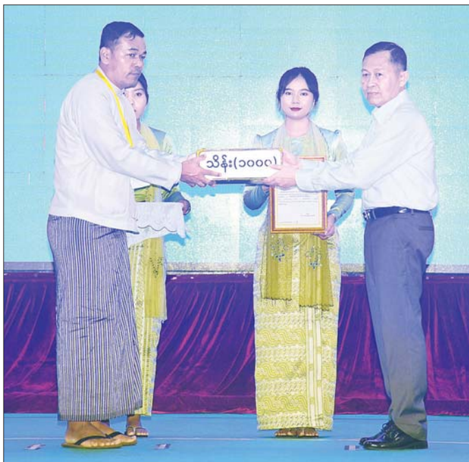
နိုင်ငံတော်စီမံအုပ်ချုပ်ရေးကောင်စီ ဒုတိယဥက္ကဋ္ဌ ဒုတိယဝန်ကြီးချုပ် ဒုတိယဗိုလ်ချုပ်မှူးကြီး စိုးဝင်း ရေဘေးဒဏ်သင့်ခဲ့ရသည့်ဒေသများ၌ ကူညီကယ်ဆယ်ရေးနှင့် ပြန်လည်ထူထောင်ရေးလုပ်ငန်းများ ဆောင်ရွက်ရန်အတွက် စေတနာရှင်၊ အလှူရှင်များက ပေးအပ်လှူဒါန်းသည့် အလှူငွေများကို လက်ခံရယူစဉ်။

မိခင်မုန့်တိုင်းဒဏ်ကြောင့် ရေဝင်၊ ရေဝပ်မှု ဖြစ်ပေါ်ခဲ့မှုများကို သင်ခန်းစာယူ၍ ပုဂံရေးဟောင်း ယဉ်ကျေးမှုနယ်မြေ၌ လိုအပ်သည့် ကြိုတင်ပြင်ဆင်မှုလုပ်ငန်းများကို ဆောင်ရွက်ခဲ့ခြင်းကြောင့် ယခု မိုးသည်းထန်စွာ ရွာသွန်းချိန်တွင် ထိခိုက်ပျက်စီးမှု အနည်းငယ်သာ ရှိခဲ့သည့် အခြေအနေများကို ရှင်းလင်းပြောကြားသည်။ ဆက်လက်ပြောကြားရာတွင် မိမိတို့အနေဖြင့် နိုင်ငံတော်တွင် ဖြစ်ပေါ်ခဲ့သည့် သဘာဝဘေးဒဏ် များကို သင်ခန်းစာယူပြီး နောင်ဖြစ်ပေါ်ချိန်များတွင် ထိခိုက် ပျက်စီးမှု အနည်းဆုံးဖြစ်စေ ရေး ကြိုတင်ပြင်ဆင်မှုများကို ဆောင်ရွက်သွားရန် လိုကြောင်း၊ နိုင်ငံတွင်းရှိ မြစ်များ၊ ချောင်းများ တစ်လျှောက်၌ ရေလမ်းကြောင်း