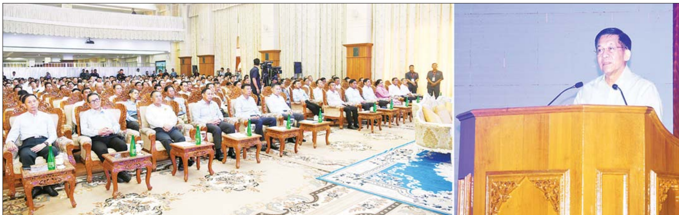
နိုင်ငံတော်စီမံအုပ်ချုပ်ရေးကောင်စီဥက္ကဋ္ဌ နိုင်ငံတော်ဝန်ကြီးချုပ် ဗိုလ်ချုပ်မှူးကြီး မင်းအောင်လှိုင် ရေဘေးဒဏ်သင့်ခဲ့ရသည့်ဒေသများ၌ ကူညီကယ်ဆယ်ရေးနှင့် ပြန်လည်ထူထောင်ရေးလုပ်ငန်းများ ဆောင်ရွက်ရန်အတွက် စေတနာရှင်၊ အလှူရှင်များက အလှူငွေများ ပေးအပ်လှူဒါန်းမှုအပေါ် ကျေးဇူးတင်စကား ပြန်လည်ပြောကြားစဉ်။