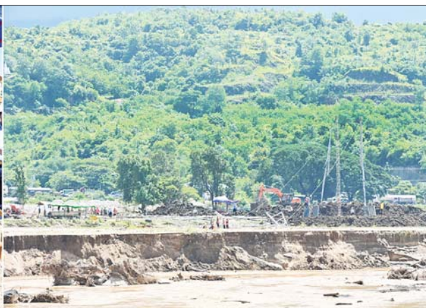
နိုင်ငံတော်စီမံအုပ်ချုပ်ရေးကောင်စီဥက္ကဋ္ဌ နိုင်ငံတော်ဝန်ကြီးချုပ် ဗိုလ်ချုပ်မှူးကြီး မင်းအောင်လှိုင် ကင်းသာလမ်းခွဲအနီးရှိ ၂၃၀ ကေစီ သာစည် - ရွှေမြို့၊ ဓာတ်အားလိုင်း ပြန်လည်ပြုပြင်ရေး ဆောင်ရွက်နေမှုကို ကြည့်ရှုစစ်ဆေးစဉ်။