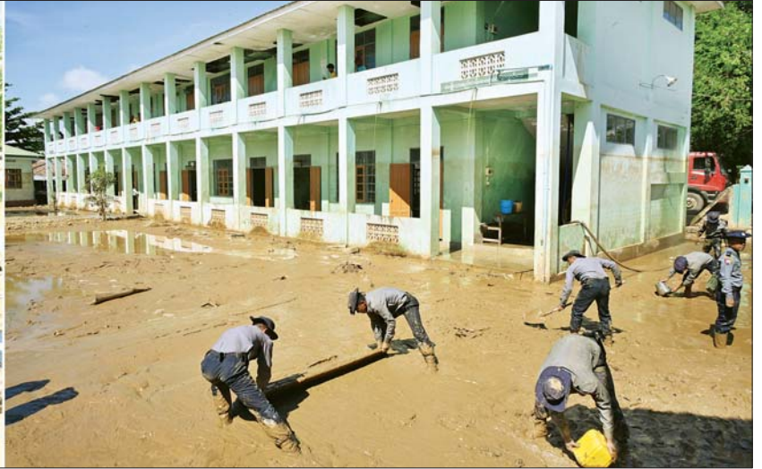
နိုင်ငံတော်စီမံအုပ်ချုပ်ရေးကောင်စီဥက္ကဋ္ဌ နိုင်ငံတော်ဝန်ကြီးချုပ် ဗိုလ်ချုပ်မှူးကြီး မင်းအောင်လှိုင် ဆင်သေကျေးရွာ အခြေခံပညာအထက်တန်းကျောင်း(ခွဲ)၌ နန်းများ ဖယ်ရှားရှင်းလင်းခြင်းနှင့် သန့်ရှင်းရေးလုပ်ငန်း ဆောင်ရွက်နေမှုများကို ကြည့်ရှုစစ်ဆေးစဉ်။

ဖွင့်လှစ် သင်ကြားပေးနိုင်ရေးအတွက် လိုအပ်သည်များကို အမြန်ဆုံးဆောင်ရွက် ပေးသွားရန် တာဝန်ရှိသူများကို မှာကြား သည်။