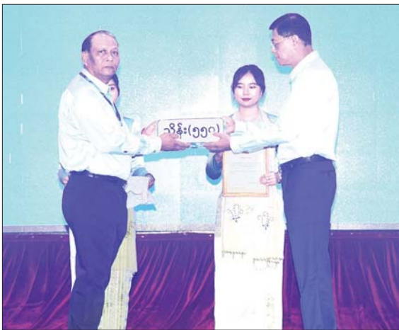
နိုင်ငံတော်စီမံအုပ်ချုပ်ရေးကောင်စီအဖွဲ့ဝင် ဗိုလ်ချုပ်ကြီး မြထွန်းဦး ရေဘေးဒဏ် သင့်ခဲ့ရသည့်ဒေသများ၌ ကူညီကယ်ဆယ်ရေးနှင့် ပြန်လည်ထူထောင်ရေးလုပ်ငန်းများ ဆောင်ရွက်ရန်အတွက် စေတနာရှင်၊ အလှူရှင်များက ပေးအပ်လှူဒါန်းသည့် အလှူငွေ များကို လက်ခံရယူစဉ်။

အတူတကွ ပိုင်းဝန်း ဆောင်ရွက်သွားကြရန်လို အလှူရှင်များ၏ သန့်ရှင်း သောစိတ်ဖြင့် လှူဒါန်းခဲ့သည့် လှူဒါန်းမှုများကို အမှန်တကယ် လိုအပ်နေသူများထံသို့ ရောက်ရှိ နိုင်ရေး စနစ်တကျစီမံခန့်ခွဲ ဆောင်ရွက်သွားကြရန်လိုကြောင်း၊ အရောင်အသွေးကင်းရှင်းစွာဖြင့် လှူဒါန်းလာသည့် ပြည်ပမှလှူဒါန်း မှုများကိုလည်း မိမိတို့အနေဖြင့် စနစ်တကျ လက်ခံဆောင်ရွက် ပေးလျက်ရှိကြောင်း၊ စေတနာရှင် အလှူရှင်များအနေဖြင့် နိုင်ငံစီးပွား ဖွံ့ဖြိုးတိုးတက်ရေးလုပ်ငန်းများ၊ နိုင်ငံသူ၊ နိုင်ငံသားများ၏ ပညာ ရည်မြှင့်တင်မှု လုပ်ငန်းများတွင် လည်း ပိုင်းဝန်းဆောင်ရွက်ပေးကြ စေလိုကြောင်း၊ နိုင်ငံတော်အနေ ဖြင့် ရေဘေးဒဏ်ကျရောက်ခဲ့ရ သည့် ကျောင်းများအား အမြန်ဆုံး ပြန်လည် ဖွင့်လှစ်နိုင်ရေးနှင့် ကလေးငယ်များ၏ ပညာရေး နောက်ကျမှုမရှိစေရေး ကြိုးပမ်း ဆောင်ရွက်လျက်ရှိကြောင်း၊ အစိုးရ တစ်ခုတည်း ဆောင်ရွက်၍မရဘဲ မိမိတို့အားလုံး ပိုင်းဝန်းဆောင်ရွက် မှသာလျှင် နိုင်ငံတော်တည်ငြိမ် အေးချမ်းပြီး ဖွံ့ဖြိုးတိုးတက်နိုင် မည်ဖြစ်ကြောင်း၊ ယနေ့တွင် လာရောက် လှူဒါန်းကြသည့် စေတနာရှင် အလှူရှင်များ၏ လှူဒါန်းမှုများကို အထူးပင် ကျေးဇူးတင်ရှိကြောင်းနှင့် နိုင်ငံ တော်ဖွံ့ဖြိုးတိုးတက်ရေးလုပ်ငန်း များတွင် မိမိတို့တတ်နိုင်သည့် နယ်ပယ်မှ အတူတကွပိုင်းဝန်း ဆောင်ရွက်သွားကြရန်လိုကြောင်း ပြောကြားသည်။