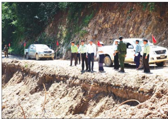
အရှည် ၅၆၀ မီတာ၊ သံကွက္ကနာရစ် သံလွင်(တာဆွတ်တိန်း) တံတား တည်ဆောက်ရေး စီမံကိန်းလုပ်ငန်း များက လုပ်ငန်းဆောင်ရွက်ပြီးစီးမှု