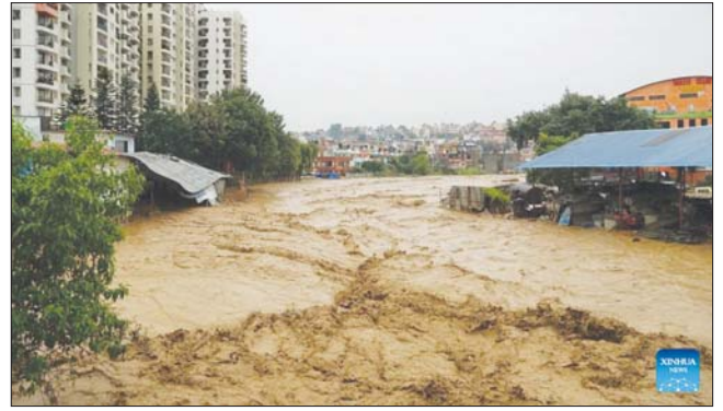
နီပေါနိုင်ငံ ခတ္တမန္တူမြို့ ရပ်ကွက်တစ်ခု၌ မိုးသည်းထန်စွာ ရွာသွန်းမှုကြောင့် ရေကြီးနေစဉ်။

ဒန်ဗဟာဒူးခါကီက ပြောကြားသည်။ ရေကြီးမှုနှင့် မြေပြိုမှုများကြောင့် အနည်းဆုံး လူဦးရေ ၄၀၀ ခန့် အိုးအိမ်စွန့်ခွာ ထွက်ပြေးခဲ့ရ မှုနှင့်အတူ ခတ္တမန္တူအပါအဝင် ဒေသအများစုတွင် မိုးသည်းထန်စွာရွာသွန်းမှုကြောင့် ရေဘေးသင့် ခဲ့ရပြီး မြေပြိုမှုများကြောင့် လမ်းအများအပြား လည်း ပိတ်ဆို့မှုဖြစ်ပေါ်လျက်ရှိကြောင်း ခါကီက ပြောသည်။ နီပေါမိုးလေဝသနှင့် စလဗေဒဗွေန်ကြားမှု ဦးစီးဌာနမှ စက်တင်ဘာ ၂၉ ရက်အထိ မိုးသည်း ထန်စွာ ရွာသွန်းဖွယ်ရှိသေးကြောင်း ထုတ်ပြန် ထားသည်။ ဆင်ဟွာ