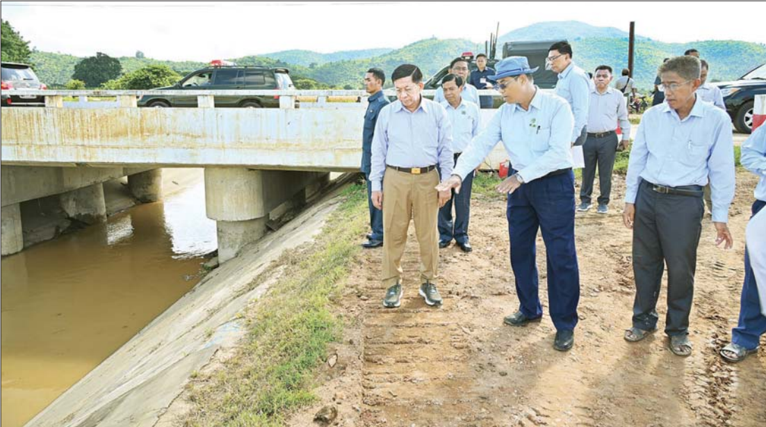
နိုင်ငံတော်စီမံအုပ်ချုပ်ရေးကောင်စီဥက္ကဋ္ဌ နိုင်ငံတော်ဝန်ကြီးချုပ် ဗိုလ်ချုပ်မှူးကြီး မင်းအောင်လှိုင် ပေါင်းလောင်း(အဝေရာဆည်) လက်ယာရေပေးမြောင်းမကြီးမြောင်းတာပေါင်ကျိုးပေါက်ခဲ့သည့်နေရာများ ပြန်လည်ပြင်ဆင်ခြင်းဆောင်ရွက်နေမှုကို ကြည့်ရှုစစ်ဆေးစဉ်။

ရှင်းလင်း တင်ပြချက်များအပေါ် နိုင်ငံတော်စီမံအုပ်ချုပ်ရေးကောင်စီဥက္ကဋ္ဌ နိုင်ငံတော်ဝန်ကြီးချုပ်က ပြန်လည်ပြုပြင်ရေးလုပ်ငန်းများ ဆောင်ရွက်ရာတွင် ရေရှည်တည်တံ့ခိုင်မြဲရေးအတွက် စနစ်တကျ တွက်ချက်ဆောင်ရွက်သွားရန်လိုကြောင်း၊ ရေနုတ်မြောင်းများ ရေဝင်ရေထွက်ကောင်းမွန်စေရေး ပြန်လည်တူးဖော်သွားရန်လိုကြောင်း၊ ရေနုတ်မြောင်းများ ပြန်လည်တူးဖော်ဆောင်ရွက်ရာတွင် တစ်နေရာတည်းဆောင်ရွက်၍ မရဘဲ အဆင့်ဆင့်ရေစီးဆင်းမှုကောင်းမွန်အောင်နေရာစုံ၌ ဆောင်ရွက်သွားရန်လိုကြောင်း၊ ရေမြောင်းများ၊ တူးမြောင်းများ၌ ရေဝင်ရေထွက်ကောင်းမွန်စေရန် နှစ်စဉ် စစ်ဆေးမှုများ ပြုလုပ်နေရန်လိုကြောင်းနှင့် အခြားလိုအပ်သည်များကို မှာကြားသည်။