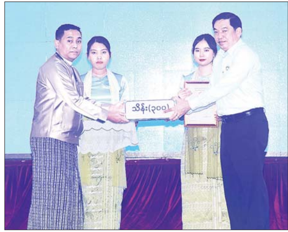
နိုင်ငံတော်စီမံအုပ်ချုပ်ရေးကောင်စီအဖွဲ့ဝင် ဗိုလ်ချုပ်ကြီး ညိုစော ရေဘေးဒဏ် သင့်ခဲ့ရသည့်ဒေသများ၌ ကူညီကယ်ဆယ်ရေးနှင့် ပြန်လည်ထူထောင်ရေးလုပ်ငန်းများ ဆောင်ရွက်ရန်အတွက် စေတနာရှင်၊ အလှူရှင်များက ပေးအပ်လှူဒါန်းသည့် အလှူငွေ များကို လက်ခံရယူစဉ်။

အခမ်းအနားအပြီးတွင် နိုင်ငံတော် စီမံအုပ်ချုပ်ရေးကောင်စီ ဥက္ကဋ္ဌ နိုင်ငံတော်ဝန်ကြီးချုပ်နှင့် အဖွဲ့ဝင်များသည် စေတနာရှင်၊ အလှူရှင်များအား ရင်းရင်းနှီးနှီး နှုတ်ဆက်ပြီး လက်ဖက်ရည်ပိုင်း ဖြင့် တည်ခင်းစည်ခံခဲ့သည်။ များ၌ ကူညီကယ်ဆယ်ရေးနှင့် ပြန်လည်ထူထောင်ရေးလုပ်ငန်းများ ဆောင်ရွက်ရန်အတွက် စေတနာရှင်၊ အလှူရှင်များက ပေးအပ်လှူဒါန်းသည့် အလှူငွေ (ငွေကျပ် ၁၀ ဒသမ ၅ ဘီလီယံ) ကျော်ကို လက်ခံရရှိခဲ့ကြောင်း သတင်းရရှိသည်။ သတင်းစဉ်