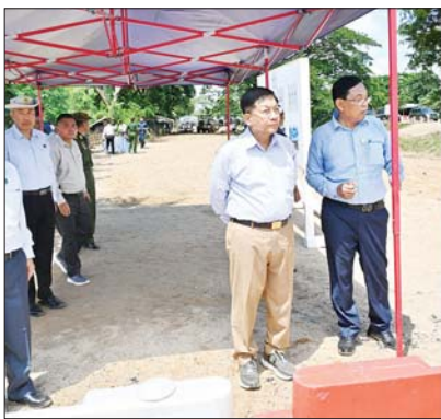
နိုင်ငံတော်စီမံအုပ်ချုပ်ရေးကောင်စီဥက္ကဋ္ဌ နိုင်ငံတော်ဝန်ကြီးချုပ် ဗိုလ်ချုပ်မှူးကြီး မင်းအောင်လှိုင် နှင့် နောင်ချောင်းတံတား(အဆုံ) ယာယီဘေးလိတ်တား တည်ဆောက်ပြုပြင်ပြီးစီးမှုနှင့် တံတားချဉ်းကပ်လမ်းကမ်းကပ်ခုံ ပြန်လည်ပြုပြင်ဆောင်ရွက်နေမှုကို ကြည့်ရှုစစ်ဆေးစဉ်။

ဓာတ်အားလိုင်းတာဝါတိုင်များ ပြုပြင်ဆောင်ရွက်လျက်ရှိမှု ဆက်လက်၍ နိုင်ငံတော်စီမံအုပ်ချုပ်ရေးကောင်စီဥက္ကဋ္ဌ နိုင်ငံတော်ဝန်ကြီးချုပ်နှင့် အဖွဲ့ဝင်များသည် နေပြည်တော်-တပ်ကုန်း လမ်းကြောင်းအတိုင်း မော်တော်ယာဉ်များဖြင့် သွားရောက်ခဲ့ပြီး ကင်းသာလမ်းခွဲအနီးရှိ ၂၃၀ ကေစီ သာစည် - ရွှေမြို့ ဓာတ်အားလိုင်း တာဝါတိုင်အမှတ် ၃၀၁ မှ ၃၀၅ အထိ တာဝါတိုင် ၅ တိုင် ပြုလုပ်ပျက်စီးခဲ့မှုနှင့် ၂၃၀ ကေစီ ရွှေမြို့-နေပြည်တော် (၂) ဓာတ်အားလိုင်း တာဝါတိုင်အမှတ် ၁၂ မှ ၁၅ အထိ တာဝါတိုင် ၄ တိုင် ပြုလုပ်ပျက်စီးမှု တို့အား ပြန်လည်ပြုပြင်ရေး ဆောင်ရွက်နေမှုများကို ကြည့်ရှုစစ်ဆေးရာ တာဝန်ရှိသူများက ရှင်းလင်းတင်ပြသည်။ ရှင်းလင်းတင်ပြမှုများအပေါ် နိုင်ငံတော် စီမံအုပ်ချုပ်ရေးကောင်စီဥက္ကဋ္ဌ နိုင်ငံတော်