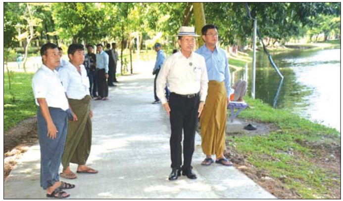
ရောဂါတိုင်းဒေသကြီးဝန်ကြီးချုပ် ဦးတင်မောင်ဝင်း ပုသိမ်မြို့ ကန့်သုံးဆင့်ကန့်ပတ်လမ်း တိုးချဲ့ ဆောင်ရွက်နေမှုများကို ကြည့်ရှုစစ်ဆေးစဉ်။

မြှင့်တင်ခြင်းလုပ်ငန်း ဆောင်ရွက်နေမှုများကို ကြည့်ရှုစစ်ဆေးပြီး တာဝန်ရှိသူများ၏ ရှင်းလင်း တင်ပြမှုများအပေါ် ကန့်ပတ်လမ်းအား လမ်းပန်းများ စနစ်တကျဆောင်ရွက်စေရေး၊ အများပြည်သူများ စိတ်အေးချမ်းစွာ အနားယူနိုင်စေရေး၊ မြက်ခင်းများ စနစ်တကျ စိုက်ပျိုးစေရေး၊ ပျိုးဥယျာဉ်များ စနစ် တကျစိုက်ပျိုးစေရေးနှင့် အမှိုက်ပုံးများထားရှိ၍ အမှိုက်များစနစ်တကျ စွန့်ပစ်စေရေးနှင့် သတ်မှတ် ကာလအတွင်း ပြီးစီးစေရေး မှာကြားသည်။ ထို့နောက် တိုင်းဒေသကြီး ဝန်ကြီးချုပ်နှင့် တာဝန်ရှိသူများက လမ်းလုပ်ငန်းဆောင်ရွက်နေမှုများ ကို ကြည့်ရှုစစ်ဆေးခဲ့ပြီး green area ဆောင်ရွက် မည့်အခြေအနေများကို ရှင်းလင်းတင်ပြမှုအပေါ် တိုင်းဒေသကြီး ဝန်ကြီးချုပ်က လမ်းအရည်အသွေး ပြည့်စီရေးနှင့် သတိမှတ်ကာလအတွင်း ပြီးစီးစေ ရေးမှာကြားခဲ့ကြောင်း သိရသည်။ တိုင်းဒေသကြီး(ပြန်/ဆက်)