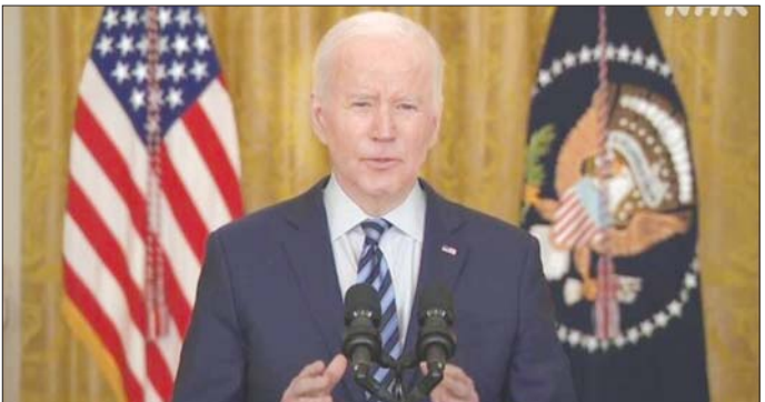
ဖက်ဒရယ်အစိုးရ အဖွဲ့အစည်းအဖြစ် ဖယ်ရှားရင်းလင်းရန် အခွင့်အရေးနှင့် တာဝန်ရှိ ခေါ်ဆိုကာ အစွဲအစားသည် ၎င်း၏ ပြည်သူ့ နယ်မြေနှင့် ကြောင်း၊ ဂျွန်ကာဘီက ပြောသည်။ အချုပ်အခြာအာဏာဖြစ်ခြင်းကြောင့် သူတို့သည် အင်န်အိတ်ချ်ကေ

၎င်းက ဖက်ဒရယ်အစိုးရ ကွပ်ကဲမှုဖွဲ့စည်းပုံ သည် ပျက်စီးလွန်းပါးဖြစ်နေကြောင်း၊ လွန်ခဲ့သော ရက်အနည်းငယ်အတွင်း အစွဲအစားတပ်မတော်က နုံးကျည်နှင့် ဒရုန်းထောင်ချီတို့ ဖျက်ဆီးနိုင်ခဲ့ကြောင်း ပြောသည်။ ထို့ပြင် ယနေ့ ဖက်ဒရယ်အစိုးရ သောသီတင်းပတ်က ဖက်ဒရယ်အစိုးရ မဟုတ်ဘူးဆိုတာ မေးခွန်းထုတ်စရာမရှိကြောင်း ၎င်းက ဆက်ပြော သည်။