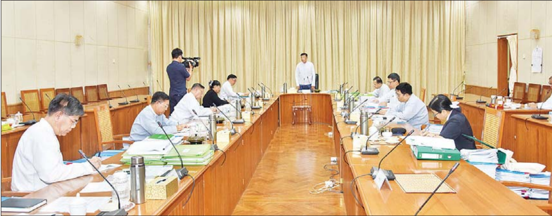
နိုင်ငံတော်စီမံအုပ်ချုပ်ရေးကောင်စီအဖွဲ့ဝင်၊ ဒုတိယဝန်ကြီးချုပ်နှင့် မြန်မာနိုင်ငံ ရင်းနှီးမြှုပ်နှံမှုကော်မရှင်ဥက္ကဋ္ဌ ဗိုလ်ချုပ်ကြီး မြထွန်းဦး၊ မြန်မာနိုင်ငံရင်းနှီးမြှုပ်နှံမှု ကော်မရှင်၏ (၈/၂၀၂၄) ကြိမ်မြောက် အစည်းအဝေးတွင် အမှာစကားပြောကြားစဉ်။

နေပြည်တော် စက်တင်ဘာ ၃၀ မြန်မာနိုင်ငံရင်းနှီးမြှုပ်နှံမှု ကော်မရှင်၏ (၈/၂၀၂၄) ကြိမ်မြောက် အစည်းအဝေးကို ယနေ့ နံနက်ပိုင်းတွင် နေပြည်တော်ရှိ ရုံးအမှတ်(၁၈) အစည်းအဝေးခန်းမ၌ ကျင်းပရာ အစည်းအဝေးသို့ နိုင်ငံတော်စီမံအုပ်ချုပ်ရေးကောင်စီအဖွဲ့ဝင်၊ ဒုတိယဝန်ကြီးချုပ်နှင့် မြန်မာနိုင်ငံ ရင်းနှီးမြှုပ်နှံမှု ကော်မရှင်ဥက္ကဋ္ဌ ဗိုလ်ချုပ်ကြီး မြထွန်းဦးနှင့် ကော်မရှင်အဖွဲ့ဝင်များ တက်ရောက်ကြသည်။