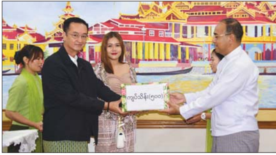
Red Mountain production Co. Ltd. က အောင်ရတနာ ကုမ္ပဏီလီမိတက်က ငွေကျပ် သိန်း ၅၀၀ ကိုလည်းကောင်း၊ ငွေကျပ် သိန်း ၃၀၀ ကိုလည်းကောင်း၊ သုဓမ္မဇာတိစောတရ ဦးအောင်သန်း၊ မြန်မာ ပြည်ပအလုပ်အကိုင်ဝန်ဆောင်မှု

တောင်ကြီး စက်တင်ဘာ ၃၀ ရှမ်းပြည်နယ်ဝန်ကြီးချုပ် ဦးအောင်အောင်၊ ပြည်နယ်ဝန်ကြီးများ၊ ပြည်နယ်ဥပဒေချုပ်နှင့် တာဝန်ရှိသူများသည် စက်တင်ဘာ ၃၀ ရက် နံနက် ၁၀ နာရီက ရှမ်းပြည်နယ် အစိုးရအဖွဲ့ရုံး ဧည့်ခန်းမ၌ ကျင်းပသည့် ရေဘေးသင့်ပြည်သူများအတွက် အလှူငွေပေးအပ်လှူဒါန်းပွဲသို့ တက်ရောက်သည်။