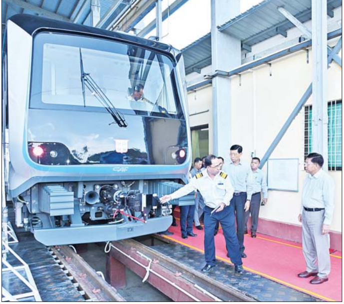
နိုင်ငံတော်စီမံအုပ်ချုပ်ရေးကောင်စီဥက္ကဋ္ဌ နိုင်ငံတော်ဝန်ကြီးချုပ် ဗိုလ်ချုပ်မှူးကြီး မင်းအောင်လှိုင် စပိန်နိုင်ငံမှ ရောက်ရှိလာသည့် DEMU ရထားတွဲဆိုင်းအသစ်များအား ကြည့်ရှုစစ်ဆေးစဉ်။