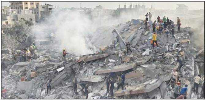
အစ္စရေးလေကြောင်းတိုက်ခိုက်မှုအပြီး အပျက်အစီးများအကြား အသက်ရှင်ကျန်ရစ်သူများအား ရှာဖွေနေသည့် ပါလက်စတိုင်းဒေသခံများ။

ပါလက်စတိုင်းရှိ ဟားမားစ်စစ်သွေးကြွအဖွဲ့သည် ပြီးခဲ့သောနှစ် အောက်တိုဘာ ၇ ရက်တွင် အစ္စရေးနိုင်ငံအပေါ် ကြီးမားသော အကြမ်းဖက်တိုက်ခိုက်မှုများ ပြုလုပ်ခဲ့ရာ လူပေါင်း ၁၂၀၀ ခန့် သေဆုံးပြီး ၂၅၀ ဦးအား ဘေးစာခံအဖြစ် ဖမ်းဆီးသော်လည်းကောင်း၊ ယခုအချိန်အထိ စစ်သွေးကြွများ၏ လက်ထဲတွင် ဓားစာခံ ၁၀၀ ဦးအား ဖမ်းဆီးထားဆဲဖြစ်သည်။ အစ္စရေးတပ်မတော်က ဂါဇာကမ်းမြောင်းဒေသတွင် ဟားမားစ်အဖွဲ့ကို ဖြိုခွင်းပြီး ကျန်ရှိသော ဓားစာခံများကို လွတ်ပေးရန် ကြိုးပမ်းလျက်ရှိသည်။ ဟားမားစ်တို့ကမူ ဂါဇာကမ်းမြောင်းဒေသ တောင်ပိုင်းရှိ ၎င်းတို့၏ တပ်ဖွဲ့များအား ဖျက်သိမ်းလိုက်ကြောင်း ဆိုသည်။ အစ္စရေးတပ်မတော်က ဂါဇာမြောက်ပိုင်းရှိ ဂျာဘာလီယာတွင် အောက်တိုဘာ ၆ ရက်က မြေပြင်ထိုးစစ်ကို ပြန်လည်စတင်ခဲ့ပြီး အဆိုပါတိုက်ခိုက်မှုများသည် ဟားမားစ်တို့ ပြန်လည်စုဖွဲ့လာမှုကို တားဆီးရန် ရည်ရွယ်ကြောင်း ပြောကြားသည်။ ဂါဇာတွင် တိုက်ခိုက်မှုများ စတင်ချိန်မှစ၍ လူပေါင်း ၄၁၈၇၀ သေဆုံးခဲ့ကြောင်း ဂါဇာရှိ ကျန်းမာရေး အရာရှိများက အောက်တိုဘာ ၆ ရက်တွင် ပြောကြားသည်။ ခန့်မှန်းခြေအားဖြင့် လူဦးရေ ၁ ဒသမ ၉ သန်း သို့မဟုတ် ဂါဇာရှိ လူဦးရေအားလုံး၏ ၉၀ ရာခိုင်နှုန်းသည် အိုးမဲ့အိမ်မဲ့ဖြစ်ခဲ့ရသည်။ စားနပ်ရိက္ခာနှင့် ရေပြတ်လပ်မှုနှင့် ပြည်သူ့ကျန်းမာရေးအခြေအနေများ ပိုမိုဆိုးရွားလာခြင်း