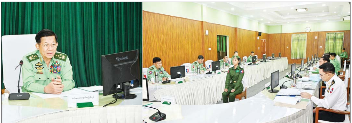
နိုင်ငံတော်စီမံအုပ်ချုပ်ရေးကောင်စီဥက္ကဋ္ဌ တပ်မတော်ကာကွယ်ရေးဦးစီးချုပ် ဗိုလ်ချုပ်မှူးကြီး မင်းအောင်လှိုင် တပ်မတော် (ကြည်း) ဗိုလ်သင်တန်းကျောင်း(မှော်ဘီ) ဘွဲ့ရအမျိုးသမီးဗိုလ်လောင်းသင်တန်း အမှတ်စဉ်(၁၁) စစ်လက်ရုံးရွေးချယ်ပွဲတွင် ဗိုလ်လောင်းတစ်ဦးချင်း စိစစ်ရွေးချယ်စဉ်။