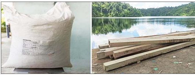
ပဲခူးတိုင်းဒေသကြီး၌ ဖမ်းဆီးရမိမှု။

နေပြည်တော် အောက်တိုဘာ ၇ တရားမဝင်ကုန်သွယ်မှုတိုက်ဖျက်ရေး ဦးဆောင်ကော်မတီ၏ ကြီးကြပ်ကွပ်ကဲမှုဖြင့် တရားမဝင်ကုန်သွယ်မှုများကို ဥပဒေနှင့်အညီ ထိရောက်စွာ တားဆီးအရေးယူနိုင်ရေး ဆောင်ရွက်လျက်ရှိရာ အောက်တိုဘာ ၆ ရက်တွင် နေပြည်တော်တရားမဝင်ကုန်သွယ်မှုတိုက်ဖျက်ရေးအဖွဲ့အဖွဲ့၏ စီမံခန့်ခွဲမှုဖြင့် တာဝန်ကျပေးပေါင်းအဖွဲ့က စစ်ဆေးမှုများ ဆောင်ရွက်ခဲ့ရာ လယ်ဝေးမြို့ တောင်စဉ်အေးပွဲပေါင်းစစ်ဆေးရေးကိတ်၌ လိုင်စင်မဲ့ Toyota Caldina မော်တော်ယာဉ်တစ်စီး (ခန့်မှန်းတန်ဖိုးငွေကျပ် ၇၀၀၀၀၀)ကို ဖမ်းဆီးရမိခဲ့ပြီး ပို့ကုန်သွင်းကုန် ဥပဒေနှင့်အညီ အရေးယူဆောင်ရွက်လျက်ရှိသည်။ အောက်တိုဘာ ၇ ရက်တွင် ကရင်ပြည်နယ် တရားမဝင်ကုန်သွယ်မှုတိုက်ဖျက်ရေး အဖွဲ့အဖွဲ့၏ စီမံခန့်ခွဲမှုဖြင့် တာဝန်ကျပေးပေါင်းအဖွဲ့က စစ်ဆေးမှုများဆောင်ရွက်ခဲ့ရာ သံလွင်တံတား ပွဲပေါင်းစစ်ဆေးရေးကိတ် (တရုတ်လူဘက်ခြမ်း)၌ ဘားအံမြို့မှ သံလွင်မြို့သို့ မောင်းနှင်လာသည့် မော်တော်ယာဉ်တစ်စီးပေါ်မှ တရားဝင်စာရွက်စာတမ်းအထောက်အထားတင်ပြနိုင်ခြင်းမရှိသည့် မော်တော်ယာဉ်အပိုပစ္စည်းတစ်မျိုး (ခန့်မှန်းတန်ဖိုးငွေကျပ် ၁၀၀၀၀၀)နှင့် အဆိုပါပစ္စည်းများ တင်ဆောင်လာ