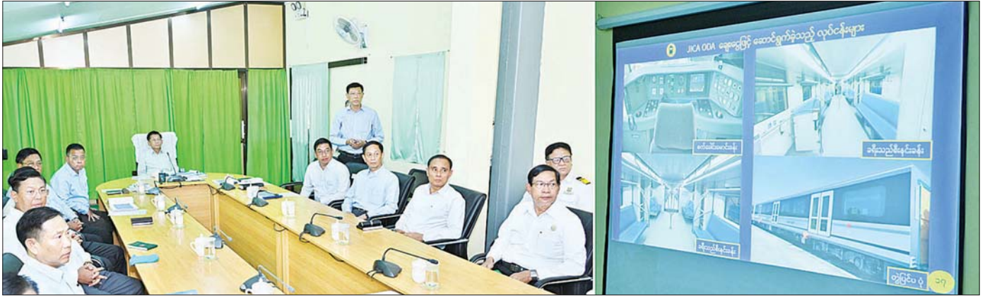
နိုင်ငံတော်စီမံအုပ်ချုပ်ရေးကောင်စီဥက္ကဋ္ဌ နိုင်ငံတော်ဝန်ကြီးချုပ် ဗိုလ်ချုပ်မှူးကြီး မင်းအောင်လှိုင်နှင့်အဖွဲ့ဝင်များအား နိုင်ငံတော်စီမံအုပ်ချုပ်ရေးကောင်စီဝင် ပို့ဆောင်ရေးနှင့် ဆက်သွယ်ရေးဝန်ကြီးဌာန ပြည်ထောင်စုဝန်ကြီး ဗိုလ်ချုပ်ကြီး မြထွန်းဦးက ရန်ကုန်မြို့ပတ်လမ်း အဆင့်မြှင့်တင်ရေးစီမံကိန်း၏ လုပ်ငန်းဆောင်ရွက်မှုအခြေအနေများနှင့်ပတ်သက်၍ ရှင်းလင်းတင်ပြစဉ်။