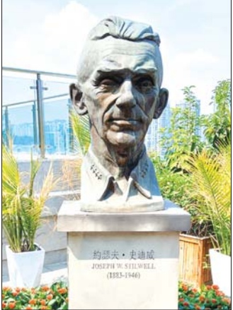
စတီးဝဲလ်၏ ပုံတူကျောက်ရုပ်တု။

စစ်တုန်းက အမေရိကန်က ၁၉၄၂ ခုနှစ်မှာ ဖောက်လုပ်ခဲ့တယ်လို့ သိရပါတယ်။ အိန္ဒိယနိုင်ငံ အသံပြည်နယ် လီဒိုမြို့လေးကစတင်ပြီးတော့ မြန်မာနိုင်ငံ ကချင်ပြည်နယ်ကို ဖြတ်ပြီး တရုတ်နိုင်ငံ ယူနန်ပြည်နယ် ကုမင်းမြို့မှာ လမ်းဆုံးတယ်လို့ သိရပါတယ်။ လမ်းမကြီးရဲ့အရှည်ကတော့ ၁၇၄၆ ကီလိုမီတာရှိပါတယ်။ မိုင်အားဖြင့်ကတော့ ၁၀၇၂ မိုင် ဖြစ်ပါတယ်။ လက်ရှိအိန္ဒိယကနေ မြန်မာအထိသာ လမ်းကောင်းပြီးတော့ တရုတ်အထိတော့ သွားလို့မရတော့ဘူးလို့ သိရပါတယ်။ လီဒိုလမ်းမကြီးအပေါ် ပထမဆုံး