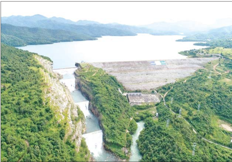
ပေါင်းလောင်းရေလှောင်တံစံ၏ ရေပိုလွှဲမှ ရေကျော်စီးဆင်းမှုကို တွေ့ရစဉ်။

ရေလှောင်တံစံဆိုသည်မှာ ရေလှောင်တံစံဆိုသည်မှာ မိုးရာသီ တွင် မြစ်ချောင်းများမှတစ်ဆင့် ပင်လယ် အတွင်းသို့ အကျိုးမရှိဆင်းသွားမည့် မိုးရေများကို စိုက်ပျိုးရေးပေးစေရန်၊ ရေအားလျှပ်စစ်ထုတ်လုပ်ရေး၊ မြို့ရွာ များသောက်သုံးရေပေးစေရန်၊ ဒေသ တစ်ခုစီ စီမံလမ်းစီပြည်ရေးတို့အတွက် အကျိုးရှိစွာ အသုံးပြုနိုင်ရန် လိုအပ်သည့် ပမာဏကို စနစ်တကျ တွက်ချက် သို့လှောင်ထားသော ရေအားအဆောက် အအုံများဖြစ်ပါသည်။ စိုက်ပျိုးရေးကို အခြေခံတည်ဆောက်ထားသော မြန်မာ