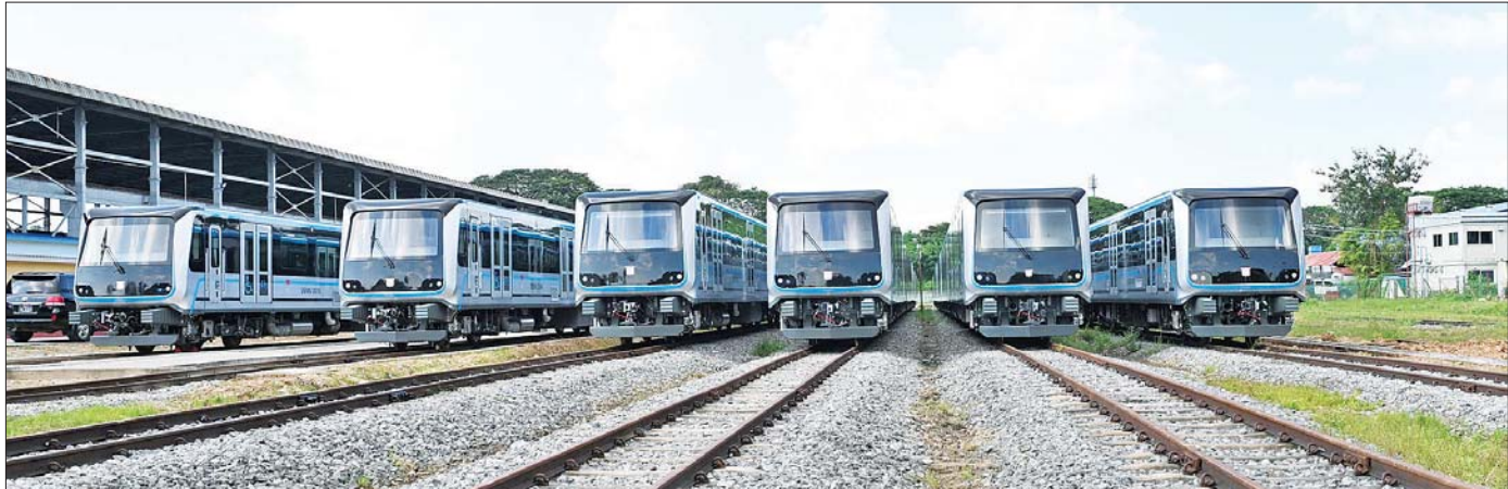
စပိန်နိုင်ငံမှရောက်ရှိလာသည့် DEMU ရထားတွဲဆိုင်းအသစ်များ။

နိုင်ရေး ကြိုးပမ်းဆောင်ရွက်သွားကြရန်လိုကြောင်း မှာကြားသည်။ ရထားတွဲဆိုင်းအသစ်များကြည့်ရှု ထိုနောက် နိုင်ငံတော်စီမံအုပ်ချုပ်ရေးကောင်စီ ဥက္ကဋ္ဌ နိုင်ငံတော်ဝန်ကြီးချုပ်နှင့် အဖွဲ့ဝင်များသည် စပိန်နိုင်ငံမှ ရောက်ရှိလာသည့် DEMU ရထားတွဲဆိုင်း အသစ်များအား ကြည့်ရှုစစ်ဆေးကာ တာဝန်ရှိသူများ ၏ ရှင်းလင်းတင်ပြမှုများအပေါ် လိုအပ်သည်များ မှာကြားခဲ့ကြောင်း သတင်းရရှိသည်။ သတင်းစဉ်