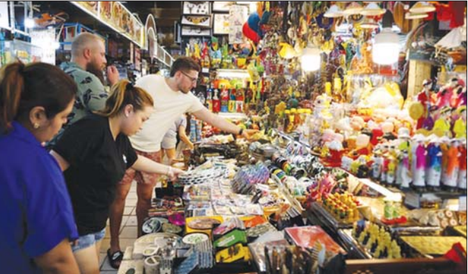
ဟိုချိုင်းမြို့ ဘင်ထန်ဈေးတွင် ဈေးဝယ်ယူနေသော နိုင်ငံတကာခရီးသွားစဉ်သည်များကို တွေ့ရစဉ်။