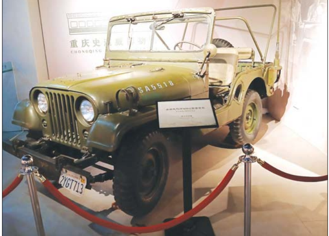
ဒုတိယကမ္ဘာစစ်အတွင်း အသုံးပြုခဲ့သည့် စစ်သုံးဂျစ်ကားတစ်စီးအား ပြတိုက်အတွင်း ပြသထားစဉ်။

ကျွန်တော်တို့ မီဒီယာအဖွဲ့အနေနဲ့ ပြတိုက်က အပြန် ဒီလိုလည်းစဉ်းစားမိပါတယ်။ တကယ်သာ လီဒိုလမ်းမကြီး ဆက်ပြီးအသုံးပြုသွားလာနိုင်မယ်ဆိုရင် တရုတ်နဲ့ အိန္ဒိယ အပြန်အလှန် ကုန်သွယ်ကြပြီး မြန်မာနိုင်ငံက ကြားခံနိုင်အဖြစ် အကျိုးရှိအောင် အသုံးချနိုင်မှာ ဖြစ်ပါတယ်။ တရုတ်နိုင်ငံနဲ့ အိန္ဒိယနိုင်ငံတို့ဟာ ကမ္ဘာမှာလူဦးရေအများဆုံးနိုင်ငံတွေပါ။ လူဦးရေ သန်း ၁၃၀၀ စီရှိတဲ့ နိုင်ငံကြီးတွေပဲ။ ဒီနိုင်ငံကြီးတွေက လူဦးရေသာမကပါဘူး သိပ္ပံနဲ့ နည်းပညာ၊ ဆေးဝါးလုပ်ငန်း၊ အိုင်တီနည်းပညာ စသည်ဖြင့် အစစအရာရာသာလွန်တဲ့ နိုင်ငံတွေဖြစ်ပါတယ်။ ကျွန်တော်တို့ မြန်မာနိုင်ငံက ပထမီအနေအထားအရ အဲဒါကို ကျွန်တော်တို့ မြန်မာလူမျိုးတွေအတွက် အခွင့်အရေးတစ်မျိုးလို့ ဆိုနိုင်ပါတယ်။ ဒီအခွင့်အရေးကို ကျွန်တော်တို့ မြန်မာလူမျိုးတွေက ကောင်းကောင်းအသုံးချတတ်ဖို့ လိုပါတယ်။ ကမ္ဘာလူအင်အားအများဆုံး နိုင်ငံကြီး နှစ်နိုင်ငံကို ချိတ်ဆက်ပေးခြင်းဖြင့် ကုန်စည်ဖြတ်သန်းခွင့်လိုမျိုး အကျိုးအမြတ်တွေ ရရှိလာနိုင်မှာ ဖြစ်ပါတယ်။ နောက်ဆုံးဖွံ့ဖြိုးပြီး နိုင်ငံကြီးတွေလို တစ်ပြေးညီဖွံ့ဖြိုးတိုးတက်မှုတွေလည်း ရှိလာနိုင်တယ်လို့ ထင်မြင်သုံးသပ်မိပါတယ်။ ။