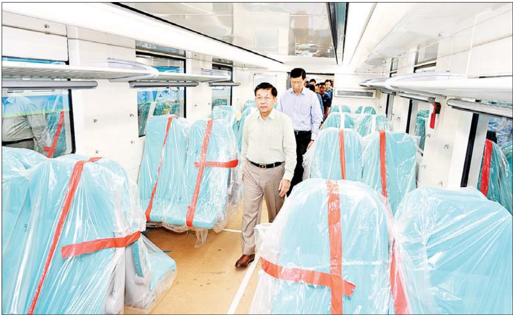
နိုင်ငံတော်စီမံအုပ်ချုပ်ရေးကောင်စီဥက္ကဋ္ဌ နိုင်ငံတော်ဝန်ကြီးချုပ် ဗိုလ်ချုပ်မှူးကြီး မင်းအောင်လှိုင် စပိန်နိုင်ငံမှရောက်ရှိလာသည့် DEMU ရထားတွဲဆိုင်းအသစ် များအား ကြည့်ရှုစစ်ဆေးစဉ်။

မိမိတို့အနေဖြင့် အမြန်နှုန်းတစ်နာရီလျှင် ၈၀ ကီလိုမီတာအထိ မြန်နှုန်းမြှင့်တင်မောင်းနှင် နိုင်ရေး စံသတ်မှတ်ဆောင်ရွက်သွားရန်လိုပြီး ကွန်ကရစ်တုံးများအား တစ်နာရီလျှင် ၆၀ ကီလိုမီတာ အထိ မောင်းနှင်နိုင်ရေး ဆောင်ရွက်သွားရမည်ဖြစ် ကြောင်း၊ ဒီဇယ်လျှပ်စစ်သုံး (DEMU) စက်ခေါင်းများ၊