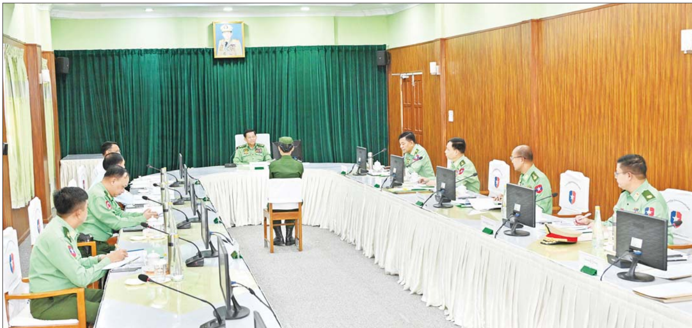
နိုင်ငံတော်စီမံအုပ်ချုပ်ရေးကောင်စီဥက္ကဋ္ဌ တပ်မတော်ကာကွယ်ရေးဦးစီးချုပ် ဗိုလ်ချုပ်မှူးကြီး မင်းအောင်လှိုင် တပ်မတော် (ကြည်း) ဗိုလ်သင်တန်းကျောင်း(မှော်ဘီ) ဘွဲ့ရအမျိုးသမီးဗိုလ်လောင်းသင်တန်း အမှတ်စဉ်(၁၁) စစ်လက်ရုံးရွေးချယ်ပွဲတွင် ဗိုလ်လောင်းတစ်ဦးချင်း စိစစ်ရွေးချယ်စဉ်။

( ၃-၉-၂၀၂၄ ရက်နေ့တွင် နိုင်ငံတော်စီမံအုပ်ချုပ်ရေးကောင်စီဥက္ကဋ္ဌ နိုင်ငံတော်ဝန်ကြီးချုပ် ဗိုလ်ချုပ်မှူးကြီး မင်းအောင်လှိုင် ရှမ်းပြည်နယ်အစိုးရအဖွဲ့ဝင်များ၊ ပြည်နယ်နှင့် ခရိုင်အဆင့်ဌာနဆိုင်ရာတာဝန်ရှိသူများအား ပြောကြားသည့် အမှာစကားမှ ကောက်နုတ်ချက် )