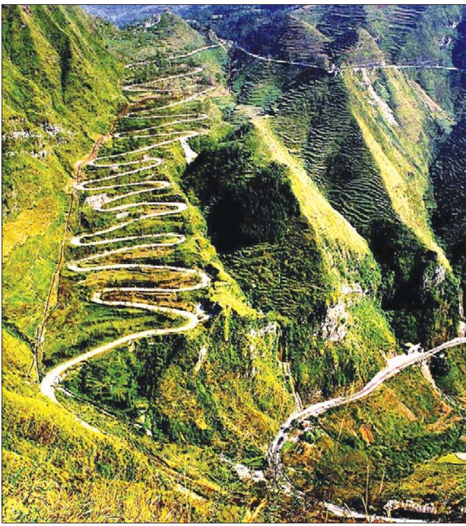
ဒုတိယကမ္ဘာစစ်အတွင်းက ဖောက်လုပ်ခဲ့သည့် လီဒိုလမ်းမကြီး။

ဒီပြတိုက်ကတော့ တရုတ်နိုင်ငံ ချူချင်မြို့မှာ ဖြစ်ပါတယ်။ တချို့က ဒီမြို့ကို ချူကင်းလို့လည်း ခေါ်ကြပါသေးတယ်။ ပြီးခဲ့တဲ့စက်တင်ဘာလလယ်က ကျွန်တော်တို့ မြန်မာမီဒီယာအဖွဲ့ကို ရန်ကုန်မြို့ တရုတ်သံရုံးရဲ့ ဖိတ်ကြားမှုနဲ့ တရုတ်နိုင်ငံကို သွားရောက်လည်ပတ်တဲ့ခရီးစဉ်မှာ အဲဒီပြတိုက်ကိုလည်း ရောက်ခဲ့ပါတယ်။ ကျွန်တော်တို့ မြန်မာမီဒီယာအဖွဲ့ရောက်သွားချိန်မှာ တရုတ်ပြတိုက်တာဝန်ရှိသူတွေက ဝမ်းပန်းတသာကြိုဆိုပြီးတော့ ပြတိုက်နဲ့ ပတ်သက်လို့ အသေးစိတ် လိုက်လံရှင်းပြပေးခဲ့ပါတယ်။ ပြီးတော့ ဒီပြတိုက်က ချူချင်မြို့ရဲ့ မြစ်ကမ်းနံဘေးမှာ မေးတင်တည်ရှိနေတာဖြစ်လို့ အတော်လေးသာယာဖွယ်ကောင်းပါတယ်။