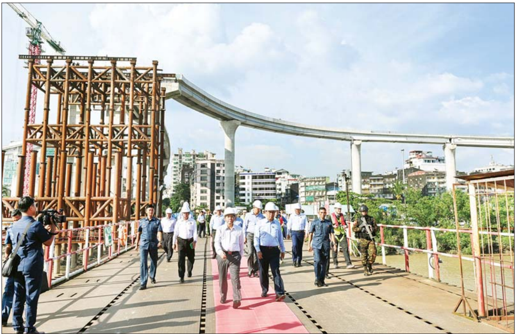
နိုင်ငံတော်စီမံအုပ်ချုပ်ရေးကောင်စီဥက္ကဋ္ဌ နိုင်ငံတော်ဝန်ကြီးချုပ် ဗိုလ်ချုပ်မှူးကြီး မင်းအောင်လှိုင် ရန်ကုန်မြို့နှင့် ဒလမြို့တို့ကို ဆက်သွယ်ဖောက်လုပ်လျက် ရှိသည့် မြန်မာ - ကိုရီးယား ချစ်ကြည်ရေး (ဒလ) တံတားစီမံကိန်းလုပ်ငန်း ဆောင်ရွက်နေမှုအခြေအနေများကို လိုက်လံကြည့်ရှုစစ်ဆေးစဉ်။

ရှင်းလင်းတင်ပြ ဆက်လက်၍ နိုင်ငံတော်စီမံအုပ်ချုပ်ရေးကောင်စီ ဥက္ကဋ္ဌ နိုင်ငံတော်ဝန်ကြီးချုပ်နှင့် အဖွဲ့ဝင်များ သည် ရန်ကုန်မြို့နှင့် ဒလမြို့တို့ကို ဆက်သွယ် ဖောက်လုပ်လျက်ရှိသည့် မြန်မာ - ကိုရီးယား ချစ်ကြည်ရေး (ဒလ) တံတားစီမံကိန်းသို့ ရောက်ရှိ ကြရာ အစည်းအဝေးခန်းမတွင် ဆောက်လုပ်ရေး ဝန်ကြီးဌာန ပြည်ထောင်စုဝန်ကြီး ဦးမျိုးသန့်က တံတားတည်ဆောက်ရေးစီမံကိန်း ဖြစ်ပေါ်လာပုံနှင့်