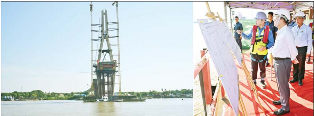
နိုင်ငံတော်စီမံအုပ်ချုပ်ရေးကောင်စီဥက္ကဋ္ဌ နိုင်ငံတော်ဝန်ကြီးချုပ် ဗိုလ်ချုပ်မှူးကြီး မင်းအောင်လှိုင် ရန်ကုန်မြို့နှင့် ဒလမြို့တို့ကို ဆက်သွယ်ဖောက်လုပ်လျက်ရှိသည့် မြန်မာ - ကိုရီးယား ချစ်ကြည်ရေး (ဒလ) တံတားစီမံကိန်းလုပ်ငန်း ဆောင်ရွက်နေမှုအခြေအနေများကို ကြည့်ရှုစစ်ဆေးစဉ်။

တံတားဆိုင်ရာ အချက်အလက်များ၊ စီမံကိန်း၏ အကျိုးကျေးဇူးများ၊ ၂၀၂၃ ခုနှစ် မေလအတွင်း နိုင်ငံတော်စီမံအုပ်ချုပ်ရေးကောင်စီဥက္ကဋ္ဌ နိုင်ငံတော် ဝန်ကြီးချုပ်လာရောက်စစ်ဆေးစဉ် လမ်းညွှန်မှာကြား ချက်များအား အကောင်အထည်ဖော် ဆောင်ရွက် ပြီးစီးမှု၊ ဒလဘက်ကမ်းချဉ်းကပ်တံတားလုပ်ငန်း ပြီးစီးမှု၊ ပင်မတံတားလုပ်ငန်းပြီးစီးမှု၊ တံတား၏အဓိက ကျသည့် ရေလယ်တာဝါတိုင်လုပ်ငန်း ဆောင်ရွက် ပြီးစီးမှု၊ ရန်ကုန်ဘက်ကမ်း ချဉ်းကပ်တံတားလုပ်ငန်း ပြီးစီးမှု၊ စီမံကိန်းလုပ်ငန်းအပိုင်းအလိုက် လုပ်ငန်း ဆောင်ရွက်ပြီးစီးမှု၊ စီမံကိန်းလုပ်ငန်းများ ဆောင် ရွက်ရာ၌ အရည်အသွေးထိန်းသိမ်းရေးလုပ်ငန်းများ၊ လုပ်ငန်းခွင်ဘေးအန္တရာယ်ကင်းရှင်းရေး လုပ်ငန်းများ နှင့် သဘာဝပတ်ဝန်းကျင် ထိန်းသိမ်းရေးလုပ်ငန်းများ ဆောင်ရွက်လျက်ရှိမှု အခြေအနေများကို ရှင်းလင်း တင်ပြသည်။