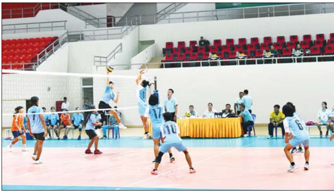
စခန်းမှူးရုံးအသင်းတို့ ယှဉ်ပြိုင်ကစားကြရာ ကာကွယ်ရေးဦးစီးချုပ်ရုံး(ရေ)အသင်းက ကာကွယ်ရေးဦးစီးချုပ်ရုံး(ကြည်း) စခန်းမှူးရုံးအသင်းနှင့် ကာကွယ်ရေးဦးစီးချုပ်ရုံး(ကြည်း) တို့ ယှဉ်ပြိုင်ကစားကြရာ အလယ်ပိုင်းတိုင်းစစ်ဌာနချုပ်အသင်းနှင့် ကာကွယ်ရေးဦးစီးချုပ်ရုံး(ကြည်း) တို့ ယှဉ်ပြိုင်ကစားကြရာ အလယ်ပိုင်းတိုင်းစစ်ဌာနချုပ်အသင်းက ကာကွယ်ရေးဦးစီးချုပ်ရုံး(ကြည်း) တို့ ယှဉ်ပြိုင်ကစားကြသည်။

၂၀၂၄ ခုနှစ် တပ်မတော် (ကြည်း၊ ရေ၊ လေ) အားကစားပြိုင်ပွဲများဖြစ်သည့် တပ်မတော် (ကြည်း၊ ရေ၊ လေ)အမျိုးသား/အမျိုးသမီး ဘော်လီဘောပြိုင်ပွဲ တတိယနေရာလုပွဲများကို ဇေယျာသီရိအားကစားရုံ(B)တွင် အမျိုးသားပွဲစဉ်အဖြစ် ကာကွယ်ရေးဦးစီးချုပ်ရုံး(ရေ) အသင်းနှင့် ကာကွယ်ရေးဦးစီးချုပ်ရုံး(ကြည်း) စခန်းမှူး