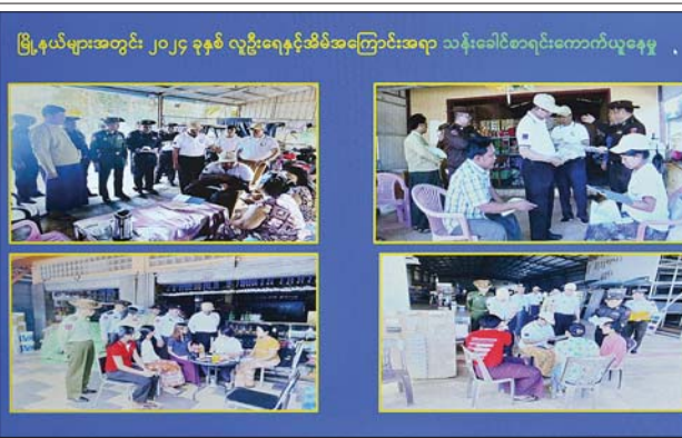
မြို့နယ်များအတွင်း ၂၀၂၄ ခုနှစ် လူဦးရေနှင့်အိမ်အကြောင်းအရာ သန်းခေါင်စာရင်းကောက်ယူနေမှု

နိုင်ငံတော်စီမံအုပ်ချုပ်ရေးကောင်စီဥက္ကဋ္ဌ နိုင်ငံတော်ဝန်ကြီးချုပ် ဗိုလ်ချုပ်မှူးကြီး မင်းအောင်လှိုင်နှင့်အဖွဲ့ဝင်များအား ရန်ကုန်တိုင်းဒေသကြီး ဝန်ကြီးချုပ် ဦးစိုးသိန်းက ရှင်းလင်းတင်ပြစဉ်။