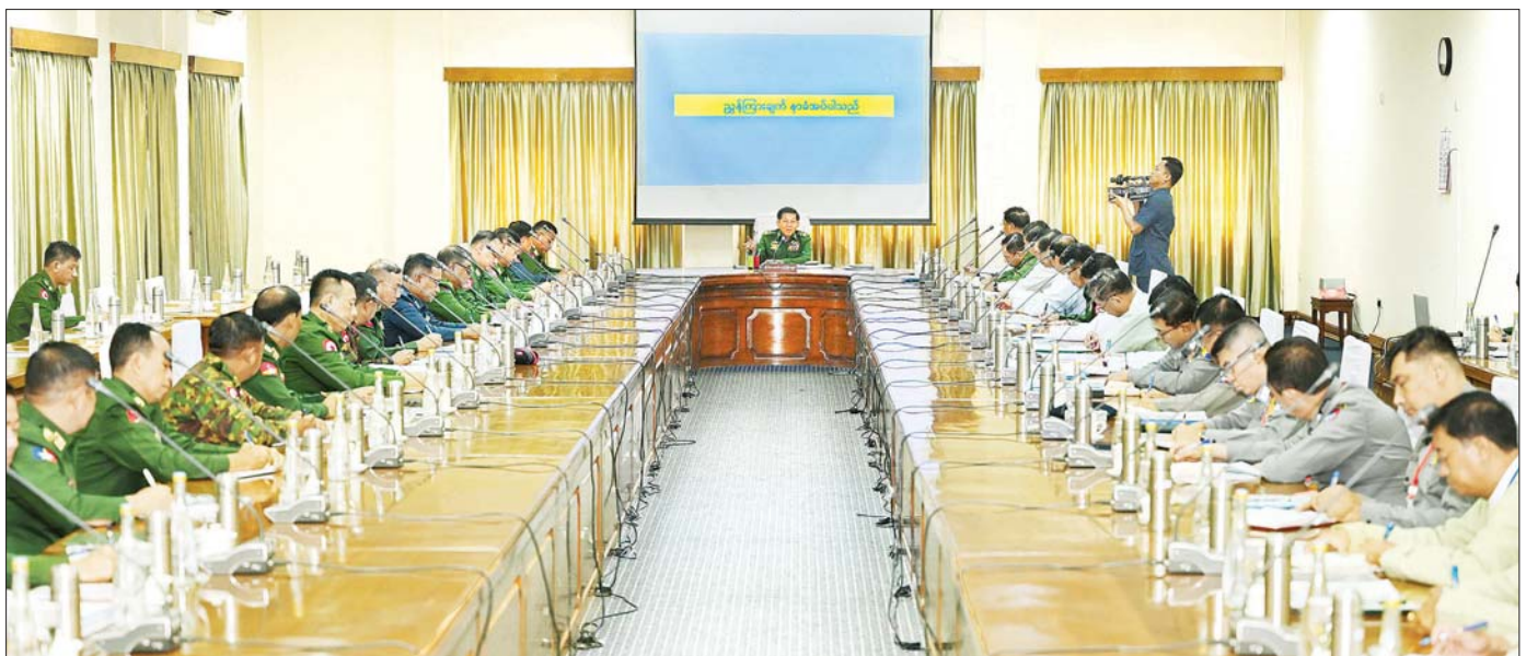
နိုင်ငံတော်စီမံအုပ်ချုပ်ရေးကောင်စီဥက္ကဋ္ဌ နိုင်ငံတော်ဝန်ကြီးချုပ် ဗိုလ်ချုပ်မှူးကြီး မင်းအောင်လှိုင် ရန်ကုန်တိုင်းဒေသကြီး လုံခြုံရေးနှင့်ဖွံ့ဖြိုးတိုးတက်ရေးအစည်းအဝေးတွင် အမှာစကားပြောကြားစဉ်။

ရန်ကုန်တိုင်းဒေသကြီး လုံခြုံရေးနှင့်ဖွံ့ဖြိုးတိုးတက်ရေး အစည်းအဝေးကျင်းပ နိုင်ငံတော်စီမံအုပ်ချုပ်ရေးကောင်စီဥက္ကဋ္ဌ နိုင်ငံတော်ဝန်ကြီးချုပ် ဗိုလ်ချုပ်မှူးကြီး မင်းအောင်လှိုင် အမှာစကားပြောကြား ပြည်သူ့လုံခြုံရေးနှင့် အကြမ်းဖက်နှိမ်နင်းရေးအဖွဲ့များ ဖွဲ့စည်းထားရှိပြီး ၎င်းအဖွဲ့ဝင်များအနေဖြင့် လုံခြုံရေးအသိအမြင်များ အမြဲမပြတ်ရှိနေရမည်