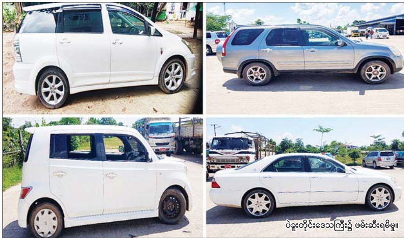
ပဲခူးတိုင်းဒေသကြီး၌ ဖမ်းဆီးရမိမှု။