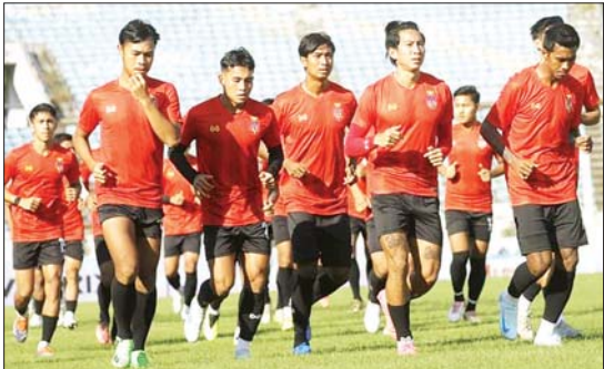
မြန်မာ့လက်ရွေးစင်အသင်း သီရိလင်္ကာလက်ရွေးစင်အသင်းနှင့် ခြေစမ်းပွဲအတွက် လေ့ကျင့်နေစဉ်။