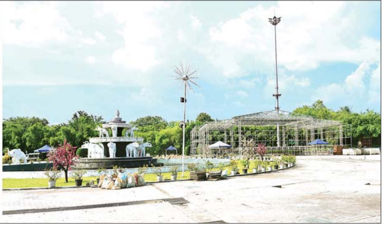
နိုင်ငံတော်စီမံအုပ်ချုပ်ရေးကောင်စီဥက္ကဋ္ဌ နိုင်ငံတော်ဝန်ကြီးချုပ် ဗိုလ်ချုပ်မှူးကြီး မင်းအောင်လှိုင် ပြည်သူ့ရင်ပြင်နှင့် ပြည်သူ့ဥယျာဉ်အတွင်း ပြုပြင်ထိန်းသိမ်းခြင်းလုပ်ငန်းများ ဆောင်ရွက်နေမှုကို ကြည့်ရှုစစ်ဆေးစဉ်။