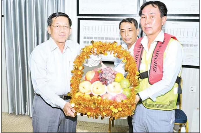
နိုင်ငံတော်စီမံအုပ်ချုပ်ရေးကောင်စီဥက္ကဋ္ဌ နိုင်ငံတော်ဝန်ကြီးချုပ် ဗိုလ်ချုပ်မှူးကြီး မင်းအောင်လှိုင် မြန်မာ-ကိုရီးယား ချစ်ကြည်ရေး (ဒလ) တံတားစီမံကိန်းတွင် လုပ်ငန်းဆောင်ရွက်လျက်ရှိသည့် အင်ဂျင်နီယာများအတွက် ဂုဏ်ပြုသစ်သီးခြင်း ပေးအပ်ချီးမြှင့်စဉ်။

အဆိုပါ မြန်မာ-ကိုရီးယား ချစ်ကြည်ရေး(ဒလ) တံတားတည်ဆောက်ရေး စီမံကိန်းကို ၂၀၁၂ ခုနှစ် တွင် နိုင်ငံတော်သမ္မတဦးသိန်းစိန်၏ ကိုရီးယားနိုင်ငံ ချစ်ကြည်ရေးခရီးစဉ်အတွင်း မြန်မာနိုင်ငံတွင် မြန်မာ-ကိုရီးယား ချစ်ကြည်ရေးတံတားစီမံကိန်း တစ်ခု အကောင်အထည်ဖော် ဆောင်ရွက်ရန် ဆွေးနွေးခဲ့ပြီး ၂၀၁၃ ခုနှစ်တွင် စီမံကိန်းအား စတင် အကောင်အထည်ဖော်ဆောင်ရွက်ခဲ့ရာ ၂၀၁၅ ခုနှစ် တွင် တည်ဆောက်ရေးလုပ်ငန်းများကို စတင် ဆောင်ရွက်ခဲ့ကြောင်း၊ တံတားအမျိုးအစားမှာ ကြိုးဆိုင်တံတား (Cable - Stayed Bridge) အမျိုး အစားဖြစ်ကြောင်း၊ တံတားတည်ဆောက်ပြီးစီးပါက ရန်ကုန်မြို့မှ ဒလ၊ တွံတေး၊ ကော့မှူး၊ ကွမ်းခြံကုန်း မြို့နယ်များ၊ ဒေးဒရိုတံတားမှတစ်ဆင့် ကမ်းခြေဒေသ များနှင့် ဧရာဝတီတိုင်းဒေသကြီးတစ်ခုလုံးသို့ လွယ်ကူလျင်မြန်စွာ သွားလာနိုင်မည်ဖြစ်ပြီး လက်ရှိ ဖြစ်ပေါ်နေသည့် ရန်ကုန်မြို့၏ ယာဉ်ကြောပိတ်ဆို့မှု များသည်လည်း အတိုင်းအတာတစ်ခုအထိ လျော့ပါး သက်သာသွားမည်ဖြစ်ကြောင်း၊ လူမှုရေး၊ စီးပွားရေး၊ ပညာရေး၊ ကျန်းမာရေးနှင့် သယ်ယူပို့ဆောင်ရေး ကဏ္ဍ ဖွံ့ဖြိုးတိုးတက်မှုအပါအဝင် ကဏ္ဍပေါင်းစုံ၌ ဖွံ့ဖြိုးတိုးတက်လာနိုင်ပြီး ရန်ကုန်မြို့၏ အထင်ကရ ပြယုဂ် (Landmark) တစ်ခုလည်း ဖြစ်လာမည်ဖြစ် ကြောင်း သတင်းရရှိသည်။ သတင်းစဉ်