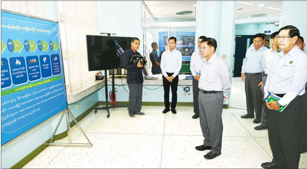
နိုင်ငံတော်စီမံအုပ်ချုပ်ရေးကောင်စီဥက္ကဋ္ဌ နိုင်ငံတော်ဝန်ကြီးချုပ် ဗိုလ်ချုပ်မှူးကြီး မင်းအောင်လှိုင် နက္ခတ်တာရာပြခန်းအတွင်းရှိ ပြကွက်အလိုက် ပြသထားရှိမှုများကို ကြည့်ရှုစဉ်။

လိုအပ်သည်များ လမ်းညွှန်မှာကြားဦးစွာ ရန်ကုန်မြို့တော်ဝန် ဦးဗိုလ်ဌေးက နက္ခတ်တာရာပြခန်း သမိုင်းကြောင်းနှင့် ပြခန်းဆိုင်ရာ အချက်အလက်များ၊ နက္ခတ်တာရာပြခန်းအား အာကာသပြခန်းအဖြစ် အဆင့်မြှင့်တင်ရန် ဆောင်ရွက်နေမှု အခြေအနေများကို ရှင်းလင်းတင်ပြရာ နိုင်ငံတော်စီမံအုပ်ချုပ်ရေးကောင်စီဥက္ကဋ္ဌ နိုင်ငံတော်ဝန်ကြီးချုပ်က လိုအပ်သည်များ လမ်းညွှန်မှာကြားသည်။