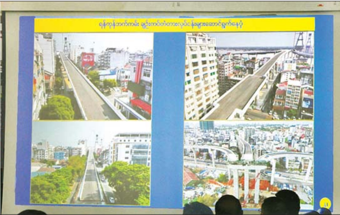
နိုင်ငံတော်စီမံအုပ်ချုပ်ရေးကောင်စီဥက္ကဋ္ဌ နိုင်ငံတော်ဝန်ကြီးချုပ် ဗိုလ်ချုပ်မှူးကြီး မင်းအောင်လှိုင်နှင့် အဖွဲ့ဝင်များအား ပြည်ထောင်စုဝန်ကြီး ဦးမျိုးသန့်က ရန်ကုန်မြို့နှင့် ဒလမြို့တို့ကို ဆက်သွယ်ဖောက်လုပ်လျက်ရှိသည့် မြန်မာ - ကိုရီးယား ချစ်ကြည်ရေး (ဒလ) တံတားစီမံကိန်းနှင့်ပတ်သက်၍ ရှင်းလင်းတင်ပြစဉ်။