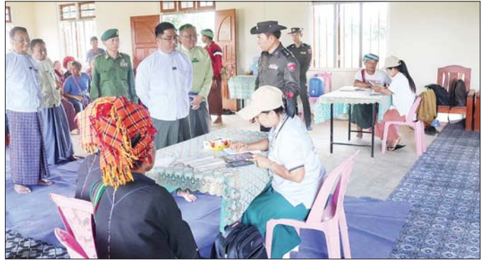
အောက်တိုဘာ ၁ ရက်မှ ၇ ရက်အထိ ရပ်ကွက် ၂၄ ရပ်ကွက်နှင့် ကျေးရွာအုပ်စုနှစ်အုပ်စုတို့၌ ၂၀၂၄ ခုနှစ် လူဦးရေနှင့် အိမ်အကြောင်းအရာ သန်းခေါင်စာရင်း ဦးစီးမှူးရုံးမှ သိရသည်။ ပြည်နယ်(ပြန်/ဆက်)

ထို့နောက် နွားလင်းကျေးရွာနှင့် လယ်တွဲကျေးရွာများတွင် စာရင်းစစ်၊ စာရင်းကောက်အဖွဲ့များက တစ်အိမ်တက်ဆင်း Mobile Tablet များဖြင့် သန်းခေါင်စာရင်းဆိုင်ရာ မေးခွန်းများ မေးမြန်းကောက်ယူနေမှုနှင့် ဒေသခံပြည်သူများက စိတ်ဝင်တစား ပြန်လည်ကြည့်ရှုနေမှုများကို လှည့်လည်ကြည့်ရှုအားပေးသည်။ လွိုင်ကော်မြို့နယ်အတွင်း