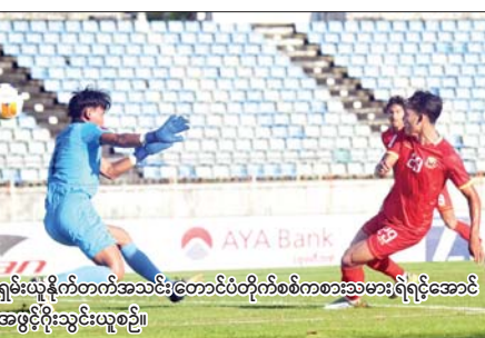
ရှမ်းယူနိုက်တက်အသင်းကြောင့်ပွဲတိုက်စစ်ကစားသမားရဲရင့်အောင် အဖွင့်ဂိုးသွင်းယူစဉ်။

အဆုံးသတ်အားနည်းမှုကြောင့် ဂိုးထပ်မရခဲ့ပေ။ အုပ်စု (D) ဒုတိယနေ့ကို အောက်တိုဘာ ၃၀ ရက်တွင် ဆက်လက် ကျင်းပမည်ဖြစ်ပြီး တရုတ်(တိုင်ပေ)ကလပ် တိုင်နန် စီးတီးအသင်းနှင့် လားအိုကလပ် Young Elephant အသင်း ယှဉ်ပြိုင်ကစားမည်ဖြစ်သည်။ ရဲရင့်လွင် ဓာတ်ပုံ-သော်လည်း