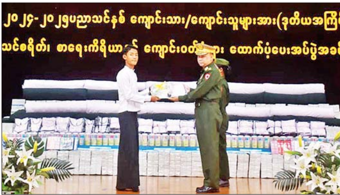
၂၀၂၄-၂၀၂၅ ပညာသင်နှစ် ကျောင်းသား/ကျောင်းသူများအား (ဒုတိယအကြိမ်) သင်စရိတ်၊ စာရေးကိရိယာနှင့် ကျောင်းဝတ်စုံများ ထောက်ပံ့ပေးအပ်ပွဲအခမ်းကွဲတွင် တက်ရောက် ပညာသင်ကြား တိုင်းမှူး (အပေါ်ပုံ) နှင့် တာဝန်ရှိသူများက ထောက်ပံ့ပေးအပ်ရာ ကျောင်းသား ကျောင်းသူများက လက်ခံရယူခဲ့ကြကြောင်း သတင်းရရှိသည်။