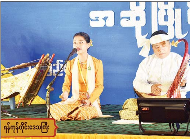
ရန်ကုန်တိုင်းဒေသကြီး

အကပြိုင်ပွဲ အခြေခံပညာ(အမျိုးသမီး အသက် ၁၅ နှစ်မှ ၂၀ နှစ်အတွင်း)၌ ပထမဆုရရှိသည့် ရန်ကုန်တိုင်း ဒေသကြီးမှ မဆုရတနာ၏ ကပြယှဉ်ပြိုင်ဟန်။