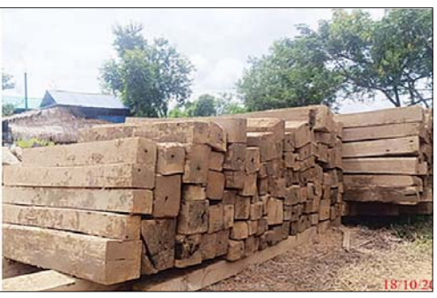
ပဲခူးတိုင်းဒေသကြီး၌ ဖမ်းဆီးရမိမှု။

တရားမဝင်ကုန်သွယ်မှုနှင့် ပတ်သက်၍ အဓိပ္ပာယ်အမျိုးမျိုးဖြင့်ဆိုမှုများအနက် 'နိုင်ငံတော်က ဥပဒေများအရ သတ်မှတ်ထားသည့် တရားမဝင်ကုန်စည်များကို ထုတ်လုပ်ခြင်း၊ ဝယ်ယူခြင်း၊ ပို့ဆောင်ခြင်း၊ ရွှေ့ပြောင်းခြင်း၊ လွှဲပြောင်းခြင်း၊ လက်ခံခြင်း၊ လက်ဝယ်ထားရှိခြင်း သို့မဟုတ် ပြန်ဖြူးခြင်းနှင့် အဆိုပါဆောင်ရွက်ချက်များကို အားပေးရန် ရည်ရွယ်သည့် မည်သည့်လုပ်ဆောင်မှုကိုမဆို တရားမဝင်ကုန်သွယ်မှု' ဟု ကမ္ဘာ့ကုန်သွယ်ရေးအဖွဲ့က အဓိပ္ပာယ်ဖွင့်ဆိုထားပါသည်။