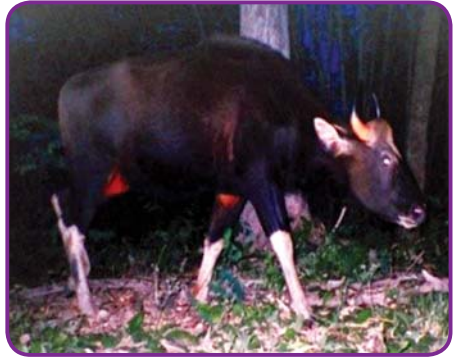
အမျိုးသားဥယျာဉ်အတွင်း ကျက်စားသည့် ပြောင်း။

လွန်ခဲ့သည့် ၂၀၀၁ ခုနှစ်မှသည် လာမည့် ၂၀၃၀ ပြည့်နှစ်ကာလ ထိတိုင် နှစ် ၃၀ စီမံကိန်းသတ်မှတ်၍ အမျိုးသားသစ်တောကဏ္ဍ ရည်မှန်းချက်ကို ဖော်ဆောင်လျက်ရှိပေရာ ယင်းစီမံကိန်းအရ