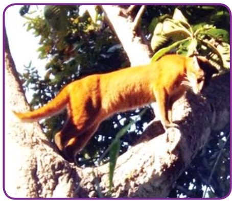
အမျိုးသားဥယျာဉ်အတွင်း ကျက်စားသည့် ကြောင်မင်း။