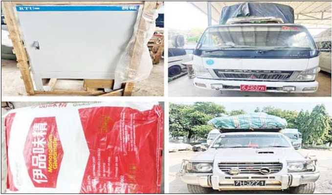
မန္တလေးတိုင်းဒေသကြီး၌ ဖမ်းဆီးရမိမှု။

တရားမဝင်ကုန်သွယ်မှု တိုက်ဖျက်ရေး ဦးဆောင်ကော်မတီ၏ ကြီးကြပ်ကွပ်ကဲမှုဖြင့် တရားမဝင် ကုန်သွယ်မှုများကို ဥပဒေနှင့်အညီ ထိရောက်စွာတားဆီးအရေးယူနိုင်ရေး ဆောင်ရွက်လျက်ရှိရာ အောက်တိုဘာ ၂၆ ရက်တွင် အကောက်ခွန်ဦးစီးဌာန၏ စီမံခန့်ခွဲမှုဖြင့် တာဝန်ကျပူးပေါင်း အဖွဲ့များက စစ်ဆေးမှုများ ဆောင်ရွက်ခဲ့ရာ မရမ်းချောင်း အပြင်တန်း စစ်ဆေးရေးစခန်း၌ တားဆီးမှုမှန်ကန်မြို့သို့မောင်းနှင်လာသည့် မော်တော်ယာဉ်တစ်စီး ပေါ်မှ တရားဝင်စာရွက်စာတမ်း အထောက်အထား တင်ပြနိုင်ခြင်း မရှိသည့် ယာဉ်အပိုပစ္စည်း တစ်မျိုး (ခန့်မှန်းတန်ဖိုး ငွေကျပ် ၁၅၀၀၀၀၀) နှင့် အဆိုပါပစ္စည်း များ တင်ဆောင်လာသည့် Hino Profia Truck တစ်စီး (ခန့်မှန်း တန်ဖိုးငွေကျပ် ၅၀၀၀၀၀၀) ကိုလည်းကောင်း၊ ရန်ကုန်အပြည်ပြည်ဆိုင်ရာလေဆိပ်၊ လေဆိပ် (သွင်းကုန်) ၌ တရားဝင်စာရွက်စာတမ်းအထောက်အထား တင်ပြနိုင်ခြင်းမရှိသည့် လုပ်ငန်းသုံး ပစ္စည်းတစ်မျိုး (ခန့်မှန်းတန်ဖိုး ငွေကျပ် ၁၀၀၀၀၀၀)နှင့် အဆိုပါ ပစ္စည်းများ တင်ဆောင်လာသည့် Hino Profia Truck တစ်စီး (ခန့်မှန်းတန်ဖိုး ငွေကျပ် ၆၃၄၉၆၃၈) ကို ဖမ်းဆီးရမိခဲ့ပြီး အကောက်ခွန်လုပ်ထုံး လုပ်နည်းများနှင့်အညီ အရေးယူ