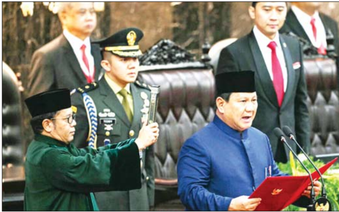
အင်ဒိုနီးရှားသမ္မတသစ် ပရာဘိုဝို ကျမ်းသစ္စာကျိန်ဆိုနေသည်ကို တွေ့ရစဉ်။ (၂၀-၁၀-၂၀၂၄)

၂၀၂၄ ခုနှစ်အထိ သမ္မတသက်တမ်း ၁၀ နှစ်ကာလအတွင်း သမ္မတ ဂျိုကိုဝီဒီယာ များစွာ အတွေ့အကြုံရကြောင်းကို လုံးဝပုံစံပြောင်းလဲ သွားခဲ့သည်။ ဂျာဗားကျွန်းမှ ဂျာကာတာမြို့တော်သို့ ရောက်ရှိလာသည့် အစီအစဉ်အရ တော်သား နိုင်ငံရေးသမား မဟုတ်တော့ပေ။ ထိုကဲ့သို့သည့် အတွေ့အကြုံ ဗဟုသုတ၊ အဆက်အသွယ်ကွန်ရက် နှင့် နိုင်ငံရေးအရင်းအနှီးတို့ စုဆောင်းမိခဲ့ပြီ ဖြစ်သည်။ လူ့အသိုက်အဝန်း ကျဉ်းကျဉ်းကလေး၌ လူကြီးလုပ်ရခြင်းမှာ (A big fish in a small pond) ရေအိုင်သေးသေးကလေးထဲ၌ ငါးရေခါင်းတိုက် ဗိုလ်လုပ်ရသည်နှင့် တူ၏။ လူဦးရေသန်း ၂၅၀ ကျော်ရှိပြီး ကျွန်းပေါင်း ၁၇၀၀၀ ရှိသော နိုင်ငံကြီး ကို အုပ်ချုပ်ရခြင်းမှာကား ပင်လယ်အတွင်း၌ ရှင်သန်နိုင်ရန် ကြိုးပမ်းခြင်းမျိုးဖြစ်လေရာ ငါးရေ ခေါင်းတို၏ ဗဟုသုတ၊ အမှုအကျင့်၊ ခွန်အားမျှနှင့် မလုံလောက်တော့ပေ။ ရောမသို့ရောက်လျှင် ရောမသားတို့ကဲ့သို့ ကျင့်ရမည်ဟု ဆိုရိုးရှိသည်နှင့် အညီ ဂျိုကိုဝီဒီယာသည်လည်း ဂျာကာတာနိုင်ငံရေးကို ဂျာကာတာသား အင်ဒိုနီးရှားရေပေါ်ဆီ အသိုက် အဝန်းတို့၏ ပုံစံအတိုင်း လိုက်နာကျင့်ကြံရပေ တော့သည်။ ဂျိုကိုဝီဒီယာ ပုံသွင်းစင်တင်ပေးခဲ့သည့် ဒီမိုကရေစီနှင့် လစ်ဘရယ်စ်နန်းတန်ဖိုးစသည့် နိုင်ငံရေးကျမ်းစာလား သဘောတရားတို့သည်၊ လက်တွေ့ဘဝနိုင်ငံရေး (Real politik) ကျားကွက် များအောက်၌ မှေးမှိန်သွားခဲ့လေပြီ။