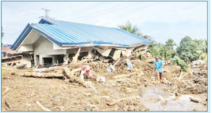
တွင် ပျက်စီးမှုတန်ဖိုး ဝီအို ၁ ဒသမ ၄၂၂ ဘီလီယံ ၂၀ ခန့် ဝင်ရောက်တိုက်ခတ်လေ့ရှိကြောင်း သိရ (ဒေါ်လာ ၂၄ ဒသမ ၅ သန်း) ရှိသည်။ နှစ်စဉ် သည်။ ဖိလစ်ပိုင်သို့ တိုင်းဖွန်းမုန်တိုင်း ပျမ်းမျှအကြိမ် ဆင်ဟွာ

တိုင်းဖွန်းထရပ်ကြောင့် ဆိပ်ကမ်းများတွင် လူပေါင်း ၈၀၀၀ ကျော် သေဆုံးခဲ့သည် ဟု ဖိလစ်ပိုင်ကမ်းခြေစောင့်တပ်က ပြောကြား သည်။ တိုင်းဖွန်းထရပ် ဖိလစ်ပိုင်နိုင်ငံမှ ထွက်ခွာ ပြီးနောက် နှစ်ရက်ကြာသည်အထိ သဘာဝ ဘေးသင့်ပြည်သူများသည် အစားအစာနှင့် သန့်ရှင်း သောရေရရှိရေး စောင့်ဆိုင်းနေရဆဲဖြစ်သည်။ တိုင်းဖွန်းထရပ်ကြောင့် အခြေခံအဆောက်အအုံ ပျက်စီးဆုံးရှုံးမှု ခန့်မှန်းတန်ဖိုး ဝီအို ၈၂၅ သန်း (အမေရိကန်ဒေါ်လာ ၁၄ သန်း) စိုက်ပျိုးရေးကဏ္ဍ