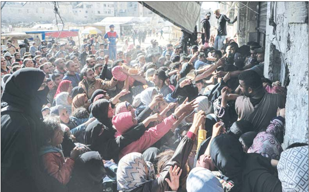
ဂါစာတောင်ပိုင်း ခန်းယူနစ်ရှိ တစ်ခုတည်းသော မုန့်ဆိုင်မှ ပေါင်မုန့်ဝယ်ယူရန် တိုးဝှေ့နေသည့် ပါလက်စတိုင်းပြည်သူများကို ၂၀၂၄ ခုနှစ် အောက်တိုဘာ ၂၃ ရက်က တွေ့ရစဉ်။

မျှော်လင့်မထားသောလည်း ဖြစ်လာတဲ့အခါ ပြင်ဆင်ထားလျက်နဲ့ ဆုံးရှုံးမှုမထင်ကြီးမားတာမျိုး ကြိုရလေ့ရှိတယ်။ မျှော်လင့်မထားတဲ့ အခြေအနေတွေဆိုတာ ဖောက်ပြန်ပျက်စီးခြင်း တစ်မျိုးပါ။ ရာသီဥတုကြောင့်၊ သဘာဝကပ်ဘေး၊ ကိုဗစ်ကပ်ကဲ့သို့ ရောဂါကပ်ဆိုး၊ ကမ္ဘာစစ်ကြီးများကဲ့သို့ စစ်မက်ဘေး၊ နောက်ဆက်တွဲ စီးပွားပျက်ကပ်ငတ်မှုတစ်ခုစသည့်ဖြစ်ပေါ်။ ဖောက်ပြန်မှုတွေမှာ ရာသီဥတုဖောက်ပြန်မှုက အဆိုးဆုံးဆုံးထဲမှာပါတယ်။ မူမမှန်တဲ့ ရာသီဥတုဖြစ်စဉ်တွေက လူတွေအတွက် အိပ်မက်ဆိုးတစ်ခု ဖြစ်လာနေတယ်။