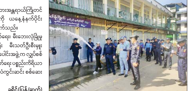
ခရိုင်(ပြန်/ဆက်)

ပုသိမ် အောက်တိုဘာ ၂၇ ရောဝတီတိုင်းဒေသကြီး ပုသိမ်မြို့ရှိ ဈေးများမီးဘေးအန္တရာယ်ကြိုတင် ကာကွယ်ရေးအတွက် ကွင်းဆင်းစစ်ဆေးခြင်းကို ယနေ့နံနက်ပိုင်း က မြို့မဈေးနှင့် ရွှေပြည်သာဈေးတို့၌ ဆောင်ရွက်သည်။