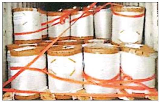
အေးရှားဝေါ့ကုန်သေတ္တာ စစ်ဆေးရေးစခန်း၌ ဖမ်းဆီးရမိမှု။

ကုန်သွယ်မှုကဏ္ဍ ဖွံ့ဖြိုးတိုးတက်စေရေးအတွက် နိုင်ငံတော်က မူဝါဒများချမှတ်ဆောင်ရွက်ပေးနေသကဲ့သို့ တစ်ဖက်တွင်လည်း စီးပွားရေးမသမာမှုများကို ကာကွယ်တားဆီးရန် ဆောင်ရွက်ရပါသည်။ တစ်ဖက်တွင်လည်း ဝိသမလောဘသား စီးပွားရေးသမားများက နိုင်ငံတော်အကျိုးနှင့် ပြည်သူ့အကျိုးကိုမသိဘဲ ရရာနည်းလမ်းဖြင့်ကြံ၍ တရားမဝင်တင်သွင်း၊ တင်ပို့ခြင်းများဖြင့် တရားမဝင်ကုန်သွယ်မှုများကို ဆောင်ရွက်လျက်ရှိပါသည်။