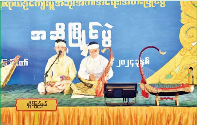
ရခိုင်ပြည်နယ်

၂၀၂၄ ခုနှစ် (၂၅) ကြိမ်မြောက် ငွေတုအထိမ်းအမှတ် မြန်မာ့ရိုးရာယဉ်ကျေးမှု ဆို၊ က၊ ရေး၊ အတီး၊ အတေး၊ အတီးပြိုင်ပွဲကြီးကို အောက်တိုဘာ ၁၄ ရက်မှ အောက်တိုဘာ ၂၃ ရက်အထိ နေပြည်တော်ရှိ သတ်မှတ်နေရာ အသီးသီး၌ ကျင်းပခဲ့ရာ ပထမဆုရပြိုင်ပွဲဝင်များ၏ ယှဉ်ပြိုင်ခဲ့မှု မြင်ကွင်းပုံရိပ်များကို စုစည်းဖော်ပြလိုက်ပါသည်။