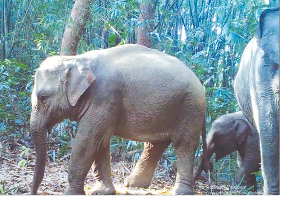
အမျိုးသားဥယျာဉ်ကြီးအတွင်း ရှင်သန်ကျက်စားနေသည့် တောဆင်ရိုင်းများ။

သို့ဖြစ်ပေရာ နိုင်ငံတော်၏ အနာဂတ်မျိုးဆက်သစ်များအတွက် သဘာဝသယံဇာတအမွေအနှစ်များ လက်ဆင့်ကမ်းကျန်ရစ်စေရေး၊ ဂေဟစနစ်နှင့် ဇီဝမျိုးစုံမျိုးကွဲများ ရေရှည်တည်တံ့စေရေးတို့အတွက် အဓိကကျသောလုပ်ငန်းစဉ်များတွင် အရေးပါသည့် စစ်ကိုင်းတိုင်းဒေသ ကြီးအတွင်းရှိ အလောင်းတော်ကသပအမျိုးသားဥယျာဉ်ကြီး ရေရှည် တည်တံ့ရှင်သန်ရေးအတွက် ဒေသခံပြည်သူများ၏ အသိစိတ်ဓာတ်ရှိရှိ ပူးပေါင်းပါဝင်မှုဖြင့် အရှိန်အဟုန်ဖြင့် ကြိုးပမ်းလျက်ရှိနေကြောင်း သတင်းစကား မျှဝေလိုက်ရပါသည်။ ။