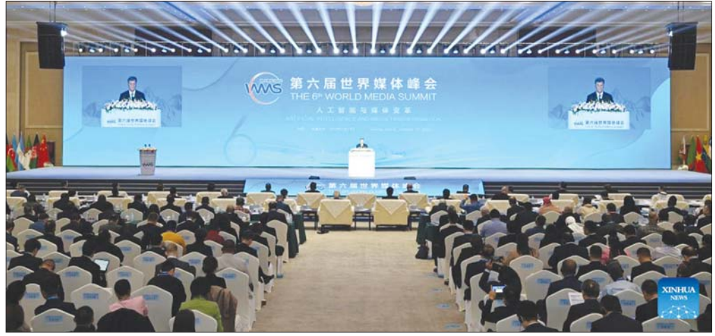
The 6th World Media Summit အခမ်းအနား ကျင်းပနေမှု။

AI ခေတ်မှာ သတင်းမီဒီယာတွေဟာ ဘယ်လို အခွင့်အလမ်းတွေ စိန်ခေါ်မှုတွေနဲ့ ရင်ဆိုင်နေရလဲ၊ သူတို့ရဲ့တာဝန်တွေနဲ့ ရည်မှန်းချက်တွေကို ဘယ်လို ဖြည့်ဆည်းဆောင်ရွက်သွားမလဲဆိုတာ စိတ်ဝင်စားစရာကောင်းပါတယ်။ New China Research နဲ့ ဆင်ပွားသတင်းအေဂျင်စီ ဉာဏ်ကြီး ရှင်အဖွဲ့ရဲ့ သုတေသနစစ်တမ်းတွေအရ ၆၆ ရာခိုင်နှုန်းလောက်ဟာ ကမ္ဘာ့သတင်းမီဒီယာအများစုက သတင်းမီဒီယာကဏ္ဍအပေါ် ဖျိုးဆက်သစ် AI နည်းပညာရဲ့သက်ရောက်မှုကို အပြုသဘောနဲ့ ကြိုဆိုကြပါတယ်။ ၆၇ ဒသမ ရာခိုင်နှုန်းကတော့ AI က ယူဆောင်လာတဲ့ အပြောင်းအလဲတွေ၊ အတွေ့ အကြုံသစ်တွေကို အသုံးပြုနေကြပြီဖြစ်ပါတယ်။ ၅၁ ဒသမ ၂ ရာခိုင်နှုန်းရဲ့ ထက်ဝက်ကတော့ အေအိုင် နည်းပညာကို စတင်အကောင်အထည်ဖော်နေ ကြပြီဖြစ်ပါတယ်။ မီဒီယာအဖွဲ့အစည်းတွေအနေနဲ့ အဓိကအားဖြင့် ဖျိုးဆက်သစ် AI နည်းပညာကို