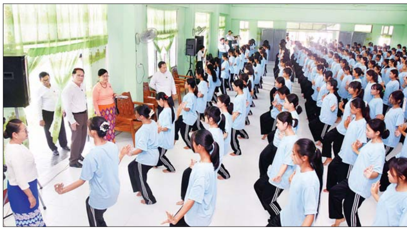
ပြည်ထောင်စုဝန်ကြီး ဦးမောင်မောင်အုန်း ဧဇ္ဈာန်ရိဖြူနယ် အမှတ် (၁၁) အခြေခံပညာအထက်တန်းကျောင်း၌ ပဉ္စမအကြိမ် အမျိုးသားအားကစားပွဲတော် ဖွင့်ပွဲ၊ ပိတ်ပွဲအခမ်းအနားတွင် အကအလှများဖြင့် ဖျော်ဖြေတင်ဆက်ကြမည့် ကျောင်းသူများ ကြိုတင်လေ့ကျင့်နေမှုများကို ကြည့်ရှုအားပေးခဲ့သည်။

နေပြည်တော် အောက်တိုဘာ ၂၇ ပဉ္စမအကြိမ် အမျိုးသားအားကစားပွဲတော် အောင်မြင်စွာကျင်းပနိုင်ရေး ဖွင့်ပွဲ၊ ပိတ်ပွဲ အခမ်းအနား ကျင်းပရေး လုပ်ငန်း နှစ်ကော်မတီဥက္ကဋ္ဌ ပြန်ကြားရေးဝန်ကြီးဌာန ပြည်ထောင်စုဝန်ကြီး ဦးမောင်မောင်အုန်း သည် ကော်မတီဒုတိယဥက္ကဋ္ဌ သာသနာရေးနှင့် ယဉ်ကျေးမှုဝန်ကြီးဌာန ဒုတိယဝန်ကြီး ဒေါ်နန္ဒာ၊ အမြဲတမ်းအတွင်းဝန် ဦးဝင်းကျော်အောင်၊ ဌာနဆိုင်ရာအကြီးအကဲများနှင့်အတူ ယနေ့နံနက်ပိုင်းတွင် နေပြည်တော် ကောင်စီနယ်မြေအတွင်းရှိ အခြေခံပညာကျောင်းများ၌ ၂၀၂၄ ခုနှစ် ပဉ္စမအကြိမ် အမျိုးသားအားကစားပွဲတော် ဖွင့်ပွဲ၊ ပိတ်ပွဲ အခမ်းအနား၌ အကအလှများဖြင့် ဖျော်ဖြေတင်ဆက်ကြမည့် ကျောင်းသူများ ကြိုတင်လေ့ကျင့်နေမှုများကို ကြည့်ရှုအားပေးကြသည်။