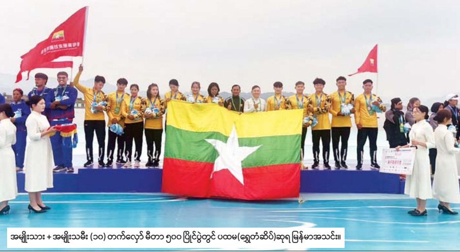
အမျိုးသား + အမျိုးသမီး (၁၀) တက်လှော် မီတာ ၅၀၀ ပြိုင်ပွဲတွင် ပထမ (ရွှေတံဆိပ်) ဆုရ မြန်မာအသင်း။