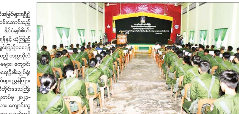
ကြသည်။ အဆိုပါ သင်တန်းဆင်းပွဲသို့ တိုင်းဒေသကြီး ဝန်ကြီးချုပ် ဦးတင်မောင်ဝင်း၊ တိုင်းမှူး ဗိုလ်ချုပ် ဝေလင်းနှင့် တာဝန်ရှိသူများ၊ သင်တန်းနည်းပြများ၊ ဆရာ ဆရာမများ၊ ကျောင်းသား ကျောင်းသူများ၊ ဖိတ်ကြားထားသူများ တက်ရောက်ကြပြီး တိုင်းဒေသ ကြီး ဝန်ကြီးချုပ်နှင့် တိုင်းမှူးတို့က သင်တန်းဆင်း အမှာစကားများ ပြောကြားကြသည်။

နေပြည်တော် အောက်တိုဘာ ၃၀ နိုင်ငံတော်ကာကွယ်ရေးဆိုင်ရာ အသိအမြင်များရရှိ၍ အနာဂတ်နိုင်ငံတော်၏ တာဝန်များထမ်းဆောင်သည့် အခါတွင် အထောက်အကူရရှိကာ နိုင်ငံချစ်စိတ်၊ မျိုးချစ်စိတ်များ ပိုမိုရင့်သန်လာစေရန်နှင့် ယုံကြည် ချက်၊ ခံယူချက်မြင့်မားပြီး အရည်အချင်းပြည့်ဝစေရန် ရည်ရွယ်ချက်ဖြင့် ကိုယ်တိုင်ဆန္ဒပြုသည့် တက္ကသိုလ် လေ့ကျင့်ရေးတပ်ဖွဲ့ဝင် ဆရာ ဆရာမများ၊ ကျောင်း သား ကျောင်းသူများကို ကာကွယ်ရေးဦးစီးချုပ်ရုံး (ကြည်း)၊ ပြည်သူ့စစ်နှင့်နယ်ခြားတပ်များ ညွှန်ကြား ရေးမှူးရုံးကွပ်ကဲမှုအောက် ဧရာဝတီတိုင်းဒေသကြီး ပုသိမ်မြို့ရှိ တက္ကသိုလ်လေ့ကျင့်ရေးတပ်မှ ၂၀၂၃- ၂၀၂၄ ပညာသင်နှစ် ကျောင်းသား ကျောင်းသူ စုစုပေါင်း ၉၆ ဦးအား အောက်တိုဘာ ၁ ရက်တွင် ပထမနှစ် အခြေခံစစ်ပညာသင်တန်း ဖွင့်လှစ်၍ လေ့ကျင့်သင်ကြားပေးခဲ့ပြီး ယနေ့ နံနက်ပိုင်းတွင် သင်တန်းဆင်းပွဲကို အနောက်တောင်တိုင်း စစ်ဌာန ချုပ် နယ်မြေခံသင်တန်းကျောင်းခန်းမ၌ ပြုလုပ်