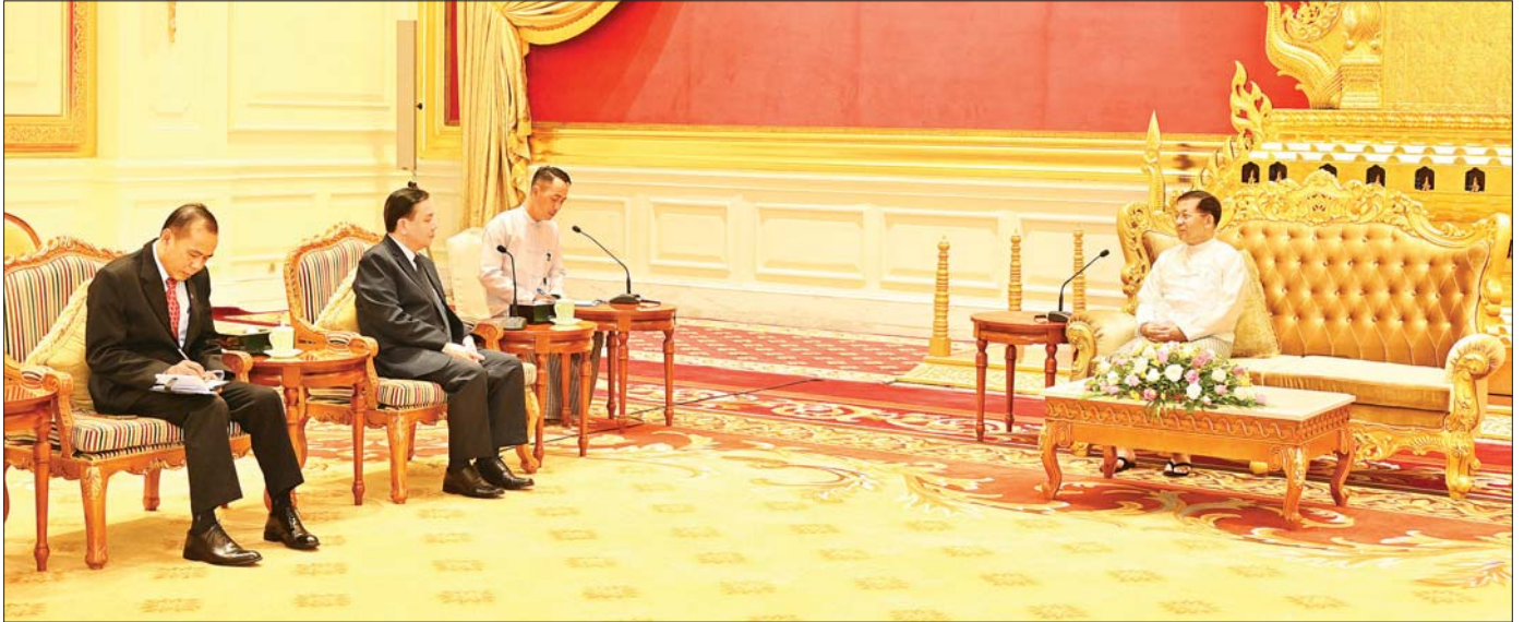
နိုင်ငံတော်စီမံအုပ်ချုပ်ရေးကောင်စီဥက္ကဋ္ဌ နိုင်ငံတော်ဝန်ကြီးချုပ် ဗိုလ်ချုပ်မှူးကြီး မင်းအောင်လှိုင် မြန်မာနိုင်ငံဆိုင်ရာ လာအိုနိုင်ငံသံအမတ်ကြီး H. E. Mr. Heuangseng KHAMDALAVONG အား လက်ခံတွေ့ဆုံစဉ်။