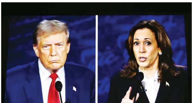
ထရမ်၏ မဲဆွယ်စည်းရုံးမှုတွင် ထရမ်က ဘိုင်ဒင် - ဟားရစ်အုပ်ချုပ်ရေးသည် မြို့ပြဒေသများတွင် ရာဇဝတ်မှုများ တိုးလာစေသည်ဟု စွပ်စွဲခဲ့သည်။ လက်ရှိဘိုင်ဒင်အစိုးရတက်လာပြီးကတည်းက ဆင်ဟွာ

ဝါရှင်တန် အောက်တိုဘာ ၃၀ မကြာမီကျင်းပတော့မည့် သမ္မတရွေးကောက်ပွဲပြိုင်ပွဲ အတွက် အမေရိကန်ပြည်သူများ မဲမပေးမီ တစ်ပတ်အလိုတွင် အမေရိကန်သမ္မတလောင်း နှစ်ဦး၏ပြိုင်ဆိုင်မှုမှာ အကြိတ်အနယ်ရှိလာခဲ့သည်။ အောက်တိုဘာ ၂၉ ရက်အထိ နိုင်ငံလုံးဆိုင်ရာ မဲရုံးများတွင် ရီပတ်ဘလီကန်သမ္မတလောင်း ဒေါ်နယ်ထရမ်က ဒီမိုကရက်တစ်သမ္မတလောင်း ကာမလာ ဟားရစ်ကို ၀ ဒသမ ၄ ရာခိုင်နှုန်းဖြင့် ဦးဆောင်လျက်ရှိကြောင်း အမေရိကန်ရွေးကောက်ပွဲသတင်းအချက်အလက် ဝက်ဘ်ဆိုက်တစ်ခု ဖြစ်သည့် Real Clear Politics အရ သိရသည်။ ထရမ်သည် ကျော်ဂျီယာ၊ အရီဇိုနား၊ ပင်ဆယ်ဗေးနီးယား၊ ဝစ်ကွန်ဆင်နှင့် မြောက်ကာရိုလိုင်းနား ပြည်နယ်များအပါအဝင် ပြည်နယ်အတော်များများတွင် ရာခိုင်နှုန်းအနည်းငယ်သာဖြင့် ဦးဆောင်လျက်ရှိသည်။ ဟားရစ်သည် မီချီဂန်ပြည်နယ်တွင် ရမှတ်တစ်ဝက်ဖြင့် ဦးဆောင်လျက်ရှိသည်။ အကြိတ်အနယ်ရှိသည့် ပြိုင်ဘက်ပြည်နယ်များတွင် ရွေးကောက်ပွဲရလဒ်ကို ဆုံးဖြတ်ပေးနိုင်သည်။ သမ္မတလောင်းနှစ်ဦးလုံးသည် အဆိုပါပြည်နယ်များတွင် တက်ကြွစွာ မဲဆွယ်စည်းရုံးမှုများပြုလုပ်ခဲ့သည်။ သမ္မတရွေးကောက်ပွဲပြိုင်ပွဲသည် ဆက်လက်ပြီး အကြိတ်အနယ်ဖြစ်လျက်ရှိသည်။ သို့သော်လည်း ဟားရစ်သည် ကြော်ငြာတွင် ထရမ်ကို အနည်းငယ် အသာရလျက်ရှိကြောင်း ဘရူတ်ကလင်း အင်စတီကျုမှ အကြီးတန်းအရာရှိတစ်ဦးဖြစ်သူ ဒါရယ်ဝက်စ်က ပြောသည်။ ငွေကြေးဖောင်းပွခြင်းနှင့် စီးပွားရေးအခြေအနေသည် အဓိကပြဿနာများဖြစ်သည်။ သမ္မတကျိုးဘိုင်ဒင်နှင့် ဒုတိယသမ္မတ ဟားရစ်တို့သည် နိုင်ငံစီးပွားရေးတွင် အလုပ်လက်မဲ့နှုန်းအောင်ကြီးကြပ်ခဲ့သော်လည်း လက်ရှိအစိုးရလက်ထက်တွင် ဖြစ်ပေါ်နေသော ဈေးနှုန်းကြီးမြင့်မှုများအပေါ် မဲဆန္ဒရှင်များက အမျက်ထွက်ခဲ့ကြသည်။