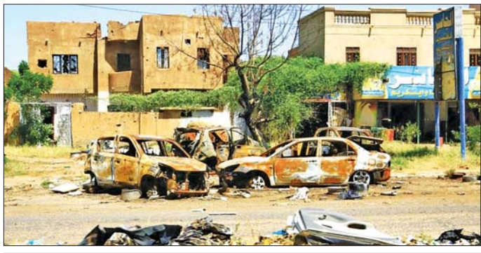
ပဋိပက္ခဖြစ်ပွားမှုကြောင့် ခါတွန်မြို့မြောက်ပိုင်းတွင် ထိခိုက်ပျက်စီးမှုများကို အောက်တိုဘာ ၂၈ ရက်က တွေ့ရစဉ်။