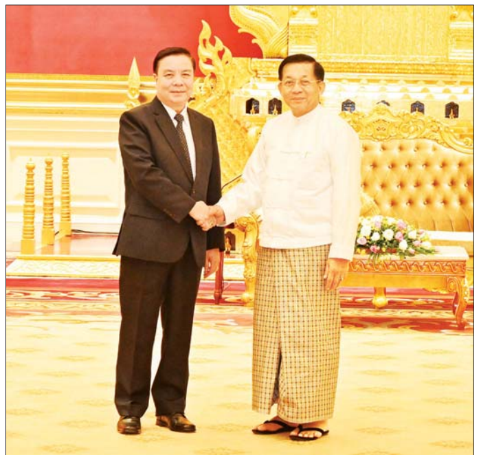
နိုင်ငံတော်စီမံအုပ်ချုပ်ရေးကောင်စီဥက္ကဋ္ဌ နိုင်ငံတော်ဝန်ကြီးချုပ် ဗိုလ်ချုပ်မှူးကြီး မင်းအောင်လှိုင် မြန်မာနိုင်ငံဆိုင်ရာ လာအိုနိုင်ငံသံအမတ်ကြီး H. E. Mr. Heuangseng KHAMDALAVONG အား ရင်းနှီးနှီးနှီး နှုတ်ဆက်စဉ်။