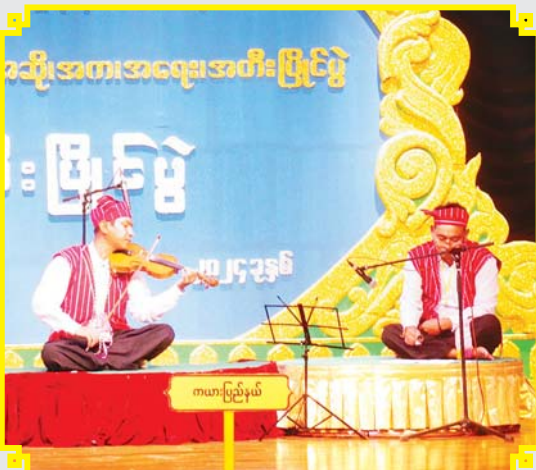
ကယား (အတီး)

ကာလပေါ်/ခေတ်ဟောင်းတေး အဆိုပြိုင်ပွဲ အခြေခံပညာ (အမျိုးသမီး အသက် ၁၀ နှစ်မှ ၁၅ နှစ်အတွင်း) ၌ ပထမဆုရရှိသည့် မန္တလေးတိုင်းဒေသကြီးမှ မသုန်းဝတ်ထွဋ် "မြန်မာ့ဂီတ လှပဝေဆာ" သီချင်းဖြင့် သီဆိုယှဉ်ပြိုင်စဉ်။