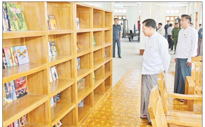
နိုင်ငံတော်စီမံအုပ်ချုပ်ရေးကောင်စီဥက္ကဋ္ဌ နိုင်ငံတော်ဝန်ကြီးချုပ် ဗိုလ်ချုပ်မှူးကြီး မင်းအောင်လှိုင် Naypyitaw State Polytechnic University ပင်မစာသင်ဆောင်အတွင်း စာသင်ခန်းများနှင့် စာကြည့်တိုက် ပြင်ဆင်ဆောင်ရွက်ထားမှုအခြေအနေ ကြည့်ရှုစစ်ဆေးစဉ်။