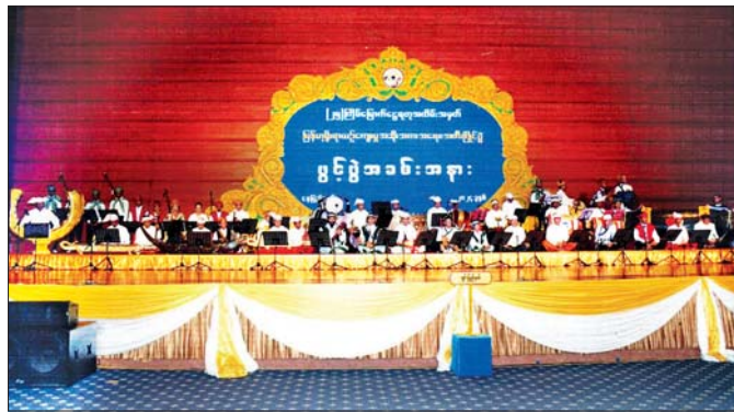
ပြည်ထောင်စုဖွား တိုင်းရင်းသားညီအစ်ကိုမောင်နှမတို့၏ စုစည်းတီးခတ်ပုံဖော်ထားသော တိုင်းရင်းသား တူရိယာသံစုံတီးဝိုင်းကြီး၏ တီးခတ်ဖျော်ဖြေတင်ဆက်မှုကို တွေ့ရစဉ်။

ပြည်ထောင်စုတိုင်းရင်းသား သွေးချင်းများသည် မြန်မာနိုင်ငံအတွင်း နှစ်ပေါင်းထောင်ချီ ရှည်လျား သော သမိုင်းစဉ်တစ်လျှောက်တွင် စည်းလုံးညီညွတ် စွာ နေလာခဲ့ကြပြီး ထုထည်ပမာဏ ကြီးမားခိုင်ခံ့ သော မြန်မာယဉ်ကျေးမှုအုတ်မြစ်ကြီးများကို ခိုင်ခိုင် မာမာ စိုက်ထူနိုင်ခဲ့ကြသည်။