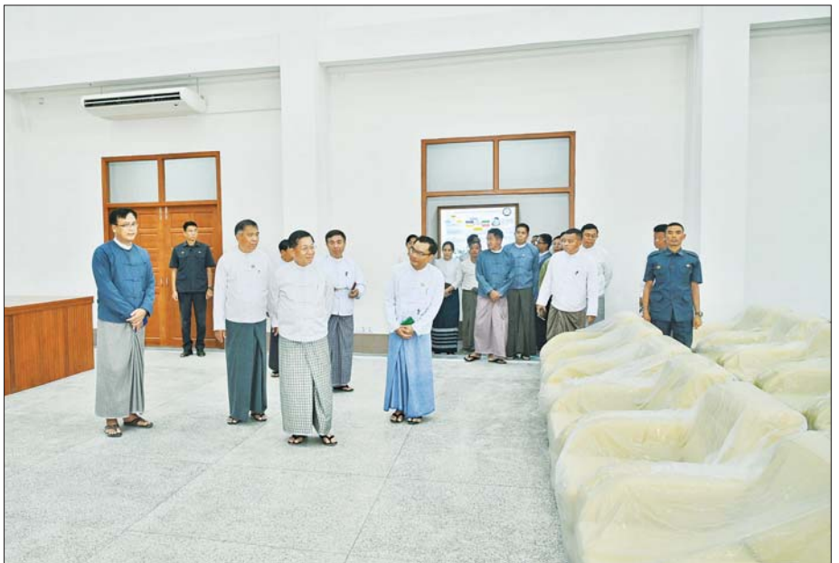
နိုင်ငံတော်စီမံအုပ်ချုပ်ရေးကောင်စီဥက္ကဋ္ဌ နိုင်ငံတော်ဝန်ကြီးချုပ် ဗိုလ်ချုပ်မှူးကြီး မင်းအောင်လှိုင် Naypyitaw State Polytechnic University ပင်မစာသင်ဆောင်အတွင်း ပြင်ဆင်ဆောင်ရွက်ထားမှုအခြေအနေ ကြည့်ရှုစစ်ဆေးစဉ်။

ခန်းမ ဆောင်ရွက်ထားရှိမှုအခြေအနေများကို ကြည့်ရှုစစ်ဆေးပြီး တာဝန်ရှိသူများ၏ တင်ပြချက်များအပေါ် လိုအပ်သည်များမှာကြားသည်။ ယင်းနောက် နိုင်ငံတော်စီမံအုပ်ချုပ်ရေးကောင်စီဥက္ကဋ္ဌ နိုင်ငံတော်ဝန်ကြီးချုပ်သည် ပင်မစာသင်ဆောင်အတွင်းသို့ ရောက်ရှိပြီး ကျောင်းသားစုဝေးခန်းမ၊ ဘွဲ့နှင်းသဘင်ခန်းမ၊ စာသင်ခန်းများ၊ လက်တွေ့ခန်းများ၊ ယာယီစာကြည့်တိုက်နှင့် အထောက်အကူပြုခန်းများ ဖွဲ့စည်း ဆောင်ရွက်ထားရှိမှု အခြေအနေများကို ကဏ္ဍတစ်ခုချင်းစီအလိုက် အသေးစိတ် လိုက်လံကြည့်ရှု စစ်ဆေးကာ တာဝန်ရှိသူများ၏ တင်ပြချက်များအပေါ် လိုအပ်သည်များမှာကြားသည်။ ထို့နောက် တက္ကသိုလ် ယာယီရှင်းလင်းဆောင်၌ သိပ္ပံနှင့် နည်းပညာဝန်ကြီးဌာန ပြည်ထောင်စုဝန်ကြီးက တက္ကသိုလ်အတွင်း စာမျက်နှာ ၅ သို့