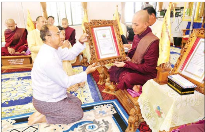
နာကြားကြသည်။ ဆက်လက်၍ လှူဒါန်းမှုအစုစု တို့အတွက် ရေစက်သွန်းချ အမျှ ပေးဝေကြပြီးစာအောင်သမ္မတကော် စာမေးပွဲ အခမ်းအနား ဆက်လက်ကျင်းပ ခဲ့ကြောင်းနှင့် (၂၃)ကြိမ်မြောက် ကမ္ဘောဇသမ္မတကော်စာမေးပွဲ တွင် ပထမဆင့်အပါး ၂၄၀၊ ဒုတိယ ဆင့် ၄၁ ပါး၊ တတိယဆင့် ၂၆ ပါး အောင်မြင်ခဲ့ရာ ယခု (၂၃) မြောက် အထိ သမ္မတကော်စာမေးပွဲ ပါး ပေါ်ထွန်းခဲ့ပြီးဖြစ်ကြောင်း သိရသည်။ ပြည်နယ်(ပြန်/ဆက်)

များက ကမ္ဘောဇသမ္မတကော်စာ မေးပွဲရသမ္မတကော်စာများအား ဘွဲ့ပ တော်၊ ဘွဲ့တံဆိပ်တော်၊ ဘွဲ့အလံ တော်နှင့် စာမေးပွဲအဆင့်အလိုက် အောင်လက်မှတ် စာအောင်ဆု များ ဆက်ကပ်လှူဒါန်းကြသည်။ ယင်းနောက် ပြည်နယ်တရား လွှတ်တော်တရားသူကြီးချုပ်နှင့် အရှေ့ပိုင်းတိုင်းစစ်ဌာနချုပ် တိုင်း ဦးစီးချုပ်တို့က ဆရာတော်ကြီး များအား လှူဖွယ်ပစ္စည်း များ ဆက်ကပ်လှူဒါန်းကြကာ နိုင်ငံတော်ဩဝါဒစရိယ ကမ္ဘောဇ သမ္မတကော်စာမေးပွဲကျင်းပ ရေးအဖွဲ့၏ ဩဝါဒစရိယ၊ အဂ္ဂ မဟာပဏ္ဍိတ၊ မဟာကမ္မဋ္ဌာနာ စရိယ စွန်းလွန်းကျောင်းတိုက် ဦးစီးပဓာနမဟာနာယက ဆရာ တော် ဘဒ္ဒန္တအဂ္ဂဓမ္မာဘိဝံသ အရှင်သူမြတ်ထံမှ ဩဝါဒ ကတနှင့် အနုမောဒနာတရား