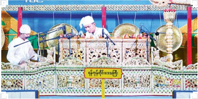
ဆိုင်းတစ်ဦးချင်း(အတီး)

၂၀၂၄ ခုနှစ် (၂၅) ကြိမ်မြောက် ငွေရတုအထိမ်းအမှတ် မြန်မာ့ရိုးရာယဉ်ကျေးမှု အဆို၊ အက၊ အရေး၊ အတီးပြိုင်ပွဲကြီးကို အောက်တိုဘာ ၁၄ ရက်မှ အောက်တိုဘာ ၂၃ ရက်အထိ နေပြည်တော်ရှိ သတ်မှတ် နေရာအသီးသီး၌ကျင်းပခဲ့ရာ ပထမဆုရပြိုင်ပွဲဝင်များ၏ ယှဉ်ပြိုင်ခဲ့မှုမြင်ကွင်းပုံရိပ်များကို စုစည်းဖော်ပြလိုက်ပါသည်။