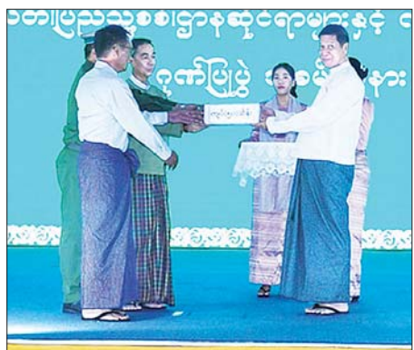
ဦးစွာ ပြည်နယ်ဝန်ကြီးချုပ်က ဂုဏ်ပြုအမှာစကား ပြောကြား သည်။ ထို့နောက် ပြည်နယ်ဝန်ကြီး ချုပ်နှင့် တိုင်းမှူးတို့က ကယ်ဆယ်

နေပြည်တော် အောက်တိုဘာ ၃၀ ရှမ်းပြည်နယ်အတွင်း တိုင်ဖွန်း မုန်တိုင်း (ရာဂီ) ဒဏ်ကြောင့် ရေဘေးသင့်ခဲ့သည့် မြို့နယ်များ တွင် ကယ်ဆယ်ရေးလုပ်ငန်းများ၊ ပြန်လည်ထူထောင်ရေးလုပ်ငန်း များ စွမ်းစွမ်းတမ်း ဆောင်ရွက်ခဲ့ သည့် ဌာန/အဖွဲ့အစည်းများအား ဂုဏ်ပြုချီးမြှင့်ပွဲကို ယနေ့ နံနက် ပိုင်းတွင် တောင်ကြီးမြို့၊ မြို့တော် ခန်းမ၌ ပြုလုပ်ရာ ပြည်နယ် ဝန်ကြီးချုပ် ဦးအောင်အောင်၊ အရှေ့ပိုင်းတိုင်း စစ်ဌာနချုပ် တိုင်းမှူး ဗိုလ်ချုပ် ဇော်မင်းလတ် နှင့် ပြည်နယ်အစိုးရအဖွဲ့ဝင် ဝန်ကြီးများ၊ ဌာနဆိုင်ရာတာဝန် ရှိသူများ၊ ဖိတ်ကြားထားသူများ တက်ရောက်ကြသည်။