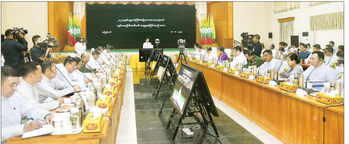
နိုင်ငံတော်စီမံအုပ်ချုပ်ရေးကောင်စီ ဒုတိယဥက္ကဋ္ဌ ဒုတိယဝန်ကြီးချုပ် ဒုတိယဗိုလ်ချုပ်မှူးကြီး စိုးဝင်း ၂၀၂၄ ခုနှစ် ပဉ္စမအကြိမ် အမျိုးသားအားကစားပွဲတော် ကျင်းပရေးဦးစီးကော်မတီ စတုတ္ထအကြိမ်အစည်းအဝေးတွင် အမှာစကားပြောကြားစဉ်။

နေပြည်တော် အောက်တိုဘာ ၃၀ ၂၀၂၄ ခုနှစ် ပဉ္စမအကြိမ်အမျိုးသားအားကစားပွဲတော် ကျင်းပရေးဦးစီးကော်မတီ စတုတ္ထအကြိမ်အစည်းအဝေးကို ယနေ့မနက် ၉ နာရီတွင် နေပြည်တော်ရှိ အားကစားနှင့် လူငယ်ရေးရာဝန်ကြီးဌာနစုပေါင်းအစည်းအဝေးခန်းမ၌ ကျင်းပရာ ပဉ္စမအကြိမ်အမျိုးသား အားကစားပွဲတော်ကျင်းပရေး ဦးစီးကော်မတီနာယက နိုင်ငံတော်စီမံအုပ်ချုပ်ရေးကောင်စီဒုတိယဥက္ကဋ္ဌ ဒုတိယဝန်ကြီးချုပ် ဒုတိယဗိုလ်ချုပ်မှူးကြီး စိုးဝင်း တက်ရောက်အမှာစကားပြောကြားသည်။ အစည်းအဝေးသို့ ကျင်းပရေးဦးစီးကော်မတီဝင် ပြည်ထောင်စုဝန်ကြီးများ၊ ပြည်ထောင်စုစာမျက်နှာ ၆ ကော်လံ ၁ ♦