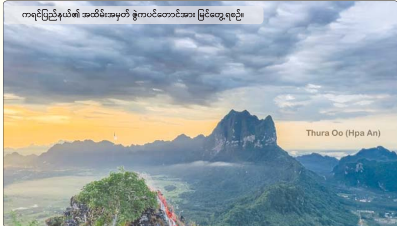
ကရင်ပြည်နယ်၏ အထိမ်းအမှတ် ဇွဲကပင်တောင်အား မြင်တွေ့ရစဉ်။