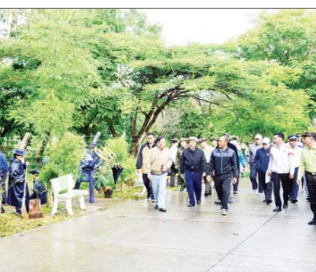
ပျံ့တော်ကျင်းပမည့် အဝေရာ ပွဲဈေးတန်းများနှင့် MSMEs များကို ကြည့်ရှုစစ်ဆေးခဲ့ကြောင်း မီးပုံးပျံ့ကွင်း ပြင်ဆင်ဆောင်ရွက် အသေးစား၊ အလတ်စား၊ သိရသည်။ ထားရှိမှုများ၊ ပွဲတော်မုခ်ဦးများ၊ အငယ်စား ဒေသထွက်ကုန်ပြခန်း မောင်မောင်သန်း(တောင်ကြီး)

ကြည့်ရှုစစ်ဆေးကာ ရွှေရင်အေးလမ်းမီးသတ်ဦးစီးဌာန အနီးရှိ လမ်းဘေး ၁၀ ယာတွင် စုပေါင်းသန့်ရှင်းရေးဆောင်ရွက်နေမှုနှင့် ယင်းနေရာတွင် မြေများညှိပြီး ပြည်သူများ အားကစားလေ့ကျင့်နိုင်ရန်အတွက် အားကစားပစ္စည်းများ ဆောင်ရွက်ထားရှိပေးနိုင်ရေး သက်ဆိုင်ရာ ဌာနများနှင့် ပေါင်းစပ်ညှိနှိုင်း ဆောင်ရွက်ပေးခဲ့ကြောင်း သိရသည်။ ထိုမှတစ်ဆင့် ပြည်နယ်ဝန်ကြီးချုပ်နှင့် အဖွဲ့သည် တောင်ကြီးမြို့ စုဌာမုနိလောကချမ်းသာဘုရား စေတီတော်ဘက်စုံမွမ်းမံ ပြုပြင်ဆောင်ရွက်တောင်ကြီးတန်ဆောင်တိုင်မီးပုံး