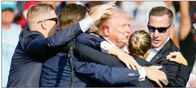
ရှေးကောက်ပွဲမဲဆွယ်ကာလအတွင်း သေနတ်ပစ်ခတ်မှုဖြစ်ပွားပြီးနောက် ထရမ်ကို တွေ့ရစဉ်။

ဝါရှင်တန်၊ နိုဝင်ဘာ ၉ - အဝင် အမေရိကန်နိုင်ငံရှိ ပစ်မှတ်ထားသူများအား အီရန်နိုင်ငံတွင် နေထိုင်သော အာဖဂန်နိန်သား ပူးပေါင်းလုပ်ကြံသတ်ဖြတ်ရာတွင် ပါဝင်ပတ်သက်မှု တစ်ဦးသည် ရှေးကောက်ခံသမ္မတဒေါ်နယ်ထရမ်အပါ ရှိကြောင်း အမေရိကန်တရားရေးဝန်ကြီးဌာနက