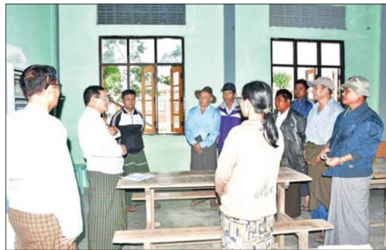
လုပ်ငန်းများနှင့် ပတ်သက်၍ ဆုံးဖြတ်ချက်ချရာတွင် အခြေခံပညာအထက်တန်းကျောင်း(ခွဲ) တွင် တင်ဒါအောင်ကုမ္ပဏီက တာဝန်ယူ တည်ဆောက်နေသည့် တစ်ထပ် ကျောင်းဆောင်သစ် ဆောက်လုပ် နေမှုကို ကြည့်ရှုစစ်ဆေးခဲ့ကြောင်း သိရသည်။

အခြေခံပညာ အထက်တန်းကျောင်း(ခွဲ) တွင် တင်ဒါအောင်ကုမ္ပဏီက တာဝန်ယူ တည်ဆောက်နေသည့် တစ်ထပ် ကျောင်းဆောင်သစ် ဆောက်လုပ် နေမှုကို ကြည့်ရှုစစ်ဆေးရာ ကုမ္ပဏီမှ တာဝန်ရှိသူများက လုပ်ငန်းဆောင်ရွက်နေမှု အခြေအနေများ၊ အဆိုပါ လုပ်ငန်းများအတွက် (QA/QC) အဖြစ် တာဝန်ယူ ဆောင်ရွက်နေသော ကုမ္ပဏီမှ လုပ်ငန်းမှူး၏ အရည်အသွေး ပိုင်းဆိုင်ရာ စစ်ဆေးချက်များနှင့် ပြီးစီးမှုရင်ဆိုင်ခန်းများကို ရှင်းလင်းတင်ပြ ကြသည်။