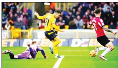
ကွင်းလယ်တိုက်စစ်ကစားသမား ဆရာတီယာ ပုဂံအသင်း အတွက် ဦးဆောင်ဂိုးသွင်းယူစဉ်။

တွင် အကောင်းဆုံးတုံ့ပြန်ခဲ့ပြီး သရေတစ်မှတ် ရယူနိုင်ခဲ့ခြင်းဖြစ်သည်။ ရန်ကုန်ယူနိုက်တက် အသင်းသည် ပြီးခဲ့သည့်ရာသီမှ အသင်းဖွဲ့စည်းကာ ပြိုင်ပွဲဝင်သော်လည်း ဒုတိယမြောက်ရာသီတွင် အမြင့်ဆုံးရပ်တည်မှုအဖြစ် ဒုတိယနေရာ ရယူနိုင် ခြင်းဖြစ်သည်။