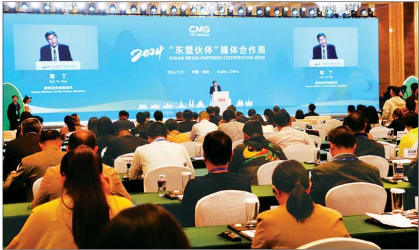
ဒုတိယဝန်ကြီး ဦးရဲတင့် 2024 ASEAN MEDIA PARTNERS COOPERATION WEEK ဖွင့်ပွဲအခမ်းအနားတွင် မိန့်ခွန်းပြောကြားစဉ်။

ရှိသူများနှင့် တက်ရောက်လာကြသည့် အာဆီယံနိုင်ငံများမှ ကိုယ်စားလှယ်အဖွဲ့ ခေါင်းဆောင်များသည် သီးသန့်တွေ့ဆုံ၍ တရုတ်နိုင်ငံနှင့် မိမိတို့ နိုင်ငံများအကြား မီဒီယာကဏ္ဍ ပူးပေါင်းဆောင်ရွက်မှု အခြေအနေနှင့် ဆက်လက်ဆောင်ရွက် သွားမည့် အခြေအနေများကို ညှိနှိုင်း ဆွေးနွေးကြသည်။ ကောင်းကျိုးများတည်ဆောက်နိုင် ဖွင့်ပွဲအခမ်းအနားတွင် ဒုတိယဝန်ကြီး ဦးရဲတင့်က မိန့်ခွန်းပြောကြားရာ၌ ယနေ့ မီဒီယာကဏ္ဍသည် နိုင်ငံအသီးသီး၏ နယ်ပယ်စုံတွင် အရေးပါလှကောင်းကြောင်း၊ မီဒီယာကြောင့် နိုင်ငံအချင်းချင်း ပြည်သူ အချင်းချင်း ရင်းနှီးကျွမ်းဝင်မှုနှင့် ကောင်းကျိုးများကို တည်ဆောက်နိုင် သကဲ့သို့ သတင်းတု သတင်းမှားများနှင့် ကျင့်ဝတ်ချိုးဖောက်သော မီဒီယာများ ကြောင့် အချို့နိုင်ငံများမှာ တည်ငြိမ် အေးချမ်းမှုပျက်ပြားပြီး ဖွံ့ဖြိုးတိုးတက်မှု နှေးကွေးသည်ကို အားလုံးအသိပင် ဖြစ်ကြောင်း။ မီဒီယာကွာဟချက်များကို လျော့ချ နိုင်ရေးနှင့် နည်းပညာမျှဝေခြင်းတို့ကို ဆောင်ရွက်သင့်ကြောင်း၊ တရုတ်နိုင်ငံ အပါအဝင် ဒေသတွင်း နိုင်ငံများအနေဖြင့် မီဒီယာကဏ္ဍကို စုပေါင်းလုပ်ကိုင်ပါက