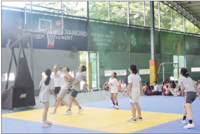
တက္ကသိုလ်အဆင့် ဘတ်စကက်ဘောပြိုင်ပွဲ အကြိတ်အနယ် ယှဉ်ပြိုင်ကြစဉ်။

ဤနေရာမှာ ပညာရှင်များက အားကစားနှင့် ဆက်စပ်ပြီး ဉာဏ်ရည်ဉာဏ်သွေး (IQ)နှင့် စိတ်ပိုင်း