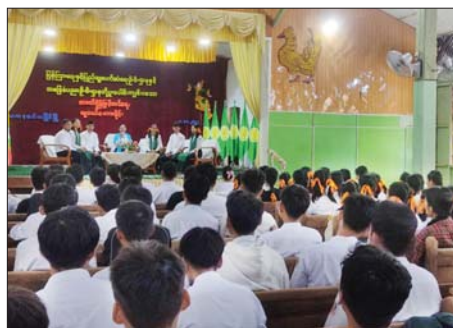
ပြောကြားကာ ကျောင်းသား ကျောင်းသူများက လူငယ်နှင့် ကိုယ်ကျင့်တရား၊ လူငယ်နှင့် ပေါင်းသင်းဆက်ဆံရေး၊ လူငယ်နှင့် စာအုပ်စာပေ၊ လူငယ်နှင့် ဆိုရှယ်မီဒီယာ၊ လူငယ်နှင့် မူးယစ်ဆေးဝါးအန္တရာယ်၊ လူငယ်နှင့်ဘဝ ရည်မှန်းချက် ခေါင်းစဉ်တို့ဖြင့် သုံးတိုက် ဖတ်ရှုလေ့လာထားသည့် စာရေးသူ၏ ဆိုလိုရင်းနှင့်

မော်လမြိုင် နိုဝင်ဘာ ၉ မွန်ပြည်နယ် မော်လမြိုင်မြို့နယ်၌ ခရိုင်ပြန်ကြားရေးနှင့် ပြည်သူ့ဆက်ဆံရေးဦးစီးဌာနနှင့် အခြေခံပညာဦးစီးဌာနတို့ ပူးပေါင်း၍ စာဖတ်ရိုက်နှိပ်ဖြန့်ဖြူးရေး လူငယ် စကားပိုင်းကို နိုဝင်ဘာ ၈ ရက်က အမှတ်(၄) အခြေခံပညာအထက်တန်းကျောင်းခန်းမ၌ ကျင်းပသည်။