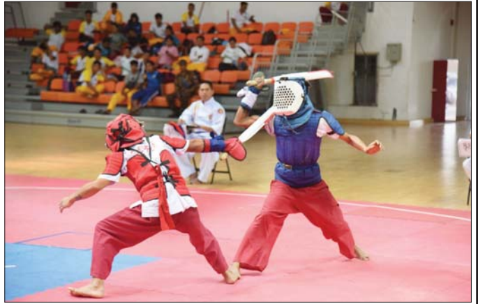
မြန်မာ့သိုင်းပြိုင်ပွဲ၌ ပါဝင်ယှဉ်ပြိုင်နေကြစဉ်။

ယခုအချိန် နိုင်ငံသားတွေ၏ ကာယပိုင်း၊ စိတ်ဓာတ်ပိုင်းက အလွန်ကို အားနည်းချည့်နဲ့ သည့် အနေအထား၊ အထူးသဖြင့် စိတ်ဓာတ်ပိုင်းက ပို၍ အားနည်းလှသည်ကို တွေ့ရသည်။ စိတ်ဓာတ်ပိုင်း အားနည်းခြင်းက အရာရာအောင်မြင်မှုနှင့် အလွမ်းဝေး သွားစေသည်။ နိုင်ငံတိုးတက်ရန်အတွက်လည်း အထောက်အကူမဖြစ်ဟု...စဉ်းစားသည့်နေရာတွင် အနာဂတ်နိုင်ငံတော်နှင့် နိုင်ငံသားများအတွက် စဉ်းစားပေးခြင်းလည်းပါသည်။ အနာဂတ် မျိုးဆက် အဆက်ဆက်အတွက် ဆိုပါတော့၊ ယခုပစ္စုပ္ပန် အတွက် အရေးကြီးသလို အနာဂတ်အတွက်လည်း မစဉ်းစားလိုမရ၊ စဉ်ဆက်မပြတ်ဖွံ့ဖြိုးရေး အမြင်ကို ပါ ထည့်သွင်းစဉ်းစားလိုက်လျှင် ပို၍တောင် အရေးကြီးသွားမည်ဖြစ်သည်။ ထိုသို့ စဉ်းစားပြီးမှ နိုင်ငံနှင့် နိုင်ငံသားများအတွက် ရေရှည်တည်တံ့ ဖြစ်သည့် ဘက်စုံတိုးတက်ဖွံ့ဖြိုးရန်အတွက် အားကစားကဏ္ဍသည် မရှိမဖြစ် အရေးပါသည်။