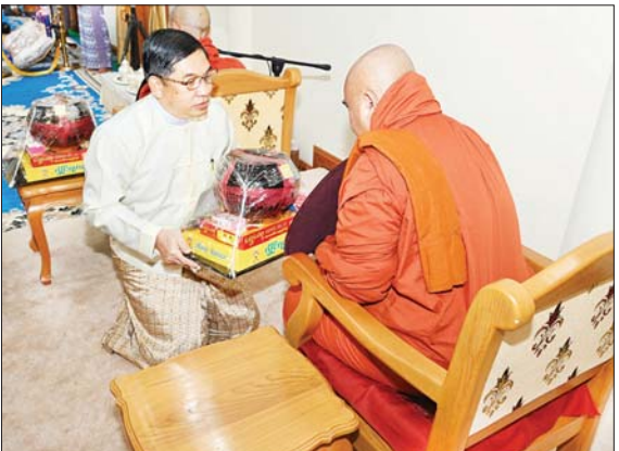
နိုင်ငံတော် စီမံအုပ်ချုပ်ရေးကောင်စီအဖွဲ့ဝင် ဗိုလ်ချုပ်ကြီး ညိုစော ဆရာတော်ထံ ကထိန်သင်္ကန်းနှင့် လှူဖွယ်ပစ္စည်းများကို ဆက်ကပ်လှူဒါန်းစဉ်။

စာမျက်နှာ ၄ မှ ကထိန်လှူသင်္ကန်းနှင့် လှူဖွယ်ပစ္စည်းများကို လည်းကောင်း ဆက်ကပ်လှူဒါန်းသည်။ ထို့နောက် နိုင်ငံတော်စီမံအုပ်ချုပ်ရေးကောင်စီ ဒုတိယဥက္ကဋ္ဌ ဒုတိယဝန်ကြီးချုပ်နှင့် ဇနီးတို့က လယ်ဝေးမြို့ အင်းသာအရှေ့ကျောင်းတိုက် ဆရာတော်အဘိဓဇဂုဏမဟာသဒ္ဓမ္မဇောတိက