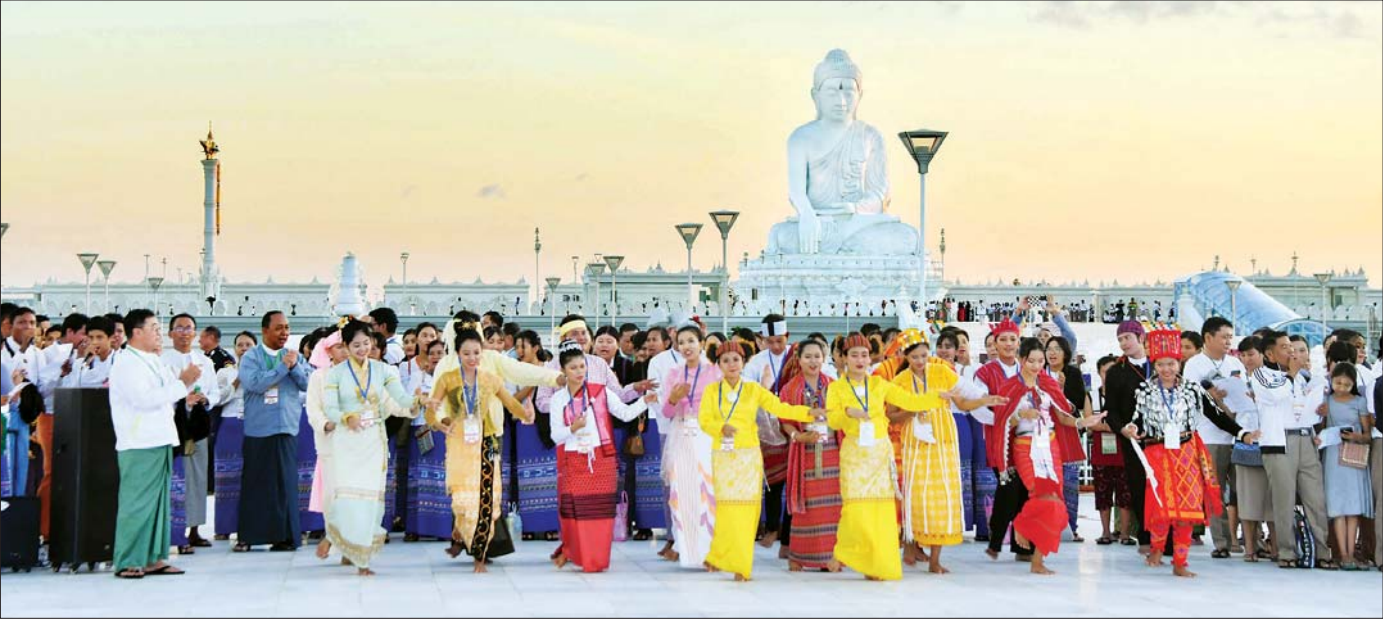
မီးပုံးပျံများ လွှတ်တင်ရန်ပြင်ဆင်မှုများ ဆောင်ရွက်နေချိန်တွင် တိုင်းရင်းသားယဉ်ကျေးမှုအဖွဲ့များက တိုင်းရင်းသားရိုးရာအကအလှများဖြင့် သီဆိုကပြဖျော်ဖြေတင်ဆက်ကြစဉ်။