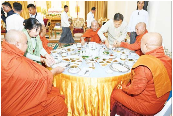
နိုင်ငံတော်စီမံအုပ်ချုပ်ရေးကောင်စီ ဒုတိယဥက္ကဋ္ဌ ဒုတိယဝန်ကြီးချုပ် ဒုတိယဗိုလ်ချုပ်မှူးကြီး စိုးဝင်းနှင့် ဇနီး ဒေါ်သန်းသန်းနွယ် ဆရာတော်၊ သံဃာတော်များအား နေ့ဆွမ်းဆက်ကပ်လှူဒါန်းစဉ်။