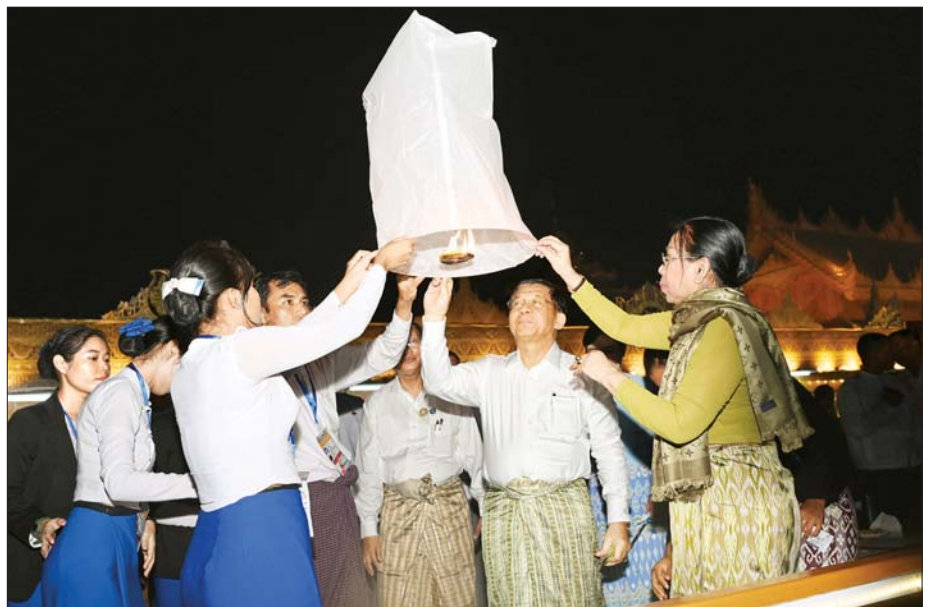
နိုင်ငံတော်စီမံအုပ်ချုပ်ရေးကောင်စီဥက္ကဋ္ဌ နိုင်ငံတော်ဝန်ကြီးချုပ် ဗိုလ်ချုပ်မှူးကြီး မင်းအောင်လှိုင်နှင့် ဇနီး ဒေါ်ကြူကြူလှတို့ အခမ်းအနားတက်ရောက်လာကြသူများနှင့်အတူ မီးပုံးပျံငယ်များကို လွှတ်တင်ပူဇော်ကြစဉ်။

နိုင်ငံတော်ဝန်ကြီးချုပ်နှင့် ဇနီးတို့သည် မာရဝိဇယဗုဒ္ဓရုပ်ပွားတော် မြတ်ကြီးအား ဖူးမြော်ကြည့်ညိပြီး ပန်း၊ ရေချမ်းနှင့် ဆီမီးများ ကပ်လှူပူဇော်ပြီး ရင်ပြင်တော်ကြီးပေါ်၌ လှည့်လည်ဖူးမြော်ကြည့်ညိ၍ မာရဝိဇယဗုဒ္ဓရုပ်ပွားတော် မြတ်ကြီး တန်ဆောင်တိုင်မီးထွန်းပွဲတော်ဖွင့်ပွဲ အခမ်းအနားသို့ တက်ရောက်လာကြသူများနှင့် အတူ ဆီမီးများကို အတူတကွ ထွန်းညှိပူဇော်ကြသည်။ ဘုရားဖူးလာသူများအား ရင်းနှီးစွာနှုတ်ဆက် ထို့နောက် နိုင်ငံတော်စီမံအုပ်ချုပ်ရေး ကောင်စီဥက္ကဋ္ဌ နိုင်ငံတော်ဝန်ကြီးချုပ်နှင့် ဇနီးတို့သည် မာရဝိဇယဗုဒ္ဓရုပ်ပွားတော် မြတ်ကြီး တန်ဆောင်တိုင်မီးထွန်းပွဲတော်သို့ လာရောက်ကြသူများနှင့် ဘုရားဖူးလာ ရဟန်းရှင်လူပြည်သူများအား ခင်မင်ရင်းနှီးစွာ နှုတ်ဆက်ကြသည်။ စာမျက်နှာ ၈ သို့