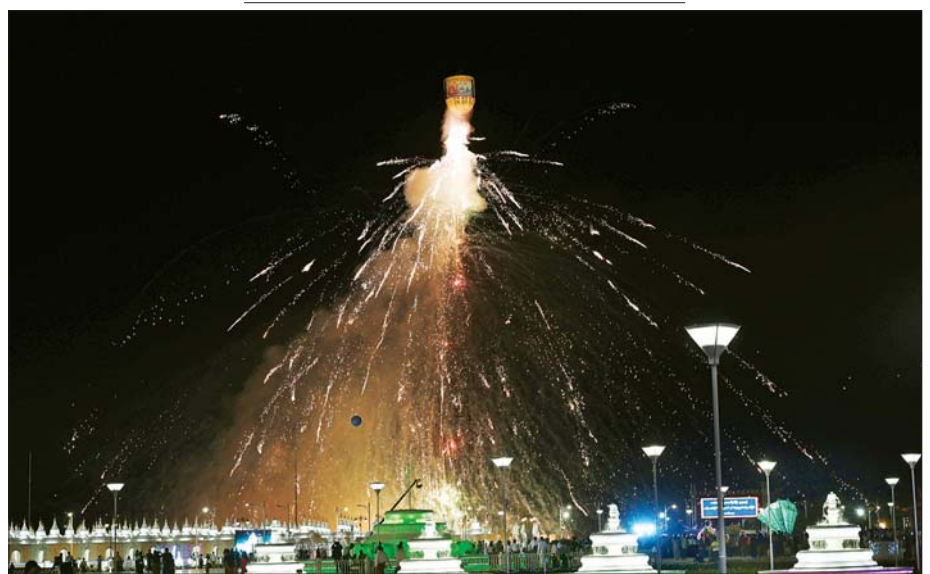
မာရဝိဇယဗုဒ္ဓရုပ်ပွားတော်မြတ်ကြီး တန်ဆောင်တိုင်မီးထွန်းပွဲတော် မီးပုံးပျံလွှတ်တင်ပူဇော်ပွဲတွင် စိန်နားပန်မီးပုံးပျံများနှင့် ညမီးကျည်(ညမီးကြီး) မီးပုံးပျံများ လွှတ်တင်ပူဇော်ယှဉ်ပြိုင်နေမှုများကို တွေ့ရစဉ်။