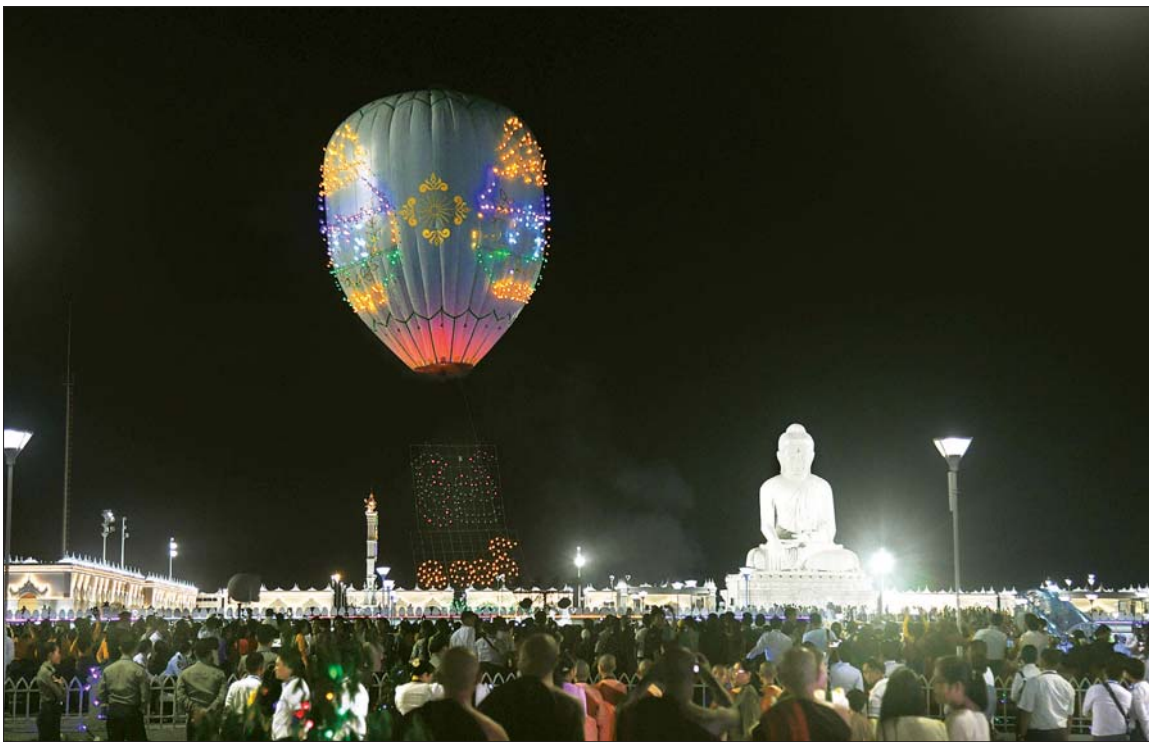
နေပြည်တော် ဒက္ခိဏသီရိမြို့နယ်ရှိ မာရဝိဇယဗုဒ္ဓရုပ်ပွားတော်မြတ်ကြီး တန်ဆောင်တိုင်မီးထွန်းပွဲတော် မီးပုံးပျံလွှတ်တင်ပူဇော်ခြင်းဖွင့်ပွဲအခမ်းအနား စည်ကားသိုက်မြိုက်စွာကျင်းပစဉ်။

နေပြည်တော် နိုဝင်ဘာ ၁၃ ပြည်ထောင်စု နယ်မြေ နေပြည်တော် ဒက္ခိဏသီရိမြို့နယ် ရှိ မာရဝိဇယ ဗုဒ္ဓရုပ်ပွားတော် မြတ်ကြီး တန်ဆောင်တိုင်မီးထွန်းပွဲတော် မီးပုံးပျံလွှတ်တင်ပူဇော်ခြင်းဖွင့်ပွဲအခမ်းအနားကို ယနေ့ ညနေပိုင်းတွင် မာရဝိဇယ ဗုဒ္ဓဥယျာဉ်တော်အတွင်းရှိ ရေပန်းရင်ပြင်တော်၌ စည်ကားသိုက်မြိုက်စွာကျင်းပပြုလုပ်သည်။ အခမ်းအနားသို့ နိုင်ငံတော်စီမံအုပ်ချုပ်ရေး ကောင်စီဥက္ကဋ္ဌ နိုင်ငံတော်ဝန်ကြီးချုပ် ဗိုလ်ချုပ်မှူးကြီး မင်းအောင်လှိုင်နှင့်ဇနီး ဒေါ်ကြူကြူလှ၊ နိုင်ငံတော်စီမံအုပ်ချုပ်ရေး ကောင်စီဒုတိယဥက္ကဋ္ဌ ဒုတိယဝန်ကြီးချုပ် ဒုတိယဗိုလ်ချုပ်မှူးကြီး စိုးဝင်းနှင့်ဇနီး ဒေါ်သန်းသန်းနွယ်၊ ကောင်စီအတွင်းရေးမှူးနှင့်ဇနီး၊ တွဲဖက်အတွင်းရေးမှူးနှင့် ဇနီး၊ ကောင်စီဝင်များနှင့် ဇနီးများ၊ ပြည်ထောင်စုဝန်ကြီးများနှင့်ဇနီး၊ နေပြည်တော် ကောင်စီဥက္ကဋ္ဌ၊ ကာကွယ်ရေးဦးစီးချုပ်ရုံးမှ အဆင့်မြင့်တပ်မတော်အရာရှိကြီးများနှင့် ဇနီးများ၊ စာမျက်နှာ ၆ ကော်လံ ၁