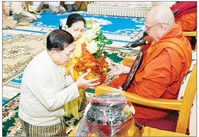
နိုင်ငံတော်စီမံအုပ်ချုပ်ရေးကောင်စီဥက္ကဋ္ဌ နိုင်ငံတော်ဝန်ကြီးချုပ် ဗိုလ်ချုပ်မှူးကြီး မင်းအောင်လှိုင်နှင့် ဇနီး ဒေါ်ကြူကြူလှ ပေါက်မြိုင်ကျောင်းတိုက်ဆရာတော်ကြီး အဘိဓဇ မဟာရဋ္ဌဂုရု ဘဒ္ဒန္တနေမိန္ဒ ထံ ကထိန်သင်္ကန်းနှင့် လှူဖွယ်ပစ္စည်းများ ဆက်ကပ်လှူဒါန်းစဉ်။