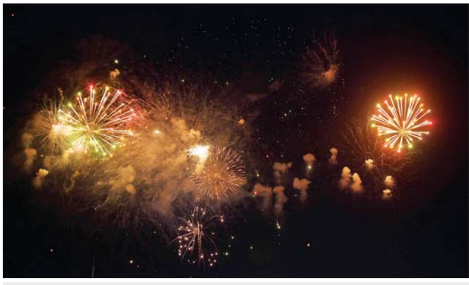
မာရဝိဇယဗုဒ္ဓရုပ်ပွားတော်မြတ်ကြီး တန်ဆောင်တိုင်မီးထွန်းပွဲတော် မီးပုံးပျံလွှတ်တင်ပူဇော်တွင် မီးရှူးမီးပန်းများ ပစ်ဖောက်ပူဇော်မှုကို တွေ့ရစဉ်။