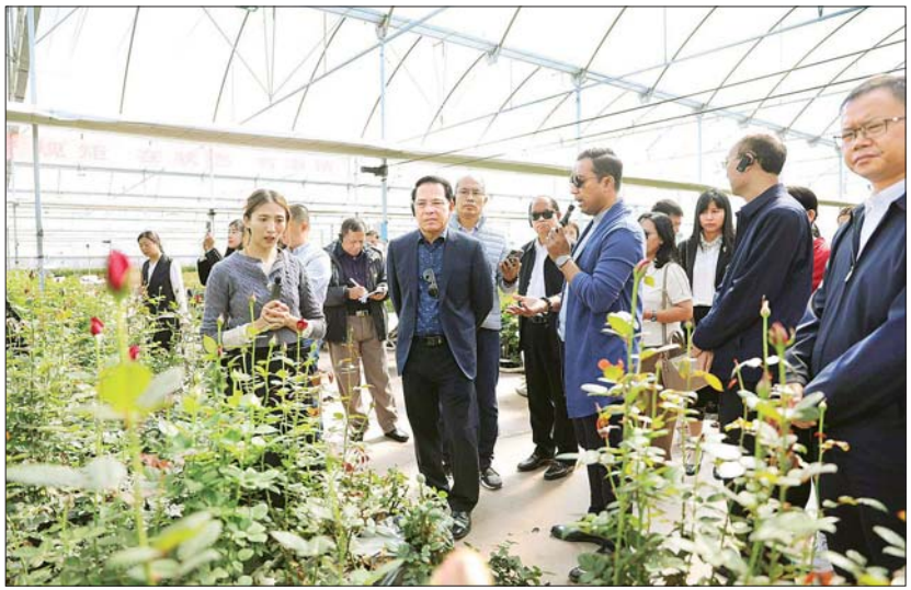
ပြည်ထောင်စုဝန်ကြီး ဦးမောင်မောင်အုန်း ဦးဆောင်သည့် မြန်မာကိုယ်စားလှယ်အဖွဲ့ ယူနန်ပြည်နယ် ချူရှုံ့ပြည်နယ်ခွဲ ယောင်အန်းခရိုင်ရှိ “အရှေ့တိုင်း နှင်းဆီတောင်ကြား” လယ်ယာစိုက်ပျိုးရေးဥယျာဉ်၌ ကြည့်ရှုလေ့လာကြသည်။

နိုဝင်ဘာ ၁၃ ရက် ယနေ့ နံနက်ပိုင်း တွင် မြန်မာကိုယ်စားလှယ်အဖွဲ့သည် ယူနန်ပြည်နယ်၊ ချူရှုံ့ပြည်နယ်ခွဲ ယောင်အန်းခရိုင်ရှိ “အရှေ့တိုင်း နှင်းဆီ တောင်ကြား” လယ်ယာစိုက်ပျိုးရေး ဥယျာဉ်သို့ မော်တော်ယာဉ်များဖြင့် သွားရောက်ကြပြီး တျန်းယွင်၊ ယွမ်ရှီ၊ ရှူချို၊ ထျန်းလန်စသည့် တရုတ် ဂန္ဓမာ ပန်း၊ ထာဝရပန်းနှင့် နှင်းဆီပန်းများကို ဖန်လုပ်အိမ် ခေတ်မီစိုက်ပျိုးရေးနည်း စနစ်ဖြင့် စိုက်ပျိုးထုတ်လုပ်ပြီး တရုတ် ပြည်တွင်းနှင့် ပြည်ပသို့ ကူမင်း