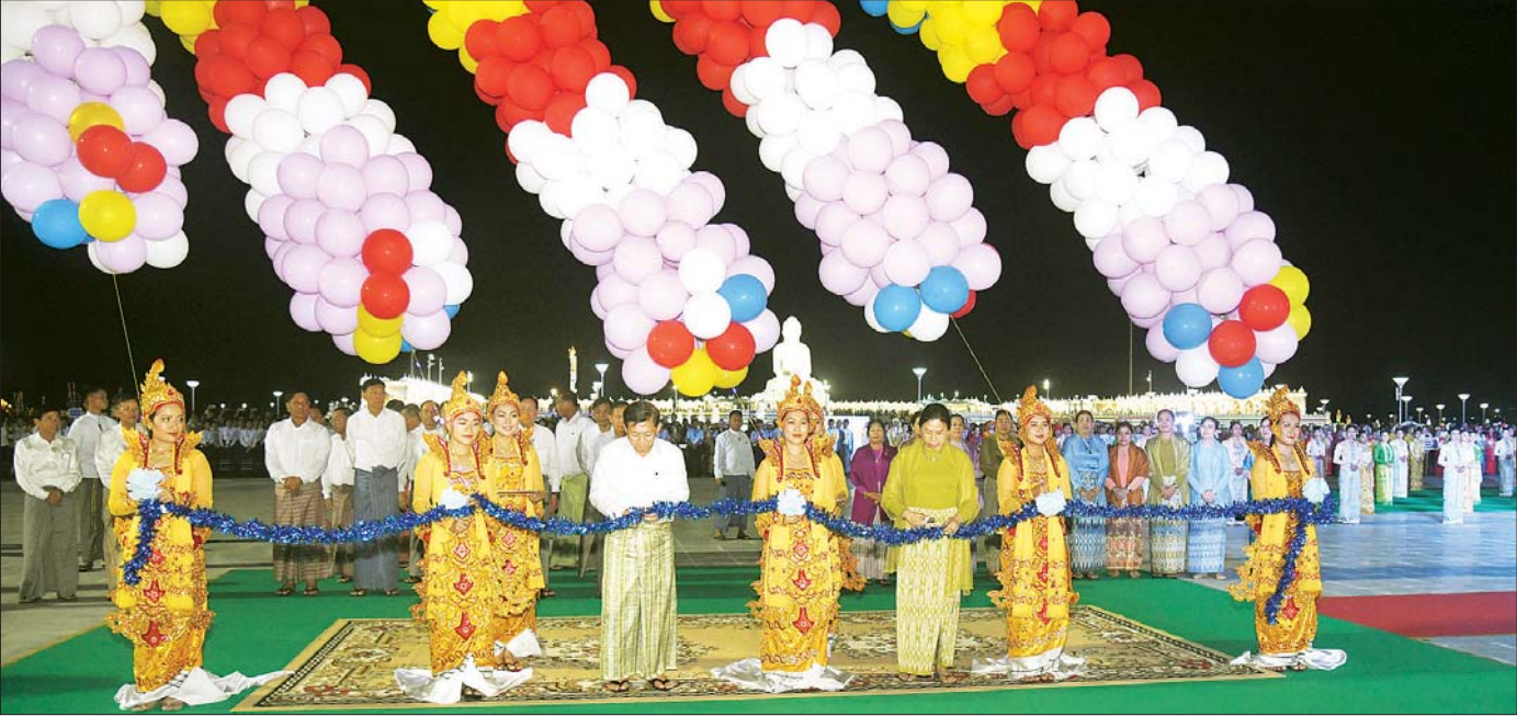
နိုင်ငံတော်စီမံအုပ်ချုပ်ရေးကောင်စီဥက္ကဋ္ဌ နိုင်ငံတော်ဝန်ကြီးချုပ် ဗိုလ်ချုပ်မှူးကြီး မင်းအောင်လှိုင်နှင့်ဇနီး ဒေါ်ကြူကြူလှ မာရဝိဇယဗုဒ္ဓရုပ်ပွားတော်မြတ်ကြီး တန်ဆောင်တိုင်မီးထွန်းပွဲတော် မီးပုံးပျံလွှတ်တင်ပူဇော်ခြင်း ဖွင့်ပွဲအခမ်းအနားအား ဖဲကြိုးဖြတ်ဖွင့်လှစ်ပေးကြစဉ်။

၂ ဂျေ ဖုံးမှ နေပြည်တော်တိုင်း စစ်ဌာနချုပ် တိုင်းမှူးနှင့် တာဝန်ရှိသူများ တက်ရောက်ကြပြီး ဘုရားဖူးလာ ရဟန်းရှင်လှပြည်သူများကလည်း စည်ကားများပြားစွာ လာရောက် ကြည့်ရှုကြသည်။ ဖဲကြိုးဖြတ်ဖွင့်လှစ်ပေး ဦးစွာ နိုင်ငံတော်စီမံအုပ်ချုပ် ရေးကောင်စီဥက္ကဋ္ဌ နိုင်ငံတော် ဝန်ကြီးချုပ်နှင့် ဇနီးတို့သည် အခမ်းအနားကျင်းပမည့်နေရာ သို့ရောက်ရှိကြရာ တိုင်းရင်းသား၊ တိုင်းရင်းသူများက မီးကြာခွက် များကိုင်ဆောင်၍ လည်းကောင်း၊ တိုင်းရင်းသားရိုးရာယဉ်ကျေးမှု အဖွဲ့များက ဦးရွှေရိုး ဒေါ်မိုးအက၊ တိုင်းရင်းသားရိုးရာ အကအလှ များ၊ အိုးစည်ဒိုးပတ်များ တီးမှုတ် ၍ ကြိုဆိုကြသည်။ ထို့နောက် နိုင်ငံတော်စီမံ အုပ်ချုပ်ရေး ကောင်စီဥက္ကဋ္ဌ နိုင်ငံတော်ဝန်ကြီးချုပ်နှင့် ဇနီးတို့