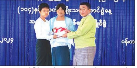
ဆုများ ချီးမြှင့်ပေးအပ်ကာ ကို ကျောင်းသား ကျောင်းသူ များက လေ့လာကြည့်ရှုကြောင်း သိရသည်။

ရေးဦးစီးဌာန ဦးစီးအရာရှိဦးကို မောင်က အမျိုးသားနေ့ပေါ်ပေါက် လာပုံအကြောင်းကို ရှင်းလင်း ပြောကြားသည်။ ထို့နောက် “လူငယ်နှင့် အမျိုး သားရေးတာဝန်” ခေါင်းစဉ်ဖြင့် စာစီစာကုံးပြိုင်ပွဲ ကျင်းပရာ ပန်းတနော်မြို့ အခြေခံပညာ အလယ်တန်းကျောင်း(ခွဲ)ဆယ်နှစ် ရွှေကျောင်းမှကျောင်းသားကျောင်း သူများက ယှဉ်ပြိုင်ခဲ့ကြပြီး ဆုရရှိ သူများအား တာဝန်ရှိသူများက