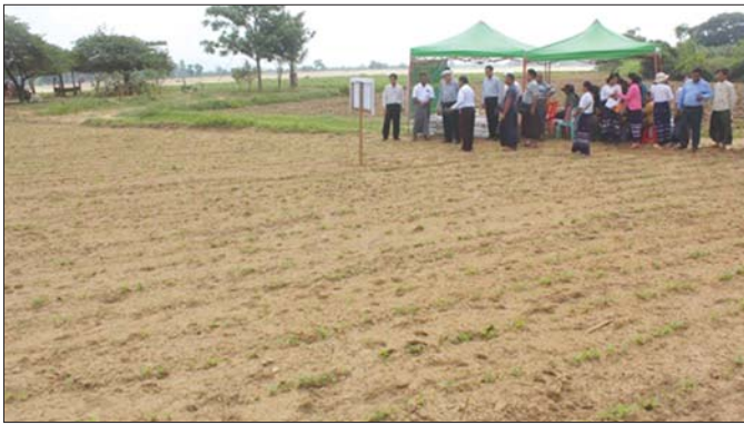
ဆောင်းသီးနှံစိုက်ပျိုးထားမှုအား တာဝန်ရှိသူများ ကြည့်ရှုစစ်ဆေးစဉ်။

ကျွန်တော်က မြို့နယ်အလိုက်တွေ့ရှိရသည့် မြေအခြေအနေများကို ရှင်းလင်းပြလိုက်ရရှိ