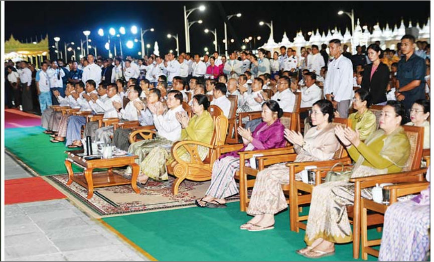
နိုင်ငံတော်စီမံအုပ်ချုပ်ရေးကောင်စီဥက္ကဋ္ဌ နိုင်ငံတော်ဝန်ကြီးချုပ် ဗိုလ်ချုပ်မှူးကြီး မင်းအောင်လှိုင်၊ ဇနီး ဒေါ်ကြူကြူလှနှင့် အခမ်းအနားတက်ရောက်လာကြသူများ မီးပုံးပျံများ လွှတ်တင်ပူဇော်ယှဉ်ပြိုင်နေမှုများကို ကြည့်ရှုအားပေးကြစဉ်။

စာမျက်နှာ ၆ မှ စိန်နားပန်မီးပုံးပျံများနှင့် ညမီးကျည်(ညမီးကြီး)၊ မီးပုံးပျံများ လွှတ်တင်ပူဇော် ယှဉ်ပြိုင်နေမှုများကို ကြည့်ရှုအားပေးကြသည်။ မီးပုံးပျံများ လွှတ်တင်ရန် ပြင်ဆင်မှုများ ဆောင်ရွက်နေချိန်တွင် တိုင်းရင်းသားယဉ်ကျေးမှု အဖွဲ့များက တိုင်းရင်းသားရိုးရာ အကအလှများဖြင့် ယိမ်းအက အလှများ၊ တေးသီချင်းများဖြင့် သီဆိုကပြဖျော်ဖြေတင်ဆက်ခဲ့ကြသည်။ မီးပုံးပျံငယ်များ လွှတ်တင်ပူဇော် ထို့နောက် နိုင်ငံတော်စီမံအုပ်ချုပ်ရေး ကောင်စီဥက္ကဋ္ဌ နိုင်ငံတော်ဝန်ကြီးချုပ်နှင့် ဇနီး၊ အဖွဲ့ဝင်များသည် အခမ်းအနားတက်ရောက်လာကြသူများနှင့် အတူ မီးပုံးပျံငယ်များကိုလွှတ်တင်ပူဇော်ကြသည်။ ယင်းနောက် နိုင်ငံတော်စီမံအုပ်ချုပ်ရေး ကောင်စီဥက္ကဋ္ဌ