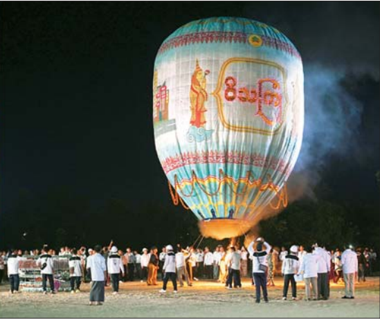
နိုင်ငံတော်စီမံအုပ်ချုပ်ရေးကောင်စီဥက္ကဋ္ဌ နိုင်ငံတော်ဝန်ကြီးချုပ် ဗိုလ်ချုပ်မှူးကြီး မင်းအောင်လှိုင်၊ ဇနီး ဒေါ်ကြူကြူလှနှင့် အခမ်းအနားတက်ရောက်လာကြသူများ မီးပုံးပျံများ လွှတ်တင်ပူဇော်ယှဉ်ပြိုင်နေမှုများကို ကြည့်ရှုအားပေးကြစဉ်။