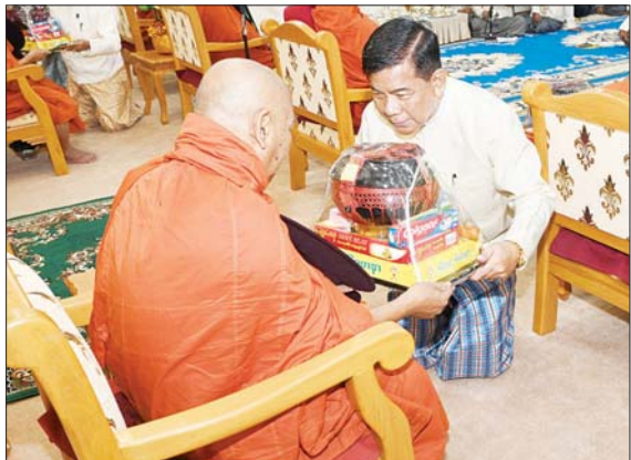
နိုင်ငံတော် စီမံအုပ်ချုပ်ရေးကောင်စီအဖွဲ့ဝင် ဗိုလ်ချုပ်ကြီး မောင်မောင်အေး ဆရာတော်ထံ ကထိန်သင်္ကန်းနှင့် လှူဖွယ်ပစ္စည်းများကို ဆက်ကပ်လှူဒါန်းစဉ်။