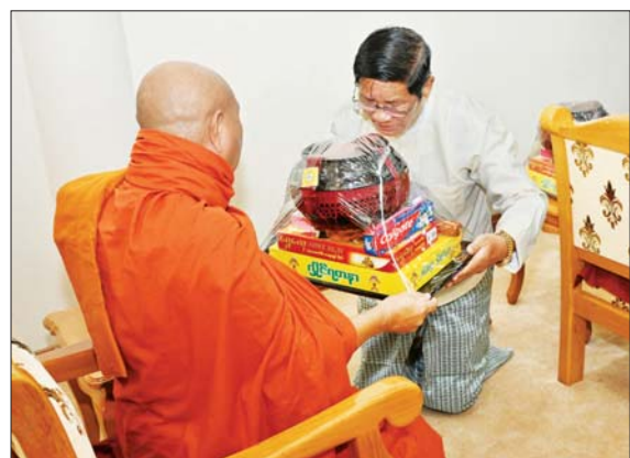
ပြည်ထောင်စု ဝန်ကြီး ဦးညွှန်ထွန်း ဆရာတော်ထံ ကထိန်သင်္ကန်းနှင့် လှူဖွယ် ပစ္စည်းများကို ဆက်ကပ် လှူဒါန်းစဉ်။