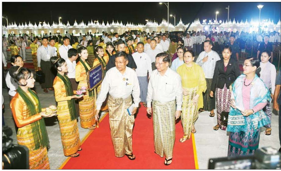
နိုင်ငံတော်စီမံအုပ်ချုပ်ရေးကောင်စီဥက္ကဋ္ဌ နိုင်ငံတော်ဝန်ကြီးချုပ် ဗိုလ်ချုပ်မှူးကြီး မင်းအောင်လှိုင်နှင့်ဇနီး ဒေါ်ကြူကြူလှတို့ အခမ်းအနား ကျင်းပမည့်နေရာသို့ရောက်ရှိရာ တိုင်းရင်းသား၊ တိုင်းရင်းသူများက မီးကြာခွက်များ ကိုင်ဆောင်၍ ကြိုဆိုကြစဉ်။

က မာရဝိဇယဗုဒ္ဓရုပ်ပွားတော် မြတ်ကြီး တန်ဆောင်တိုင်မီးထွန်း ပွဲတော် မီးပုံးပျံလွှတ်တင်ပူဇော် ခြင်းဖွင့်ပွဲအခမ်းအနားအား ဖဲကြိုး ဖြတ် ဖွင့်လှစ်ပေးကြသည်။ ကြည့်ရှုအားပေး ထိုသို့ ဖဲကြိုးဖြတ် ဖွင့်လှစ် သည်နှင့်တစ်ပြိုင်နက် မီးပုံးပျံငယ် အလုံး ၅၀၀ ကို လွှတ်တင်ခြင်း၊ မီးရှူးမီးပန်းများ ပစ်ဖောက်ခြင်း နှင့် မြိုင်မြိုင်ဆိုင်ဆိုင် လတန်ဆောင် တိုင် တေးသီချင်းဖြင့် ကပြ ဖျော်ဖြေခြင်းများကို ဆောင်ရွက် ကြရာ နိုင်ငံတော်စီမံအုပ်ချုပ်ရေး ကောင်စီဥက္ကဋ္ဌ နိုင်ငံတော်ဝန်ကြီး ချုပ်နှင့်ဇနီး၊ အခမ်းအနား တက်ရောက် လာကြသူများက ကြည့်ရှုအားပေးကြသည်။ ယင်းနောက် နိုင်ငံတော်စီမံ အုပ်ချုပ်ရေး ကောင်စီဥက္ကဋ္ဌ နိုင်ငံတော်ဝန်ကြီးချုပ်နှင့် ဇနီး၊ အခမ်းအနား တက်ရောက်လာကြ သူများသည် စာမျက်နှာ ၇ သို့