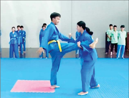
ရန်ကုန်တိုင်းဒေသကြီးမှ ဗိုလ်ချုပ်အားကစားနည်း ဝင်ရောက်ယှဉ်ပြိုင်မည်။

ရန်ကုန် နိုဝင်ဘာ ၁၃ နေပြည်တော်တွင် နိုဝင်ဘာ ၉ ရက်မှ ၂၀ ရက်အထိ ကျင်းပမည့် ပဉ္စမအကြိမ် အမျိုးသားအားကစားပြိုင်ပွဲတွင် ရန်ကုန်တိုင်းဒေသကြီး ကိုယ်စားပြု ဗိုလ်ချုပ်အားကစားနည်း ဝင်ရောက်ယှဉ်ပြိုင်သွားမည်ဖြစ်ကြောင်း သိရသည်။ “ဗိုလ်ချုပ်အားကစားနည်းကို ပြိုင်ပွဲမလုပ်လိုက်ရဘူး။ လူရွေးပွဲတွေပဲ လုပ်လိုက်ပြီး အောက်တိုဘာ ၁ ရက်က စပြီး တစ်နေ့သုံးကြိမ် စခန်းသွင်းလေ့ကျင့်နေတာဖြစ်ပါတယ်။ ကစားသမားတွေ အကုန်လုံးက ပြည့်စုံနေပြီး သားဖြစ်ပါတယ်။ မှားတာလောက်ပဲ ပြင်ရတာပဲရှိပါတယ်။ ပြိုင်ပွဲဝင်ဖို့ အဆင်မပြေနေပါပြီ။ စာမျက်နှာ ၁၂ ကော်လံ ၁