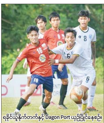
ရခိုင်ယူနိုက်တက်နှင့် Dagon Port ယှဉ်ပြိုင်နေစဉ်။