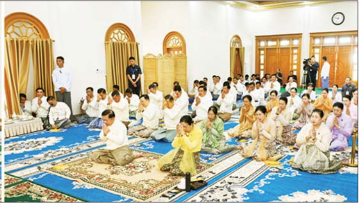
နိုင်ငံတော်စီမံအုပ်ချုပ်ရေးကောင်စီဥက္ကဋ္ဌ နိုင်ငံတော်ဝန်ကြီးချုပ် ဗိုလ်ချုပ်မှူးကြီး မင်းအောင်လှိုင်၊ ဇနီး ဒေါ်ကြူကြူလှနှင့် အခမ်းအနား တက်ရောက်လာကြသည့် ဧည့်ပရိသတ်များ မာရဝိဇယကျောင်းတော် ပဓာနနာယက အဂ္ဂမဟာပဏ္ဍိတ ဘဒ္ဒန္တ နေမိန္ဒ ထံမှ ငါးပါးသီလခံယူဆောက်တည်ကြပြီး သံဃာတော်အရှင်သူမြတ်များ ရွတ်ပွားသရဏ္ဍယ်တော်မူသော မေတ္တာသုတ်ပရိတ်တရားတော်များ နာယူကြစဉ်။