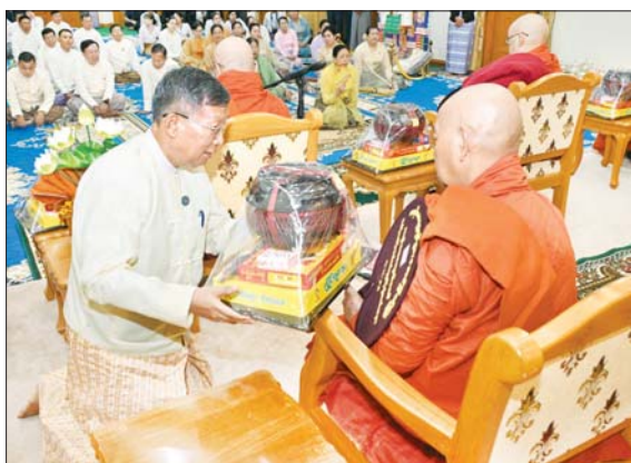
ပြည်ထောင်စု ဝန်ကြီး ဦးတင်ဦးလွင် ဆရာတော်ထံ ကထိန်သင်္ကန်းနှင့် လှူဖွယ် ပစ္စည်းများကို ဆက်ကပ် လှူဒါန်းစဉ်။