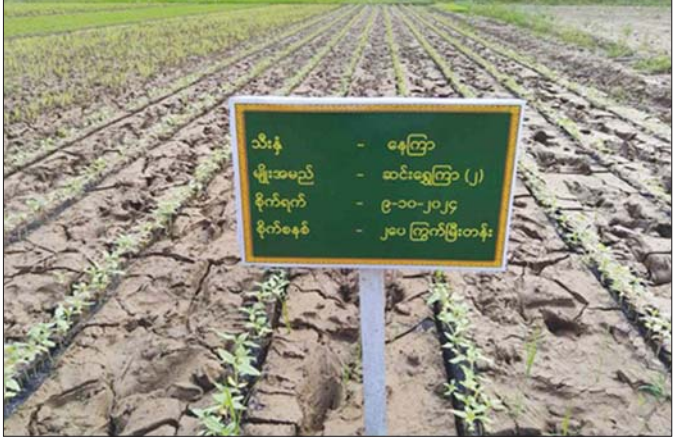
ပဗ္ဗသီရိမြို့နယ် ပင်လောင်းလမ်းဘေးရှိ နေကြာစိုက်ခင်း။

“သူတို့ကတော့ ‘ရာဂီကို အဲဒီကဲပြုထိုက်သည့် ဒို့ပြည်သူ’ လို့ တင်စားရမယ့် လယ်သမားတွေပါ။” ကျွန်တော်က ကျွန်တော်စကားကို အဆုံးသတ် ၍ အစ်ကိုကြီးအား ပြုံး၍ ကြည့်လိုက်မိပါသည်။ အစ်ကိုကြီးမျက်နှာတွင်လည်း အပြုံးပန်းများ ဝေဆာလျက်ဖြင့် ...။