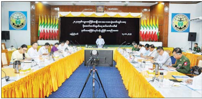
ရွက်မှု အခြေအနေများကို အသေးစိတ်ရှင်းလင်း ဒုတိယဝန်ကြီးက လိုအပ်သည်များကို ပေါင်းစပ် တင်ပြရာ အစည်းအဝေးတက်ရောက်ကြသူများက ညှိနှိုင်းပေးခဲ့ကြောင်း သိရသည်။