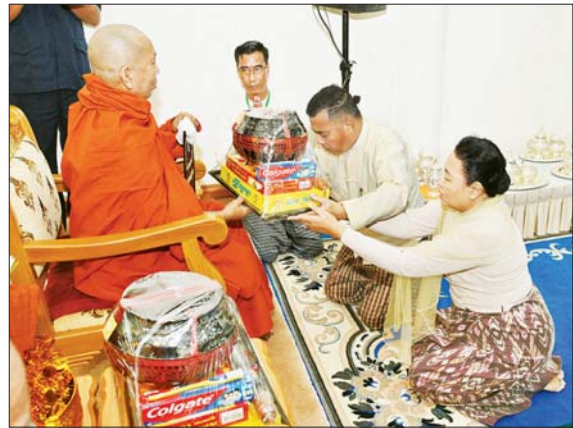
နိုင်ငံတော် စီမံအုပ်ချုပ်ရေး ကောင်စီတွဲဖက်အတွင်းရေးမှူး ဗိုလ်ချုပ်ကြီး ရဲဝင်းဦးနှင့် ဇနီး ဆရာတော်ထံ ကထိန်သင်္ကန်း နှင့် လှူဖွယ်ပစ္စည်းများကို ဆက်ကပ်လှူဒါန်းစဉ်။