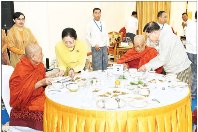
နိုင်ငံတော်စီမံအုပ်ချုပ်ရေးကောင်စီဥက္ကဋ္ဌ နိုင်ငံတော်ဝန်ကြီးချုပ် ဗိုလ်ချုပ်မှူးကြီး မင်းအောင်လှိုင်နှင့် ဇနီး ဒေါ်ကြူကြူလှ ပေါက်မြိုင်ဆရာတော်ကြီး အမျိုးပြုသည့် ဆရာတော်၊ သံဃာတော်များအား နေ့ဆွမ်းဆက်ကပ်လှူဒါန်းစဉ်။

( ၃-၉-၂၀၂၄ ရက်နေ့တွင် နိုင်ငံတော်စီမံအုပ်ချုပ်ရေးကောင်စီဥက္ကဋ္ဌ နိုင်ငံတော်ဝန်ကြီးချုပ် ဗိုလ်ချုပ်မှူးကြီး မင်းအောင်လှိုင် ရှမ်းပြည်နယ်အစိုးရအဖွဲ့ဝင်များ၊ ပြည်နယ်နှင့် ခရိုင်အဆင့်ဌာနဆိုင်ရာတာဝန်ရှိသူများအား ပြောကြားသည့် အမှာစကားမှ ကောက်နုတ်ချက် )