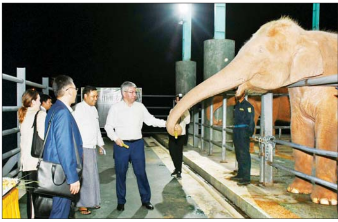
ရုရှားဖက်ဒရေးရှင်းနိုင်ငံ ဘူရားတီးရားပြည်နယ်အကြီးအကဲ H.E.Mr. Alexey Sambuevich Tsydenov ရတနာဆင်ဖြူတော်အဆောင်ရှိ ဆင်ဖြူတော်များကို အာဟာရဖြည့်စွက်စာများ ကျွေးမွေးစဉ်။