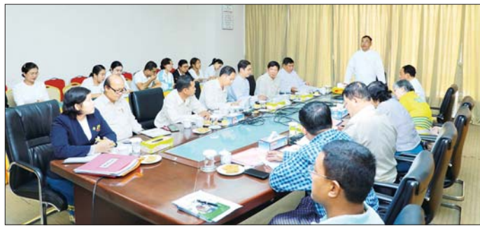
မျိုးဆက်သစ် အားကစားသမားများ ရွေးချယ်ရေးဆိုင်ရာပညာ သင်တန်းများ ဆက်လက်ပေးပို့ရန် ဦးထိန်းလင်းက အားကစားပြိုင်ပွဲများကို အဆင့်မီမီဖြင့် စနစ်တကျ ကျင်းပနိုင်ရေးနှင့် မျိုးဆက်သစ်အားကစားသမားများကို စနစ်တကျ စိစစ်ကြပ်မတ်ရွေးချယ်နိုင်ရေးအတွက် ကြိုတင်ပြင်ဆင်ဆောင်ရွက်ထားနိုင်ရန် လိုအပ်ချက်များကို ဆွေးနွေးတင်ပြကြရာ ခုတ်ယူဝန်ကြီးက လိုအပ်သည်များကို ပေါင်းစပ်ညှိနှိုင်း ဆောင်ရွက်ပေးသည်။ သတင်းစဉ်

အစည်းအဝေးတွင် ပဉ္စမအကြိမ် အမျိုးသားအားကစားပွဲတော် ပြိုင်ပွဲကျွမ်းပေးရေးနှင့် နည်းစနစ်ဆိုင်ရာပညာ သင်တန်းများ ဆက်လက်ပေးပို့ရန် ဦးထိန်းလင်းက အားကစားပြိုင်ပွဲများကို အဆင့်မီမီဖြင့် စနစ်တကျ ကျင်းပနိုင်ရေးနှင့် မျိုးဆက်သစ်အားကစားသမားများကို စနစ်တကျ စိစစ်ကြပ်မတ်ရွေးချယ်နိုင်ရေးအတွက် ကြိုတင်ပြင်ဆင်ဆောင်ရွက်ထားနိုင်ရန် ယခု