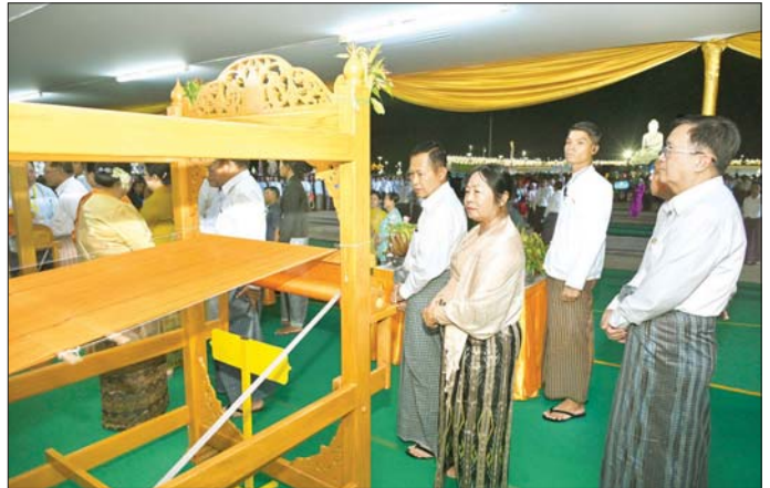
နိုင်ငံတော်စီမံအုပ်ချုပ်ရေးကောင်စီ ဒုတိယဥက္ကဋ္ဌ ဒုတိယဝန်ကြီးချုပ် ဒုတိယဗိုလ်ချုပ်မှူးကြီး စိုးဝင်းနှင့်ဇနီး ဒေါ်သန်းသန်းနွယ် ရက်ကန်းအဖွဲ့များ၏ မသိုးရွှေကြာသင်္ကန်းရက်လုပ်နေမှုကို စိတ်ဝင်တစားလှည့်လည်ကြည့်ရှုအားပေးကြစဉ်။