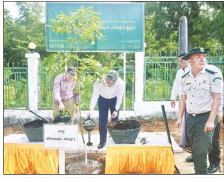
ရုရှားဖက်ဒရေးရှင်းနိုင်ငံ ဘူရားတီးရားပြည်နယ်အကြီးအကဲ H.E.Mr. Alexey Sambuevich Tsydenov ချောင်းသာမြို့အဝင်၌ ရုရှား - မြန်မာ ချစ်ကြည်ရေးအထိမ်းအမှတ်အဖြစ် ခရေပင်ကို စိုက်ပျိုးပေးစဉ်။