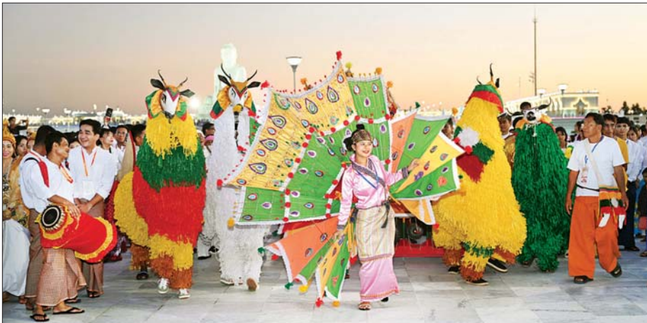
တိုင်းရင်းသားရိုးရာအကအဖွဲ့များက ပွဲတော်သို့လာရောက်သည့်စဉ်ပရိသတ်များအား ကပြဖျော်ဖြေမှုကို တွေ့ရစဉ်။

နေပြည်တော် ကောင်စီနယ်မြေ အပါအဝင် တိုင်းဒေသကြီးနှင့် ပြည်နယ်အသီးသီးက ရက်ကန်း စင်တော် ၁၅ ခုမှ ရက်ကန်းအဖွဲ့ များ၏ မသုံးရွှေကြာသက်နိုး ရက်လုပ်နေမှုများကို ရက်ကန်း စင်တော် တစ်ခုချင်းစီအလိုက် စိတ်ဝင်တစားလှည့်လည် ကြည့်ရှု အားပေးကြသည်။ နိုင်ငံတော် စီမံအုပ်ချုပ်ရေး ကောင်စီဥက္ကဋ္ဌ နိုင်ငံတော်ဝန်ကြီး ချုပ်နှင့် ဇနီး၊ အခမ်းအနား တက်ရောက်လာကြသူများသည် စိန်နားပန်းမီးပျံများနှင့် ည မီးကျည် (ညမီးကြီး) မီးပုံးပျံများ လွှတ်တင်မှုများကို မာရဝိဇယပုဒ် ရုပ်ပွားတော်မြတ်ကြီး တန်ဆောင် တိုင်မီးထွန်းပွဲတော်သို့ လာရောက် ကြည့်ရှု ဘုရားဖူးလာရဟန်းရှင် လှပြည်သူများနှင့်အတူ ကြည့်ရှု အားပေးကြသည်။ ပြည်ထောင်စုနယ်မြေ နေပြည်