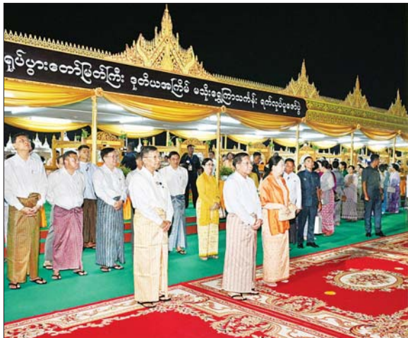
နိုင်ငံတော်စီမံအုပ်ချုပ်ရေးကောင်စီဥက္ကဋ္ဌ နိုင်ငံတော်ဝန်ကြီးချုပ် ဗိုလ်ချုပ်မှူးကြီး မင်းအောင်လှိုင်၊ ဇနီး ဒေါ်ကြူကြူလှနှင့်ဧည့်ပရိသတ်များ အနုပညာရှင်များ၏ ယိမ်းအကအလှများ၊ တေးသီချင်းများဖြင့် ကပြဖျော်ဖြေတင်ဆက်မှုကို ကြည့်ရှုအားပေးကြစဉ်။