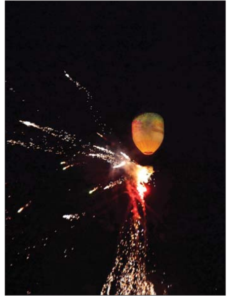
မြတ်စွာဘုရားရှင်အား ရည်မှန်း၍ မီးပုံးပျံလွှတ်တင်ပူဇော်မှုနှင့် ကြည့်ရှုအားပေးသည့် ဘုရားဖူးလာပရိသတ်များကို စည်စည်ကားကားတွေ့ရစဉ်။