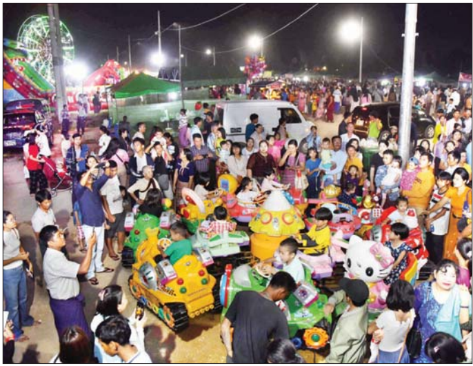
ကလေးကစားကွင်း၌ ကလေးငယ်များ ပျော်ရွှင်စွာကစားနေကြသည်ကို တွေ့ရစဉ်။