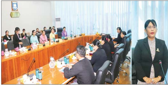
ထောင်စု တရားလွှတ်တော်ချုပ်ရုံး၊ နိုင်ငံတော်ဖွဲ့စည်းပုံအခြေခံဥပဒေဆိုင်ရာခုံရုံး၊ ခရိုင်နှင့် မြို့နယ် တရားရုံးများ၊ အမျိုးသားစာကြည့်တိုက်၊ ဥပဒေရေးရာဝန်ကြီးဌာန စာကြည့်တိုက်၊ နေပြည်တော် ဥပဒေအသိပညာ ပြန့်ပွားရေး သင်တန်းကျောင်း တို့ကိုလည်း လေ့လာရေးခရီးစဉ်များ စီစဉ်

သင်ကြားပို့ချ သင်တန်းဆင်းပွဲတွင် ဥပဒေရေးရာဝန်ကြီးဌာန ပြည်ထောင်စုဝန်ကြီးနှင့် ပြည်ထောင်စုရှေ့နေချုပ် ဒေါက်တာ သီတာဦးက သင်တန်းတွင် Naypyitaw State Academy မှ ဥပဒေအထူးပြုကျောင်းသားများကို ဥပဒေရေးရာဝန်ကြီးဌာန ဝန်ကြီးရုံးနှင့်ဦးစီးဌာနလေးခုတို့၏ လက်တွေ့