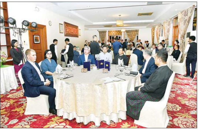
နေပြည်တော်ကောင်စီဥက္ကဋ္ဌ ဦးသန်းထွန်းဦး၊ ရုရှားဖက်ဒရေးရှင်းနိုင်ငံ ဘူရားတီးရားပြည်နယ်အကြီးအကဲ H.E.Mr. Alexey Sambuevich Tsydenov နှင့်အဖွဲ့အား ညစာဖြင့် တည်ခင်းစဉ်ခံစဉ်။