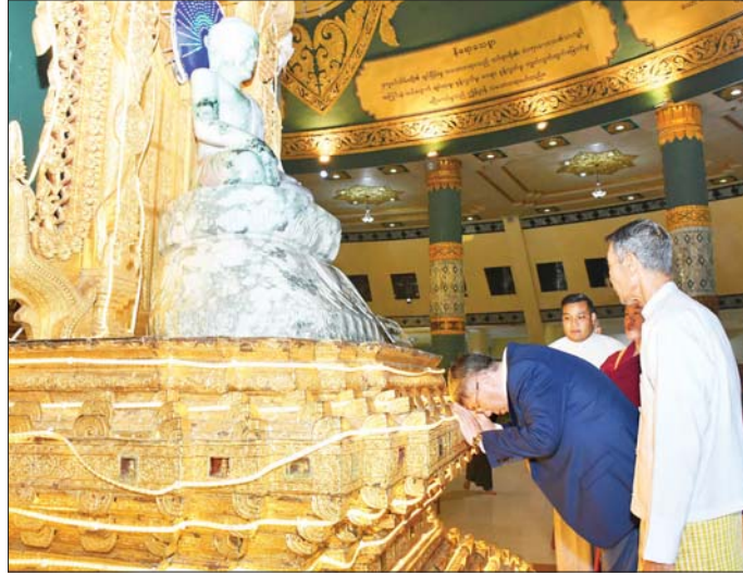
ရုရှားဖက်ဒရေးရှင်းနိုင်ငံ ဘူရားတီးရားပြည်နယ်အကြီးအကဲ H.E.Mr. Alexey Sambuevich Tsydenov နေပြည်တော်ရှိ ဥပျာတက္ကသိုလ်တော်မြတ်ကြီး လိုဏ်အတွင်းရှိ ဗုဒ္ဓရုပ်ပွားတော်မြတ်အား ဖူးမြော်ကြည့်ညို့ စဉ်။