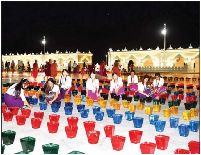
ဘုရားဖူးလာပြည်သူများ ဆီမီးထွန်းညှိပူဇော်မှုကို တွေ့ရစဉ်။

ဝတ္ထုကတော်အတွင်းရှိ ရေပန်း ရင်ပြင်တော်၌ တိုင်းဒေသကြီးနှင့် ပြည်နယ်ကိုယ်စားပြု ရက်ကန်း အဖွဲ့ ၁၅ ဖွဲ့တို့က မသိုးရွှေကြာ သင်္ကန်းကို အားကြီးမာန်တက် စတင်ရက်လုပ်ယှဉ်ပြိုင်နေကြရာ အဆိုပါ ရက်ကန်းရက်လုပ်နေမှု ကို အားပေးလေ့လာကြည့်ရှုကြ သည့် ဘုရားဖူးလာပြည်သူများ ဖြင့်လည်း စည်ကားလျက်ရှိသည်။ မီးပုံးပျံလွှတ်တင်ပူဇော် ထိုပြင် မြတ်စွာဘုရားရှင်အား မီးပုံးပျံလွှတ်တင်၍ ပူဇော်ခြင်း ကုသိုလ်ထူးကို ခံစားနိုင်စေရန် အတွက် ဝန်ကြီးဌာနအလိုက် မီးပုံးပျံလွှတ်တင် ပူဇော်ခြင်းပြိုင်ပွဲ များကို စီစဉ်ဆောင်ရွက်ထား ရှိသည့် အတွက်ကြောင့်လည်း ပြိုင်ပွဲမစတင်မီ အစောပိုင်းကပင် စာမျက်နှာ ၇ သို့