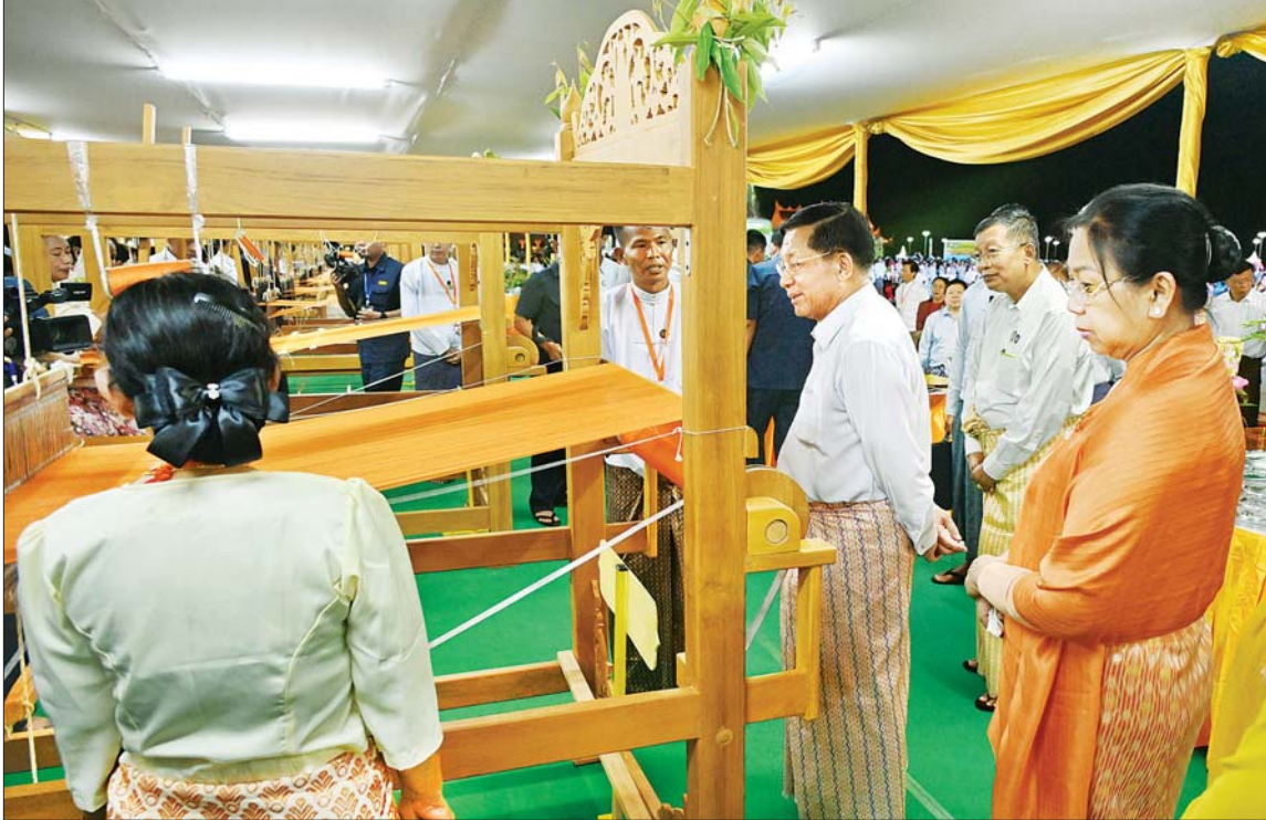
နိုင်ငံတော်စီမံအုပ်ချုပ်ရေးကောင်စီဥက္ကဋ္ဌ နိုင်ငံတော်ဝန်ကြီးချုပ် ဗိုလ်ချုပ်မှူးကြီး မင်းအောင်လှိုင်နှင့် ဇနီး ဒေါ်ကြူကြူလှ မာရဝိဇယဗုဒ္ဓရုပ်ပွားတော်မြတ်ကြီးအား ဒုတိယအကြိမ် မသိုးရွှေကြာသင်္ကန်းတော် ရက်လုပ်ပူဇော်ပွဲတွင် ရက်ကန်းအဖွဲ့များ၏ မသိုးရွှေကြာသင်္ကန်းရက်လုပ်နေမှုကို စိတ်ဝင်တစားလှည့်ကြည့်ရှုအားပေးကြစဉ်။

နေပြည်တော် နိုဝင်ဘာ ၁၄ ပြည်ထောင်စုနယ်မြေ နေပြည်တော် ဒက္ခိဏသီရိမြို့နယ် ဗုဒ္ဓဥယျာဉ်တော် ဝတ္ထုကံတော် အတွင်းရှိ မာရဝိဇယဗုဒ္ဓရုပ်ပွားတော်မြတ်ကြီးအား ဒုတိယအကြိမ်မသိုးရွှေကြာသင်္ကန်းတော် ရက်လုပ်ပူဇော်ပွဲ ဖွင့်ပွဲအခမ်းအနားကို ယနေ့ညနေပိုင်းတွင် ဗုဒ္ဓဥယျာဉ်တော် ဝတ္ထုကံတော် အတွင်းရှိ ရေပန်းရင်ပြင်တော်၌ ကျင်းပရာ နိုင်ငံတော်စီမံအုပ်ချုပ်ရေးကောင်စီဥက္ကဋ္ဌ နိုင်ငံတော်ဝန်ကြီးချုပ် ဗိုလ်ချုပ်မှူးကြီး မင်းအောင်လှိုင်နှင့် ဇနီး ဒေါ်ကြူကြူလှတို့ တက်ရောက်ပူဇော်ဖွင့်လှစ်ပေးသည်။ အခမ်းအနားသို့ နိုင်ငံတော်စီမံအုပ်ချုပ်ရေး ကောင်စီဥက္ကဋ္ဌ နိုင်ငံတော်ဝန်ကြီးချုပ်နှင့် ဇနီးတို့နှင့်အတူ နိုင်ငံတော်စီမံအုပ်ချုပ်ရေးကောင်စီဒုတိယဥက္ကဋ္ဌ ဒုတိယဝန်ကြီးချုပ်နှင့် ဇနီး၊ ကောင်စီအတွင်းရေးမှူးနှင့် ဇနီး၊ တွဲဖက်အတွင်းရေးမှူးနှင့် ဇနီး၊ ကောင်စီဝင်များနှင့် ဇနီးများ၊ ပြည်ထောင်စုအဆင့်ပုဂ္ဂိုလ်များ၊ ပြည်ထောင်စုဝန်ကြီးများနှင့် ဇနီးများ၊ နေပြည်တော် ကောင်စီဥက္ကဋ္ဌ စာမက်နှာ ၃ ကော်လံ ၁ ဇ