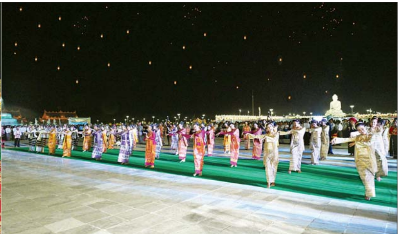
နိုင်ငံတော်စီမံအုပ်ချုပ်ရေးကောင်စီဥက္ကဋ္ဌ နိုင်ငံတော်ဝန်ကြီးချုပ် ဗိုလ်ချုပ်မှူးကြီး မင်းအောင်လှိုင်၊ ဇနီး ဒေါ်ကြူကြူလှနှင့်ဧည့်ပရိသတ်များ အနုပညာရှင်များ၏ ယိမ်းအကအလှများ၊ တေးသီချင်းများဖြင့် ကပြဖျော်ဖြေတင်ဆက်မှုကို ကြည့်ရှုအားပေးကြစဉ်။