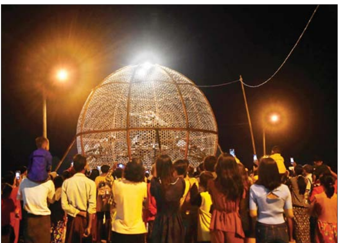
ဘုရားဖူးလာပြည်သူများအတွက် စိတ်အပန်းဖြေစေရန် ဆပ်ကပ်ဖျော်ဖြေမှုကို ကြည့်ရှုအားပေးသူများအား တွေ့ရစဉ်။

ထို့ပြင် ဘုရားဖူးလာကလေး ငယ်များအတွက်လည်း ကလေး ကစားကွင်း ထားရှိပေးထား ရာ ကစားနည်းများအလိုက် စိတ်ပျော်ရွှင်ချမ်းမြေ့စွာဖြင့် ကစား နေကြသည့် ကလေးငယ်များ ဖြင့်လည်း အထူးစည်ကားလျက် ရှိသည်။