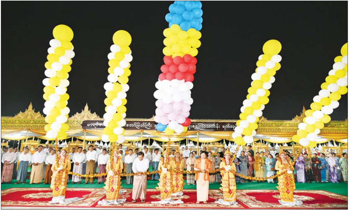
နိုင်ငံတော်စီမံအုပ်ချုပ်ရေးကောင်စီဥက္ကဋ္ဌ နိုင်ငံတော်ဝန်ကြီးချုပ် ဗိုလ်ချုပ်မှူးကြီး မင်းအောင်လှိုင်နှင့်ဇနီး ဒေါ်ကြူကြူလှ မာရဝိဇယဗုဒ္ဓရုပ်ပွားတော်မြတ်ကြီးအား ဒုတိယအကြိမ် မသိုးရွှေကြာသင်္ကန်းတော်ရက်လုပ်ပူဇော်ပွဲ ဖွင့်ပွဲအခမ်းအနားကို ဖဲကြီးဖြတ်၍ ဖွင့်လှစ်ပေးကြစဉ်။