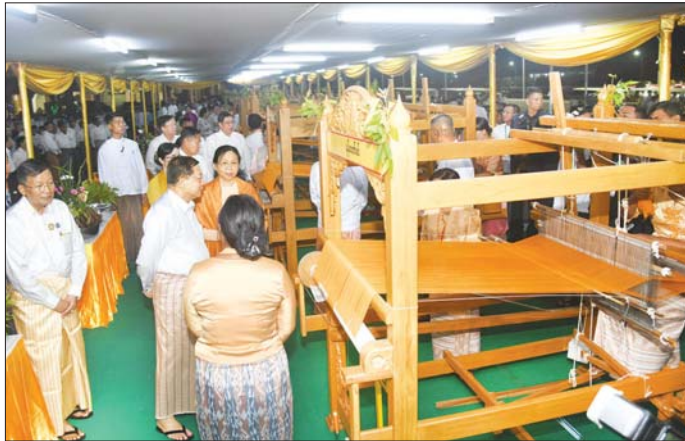
နိုင်ငံတော်စီမံအုပ်ချုပ်ရေးကောင်စီဥက္ကဋ္ဌ နိုင်ငံတော်ဝန်ကြီးချုပ် ဗိုလ်ချုပ်မှူးကြီး မင်းအောင်လှိုင်နှင့်ဇနီး ဒေါ်ကြူကြူလှ ရက်ကန်းအဖွဲ့များ၏ မသိုးရွှေကြာသင်္ကန်းရက်လုပ်နေမှုကို စိတ်ဝင်တစားလှည့်လည်ကြည့်ရှုအားပေးကြစဉ်။