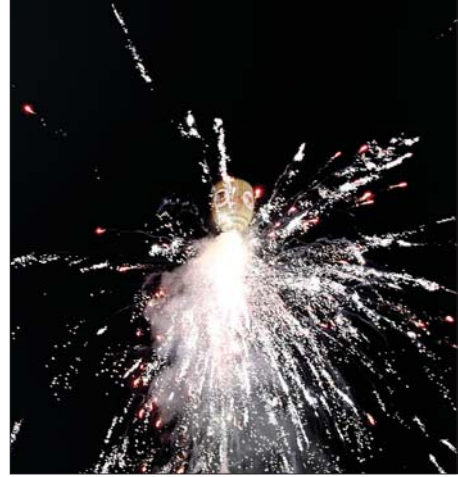
စိန်နားပန်မီးပုံးပျံများနှင့် ညမီးကျည် (ညမီးကြီး) မီးပုံးပျံများ လွှတ်တင်မှုကို တွေ့ရစဉ်။