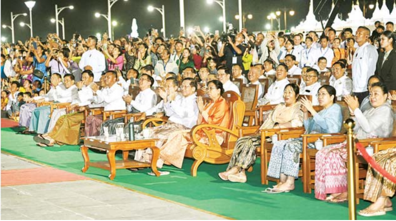
နိုင်ငံတော်စီမံအုပ်ချုပ်ရေးကောင်စီဥက္ကဋ္ဌ နိုင်ငံတော်ဝန်ကြီးချုပ် ဗိုလ်ချုပ်မှူးကြီး မင်းအောင်လှိုင်၊ ဇနီး ဒေါ်ကြူကြူလှနှင့် အခမ်းအနားတက်ရောက်လာကြသူများ တန်ဆောင်တိုင်မီးထွန်းပွဲတော်သို့ လာရောက်ကြသည့် ဘုရားဖူးလာရဟန်းရှင်လူပြည်သူများနှင့်အတူ စိန်နားပန်မီးပုံးပျံများ လွှတ်တင်မှုများ ကြည့်ရှုအားပေးကြစဉ်။