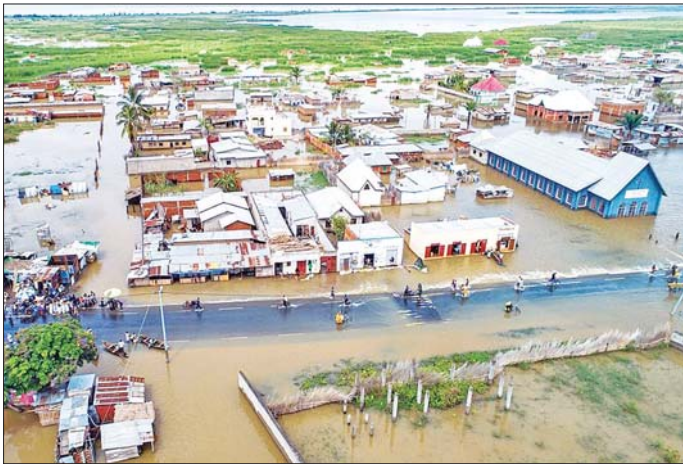
ဘုရုန်ဒီနိုင်ငံ၌ ရေကြီးရေလျှံဖြစ်ပွားမှုကို ဖြေ ၁၉ ရက်က တွေ့ရစဉ်။

ကင်ညာ၊ တန်ဇနီးနီးယား၊ ရဝမ်ဒါနှင့် ဘုရုန်ဒီနိုင်ငံတို့တွင်