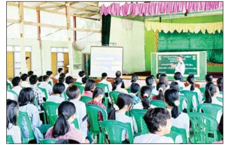
ပန်းတောင်း

ပဲခူးတိုင်းဒေသကြီး ပန်းတောင်းမြို့နယ် ဥသျှစ်ပင်မြို့ အ.ထ.က ကျောင်း၌ ရာသီဥတုပြောင်းလဲမှု သဘာဝဘေးအန္တရာယ်နှင့် မီးခိုးမြူငွေ့လျော့ချရေးဆိုင်ရာ အသိပညာပေးဟောပြောပွဲကို ယနေ့နံနက် ၉ နာရီက ကျင်းပသည်။