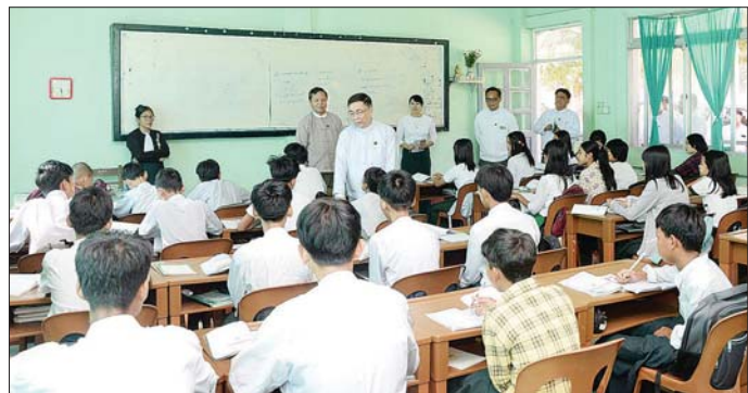
မှာကြားသည်။ ထိုမှတစ်ဆင့် ပြည်ထောင်စု ဝန်ကြီးသည် နေပြည်တော် မွေးဇီဝိမြို့နယ် အမှတ်(၁၁) အခြေခံပညာ အထက်တန်း ကျောင်းသို့ သွားရောက်ကြည့်ရှု စစ်ဆေး၍ စာသင်ခန်းအတွင်း အားပေးခဲ့ကြောင်း သိရသည်။ သတင်းစဉ်

ကြောင်း၊ ဆရာဆရာမများအနေ ဖြင့် ကျောင်းသား ကျောင်းသူများ အေးချမ်းပျော်ရွှင်စွာ ပညာ သင်ကြားနိုင်ရေးအတွက် လိုအပ် သည့်များကို ဝိုင်းဝန်းလက်တွဲ၍ ပံ့ပိုးဖြည့်ဆည်း ဆောင်ရွက်ပေး ကြ ရမည်ဖြစ်ပါကြောင်း၊ ဘာသာ ရပ်ဆိုင်းရာ သင်ကြားသင်ယူမှု လုပ်ငန်းများတိုးတက်ကောင်းမွန် ရေးအတွက် စဉ်ဆက်မပြတ် လေ့လာကြိုးပမ်းကြရမည် ဖြစ်ပါ ကြောင်း၊ မိမိတို့ တက္ကသိုလ်များ ၏ ဥပဓိရပ်ကောင်းမွန်ရေးနှင့် တက္ကသိုလ် ပတ်ဝန်းကျင်တွင် သန့်ရှင်းသာယာ လှပရေးကို လည်း အမြဲမပြတ် အလေးထား ဆောင်ရွက်ရန် လိုအပ်ကြောင်း