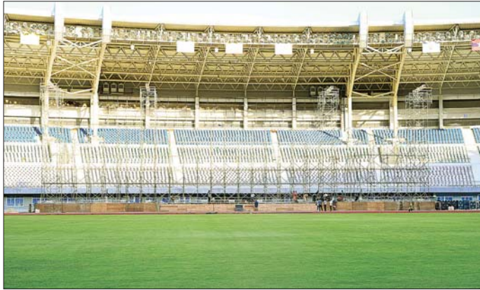
အမျိုးသားအားကစားပွဲတော် ကျင်းပရန် ပြင်ဆင်ဆောင်ရွက်နေမှုကို တွေ့ရစဉ်။

(အမျိုးသား) နှင့် ဘော်လီဘော (အမျိုးသား) စသည့်အားကစား နည်း ခြောက်ခုနည်းကို ပါဝင် ယှဉ်ပြိုင်ကြမည်ဖြစ်သည်။ အမျိုးသားအားကစားပွဲတော် ကို နိုင်ငံတော်၏ အားကစား အဆင့်အတန်း ပိုမိုတိုးတက် မြင့်မားလာစေရန်၊ (၃၃) ကြိမ် မြောက် အရှေ့တောင်အာရှ အားကစားပြိုင်ပွဲနှင့် အခြားနိုင်ငံ တကာပြိုင်ပွဲများတွင် ပါဝင် ယှဉ်ပြိုင် အောင်မြင်မှုရရှိစေရန်၊ နိုင်ငံ့ ဂုဏ်ဆောင်နိုင်မည့် အဆင့်မီ အားကစားသမားများနှင့် အလား အလာရှိသော လူငယ်မျိုးဆက် သစ် အားကစားသမားများ ပေါ်ထွက်လာစေရန်၊ တိုင်းဒေသ ကြီးနှင့် ပြည်နယ်များ၊ ဝန်ကြီးဌာန များအကြား အချင်းချင်းချစ်ကြည် ရင်းနှီးမှုရရှိပြီး အားကစားလုပ်ရှား မှုများ ပိုမိုတိုးမြှင့်ဆောင်ရွက်လာ နိုင်စေရန်၊ ပြည်သူတစ်ရပ်လုံး အားကစားကို ပိုမိုစိတ်ပါဝင်စား လာပြီး အားကစားလှုပ်ရှားမှုများ တွင် ပါဝင်လာစေရန် ရည်ရွယ် ကျင်းပခြင်းဖြစ်သည်။ သတင်းစဉ်