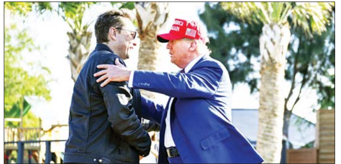
နှင့်အတူ တွေ့ရသည့် ထရပ်၏အသွင်အပြင်မှာ မက်စ်၏ လွှမ်းမိုးနိုင်မှုမြင့်မားလာကြောင်း အမေရိကန် ၎င်းတို့နှစ်ဦးကြားရင်းနှီးမှုပမာဏ တိုးလာသည်ကို အဓိကမီဒီယာကြီးများက ဖော်ပြကြသည်။ အင်န်အိတ်ချ်က ဖော်ပြနေပြီး ထရပ်၏ဆုံးဖြတ်ချက်များတွင် အီလွန်

နိုဝင်ဘာ ၁၉ ရက်အခမ်းအနားတွင် အီလွန်မက်စ်