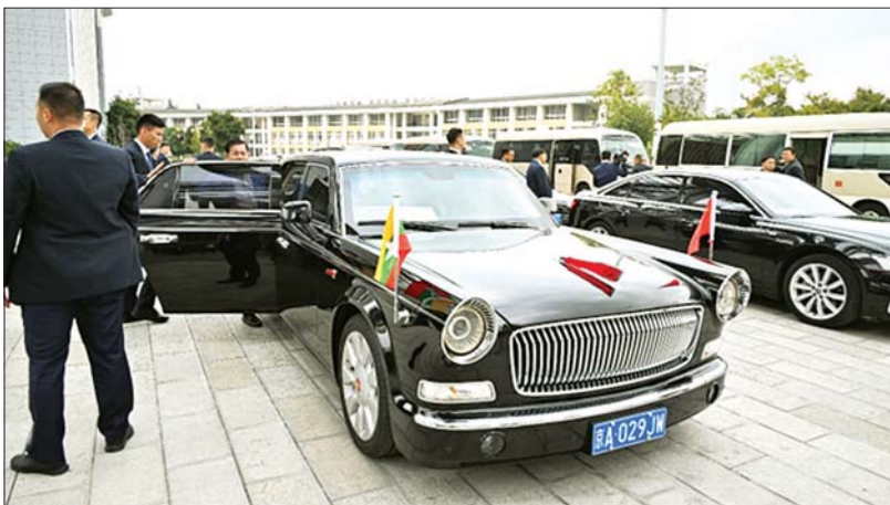
နိုင်ငံတော်စီမံအုပ်ချုပ်ရေးကောင်စီဥက္ကဋ္ဌ နိုင်ငံတော်ဝန်ကြီးချုပ် ဗိုလ်ချုပ်မှူးကြီး မင်းအောင်လှိုင်၏ ခရီးစဉ်တစ်လျှောက် အသုံးပြုခဲ့သည့် Hongqi L5 ကျည်ကာမော်တော်ယာဉ်။

ဝန်ကြီးချုပ်ကို တစ်ဦးပြီး တစ်ဦး လာမိတ်ဆက် မေးမြန်းနေကြပြန်ပါတယ်။ အားလုံးကို စိတ်ရှည်လက်ရှည် ပြန်ရှင်းပြနေတဲ့ ဝန်ကြီးချုပ်ရဲ့ နိုင်ငံအပေါ်ထားတဲ့တောနာဟာ လေးစားစရာပါ။ နေ့လယ်စာစားပြီးတာနဲ့ အနားမရဘဲ မွန်းလွဲပိုင်းမှာ ယူနန်အသက်မွေးဝမ်းကျောင်းနှင့် စက်မှုလက်မှုနည်းပညာကော်လီပ်စ် ကုမ္ပဏီသိပ္ပံနှင့် နည်းပညာတက္ကသိုလ်တို့ကို သွားရောက်လေ့လာကြည့်ရှုပါတယ်။ ဒီလိုမျိုး သွားရောက်လေ့လာကြည့်ရှုမှုက နိုင်ငံအနာဂတ်လူငယ်များရဲ့ စွမ်းရည်ဖွံ့ဖြိုး