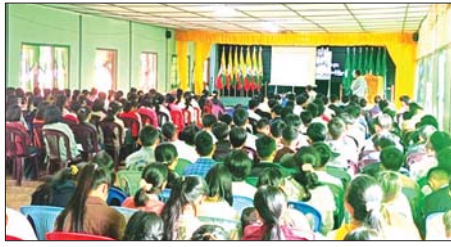
နမ့်စန်(တ)

ရှမ်းပြည်နယ်(တောင်ပိုင်း) နမ့်စန်မြို့နယ်၌ မီးခိုးမြူငွေ့လျော့ချရေးနှင့် သဘာဝဘေးအန္တရာယ်ဆိုင်ရာ အသိပညာပေးဟောပြောပွဲကို နိုဝင်ဘာ ၁၉ ရက်က အမှတ်(၂) ရပ်ကွက်ရှိ အခြေခံပညာအထက်တန်းကျောင်း (နမ့်စန်)၌ ကျင်းပသည်။