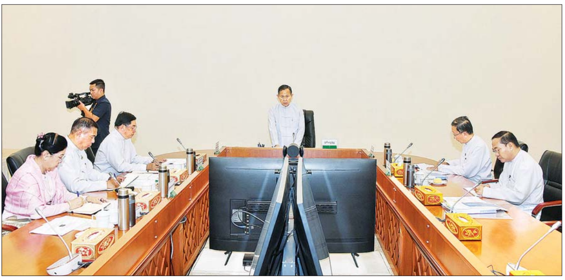
နိုင်ငံတော်စီမံအုပ်ချုပ်ရေးကောင်စီ ဒုတိယဥက္ကဋ္ဌ ဒုတိယဝန်ကြီးချုပ် ဒုတိယဗိုလ်ချုပ်မှူးကြီး စိုးဝင်း ၂၀၂၄ - ၂၀၂၅ ဘဏ္ဍာရေးနှစ်၊ ပြည်ထောင်စု၏ ဖြည့်စွက်ခွင့်ပြုငွေ စာရင်းများ တင်ပြခြင်းဆိုင်ရာ ညှိနှိုင်းအစည်းအဝေးတွင် အမှာစကားပြောကြားစဉ်။