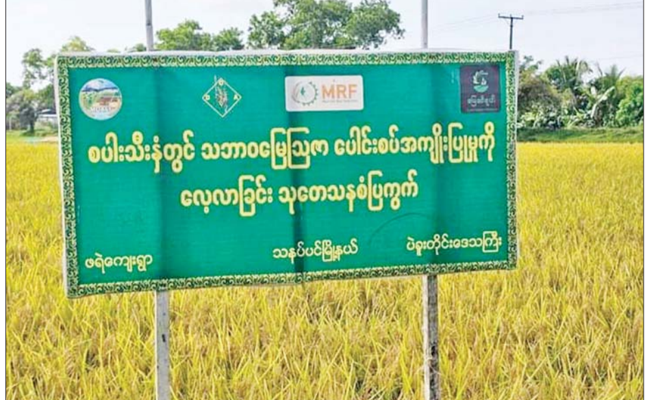
ပဲခူးတိုင်းဒေသကြီး သနပ်ပင်မြို့နယ် ဖရဲကျေးရွာရှိ သုတေသနစံပြုကွက်အားတွေ့ရစဉ်။