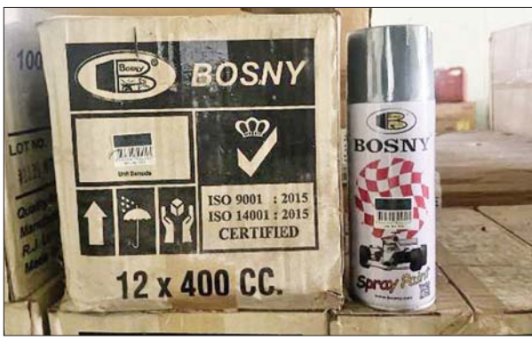
မွန်ပြည်နယ်၌ သိမ်းဆည်းရမိမှု။

ထို့အတူ ပဲခူးတိုင်းဒေသကြီးတရားမဝင်ကုန်သွယ်မှုတိုက်ဖျက် ရေးအထူးအဖွဲ့၏ စီမံခန့်ခွဲမှုဖြင့် တာဝန်ကျပူးပေါင်းအဖွဲ့က စစ်ဆေးမှု များ ဆောင်ရွက်ခဲ့ရာ ညောင်ခါးရည် X-Ray စက် စစ်ဆေးရေးဂိတ်၌ ဘားအံမြို့မှ ရန်ကုန်မြို့သို့ မောင်းနှင်လာသည့် ယာဉ်တစ်စီးပေါ်မှ တရားမဝင်စာရွက်စာတမ်းအထောက်အထား တင်ပြနိုင်ခြင်းမရှိသည့် စားသောက်ကုန်ပစ္စည်းနှစ်မျိုး (ခန့်မှန်းတန်ဖိုးငွေကျပ် ၃၀၃၀၀၀၀) နှင့် အဆိုပါပစ္စည်းများ တင်ဆောင်လာသည့် Nissan Caravan တစ်စီး