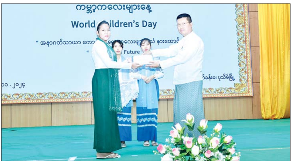
ကိုယ်တိုင်ပါဝင်ဆောင်ရွက်ခွင့် ရရှိစေရန် ကလေးများ၏အသံကို နားထောင်၍ အနာဂတ်သာယာကောင်းမွန်စေရန် ဖန်တီးပေးနိုင်ရေး ရည်ရွယ်ခြင်းဖြစ်ပါကြောင်း အမှာစကားပြောကြားသည်။ ဂုဏ်ပြုလက်ဆောင်များ ပေးအပ် ထိုနောက်တိုင်းဒေသကြီး ဝန်ကြီးချုပ်နှင့် ဧည့်သည်တော်များသည် လူမှုဝန်ထမ်း၊ ကယ်ဆယ်ရေးနှင့်ပြန်လည်နေရာချထားရေးဝန်ကြီးဌာနက ပေးပို့သည့် မှတ်တမ်းဗီဒီယိုနှင့် ပုသိမ်မူလတန်းကြိုကျောင်းများမှ ရင်သွေးငယ်များ၏ ကပြဖျော်ဖြေမှုများကို ကြည့်ရှုအားပေးခဲ့သည်။ ယင်းနောက် တိုင်းဒေသကြီးဝန်ကြီးချုပ်က ကမ္ဘာ့ကလေးများနေ့အကြို စာစီစာကုံးပြိုင်ပွဲ အခြေခံပညာအထက်တန်းအဆင့်တွင် ပထမ၊ ဒုတိယနှင့် တတိယဆုရရှိသည့် ကျောင်းသားကျောင်းသူများအား ဆုများနှင့် ကပြဖျော်ဖြေသည့် ရင်သွေးငယ်များအား ဂုဏ်ပြုလက်ဆောင်များပေးအပ်ချီးမြှင့်ခဲ့ကြောင်း သိရသည်။ တိုင်းဒေသကြီး(ပြန်/ဆက်)

ကုလသမဂ္ဂကွန်ဗင်းရှင်းနှစ်ပတ်လည်နေ့၊ ကမ္ဘာ့ကလေးများနေ့(World Children's Day) အဖြစ် သတ်မှတ်ခဲ့ပြီး ကလေးများကိုယ်တိုင်ပါဝင်သည့် အထိမ်းအမှတ်အခမ်းအနားများကို ကမ္ဘာတစ်ဝန်းကျင်းပခဲ့ခြင်းဖြစ်ပါကြောင်း၊ ကလေးများအတွက် ကလေးသူငယ်အခွင့်အရေးများဆိုင်ရာ သဘောတူစာချုပ်အရ အခြေခံလိုအပ်ချက်ဖြစ်သည့် အသက်ရှင်သန်ခွင့်၊ ဖွံ့ဖြိုးတိုးတက်ခွင့်၊ ကာကွယ်စောင့်ရှောက်ခံပိုင်ခွင့်နှင့် ပါဝင်ဆောင်ရွက်ခွင့်များကို ဆောင်ရွက်ပေးရာတွင် လူမှုဝန်ထမ်း၊ ကယ်ဆယ်ရေးနှင့်ပြန်လည်နေရာချထားရေးဝန်ကြီးဌာနက ရှေးဦးအရွယ် ကလေးသူငယ် ပြုစုပျိုးထောင်ရေးနှင့် ဖွံ့ဖြိုးရေးလုပ်ငန်းဥပဒေ၊ ကလေးသူငယ်အခွင့်အရေးများဆိုင်ရာဥပဒေများကို ပြဋ္ဌာန်းခဲ့ပြီး နိုင်ငံတော်အဆင့် အမျိုးသားကော်မတီများ ဖွဲ့စည်းဆောင်ရွက်ပေးလျက်ရှိပါကြောင်း၊ ကမ္ဘာပေါ်ရှိ ကလေးများအားလုံး၏ အခွင့်အရေးတစ်ရပ်ဖြစ်သည့် ကလေးများ