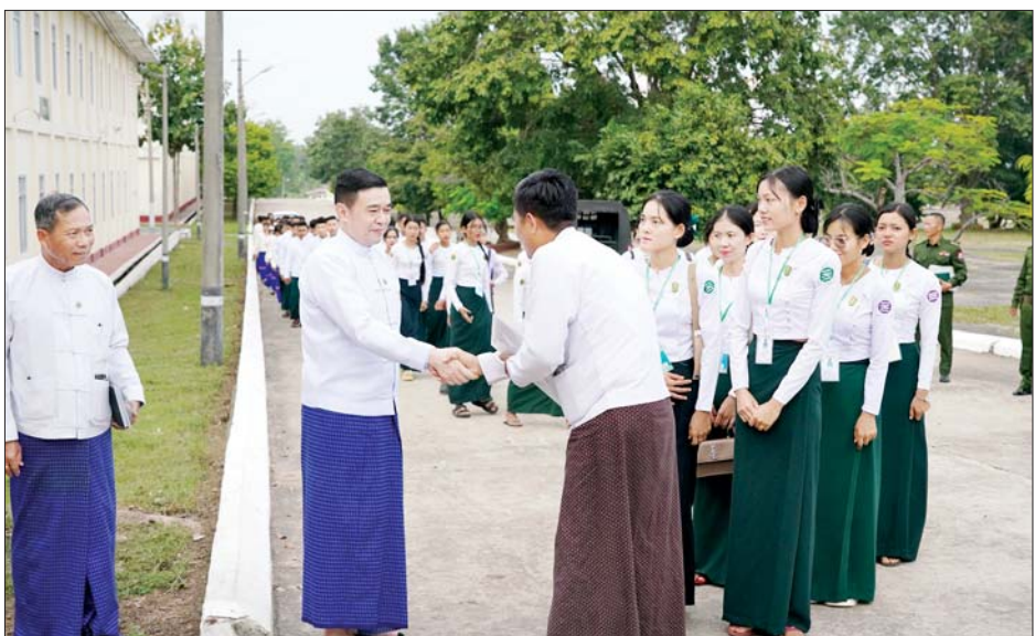
နိုင်ရန် တိုင်းဒေသကြီး/ပြည်နယ်အလိုက် နေရာချ ထားမည့် အဆောင်များ၊ အိပ်ရာသုံးပစ္စည်းများ ထိန်းသိမ်းထားမှုအခြေအနေများနှင့် ဆပ်ကော်မတီ ရုံးခန်းဖွင့်လှစ်မည့်အခန်းများကို လှည့်လည်ကြည့်ရှု စစ်ဆေးပြီး လိုအပ်သည်များကို မှာကြားခဲ့ကြောင်း သတင်းစဉ်

ထို့နောက် ဖျော်ဖြေရေးအဖွဲ့များ တည်းခိုနေထိုင်မည့် အဆောင်များတွင် အိပ်ရာခင်းကျင်းထားမှုအခြေအနေများ၊ ကြီးကြပ်သူများကို နေရာချထားမည့် အခန်းများ၊ စားရိပ်သာများနှင့် သန့်စင်ခန်းများကို လှည့်လည်ကြည့်ရှုစစ်ဆေးကာ တည်းခိုနေထိုင်မည့်သူများအတွက် သောက်ရေနှင့်သုံးစွဲရေများကို အလုံအလောက်ထားရှိရန်နှင့် သန့်ရှင်းမှုနှင့် ကျန်းမာရေးနှင့်ညီညွတ်မှုရှိအောင် ဆောင်ရွက်ထားရှိရန်၊ ရေ၊ မီး၊ မိလ္လာစနစ်ကောင်းမွန်စေရေးအတွက် သက်ဆိုင်ရာအဖွဲ့အလိုက် ကြပ်မတ်ဆောင်ရွက်ရန်၊ စားရိပ်သာများကို သန့်ရှင်းသပ်ရပ်မှုရှိအောင် ပြင်ဆင်ခင်းကျင်းထားရှိနိုင်ရေးအတွက် ကြပ်မတ်ဆောင်ရွက်ရန်၊ အစားအစာများ ချက်ပြုတ်ခြင်းနှင့် ကျွေးမွေးဧည့်ခံခြင်းတို့တွင် သန့်ရှင်းမှုရှိစေရန်နှင့် ကျန်းမာရေးနှင့် ညီညွတ်မှုရှိစေရေး ဂရုပြုဆောင်ရွက်ကြရန် မှာကြားသည်။ ဆက်လက်၍ အမျိုးသားအားကစားပွဲတော်တွင် ပြိုင်ပွဲဝင်မည့် အားကစားသမားများ တည်းခိုနေထိုင်