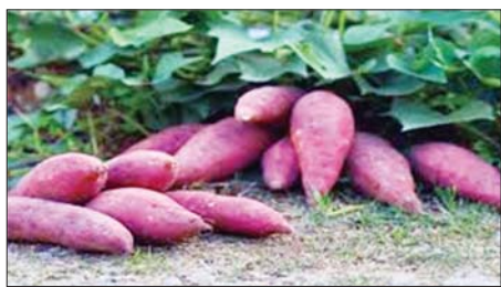
ကောင်းမွန်ပြီး ဈေးကောင်းရရှိပါက အကျိုးအမြတ်ပိုမိုရရှိမည် ဖြစ်ကြောင်း ကန်စွန်းဥစိုက်တောင်သူတစ်ဦးထံမှ သိရသည်။