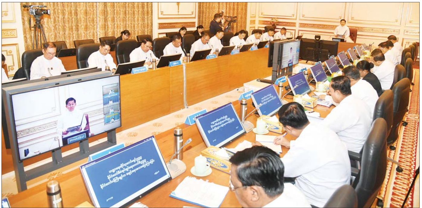
ဘဏ္ဍာရေးဆိုင်ရာကော်မရှင်ဥက္ကဋ္ဌ နိုင်ငံတော်စီမံအုပ်ချုပ်ရေးကောင်စီဥက္ကဋ္ဌ နိုင်ငံတော်ဝန်ကြီးချုပ် ဗိုလ်ချုပ်မှူးကြီး မင်းအောင်လှိုင် ဘဏ္ဍာရေးဆိုင်ရာကော်မရှင်အစည်းအဝေးတွင် အမှာစကားပြောကြားစဉ်။

ဘဏ္ဍာရေးဆိုင်ရာကော်မရှင်ဥက္ကဋ္ဌ နိုင်ငံတော်စီမံအုပ်ချုပ်ရေးကောင်စီဥက္ကဋ္ဌ နိုင်ငံတော်ဝန်ကြီးချုပ် ဗိုလ်ချုပ်မှူးကြီး မင်းအောင်လှိုင် ဘဏ္ဍာရေးဆိုင်ရာကော်မရှင်အစည်းအဝေးသို့ တက်ရောက်အမှာစကားပြောကြား ယခုဘဏ္ဍာနှစ်နှင့် နောင်လာမည့်ဘဏ္ဍာနှစ်များ၌ ပြည်သူလူထုနှင့်သက်ဆိုင်သော အများပြည်သူအသုံးပြုနိုင်သည့် အခြေခံလိုအပ်ချက်များကို နေပြည်တော် ပြည်ထောင်စုနယ်မြေအပါအဝင် တိုင်းဒေသကြီးနှင့်ပြည်နယ်များ၌ ဖြည့်ဆည်းပေးနိုင်ရေး ဦးစားပေးဆောင်ရွက်သွားမည်