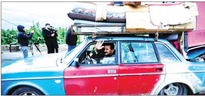
အစ္စရေးနှင့် ပာစ်စတိုလာတို့အကြား ပစ်ခတ်တိုက်ခိုက်မှုရပ်စဲရေး သဘောတူညီချက် စတင် အသက်ဝင်လာပြီးနောက် လက်ဘန္တန်နိုင်ငံတောင်ပိုင်းရှိ ကျေးရွာတစ်ရွာသို့ ပြန်လာသော မိသားစု တစ်စုကို တွေ့ရစဉ်။

ဂျေရုဆလင် နိုဝင်ဘာ ၂၇ အစ္စရေးနှင့် ရှိအာမ္မတ်စလင်အဖွဲ့ ပာစ်စတိုလာတို့အကြား အပစ် အခတ်ရပ်စဲရေး သဘောတူညီ ချက် စတင်အကျိုးသက်ရောက် လာပြီဖြစ်သောကြောင့် လက် ဘန္တန်တောင်ပိုင်းမှ အိုးအိမ်စွန့်ခွာ ထွက်ပြေးလာကြသော ဒေသခံ များသည် ယခုအခါ ၎င်းတို့၏ နေအိမ်များသို့ ပြန်သွားနေကြ ပြီဖြစ်ကြောင်း သိရသည်။