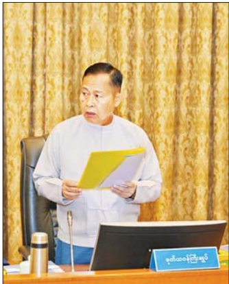
ဘဏ္ဍာရေးဆိုင်ရာကော်မရှင် ဒုတိယဥက္ကဋ္ဌ နိုင်ငံတော်စီမံအုပ်ချုပ်ရေးကောင်စီ ဒုတိယဥက္ကဋ္ဌ ဒုတိယဝန်ကြီးချုပ် ဒုတိယဝန်ကြီးချုပ်မှူးကြီး ဖိုးဝင်း ရှင်းလင်းတင်ပြနေသည်။