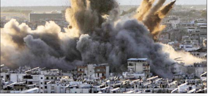
လက်နက်ခွန်နိုင်ငံ ဘေရုတ်တောင်ပိုင်း၌ ၂၀၂၃ ခုနှစ် အောက်တိုဘာ ၁၉ ရက်က အစွဲရောက်လေကြောင်း တိုက်ခိုက်မှုကြောင့် မီးခိုးများ ထွက်ပေါ်နေသည့်ကို တွေ့ရစဉ်။

ဂျေရုဆလမ် နိုဝင်ဘာ ၂၈ အစွဲရောက်ကွယ်ရေး တပ်ဖွဲ့ (အိုင်ဒီအက်မ်)သည် ၂၀၂၃ ခုနှစ် အောက်တိုဘာလမှ စတင်ကာ လက်နက်ခွန်နိုင်ငံတစ်ဝန်း ဟစ်ဇ်ဘိုလာကို ပစ်မှတ်ထား၍ လေကြောင်း တိုက်ခိုက်မှုပေါင်း ၁၂၅၀၀ ကြိမ် ပြုလုပ်ခဲ့ကြောင်း ပြောကြားသည်။ အပစ်အခတ် ရပ်စဲရေး သဘောတူညီချက် အသက်မဝင် မီ နာရီပိုင်းအလိုတွင် အစွဲရောက် ကာကွယ်ရေးတပ်ဖွဲ့က ဆီးရီးယားနယ်စပ်အနီး ဟစ်ဇ်ဘိုလာ ခုံးကျည်ထုတ်လုပ်သည့် နေရာ