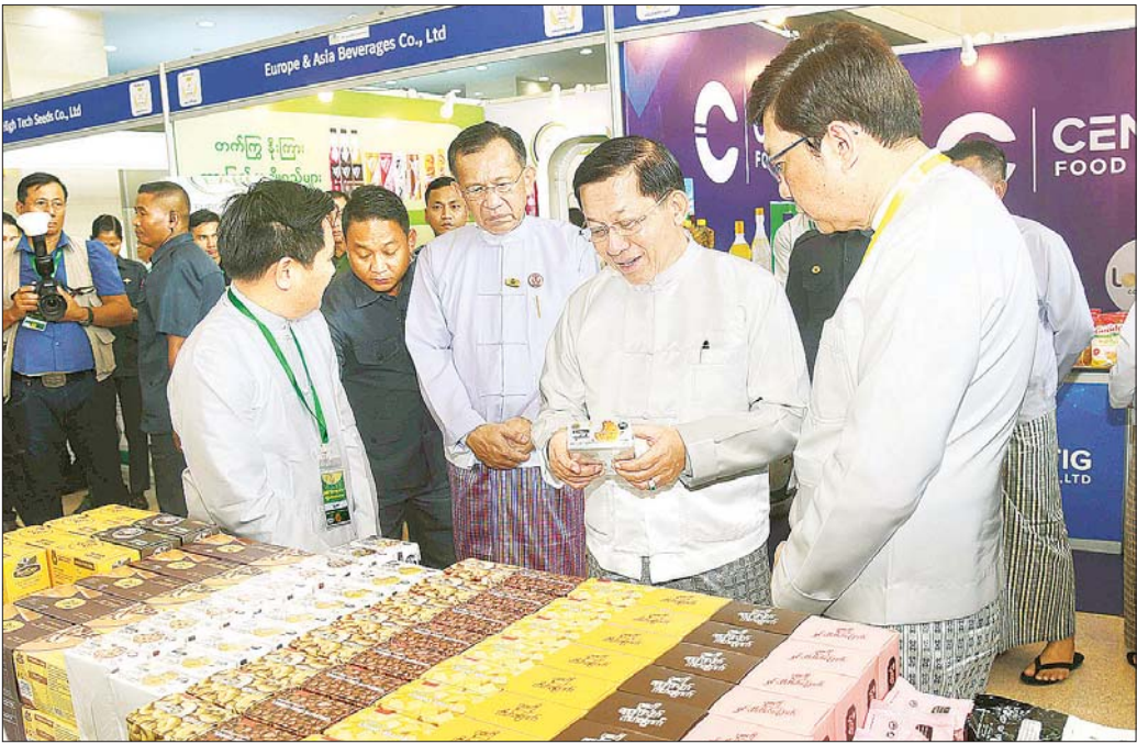
နိုင်ငံတော်စီမံအုပ်ချုပ်ရေးကောင်စီဥက္ကဋ္ဌ နိုင်ငံတော်ဝန်ကြီးချုပ် ဗိုလ်ချုပ်မှူးကြီး မင်းအောင်လှိုင် ခင်းကျင်းပြသထားသည့် မြန်မာနိုင်ငံ "စီးပွားရေးဝတ္ထု ဝှမ်း(၁၀၀)" ရာပြည့်အထိမ်းအမှတ်ပြခန်းတစ်ခုချင်းစီအလိုက် စိတ်ဝင်တစားလှည့်လည်ကြည့်ရှုလေ့လာစဉ်။

စာမျက်နှာ ၃ မှ ကိန်းဂဏန်းများအရ တိုးတက်မှုသာမက လက်တွေ့ ကျကျတိုးတက်အောင် ဆောင်ရွက်ကြရမည်။ အဓိက ကျသည့် စိုက်ပျိုးရေးကဏ္ဍအနေဖြင့် အထွက်နှုန်း ကောင်းမွန်ရေး တစ်နည်းအားဖြင့် ပန်းတိုင်ရည်မှန်းချက်ပြည့်မီကျော်လွန်ရေး၊ သီးထပ်စွမ်းအားဖြင့်တင်ရေး၊ စိုက်ပျိုးရေး ဖွံ့ဖြိုးရေး မူဝါဒကို အခြေခံပြီး ဆောင်ရွက်ပေးနိုင်ကြရန် တိုက်တွန်းလိုကြောင်း။ ဝန်ဆောင်မှုလုပ်ငန်းများကို ပံ့ပိုးပေးလျက်ရှိ မိမိတို့နိုင်ငံ GDP ၏ ၈ ရာခိုင်နှုန်းခန့်သည် ပုဂ္ဂလိကကဏ္ဍ၏ ထုတ်လုပ်မှုများဖြစ်သကဲ့သို့ နိုင်ငံစီးပွားရေးလုပ်ငန်းများ၏ ၉၅ ရာခိုင်နှုန်းသည် လည်း အသေးစား၊ အငယ်စား၊ အလတ်စားကုန်ထုတ်လုပ်ငန်းများသာဖြစ်ကြောင်း၊ ထို့ကြောင့် ပိုမိုကုန်တိုးမြှင့်ရေးနှင့် သွင်းကုန်အစားထိုးရေးလုပ်ငန်းများအတွက် ပုဂ္ဂလိကကဏ္ဍဖွံ့ဖြိုးမှုနှင့် Agro-based Industry ကို အဓိကထားပြီး MSME များ ဖွံ့ဖြိုးတိုးတက်မှုတို့ကို တွဲဖက်ဆောင်ရွက်ကြရမည်ဖြစ်ကြောင်း၊ MSME လုပ်ငန်းများ ဖွံ့ဖြိုးတိုးတက်မှုအတွက် အထောက်အကူပြု ဝန်ဆောင်မှုလုပ်ငန်းများကို ပံ့ပိုးပေးလျက်ရှိကြောင်း။