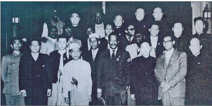
၂-၁၁-၁၉၅၈ ရက်နေ့က တရုတ်နိုင်ငံ ကျောင်းမြို့၌ တရုတ်ဝန်ကြီးချုပ်ချူအင်လိုင်နှင့် အာရှ-အာဖရိက စာရေးဆရာများ မှတ်တမ်းတင် ဓာတ်ပုံရိုက်စဉ်။

တရုတ်တော်လှန်ရေးစစ်ပွဲတွင် ရှုံးနိမ့်ပြီး အမေရိကန်စစ်သင်္ဘောများဖြင့် ထွက်ပြေးရသော ချန်ကေရှိတ်နှင့် နောက်လိုက်တစ်သန်းကျော်အား အမေရိကန်စစ်သင်္ဘောများက ယနေ့ ထိုင်ဝမ်ကျွန်းသို့ သယ်ဆောင်ပို့ပေးခဲ့သည့်အပြင် အဘက်ဘက်မှ ကူညီပံ့ပိုးကာ (ဒုတိယ)