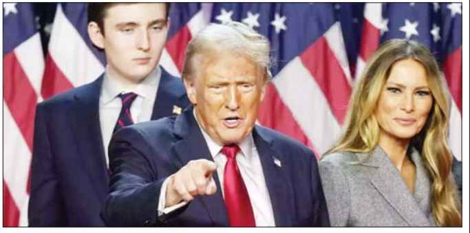
ပန်ဘွန်ဒီ၊ ကုလသမဂ္ဂဆိုင်ရာ အမေရိကန်သံအမတ် ကြီးအဖြစ် ကွန်ဂရက်အမတ် အီလိုက်စတီဖာနစ်၊ စိုက်ပျိုးရေးဝန်ကြီးအဖြစ် အမေရိကန်ပထမမူဝါဒ သိပ္ပံအကြံပေး ဘရူတ်ရှီးလင်းတို့ကို ပစ်မှတ်ထား လျက်ရှိကြောင်း စိတ်အာရုံစာတင်တွင် ဖော်ပြ ထားသည်။ ဆင်ဟွာ

ဝါရှင်တန် နိုဝင်ဘာ ၂၈ အမေရိကန်ရွေးကောက်ခံသမ္မတ ဒေါ်နယ်ထရမ်၏ အစိုးရအဖွဲ့နှင့် အုပ်ချုပ်ရေးပိုင်းရွေးချယ်ခံရသူ တော်တော်များများကို ဖွဲ့စည်းခြောက်မှုများနှင့်သမ္မတ တုန်လှုပ်ချောက်ချားဖွယ်ရာဖြစ်ရပ်များဖြင့် ပါ တိုက်ခိုက်ရန် ပစ်မှတ်ထားလျက်ရှိကြောင်း မစ္စတာဒေါ်နယ်ထရမ်၏ အသွင်ကူးပြောင်းရေးအဖွဲ့က နိုဝင်ဘာ ၂၇ ရက်က ပြောကြားလိုက်သည်။