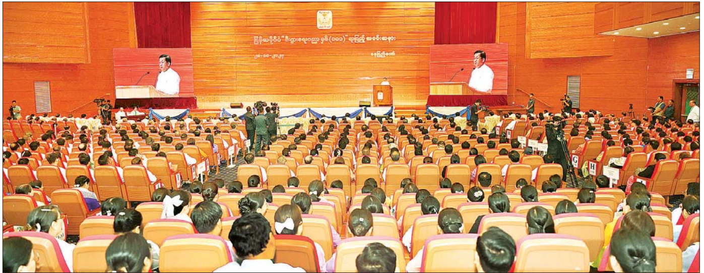
နိုင်ငံတော်စီမံအုပ်ချုပ်ရေးကောင်စီဥက္ကဋ္ဌ နိုင်ငံတော်ဝန်ကြီးချုပ် ဗိုလ်ချုပ်မှူးကြီး မင်းအောင်လှိုင် မြန်မာနိုင်ငံ “စီးပွားရေးပညာနှစ်(၁၀၀)” ရာပြည့် အထိမ်းအမှတ်အခမ်းအနားတွင် ဂုဏ်ပြုအမှာစကား ပြောကြားစဉ်။

❖ ရှေ့ဖွဲ့မှု ဦးစွာ အခမ်းအနားကို စတင်ကျင်းပပြုလုပ်ရာ နိုင်ငံတော်စီမံအုပ်ချုပ်ရေးကောင်စီဥက္ကဋ္ဌ နိုင်ငံတော်ဝန်ကြီးချုပ်နှင့် အခမ်းအနားတက်ရောက်လာကြသူ များသည် မြန်မာနိုင်ငံ “စီးပွားရေးပညာနှစ်(၁၀၀)” ရာပြည့်အထိမ်းအမှတ် အခမ်းအနား Video Clip ကိုကြည့်ရှုကြသည်။