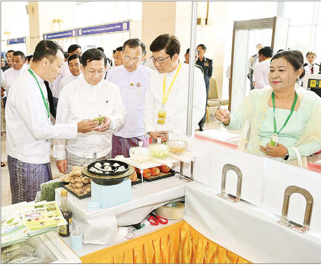
နိုင်ငံတော်စီမံအုပ်ချုပ်ရေးကောင်စီဥက္ကဋ္ဌ နိုင်ငံတော်ဝန်ကြီးချုပ် ဗိုလ်ချုပ်မှူးကြီး မင်းအောင်လှိုင် ခင်းကျင်းပြသထားသည့် မြန်မာနိုင်ငံ “စီးပွားရေးပညာနှစ်(၁၀၀)” ရာပြည့်အထိမ်းအမှတ်ပြခန်းကို စိတ်ဝင်တစားကြည့်ရှုလေ့လာစဉ်။