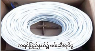
ကရင်ပြည်နယ်၌ ဖမ်းဆီးရမိမှု