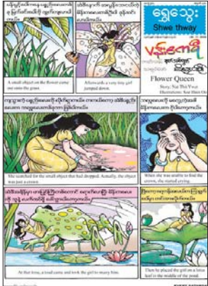
တစ်စောင်လျှင် ငွေကျပ် ၄၀၀ ဖြင့် စာပေဗိမာန် စာအုပ်အရောင်းဆိုင်များတွင် ဝယ်ယူရရှိနိုင် ကြောင်း သိရသည်။ သတင်းစဉ်