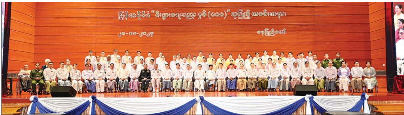
နိုင်ငံတော်စီမံအုပ်ချုပ်ရေးကောင်စီဥက္ကဋ္ဌ နိုင်ငံတော်ဝန်ကြီးချုပ် ဗိုလ်ချုပ်မှူးကြီး မင်းအောင်လှိုင်နှင့် အခမ်းအနားတက်ရောက်လာကြသူများ စုပေါင်းမှတ်တမ်းတင်ဓာတ်ပုံရိုက်စဉ်။

( ၃-၉-၂၀၂၄ ရက်နေ့တွင် နိုင်ငံတော်စီမံအုပ်ချုပ်ရေးကောင်စီဥက္ကဋ္ဌ နိုင်ငံတော်ဝန်ကြီးချုပ် ဗိုလ်ချုပ်မှူးကြီး မင်းအောင်လှိုင် ရှမ်းပြည်နယ်အစိုးရအဖွဲ့ဝင်များ၊ ပြည်နယ်နှင့် ခရိုင်အဆင့်ဌာနဆိုင်ရာတာဝန်ရှိသူများအား ပြောကြားသည့် အမှာစကားမှ ကောက်နုတ်ချက် )