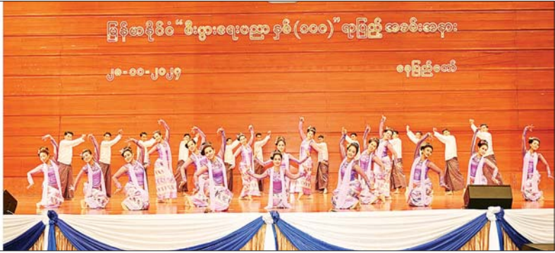
နိုင်ငံတော်စီမံအုပ်ချုပ်ရေးကောင်စီဥက္ကဋ္ဌ နိုင်ငံတော်ဝန်ကြီးချုပ် ဗိုလ်ချုပ်မှူးကြီး မင်းအောင်လှိုင်နှင့် အဖွဲ့ဝင်များ "စီးပွားရေးဝတ္ထု ဝှမ်း(၁၀၀)" ရာပြည့်အထိမ်းအမှတ် အခမ်းအနားလှူတော်ပေးပေးပွဲ သီဆိုဖျော်ဖြေတင်ဆက်နေမှုကို ကြည့်ရှုအားပေးစဉ်။

စာမျက်နှာ ၃ မှ ကိန်းဂဏန်းများအရ တိုးတက်မှုသာမက လက်တွေ့ ကျကျတိုးတက်အောင် ဆောင်ရွက်ကြရမည်။ အဓိက ကျသည့် စိုက်ပျိုးရေးကဏ္ဍအနေဖြင့် အထွက်နှုန်း ကောင်းမွန်ရေး တစ်နည်းအားဖြင့် ပန်းတိုင်ရည်မှန်းချက်ပြည့်မီကျော်လွန်ရေး၊ သီးထပ်စွမ်းအားဖြင့်တင်ရေး၊ စိုက်ပျိုးရေး ဖွံ့ဖြိုးရေး မူဝါဒကို အခြေခံပြီး ဆောင်ရွက်ပေးနိုင်ကြရန် တိုက်တွန်းလိုကြောင်း။ ဝန်ဆောင်မှုလုပ်ငန်းများကို ပံ့ပိုးပေးလျက်ရှိ မိမိတို့နိုင်ငံ GDP ၏ ၈ ရာခိုင်နှုန်းခန့်သည် ပုဂ္ဂလိကကဏ္ဍ၏ ထုတ်လုပ်မှုများဖြစ်သကဲ့သို့ နိုင်ငံစီးပွားရေးလုပ်ငန်းများ၏ ၉၅ ရာခိုင်နှုန်းသည် လည်း အသေးစား၊ အငယ်စား၊ အလတ်စားကုန်ထုတ်လုပ်ငန်းများသာဖြစ်ကြောင်း၊ ထို့ကြောင့် ပိုမိုကုန်တိုးမြှင့်ရေးနှင့် သွင်းကုန်အစားထိုးရေးလုပ်ငန်းများအတွက် ပုဂ္ဂလိကကဏ္ဍဖွံ့ဖြိုးမှုနှင့် Agro-based Industry ကို အဓိကထားပြီး MSME များ ဖွံ့ဖြိုးတိုးတက်မှုတို့ကို တွဲဖက်ဆောင်ရွက်ကြရမည်ဖြစ်ကြောင်း၊ MSME လုပ်ငန်းများ ဖွံ့ဖြိုးတိုးတက်မှုအတွက် အထောက်အကူပြု ဝန်ဆောင်မှုလုပ်ငန်းများကို ပံ့ပိုးပေးလျက်ရှိကြောင်း။