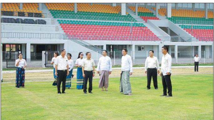
ပြင်ဆင်ဆောင်ရွက်ထားရှိမှု၊ ကွင်းအဝင်လမ်းနှင့် နောက်ခံဆိုင်းဘုတ်စီနိုင်းများ အချိန်မီတပ်ဆင်ပြီးစီးနိုင်ရေး၊ ဘောလုံးကွင်းအတွင်း သန့်ရှင်းသပ်ရပ်မှုရှိစေရေးနှင့် စိမ်းလန်းစိုပြည်မှုရှိစေရေး၊ ရေစီးရေလာကောင်းမွန်စေရေးအတွက် ရေနုတ်မြောင်းများ သန့်ရှင်းရေးဆောင်ရွက်သွားရန်၊ ပြိုင်ပွဲတွင်း

နေပြည်တော် နိုဝင်ဘာ ၂၈ ၂၀၂၄ ခုနှစ် ပဉ္စမအကြိမ် အမျိုးသားအားကစားပွဲတော် ပြိုင်ပွဲကျင်းပရေးဦးစီးကော်မတီဥက္ကဋ္ဌ အားကစားနှင့် လူငယ်ရေးရာဝန်ကြီးဌာန ပြည်ထောင်စုဝန်ကြီး ဦးမင်းသိန်းဇံသည် ယနေ့မွန်းလွဲပိုင်းတွင် နေပြည်တော် အတွင်းရှိ ပဉ္စမအကြိမ် အမျိုးသားအားကစားပွဲတော် တွင် အားကစားပြိုင်ပွဲများကျင်းပမည့် အားကစားကွင်း / အားကစားရုံများ ကြိုတင်ပြင်ဆင်ဆောင်ရွက်ထားရှိမှု အခြေအနေများကို ကြည့်ရှုစစ်ဆေးသည်။ ဦးစွာ ပြည်ထောင်စုဝန်ကြီးသည် ပဉ္စမအကြိမ် အမျိုးသားအားကစားပွဲတော်တွင် အားကစားပြိုင်ပွဲများကျင်းပမည့် နေပြည်တော် ဧည့်သည်ရုံ၊ ရွှေကြာပင်အားကစားကွင်း / ရွှေကြာပင်အားကစားရုံ ယူဦးမနားမြို့နယ်ရှိ ပေါင်းလောင်းအားကစားကွင်း၊ ဘောဂဝတီအားကစားကွင်းများအတွင်း ကြိုတင်ပြင်ဆင်ဆောင်ရွက်ထားရှိမှု အခြေအနေများကို လိုက်လံကြည့်ရှုစစ်ဆေးပြီး ပြိုင်ပွဲကျင်းပရေး ကြိုတင်