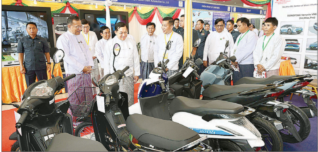
နိုင်ငံတော်စီမံအုပ်ချုပ်ရေးကောင်စီဥက္ကဋ္ဌ နိုင်ငံတော်ဝန်ကြီးချုပ် ဗိုလ်ချုပ်မှူးကြီး မင်းအောင်လှိုင် ခင်းကျင်းပြသထားသည့် မြန်မာနိုင်ငံ "စီးပွားရေးဝတ္ထု ဝှမ်း(၁၀၀)" ရာပြည့်အထိမ်းအမှတ်ပြခန်းတစ်ခုချင်းစီအလိုက် စိတ်ဝင်တစားလှည့်လည်ကြည့်ရှုလေ့လာစဉ်။

ခံနိုင်ရည်ရှိအောင် ကြိုတင်ကာကွယ် လက်ရှိကာလတွင်လည်း ပြန်လည်တည်ဆောက်ရေး၊ ထုထောင်ရေးနှင့် နေရာချထားရေးလုပ်ငန်းများ ဖြစ်သည့် Reconstruction | Relief | Rehabilitation | Resilience စသည့်တို့ကို လုပ်ဆောင်နေရသည်မှာ အားလုံးအသိဖြစ်ကြောင်း၊ အနာဂတ်သဘာဝဘေးအန္တရာယ်များကို ခံနိုင်ရည်ရှိအောင် ကြိုတင်ကာကွယ်ရေးများကိုလည်း ဆက်လက်လုပ်ဆောင်ရမည်ဖြစ်ကြောင်း၊ နိုင်ငံတည်ဆောက်ရေး (Nation Building) အတွက် အဓိကငွေကြေးလိုအပ်ချက်များကိုလည်း ပြည်တွင်းစီးပွားရေးလုပ်ငန်းရှင်များ၏ ရင်းနှီးမြုပ်နှံမှုများက ဖြည့်ဆည်းပေးခဲ့ခြင်းပင် ဖြစ်ကြောင်း၊ ရာဂီမုန်တိုင်း ပြန်လည်ထူထောင်ရေးလုပ်ငန်းများတွင်လည်း အင်တိုက်အားတိုက် ပါဝင်လှူဒါန်းခဲ့ကြသောကြောင့် ပြည်တွင်းစီးပွားရေးလုပ်ငန်းရှင်များ၏စေတနာကို ထင်ရှားစွာ မြင်တွေ့ရသည့်အတွက် ဂရုတစိုက်နှင့် မျှဝေခံစားတတ်သည့် စာမျက်နှာ ၅ သို့