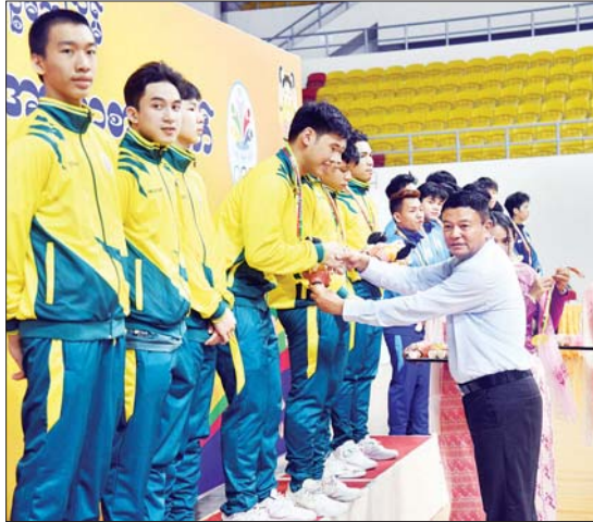
ပြည်ထောင်စုဝန်ကြီးနှင့် ပြည်ထောင်စုရေချုပ် ခေါက်တာသီတာဦး၊ ပြည်နယ်နှင့် တိုင်းဒေသကြီး ကြက်တောင်ရိုက်ပြိုင်ပွဲတွင် ပထမဆုရ ရန်ကုန်တိုင်းဒေသကြီးအသင်းမှ ပြိုင်ပွဲဝင်များအား ဂုဏ်ပြုဆုတံဆိပ်နှင့် အမျိုးသားအားကစားပွဲတော်အထိမ်းအမှတ်အရပ် ပေးအပ်ချီးမြှင့်စဉ်။