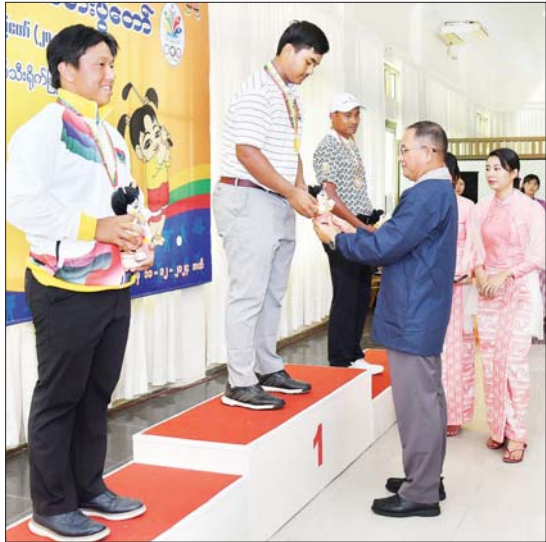
ပြည်ထောင်စုဝန်ကြီး ဦးအောင်ကျော်ဟိုး ဂေါက်သီးရိုက်ပြိုင်ပွဲ အမျိုးသားတစ်ဦးချင်း (အကျောမှ) ပြိုင်ပွဲတွင် ပထမဆုရ မန္တလေးတိုင်းဒေသကြီးမှ ပြိုင်ပွဲဝင်အား ဂုဏ်ပြုဆုတံဆိပ်နှင့် အမျိုးသားအားကစားပွဲတော် အထိမ်းအမှတ်အရုပ် ပေးအပ်ချီးမြှင့်စဉ်။