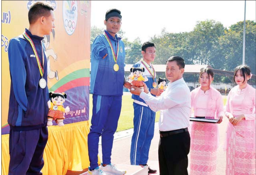
နိုင်ငံတော်စီမံအုပ်ချုပ်ရေးကောင်စီအဖွဲ့ဝင် ခွန်စုံလွင် အမျိုးသားဗီတာ (၁၀၀) T46/47 အပြေးပြိုင်ပွဲတွင် ပထမဆုရ ပဲခူးတိုင်းဒေသကြီးမှ အောင်မြင်မြတ်အား ဂုဏ်ပြုဆုတံဆိပ်နှင့် အမျိုးသားအားကစားပွဲတော်အထိမ်းအမှတ်အရုပ် ပေးအပ်ချီးမြှင့်စဉ်။

ပြည်နယ်နှင့် တိုင်းဒေသကြီးဘတ်စကက်ဘောပြိုင်ပွဲ ဆုချီးမြှင့်ပွဲအခမ်းအနားကို ရွှေကြာပင်အားကစားကွင်း၌ ကျင်းပရာရမ်းပြည်နယ်အစိုးရအဖွဲ့တိုင်းရင်းသားရေးရာဝန်ကြီး ဦးအောင်ကြည်ဝင်းက ပူးတွဲတတိယဆုရရှိသည့် စာမျက်နှာ ၅ သို့