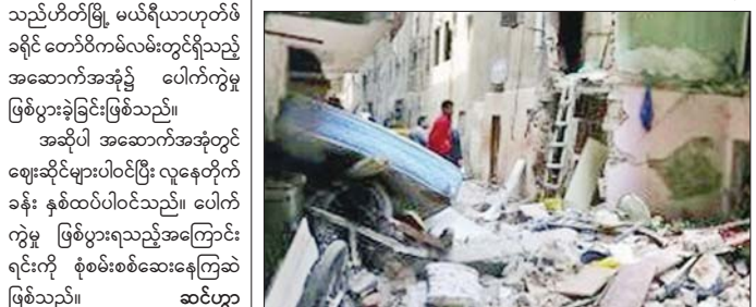
ပေါက်ကွဲမှုကြောင့် ပျက်စီးသွားသည့် အဆောက်အအုံအနီးတွင် ဖျားဆိုင်များပါဝင်ပြီး လူနေတိုက်ခန်း နှစ်ထပ်ပါဝင်သည်။ ပေါက်ကွဲမှု ဖြစ်ပွားရသည့်အကြောင်းရင်းကို စုံစမ်းစစ်ဆေးနေကြဆဲဖြစ်သည်။