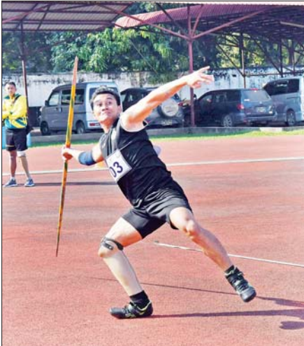
အမျိုးသား လှံတံပစ်ပြိုင်ပွဲတွင် ပြိုင်ပွဲဝင်တစ်ဦး ဝင်ရောက် ယှဉ်ပြိုင်စဉ်။