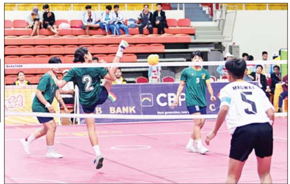
ပြည်နယ်နှင့် တိုင်းဒေသကြီး အမျိုးသား သုံးယောက်တွဲ ဝိုက်ကျော်ခြင်းပြိုင်ပွဲ အုပ်စုပတ်လည်ပွဲစဉ်တွင် မွန်ပြည်နယ်အသင်းနှင့် မကွေးတိုင်းဒေသကြီးအသင်းတို့ ယှဉ်ပြိုင်ကစားစဉ်။

က ရခိုင်ပြည်နယ်အသင်းကို ၂ ဂိုးဖြင့်၊ ပြည်ထောင်စုနယ်မြေ နေပြည်တော်အသင်းက ကရင်ပြည်နယ်အသင်းကို ၂ ဂိုးဖြင့်၊ ကချင်ပြည်နယ်အသင်းက ကယားပြည်နယ်အသင်းကို ၂ ဂိုးဖြင့်၊ မွန်ပြည်နယ်အသင်းက ချင်းပြည်နယ်အသင်းကို ၂ ဂိုးဖြင့်၊ ရန်ကုန်တိုင်းဒေသကြီးအသင်းက ဧရာဝတီတိုင်းဒေသကြီးအသင်းကို ၂ ဂိုးဖြင့်၊ မန္တလေးတိုင်းဒေသကြီးအသင်းက မကွေးတိုင်းဒေသကြီးအသင်းကို ၂ ဂိုးဖြင့်၊ လည်းကောင်း၊ အမျိုးသမီး သုံးယောက်တွဲပြိုင်ပွဲတွင် မွန်ပြည်နယ်အသင်းက မကွေးတိုင်းဒေသကြီးအသင်းကို ၂ ဂိုး-၁ ဂိုး၊ စစ်ကိုင်းတိုင်းဒေသကြီးအသင်းက တနင်္သာရီတိုင်းဒေသကြီးအသင်းကို ၂ ဂိုးဖြင့်၊ ရခိုင်ပြည်နယ်အသင်းက ရန်ကုန်တိုင်းဒေသကြီးအသင်းကို ၂ ဂိုးဖြင့်၊ မန္တလေးတိုင်းဒေသကြီးအသင်းက ရှမ်းပြည်နယ်အသင်းကို ၂ ဂိုးဖြင့်၊ ကရင်ပြည်နယ်အသင်းက ကချင်ပြည်နယ်အသင်းကို ၂ ဂိုးဖြင့်၊ မြန်မာပြည်ထောင်စုနယ်မြေ နေပြည်တော်အသင်းကို ၂ ဂိုးဖြင့်၊ ရှမ်းပြည်နယ်အသင်းက မွန်ပြည်နယ်အသင်းကို ၂ ဂိုးဖြင့်၊ ဖြင့်လည်းကောင်း၊ အမျိုးသမီး သုံးယောက်တွဲ ဝိုက်ကျော်ခြင်းပြိုင်ပွဲတွင် ပဲခူးတိုင်းဒေသကြီး