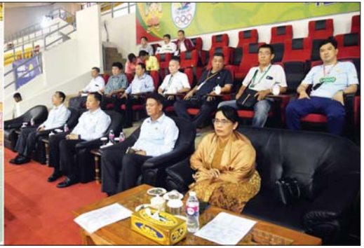
ပြည်ထောင်စုဝန်ကြီးနှင့် ပြည်ထောင်စုရေချုပ် ခေါက်တာသီတာဦး၊ ပြည်ထောင်စုဝန်ကြီး ဦးမင်းသိန်းဇော်နှင့် တာဝန်ရှိသူများ ပြည်နယ်နှင့် တိုင်းဒေသကြီး ကြက်တောင်ရိုက်ပြိုင်ပွဲ အမျိုးသမီးပြိုင်ပွဲတွင် ရန်ကုန်တိုင်းဒေသကြီးအသင်းနှင့် ရှမ်းပြည်နယ်အသင်းတို့ ယှဉ်ပြိုင်နေမှုကို ကြည့်ရှုအားပေးစဉ်။

ရှမ်းပြည်နယ်အစိုးရအဖွဲ့ လူမှုရေးရာဝန်ကြီး ဦးမင်းမင်းလွင်တို့က အမျိုးသမီးအသင်းလိုက်ပြိုင်ပွဲတွင် ပူးတွဲတတိယဆု