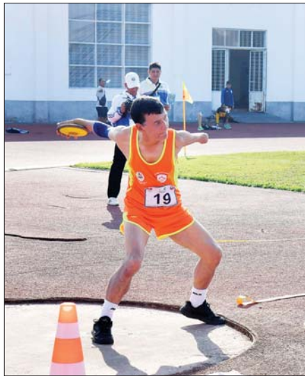
အမျိုးသား သံပြားပစ်ပြိုင်ပွဲတွင် ပြိုင်ပွဲဝင်တစ်ဦး ဝင်ရောက် ယှဉ်ပြိုင်စဉ်။