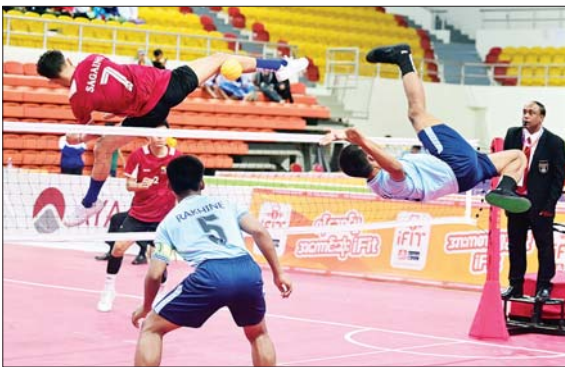
ပြည်နယ်နှင့် တိုင်းဒေသကြီး အမျိုးသား သုံးယောက်တွဲ ဝိုက်ကျော်ခြင်းပြိုင်ပွဲ အုပ်စုပတ်လည်ပွဲစဉ်တွင် စစ်ကိုင်းတိုင်းဒေသကြီးအသင်းနှင့် ရခိုင်ပြည်နယ်အသင်းတို့ ယှဉ်ပြိုင်ကစားစဉ်။

ပြည်နယ်နှင့် တိုင်းဒေသကြီး ဝိုက်ကျော်ခြင်းပြိုင်ပွဲ အုပ်စုပတ်လည်ပွဲစဉ်များကို ဝဏ္ဏသိဒ္ဓိအားကစားကွင်း(A)ရုံ၌ ကျင်းပရာ အမျိုးသား သုံးယောက်တွဲ ဝိုက်ကျော်ခြင်းပြိုင်ပွဲတွင် ရှမ်းပြည်နယ်အသင်းက ပဲခူးတိုင်းဒေသကြီးအသင်းကို ၂ ဂိုးဖြင့်၊ စစ်ကိုင်းတိုင်းဒေသကြီးအသင်း