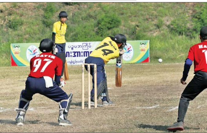
ပြည်နယ်နှင့် တိုင်းဒေသကြီး အမျိုးသားခရစ်ကတ်ပြိုင်ပွဲ အုပ်စုပွဲစဉ်တွင် ကရင်ပြည်နယ်အသင်းနှင့် ရှမ်းပြည်နယ်အသင်းတို့ ယှဉ်ပြိုင်ကစားစဉ်။

က ရခိုင်ပြည်နယ်အသင်းကို ၂ ဂိုးဖြင့်၊ ပြည်ထောင်စုနယ်မြေ နေပြည်တော်အသင်းက ကရင်ပြည်နယ်အသင်းကို ၂ ဂိုးဖြင့်၊ ကချင်ပြည်နယ်အသင်းက ကယားပြည်နယ်အသင်းကို ၂ ဂိုးဖြင့်၊ မွန်ပြည်နယ်အသင်းက ချင်းပြည်နယ်အသင်းကို ၂ ဂိုးဖြင့်၊ ရန်ကုန်တိုင်းဒေသကြီးအသင်းက ဧရာဝတီတိုင်းဒေသကြီးအသင်းကို ၂ ဂိုးဖြင့်၊ မန္တလေးတိုင်းဒေသကြီးအသင်းက မကွေးတိုင်းဒေသကြီးအသင်းကို ၂ ဂိုးဖြင့်၊ လည်းကောင်း၊ အမျိုးသမီး သုံးယောက်တွဲပြိုင်ပွဲတွင် မွန်ပြည်နယ်အသင်းက မကွေးတိုင်းဒေသကြီးအသင်းကို ၂ ဂိုး-၁ ဂိုး၊ စစ်ကိုင်းတိုင်းဒေသကြီးအသင်းက တနင်္သာရီတိုင်းဒေသကြီးအသင်းကို ၂ ဂိုးဖြင့်၊ ရခိုင်ပြည်နယ်အသင်းက ရန်ကုန်တိုင်းဒေသကြီးအသင်းကို ၂ ဂိုးဖြင့်၊ မန္တလေးတိုင်းဒေသကြီးအသင်းက ရှမ်းပြည်နယ်အသင်းကို ၂ ဂိုးဖြင့်၊ ကရင်ပြည်နယ်အသင်းက ကချင်ပြည်နယ်အသင်းကို ၂ ဂိုးဖြင့်၊ မြန်မာပြည်ထောင်စုနယ်မြေ နေပြည်တော်အသင်းကို ၂ ဂိုးဖြင့်၊ ရှမ်းပြည်နယ်အသင်းက မွန်ပြည်နယ်အသင်းကို ၂ ဂိုးဖြင့်၊ ဖြင့်လည်းကောင်း၊ အမျိုးသမီး သုံးယောက်တွဲ ဝိုက်ကျော်ခြင်းပြိုင်ပွဲတွင် ပဲခူးတိုင်းဒေသကြီး