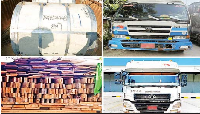
တရားမဝင်ပစ္စည်းများ ဖမ်းဆီးရမိမှု။

တရားမဝင်တင်သွင်းလာသည့် ကုန်စည်များကြောင့် ပြည်တွင်းကုန်စည်ထုတ်လုပ်မှုများ ဈေးကွက်ယှဉ်ပြိုင်နိုင်မှု ကျဆင်းလာနိုင်ခြင်း၊ နိုင်ငံခြားရင်းနှီးမြှုပ်နှံမှုများ လျော့နည်းကျဆင်းစေခြင်း၊ အလုပ်အကိုင်အခွင့်အလမ်းများ ဆုံးရှုံးနိုင်ခြင်း၊ တရားမဝင် တင်သွင်းလာသည့် ဆေးနှင့်ဆေးပစ္စည်းများ၊ စားသောက်ကုန်နှင့် အလှကုန်ပစ္စည်းများတွင် အတုအပများ၊ သက်တမ်းလွန် ကုန်စည်များကြောင့် သုံးစွဲသူပြည်သူများ ထိခိုက်နစ်နာမှုများ ဖြစ်ပေါ်နိုင်ခြင်း စသည့်ဆိုးကျိုးများအပြင် နိုင်ငံ၏ စီးပွားရေး ဖွံ့ဖြိုးတိုးတက်မှုအတွက် အဓိကကျသည့် ကုန်ထုတ်လုပ်မှုနှင့် ကုန်သွယ်မှုကို ထိခိုက်ကျဆင်းစေနိုင်ခြင်းတို့ကြောင့် တရားမဝင်ကုန်သွယ်မှုများကို တိုက်ဖျက်ဆောင်ရွက်ရာတွင် မိမိတို့အားလုံးက “အမျိုးသားရေးတာဝန်” တစ်ရပ်အဖြစ် သတ်မှတ်ဆောင်ရွက်ကြရမည် ဖြစ်ပေသည်။ သတင်းပေးသူများကို ဆုကြေးငွေ မြန်မြန် ဆန်ဆန် ချီးမြှင့်ပေးခဲ့ပြီး သတင်းကုန်ရက်တည်ဆောက်ထားရန်နှင့် ရရှိလာသည့်သတင်းများကို အကျိုးရှိစွာ အသုံးပြုထားဆုံးစစ်ဆေးအရေးယူကြရန် လိုအပ်ပါသည်။ သို့ဖြစ်၍ တရားမဝင်ကုန်သွယ်မှုများကြောင့် ပြည်သူတို့၏ လူမှုစီးပွားဘဝများ ထိခိုက်နစ်နာဆုံးရှုံးနေရသည်ကို သိရှိကြပြီး တရားမဝင်ကုန်သွယ်မှုများကို ဖော်ထုတ်ဖမ်းဆီးခြင်းဖြင့် နိုင်ငံ၏ လူမှုစီးပွားရေးကဏ္ဍများကို ဝိုင်းဝန်းမြှင့်တင်ကြပါစို့ဟု တိုက်တွန်းရေးသားလိုက်ရပါသည်။ ။