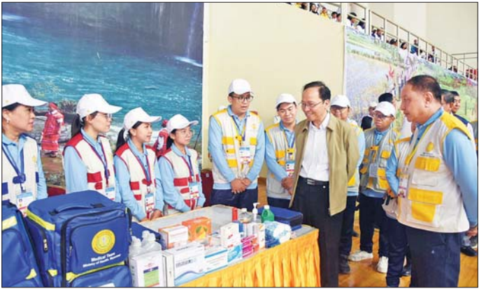
စောင့်ရှောက်မှုလုပ်ငန်း၌ အသုံးပြုသည့် လူနာတင်ယာဉ်များတွင် ထိခိုက်ဒဏ်ရာလူနာများအတွက် အရေးပေါ်အသက်ကယ်ဆေးနှင့် ဆေးပစ္စည်းများ ပြည့်ဆည်းထားရှိမှုနှင့် စနစ်တကျအသုံးပြုနိုင်ရေး စီစဉ်ထားရှိမှု၊ အောက်ဆီဂျင်၊ အသက်ရှူကိရိယာ၊ လူနာအခြေအနေအလိုက် သယ်ယူပို့ဆောင်ပစ္စည်းအမျိုးမျိုး၊ အလွယ်တကူ သယ်ဆောင်နိုင်သည့် ဆေးအိတ်များကို ကြည့်ရှုစစ်ဆေးကာ လိုအပ်ချက်နှင့်အညီ လွယ်လင့်တကူ အသုံးပြုနိုင်ရေး စီစဉ်ထားရှိရန် မှာကြားသည်။ ၂၀၂၄ ခုနှစ် ပဉ္စမအကြိမ် အမျိုးသားအားကစားပွဲတော်အောင်မြင်စွာ ကျင်းပနိုင်ရေးအတွက် ကျန်းမာရေးစောင့်ရှောက်မှုလုပ်ငန်းများ လစ်ဟင်းမှုမရှိစေရေး ဆေးကုသရေးလုပ်ငန်းအဖွဲ့၊ ရေကောင်းရေးလုပ်ငန်းအဖွဲ့နှင့် အစားအစာကြီးကြပ်မှုလုပ်ငန်းအဖွဲ့၊ ကူးစက်ရောဂါနှိမ်နင်းရေးနှင့် ပတ်ဝန်းကျင်သန့်ရှင်း

နေပြည်တော် ဒီဇင်ဘာ ၈ ကျန်းမာရေးဝန်ကြီးဌာန ပြည်ထောင်စုဝန်ကြီး ပါမောက္ခ ခေါက်တာသက်ခိုင်ဝင်းသည် ပဉ္စမအကြိမ် အမျိုးသားအားကစားပွဲတော် ဖွင့်ပွဲ/ပိတ်ပွဲ အခမ်းအနားများတွင် ပါဝင်ချိတ်ကပ်မည့် ကျန်းမာရေးဝန်ထမ်းများ၊ အားကစားပြိုင်ပွဲများတွင် ပါဝင်ယှဉ်ပြိုင်မည့် ကျန်းမာရေးဝန်ကြီးဌာန ကိုယ်စားပြုအားကစားသမားများ၊ အုပ်ချုပ်သူများ၊ ကျန်းမာရေးစောင့်ရှောက်မှုပေးမည့်သူများကို ယနေ့ နံနက်ပိုင်းတွင် ကျန်းမာရေးဝန်ကြီးဌာန အစည်းအဝေးခန်းမ၌ ရင်းရင်းနှီးနှီးနှုတ်ဆက်ကာ အားပေးစကားပြောကြားသည်။ ဦးစွာ ပြည်ထောင်စုဝန်ကြီးက ဖွင့်ပွဲ/ပိတ်ပွဲအခမ်းအနားများတွင် စနစ်တကျ ဖျော်ရွှင်စွာ ပါဝင်ဆောင်ရွက်ရေး၊ ပြိုင်ပွဲဝင်အားကစားသမားများအားလုံး ကျန်းမာရေးကောင်းမွန်စေရန် အစားအသောက်/အနေအထိုင်အထူးဂရုပြုဆောင်ရွက်ရေး၊ အားကစားစိတ်ဓာတ်အပြည့်အဝဖြင့် ယှဉ်ပြိုင်နိုင်ရေး၊ ပါဝင်ဆောင်ရွက်ခွင့်ရရှိသည့်အခွင့်အရေးမှအတွေ့အကြုံကောင်းများရယူရေး မှာကြားသည်။ ဆက်လက်၍ ပြည်ထောင်စုဝန်ကြီးနှင့်အဖွဲ့သည် အမျိုးသားအားကစားပွဲတော် ပါဝင်ယှဉ်ပြိုင်ကြမည့် အားကစားသမားများအတွက် ကျန်းမာရေး