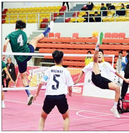
ပြည်နယ်နှင့်တိုင်းဒေသကြီး အမျိုးသမီးပိုက်ကော့စ်ပြိုင်ပွဲတွင် မွန်ပြည်နယ်အသင်းနှင့် မကွေးတိုင်းဒေသကြီးအသင်းတို့ ယှဉ်ပြိုင်ကြစဉ်။