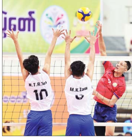
အမျိုးသားဘော်လီဘောပြိုင်ပွဲတွင် ကရင်ပြည်နယ်အသင်းနှင့်ရန်ကုန် တိုင်းဒေသကြီးအသင်းတို့ ယှဉ်ပြိုင်ကြစဉ်။