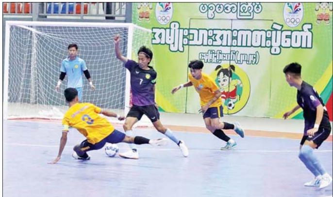
ပြည်နယ်နှင့် တိုင်းဒေသကြီး အမျိုးသားဖူဆယ်ဘောလုံးပြိုင်ပွဲ အုပ်စုပွဲစဉ်တွင် ပညာရေးဝန်ကြီးဌာနအသင်းနှင့် ပြန်ကြားရေးဝန်ကြီးဌာနအသင်းတို့ ယှဉ်ပြိုင်ကစားစဉ်။

ကြည့်ရှုအားပေး ယနေ့ကျင်းပသည့်အားကစားပြိုင်ပွဲများသို့ ပြည်ထောင်စုအဆင့်ပုဂ္ဂိုလ်များ၊ ဒုတိယဝန်ကြီးများ၊ တိုင်းဒေသကြီးနှင့်ပြည်နယ်အစိုးရအဖွဲ့ဝန်ကြီးများ၊ ဌာနဆိုင်ရာများ၊ အားကစားနည်းအလိုက် အဖွဲ့ချုပ်များမှ တာဝန်ရှိသူများ၊ ဝန်ထမ်းများ၊ ကျောင်းသားကျောင်းသူများနှင့် အားကစားဝါသနာရှင်ပြည်သူများ စိတ်ပါဝင်စားစွာ လာရောက်ကြည့်ရှုအားပေးခဲ့ကြသည်။