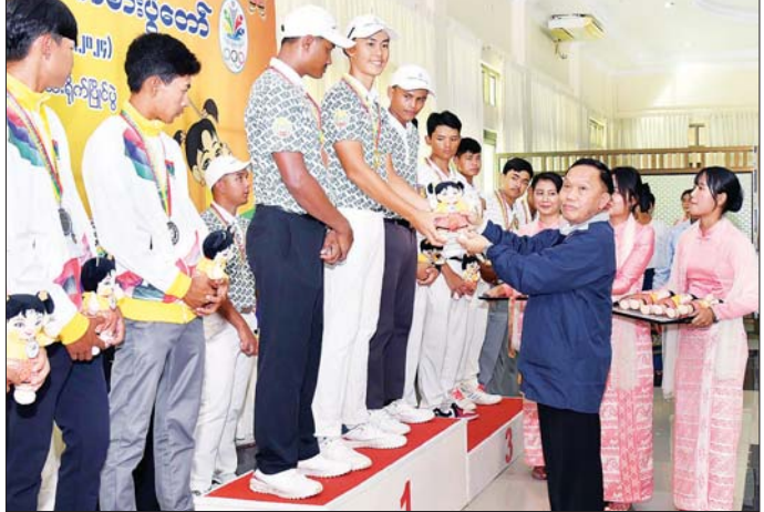
နိုင်ငံတော်စီမံအုပ်ချုပ်ရေးကောင်စီအဖွဲ့ဝင် ဦးရွှေကြမ်း ဂေါက်သီးရိုက်ပြိုင်ပွဲ အသင်းလိုက်(အကျောမဲ့) ပြိုင်ပွဲတွင် ပထမဆုရ ရန်ကုန်တိုင်းဒေသကြီးမှ ပြိုင်ပွဲဝင်များအား ဂုဏ်ပြုဆုတံဆိပ်နှင့် အမျိုးသား အားကစားပွဲတော်အထိမ်းအမှတ်အရပ် ပေးအပ်ချီးမြှင့်စဉ်။