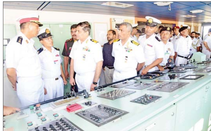
အိန္ဒိယနိုင်ငံ Naval War College (NWC)မှ ဒုတိယကျောင်းအုပ်ကြီး Commodore Prashant Chandrasekharan ဦးဆောင်သော အရာရှိကြီးများအဖွဲ့ နေပြည်တော်ရှိ တပ်မတော်စစ်သမိုင်းပြတိုက်နှင့် စစ်ဗေယာဉ် (မေယု)သို့ သွားရောက်လေ့လာကြစဉ်။