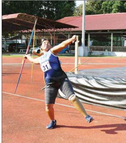
အမျိုးသမီး လှံတံပစ်ပြိုင်ပွဲတွင် ပြိုင်ပွဲဝင်တစ်ဦး ဝင်ရောက် ယှဉ်ပြိုင်စဉ်။