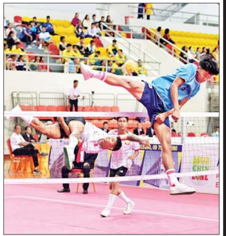
ပြည်နယ်နှင့်တိုင်းဒေသကြီး အမျိုးသားပိုက်ကော့စ်ပြိုင်ပွဲတွင် ရှမ်းပြည်နယ်အသင်းနှင့် ပဲခူးတိုင်းဒေသကြီးအသင်းတို့ ယှဉ်ပြိုင်ကြစဉ်။