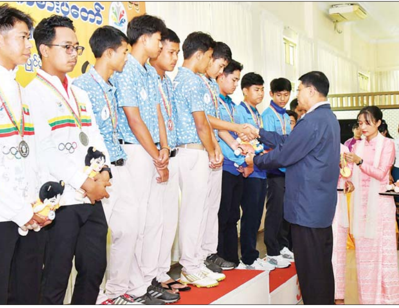
နိုင်ငံတော်စီမံအုပ်ချုပ်ရေးကောင်စီအဖွဲ့ဝင် ဒုတိယဝန်ကြီးချုပ်နှင့် ပြည်ထောင်စုဝန်ကြီး ဗိုလ်ချုပ်ကြီး မြထွန်းဦး ဂေါက်သီးရိုက် ပြိုင်ပွဲ အသင်းလိုက် (အကျောပေး)ပြိုင်ပွဲတွင် ပထမဆုရ ပြည်ထောင်စုနယ်မြေ နေပြည်တော်မှ ပြိုင်ပွဲဝင်များအား ဂုဏ်ပြု ဆုတံဆိပ်နှင့် အမျိုးသားအားကစားပွဲတော် အထိမ်းအမှတ်အရပ် ပေးအပ်ချီးမြှင့်စဉ်။

ယင်းနောက် မသန်စွမ်းပြေးခုန်ပစ် ပြိုင်ပွဲ ဆုချီးမြှင့်ပွဲအခမ်းအနားကို ဆက်လက်ကျင်းပရာ ရော့တီတိုင်းဒေသ ကြီးအစိုးရအဖွဲ့ လူမှုရေးရာဝန်ကြီး ဦးခင်မောင်ကြည်က အမျိုးသားသံလုံးပစ် F62/63 ပြိုင်ပွဲတွင် ပထမဆုရရှိသည့် ပဲခူးတိုင်းဒေသကြီး၊ ဒုတိယဆုရရှိသည့် မန္တလေးတိုင်းဒေသကြီးနှင့် တတိယဆု ရရှိသည့် မွန်ပြည်နယ်အသင်းတို့မှ ပြိုင်ပွဲ ဝင်များကိုလည်းကောင်း၊ ပဲခူးတိုင်းဒေသ ကြီးအစိုးရအဖွဲ့ လူမှုရေးရာဝန်ကြီး ဦးမျိုးအောင်က အမျိုးသားလှံပစ် F56/57 ပြိုင်ပွဲတွင် ပထမဆုရရှိသည့် ဧရာဝတီတိုင်းဒေသကြီး၊ ဒုတိယဆုရရှိ သည့် မွန်ပြည်နယ်နှင့် တတိယဆုရရှိ သည့် ရန်ကုန်တိုင်းဒေသကြီးအသင်းတို့မှ ပြိုင်ပွဲဝင်များကိုလည်းကောင်း၊ ဂုဏ်ပြုဆု တံဆိပ်နှင့် အမျိုးသားအားကစားပွဲတော် အထိမ်းအမှတ်အရပ်အား ပေးအပ်ချီးမြှင့် ကြသည်။