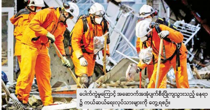
ပေါက်ကွဲမှုကြောင့် အဆောက်အအုံပျက်စီးပြိုကျသွားသည့် နေရာ၌ ကယ်ဆယ်ရေးလုပ်သားများကို တွေ့ရစဉ်။

သည်ဟိတ် ဒီဇင်ဘာ ၈ နယ်သာလန်နိုင်ငံ၌ ဒီဇင်ဘာ ၇ ရက်က အင်အားပြင်းထန်သည့် ပေါက်ကွဲမှုဖြစ်ပွားခဲ့ပြီး အဆောက် အအုံ တစ်စိတ်တစ်ပိုင်း ပြိုကျခဲ့ရာ အပျက်အစီးများအောက်မှ လူသေ လောင်းငါးလောင်းကို တွေ့ရှိခဲ့ သည်ဟု နယ်သာလန်အာဏာပိုင် များက ပြောသည်။ နောက်ထပ် ထိခိုက်ခံစားရသူ များကို ကယ်ဆယ်နိုင်ရေး ရှာဖွေ မှုများ ဆက်လက်ပြုလုပ်နေကြ သည်။ သေဆုံးသွားခဲ့ပြီး ရေမှာ ၂၀ ဝန်းကျင်အထိ ရှိလာနိုင်ကြောင်း အရေးပေါ်ကယ်ဆယ်ရေးဌာနက သတိပေးထားသည်။ အသက်ရှင်လျက် ပြန်လည် တွေ့ရှိနိုင်သည့် အလားအလာမှာ အလွန်နည်းပါးကြောင်း သိရ သည်။ အဆိုးဆုံးအခြေအနေ အတွက် ပြင်ဆင်ထားကြောင်း မြို့တော်ဝန် ဂျန်ဗန်ဇန်နီက ပြောသည်။ ကနဦး ကယ်တင်နိုင်ခဲ့သည့် နှစ်ဦးမှာလည်း စိုးရိမ်ရသည့်အခြေ အနေတွင်ရှိသည်ဟု မြို့တော်ဝန် က ပြောသည်။ နယ်သာလန်