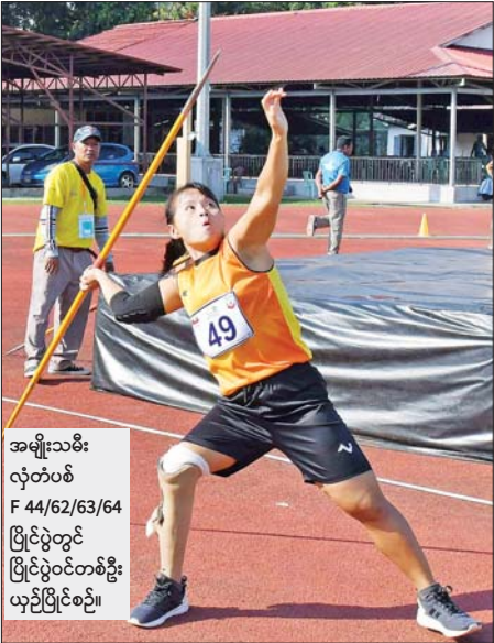
အမျိုးသမီး လှုပ်တစ် F 44/62/63/64 ပြိုင်ပွဲတွင် ပြိုင်ပွဲဝင်တစ်ဦး ယှဉ်ပြိုင်စဉ်။