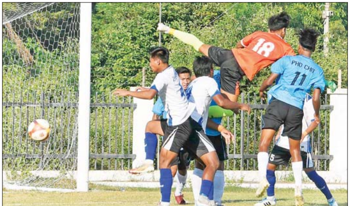
ဝန်ကြီးဌာနပေါင်းစုံ အလွတ်တန်း အမျိုးသားဘောလုံးပြိုင်ပွဲ အုပ်စုပွဲစဉ်တွင် ပို့ဆောင်ရေးနှင့် ဆက်သွယ်ရေးဝန်ကြီးဌာနအသင်းနှင့် သမဝါယမနှင့် ကျေးလက်ဖွံ့ဖြိုးရေးဝန်ကြီးဌာနအသင်းတို့ ယှဉ်ပြိုင်ကစားစဉ်။