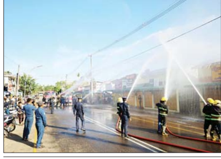
ချိန်ခါမရွေးသတိပေး မီးဘေးသတိပြု