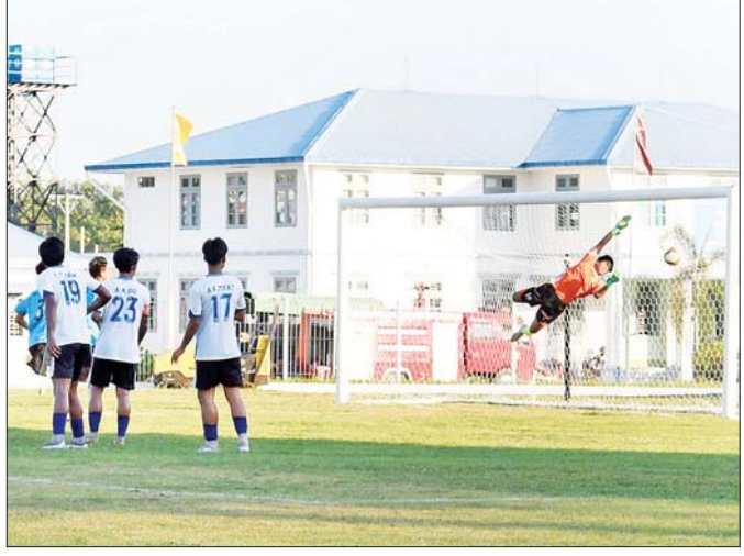
ဝန်ကြီးဌာန အမျိုးသားဘောလုံးပြိုင်ပွဲတွင် ပို့ဆောင်ရေးနှင့်ဆက်သွယ်ရေးဝန်ကြီးဌာနအသင်းနှင့် သမဝါယမနှင့်ကျေးလက်ဖွံ့ဖြိုးရေးဝန်ကြီးဌာနအသင်းတို့ ယှဉ်ပြိုင်ကြစဉ်။