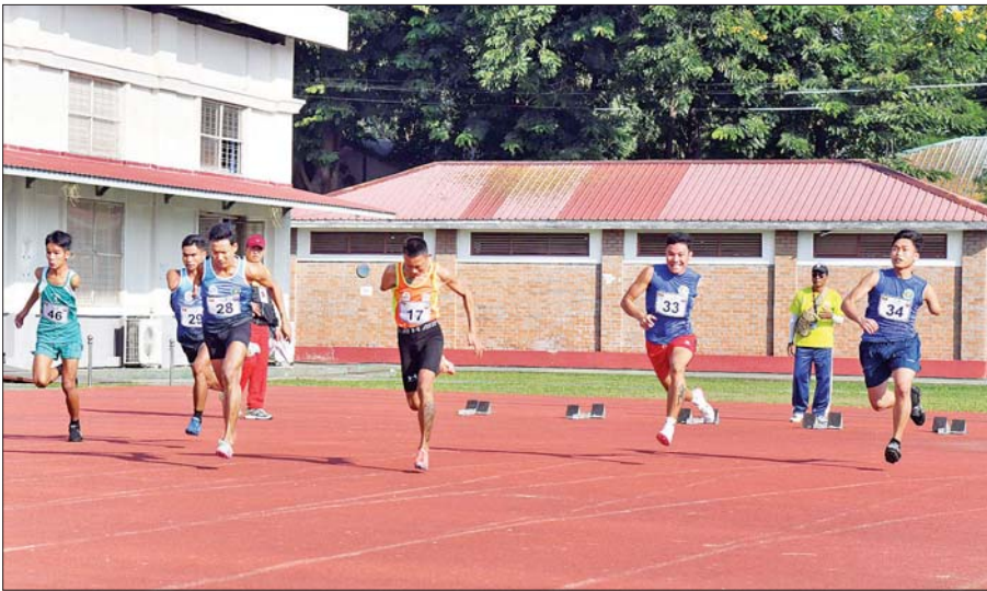
ပြည်နယ်နှင့်တိုင်းဒေသကြီး အမျိုးသား မသန်စွမ်းမီတာ (၁၀၀) အပြေးပြိုင်ပွဲတွင် ပြိုင်ပွဲဝင်အားကစားသမားများ ဝင်ရောက် ယှဉ်ပြိုင်စဉ်။