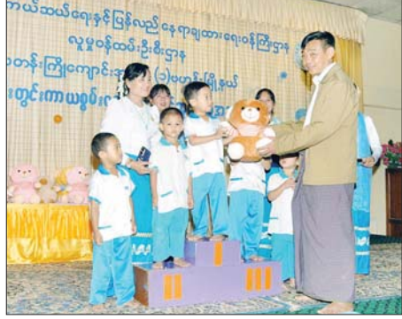
အောင်ကျော် (ပြန်/ဆက်)

ဆက်လက်၍ ရင်သွေးငယ်လေးများ၏ အကအလှဖြင့် ဖျော်ဖြေတင်ဆက်ပြီး ရင်သွေးငယ်လေးများ ကာယစွမ်းရည်ပြိုင်ပွဲကျင်းပရာ ဆုရရှိကြသူများအား တာဝန်ရှိသူများက ဆုများ ပေးအပ်ချီးမြှင့်ကြသည်။ ယင်းနောက် မိဘများပြိုင်ပွဲနှင့် ဆရာမများပြိုင်ပွဲကို ကျင်းပခဲ့ကြောင်း သိရသည်။