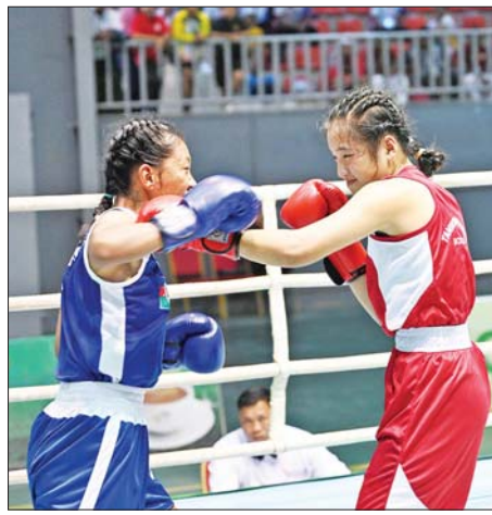
အမျိုးသမီး (၅၀) ကီလိုတန်း လက်ဝှေ့ပြိုင်ပွဲတွင် ချင်းပြည်နယ် နှင့်တနင်္သာရီတိုင်းဒေသကြီးတို့ ယှဉ်ပြိုင်ထိုးသတ်ကြစဉ်။