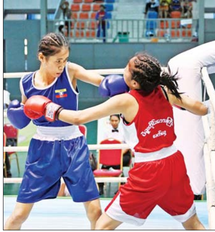
အမျိုးသမီး (၅၀) ကီလိုတန်း လက်ဝှေ့ပြိုင်ပွဲတွင် ပဲခူးတိုင်းဒေသကြီး နှင့်စစ်ကိုင်းတိုင်းဒေသကြီးတို့ ယှဉ်ပြိုင်ထိုးသတ်ကြစဉ်။