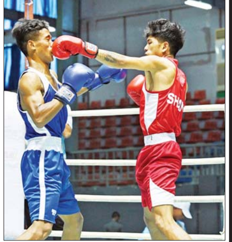
အမျိုးသား (၅၁) ကီလိုတန်း လက်ဝှေ့ပြိုင်ပွဲတွင် ရှမ်းပြည်နယ် နှင့်မန္တလေးတိုင်းဒေသကြီးတို့ ယှဉ်ပြိုင်ထိုးသတ်ကြစဉ်။