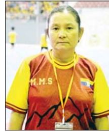
ဒေါ်မာမာစိ