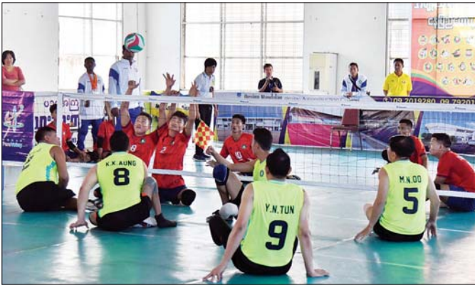
ပြည်နယ်နှင့်တိုင်းဒေသကြီး မသန်စွမ်းထိုင်လျက် ဘော်လီဘောပြိုင်ပွဲတွင် ပဲခူးတိုင်းဒေသကြီးအသင်းနှင့် ပြည်ထောင်စုနယ်မြေ နေပြည်တော်အသင်းတို့ ယှဉ်ပြိုင်ကစားကြစဉ်။