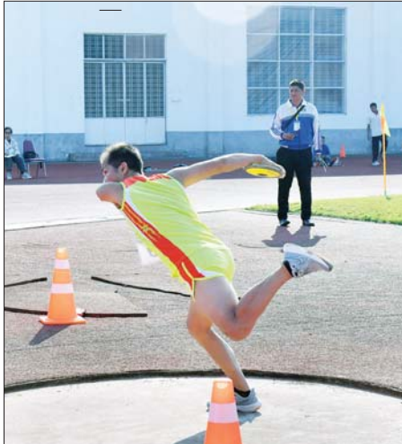
အမျိုးသား သံပြားပစ်ပြိုင်ပွဲတွင် ပြိုင်ပွဲဝင်တစ်ဦး ဝင်ရောက် ယှဉ်ပြိုင်စဉ်။