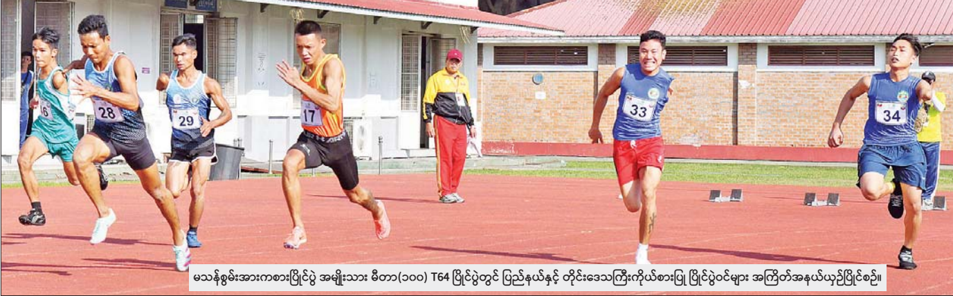
မသန်စွမ်းအားကစားပြိုင်ပွဲ အမျိုးသား မီတာ(၁၀၀) T64 ပြိုင်ပွဲတွင် ပြည်နယ်နှင့် တိုင်းဒေသကြီးကိုယ်စားပြု ပြိုင်ပွဲဝင်များ အကြိတ်အနယ်ယှဉ်ပြိုင်စဉ်။

နေပြည်တော် ဒီဇင်ဘာ ၈ ၂၀၂၄ ခုနှစ် ပဉ္စမအကြိမ် အမျိုးသား အားကစားပွဲတော် ပြည်နယ်နှင့်တိုင်းဒေသ ကြီးအဆင့်ပြိုင်ပွဲများနှင့် မသန်စွမ်းအားကစား ပြိုင်ပွဲ ဗိုလ်လုပွဲနှင့် ဆုပေးပွဲအခမ်းအနားများ ကို ယနေ့တွင် နေပြည်တော်ရှိ သက်ဆိုင်ရာ အားကစားကွင်းနှင့် အားကစားရုံများ၌ ကျင်းပ ရာ နိုင်ငံတော်စီမံအုပ်ချုပ်ရေးကောင်စီဝင်များ တက်ရောက်ကြည့်ရှုအားပေးပြီး ဆုများ ချီးမြှင့် ကြသည်။ ဦးစွာ ၂၀၂၄ ခုနှစ် ပဉ္စမအကြိမ် အမျိုးသား အားကစားပွဲတော် ပြည်နယ်နှင့်တိုင်းဒေသကြီး အဆင့် ဂေါက်သီးရိုက်ပြိုင်ပွဲ ဆုပေးပွဲအခမ်း အနားကို ယနေ့မွန်းလွဲပိုင်းတွင် နေပြည်တော် ရှိ မြို့တော်ဂေါက်ကွင်း၌ ကျင်းပသည်။ အဆိုပါအခမ်းအနားသို့ နိုင်ငံတော်စီမံ အုပ်ချုပ်ရေးကောင်စီအဖွဲ့ဝင်၊ ဒုတိယဝန်ကြီး ချုပ်နှင့် ပို့ဆောင်ရေးနှင့် ဆက်သွယ်ရေးဝန်ကြီး ဌာန ပြည်ထောင်စုဝန်ကြီး ဗိုလ်ချုပ်ကြီး မြထွန်းဦး၊ ကောင်စီအဖွဲ့ဝင်များဖြစ်ကြသည့် ဦးရွှေကြိမ်းနှင့် ဦးရန်ကျော်၊ နိုင်ငံတော်စီမံ အုပ်ချုပ်ရေးကောင်စီဥက္ကဋ္ဌရုံးဝန်ကြီးဌာန (၄) ပြည်ထောင်စုဝန်ကြီး ဦးအောင်ကျော်ဟိုးနှင့် အားကစားနှင့် လူငယ်ရေးရာဝန်ကြီးဌာန ပြည်ထောင်စုဝန်ကြီး ဦးမင်းသိန်း၊ ဒုတိယ ဝန်ကြီးများ၊ မြန်မာနိုင်ငံဂေါက်သီးအားကစား အဖွဲ့ချုပ်မှ တာဝန်ရှိသူများ၊ ပြိုင်ပွဲဝင်အသင်း များမှ အုပ်ချုပ်သူ၊ နည်းပြများနှင့် အားကစား သမားများ တက်ရောက်ကြသည်။ အခမ်းအနားတွင် ပြည်ထောင်စုဝန်ကြီး ဦးအောင်ကျော်ဟိုးက အမျိုးသားတစ်ဦးချင်း (အကျောမဲ့) ပြိုင်ပွဲတွင် ပထမဆုရရှိသည့် မန္တလေးတိုင်းဒေသကြီး၊ ဒုတိယဆုရရှိသည့် တနင်္သာရီတိုင်းဒေသကြီးနှင့် တတိယဆုရရှိ သည့် ရန်ကင်းတိုင်းဒေသကြီးအသင်းတို့မှ စာမျက်နှာ ၃ ကော်လံ ၁ ❖