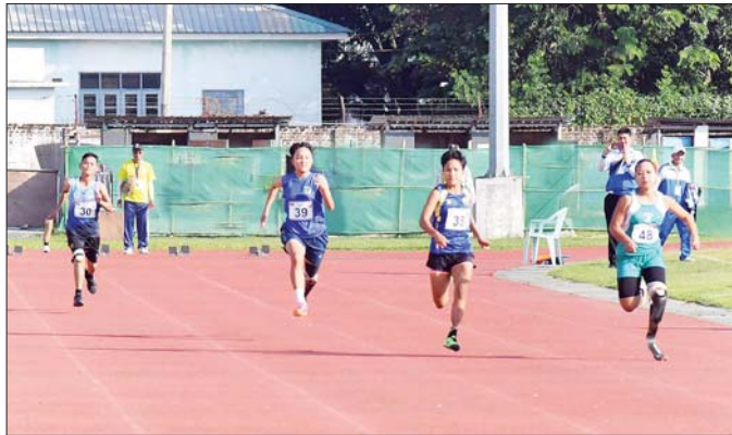
ပြည်နယ်နှင့်တိုင်းဒေသကြီး အမျိုးသမီး မသန်စွမ်းမီတာ(၁၀၀) အပြေးပြိုင်ပွဲတွင် ပြိုင်ပွဲဝင်အားကစား သမားများ ဝင်ရောက်ယှဉ်ပြိုင်စဉ်။