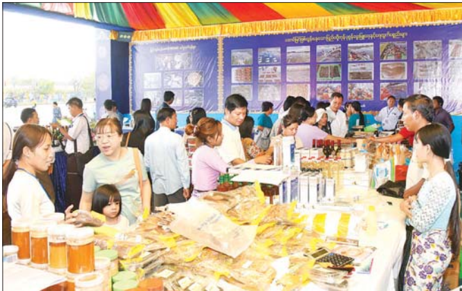
MSMEs ထုတ်ကုန်ပြခန်းအချို့အား တွေ့ရစဉ်။

နိုင်ငံဝင်ငွေ ပိုမိုတိုးတက်ရရှိစေရေး ကမ္ဘာ့နိုင်ငံများရှိ အစိုးရများအနေဖြင့်လည်း မက်ခရိုစီးပွားရေးတည်ငြိမ်မှုကို ခြိမ်းခြောက်လာသည့် တရားမဝင်ကုန်သွယ်မှုများကို ပပျောက်စေရန် အထူးအာရုံစိုက် ဆောင်ရွက်လာကြသည်ကို တွေ့ရှိရပါသည်။ မြန်မာနိုင်ငံအနေဖြင့် ပြည်တွင်း လိုအပ်ချက်များ ဖြည့်ဆည်းဆောင်ရွက်ရာတွင် နိုင်ငံအတွင်း MSMEs နှင့် စက်မှုဇုန်များက သွင်းကုန်အစားထိုးထုတ်ကုန်များ ပိုမိုထုတ်လုပ်ရန်၊ နိုင်ငံဝင်ငွေနှင့် သုံးစွဲငွေမျှတရန်အတွက် ပို့ကုန် တင်ပို့မှု ပိုမိုအားကောင်းစေရန်နှင့် ကုန်ကြမ်းပစ္စည်းများ တင်ပို့ခြင်းထက် စက်မှုထုတ်ကုန်တစ်ခုနည်းအားဖြင့် Value Added ကုန်ချောပစ္စည်းများ တင်ပို့ခြင်းဖြင့် နိုင်ငံဝင်ငွေ ပိုမိုတိုးတက်ရရှိစေရေး ဆောင်ရွက်လျက်ရှိပါသည်။