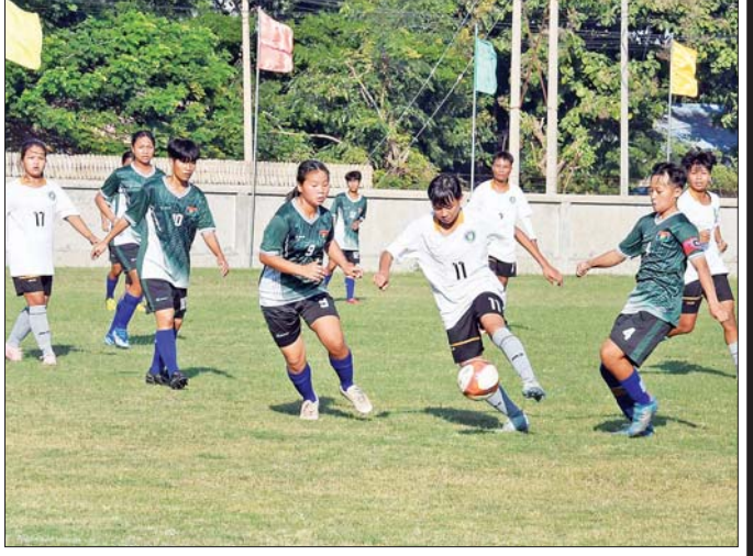
ပြည်နယ်နှင့်တိုင်းဒေသကြီး အမျိုးသမီးဘောလုံးပြိုင်ပွဲတွင် ပဲခူးတိုင်းဒေသကြီးအသင်းနှင့် ကယားပြည်နယ် အသင်းတို့ ယှဉ်ပြိုင်ကစားကြစဉ်။