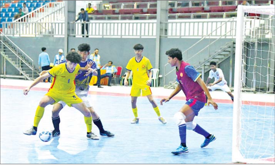
ပဉ္စမအကြိမ် အမျိုးသားအားကစားပွဲတော် ပြည်နယ်နှင့် တိုင်းဒေသကြီး အမျိုးသား ဖူဆယ်ပြိုင်ပွဲတွင် မွန်ပြည်နယ်အသင်းနှင့် စစ်ကိုင်းတိုင်းဒေသကြီးအသင်းတို့ ယှဉ်ပြိုင်ကစားကြစဉ်။

မည်သည့်အားကစားနည်းမဆို ကိုယ်တွင်းမှ ထွက်ရှိလာသည့် endorphin ဟော်မုန်းတစ်မျိုးကြောင့် အားကစားသမားများမှာ စိုးရိမ်သောကစိတ်ဓာတ်ကျဝေဒနာများ လျော့ပါးသွားသည့်အတွက် အားကစားကို ကျန်းမာရေးကုထုံးတစ်ခုအသွင် အသုံးချသင့်သည်ဟု နားလည်လာသည်။ မကြာမီကျင်းပတော့မည့် အမျိုးသားအားကစားပြိုင်ပွဲကြီးကို ဝန်ကြီးဌာနအဆင့်၊ ပြည်နယ်နှင့် တိုင်းဒေသကြီးအဆင့် နှစ်ဆင့်ကျင်းပမည်ဖြစ်ရာ ဝန်ကြီးဌာနအဆင့်တွင် ပြေးခုန်ပစ်၊ ဘောလုံး၊ ဖူဆယ်၊ ဂေါက်သီး၊ ပိုက်ကျော်ခြင်းနှင့် ဘော်လီဘောကစားနည်း ခြောက်မျိုး၊ ပြည်နယ်နှင့် တိုင်းဒေသကြီးအဆင့်တွင် ၎င်းခြောက်မျိုးအပါအဝင် ဘတ်စကက်ဘော၊ ကြက်တောင်၊ ဘီလီယက်၊ စနူကာ၊ လက်ဝှေ့၊ ကာယဗလ၊ ခရစ်ကက်၊ ဂျူဒို၊ ကရာတေး၊ ရေကူး၊ စားပွဲတင်တင်းနစ်၊ တိုက်ကွမ်ဒို၊ တင်းနစ်၊ ရိုးရာခြင်းလုံး၊ မြန်မာ့သိုင်း၊ ဗိုဗီနမ်၊ အလေးမနှင့် ဝူရှူးကစားနည်းပေါင်း ၂၃ မျိုး ပါဝင်မည်ဖြစ်ပါသည်။ အထက်ပါအားကစားနည်းအားလုံးသည် ကစားနည်းတစ်မျိုးချင်းအလိုက် ရုပ်ပိုင်း၊ စိတ်ပိုင်းနှစ်ခုလုံး ကျန်းမာကြံ့ခိုင်သန်စွမ်းမှုများစွာကိုပေးသော အားကစားနည်းများဖြစ်ကြသည်။ သို့ဖြစ်၍ ကစားနည်းအလိုက် အကျိုးကျေးဇူးများ မည်သို့ရရှိ၍ မည်သို့အကျိုးဖြစ်ထွန်းကြောင်း အားကစားတစ်ခုချင်း၏ အနစ်သာရများကို ဤနေရာကနေ ရေးသားဖော်ပြလိုပါသည်။