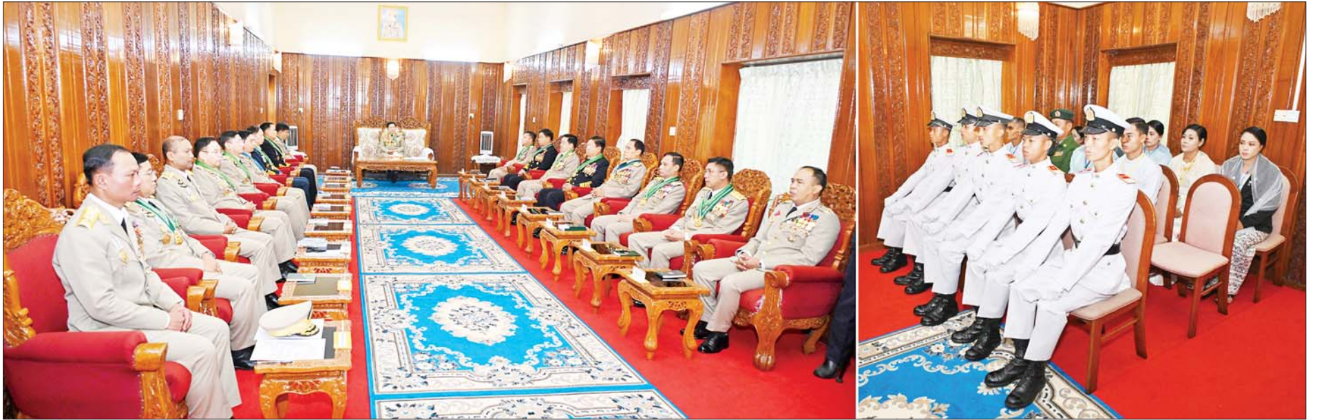
နိုင်ငံတော်စီမံအုပ်ချုပ်ရေးကောင်စီဥက္ကဋ္ဌ တပ်မတော်ကာကွယ်ရေးဦးစီးချုပ် ဗိုလ်ချုပ်မှူးကြီး သတိုးမဟာသရေစည်သူ သတိုးသိရိသုဓမ္မ မင်းအောင်လှိုင် ထူးချွန်ဆုရရှိကြသည့် ဗိုလ်လောင်းငါးဦးနှင့် ၎င်းတို့၏ မိဘဆွေမျိုးများအား တွေ့ဆုံ၍ ဂုဏ်ပြုအမှာစကားပြောကြားစဉ်။

»» စာမျက်နှာ ၅ မှ သတိုးမဟာသရေစည်သူ သတိုးသိရိသုဓမ္မ မင်းအောင်လှိုင်သည် စစ်တက္ကသိုလ်ကျောင်း ဌာနချုပ် ဧည့်ခန်းမ၌ ထူးချွန်ဆု ရရှိကြသည့် ဗိုလ်လောင်းငါးဦးနှင့် ၎င်းတို့၏ မိဘဆွေမျိုးများအား တွေ့ဆုံ၍ ဂုဏ်ပြုအမှာစကား ပြောကြားသည်။ ဂုဏ်ပြုအမှာစကားပြောကြား ရာတွင် သင်တန်းတက်ရောက်ရ သည့် လေးနှစ်တာ ကာလ တစ်လျှောက်လုံး စာပေကဏ္ဍ၊ လေ့ကျင့်ရေး ကဏ္ဍတို့တွင် စဉ်ဆက်မပြတ် ကြိုးစားအားထုတ် ခဲ့မှု၊ စည်းကမ်းကောင်းမွန်မှုတို့ ကြောင့် ယခုကဲ့သို့ ထူးချွန်ဆုများ ရရှိခဲ့ကြခြင်းဖြစ်သဖြင့် ချီးကျူး အသိအမှတ်ပြုကြောင်းနှင့် မိဘ များနှင့်ထပ်တူ ဂုဏ်ယူဝမ်းမြောက် ပါကြောင်း၊ ဆက်လက် လျှောက်လှမ်းရမည့် ဘဝခရီး တစ်လျှောက်တွင်လည်း မိဘများ၊ ဆရာ ဆရာမများက သွန်သင် ပဲ့ပြင်ပေးခဲ့သည့် အခြေခံကောင်း များ၊ ယခုသင်တန်းမှ ရရှိခဲ့သည့် မိမိဘဝ တိုးတက်မှုရှိစေရေး ကြိုးစားအားထုတ်နိုင်မှု၊ မိမိ