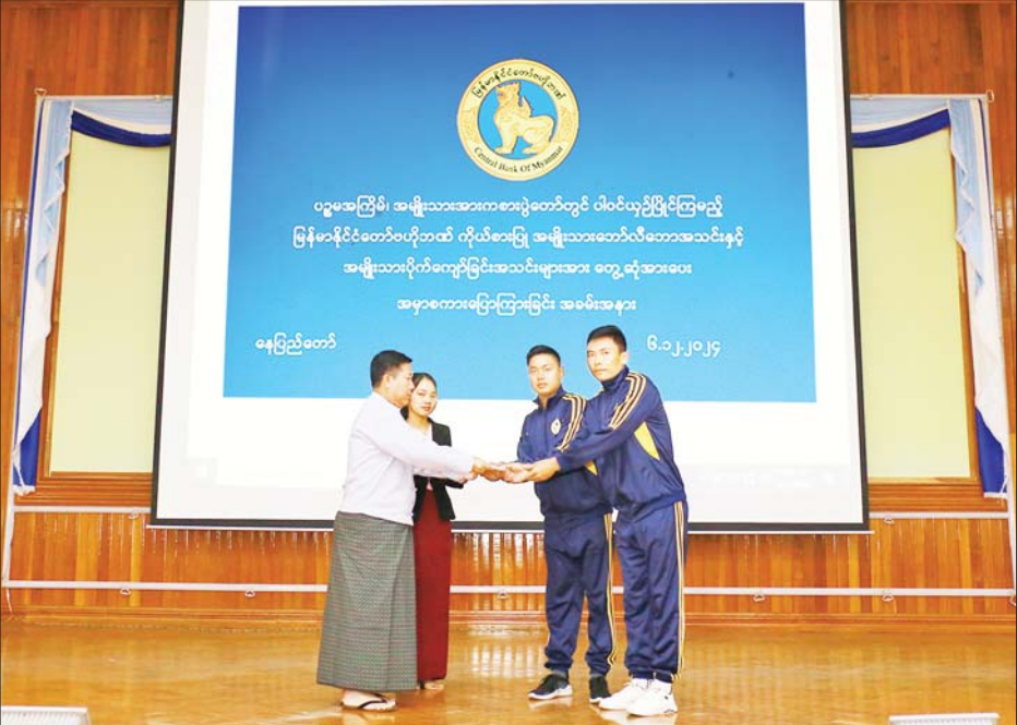
ချီးမြှင့်သည်။ နိုင်ငံ တော်ဗဟိုဘဏ်အနေဖြင့် အသင်းတို့ ပါဝင်ယှဉ်ပြိုင်သွားမည်ဖြစ်ကြောင်း သိရသည်။ သတင်းစဉ်

ဦးစွာ ဒုတိယဥက္ကဋ္ဌက ပဉ္စမအကြိမ် အမျိုးသားအားကစားပွဲတော်၌ ပါဝင်ယှဉ်ပြိုင်ကြမည့် အားကစားသမားများကို လိုအပ်သည်များမှာကြား၍ အားပေးစကားပြောကြားပြီး အားကစားအသင်းအလိုက် အသင်းခေါင်းဆောင်များနှင့် တာဝန်ရှိသူများကို ထောက်ပံ့ပေးအပ်