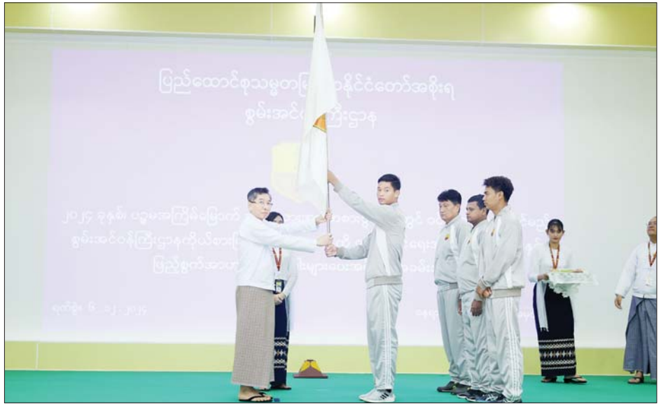
ဌာနကိုယ်စားပြု အားကစားအဖွဲ့များမှ အုပ်ချုပ် ကြကြောင်း သိရသည်။ သူများ၊ နည်းပြများနှင့်တာဝန်ရှိသူများ တက်ရောက် သတင်းစဉ်

အခမ်းအနားသို့ စွမ်းအင်ဝန်ကြီးဌာန ပြည်ထောင်စုဝန်ကြီးရုံးနှင့် ဝန်ကြီးဌာနကြီးကြပ်မှု အောက်ရှိ ဦးစီးဌာန/လုပ်ငန်းများမှ စွမ်းအင်ဝန်ကြီး