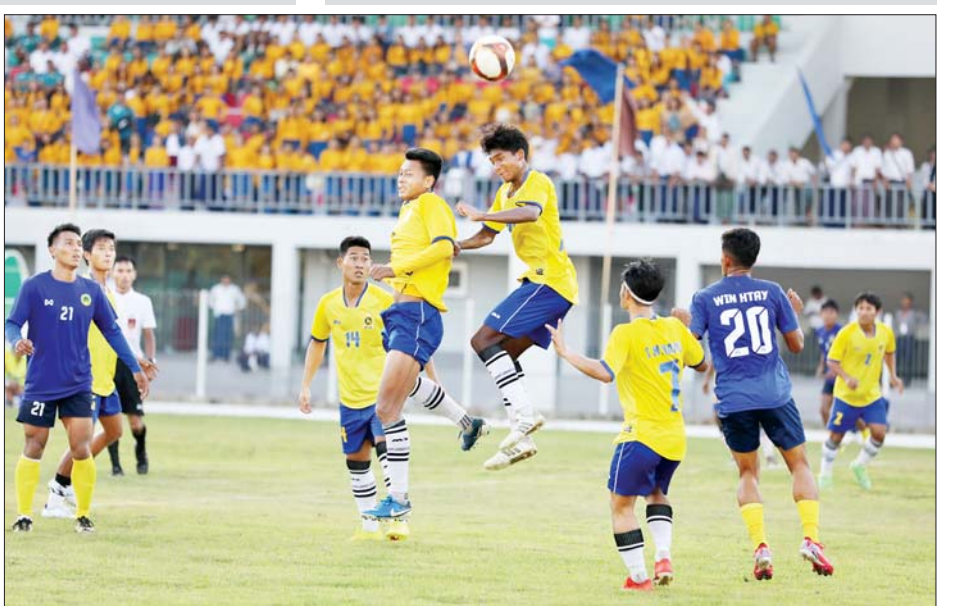
ဝန်ကြီးဌာနပေါင်းစုံ အလွတ်တန်း အမျိုးသားဘောလုံးပြိုင်ပွဲတွင် စီမံကိန်းနှင့်ဘဏ္ဍာရေးဝန်ကြီးဌာန အသင်းနှင့် ဆောက်လုပ်ရေးဝန်ကြီးဌာနအသင်းတို့ ယှဉ်ပြိုင်ကစားကြစဉ်။

ရန်ကုန်တိုင်းဒေသကြီးအသင်းက ကချင်ပြည်နယ်အသင်းကို သုံးပွဲ ပြတ်၊ ဧရာဝတီတိုင်းဒေသကြီး အသင်းက စစ်ကိုင်းတိုင်းဒေသကြီး အသင်းကို သုံးပွဲနှစ်ပွဲ ရှမ်းပြည်နယ် အသင်းက မကွေးတိုင်းဒေသကြီး အသင်းကို သုံးပွဲပြတ်၊ မန္တလေး တိုင်းဒေသကြီး အသင်းက ပြည်ထောင်စုနယ်မြေ နေပြည် တော်အသင်းကို သုံးပွဲပြတ်၊ ပဲခူး တိုင်းဒေသကြီးအသင်းက ကရင် ပြည်နယ်အသင်းကို သုံးပွဲပြတ်၊ ကယားပြည်နယ်အသင်းက မွန် ပြည်နယ်အသင်းကို သုံးပွဲ နှစ်ပွဲ ဖြင့်လည်းကောင်း၊ အမျိုးသမီး ကြက်တောင်ရိုက် ပြိုင်ပွဲတွင် ရန်ကုန်တိုင်းဒေသကြီးအသင်းက မွန်ပြည်နယ်အသင်းကို သုံးပွဲပြတ်၊ မန္တလေးတိုင်း ဒေသကြီးအသင်းက စစ်ကိုင်းတိုင်းဒေသကြီးအသင်းကို သုံးပွဲပြတ်၊ ပဲခူးတိုင်းဒေသကြီး အသင်းက ပြည်ထောင်စုနယ်မြေ နေပြည်တော်အသင်းကို သုံးပွဲပြတ်၊ ရှမ်းပြည်နယ်အသင်းက တနင်္သာရီ တိုင်းဒေသကြီးအသင်းကို သုံးပွဲ