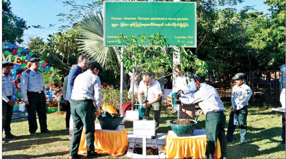
ရုရှားဖက်ဒရေးရှင်းနိုင်ငံ ဒူးမားလွတ်တော်ဒုတိယဥက္ကဋ္ဌ H.E.Mr. Sholban Kara-Ool ငွေဆောင်မြို့ အဝင်၌ ပြုလုပ်သည့် ရုရှား-မြန်မာ ချစ်ကြည်ရေးအထိမ်းအမှတ် သစ်ပင်စိုက်ပျိုးပွဲ။

ဦးတင်မောင်ဝင်း၊ အစိုးရအဖွဲ့ဝင်ဝန်ကြီးများ၊ တာဝန်ရှိသူများနှင့် ကျောင်းသား ကျောင်းသူများက ဒေသထွက်အမှတ်တရလက်ဆောင် ပစ္စည်းများ ပေးအပ်ကာ ပုသိမ်လေဆိပ်၌ ပို့ဆောင်နှုတ်ဆက်ကြကြောင်း သိရသည်။ သတင်းစဉ်