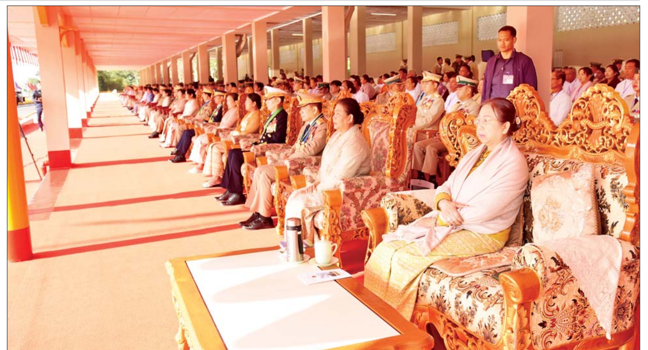
စစ်တက္ကသိုလ်ဗိုလ်လောင်းသင်တန်း အမှတ်စဉ်(၆၆) သင်တန်းဆင်းဂုဏ်ပြုစစ်ရေးပြအခမ်းအနားသို့ တက်ရောက်လာကြသူများကို တွေ့ရစဉ်။

ကိုယ်ကို ထိန်းသိမ်းနိုင်မှု၊ စည်းကမ်း ကောင်းမွန်မှု စသည့် အခြေခံ အလေ့အကျင့်ကောင်းများကို ဆက်လက်ထိန်းသိမ်းပြီး စဉ်ဆက် မပြတ် ဆက်လက်ကြိုးစား အားထုတ် သွားကြရမည် ဖြစ်ကြောင်း၊ ယနေ့ခေတ်သည် နည်းပညာများ စဉ်ဆက်မပြတ် ပြောင်းလဲ တိုးတက်နေသည့် အတွက် မိမိတို့ဘဝတိုးတက်ရေး အတွက် အထောက်အကူဖြစ်စေ မည့် အသိပညာ၊ အတတ်ပညာ များကို စဉ်ဆက်မပြတ် ဖတ်မှတ် လေ့လာခြင်းဖြင့် ဆက်လက် ဆည်းပူးလေ့လာပြီး နိုင်ငံတော် နှင့် တပ်မတော်က အားထားရပြီး လက်အောက်က အားကိုးရသူများ ဖြစ်အောင် ဆက်လက်ကြိုးပမ်း သွားကြစေလိုကြောင်း။ ယခုကဲ့သို့ ထူးချွန်ထက်မြက်သူ များဖြစ်လာစေရေး ငယ်စဉ် ကတည်းက ကျွေးမွေးပြုစု ပျိုးထောင်ပေးခဲ့သည့် မိဘများ၏ ကျေးဇူးများ၊ အသိပညာများရရှိ စေရေး သင်ကြားပေးခဲ့သည့် ဆရာ ဆရာမများ၏ ကျေးဇူးများ ကို သိတတ်ရန်နှင့် ကျေးဇူးဆပ်ရန် လိုအပ်မည်ဖြစ်ကြောင်း၊ ထို့အတူ