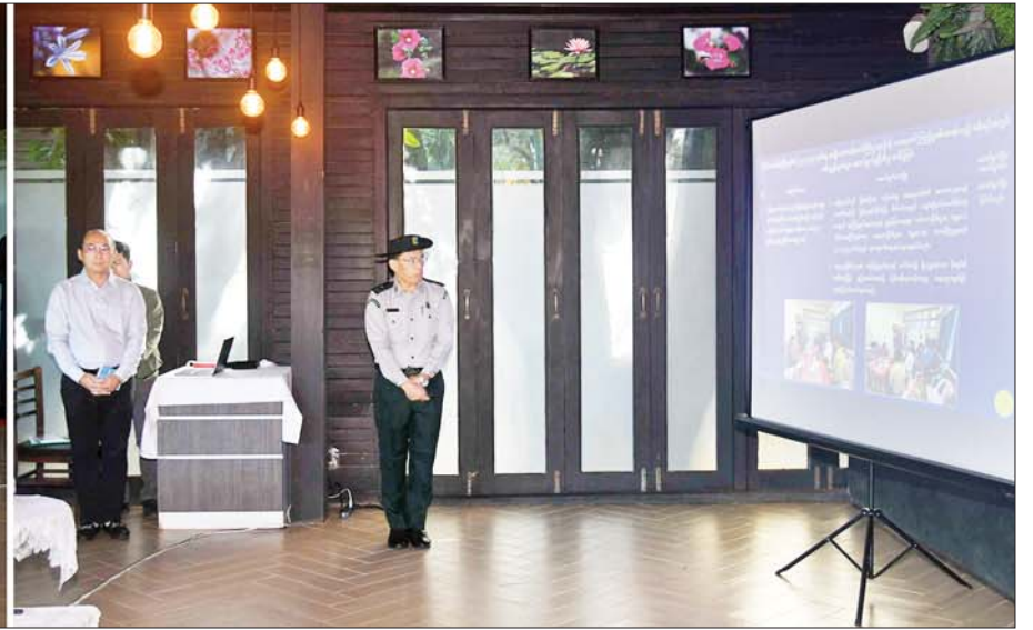
နိုင်ငံတော်စီမံအုပ်ချုပ်ရေးကောင်စီဥက္ကဋ္ဌ နိုင်ငံတော်ဝန်ကြီးချုပ် ဗိုလ်ချုပ်မှူးကြီးမင်းအောင်လှိုင်အား ပြင်ဦးလွင်မြို့ အမျိုးသားကန်တော်ကြီးဥယျာဉ် ရှင်းလင်းဆောင်ခန်းမ၌ တာဝန်ရှိသူတစ်ဦးက ရှင်းလင်းတင်ပြစဉ်။