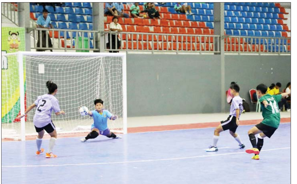
ပြည်နယ်နှင့်တိုင်းဒေသကြီး အမျိုးသမီးဖူဆယ်ပြိုင်ပွဲ ကွာတားဖိုင်နယ်ပွဲစဉ်၌ မွန်ပြည်နယ်အသင်း နှင့် ဧရာဝတီတိုင်းဒေသကြီးအသင်းတို့ ယှဉ်ပြိုင်ကစားကြစဉ်။