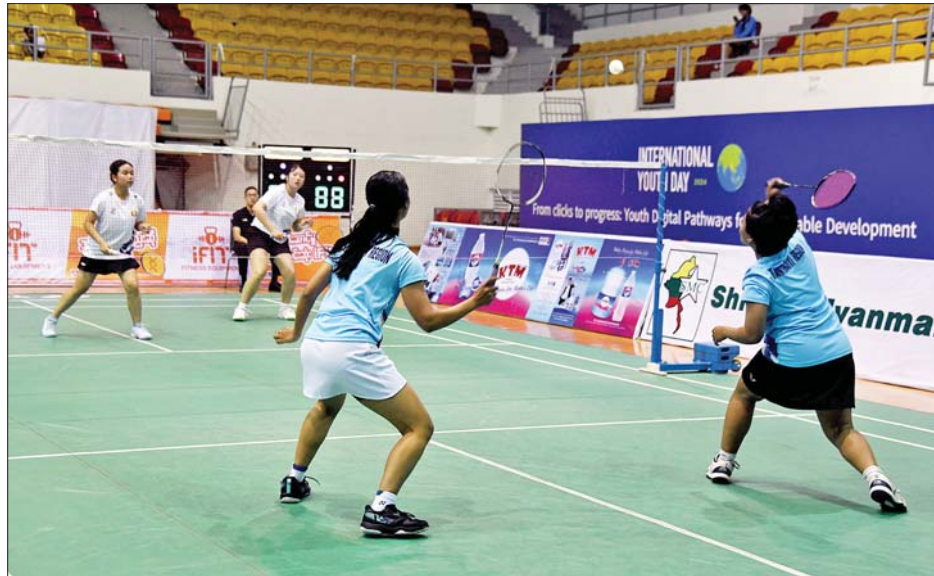
ပြည်နယ်နှင့်တိုင်းဒေသကြီး အမျိုးသမီး ကြက်တောင်ရိုက်ပြိုင်ပွဲတွင် ရှမ်းပြည်နယ်အသင်းနှင့် တနင်္သာရီတိုင်းဒေသကြီးအသင်းတို့ ယှဉ်ပြိုင်ကစားကြစဉ်။

ကျင်းပရာ ကျင်းပရာ ပြည်ထောင်စုနယ်မြေ နေပြည်တော်အသင်းက ပဲခူးတိုင်းဒေသကြီးအသင်းကို သုံးပွဲပြတ်၊ ရန်ကုန်တိုင်းဒေသကြီးအသင်းက မန္တလေးတိုင်းဒေသကြီးအသင်းကို သုံးပွဲပြတ်၊ ပဲခူးတိုင်းဒေသကြီးအသင်းက ဧရာဝတီတိုင်းဒေသကြီးအသင်းကို သုံးပွဲပြတ်၊ ပြည်ထောင်စုနယ်မြေ နေပြည်တော်အသင်းက ရန်ကုန်တိုင်းဒေသကြီးအသင်းကို သုံးပွဲ တစ်ပွဲ၊ ဧရာဝတီတိုင်းဒေသကြီးအသင်းက မန္တလေးတိုင်းဒေသကြီးအသင်းကို သုံးပွဲ တစ်ပွဲဖြင့် အနိုင်ရရှိခဲ့ကြသည်။ ယနေ့ကျင်းပသည့် အားကစားပြိုင်ပွဲများသို့ ပြည်ထောင်စုအဆင့် ပုဂ္ဂိုလ်များ၊ ဒုတိယဝန်ကြီးများ၊ တိုင်းဒေသကြီးနှင့် ပြည်နယ်အစိုးရအဖွဲ့ဝန်ကြီးများ၊ ဌာနဆိုင်ရာများ၊ အားကစားနည်းအလိုက်အဖွဲ့ချုပ်များမှ တာဝန်ရှိသူများ၊ ဝန်ထမ်းများ၊ ကျောင်းသား ကျောင်းသူများနှင့် အားကစားဝါသနာရှင် ပြည်သူများ စိတ်ပါဝင်စားစွာ လာရောက်ကြည့်ရှုအားပေးခဲ့ကြသည်။ သတင်းစဉ်