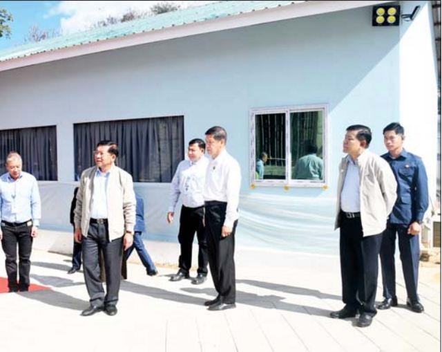
ယခု အဆင့်မြင့်ဈေးသစ် တည်ဆောက်စေခြင်းသည် ပြင်ဦး လွင်မြို့၏ လူနေမှုထူထပ်လာမှုများ၊ ခရီးသွားလာမှု များပြားလာမှုများ နှင့်ကိုက်ညီသည့် အဆင့်မြင့်ဈေး တစ်ခုဖြစ်ပေါ်လာစေရန်နှင့် ဒေသ ထွက်နှင့် အခြေခံသုံးကုန်ပစ္စည်း များကို တစ်နေရာတည်းတွင် တစုတစည်းတည်း ရရှိနိုင်စေရန် ရည်ရွယ် ဆောင်ရွက်စေခြင်းဖြစ် ကြောင်းနှင့် စံပြဈေးတစ်ခုဖြစ်ရ မည်ဖြစ်ကြောင်း မှာကြားသည်။ ဆက်လက်၍ နိုင်ငံတော်စီမံ အုပ်ချုပ်ရေးကောင်စီဥက္ကဋ္ဌ နိုင်ငံ တော်ဝန်ကြီးချုပ်သည် သုမင်္ဂလာ ဈေး(ညံတောဈေး) ခြောက်ထပ် အဆင့်မြင့်ဈေးသစ် တည်ဆောက် ရေးစီမံကိန်းအတွင်း လုပ်ငန်း ဆောင်ရွက်နေမှု အခြေအနေများ ကို လှည့်လည်ကြည့်ရှုစစ်ဆေး ပြီး တာဝန်ရှိသူများ၏ တင်ပြ ချက်များအပေါ် လိုအပ်သည်များ လမ်းညွှန်မှာကြားခဲ့ကြောင်း သိရ သည်။ သတင်းစဉ်