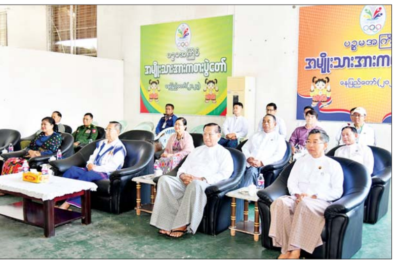
နိုင်ငံတော်စီမံအုပ်ချုပ်ရေးကောင်စီအဖွဲ့ဝင်များနှင့် တာဝန်ရှိသူများ မသန်စွမ်းအားကစားပွဲတော် အထိမ်းအမှတ်အရပ်အား ပေးအပ်ချီးမြှင့်ကြည့်ရှုအားပေးစဉ်။

ကြည့်ရှုအားပေး ဦးစွာ နိုင်ငံတော်စီမံအုပ်ချုပ်ရေးကောင်စီအဖွဲ့ဝင်များဖြစ်ကြသည့် ဒေါ်ဒွေဘူ၊ ပိုးရယ်အောင်သိန်းနှင့် မန်းငြိမ်းမောင်၊ ပြည်ထောင်စုဝန်ကြီး ဦးကိုကိုလွင်၊ ဦးမြင့်နောင်နှင့် ဦးမင်းသိန်းဇံ၊ ပြည်ထောင်စုတရားလွှတ်တော်ချုပ် တရားသူကြီး၊ ဒုတိယဝန်ကြီးများ၊ မြန်မာနိုင်ငံ မသန်စွမ်းအားကစားအဖွဲ့ချုပ်ဥက္ကဋ္ဌနှင့် တာဝန်ရှိသူတို့သည် လယ်ဝေး TC-2 အားကစားကွင်း ဘော်လီဘောရုံ၌ မသန်စွမ်းအားကစားပွဲတော်အထိမ်းအမှတ်အရပ်အား ပေးအပ်ချီးမြှင့်ပွဲတွင် တက်ရောက်ကြည့်ရှုအားပေးပြီး ဆုများပေးအပ်ချီးမြှင့်ကြသည်။