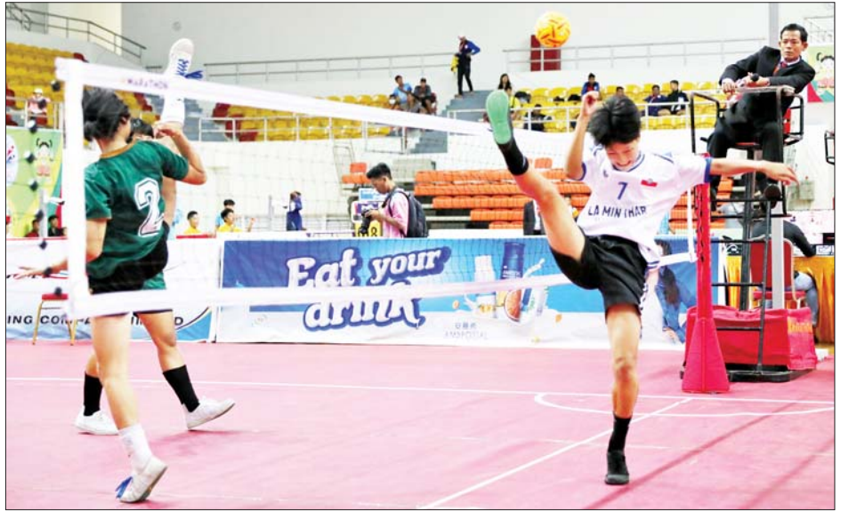
ပြည်နယ်နှင့်တိုင်းဒေသကြီး အမျိုးသမီးနှစ်ယောက်တွဲ ပိုက်ကျော်ခြင်းပြိုင်ပွဲ ဗိုလ်လုပွဲစဉ် မွန်ပြည်နယ်အသင်းနှင့် ရခိုင်ပြည်နယ်အသင်းတို့ ယှဉ်ပြိုင်ကစားကြစဉ်။

★ စာမျက်နှာ ၁၆ မှ စစ်ကိုင်းတိုင်းဒေသကြီးအသင်းက ကရင်ပြည်နယ်အသင်းကို နှစ်ပွဲ တစ်ပွဲဖြင့် အနိုင်ရရှိခဲ့ပြီး ပထမဆုကို စစ်ကိုင်းတိုင်းဒေသကြီး၊ ဒုတိယဆုကို ကရင်ပြည်နယ်အသင်းနှင့် တတိယဆုကို မန္တလေးတိုင်းဒေသကြီးအသင်းတို့က ရရှိခဲ့ကြသည်။ အမျိုးသမီး နှစ်ယောက်တွဲ ပိုက်ကျော်ခြင်းပြိုင်ပွဲ ဆီမီးဖိုင်နယ် ပွဲစဉ်တွင် မွန်ပြည်နယ်အသင်းက ရန်ကုန်တိုင်းဒေသကြီးအသင်းကို နှစ်ပွဲ တစ်ပွဲ၊ ရခိုင်ပြည်နယ်အသင်းက ပဲခူးတိုင်းဒေသကြီးအသင်းကို နှစ်ပွဲ တစ်ပွဲ၊ တတိယနေရာလုပွဲတွင် ရန်ကုန်တိုင်းဒေသကြီးအသင်းက ပဲခူးတိုင်းဒေသကြီးအသင်းကို နှစ်ပွဲ ပြတ်၊ ဗိုလ်လုပွဲတွင် မွန်ပြည်နယ်အသင်းက ရခိုင်ပြည်နယ်အသင်းကို နှစ်ပွဲ တစ်ပွဲဖြင့် အနိုင်ရရှိခဲ့ပြီး ပထမဆုကို မွန်ပြည်နယ်အသင်း၊ ဒုတိယဆုကို ရခိုင်ပြည်နယ်အသင်းနှင့် တတိယဆုကို ရန်ကုန်တိုင်းဒေသကြီးအသင်းတို့က ရရှိခဲ့ကြသည်။ ပြည်နယ်နှင့် တိုင်းဒေသကြီးအသက် ၂၅ နှစ်အောက် ခရစ်ကက်ပြိုင်ပွဲတွင် ကရင်ပြိုင်ပွဲကို ဝဏ္ဏသိဒ္ဓိအားကစားကွင်း မြားပစ်ကွင်း (၁/၂)၌ ကျင်းပရာ အမျိုးသားခရစ်ကက်ပြိုင်ပွဲတွင် ဧရာဝတီတိုင်းဒေသကြီးအသင်းက ပဲခူးတိုင်းဒေသကြီးအသင်းကို ခုနစ်ယောက်အသာဖြင့် လည်းကောင်း၊ ရှမ်းပြည်နယ်အသင်းက ပဲခူးတိုင်းဒေသကြီးအသင်းကို ၇၆ မှတ်အသာဖြင့် လည်းကောင်း အနိုင်ရရှိခဲ့ကြသည်။ ပြည်နယ်နှင့် တိုင်းဒေသကြီး (အမျိုးသား/အမျိုးသမီး) လက်ဝှေ့ပြိုင်ပွဲကို ဝဏ္ဏသိဒ္ဓိအားကစားကွင်း လက်ဝှေ့ရုံ၌ကျင်းပရာ အမျိုးသား ၅၁ ကီလိုတန်း လက်ဝှေ့ပြိုင်ပွဲတွင် ရန်ကုန်တိုင်းဒေသကြီးမှ ခန့်ဖြူးကျော်က မွန်ပြည်နယ်မှ ထွန်းထွန်းအောင်ကို လည်းကောင်း၊ ချင်းပြည်နယ်မှ ရဲရင့်ထွေးက ပြည်ထောင်စုနယ်မြေ နေပြည်တော်မှ လင်းလင်းထွန်းကို လည်းကောင်း၊ စစ်ကိုင်းတိုင်းဒေသကြီးမှ သူရက တနင်္သာရီတိုင်းဒေသကြီးမှ