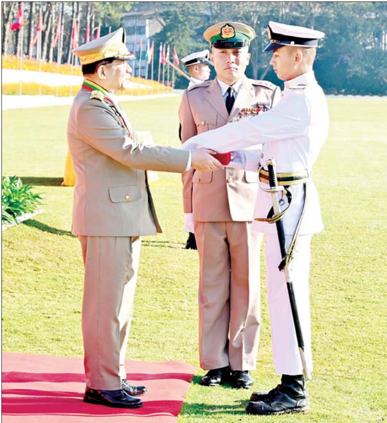
နိုင်ငံတော်စီမံအုပ်ချုပ်ရေးကောင်စီဥက္ကဋ္ဌ တပ်မတော်ကာကွယ်ရေးဦးစီးချုပ် ဗိုလ်ချုပ်မှူးကြီး သတိုးမဟာသရေစည်သူ သတိုးသီရိသုဓမ္မမင်းအောင်လှိုင် စစ်တက္ကသိုလ် ဗိုလ်လောင်းသင်တန်းအမှတ်စဉ်(၆၆)မှ လေ့ကျင့်ရေးထူးချွန်ဆုရရှိသူ ဗိုလ်လောင်းအမှတ် ၃၅၈၅၃ ဗိုလ်လောင်း သီဟစိုးအား ဆုပေးအပ်ချီးမြှင့်စဉ်။

ဆုများပေးအပ်ချီးမြှင့် ဦးစွာ နိုင်ငံတော်စီမံအုပ်ချုပ်ရေးကောင်စီဥက္ကဋ္ဌ တပ်မတော်ကာကွယ်ရေးဦးစီးချုပ် ဗိုလ်ချုပ်မှူးကြီး သတိုးမဟာသရေစည်သူ သတိုးသီရိသုဓမ္မ မင်းအောင်လှိုင်အား ဗိုလ်လောင်းတပ်ခွဲများက အနွေးလျှောက်၊ အမြန်လျှောက်ဖြင့် ချီတက်အလေးပြုကြသည်။ ထို့နောက် နိုင်ငံတော်စီမံအုပ်ချုပ်ရေးကောင်စီဥက္ကဋ္ဌ တပ်မတော်ကာကွယ်ရေးဦးစီးချုပ် ဗိုလ်ချုပ်မှူးကြီး သတိုးမဟာသရေစည်သူ သတိုးသီရိသုဓမ္မ မင်းအောင်လှိုင်က စစ်တက္ကသိုလ် ဗိုလ်လောင်းသင်တန်း အမှတ်စဉ်(၆၆)မှ လေ့ကျင့်ရေး ထူးချွန်ဆုရရှိသူ အမှတ် ၃၆၀၀၁ ဗိုလ်လောင်း ဗိုလ်လောင်းအမှတ် ၃၅၈၅၃ နေသုခ၊ စာပေထူးချွန်ဆု(သိပ္ပံ) ရရှိသူ ဗိုလ်လောင်းအမှတ် ၃၆၁၂၆ ဗိုလ်လောင်း ရဲထက်၊ စာပေထူးချွန်ဆု (ကွန်ပျူတာ) ယင်းနောက် နိုင်ငံတော်စီမံအုပ်ချုပ်ရေးကောင်စီ ဥက္ကဋ္ဌ တပ်မတော်ကာကွယ်ရေးဦးစီးချုပ် ဗိုလ်ချုပ်မှူးကြီး သတိုးမဟာသရေစည်သူ သတိုးသီရိသုဓမ္မ မင်းအောင်လှိုင်က သင်တန်းဆင်း မိန့်ခွန်း ပြောကြားသည်။ (နိုင်ငံတော် စီမံအုပ်ချုပ်ရေးကောင်စီဥက္ကဋ္ဌ တပ်မတော်ကာကွယ်ရေးဦးစီးချုပ်၏ မိန့်ခွန်းကို စာမျက်နှာ ၃ တွင် သီးခြားဖော်ပြထားပါသည်။)