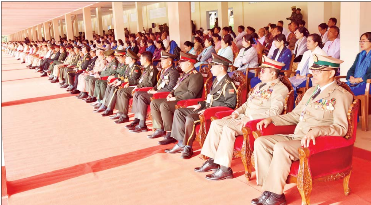
စစ်တက္ကသိုလ်ဗိုလ်လောင်းသင်တန်း အမှတ်စဉ်(၆၆) သင်တန်းဆင်းဂုဏ်ပြုစစ်ရေးပြအခမ်းအနားသို့ တက်ရောက်လာကြသူများကို တွေ့ရစဉ်။

တပ်မတော်သားများသည် ပြည်သူ ကြားမှ ပေါက်ဖွားလာခြင်းဖြစ်ပြီး တပ်မတော်သည် နိုင်ငံတော်၏ အစိတ်အပိုင်းတစ်ရပ်ဖြစ်ကြောင်း၊ ထို့ကြောင့် မိမိကိုယ်ကို၊ မိမိအဖွဲ့ အစည်းနှင့် နိုင်ငံတော်အပေါ် သစ္စာစောင့်သိ၍ ပေးအပ်သည့် တာဝန်များကို အောင်မြင်ကျေပွန် စွာ ထမ်းဆောင်သွားကြရန်လို ကြောင်း၊ ထိုသို့ ဆောင်ရွက်ခြင်း သည် နိုင်ငံတော်နှင့် တပ်မတော် အကျိုးကို ဆောင်ရွက်ခြင်းပင်ဖြစ် ကြောင်း အမှာစကားပြောကြားခဲ့ ကြောင်း သိရသည်။ သတင်းစဉ်