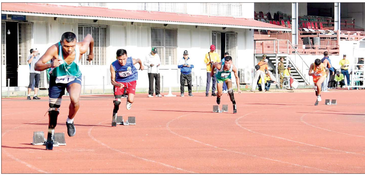
အမျိုးသား မိတာ ၄၀၀ မသန်စွမ်း T64 ပြိုင်ပွဲတွင် အားကစားသမားများ ယှဉ်ပြိုင်နေမှုကို တွေ့ရစဉ်။

ဆုရရှိသည့် မွန်ပြည်နယ်နှင့် တတိယဆုရရှိသည့် မန္တလေးတိုင်းဒေသကြီးတို့မှ ပြိုင်ပွဲဝင်များအားလည်းကောင်း ဂုဏ်ပြုဆုတံဆိပ်နှင့် အမျိုးသားအားကစားပွဲတော် အထိမ်းအမှတ်အရပ်အား ပေးအပ်ချီးမြှင့်ကြသည်။ အလားတူ မသန်စွမ်းရေကူး (အမျိုးသား/အမျိုးသမီး) မိတာ ၅၀၀ ပတ်လက်ကူးပြိုင်ပွဲ၊ လိပ်ပြာကူးနှင့် ရင်ပေါင်တန်းကူးပြိုင်ပွဲတို့၏ ဗိုလ်လုပွဲစဉ်များကို ဝဏ္ဏသိဒ္ဓိရေကူးကန်၌ ယှဉ်ပြိုင်ကစားကြရာ ရင်းနှီးမြှုပ်နှံမှုနှင့် နိုင်ငံခြားစီးပွားဆက်သွယ်ရေးဝန်ကြီးဌာန ပြည်ထောင်စုဝန်ကြီး ဒေါက်တာကံဇော်၊ ဒုတိယဝန်ကြီးများ၊ နိုင်ငံတော် စီမံအုပ်ချုပ်ရေး စာမျက်နှာ ၁၁ သို့