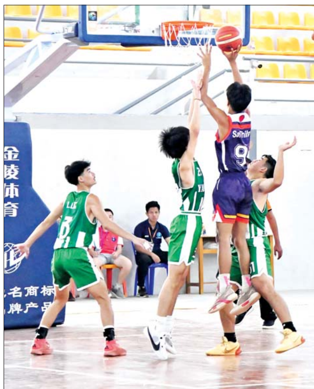
ပြည်နယ်နှင့်တိုင်းဒေသကြီး အသက် ၂၃ နှစ်အောက် အမျိုးသား ဘတ်စကက်ဘောပြိုင်ပွဲ ကွာတားဖိုင်နယ်ပွဲစဉ်၌ ရန်ကုန်တိုင်းဒေသကြီး အသင်းနှင့် ပဲခူးတိုင်းဒေသကြီးအသင်းတို့ ယှဉ်ပြိုင်ကစားကြစဉ်။

ပြည်နယ်နှင့် တိုင်းဒေသကြီး ကြက်တောင်ရိုက်ပြိုင်ပွဲ အုပ်စုစဉ် များကို ဝဏ္ဏသိဒ္ဓိအားကစားကွင်း (C) ရုံ၌ ကျင်းပရာ အမျိုးသား ကြက်တောင်ရိုက် ပြိုင်ပွဲတွင်