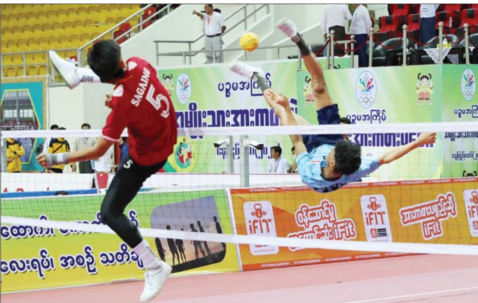
ပြည်နယ်နှင့်တိုင်းဒေသကြီး ပိုက်ကျော်ခြင်းပြိုင်ပွဲ အမျိုးသားနှစ်ယောက်တွဲပြိုင်ပွဲ ဗိုလ်လှပွဲစဉ်၌ စစ်ကိုင်းတိုင်းဒေသကြီးအသင်းနှင့် ကရင်ပြည်နယ်အသင်းတို့ ယှဉ်ပြိုင်ကစားကြစဉ်။

တွင် မန္တလေးတိုင်းဒေသကြီး အသင်းက ပြည်ထောင်စု နယ်မြေ နေပြည်တော်အသင်းကို နှစ်ပွဲပြတ်၊ ဗိုလ်လှပွဲစဉ်တွင် စာမျက်နှာ ၁၇ သို့ ★