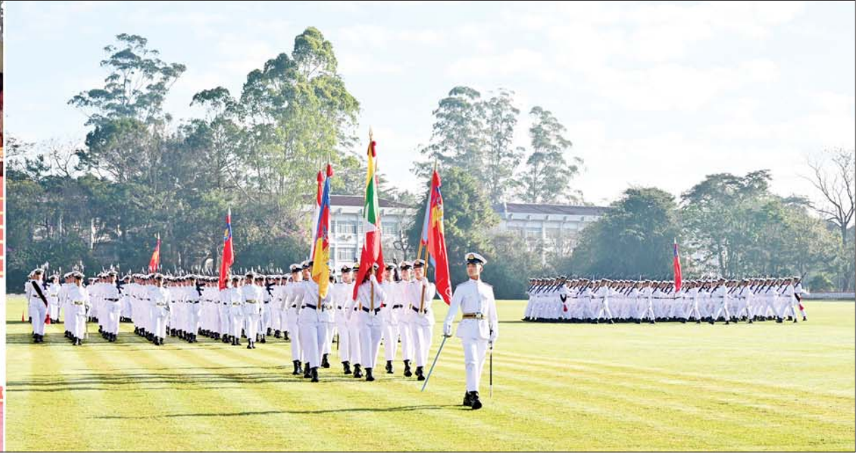
နိုင်ငံတော်စီမံအုပ်ချုပ်ရေးကောင်စီဥက္ကဋ္ဌ တပ်မတော်ကာကွယ်ရေးဦးစီးချုပ် ဗိုလ်ချုပ်မှူးကြီး သတိုးမဟာသရေစည်သူ သတိုးသီရိသုဓမ္မမင်းအောင်လှိုင်အား ဗိုလ်လောင်းတပ်ခွဲများက အနွေးလျှောက်၊ အမြန်လျှောက်ဖြင့် ချီတက်အလေးပြုကြစဉ်။

◆ ရှေ့ဖုံးမှ ပြည်ထောင်စုဝန်ကြီးများ၊ မန္တလေးတိုင်းဒေသကြီးဝန်ကြီးချုပ်နှင့် ဇနီး၊ အလယ်ပိုင်းတိုင်းစစ်ဌာနချုပ်တိုင်းမှူး၊ မြန်မာနိုင်ငံဆိုင်ရာ နိုင်ငံခြားစစ်သံရုံးများမှ စစ်သံမှူးများ၊ စစ်တက္ကသိုလ်ကျောင်းအုပ်ကြီး၊ ပြင်ဦးလွင်တပ်နယ်မှ တာဝန်ရှိသူများ၊ ကျောင်းဆင်းဗိုလ်လောင်းများ၏ မိဘဆွေမျိုးများနှင့် ဖိတ်ကြားထားသည့် ဧည့်သည်တော်များ တက်ရောက်ကြသည်။