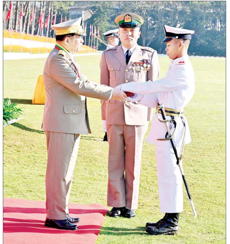
နိုင်ငံတော်စီမံအုပ်ချုပ်ရေးကောင်စီဥက္ကဋ္ဌ တပ်မတော်ကာကွယ်ရေးဦးစီးချုပ် ဗိုလ်ချုပ်မှူးကြီး သတိုးမဟာသရေစည်သူ သတိုးသီရိသုဓမ္မမင်းအောင်လှိုင် စစ်တက္ကသိုလ် ဗိုလ်လောင်းသင်တန်းအမှတ်စဉ်(၆၆)မှ စာပေထူးချွန်ဆု (ဝိဇ္ဇာ)ရရှိသူ ဗိုလ်လောင်းအမှတ် ၃၆၀၀၁ ဗိုလ်လောင်း နေသုခအား ဆုပေးအပ်ချီးမြှင့်စဉ်။