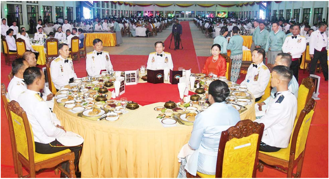
နိုင်ငံတော်စီမံအုပ်ချုပ်ရေး ကောင်စီဥက္ကဋ္ဌ တပ်မတော် ကာကွယ်ရေးဦးစီးချုပ် ဗိုလ်ချုပ် မှူးကြီး မင်းအောင်လှိုင် သင်တန်းဆင်း အရာရှိများအား ရင်းရင်းနှီးနှီး လိုက်လံနှုတ်ဆက် စဉ်။