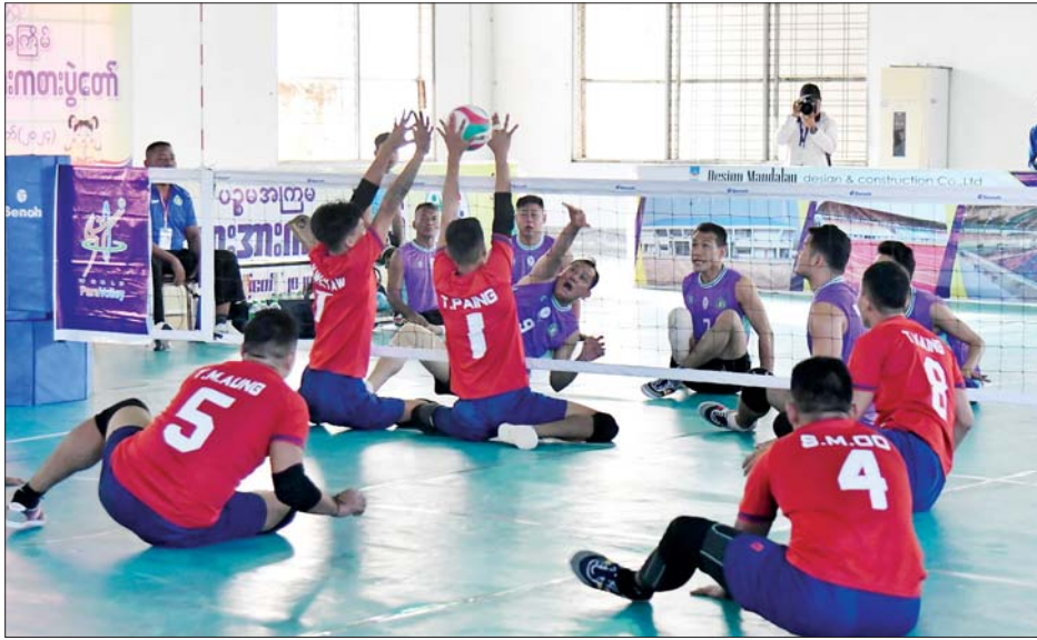
မသန်စွမ်းအမျိုးသား တိုင်လျက်ဘော်လီဘောပြိုင်ပွဲ အုပ်စုပတ်လည်ပြိုင်ပွဲတွင် ရန်ကုန်တိုင်းဒေသကြီး အသင်းနှင့် မန္တလေးတိုင်းဒေသကြီးအသင်းတို့ ယှဉ်ပြိုင်ကစားကြစဉ်။