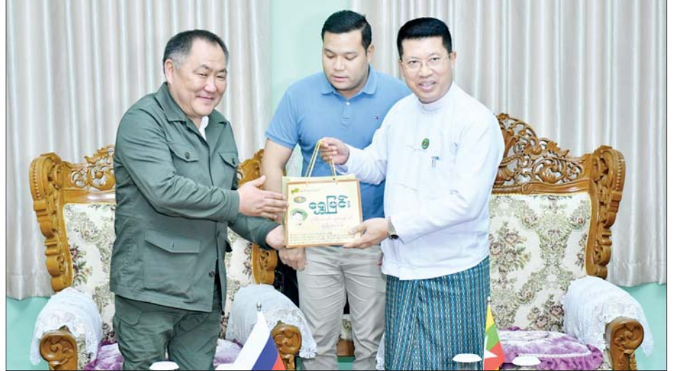
ရုရှားဖက်ဒရေးရှင်းနိုင်ငံ ဒူးမားလွတ်တော်ဒုတိယဥက္ကဋ္ဌ H.E.Mr. Sholban Kara-Ool အား ဧရာဝတီ တိုင်းဒေသကြီးဝန်ကြီးချုပ်က ဒေသထွက်အမှတ်တရလက်ဆောင်ပစ္စည်း ပေးအပ်စဉ်။