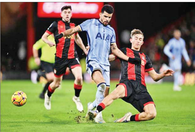
ဘုန်းမောက်အသင်းနှင့် စပါးအသင်းတို့ ယှဉ်ပြိုင်ကစားကြစဉ်။

ပရီမီယာလိဂ် ပွဲစဉ်(၁၄)ရဲ့ နောက်ဆုံးပွဲစဉ်နှစ်ပွဲဖြစ်တဲ့ ဖူလ်ဟမ်အသင်းနဲ့ ဘရိုက်တန်အသင်း၊ ဘုန်းမောက်အသင်းနဲ့ စပါးအသင်းတို့ ဒီဇင်ဘာ ၆ ရက် နံနက်ပိုင်းတွင် ယှဉ်ပြိုင်ကစားခဲ့ရာ ဖူလ်ဟမ်အသင်းနဲ့ ဘုန်းမောက်အသင်းတို့ ဟာ အိမ်ကွင်းနိုင်ပွဲအသီးသီးရရှိခဲ့ပါတယ်။ ဖူလ်ဟမ်အသင်းနဲ့ ဘရိုက်တန်အသင်းတို့ပွဲစဉ်မှာ ဖူလ်ဟမ်အသင်းက သုံးဂိုး-တစ်ဂိုးနဲ့ အနိုင်ရရှိခဲ့တာဖြစ်ပြီး အဲဒီပွဲစဉ်မှာ ဖူလ်ဟမ်အသင်းအတွက် သွင်းဂိုးတွေကို အိုင်ဝိုဘီက ပထမပိုင်းပွဲကစားချိန် စာမျက်နှာ ၁၉ ကော်လံ ၅ သို့