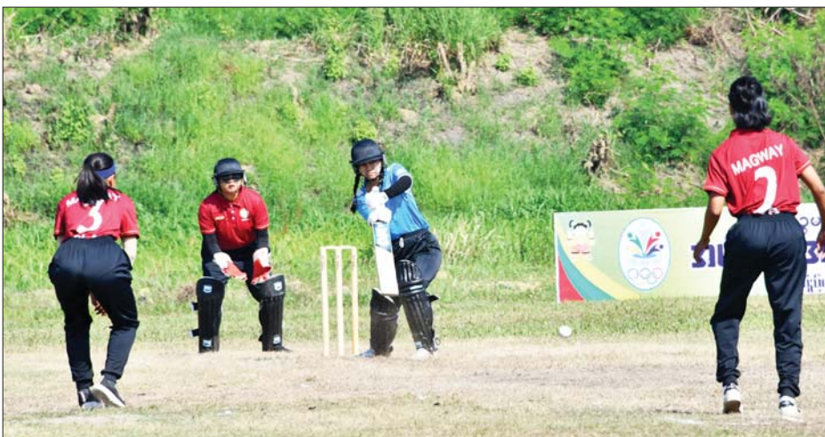
ပြည်နယ်နှင့်တိုင်းဒေသကြီး အသက် ၂၅ နှစ်အောက် အမျိုးသမီး ခရစ်ကက်ပြိုင်ပွဲတွင် မကွေးတိုင်းဒေသကြီးအသင်းနှင့် ဧရာဝတီတိုင်းဒေသကြီးအသင်းတို့ ယှဉ်ပြိုင်ကစားကြစဉ်။

★ စာမျက်နှာ ၁၆ မှ စစ်ကိုင်းတိုင်းဒေသကြီးအသင်းက ကရင်ပြည်နယ်အသင်းကို နှစ်ပွဲ တစ်ပွဲဖြင့် အနိုင်ရရှိခဲ့ပြီး ပထမဆုကို စစ်ကိုင်းတိုင်းဒေသကြီး၊ ဒုတိယဆုကို ကရင်ပြည်နယ်အသင်းနှင့် တတိယဆုကို မန္တလေးတိုင်းဒေသကြီးအသင်းတို့က ရရှိခဲ့ကြသည်။ အမျိုးသမီး နှစ်ယောက်တွဲ ပိုက်ကျော်ခြင်းပြိုင်ပွဲ ဆီမီးဖိုင်နယ် ပွဲစဉ်တွင် မွန်ပြည်နယ်အသင်းက ရန်ကုန်တိုင်းဒေသကြီးအသင်းကို နှစ်ပွဲ တစ်ပွဲ၊ ရခိုင်ပြည်နယ်အသင်းက ပဲခူးတိုင်းဒေသကြီးအသင်းကို နှစ်ပွဲ တစ်ပွဲ၊ တတိယနေရာလုပွဲတွင် ရန်ကုန်တိုင်းဒေသကြီးအသင်းက ပဲခူးတိုင်းဒေသကြီးအသင်းကို နှစ်ပွဲ ပြတ်၊ ဗိုလ်လုပွဲတွင် မွန်ပြည်နယ်အသင်းက ရခိုင်ပြည်နယ်အသင်းကို နှစ်ပွဲ တစ်ပွဲဖြင့် အနိုင်ရရှိခဲ့ပြီး ပထမဆုကို မွန်ပြည်နယ်အသင်း၊ ဒုတိယဆုကို ရခိုင်ပြည်နယ်အသင်းနှင့် တတိယဆုကို ရန်ကုန်တိုင်းဒေသကြီးအသင်းတို့က ရရှိခဲ့ကြသည်။ ပြည်နယ်နှင့် တိုင်းဒေသကြီးအသက် ၂၅ နှစ်အောက် ခရစ်ကက်ပြိုင်ပွဲတွင် ကရင်ပြိုင်ပွဲကို ဝဏ္ဏသိဒ္ဓိအားကစားကွင်း မြားပစ်ကွင်း (၁/၂)၌ ကျင်းပရာ အမျိုးသားခရစ်ကက်ပြိုင်ပွဲတွင် ဧရာဝတီတိုင်းဒေသကြီးအသင်းက ပဲခူးတိုင်းဒေသကြီးအသင်းကို ခုနစ်ယောက်အသာဖြင့် လည်းကောင်း၊ ရှမ်းပြည်နယ်အသင်းက ပဲခူးတိုင်းဒေသကြီးအသင်းကို ၇၆ မှတ်အသာဖြင့် လည်းကောင်း အနိုင်ရရှိခဲ့ကြသည်။ ပြည်နယ်နှင့် တိုင်းဒေသကြီး (အမျိုးသား/အမျိုးသမီး) လက်ဝှေ့ပြိုင်ပွဲကို ဝဏ္ဏသိဒ္ဓိအားကစားကွင်း လက်ဝှေ့ရုံ၌ကျင်းပရာ အမျိုးသား ၅၁ ကီလိုတန်း လက်ဝှေ့ပြိုင်ပွဲတွင် ရန်ကုန်တိုင်းဒေသကြီးမှ ခန့်ဖြူးကျော်က မွန်ပြည်နယ်မှ ထွန်းထွန်းအောင်ကို လည်းကောင်း၊ ချင်းပြည်နယ်မှ ရဲရင့်ထွေးက ပြည်ထောင်စုနယ်မြေ နေပြည်တော်မှ လင်းလင်းထွန်းကို လည်းကောင်း၊ စစ်ကိုင်းတိုင်းဒေသကြီးမှ သူရက တနင်္သာရီတိုင်းဒေသကြီးမှ