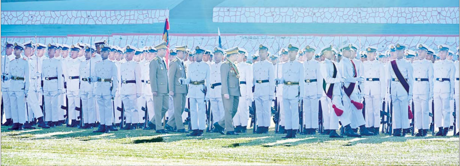
နိုင်ငံတော်စီမံအုပ်ချုပ်ရေးကောင်စီဥက္ကဋ္ဌ တပ်မတော်ကာကွယ်ရေးဦးစီးချုပ် ဗိုလ်ချုပ်မှူးကြီး သတိုးမဟာသရေစည်သူ သတိုးသီရိသုဓမ္မမင်းအောင်လှိုင် ဗိုလ်လောင်းတပ်ခွဲများအား စစ်ဆေးစဉ်။

သရေစည်သူ သတိုးသီရိသုဓမ္မ မင်းအောင်လှိုင်က သင်တန်းဆင်း မိန့်ခွန်း ပြောကြားသည်။ (နိုင်ငံတော် စီမံအုပ်ချုပ်ရေးကောင်စီဥက္ကဋ္ဌ တပ်မတော်ကာကွယ်ရေးဦးစီးချုပ်၏ မိန့်ခွန်းကို စာမျက်နှာ ၃ တွင် သီးခြားဖော်ပြထားပါသည်။) ဆက်လက်၍ နိုင်ငံတော်စီမံအုပ်ချုပ်ရေးကောင်စီ ဥက္ကဋ္ဌ တပ်မတော်ကာကွယ်ရေးဦးစီးချုပ် ဗိုလ်ချုပ်မှူးကြီး သတိုးမဟာသရေစည်သူ သတိုးသီရိသုဓမ္မ မင်းအောင်လှိုင်သည် ဗိုလ်လောင်းတပ်ခွဲများ၏ အလေးပြုခြင်းကို ခံယူပြီးနောက် စစ်ရေးပြအခမ်းအနားမှ ပြန်လည်ထွက်ခွာသည်။ စစ်ရေးပြအခမ်းအနား အပြီးတွင် နိုင်ငံတော်စီမံအုပ်ချုပ်ရေးကောင်စီဥက္ကဋ္ဌ တပ်မတော်ကာကွယ်ရေးဦးစီးချုပ် ဗိုလ်ချုပ်မှူးကြီး စာမျက်နှာ ၆ သို့ >>>