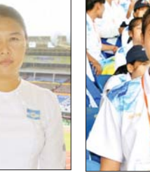
မသက်မွန်စူး