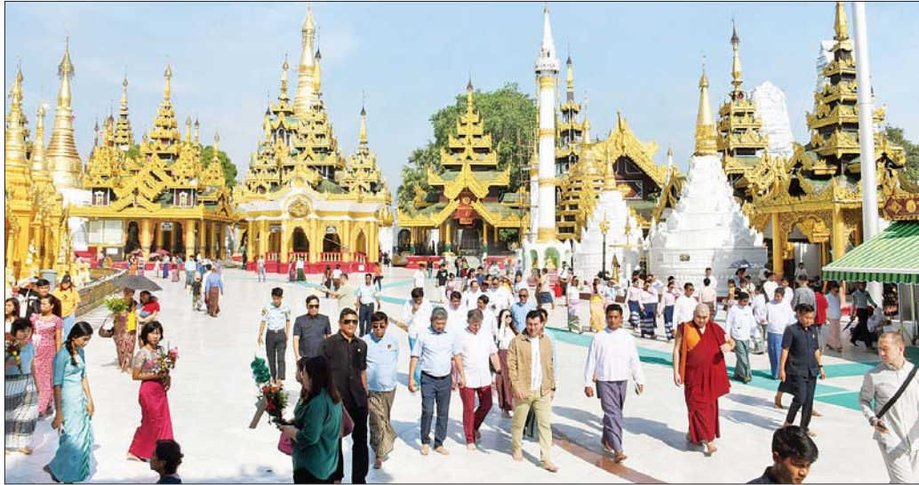
ရုရှားဖက်ဒရေးရှင်းနိုင်ငံ Kalmykia ပြည်နယ်အကြီးအကဲ ဦးဆောင်သောကိုယ်စားလှယ်အဖွဲ့ ရွှေတိဂုံစေတီတော်မြတ်ကြီး ရင်ပြင်တော်အား လှည့်လည်ကြည့်ရှုစဉ်။

ပစ္စည်း ပြခန်းများအပါအဝင် မြန်မာ့သမိုင်းဆိုင်ရာပြခန်းများကို စိတ်ဝင်တစားလေ့လာကြပြီး မြို့တော်ခန်း၊ ဝန်ကြီးများရုံး၊ ကန်တော်ကြီးနှင့် ကရဝိတ်စသည် ရန်ကုန်မြို့၏ အထင်ကရနေရာများကို မော်တော်ယာဉ်များဖြင့် လှည့်လည်ကြည့်ရှုကြကာ မြန်မာ့ကျောက်မျက် ပြတိုက်အရောင်းဆိုင်များကို သွားရောက်ကြည့်ရှု လေ့လာကြသည်။