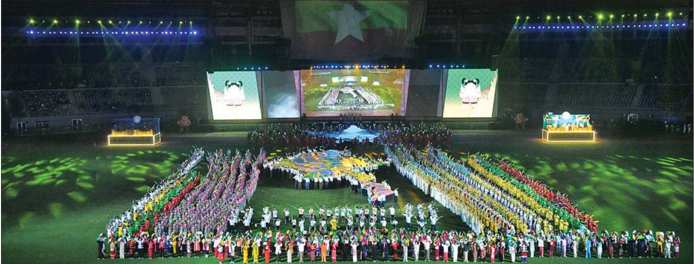
ပြည်ထောင်စုတိုင်းရင်းသားလူမျိုးများဖွံ့ဖြိုးရေးတက္ကသိုလ်နှင့် ပြည်ထောင်စုတိုင်းရင်းသားလူငယ်များ စွမ်းရည်ဖွံ့ဖြိုးရေးဒီဂရီကောလိပ်တို့မှ ကျောင်းသား ကျောင်းသူများ၊ သာသနာရေးနှင့်ယဉ်ကျေးမှုဝန်ကြီးဌာန၊ ပညာရေးဝန်ကြီးဌာန၊ သိပ္ပံနှင့်နည်းပညာဝန်ကြီးဌာနတို့မှ ကျောင်းသား ကျောင်းသူများက သရုပ်ပြချော်ဖြေတင်ဆက်စဉ်။