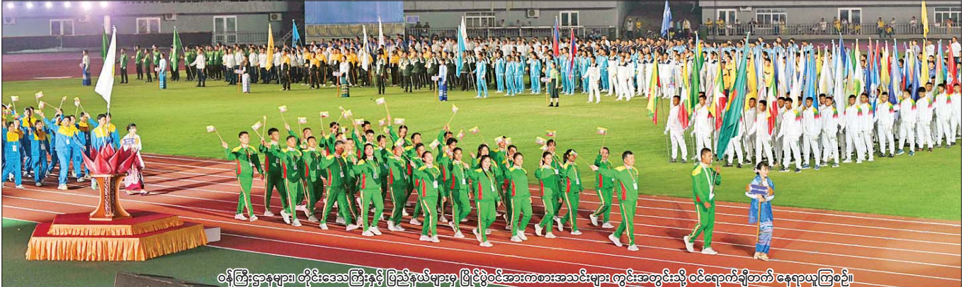
ဝန်ကြီးဌာနများ၊ တိုင်းဒေသကြီးနှင့် ပြည်နယ်များမှ ပြိုင်ပွဲဝင်အားကစားအသင်းများ ကွင်းအတွင်းသို့ ဝင်ရောက်ချီတက် နေရာယူကြစဉ်။