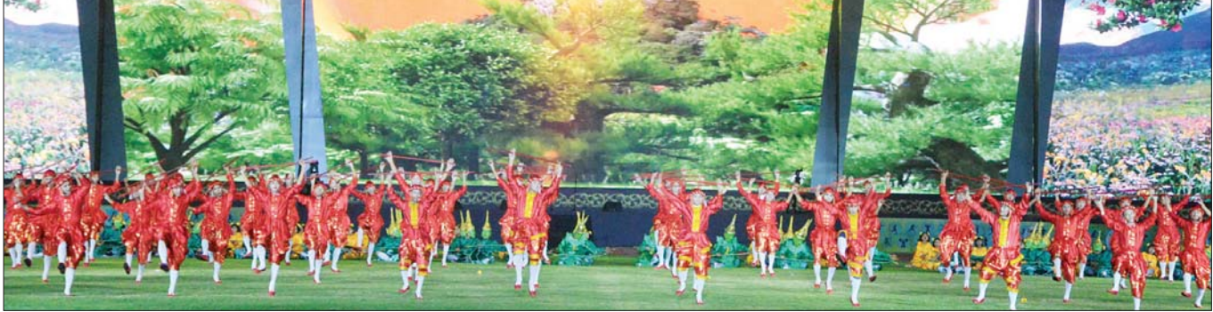
သာသနာရေးနှင့် ယဉ်ကျေးမှုဝန်ကြီးဌာန အနုပညာဦးစီးဌာနမှ အနုပညာရှင်များ၏ ဇော့ဂျီအကဖြင့် ဖျော်ဖြေတင်ဆက်မှုကို တွေ့ရစဉ်။