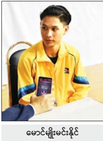
မောင်မျိုးမင်းနိုင်