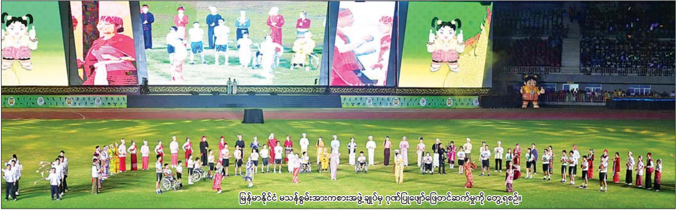
မြန်မာနိုင်ငံ မသန်စွမ်းအားကစားအဖွဲ့ချုပ်မှ ဂုဏ်ပြုဖျော်ဖြေတင်ဆက်မှုကို တွေ့ရစဉ်။