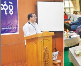
ကျန်းမာရေးတာဝန်ခံများအား တွေ့ဆုံ၍ တင်ပြချက်များအပေါ် လိုအပ်သည်များ ညှိနှိုင်းပေးပြီး စက်ရုံအတွင်း လှည့်လည်ကြည့်ရှု၍ လုပ်သားများနှင့် ရင်းရင်းနှီးနှီး တွေ့ဆုံအားပေးသည်။ မွန်းလွဲပိုင်းတွင် ရွှေပြည်သာစက်မှုဇုန်ရှိ ကနောင်

အလုပ်သမားဝန်ကြီးဌာန ဒုတိယဝန်ကြီး ဦးဝင်းရှိန်သည် ယနေ့နံနက်ပိုင်းတွင် ရန်ကုန်တိုင်းဒေသကြီး လှိုင်သာယာစက်မှုဇုန် ကနောင်ခန်းမ၌ စက်ရုံ၊ အလုပ်ရုံများမှ အလုပ်ရှင်၊ အလုပ်သမားများနှင့် တွေ့ဆုံ၍(ယာဝု) လုပ်ငန်းခွင်တည်ငြိမ်အေးချမ်းရေး၊ ကုန်ထုတ်စွမ်းအား တိုးတက်စေရေး ရှင်းလင်းမှာကြားသည်။