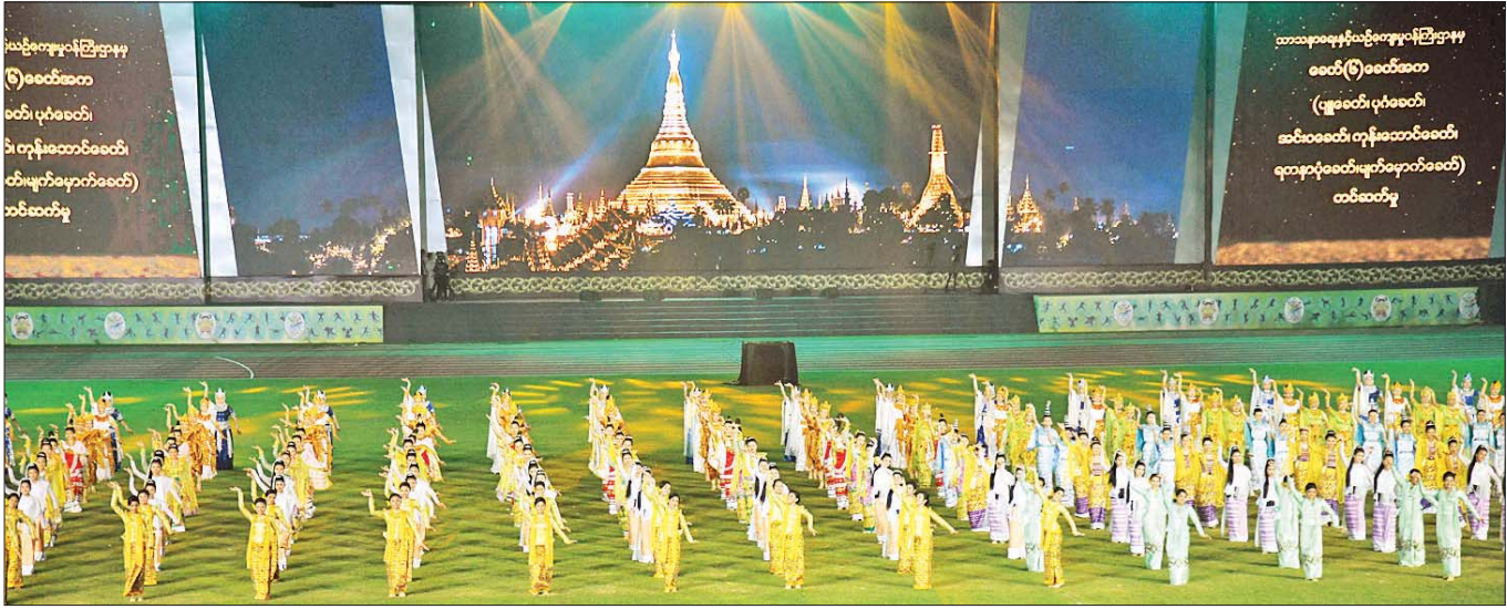
အနုပညာဦးစီးဌာနမှ အနုပညာရှင်များ၏ သမိုင်းစဉ်တစ်လျှောက် အထင်အရှားရှိခဲ့သော ခေတ် ၆ ခေတ်ကို ကိုယ်စားပြုသည့် ယိမ်းအကများဖြင့် သရုပ်ဖော်တင်ဆက်မှုကို တွေ့ရစဉ်။