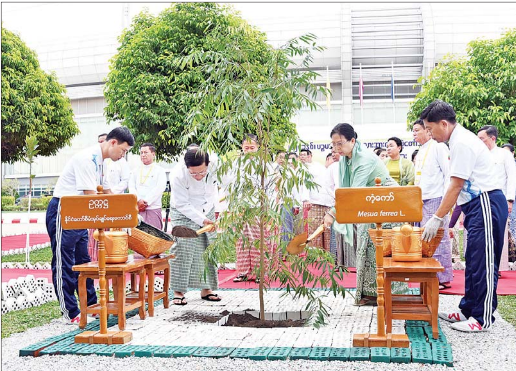
နိုင်ငံတော်စီမံအုပ်ချုပ်ရေးကောင်စီဥက္ကဋ္ဌ နိုင်ငံတော်ဝန်ကြီးချုပ် ဗိုလ်ချုပ်မှူးကြီး မင်းအောင်လှိုင်နှင့်ဇနီး ဒေါ်ကြာကြာလှ ၂၀၂၄ ခုနှစ် ပဉ္စမအကြိမ်မြောက် အမျိုးသားအားကစားပွဲတော် ဖွင့်ပွဲအထိမ်းအမှတ်အဖြစ် ကိုကော်ပင်အား စိုက်ပျိုးပေးစဉ်။

ထို့နောက် ဖွင့်ပွဲအခမ်းအနားအား စတင်ကျင်းပ ရာ အလွတ်ခွန်လေထီးအဖွဲ့မှလေထီးစံသည်များက အမျိုးသားအားကစားပွဲတော်အလံနှင့် တိုင်းဒေသ ကြီး၊ ပြည်နယ်အလံများကို ဝေဟင်ထက်မှမြေပြင်သို့