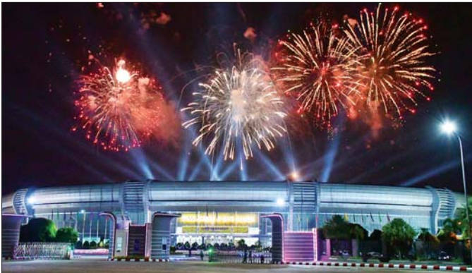
ပဉ္စမအကြိမ်မြောက် အမျိုးသားအားကစားပွဲတော်ဖွင့်ပွဲအခမ်းအနားတွင် စီးအလှပြမှု (Lighting Show) တင်ဆက်ပြသမှုကို တွေ့ရစဉ်။