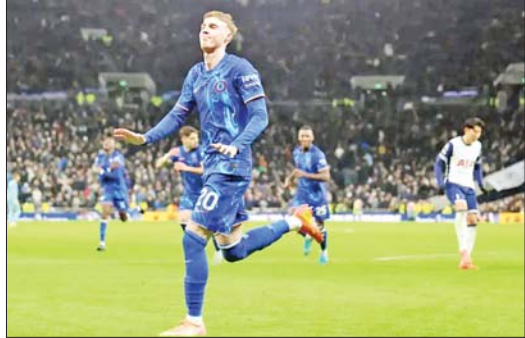
ချယ်ဆီးကစားသမား ပဲလ်မာ စပါးအသင်းဘက်သို့ ဂိုးသွင်းယူပြီးနောက် အောင်ပွဲခံစဉ်။