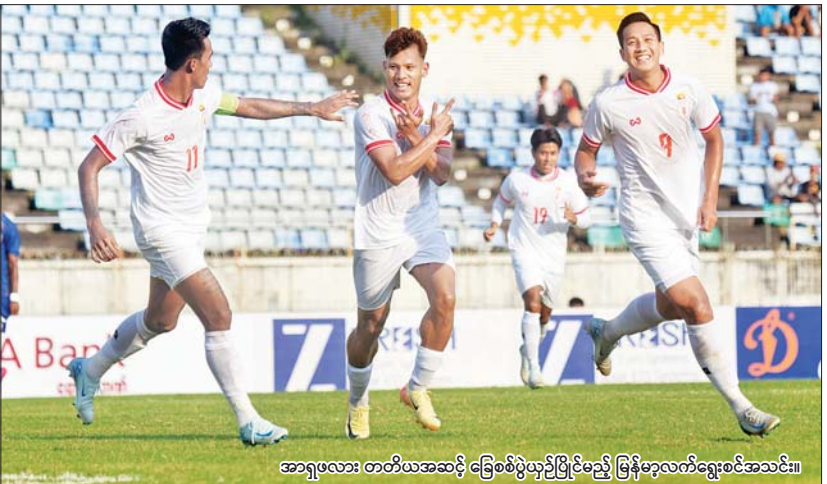
အာရှဖလား တတိယအဆင့် ခြေစစ်ပွဲယှဉ်ပြိုင်မည့် မြန်မာ့လက်ရွေးစင်အသင်း။