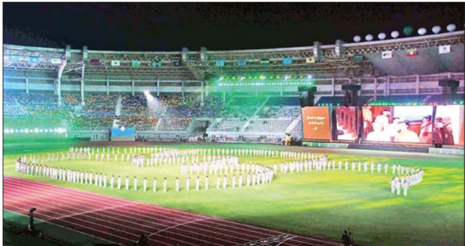
အနုပညာရှင်များက ငြိမ်းချမ်းရေးချိုးဖြူများ ပျံသန်းဝင်ရောက်မှုပုံစံ သရုပ်ဖော်ထားသည်ကို တွေ့ရစဉ်။

အနုပညာရှင်များက မြန်မာ့ ရိုးရာ ကနုတ်ပန်းအခြေခံ ပုံစံ သရုပ်ဖော်ထားသည်ကို တွေ့ရစဉ်။