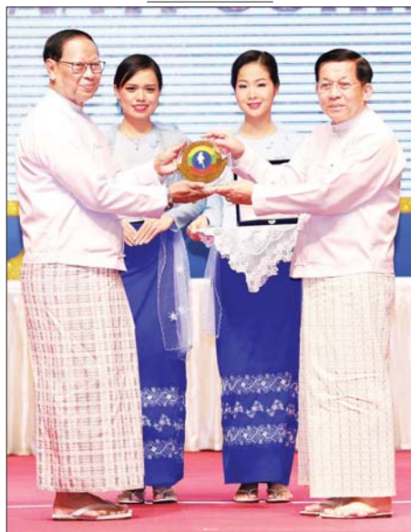
နိုင်ငံတော်စီမံအုပ်ချုပ်ရေးကောင်စီဥက္ကဋ္ဌ နိုင်ငံတော်ဝန်ကြီးချုပ် ဗိုလ်ချုပ်မှူးကြီး မင်းအောင်လှိုင် အဂတိလိုက်စားမှုတိုက်ဖျက်ရေး ကော်မရှင်ဥက္ကဋ္ဌက အပြည်ပြည်ဆိုင်ရာ အဂတိလိုက်စားမှုတိုက်ဖျက် ရေးနေ့အထိမ်းအမှတ်တံဆိပ်အား ဂါရဝပြုပေးအပ်စဉ်။

ဂါရဝပြုပေးအပ် ယင်းနောက် နိုင်ငံတော်စီမံ အုပ်ချုပ်ရေးကောင်စီဥက္ကဋ္ဌ နိုင်ငံ တော်ဝန်ကြီးချုပ် အဂတိလိုက် စားမှု တိုက်ဖျက်ရေးကော်မရှင် ဥက္ကဋ္ဌက အပြည်ပြည်ဆိုင်ရာ အဂတိလိုက်စားမှုတိုက်ဖျက်ရေး နေ့ အထိမ်းအမှတ်တံဆိပ်အား ဂါရဝပြုပေးအပ်သည်။ ဆက်လက်၍ အဂတိလိုက်စား မှုတိုက်ဖျက်ရေးကော်မရှင် ဥက္ကဋ္ဌ ဦးစစ်အေးက ကော်မရှင်၏