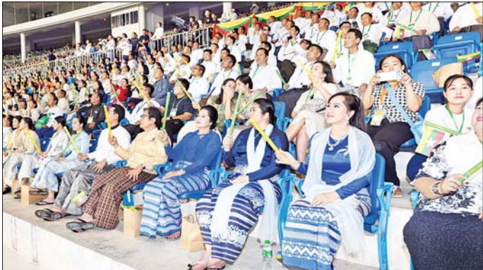
၂၀၂၄ ခုနှစ် ပဉ္စမအကြိမ်မြောက် အမျိုးသားအားကစားပွဲတော် ဖွင့်ပွဲအခမ်းအနားသို့ တက်ရောက်လာသည့် အနုပညာရှင်များအား တွေ့ရစဉ်။