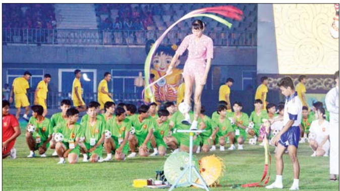
မြန်မာနိုင်ငံရပ်ရှင်အစည်းအရုံးနှင့် မြန်မာနိုင်ငံခြင်းလုံးအဖွဲ့ချုပ်တို့မှ တင်ဆက်သည့် ခြင်းအလှဝတ်သူများကို တွေ့ရစဉ်။