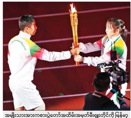
အမျိုးသားအားကစားပွဲတော်အထိမ်းအမှတ်မီးရှူးတိုင်ကို မြန်မာ့လက်ရွေးစင် နိုင်ငံ့ဂုဏ်ဆောင်အားကစားသမားများက လက်ဆင့်ကမ်းသယ်ဆောင်စဉ်။