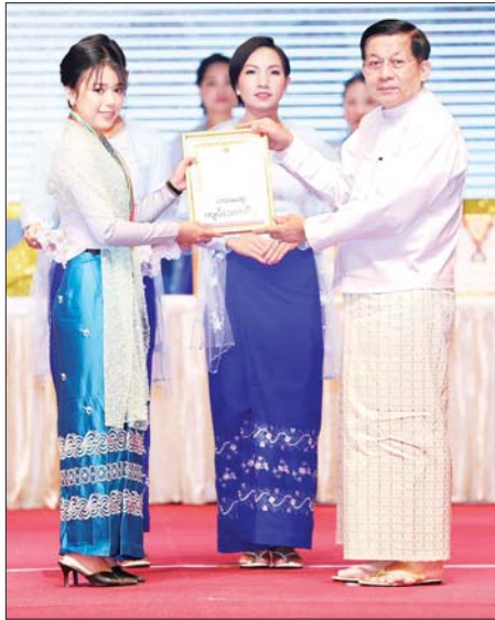
နိုင်ငံတော်စီမံအုပ်ချုပ်ရေးကောင်စီဥက္ကဋ္ဌ နိုင်ငံတော်ဝန်ကြီးချုပ် ဗိုလ်ချုပ်မှူးကြီး မင်းအောင်လှိုင် အဂတိလိုက်စားမှုတိုက်ဖျက်ရေး ဆိုင်ရာ စီဒီယိုပြိုင်ပွဲတွင် ပထမဆုရ ဒေါ်နိုင်းလှနိုးယှဉ်အား ဆုပေးအပ် ချီးမြှင့်စဉ်။