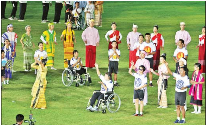
မြန်မာနိုင်ငံ မသန်စွမ်းအားကစားအဖွဲ့ချုပ်မှ ဂုဏ်ပြုဖျော်ဖြေတင်ဆက်မှုကို တွေ့ရစဉ်။