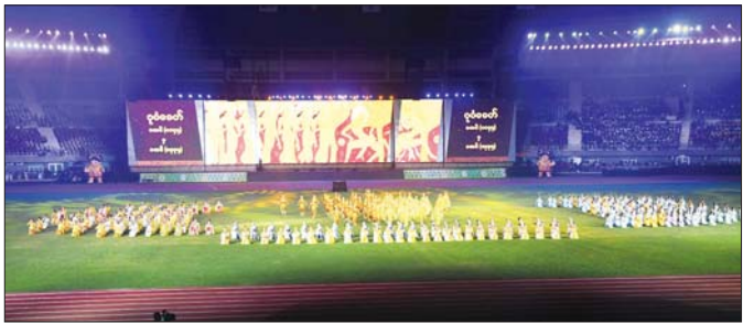
အနုပညာဦးစီးဌာနမှ အနုပညာရှင်များ၏ မြန်မာ့သမိုင်းစဉ်တစ်လျှောက် အထင်အရှားရှိခဲ့သော ပုဂံခေတ်ကို ကိုယ်စားပြုသည့် ယိမ်းအကများဖြင့် သရုပ်ဖော်တင်ဆက်မှုကို တွေ့ရစဉ်။