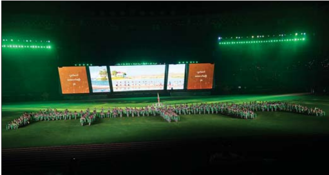
အနုပညာရှင်များက လွှတ်တော်အဆောက်အဦပုံစံ သရုပ်ဖော်ထားသည်ကို တွေ့ရစဉ်။