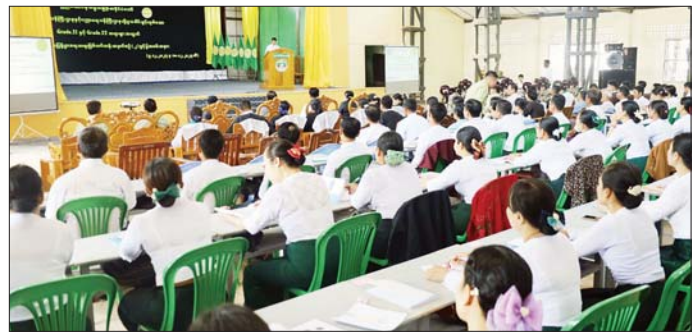
ခရိုင် လပွတ္တာမြို့နယ်၊ မော်လမြိုင်ကျွန်းမြို့နယ် ဇ ရက်မှ ၁၈ ရက်အထိ ၁၀ ရက်ကြာ သင်ကြား ပို့ချများမှ သင်တန်းသား သင်တန်းသူ စုစုပေါင်း ၂၀၄ ဦး တို့ကို သင်တန်းနည်းပြဆရာ ရှစ်ဦးတို့က ဒီဇင်ဘာ ၉ မည်ဖြစ်ကြောင်း သိရသည်။ ဇယော(မြောင်းမြ)

ဖွင့်ပွဲအခမ်းအနားကို ယနေ့နံနက် ၁၀ နာရီက တက်ရောက်ခဲ့သည်။ ဦးစွာ တိုင်းဒေသကြီးဝန်ကြီးချုပ်က အမှာစကားပြောကြားပြီး သင်တန်းသား သင်တန်းသူများကို ထောက်ပံ့ငွေကျပ် ၁၀ သိန်း ပေးအပ်သည်။ ဆက်လက်၍ ဥပဒေရေးရာဝန်ကြီးဌာန ပြည်ထောင်စုဝန်ကြီးချုပ်နှင့် ပြည်ထောင်စုရေ နေချုပ်ကိုယ်စားတိုင်းဒေသကြီးဥပဒေချုပ် ဒေါ်ခင်ခင်နွယ်က သင်တန်းနှင့်စပ်လျဉ်း၍ ရှင်းလင်းပြောကြားပြီး ဥပဒေရေးရာအသိပညာပြန့်ပွားရေး Video Clips ပြသသည်။ ထို့နောက် သင်တန်းသား သင်တန်းသူတစ်ဦးလျှင် စားသုံးဆီ နှစ်ပိဿာကို ငွေကျပ် ၁၈၀၀ နှုန်းဖြင့် ရောင်းချပေးသွားမည်ဖြစ်ကြောင်း သိရသည်။ အဆိုပါသင်တန်းကို မြောင်းမြခရိုင် မြောင်းမြမြို့နယ်၊ အိမ်မိမြို့နယ်၊ ဝါးဝယ်မြို့နယ်နှင့် လပွတ္တာ