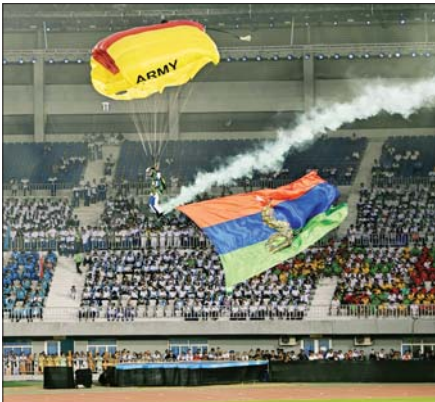
လေထီးစစ်သည်များက အမျိုးသားအားကစားပွဲတော်အလံနှင့် တိုင်းဒေသကြီး၊ ပြည်နယ်အလံများကို ဝေဟင်ထက်မှ မြေပြင်သို့ ချိတ်ဆွဲသယ်ဆောင်၍ ကွင်းအတွင်းသို့ ဂုဏ်ပြုဆင်းသက်ကြစဉ်။