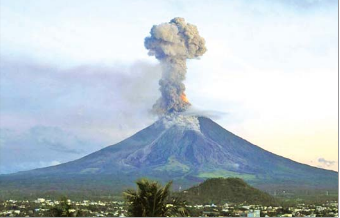
ဖိလစ်ပိုင်နိုင်ငံ အလယ်ပိုင်းရှိ ကန်လာအွန် မီးတောင်ပေါက်ကွဲမှုဖြစ်ပွားနေသည်ကို တွေ့ရပုံ။

ထုတ်ပြန်ခဲ့သည်။ မီးတောင်ထိပ်မှ အမြင့်ပေ မီတာ ၃၀၀၀ အထိ ပြာနှင့်ဓာတ်ငွေ့ များပန်းထွက်ခဲ့ပြီးနောက် အဆိုပါ ပြာနှင့် ဓာတ်ငွေ့များသည် အနောက်-နောက်တောင်ဘက်သို့ ဆက်လက် ပျံ့နှံ့သွားခဲ့ကြောင်း အင်စတီကျူက ဆက်လက် ပြောကြားခဲ့သည်။ မီးတောင်နှင့် ပတ်သက်ပြီး သတိပေးအဆင့် သတ်မှတ် ချက်ပါးချက် ရှိသည့်အနက် အဆင့်သုံးအထိ သတ်မှတ်ထား သည်။ ဒေသခံ ရွာသူရဲသား ၂၀၀၀ ခန့်အား မီးတောင်ပေါက်ကွဲမှု ဖြစ်ပွားရာနေရာနှင့် ခြောက်ကီလို မီတာ အဝန်းအပိုင်းအတွင်း ဝင်ရောက်ခြင်း မပြုရန်နှင့် ဘေး အန္တရာယ်ကင်းရာသို့ ရှောင်ရှား ကြရန် တိုက်တွန်းထားသည်။