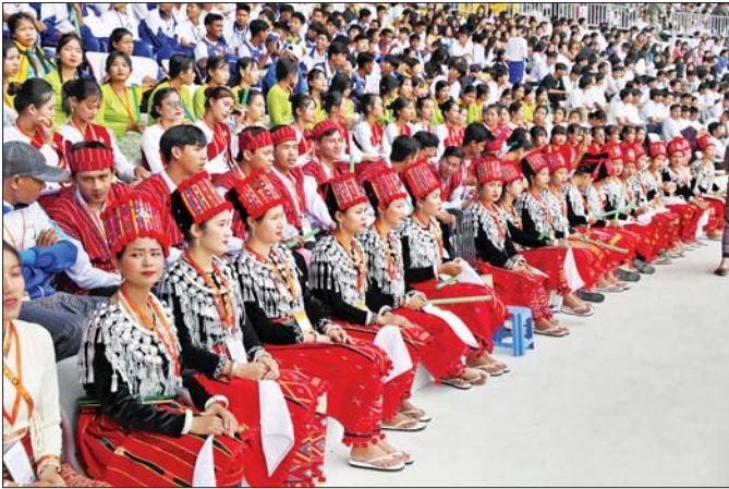
ပဉ္စမအကြိမ်မြောက် အမျိုးသားအားကစားပွဲတော်ဖွင့်ပွဲအခမ်းအနားကို လာရောက်ကြည့်ရှုအားပေးသည့် ပရိသတ်များကို တွေ့ရစဉ်။