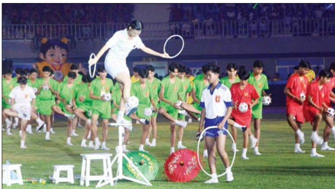
မြန်မာနိုင်ငံရပ်ရှင်အစည်းအရုံးနှင့် မြန်မာနိုင်ငံခြင်းလုံးအဖွဲ့ချုပ်တို့မှ တင်ဆက်သည့် ခြင်းအလှဝတ်သူများကို တွေ့ရစဉ်။