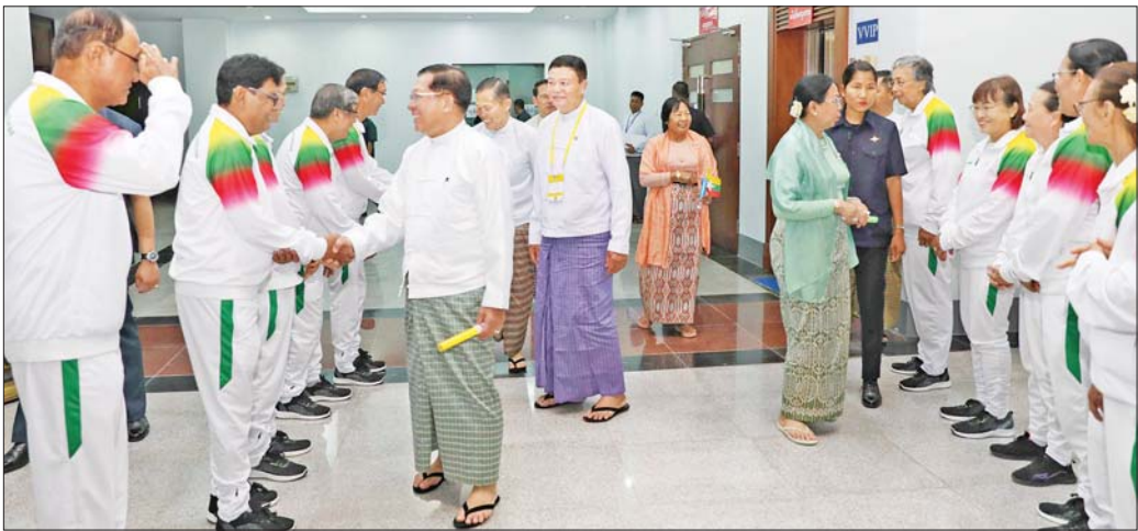
နိုင်ငံတော်စီမံအုပ်ချုပ်ရေးကောင်စီဥက္ကဋ္ဌ နိုင်ငံတော်ဝန်ကြီးချုပ် ဗိုလ်ချုပ်မှူးကြီး မင်းအောင်လှိုင်နှင့်ဇနီး ဒေါ်ကြူကြူလှ နိုင်ငံဂုဏ်ဆောင်ခဲ့ကြသည့် အားကစားသမားဟောင်းကြီးများအား ရင်းရင်းနှီးနှီး နှုတ်ဆက်စဉ်။

မိန့်နန်းပြောကြားပြီးသည်နှင့် တစ်ပြိုင်နက်