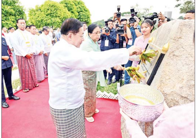
နိုင်ငံတော်စီမံအုပ်ချုပ်ရေးကောင်စီဥက္ကဋ္ဌ နိုင်ငံတော်ဝန်ကြီးချုပ် ဗိုလ်ချုပ်မှူးကြီး မင်းအောင်လှိုင်နှင့်ဇနီး ဒေါ်ကြာကြာလှ ကမ္ဘာ့ဖော်ကွန်းအား အမွှေးနံ့သာရည်များ ပက်ဖျန်းပေးစဉ်။

ချိတ်ဆွဲသယ်ဆောင်၍ ကွင်းအတွင်းသို့ ဂုဏ်ပြု ဆင်းသက်ကြပြီး နိုင်ငံတော်စီမံအုပ်ချုပ်ရေးကောင်စီ ဥက္ကဋ္ဌ နိုင်ငံတော်ဝန်ကြီးချုပ်အား အလေးပြုကြသည်။ ယင်းနောက် တေးသံရုပ်ရှင်အယ်လင်းက “ကျွန်ုပ်တို့ မြန်မာပြည်” သီချင်းဖြင့် ဂုဏ်ပြုသီဆို ဖျော်ဖြေပြီး မြန်မာ့ဆိုင်းဝိုင်း၊ မြန်မာ့တူရိယာများနှင့် ခေတ်မီဆန်းသစ်စွာ မြိုင်မြိုင်ဆိုဆို တီးခတ်ထား သည့် တေးသံသာနှင့်အတူ မီးအလှပြမှု (Lighting Show) ကို တင်ဆက်ပြသသည်။ ဆက်လက်၍ အခမ်းအနားအား အမှတ်စဉ်ရေတွက်၍ ဖွင့်လှစ်ပြီး တစ်ချိန်တည်းတွင် မီးရှူး၊ မီးပန်းများပစ်ဖောက်ကာ သာသနာရေးနှင့် ယဉ်ကျေးမှုဝန်ကြီးဌာန၊ အနုပညာ ဦးစီးဌာနနှင့် ပညာရေးဝန်ကြီးဌာန အခြေခံပညာ ဦးစီးဌာနတို့ ပူးပေါင်း၍ “လှပချစ်စရာ တို့ရွှေမြန်မာ” တေးသီချင်းဖြင့် သရုပ်ဖော်တင်ဆက်ကာပြကြသည်။ နိုင်ငံတော်အလံကို လွှင့်တင် ထို့နောက် နိုင်ငံတော်စစ်တီးဝိုင်းက ကွင်းအတွင်း နေရာယူပြီး အလံတော်အဖွဲ့ ဦးဆောင်၍ ဝန်ကြီးဌာန များ၊ တိုင်းဒေသကြီးနှင့်ပြည်နယ်များမှ ပြိုင်ပွဲဝင် အားကစားအသင်းများ ကွင်းအတွင်းသို့ ဝင်ရောက်