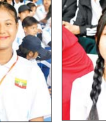
မယွန်းပြည့်မှူးအောင်