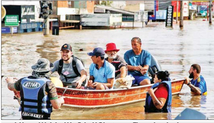
ဘရာဇီးနိုင်ငံတောင်ပိုင်း ရီယိုဂရန်ဒီဒိုဆူပြည်နယ်၌ ဖြစ်ပွားခဲ့သော ရေကြီးမှုအတွင်း ကယ်ဆယ်ရေးသမားများက ရေဘေးသင့်သူများအား ကယ်ဆယ်ရေးဆောင်ရွက်နေပုံ။

က ပြောသည်။ ဆန်တာ ကက်တာရီနာ ပြည်နယ်၏ အကြီးဆုံး မြို့ဖြစ်သည့် ဂျီအင်ဗဲလ်သည် ဒီဇင်ဘာ ၃ ရက်မှ စတင်ကာ ရေကြီးမှုဒဏ်ကိုခံစားခဲ့ရပြီး ဒီဇင်ဘာ ၁၀ ရက်နံနက်ပိုင်းအထိ မိုးဆက်လက်ရွာသွန်းနိုင် ကြောင်း မိုးလေဝသဌာနက ခန့်မှန်းထားသည်။ ဒီလို နှိုင်းဆာရီရာမြို့သည် လွန်ခဲ့သည့် ၄၈ နာရီအတွင်း မိုးရေချိန် ၁၆၆ ဒသမ ၄ မီလီမီတာခန့်ရှိနိုင်ခဲ့ပြီး ဆိုးရွားသည့် မြေပြိုမှုအန္တရာယ် ဖြစ်ပေါ်နိုင်ခြေ များလာကြောင်း အဆိုပါဌာနက ပြောသည်။ ဘရာဇီးနိုင်ငံ၌ မေလမှ စတင်မုန်တိုင်း ဝင်ရောက်တိုက်ခတ်မှုကြောင့် အိမ်နီးချင်း ရီယိုဂရန်ဒီ ဒိုဆူပြည်နယ်၌ ရေကြီးမှုဖြစ်ပွားသဖြင့် လူ ၁၈၃ ဦး သေဆုံးခဲ့ပြီး ယင်းဒေသ၏ ၉၀ ရာခိုင်နှုန်းကျော် ထိခိုက်ခဲ့ကြောင်း သိရသည်။