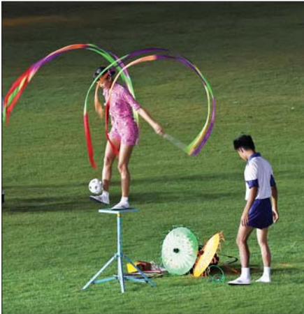
မြန်မာနိုင်ငံရုပ်ရှင်အစည်းအရုံးနှင့် မြန်မာနိုင်ငံခြင်းလုံးအဖွဲ့ချုပ်တို့မှ တင်ဆက်သည့် ခြင်းအလှခတ်သူများကို တွေ့ရစဉ်။