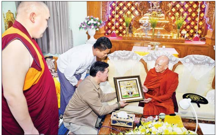
နိုင်ငံတော်သံဃမဟာနာယကအဖွဲ့ ဥက္ကဋ္ဌ ဆရာတော် ဒေါက်တာ ဘဒ္ဒန္တစန္ဒိမာဘိဝံသ ပုဂံရှေးဟောင်းယဉ်ကျေးမှုနယ်မြေ ရှင်းပုံကျောက်စိပ်နန်းချိုကားကို ရုရှားဖက်ဒရေးရှင်းနိုင်ငံ Kalmykia ပြည်နယ်အကြီးအကဲ Mr. Batu Sergeevich Khassikov အား ဓမ္မပဏ္ဍာအဖြစ် ပေးအပ်စဉ်။

ထိုသို့ လာရောက်ဖူးမြော်ကြည်ညိုစဉ် နိုင်ငံတော်သံဃမဟာနာယကအဖွဲ့ ဥက္ကဋ္ဌဆရာတော်ဒေါက်တာ ဘဒ္ဒန္တစန္ဒိမာဘိဝံသက ရုရှားနိုင်ငံသည် ရှေးယခင်ကတည်းက ယဉ်ကျေးမှု၊ စာပေ၊ အနုပညာထွန်းကားခဲ့ပြီး ယခုလည်း ထွန်းကားဆဲဖြစ်သည်ကို သိမြင်ရပါကြောင်း၊ ဘက်ပေါင်းစုံ အစဉ်အလာကြီးမားပြီး မြန်မာနိုင်ငံနှင့် ယဉ်ကျေးမှုနှင့်လူမှုရေးရာအပြောအတွတ် ကူးလူးဆက်ဆံနေသည့်အတွက် ဝမ်းမြောက်ပါကြောင်း၊ ရှေးယခင်ကတည်းကပင် သံတမန်ဆက်ဆံရေးရှိခဲ့ပြီး ယခုနိုင်ငံတော်စီမံအုပ်ချုပ်ရေးကောင်စီအစိုးရလက်ထက်တွင် ပိုမိုကောင်းမွန်သည့် သံတမန်ဆက်ဆံရေးများကြောင့် အားတက်ဝမ်းမြောက်ရပါကြောင်း၊ ရုရှားနိုင်ငံ၌ ထေရဝါဒဗုဒ္ဓဘာသာ၏ အထွတ်အမြတ်ထားရာ