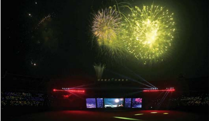
၂၀၂၄ ခုနှစ် ပဉ္စမအကြိမ် အမျိုးသားအားကစားပွဲတော်ဖွင့်ပွဲလှုပ်ခြင်းအထိမ်းအမှတ် စီးဂျူး၊ မီးပန်းများ ပစ်ဖောက်စဉ်။