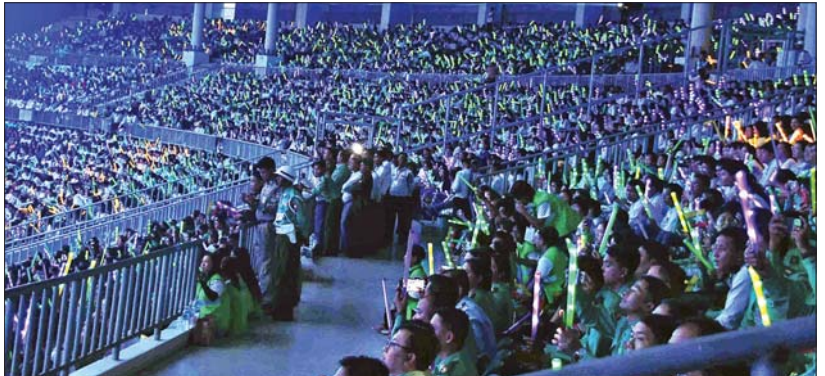
မြန်မာ့ဆိုင်းဝိုင်း၊ မြန်မာ့တူရိယာများနှင့် ခေတ်စီဆန်းသစ်စွာ မြိုင်မြိုင်ဆိုင်ဆိုင် တီးခတ်ထားသည့် တေးသံနှင့်အတူ စီးအလှပြမှု (Lighting Show)ကို တင်ဆက်ပြသစဉ်။