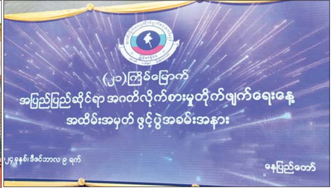
နိုင်ငံတော်စီမံအုပ်ချုပ်ရေးကောင်စီဥက္ကဋ္ဌ နိုင်ငံတော်ဝန်ကြီးချုပ် ဗိုလ်ချုပ်မှူးကြီး မင်းအောင်လှိုင် အပြည်ပြည်ဆိုင်ရာ အဂတိလိုက်စားမှုတိုက်ဖျက်ရေးနေ့ အထိမ်းအမှတ်အခမ်းအနား ဖွင့်ပွဲဆိုင်းဘုတ် ကို စက်ခလုတ်နှိပ် ဖွင့်လှစ်ပေးစဉ်။