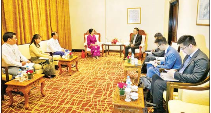
စီယက်နမ်နိုင်ငံ ဟိုင်အန်းမြို့၌ ဒီဇင်ဘာ ၁၀ ရက်မှ ၁၁ ရက်အထိ ကျင်းပမည့် ပထမအကြိမ် ကျေးလက် ဒေသဖွံ့ဖြိုးတိုးတက်ရေးဆိုင်ရာ ခရီးသွားလုပ်ငန်း ညီလာခံတက်ရောက်ရန် လေကြောင်းခရီးဖြင့် ရန်ကုန်မြို့မှ ထွက်ခွာသွားကြောင်း သိရသည်။ သတင်းစဉ်

ဌာနနှင့် အာဆီယံ-တရုတ်စင်တာတို့ ပိုမိုနီးကပ်စွာ ပူးပေါင်းဆောင်ရွက်ရေး၊ မြန်မာနိုင်ငံ၏ ခရီးသွား လုပ်ငန်းဖွံ့ဖြိုးတိုးတက်ရေးအတွက် ကူညီပံ့ပိုးနိုင်ရေး တို့နှင့် စပ်လျဉ်း၍ ရင်းနှီးပွင့်လင်းစွာ ဆွေးနွေးခဲ့ကြပြီး ပြည်ထောင်စုဝန်ကြီးက အာဆီယံ-တရုတ် စင်တာ အတွင်းရေးမှူးချုပ်နှင့် အဖွဲ့အား ညစာဖြင့် တည်ခင်း ညှိနှိုင်းခဲ့သည်။ ယနေ့နံနက်ပိုင်းတွင် ပြည်ထောင်စုဝန်ကြီးသည် ကုလသမဂ္ဂခရီးသွားလုပ်ငန်းအဖွဲ့ (UN Tourism) နှင့် စီယက်နမ်နိုင်ငံ၊ ယဉ်ကျေးမှု၊ အားကစားနှင့် ခရီးသွားလုပ်ငန်းဝန်ကြီးဌာနတို့ ပူးပေါင်းစီစဉ်မှုဖြင့်