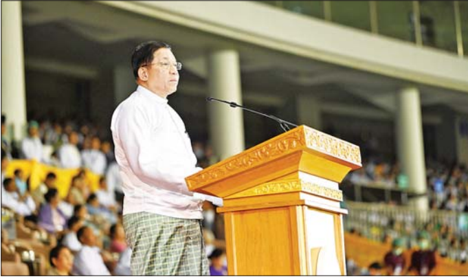
နိုင်ငံတော်စီမံအုပ်ချုပ်ရေးကောင်စီဥက္ကဋ္ဌ နိုင်ငံတော်ဝန်ကြီးချုပ် ဗိုလ်ချုပ်မှူးကြီး မင်းအောင်လှိုင် ၂၀၂၄ ခုနှစ် ပဉ္စမအကြိမ်မြောက် အမျိုးသားအားကစားပွဲတော် ဖွင့်ပွဲအခမ်းအနားတွင် အမှာစကားပြောကြားစဉ်။

◆ ယခုကျင်းပမည့် အမျိုးသားအားကစားပွဲတော်ကြီးကို “နိုင်ငံတော်၏ အားကစား အဆင့်အတန်း ပိုမိုတိုးတက်မြှင့်တင်ပေးရေး၊ (၃၃) ကြိမ်မြောက် အရှေ့တောင်အာရှ အားကစားပြိုင်ပွဲနှင့် အခြားနိုင်ငံတကာအားကစားပြိုင်ပွဲများတွင် ပါဝင်ယှဉ်ပြိုင်နိုင်ပြီး အောင်မြင်မှုရရှိစေရေး၊ နိုင်ငံ့ဂုဏ်ဆောင်နိုင်မည့် အဆင့်မီအားကစားသမားများနှင့် အလားအလာရှိသည့် လူငယ်မျိုးဆက်သစ်အားကစားသမားများ ပေါ်ထွက်လာစေရေး၊ ပြည်နယ်နှင့်တိုင်းဒေသကြီးများ၊ ဝန်ကြီးဌာနများအကြား အချင်းချင်းချစ်ကြည်ရင်းနှီးမှုရရှိပြီး အားကစားလှုပ်ရှားမှုများ ပိုမိုတိုးမြှင့်ဆောင်ရွက်လာစေရေးနှင့် ပြည်သူ့တစ်ရပ်လုံး အားကစားကို ပိုမိုစိတ်ဝင်စားလာပြီး အားကစားလှုပ်ရှားမှုများမှာ ပါဝင်လှုပ်ရှားကစားလာစေရေး” ဟူသည့် ဦးတည်ချက်များ ချမှတ်ဆောင်ရွက်ခြင်းဖြစ်