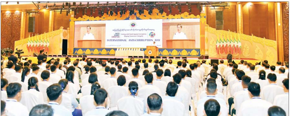
နိုင်ငံတော်စီမံအုပ်ချုပ်ရေးကောင်စီဥက္ကဋ္ဌ နိုင်ငံတော်ဝန်ကြီးချုပ် ဗိုလ်ချုပ်မှူးကြီး မင်းအောင်လှိုင် အပြည်ပြည်ဆိုင်ရာ အဂတိလိုက်စားမှုတိုက်ဖျက်ရေးနေ့ အထိမ်းအမှတ်အခမ်းအနားတွင် အမှာစကားပြောကြားစဉ်။

စက်ခလုတ်နှိပ်ဖွင့်လှစ်ဦးစွာ နိုင်ငံတော်စီမံအုပ်ချုပ်