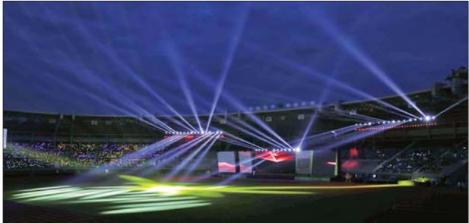
ပဉ္စမအကြိမ်မြောက် အမျိုးသားအားကစားပွဲတော်ဖွင့်ပွဲအခမ်းအနားတွင် စီးအလှပြမှု (Lighting Show) တင်ဆက်ပြသမှုကို တွေ့ရစဉ်။