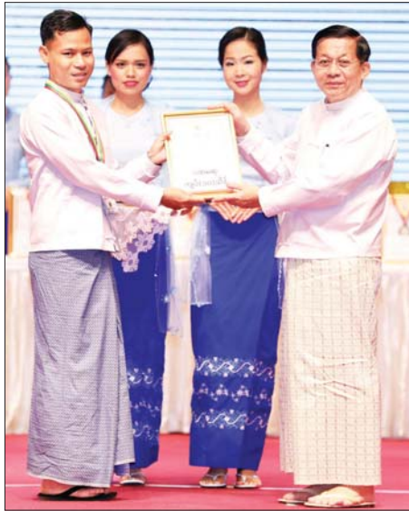
နိုင်ငံတော်စီမံအုပ်ချုပ်ရေးကောင်စီဥက္ကဋ္ဌ နိုင်ငံတော်ဝန်ကြီးချုပ် ဗိုလ်ချုပ်မှူးကြီး မင်းအောင်လှိုင် အဂတိလိုက်စားမှုတိုက်ဖျက်ရေး ဆိုင်ရာ ပိုစတာပြိုင်ပွဲတွင် ပထမဆုရ ဦးအောင်စည်သူအား ဆုပေးအပ် ချီးမြှင့်စဉ်။