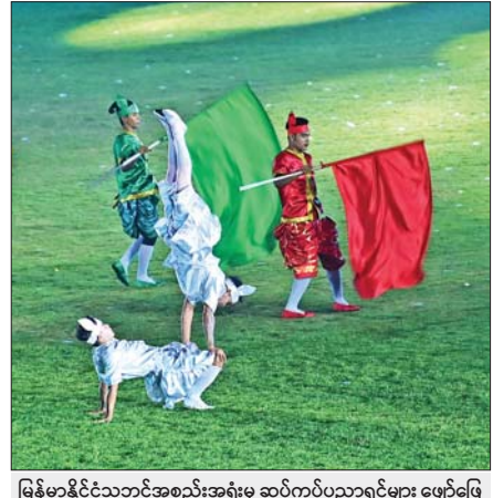
မြန်မာနိုင်ငံသဘင်အစည်းအရုံးမှ ဆပ်ကပ်ပညာရှင်များ ဖျော်ဖြေတင်ဆက်မှုကို တွေ့ရစဉ်။