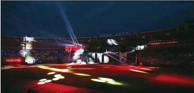
ပဉ္စမအကြိမ်မြောက် အမျိုးသားအားကစားပွဲတော်ဖွင့်ပွဲအခမ်းအနားတွင် စီးအလှပြမှု (Lighting Show) တင်ဆက်ပြသမှုကို တွေ့ရစဉ်။