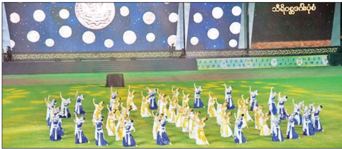
အနုပညာဦးစီးဌာနမှ အနုပညာရှင်များ၏ မြန်မာ့သမိုင်းစဉ်တစ်လျှောက် အထင်အရှားရှိခဲ့သော ဗျူခေတ်ကို ကိုယ်စားပြုသည့် ယိမ်းအကများဖြင့် သရုပ်ဖော်တင်ဆက်မှုကို တွေ့ရစဉ်။