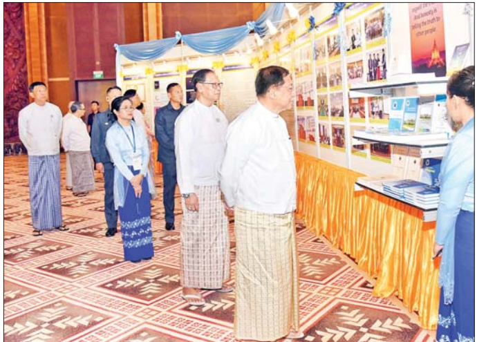
နိုင်ငံတော်စီမံအုပ်ချုပ်ရေးကောင်စီဥက္ကဋ္ဌ နိုင်ငံတော်ဝန်ကြီးချုပ် ဗိုလ်ချုပ်မှူးကြီး မင်းအောင်လှိုင် အဂတိ လိုက်စားမှုတိုက်ဖျက်ရေးလှုပ်ရှားမှုမှတ်တမ်းဓာတ်ပုံများကို စိတ်ပါဝင်စားစွာ လှည့်လည်ကြည့်ရှုစဉ်။

အုပ်ချုပ်ရေးကောင်စီဥက္ကဋ္ဌ နိုင်ငံ တော်ဝန်ကြီးချုပ်က အဂတိ လိုက်စားမှုတိုက်ဖျက်ရေးဆိုင်ရာ ပိုစတာ၊ စီဒီယိုနှင့် ဆောင်းပါး ပြိုင်ပွဲတွင် ဆုရရှိခဲ့ကြသူများအား ဆုပေးပေးအပ်ချီးမြှင့်သည်။