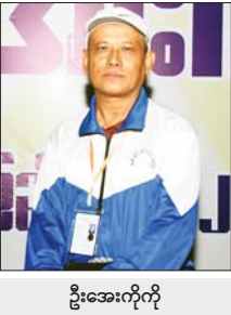
ဦးအေးကိုကို