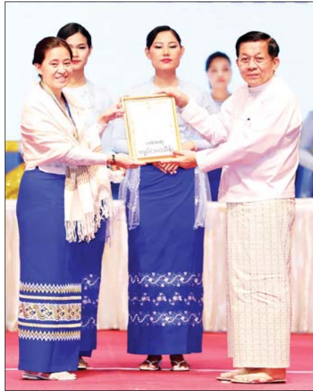
နိုင်ငံတော်စီမံအုပ်ချုပ်ရေးကောင်စီဥက္ကဋ္ဌ နိုင်ငံတော်ဝန်ကြီးချုပ် ဗိုလ်ချုပ်မှူးကြီး မင်းအောင်လှိုင် အဂတိလိုက်စားမှုတိုက်ဖျက်ရေး ဆိုင်ရာ ဆောင်းပါးပြိုင်ပွဲတွင် ပထမဆုရ ဒေါက်တာအိအိသန့်အား ဆုပေးအပ်ချီးမြှင့်စဉ်။