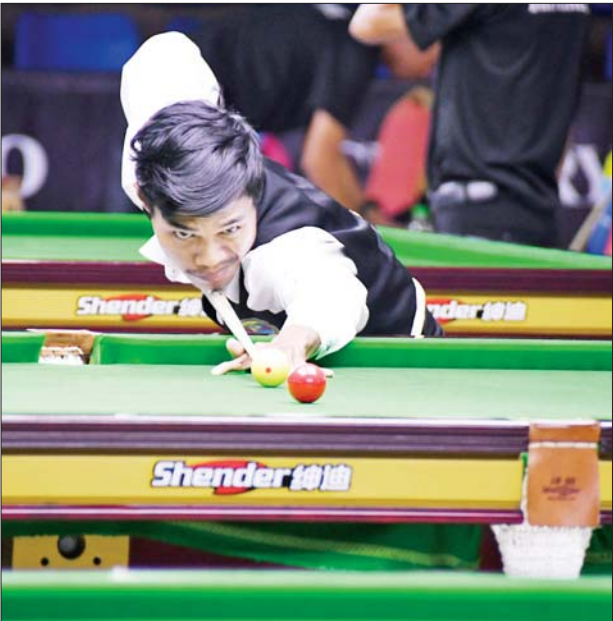
ပြည်နယ်နှင့် တိုင်းဒေသကြီး အမျိုးသား ဘီလီယက်ပြိုင်ပွဲတွင် ပြိုင်ပွဲဝင်တစ်ဦး ယှဉ်ပြိုင်နေစဉ်။

ပြည်နယ်နှင့် တိုင်းဒေသကြီး ကာယဗလနှင့် ကာယကြံ့ခိုင်မှု ပြိုင်ပွဲကို မြန်မာအပြည်ပြည် ဆိုင်ရာကွန်ဗင်းရှင်းဗဟိုဌာန-၂၅ ကျင်းပရာ အမျိုးသား ၂၁ နှစ် အောက် ကာယဗလပြိုင်ပွဲ၊ အမျိုးသား ၅၅ ကီလိုအထိကာယ ဗလပြိုင်ပွဲ၊ အမျိုးသား ၆၀ ကီလို အထိကာယဗလပြိုင်ပွဲ၊ အမျိုး သား ၆၅ ကီလိုအထိကာယဗလ ပြိုင်ပွဲ၊ အမျိုးသား ၁၇၀ စင်တီ မီတာအထိကာယကြံ့ခိုင်မှုပြိုင်ပွဲ၊ စာမျက်နှာ ၁၃ သို့ ☆