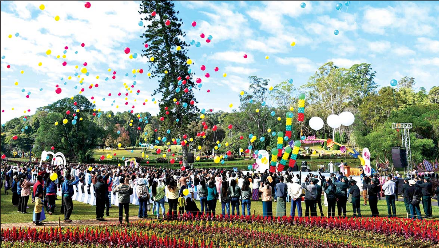
ပြင်ဦးလွင်မြို့ အမျိုးသားကန်တော်ကြီးဥယျာဉ် နှစ်(၁၀၀)ပြည့်အထိမ်းအမှတ် (၁၇)ကြိမ်မြောက်ပန်းပွဲတော် ဖွင့်ပွဲအခမ်းအနားကျင်းပစဉ်။

ပြည်ထောင်စုသမ္မတမြန်မာနိုင်ငံတော် နိုင်ငံတော်စီမံအုပ်ချုပ်ရေးကောင်စီဥက္ကဋ္ဌ နိုင်ငံတော်ဝန်ကြီးချုပ် ဗိုလ်ချုပ်မှူးကြီး သတိုးမဟာသရေစည်သူ သတိုးသိရီသုဓမ္မ မင်းအောင်လှိုင်ထံမှ နှစ်(၅၀)ပြည့် ရွှေရတုအထိမ်းအမှတ် ရခိုင်ပြည်နယ်နေ့အခမ်းအနားသို့ပေးပို့သည့် သဝဏ်လွှာ ( ၂၀၂၄ ခုနှစ်၊ ဒီဇင်ဘာလ ၁၅ ရက် ) ချစ်ခင်လေးစားအပ်ပါသော ရခိုင်ပြည်နယ်အတွင်းရှိ မိဘပြည်သူ့အိမ်ကိုမောင်နှမအပေါင်းတို့ခင်ဗျာ ယနေ့ ၂၀၂၄ ခုနှစ်၊ ဒီဇင်ဘာလ(၁၅)ရက်နေ့တွင် ကျရောက်သည့် နှစ်(၅၀)ပြည့် ရွှေရတုအထိမ်းအမှတ် ရခိုင်ပြည်နယ်နေ့ နေ့ထူးနေ့မြတ်အခါသမယ၌ ရခိုင်ပြည်နယ်နှင့်ဒေသအသီးသီးတွင် ရောက်ရှိနေထိုင်ကြသော ရခိုင်တိုင်းရင်းသား သွေးချင်းညီအစ်ကိုမောင်နှမများနှင့် နိုင်ငံတစ်ဝန်းရှိ ပြည်ထောင်စုဖွားတိုင်းရင်းသား ပြည်သူများအားလုံး ကိုယ်စိတ်နှစ်ဖြာ သုခချမ်းသာပြည့်စုံကြ၍ ကောင်းကျိုးလိုအပ်ဆန္ဒများ ပြည့်ဝကြပါစေကြောင်း ဦးစွာဆုမွန်ကောင်းတောင်းလျက် နှုတ်ခွန်းဆက်သအပ်ပါသည်။ ရခိုင်ပြည်နယ်နေ့သည် ပြည်ထောင်စုဖွားရခိုင်တိုင်းရင်းသားတို့အတွက် ထူးခြားလေးနက်သော ဝိသေသများနှင့်ပြည့်စုံပြီး ဂုဏ်ယူဖွယ်ရာ မင်္ဂလာရှိသောနေ့ဖြစ်ပါသည်။ ၁၉၇၄ ခုနှစ်တွင် ရေးဆွဲအတည်ပြုခဲ့သည့် ဖွဲ့စည်းပုံအခြေခံဥပဒေအရ တိုင်းနှင့်ပြည်နယ်များ သတ်မှတ်ပြဋ္ဌာန်းရာတွင် ရခိုင်ပြည်နယ်သည်လည်း ပြည်နယ်တစ်ခုအဖြစ်ပါရှိခဲ့ပါသည်။ ယင်း ၁၉၇၄ ခုနှစ်တွင် ဖွဲ့စည်းပုံအခြေခံဥပဒေအတည်ပြုရေးအတွက် ဆန္ဒခံယူပွဲစတင်ကျင်းပခဲ့သည့် ဒီဇင်ဘာလ (၁၅)ရက်နေ့ကို ရခိုင်ပြည်နယ်နေ့အဖြစ် သတ်မှတ်ခဲ့ရာ ၂၀၂၄ ခုနှစ်၊ ဒီဇင်ဘာလ(၁၅)ရက်နေ့တွင် နှစ်(၅၀)ပြည့်မြောက်ပြီ ဖြစ်ပါသဖြင့် ရွှေရတုအထိမ်းအမှတ်နှစ်အဖြစ် သမိုင်းဝင်မော်ကွန်းတင်ပြီး အောင်လံစိုက်ထူကမ္ဘာ့အထိမ်းအမှတ်ပေးပို့ခြင်းဖြစ်ပါသည်။ စာမျက်နှာ ၃ ကော်လံ ၁ သို့ ☆