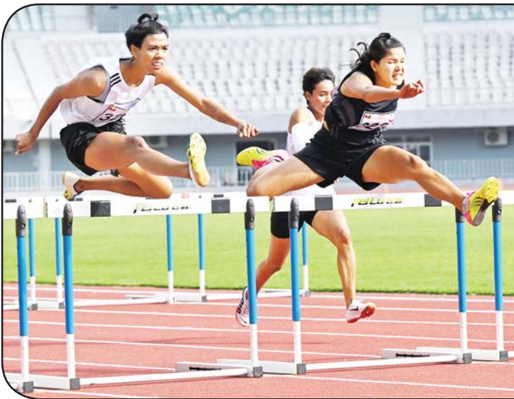
ပြည်နယ်နှင့် တိုင်းဒေသကြီး အမျိုးသမီး မီတာ(၁၁၀)တန်းကျော်ပြိုင်ပွဲတွင် ပြိုင်ပွဲဝင်များ ယှဉ်ပြိုင်နေစဉ်။