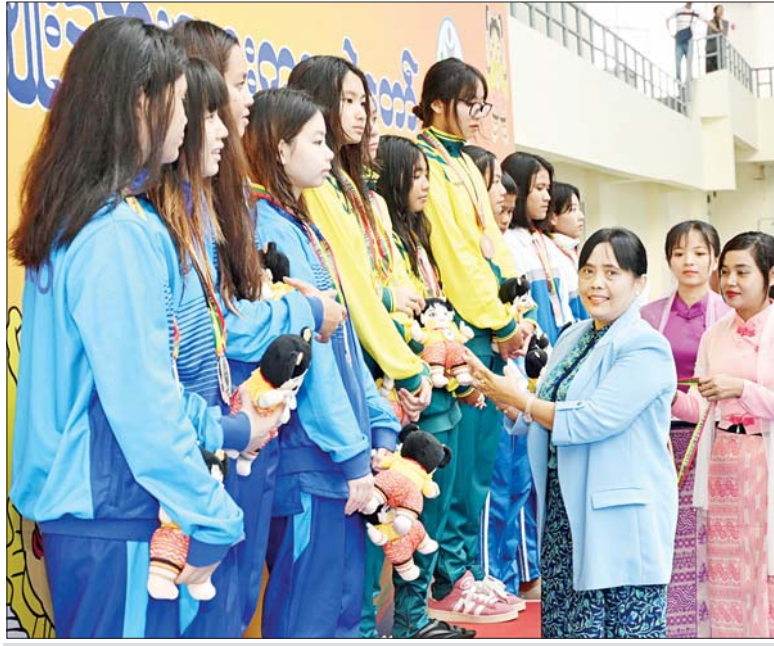
ပြည်ထောင်စုဝန်ကြီးနှင့် ပြည်ထောင်စုရှေ့နေချုပ် ဒေါက်တာသီတာဦး ပြည်နယ်နှင့် တိုင်းဒေသကြီးအဆင့်ရေကူးပြိုင်ပွဲ အမျိုးသမီး မီတာ ၅၀ x ၄ လွန်းပျံအလွတ်ကူး ပြိုင်ပွဲတွင် ပထမဆုရရှိသည့် ရန်ကုန်တိုင်းဒေသကြီးအသင်းမှ ပြိုင်ပွဲဝင်အား ဆုပေးအပ်ချီးမြှင့်စဉ်။

အလားတူ ဝန်ကြီးဌာနအဆင့် ပြေးခုန်ပစ်ပြိုင်ပွဲ ဗိုလ်လုပွဲ စဉ်များကို ဝဏ္ဏသိဒ္ဓိအားကစားကွင်း၌ကျင်းပရာ နိုင်ငံတော်စီမံအုပ်ချုပ်ရေးကောင်စီဝင် ပြည်ထဲရေးဝန်ကြီးဌာနနှင့် တတိယဆုရရှိသည့် စိုက်ပျိုးရေး၊ မွေးမြူရေးနှင့် ဆည်မြောင်းဝန်ကြီးဌာနမှ ပြိုင်ပွဲဝင်များကိုလည်းကောင်း၊ ဂုဏ်ပြုဆုတံဆိပ်နှင့် အမျိုးသားအားကစားပွဲတော် အထိမ်းအမှတ်အရပ်များအား ပေးအပ်ချီးမြှင့်ကြသည်။