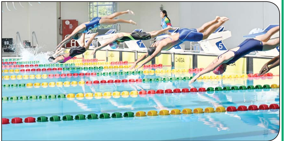
ပြည်နယ်နှင့် တိုင်းဒေသကြီး အမျိုးသမီး မီတာ(၅၀)အလွတ်ကူးပြိုင်ပွဲတွင် ပြိုင်ပွဲဝင်များ ယှဉ်ပြိုင်နေစဉ်။