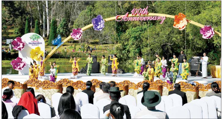
အမျိုးသားကန်တော်ကြီးဥယျာဉ် နှစ်(၁၀၀)ပြည့် အထိမ်းအမှတ် (၁၇)ကြိမ်မြောက် ပန်းပွဲတော်ဖွင့်ပွဲ တွင် ရိုးရာယဉ်ကျေးမှုအကများဖြင့် ဖျော်ဖြေတင်ဆက်စဉ်။