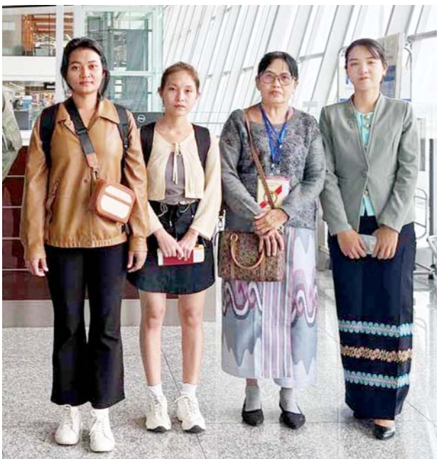
နှင့် မချစ်စုစုကျော် နှစ်ဦးတို့အား ဗီယက်နမ်နိုင်ငံ နိုင်ငံခြားရေးဝန်ကြီး ဌာန သက်ဆိုင်ရာ အာဏာပိုင် ပို့ဆောင်နိုင်ရန် မြန်မာသံရုံးသည် အဖွဲ့အစည်းများနှင့် ချိတ်ဆက်၍

ရန်ကုန် ဒီဇင်ဘာ ၁၄ နိုင်ငံတော် အစိုးရအနေဖြင့် ပြည်ပတွင်ရောက်ရှိနေသည့် အမိ နိုင်ငံသားများ အခက်အခဲကြုံတွေ့ ရပါက နိုင်ငံသားများအပေါ် အလေး အနက် တန်ဖိုးထားသည့်အနေဖြင့် မည်သို့သော အခြေအနေနှင့် တွေ့ကြုံရသည်ဖြစ်စေ မြန်မာ သံရုံး၊ မြန်မာကောင်စစ်ဝန်ချုပ်ရုံး တို့သည် သက်ဆိုင်ရာသံရုံးများ နှင့်ချိတ်ဆက်၍ အမိနိုင်ငံသားများ မြန်မာနိုင်ငံသို့ အမြန်ဆုံးအေးချမ်း လုံခြုံစွာ ပြန်လည်ရောက်ရှိနိုင်ရေး စီစဉ် ဆောင်ရွက်ပေးလျက်ရှိ သည်။ ထိုသို့ ဆောင်ရွက်ပေးလျက်ရှိ ရာ ဗီယက်နမ်နိုင်ငံ Cao Bang ပြည်နယ်အတွင်း အလုပ်လုပ်ကိုင် စဉ် အခက်အခဲများ ကြုံတွေ့နေရ သည့် မြန်မာနိုင်ငံသူ မန္တလေးခရိုင်