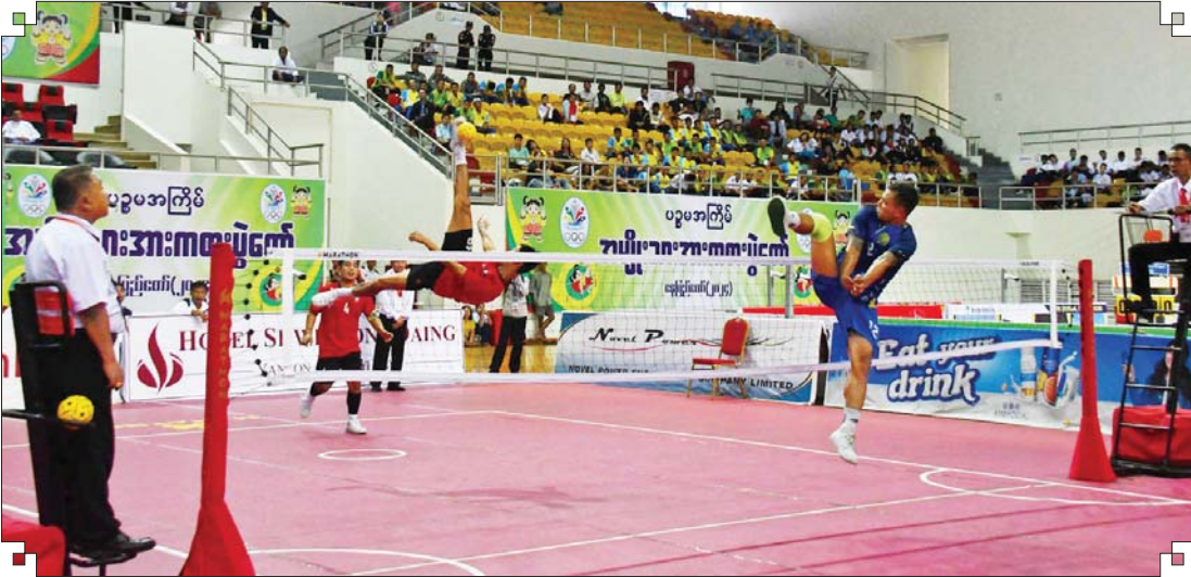
ဝန်ကြီးဌာနပေါင်းစုံ အမျိုးသား ပိုက်ကျော်ခြင်းပြိုင်ပွဲတွင် ဟိုတယ်နှင့်ခရီးသွားလာရေးဝန်ကြီးဌာနအသင်းနှင့် ကာကွယ်ရေးဝန်ကြီးဌာနအသင်းတို့ ယှဉ်ပြိုင်ကစားကြစဉ်။