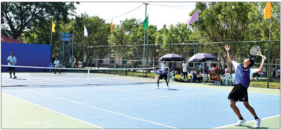
ပြည်နယ်နှင့်တိုင်းဒေသကြီး အမျိုးသားနှစ်ယောက်တွဲ တင်းနစ်ပြိုင်ပွဲတွင် ကရင်ပြည်နယ်အသင်းနှင့် ရှမ်းပြည်နယ်အသင်းတို့ ယှဉ်ပြိုင်ကစားကြစဉ်။

ဖြင့် အနိုင်ရရှိခဲ့ကြသည်။ ဝန်ကြီးဌာနပေါင်းစုံ အလွတ်တန်း အမျိုးသားဘောလုံးပြိုင်ပွဲ အုပ်စုပွဲစဉ်များကို ပေါင်းလောင်းအားကစားကွင်း၊ ရွှေကြာပင်အားကစားကွင်းနှင့် လယ်ဝေးTC-2 အားကစားကွင်းတို့၌ ယှဉ်ပြိုင်ကစားကြရာ လူမှုဝန်ထမ်း၊ ကယ်ဆယ်ရေးနှင့် ပြန်လည်နေရာချထားရေးဝန်ကြီးဌာန အသင်းက ကျန်းမာရေးဝန်ကြီးဌာနအသင်းကို နှစ်ဂိုး - ဂိုးမရှိ၊ စီမံကိန်းနှင့် ဘဏ္ဍာရေးဝန်ကြီးဌာနအသင်းက ပညာရေးဝန်ကြီးဌာနအသင်း