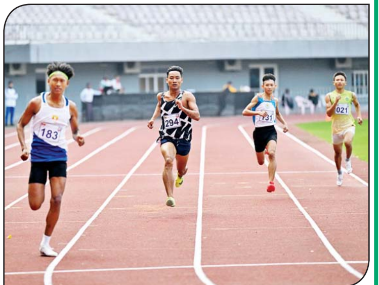
ပြည်နယ်နှင့် တိုင်းဒေသကြီး အမျိုးသား မီတာ(၄၀၀)အပြေးပြိုင်ပွဲတွင် ပြိုင်ပွဲဝင်များ ယှဉ်ပြိုင်နေစဉ်။