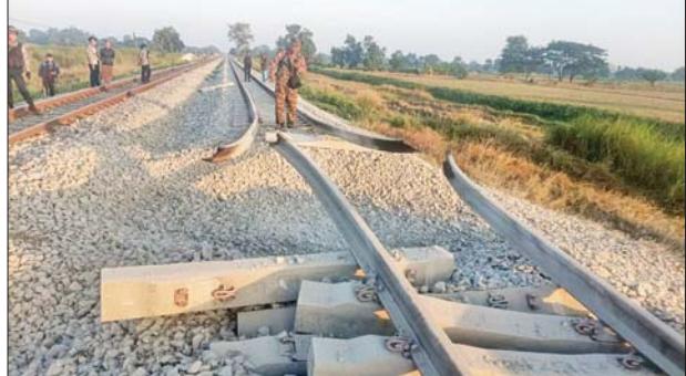
ရန်ကုန်-မန္တလေးရထားလမ်းပိုင်းအတွင်းရှိ တော်ဝိနှင့် ပိန်းလုပ်ဘူတာအကြား အစုန်ရထားလမ်းပေါ်၌ အကြမ်းဖက်သောင်းကျန်းသူအဖွဲ့က မိုင်းဖောက်ခွဲမှုကြောင့် ပျက်စီးမှုအခြေအနေကို တွေ့ရစဉ်။

ခရီးသည်များနှင့် ကုန်စည်များ ထိခိုက်ပျက်စီးဆုံးရှုံးစေရေး၊ ရထားစီးခရီးသွားပြည်သူများအနေဖြင့် ရထားဖြင့် ခရီးသွားလာရာတွင် ကိုယ်စိတ်နှလုံးချမ်းမြေ့ပြီး အသက်အန္တရာယ် ကင်းရှင်းစွာဖြင့် လုံခြုံစိတ်ချစွာ သွားလာနိုင်မှုမရှိစေရေးအတွက် ရည်ရွယ်ပြီး ယခုကဲ့သို့ အကြိမ်ကြိမ်ကျူးလွန်ဖျက်ဆီးနေကြခြင်းဖြစ်သော်လည်း နိုင်ငံတော်အစိုးရအနေဖြင့် အများပြည်သူ ခရီးသွားလာမှုနှင့် ကုန်စည်ပို့ဆောင်မှု အဆင်ပြေချောမွေ့မြန်ဆန်စေရေးအတွက် ရထားလမ်းနှင့် အခြေခံအဆောက်အအုံများ ပိုမိုတိုးတက်ကောင်းမွန်လာစေရေး၊ ရထားပို့ဆောင်ရေးစနစ် အဆင့်မြှင့်တင်ရေးစီမံကိန်းလုပ်ငန်းများကို ရည်မှန်းချက်ထားရှိ၍ အစဉ်တစိုက်အလေးထားစီမံဆောင်ရွက်ပေးလျက်ရှိကြောင်း သိရသည်။ သတင်းစဉ်