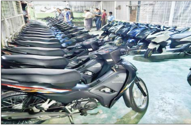
ပဲခူးတိုင်းဒေသကြီး၌ သိမ်းဆည်းရမိမှု။

ထို့ပြင် ပဲခူးတိုင်းဒေသကြီး တရားမဝင်ကုန်သွယ်မှုတိုက်ဖျက်ရေး အဖွဲ့အဖွဲ့၏ စီမံခန့်ခွဲမှုဖြင့် တာဝန်ကျပူးပေါင်းအဖွဲ့များက စစ်ဆေးမှု များ ဆောင်ရွက်ခဲ့ရာ ဒီဇင်ဘာ ၁၂ ရက်တွင် ပဲခူးမြို့ ကျွန်းရိုးတန်းလမ်း ပန်းလှိုင်ရပ်ကွက်ရှိ ဂိုဒေါင်နှစ်လုံးအတွင်းမှ တရားဝင်စာရွက်စာတမ်း အထောက်အထား တင်ပြနိုင်ခြင်းမရှိသည့် စားသောက်ကုန်ပစ္စည်း ခုနစ်မျိုး (ခန့်မှန်းတန်ဖိုးငွေကျပ် ၂၅၄၂၉၀၀၀)နှင့် ဘုရားကြီးမြို့ ရွှေသံလွင်တိုးဂိတ်အနီး၌ မြဝတီမြို့မှ ရန်ကုန်မြို့သို့ သွားရောက်မည့် ယာဉ်တစ်စီးပေါ်မှ တရားဝင်စာရွက်စာတမ်းအထောက်အထား တင်ပြ နိုင်ခြင်းမရှိသည့် လုပ်ငန်းသုံးပစ္စည်း တစ်မျိုး (ခန့်မှန်းတန်ဖိုးငွေကျပ် ၁၀၀၅၀၀၀)၊ အဆိုပါပစ္စည်းများ တင်ဆောင်လာသည့် စက်မှုဇုန်ထုတ် Paya ယာဉ်တစ်စီး (ခန့်မှန်းတန်ဖိုးငွေကျပ် ၂၀၀၀၀၀၀) တို့ကို အကောက်ခွန် လုပ်ထုံးလုပ်နည်းများအရလည်းကောင်း၊ ဒီဇင်ဘာ ၁၃ ရက်တွင် သာယာဝတီခရိုင် လက်ပံတန်းမြို့နယ်၌ တရားမဝင်စက်သုံးဆီ ဒီဇယ်ဆီ ၂၅ ပီပါ၊ ဓာတ်ဆီ ၁၈ ပီပါ (ခန့်မှန်းတန်ဖိုးငွေကျပ်