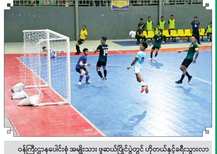
ဝန်ကြီးဌာနပေါင်းစုံ အမျိုးသား ဖူဆယ်ပြိုင်ပွဲတွင် ဟိုတယ်နှင့်ခရီးသွားလာ ရေးဝန်ကြီးဌာနအသင်းနှင့် စိုက်ပျိုးရေး၊ မွေးမြူရေးနှင့်ဆည်မြောင်းဝန်ကြီးဌာန အသင်းတို့ ယှဉ်ပြိုင်ကစားကြစဉ်။