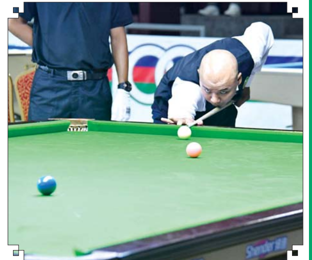
ပြည်နယ်နှင့် တိုင်းဒေသကြီး အမျိုးသား ဘီလီယက်ပြိုင်ပွဲ တွင် ပြိုင်ပွဲဝင်တစ်ဦး ယှဉ်ပြိုင်နေစဉ်။