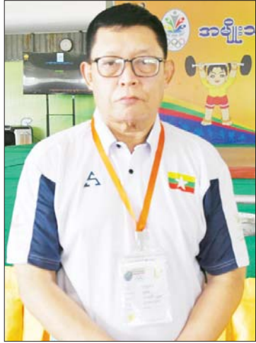
ဗိုလ်ကြီးသီဟန်

ဗိုလ်ကြီးသီဟန် အထွေထွေအတွင်းရေးမှူး မြန်မာနိုင်ငံအလေးမအဖွဲ့ချုပ်