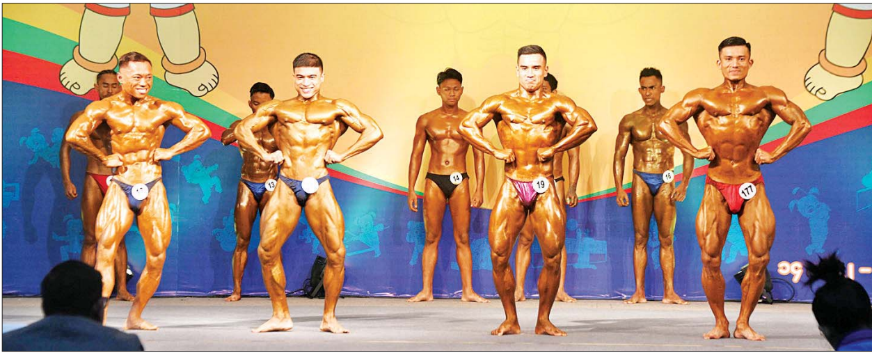
ပြည်နယ်နှင့် တိုင်းဒေသကြီး ကာယဗလမောင်ပြိုင်ပွဲ ၅၅ ကီလိုတန်းတွင် ပြိုင်ပွဲဝင်များ ယှဉ်ပြိုင်နေစဉ်။

ထို့ပြင် အမျိုးသားလှံတံပစ် ပြိုင်ပွဲတွင် အားကစားနှင့် လူငယ်