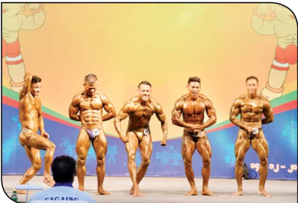
ပြည်နယ်နှင့် တိုင်းဒေသကြီး ကာယဗလမောင်ကြံ့ခိုင်မှုပြိုင်ပွဲတွင် ပြိုင်ပွဲဝင်များ ယှဉ်ပြိုင်နေစဉ်။