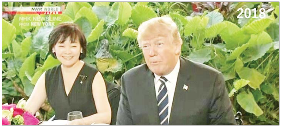
ဂျပန်ဝန်ကြီးချုပ် အိရှိဘာ ရှင်ဂီရူသည် အမေရိကန်ရွေးကောက်ခံသမ္မတ ဒေါ်နယ်ထရမ်နှင့် လူတစ်ဆင့် နှစ်နိုင်ငံကိစ္စရပ်များကို ဆွေးနွေးလျက်ရှိကြောင်း သိရသည်။ ကိုးကား - အင်န်အိတ်ချီကေဘာသာပြန် - အောင်ကျော်ကျော်

ထရမ်သည် သမ္မတရာထူးတာဝန်များကို ထမ်းဆောင်ခြင်းမရှိသေးမီ ဂျပန်နိုင်ငံက အမေရိကန်နှင့် ရင်းနှီးသည့်ဆက်ဆံရေးကို ထိန်းသိမ်းရန် ကြိုးပမ်းနေချိန်တွင် ယခုညစာစားပွဲကို ကျင်းပခြင်းဖြစ်သည်။