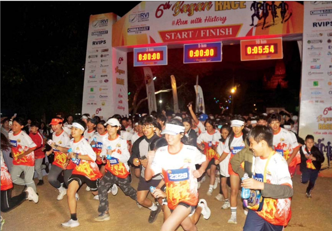
ပုဂံရှေးဟောင်းယဉ်ကျေးမှုနယ်မြေအတွင်း (၆)ကြိမ်မြောက် Bagan Race 2024 အပြေးပြိုင်ပွဲကျင်းပစဉ်။