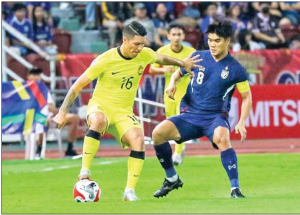
ထိုင်းအသင်းနှင့် မလေးရှားအသင်းတို့ ယှဉ်ပြိုင်နေစဉ်။