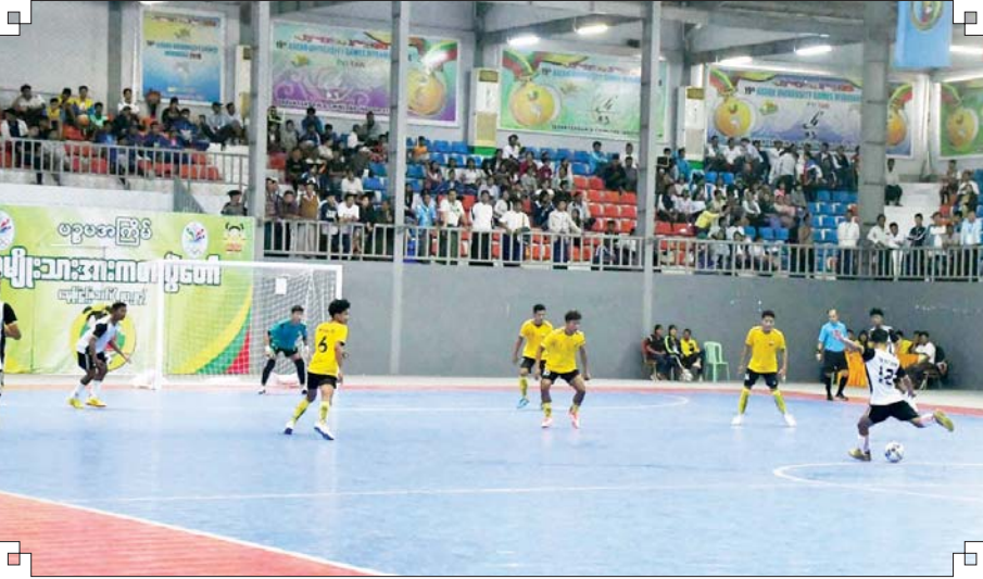
ဝန်ကြီးဌာနပေါင်းစုံ အမျိုးသား ဖူဆယ်ပြိုင်ပွဲတွင် စွမ်းအင်ဝန်ကြီးဌာနအသင်းနှင့် လျှပ်စစ် စွမ်းအားဝန်ကြီးဌာနအသင်းတို့ ယှဉ်ပြိုင်ကစားကြစဉ်။