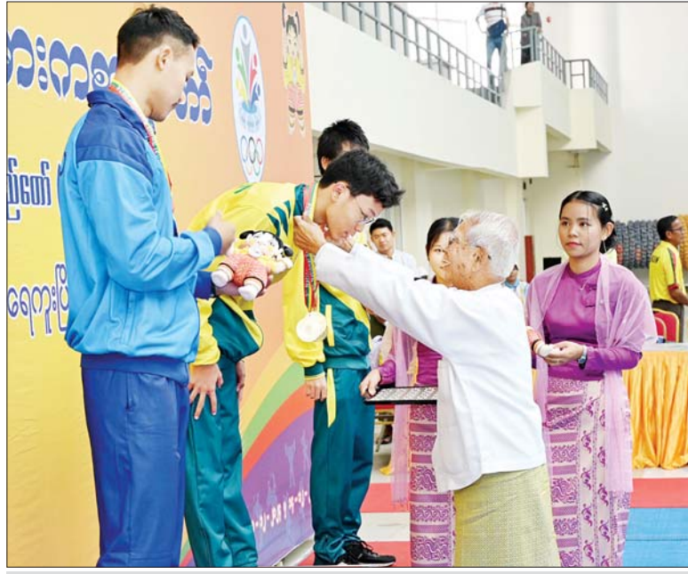
နိုင်ငံတော်စီမံအုပ်ချုပ်ရေးကောင်စီဝင် ဦးညွှန်ထွန်း ပြည်နယ်နှင့် တိုင်းဒေသကြီးအဆင့်ရေကူးပြိုင်ပွဲ အမျိုးသား မီတာ ၅၀ အလွတ်ကူးပြိုင်ပွဲတွင် ပထမဆုရရှိသည့် ရန်ကုန်တိုင်းဒေသကြီးအသင်းမှ ပြိုင်ပွဲဝင်အား ဆုပေးအပ်ချီးမြှင့်စဉ်။

ပြည်ထောင်စုရာထူးဝန်အဖွဲ့အဖွဲ့ဝင် ဒေါ်ခင်မျိုးမြင့်က အမျိုးသမီး မီတာ ၁၅၀၀ အပြေးပြိုင်ပွဲတွင် ပထမဆုနှင့် ဒုတိယဆုရရှိသည့် ပြည်ထဲရေးဝန်ကြီးဌာနနှင့် လူငယ်ရေးရာဝန်ကြီးဌာနတို့မှ ပြိုင်ပွဲဝင်များကို လည်းကောင်း၊ ပြည်ထောင်စုရာထူးဝန်အဖွဲ့ အဖွဲ့ဝင် ဦးဆန်းမြင့်က အမျိုးသမီး သုံးဆင့်ခုန်ပြိုင်ပွဲတွင် ပထမဆုရရှိသည့် ကာကွယ်ရေးဝန်ကြီးဌာန၊ ဒုတိယဆုရရှိသည့် ပြည်ထဲရေးဝန်ကြီးဌာနနှင့် တတိယဆုရရှိသည့် စိုက်ပျိုးရေး၊ မွေးမြူရေးနှင့် ဆည်မြောင်းဝန်ကြီးဌာနမှ ပြိုင်ပွဲဝင်များကိုလည်းကောင်း၊ ဂုဏ်ပြုဆုတံဆိပ်နှင့် အမျိုးသားအားကစားပွဲတော် အထိမ်းအမှတ်အရပ်များအား ပေးအပ်ချီးမြှင့်ကြသည်။