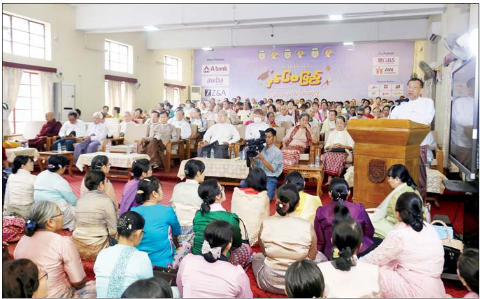
ရန်ကုန်စီးပွားရေးတက္ကသိုလ် စတင်ထူထောင်ခြင်း နှစ် (၆၀) ပြည့် အထိမ်းအမှတ်အဖြစ် စီးပွားရေးလုပ်ငန်းရှင်များကလည်း လုပ်ငန်းအလိုက် ထုတ်ကုန်

ပြီး နှစ် (၆၀) ပြည့်အထိမ်းအမှတ် အခမ်းအနားကျင်းပဆောင်ရွက်မှုကို ရှင်းလင်းကာ တက်ရောက်လာကြသည့် ဆရာကြီး ဆရာမကြီးများကလည်း မြတ်ဆရာပူဇော်ပွဲအထိမ်းအမှတ်အဖြစ် ဝမ်းမြောက်ကြောင်း အမှာစကားများ ပြောကြားကြသည်။ မြတ်ဆရာပူဇော်ပွဲသို့ ဖိတ်ကြားထားသည့် ဆရာကြီး ဆရာမကြီး ၂၅၆ ဦးမှ ၁၃၄ ဦးတို့သည် ကိုယ်တိုင်တက်ရောက်ကြပြီး အခြားဆရာကြီး ဆရာမကြီးများက အွန်လိုင်းမှ ပါဝင်တက်ရောက်ကြကာ မြတ်ဆရာပူဇော်ပွဲ အခမ်းအနားအပြီးတွင် ဖိတ်ကြားထားသည့် ဆရာကြီး ဆရာမကြီးများကို နေ့လယ်စာဖြင့် တည်ခင်းဧည့်ခံကြသည်။ ယင်းနောက် ရန်ကုန်စီးပွားရေးတက္ကသိုလ် ကျောင်းသား ကျောင်းသူဟောင်းများနှင့် တက်ရောက်နေဆဲ ကျောင်းသား ကျောင်းသူများက စတုဒိသာ ကျွေးမွေးခြင်း၊ နိုင်ငံကျော်တေးသံရှင်များက ကျောင်းသီချင်းများဖြင့် ဖျော်ဖြေခြင်းတို့ဆောင်ရွက်ကြရာ ဆရာ ဆရာမများ၊ ကျောင်းသား ကျောင်းသူများနှင့် တက်ရောက်လာသူများက ပျော်ရွှင်စွာ ပါဝင်ဆင်နွှဲ