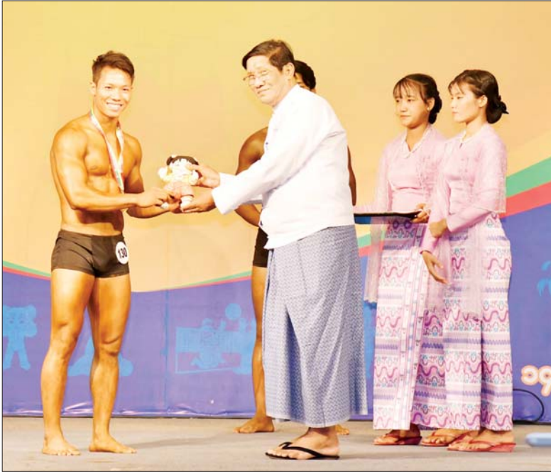
ပြည်ထောင်စုဝန်ကြီး ဦးညွှန်ထွန်း၊ ပြည်နယ်နှင့် တိုင်းဒေသကြီးအဆင့် ကာယဗလ နှင့် ကာယကြံ့ခိုင်မှုပြိုင်ပွဲ အမျိုးသား Fitness Physique ပြိုင်ပွဲတွင် ပထမဆုရရှိသည့် ရန်ကုန်တိုင်းဒေသကြီးအသင်းမှ ပြိုင်ပွဲဝင်အား ဆုပေးအပ်ချီးမြှင့်စဉ်။

ယင်းနောက် ဆောက်လုပ်ရေး ဝန်ကြီးဌာန ဒုတိယဝန်ကြီး ဦးဝင်းဖေက အမျိုးသမီး လှုပ်ရှား ပြိုင်ပွဲတွင် ပထမဆုရရှိသည့် ပြည်ထဲရေးဝန်ကြီးဌာန၊ ဒုတိယ ဆုရရှိသည့် ပို့ဆောင်ရေးနှင့် ဆက်သွယ်ရေး ဝန်ကြီးဌာနနှင့် တတိယဆုရရှိသည့် ဆောက်လုပ် ရေးဝန်ကြီးဌာနတို့မှ ပြိုင်ပွဲဝင်များ ကိုလည်းကောင်း၊ အားကစားနှင့် လူငယ်ရေးရာဝန်ကြီးဌာန ဒုတိယ ဝန်ကြီး ဦးဇော်မင်းထက်က အမျိုးသား ၂၀ ကီလိုမီတာ လမ်း လျှောက်ပြိုင်ပွဲတွင် ပထမဆုရရှိ သည့် ဆောက်လုပ်ရေးဝန်ကြီးဌာန၊ ဒုတိယဆုရရှိသည့် အားကစားနှင့် လူငယ်ရေးရာ ဝန်ကြီးဌာနနှင့် တတိယဆုရရှိသည့် ဆောက်လုပ် ရေးဝန်ကြီးဌာနတို့မှ ပြိုင်ပွဲဝင်များ ကိုလည်းကောင်း၊ နေပြည်တော်