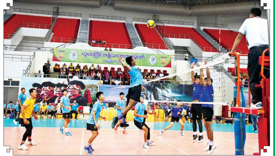
ဝန်ကြီးဌာနပေါင်းစုံ အမျိုးသား ဘော်လီဘောပြိုင်ပွဲတွင် လူဝင်မှုကြီးကြပ်ရေးနှင့် ပြည်သူ့ အင်အားဝန်ကြီးဌာနအသင်းနှင့် ဆောက်လုပ်ရေးဝန်ကြီးဌာနအသင်းတို့ ယှဉ်ပြိုင်ကစားကြစဉ်။