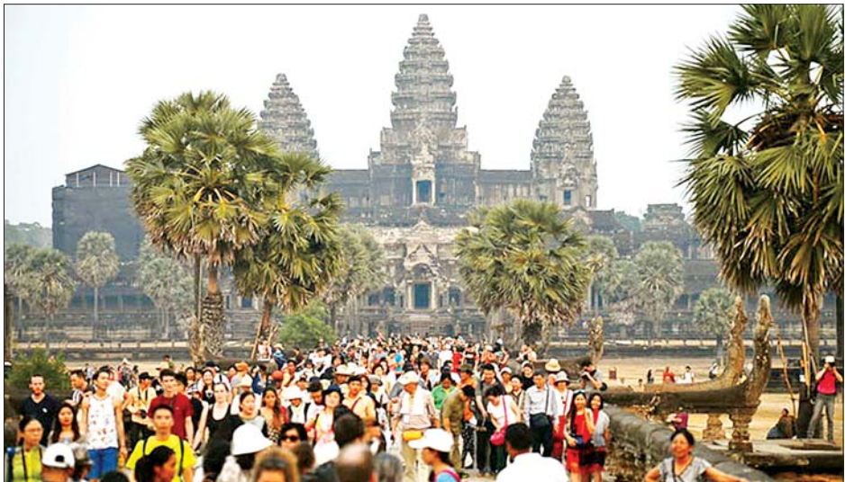
ခရီးသွားဧည့်သည် ဝင်ရောက်မှု တောင်ပိုင်းတွင် ပြုလုပ်သည့် သာသနာ့အဖွဲ့အစည်းများကို ကျော်လွန်မည်ဖြစ်ကြောင်း ကမ္ဘောဒီးယားခရီးသွားလုပ်ငန်းဝန်ကြီး ဟွတ်ဟက်က ကမ်းပေါ်ပြည်နယ် အနောက်ဘက်ပိုင်းတွင် ပြုလုပ်သည့် သာသနာ့အဖွဲ့အစည်းများကို ကျော်လွန်မည်ဖြစ်ကြောင်း ကမ္ဘောဒီးယားခရီးသွားလုပ်ငန်းဝန်ကြီး ဟွတ်ဟက်က ဆက်လက်ပြောကြားသည်။ ကိုးကား - ဆင်ဟွာဘာသာပြန် - အောင်ကျော်ကျော်

အဆိုပါ ကိန်းဂဏန်းသည် ၂၀၁၉ ခုနှစ် ကိုဗစ်-၁၉ ရောဂါကူးစက်မှုကာလအတွင်း နိုင်ငံခြားသား