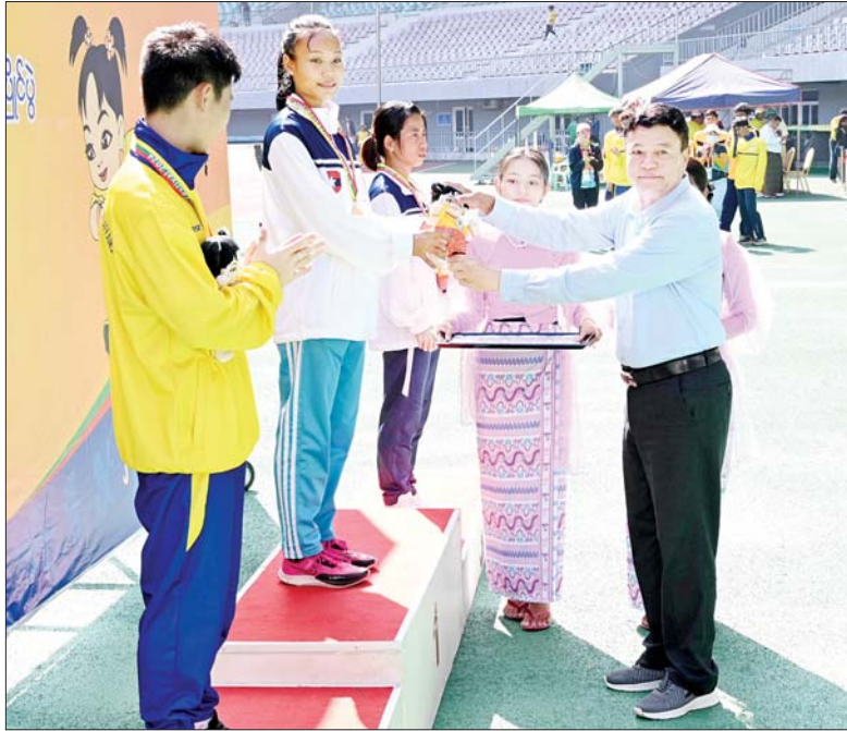
ပြည်ထောင်စုဝန်ကြီး ဦးမင်းသိန်းဇံ ဝန်ကြီးဌာနအဆင့် ပြေးခုန်ပစ်ပြိုင်ပွဲ အမျိုး သမီး မီတာ ၄၀၀ အပြေးပြိုင်ပွဲတွင် ပထမဆုရရှိသည့် ကာကွယ်ရေးဝန်ကြီးဌာနအသင်း မှ ပြိုင်ပွဲဝင်အား ဆုပေးအပ်ချီးမြှင့်စဉ်။