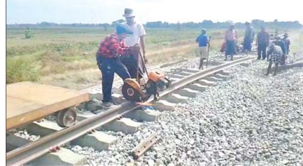
ရန်ကုန်-မန္တလေးရထားလမ်းပိုင်းအတွင်းရှိ တော်ဝိနှင့် ပိန်းလုပ်ဘူတာအကြား မိုင်းပေါက်ကွဲမှုကြောင့် ပျက်စီးသွားသည့် အစုန်ရထားလမ်းအား ပြန်လည်ပြုပြင်နေမှုကို တွေ့ရစဉ်။