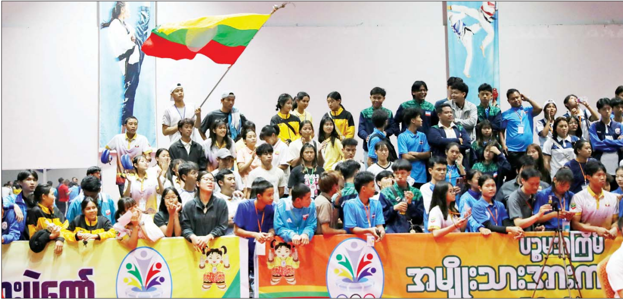
၂၀၂၄ ခုနှစ် ပဉ္စမအကြိမ် အမျိုးသားအားကစားပွဲတော် အားကစားပြိုင်ပွဲများကို လာရောက်ကြည့်ရှုအားပေးကြသူများအား တွေ့ရစဉ်။

ဆက်လက်၍ ပြည်ထောင်စု ဝန်ကြီး ဦးမင်းသိန်းဇံက အမျိုး သမီး မီတာ ၄၀၀ အပြေးပြိုင်ပွဲ တွင် ပထမဆုရရှိသည့် ကာကွယ် ရေးဝန်ကြီးဌာန၊ ဒုတိယဆုရရှိသည့် အားကစားနှင့် လူငယ်ရေးရာ ဝန်ကြီးဌာနနှင့် တတိယဆုရရှိ သည့် ကာကွယ်ရေးဝန်ကြီးဌာန တို့မှ ပြိုင်ပွဲဝင်များကိုလည်းကောင်း၊ အမျိုးသား မီတာ ၄၀၀ အပြေး ပြိုင်ပွဲတွင် ပထမဆုနှင့် ဒုတိယဆု ရရှိသည့် အားကစားနှင့် လူငယ် ရေးရာဝန်ကြီးဌာနနှင့် တတိယဆု ရရှိသည့် ပြည်ထဲရေးဝန်ကြီးဌာန