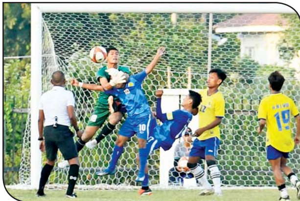
ဝန်ကြီးဌာနပေါင်းစုံ အလွတ်တန်းဘောလုံးပြိုင်ပွဲတွင် ပညာရေး ဝန်ကြီးဌာနအသင်းနှင့် စီမံကိန်းနှင့် ဘဏ္ဍာရေးဝန်ကြီးဌာနအသင်းတို့ ယှဉ်ပြိုင်ကစားစဉ်။