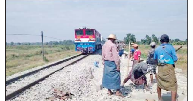
တော်ဝိနှင့် ပိန်းလုပ် အဆန်လမ်းပိုင်းအား ဧကလမ်းစနစ်ကျင့်သုံး၍ ရထားများဖြတ်သန်းနေမှုကို တွေ့ရစဉ်။