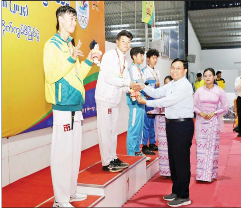
ပြည်ထောင်စုဝန်ကြီး ဦးမျိုးသန့်၊ ပြည်နယ်နှင့် တိုင်းဒေသကြီးအဆင့် တိုက်ကွမ်ဒို ပြိုင်ပွဲ အမျိုးသား (၆၃-၆၈) ကီလိုအတိုက်ပြိုင်ပွဲတွင် ပထမဆုရရှိသည့် ရှမ်းပြည်နယ် အသင်းမှ ပြိုင်ပွဲဝင်အား ဆုပေးအပ်ချီးမြှင့်စဉ်။

ကောင်စီဥက္ကဋ္ဌ ဦးသန်းထွန်းဦးက အမျိုးသမီး ၂၀ ကီလိုမီတာ လမ်း လျှောက်ပြိုင်ပွဲတွင် ပထမဆုရရှိ သည့် ပြည်ထဲရေးဝန်ကြီးဌာန၊ ဒုတိယဆုရရှိသည့် သယ်စာတင်နှင့် သဘာဝပတ်ဝန်းကျင်ထိန်းသိမ်းရေး ဝန်ကြီးဌာနနှင့် တတိယဆုရရှိသည့် စိုက်ပျိုးရေး၊ မွေးမြူရေးနှင့် ဆည် မြောင်းဝန်ကြီးဌာနတို့မှ ပြိုင်ပွဲဝင် များကိုလည်းကောင်း၊ ဂုဏ်ပြုဆု တံဆိပ်နှင့် အမျိုးသားအားကစား ပွဲတော် အထိမ်းအမှတ်အရုပ်များ အား ပေးအပ်ချီးမြှင့်ကြသည်။