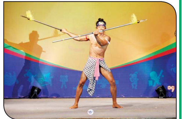
ပြည်နယ်နှင့် တိုင်းဒေသကြီး ကာယဗလနှင့် ကာယကြံ့ခိုင်မှု ပြိုင်ပွဲ အမျိုးသား Fitness Physique (1st Round) တွင် ပြိုင်ပွဲဝင် တစ်ဦး ယှဉ်ပြိုင်နေစဉ်။