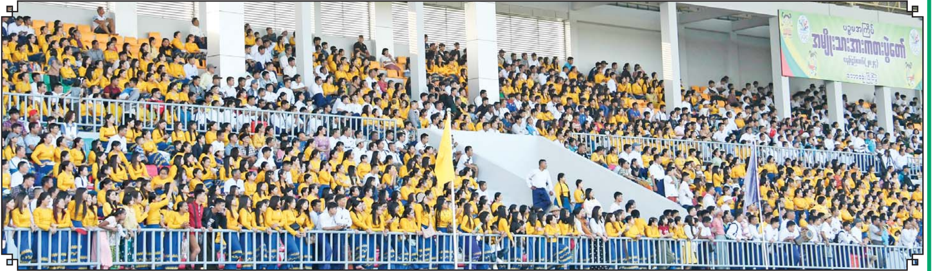
ပဉ္စမအကြိမ် အမျိုးသားအားကစားပွဲတော် အားကစားပြိုင်ပွဲများအား လာရောက်ကြည့်ရှုကြသူများကို တွေ့ရစဉ်။