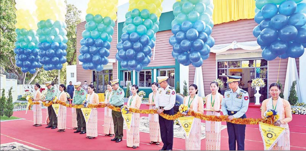
နိုင်ငံတော်စီမံအုပ်ချုပ်ရေးကောင်စီအဖွဲ့ဝင် ညွှန်ကြားရေးမှူးကြီး (ကြည်း၊ ရေ၊ လေ) ဗိုလ်ချုပ်ကြီး မောင်မောင်အေး၊ ကာကွယ်ရေးဦးစီးချုပ်(ရေ) ဗိုလ်ချုပ်ကြီး ထိန်ဝင်း၊ ကာကွယ်ရေးဦးစီးချုပ်(လေ) ဗိုလ်ချုပ်ကြီး ထွန်းအောင်၊ ကောင်စီတွဲဖက်အတွင်းရေးမှူး ဗိုလ်ချုပ်ကြီး ရဲဝင်းဦးနှင့် နိုင်ငံတော်စီမံအုပ်ချုပ်ရေး ကောင်စီအဖွဲ့ဝင် ဗိုလ်ချုပ်ကြီး ညိုစောတို့ ဖွင့်ပွဲအခမ်းအနားကို ဖဲကြိုးဖြတ်ဖွင့်လှစ်ပေးစဉ်။

မိမိတို့နိုင်ငံတွင် သဘာဝကပေးထားသည့် စိုက်ပျိုးရေးဆိုင်ရာ အခြေခံကောင်းများကို အသုံးပြု ပြီး နိုင်ငံကို ဖွံ့ဖြိုးတိုးတက်စေမည့် စက်မှုကုန်ထုတ် လုပ်ငန်းများကို ဆောင်ရွက်ကြရန်လိုကြောင်း၊ ဝါစိုက်ပျိုးရေးနှင့် ပတ်သက်၍ တာဝန်ရှိသူများနှင့် ဝါစိုက်ပျိုးတောင်သူများအနေဖြင့် နိုင်ငံတော်၏ ဝါစိုက်ပျိုးမှု ဝါထွက်ရှိမှုများတိုးတက်အောင် ကြိုးစား ကြရန် တိုက်တွန်းလိုကြောင်း၊ တပ်မတော်ချည်မျှင်နှင့် အထည်စက်ရုံ(မိတ္ထီလာ)က တပ်မတော်တစ်ရပ်လုံး အတွက် လိုအပ်သည့် စစ်တပ်ထည်ပစ္စည်းများကို