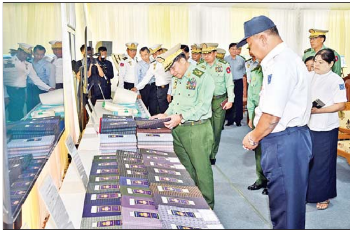
နိုင်ငံတော်စီမံအုပ်ချုပ်ရေးကောင်စီဥက္ကဋ္ဌ တပ်မတော်ကာကွယ်ရေးဦးစီးချုပ် ဗိုလ်ချုပ်မှူးကြီး မင်းအောင်လှိုင်နှင့် အဖွဲ့ဝင်များ တပ်မတော်ချည်မျှင်နှင့် အထည်စက်ရုံ(မိတ္ထီလာ) ၂/၈၀ ချည်ချောစက်ရုံခွဲမှ ထုတ်လုပ်ထားသည့် ချည်ထည်ပစ္စည်းများကို ကြည့်ရှုစဉ်။

( ၃-၉-၂၀၂၄ ရက်နေ့တွင် နိုင်ငံတော်စီမံအုပ်ချုပ်ရေးကောင်စီဥက္ကဋ္ဌ နိုင်ငံတော်ဝန်ကြီးချုပ် ဗိုလ်ချုပ်မှူးကြီး မင်းအောင်လှိုင် ရှမ်းပြည်နယ်အစိုးရအဖွဲ့ဝင်များ၊ ပြည်နယ်နှင့် ခရိုင်အဆင့်ဌာနဆိုင်ရာတာဝန်ရှိသူများအား ပြောကြားသည့် အမှာစကားမှ ကောက်နုတ်ချက် )