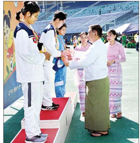
ပြည်ထောင်စုဝန်ကြီး ဒေါက်တာညွန့်ဖေ အမျိုးသမီး မာရသွန်အပြေး ပြိုင်ပွဲတွင် ပထမဆုရရှိသည့် ကာကွယ်ရေးဝန်ကြီးဌာနအသင်းမှ ပြိုင်ပွဲဝင်အား ဂုဏ်ပြုဆုတံဆိပ်နှင့် အမျိုးသားအားကစားပွဲတော် အထိမ်းအမှတ်အရုပ် ပေးအပ်ချီးမြှင့်စဉ်။

ဝန်ကြီးဌာန၊ ဒုတိယနှင့် တတိယ ဆုရရှိသည့် ကာကွယ်ရေးဝန်ကြီး ဌာနအသင်းတို့မှ ပြိုင်ပွဲဝင်များကို လည်းကောင်း တစ်ဦးချင်းဂုဏ်ပြု ဆုတံဆိပ်နှင့်အမျိုးသားအားကစား ပွဲတော် အထိမ်းအမှတ်အရုပ်အား ပေးအပ်ချီးမြှင့်ကြသည်။ ထို့နောက် ဒုတိယဝန်ကြီး ဒေါက်တာမျိုးသန့်က အမျိုးသမီး မိတာ(၄၀၀)တန်းကျော်ပြိုင်ပွဲတွင် ပထမနှင့် ဒုတိယဆု ရရှိသည့် ကာကွယ်ရေး ဝန်ကြီးဌာနနှင့် တတိယဆုရရှိသည့် ပြည်ထဲရေး ဝန်ကြီးဌာနအသင်းတို့မှ ပြိုင်ပွဲဝင် များကိုလည်းကောင်း၊ ဒုတိယ ဝန်ကြီးဦးအေးထွန်းက အမျိုးသားမိတာ (၈၀၀)အပြေးပြိုင်ပွဲတွင် ပထမဆု ရရှိသည့် အားကစားနှင့်လူငယ် ရေးရာဝန်ကြီးဌာန၊ ဒုတိယဆု ရရှိသည့် ဆောက်လုပ်ရေးဝန်ကြီးဌာန နှင့် တတိယဆုရရှိသည့် ပြည်ထဲ ရေးဝန်ကြီးဌာန အသင်းတို့မှ