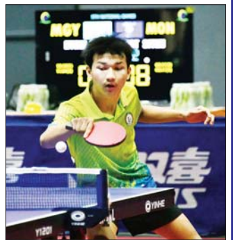
ပြည်နယ်နှင့်တိုင်းဒေသကြီး စားပွဲတင်တင်းနစ်ပြိုင်ပွဲတွင် မကွေးတိုင်းဒေသကြီးမှ ပြိုင်ပွဲဝင်တစ်ဦး ယှဉ်ပြိုင်နေမှုကို တွေ့ရစဉ်။