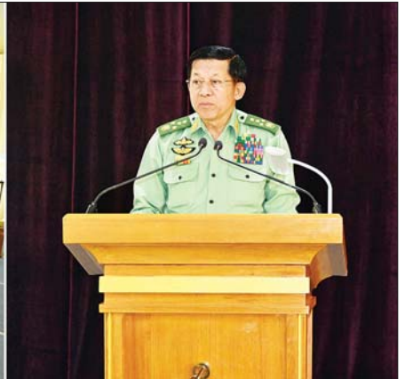
နိုင်ငံတော်စီမံအုပ်ချုပ်ရေးကောင်စီဥက္ကဋ္ဌ တပ်မတော်ကာကွယ်ရေးဦးစီးချုပ် ဗိုလ်ချုပ်မှူးကြီး မင်းအောင်လှိုင် တပ်မတော်ချည်မျှင်နှင့် အထည်စက်ရုံ(မိတ္ထီလာ) ၂/၈၀ ချည်ချောစက်ရုံခွဲ ဖွင့်ပွဲအခမ်းအနားတွင် အမှာစကားပြောကြားစဉ်။

* ရှေ့ဖို့မှ China Texmatech Co. Ltd. မှ တာဝန်ရှိသူများ၊ မိတ်ကြားထားသည့် ဧည့်သည်တော်များ၊ မိတ္ထီလာ မြို့နယ်မှ ရုပ်မြေသံချက်များ၊ စက်ရုံမှူး၊ စက်ရုံဝန်ထမ်းများနှင့် တာဝန်ရှိသူများ တက်ရောက်ကြသည်။