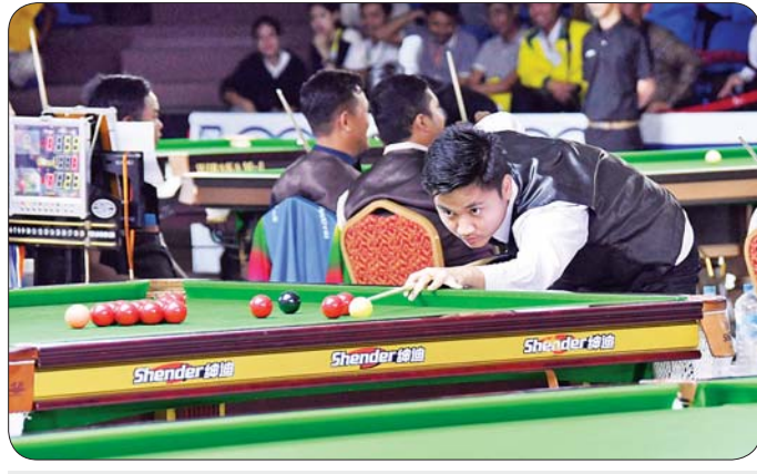
ပြည်နယ်နှင့်တိုင်းဒေသကြီး ဘီလီယက်နှင့်စနူကာပြိုင်ပွဲတွင် ပြိုင်ပွဲဝင်တစ်ဦး ယှဉ်ပြိုင်နေမှုကို တွေ့ရစဉ်။