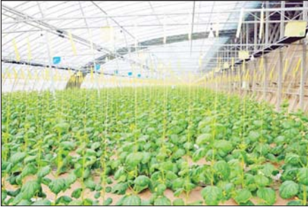
Siji Yangkun Agricultural Technology Development Co.,Ltd. ၏ Green House စိုက်ခင်းများနှင့် သီးနှံပင်များ။

လောင်တော့(Longtou)ကျေးရွာဟာ လယ်ယာ စက်မှုဇုန်နဲ့ ယဉ်ကျေးမှုခရီးသွားဇုန်အကြား ပန်ဆိုင် လမ်း ပေကျင်းဒါရင်းအပြည်ပြည်ဆိုင်ရာလေဆိပ် ကနေ ၅ ဒသမ ၅ မိုင်အကွာမှာ တည်ရှိကာ အကျယ် အဝန်းအနေနဲ့ ၅၇၇၇ ဧကခန့်ရှိပြီး အိမ်ထောင်စု ၃၂၀ စုစုပေါင်း နေထိုင်သူ ၁၀၈၃၂ ဦးရှိတဲ့ ကျေးရွာ တစ်ရွာဖြစ်ပါတယ်။ လူအများနှစ်သက် မြတ်နိုးရတဲ့ ရိုးရာယဉ်ကျေးမှုနဲ့ ထူးခြားတဲ့လက်မှုလုပ်ငန်းတွေ ကြောင့် ကျေးရွာကို လူသိများစေခဲ့တဲ့ အကြောင်း ရင်းတစ်ချက်ဖြစ်ပြီး အဲဒီအားသာချက်တွေကို အပြည့်အဝအသုံးပြုကာ စက်မှုလုပ်ငန်းတွေ ဖွံ့ဖြိုးတိုးတက်စေခဲ့တယ်လို့ သတိပြုမိခဲ့ပါတယ်။