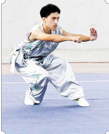
ပြည်နယ်နှင့်တိုင်းဒေသကြီး အမျိုးသားဂူဂျီပြိုင်ပွဲတွင် ရှမ်းပြည်နယ်မှ ပြိုင်ပွဲဝင်တစ်ဦး ယှဉ်ပြိုင်နေမှုကို တွေ့ရစဉ်။