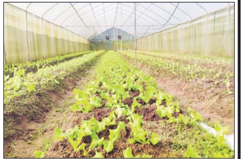
ပဲခူးတိုင်းဒေသကြီး ရွာသစ်ကျေးရွာတွင် မဲခေါင်-လန်ချန်း အထူးရန်ပုံငွေဖြင့် ဆောင်ရွက်သည့် Green House စနစ်ဖြင့် စိုက်ပျိုးထားရှိသည့် စိုက်ခင်းများနှင့် သီးနှံပင်များ။

စိုက်ပျိုးမှုဧရိယာ ၇၄၁ ဧက ၀နံကျင်ခန့်အထိ တိုးချဲ့စိုက်ပျိုးနိုင်ခဲ့ပြီး စူပါမားကက်တွေနဲ့ ပူးပေါင်းပြီး Offline ရောင်းအား စျေးကွက်ကို ဖော်ဆောင်ခဲ့တဲ့အပြင် ပေါင်းစည်းလယ်ယာစနစ်ကို ကျင့်သုံးခဲ့ကာ livestreamers တွေနဲ့ ပူးပေါင်းပြီး အွန်လိုင်းမှ ရောင်းချတဲ့စနစ်ကို ဆောင်ရွက်ပေးခဲ့ပါတယ်။ အဲဒါကြောင့် သွားသီး၊ ခရမ်းသီး၊ ပန်းသီး၊ ဖရုံသီး၊ ကန်စွန်းညှု၊ ငရုတ်သီးစတဲ့ သီးနှံစုံနဲ့ ဟင်းသီးဟင်းရွက် ၁၅၀၀ တန်ခန့် ရောင်းအားတိုးမြှင့်ခဲ့ပြီး လယ်ယာလုပ်ငန်းရှင်တွေရဲ့ ဝင်ငွေကို ရင်ဆိုင်ဘိယွမ် ၁၀ ဒသမ ၈၁ သန်း (အမေရိကန်ဒေါ်လာ ၁ ဒသမ ၅၄ သန်းခန့်) အထိ တိုးမြှင့်ရရှိစေခဲ့တယ်လို့ သိရပါတယ်။