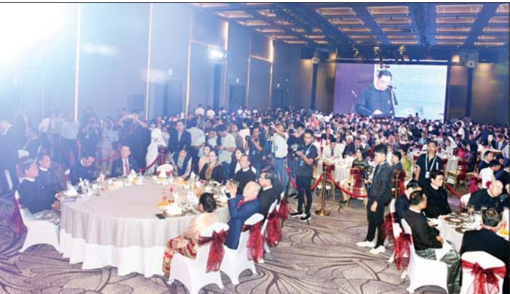
နိုင်ငံတော်စီမံအုပ်ချုပ်ရေးကောင်စီဥက္ကဋ္ဌ နိုင်ငံတော်ဝန်ကြီးချုပ်ကိုယ်စား နိုင်ငံတော်စီမံအုပ်ချုပ်ရေးကောင်စီအဖွဲ့ဝင် ဗိုလ်ချုပ်ကြီး ညိုစော မြန်မာနိုင်ငံ တရုတ်ကုန်သည်များအသင်းချုပ်တည်ထောင်ခြင်း ၁၁၅ နှစ်ပြည့်အထိမ်းအမှတ် ညစာစားပွဲအခမ်းအနားတွင် နှုတ်ခွန်းဆက်စကားပြောကြားစဉ်။

ဆိုင်ရာ တရုတ်ပြည်သူ့သမ္မတနိုင်ငံ သံအမတ်ကြီး H. E. Ms. Ma Jia၊ တရုတ်ကောင်စစ်ဝန်ချုပ်၊ မြန်မာနိုင်ငံတရုတ်ကုန်သည်များအသင်းချုပ်ဥက္ကဋ္ဌ ဦးအိုင်ထွန်း၊ အကြီးတန်း ဒုတိယဥက္ကဋ္ဌများနှင့် နာယကများ၊ ဖိတ်ကြားထားသူ