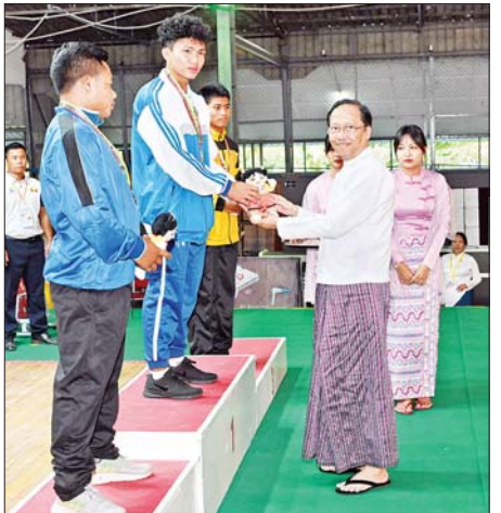
ပြည်ထောင်စုဝန်ကြီး ဒေါက်တာ သက်ခိုင်ဝင်း အမျိုးသား ၆၇ ကီလို အလေးမပြိုင်ပွဲတွင် ပထမဆုရရှိသည့် ဧရာဝတီတိုင်းဒေသကြီးအသင်း မှ ပြိုင်ပွဲဝင်အား ဂုဏ်ပြုဆုတံဆိပ်နှင့် အမျိုးသားအားကစား ပွဲတော် အထိမ်းအမှတ်အရုပ် ပေးအပ်ချီးမြှင့်စဉ်။

ဝန်ကြီးဌာန၊ ဒုတိယနှင့် တတိယ ဆုရရှိသည့် ကာကွယ်ရေးဝန်ကြီး ဌာနအသင်းတို့မှ ပြိုင်ပွဲဝင်များကို လည်းကောင်း တစ်ဦးချင်းဂုဏ်ပြု ဆုတံဆိပ်နှင့်အမျိုးသားအားကစား ပွဲတော် အထိမ်းအမှတ်အရုပ်အား ပေးအပ်ချီးမြှင့်ကြသည်။ ထို့နောက် ဒုတိယဝန်ကြီး ဒေါက်တာမျိုးသန့်က အမျိုးသမီး မိတာ(၄၀၀)တန်းကျော်ပြိုင်ပွဲတွင် ပထမနှင့် ဒုတိယဆု ရရှိသည့် ကာကွယ်ရေး ဝန်ကြီးဌာနနှင့် တတိယဆုရရှိသည့် ပြည်ထဲရေး ဝန်ကြီးဌာနအသင်းတို့မှ ပြိုင်ပွဲဝင် များကိုလည်းကောင်း၊ ဒုတိယ ဝန်ကြီးဦးအေးထွန်းက အမျိုးသားမိတာ (၈၀၀)အပြေးပြိုင်ပွဲတွင် ပထမဆု ရရှိသည့် အားကစားနှင့်လူငယ် ရေးရာဝန်ကြီးဌာန၊ ဒုတိယဆု ရရှိသည့် ဆောက်လုပ်ရေးဝန်ကြီးဌာန နှင့် တတိယဆုရရှိသည့် ပြည်ထဲ ရေးဝန်ကြီးဌာန အသင်းတို့မှ