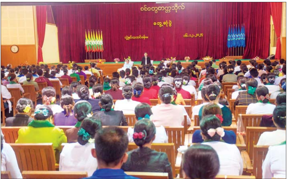
နိုင်ငံတော်စီမံအုပ်ချုပ်ရေးကောင်စီအဖွဲ့ဝင်များနှင့် တာဝန်ရှိသူများ စစ်တွေတက္ကသိုလ် ဘွဲ့နှင်းသဘင်ခန်းမ၌ အဆင့်မြင့်ပညာနှင့် အခြေခံပညာ တို့မှ ဆရာ ဆရာမများနှင့် တွေ့ဆုံစဉ်။

ထားရှိသည့် မာရဝိဇယ ဆင်းတု တော်နှင့် အဘယရာဇမုနိ ဆင်းတု တော် နှစ်ဆူအတွက် စံကျောင်း တော်(၂) ဆောက်လုပ်နေမှုနှင့် နေပူခံကျောက်ပြား ခင်းခြင်း လုပ်ငန်း ဆောင်ရွက်နေမှုကို ကြည့်ရှုစစ်ဆေးကြသည်။ ဆက်လက်၍ လောကာနန္ဒာ စေတီတော် ပရိဝုဏ်အတွင်းရှိ ရှေးဟောင်းသမိုင်းဝင်စကြာမုနိ ဗုဒ္ဓရုပ်ပွားတော်အား ဖူးမြော် ကြည့်ညိုပြီး ပန်း၊ ရေချမ်း၊ ဆီမီး များ ကပ်လှူပူဇော်၍ အလှူငွေ များ ထည့်ဝင်လှူဒါန်းခဲ့ကြ သည်။ ဆရာ ဆရာမများနှင့် တွေ့ဆုံ ထို့နောက် နိုင်ငံတော်စီမံ အုပ်ချုပ်ရေးကောင်စီအဖွဲ့ဝင်များ နှင့်အဖွဲ့သည် စစ်တွေတက္ကသိုလ် သို့ သွားရောက်ပြီး ဘွဲ့နှင်းသဘင် ခန်းမ၌ အဆင့်မြင့်ပညာနှင့် အခြေခံပညာတို့မှ ဆရာ ဆရာမ များနှင့် တွေ့ဆုံသည်။ တွေ့ဆုံစဉ် နိုင်ငံတော်စီမံ အုပ်ချုပ်ရေးကောင်စီ အဖွဲ့ဝင် ဒေါက်တာဘရွှေက ပညာရေးဌာန တွင် တာဝန်ထမ်းဆောင်နေကြ သည့် မိမိတို့ ဆရာ ဆရာမများ သည် အတတ်ပညာဆိုသည့် ဘာသာရပ် ကျွမ်းကျင်မှုအပြင် ကျောင်းသား ကျောင်းသူများကို စိတ်ပိုင်းဆိုင်ရာ အတွေးအခေါ်