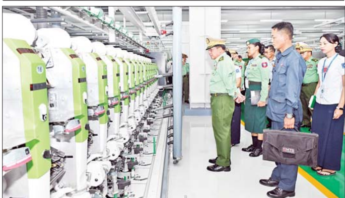
နိုင်ငံတော်စီမံအုပ်ချုပ်ရေးကောင်စီဥက္ကဋ္ဌ တပ်မတော်ကာကွယ်ရေးဦးစီးချုပ် ဗိုလ်ချုပ်မှူးကြီး မင်းအောင်လှိုင် စက်ရုံအတွင်းရှိ ချည်မျှင် အဆင့်ဆင့်ထုတ်လုပ်နေမှုအခြေအနေများကို ကြည့်ရှုစဉ်။

အဆိုပါ တပ်မတော်ချည်မျှင်နှင့် အထည်စက်ရုံ (မိတ္ထီလာ)အနေဖြင့် တပ်မတော်နှင့် မြန်မာနိုင်ငံရဲတပ်ဖွဲ့ဝင်များအတွက် လိုအပ်သည့် ဝတ်စုံများကို ချုပ်လုပ်ပေးလျက်ရှိသကဲ့သို့ ကျောင်းဝတ်စုံများ၊ အခြားနေ့စဉ်သုံး ချည်ထည်ပစ္စည်းများကိုလည်း ထုတ်လုပ်ပေးလျက်ရှိကြောင်း၊ နိုင်ငံတော်အနေဖြင့် ပြည်သူများ၏ ဝတ်ရေကို ပိုမိုအထောက်အကူပြုစေရန်နှင့် ပြည်တွင်းချည်ချောထုတ်လုပ်မှုများ တိုးတက်စေရေးဆောင်ရွက်လျက်ရှိချိန်တွင် ယခုကဲ့သို့ ၂/၈၀ ချည်ချောစက်ရုံခွဲကို ထပ်မံတိုးချဲ့တည်ဆောက်နိုင်ခဲ့ခြင်းဖြင့် ပြည်တွင်းရှိ အထည်အလိပ်နှင့် ပတ်သက်သည့် စက်မှုလုပ်ငန်းများအတွက် လိုအပ်ချက်ရှိနေသည့် ချည်မျှင်နှင့်အထည်အလိပ်များကို အတိုင်းအတာတစ်ခုအထိ ထုတ်လုပ်ဖြည့်ဆည်းပေးနိုင်တော့မည်ဖြစ်ကြောင်းနှင့် သတ်မှတ်ထားသည့် အရည်အသွေးစံနှုန်းများအတိုင်း ပြည့်မီစွာထုတ်လုပ်နိုင်မည်ဖြစ်ကြောင်း သတင်းရရှိသည်။ သတင်းစဉ်