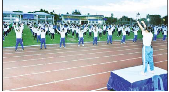
တိုင်းဒေသကြီး(ပြန်/ဆက်)

အပိုင်းရှေ့မှစတင်၍ မဟာဗန္ဓုလလမ်းမကြီးအတိုင်း တပျော်တပေါင်းလမ်းလျှောက်ခဲ့ကြပြီး ကိုးသိန်းအားကစားကွင်းတွင် ကိုယ်လက်လှုပ်ရှားလေ့ကျင့်ခန်းများ၊ Physical Fitness dance များကို အတူတကွ စုပေါင်းဆောင်ရွက်ခဲ့ကြသည်။ ဧရာဝတီတိုင်းဒေသကြီး ပုသိမ်မြို့၌ ဒီဇင်ဘာလ ဒုတိယပတ်စုပေါင်းလမ်းလျှောက်ပွဲသို့ ဌာနဆိုင်ရာများ၊ လူမှုရေးအသင်းအဖွဲ့များ၊ ဒေသပြည်သူများ စုစုပေါင်းအင်အား ၄၀၀၀ ကျော်နှင့် တိုင်းဒေသကြီးအတွင်းရှိ ခရိုင်၊ မြို့နယ်များမှ စုစုပေါင်းအင်အား ၁၇၀၀၀ ကျော် တပျော်တပေါင်း ပါဝင်ဆင်နွှဲခဲ့ကြောင်း သိရသည်။