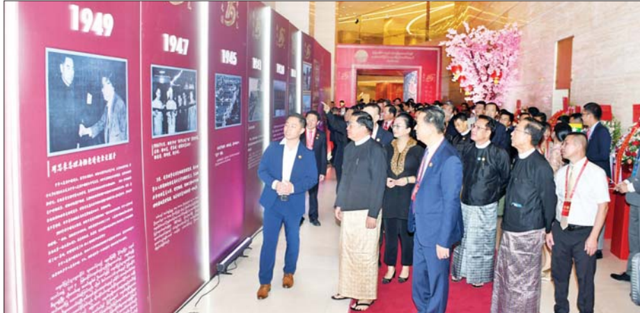
နိုင်ငံတော်စီမံအုပ်ချုပ်ရေးကောင်စီဥက္ကဋ္ဌ နိုင်ငံတော်ဝန်ကြီးချုပ်ကိုယ်စား နိုင်ငံတော်စီမံအုပ်ချုပ်ရေးကောင်စီအဖွဲ့ဝင် ဗိုလ်ချုပ်ကြီး ညိုစောနှင့် အခမ်းအနားတက်ရောက်လာသူများ ခင်းကျင်းပြသထားသည့် မြန်မာနိုင်ငံ တရုတ်ကုန်သည်များအသင်းချုပ်၏ သမိုင်းကြောင်း မှတ်တမ်းဓာတ်ပုံများကို ကြည့်ရှုစဉ်။

ယင်းနောက် မြန်မာနိုင်ငံတရုတ်ကုန်သည်များအသင်းချုပ်၏ သမိုင်းကြောင်း ဗီဒီယိုကို ကြည့်ရှုကြသည်။ နှုတ်ခွန်းဆက်စကား ပြောကြားထိုနောက် နိုင်ငံတော်စီမံအုပ်ချုပ်ရေးကောင်စီဥက္ကဋ္ဌ နိုင်ငံတော်ဝန်ကြီးချုပ် ကိုယ်စား နိုင်ငံတော် စီမံအုပ်ချုပ်ရေးကောင်စီအဖွဲ့ဝင် ဗိုလ်ချုပ်ကြီး ညိုစောက နှုတ်ခွန်းဆက်စကား ပြောကြားသည်။