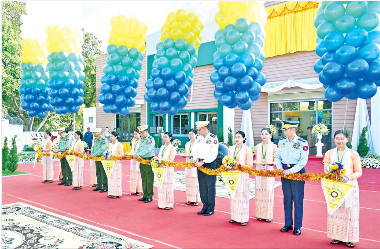
နိုင်ငံတော်စီမံအုပ်ချုပ်ရေးကောင်စီဝင် ညွှန်ကြားရေးမှူးကြီး(ကြည်း၊ ရေ၊ လေ) ဗိုလ်ချုပ်ကြီး မောင်မောင်အေး၊ ကာကွယ်ရေးဦးစီးချုပ်(ရေ) ဗိုလ်ချုပ်ကြီးထိန်ဝင်း၊ ကာကွယ်ရေးဦးစီးချုပ် (လေ) ဗိုလ်ချုပ်ကြီးထွန်းအောင်၊ ကောင်စီတွဲဖက်အတွင်းရေးမှူး၊ ဗိုလ်ချုပ်ကြီးရဲဝင်းဦးနှင့် ကောင်စီဝင် ဗိုလ်ချုပ်ကြီးညိုစောတို့ ဖွင့်ပွဲအခမ်းအနားကို ဖဲကြိုးဖြတ်ဖွင့်လှစ်ပေးစဉ်။

❖ ယခု တည်ဆောက်တပ်ဆင်ပြီးစီးသည့် စက်ရုံသည် စက်စွမ်းအားပြည့် လည်ပတ်မည်ဆိုပါက တစ်ရက် ချည်ပေါင်ချိန် ၄၈၄၀၊ တန်အားဖြင့် နှစ်တန်ခန့် ထုတ်လုပ်နိုင်မည်ဖြစ်ကြောင်း၊ ထွက်ရှိလာသည့် ၂/ ၈၀ ချည်ချောများကို ပြည်သူ့လူထုအတွက် လိုအပ် သည့် လုံချည်နှင့် ပိတ်များအဖြစ် ရက်လုပ်မည်ဖြစ် ပြီး ပိုလျှံသည့်ချည်များကို ပြင်ပဈေးကွက်ကိုဈေးနှုန်း သက်သာစွာဖြင့် ဖြန့်ဖြူးရောင်းချပေးသွားမည်