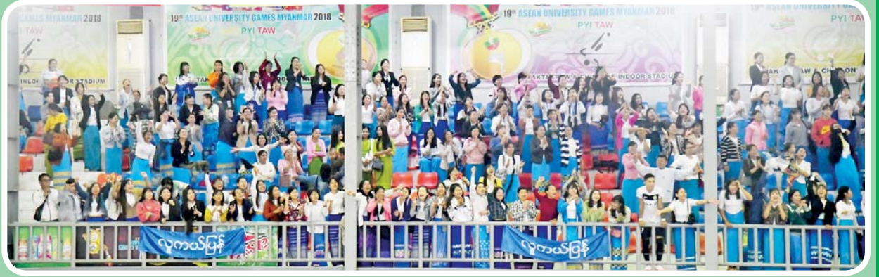
ပဉ္စမအကြိမ် အမျိုးသားအားကစားပွဲတော် အားကစားပြိုင်ပွဲများကို လာရောက်ကြည့်ရှုကြသူများအား တွေ့ရစဉ်။