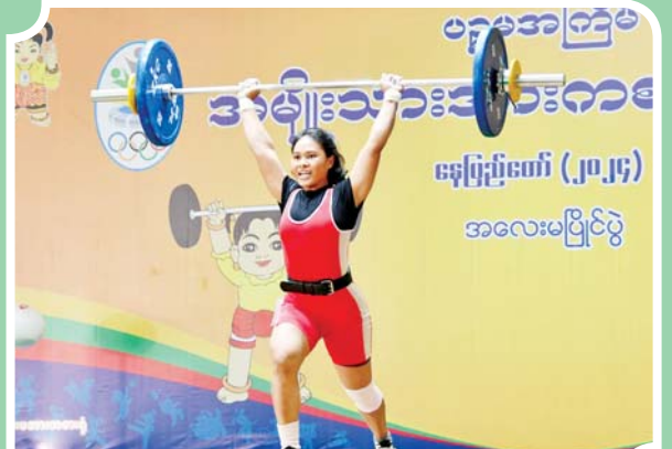
ပြည်နယ်နှင့် တိုင်းဒေသကြီး အမျိုးသမီး အလေးမပြိုင်ပွဲတွင် ပြိုင်ပွဲဝင်တစ်ဦး ယှဉ်ပြိုင်စဉ်။