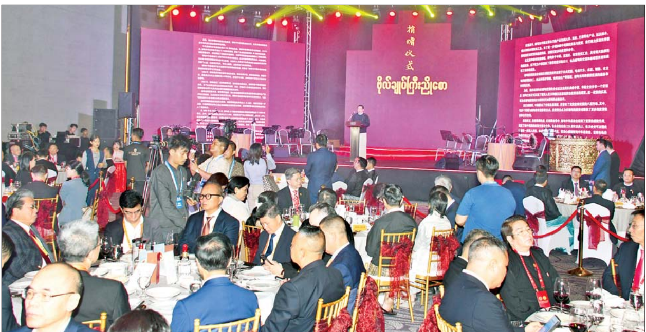
နိုင်ငံတော်စီမံအုပ်ချုပ်ရေးကောင်စီဥက္ကဋ္ဌ နိုင်ငံတော်ဝန်ကြီးချုပ်ကိုယ်စား နိုင်ငံတော်စီမံအုပ်ချုပ်ရေးကောင်စီအဖွဲ့ဝင် ဗိုလ်ချုပ်ကြီး ညိုစော မြန်မာနိုင်ငံ တရုတ်ကုန်သည်များအသင်းချုပ် တည်ထောင်ခြင်း (၁၁၅)နှစ်ပြည့် အထိမ်းအမှတ် ညစာစားပွဲတွင် နှုတ်ခွန်းဆက်စကား ပြောကြားစဉ်။

တက်ရောက် အခမ်းအနားသို့ နိုင်ငံတော် စီမံအုပ်ချုပ်ရေးကောင်စီ ဥက္ကဋ္ဌ နိုင်ငံတော်ဝန်ကြီးချုပ် ကိုယ်စား နိုင်ငံတော်စီမံအုပ်ချုပ်ရေးကောင်စီ အဖွဲ့ဝင်ဗိုလ်ချုပ်ကြီးညိုစော၊ ဒုတိယ ဝန်ကြီးချုပ်နှင့် ပြည်ထောင်စုဝန်ကြီး ဦးဝင်းရှိန်၊ ဦးမောင်မောင်အုန်း၊ ဒေါက်တာချာလီသန်း၊ ဦးထွန်းအံ့၊ ရန်ကုန်တိုင်းဒေသကြီး ဝန်ကြီးချုပ် ဦးစိုးသိန်း၊ မြန်မာ့စီးပွားရေးဦးပိုင် အများနှင့်သက်ဆိုင်သော ကုမ္ပဏီ လိမ္မော်ကုမ္ပဏီဒုတိယဗိုလ်ချုပ်ကြီး ဆန်းဦး၊ ဒုတိယဝန်ကြီး ဒေါက်တာ ဝါဝါမောင်၊ တိုင်းဒေသကြီးဝန်ကြီး များ၊ မြန်မာနိုင်ငံဆိုင်ရာ တရုတ် ပြည်သူ့သမ္မတနိုင်ငံ သံအမတ်ကြီး H. E. Ms. Ma Jia၊ တရုတ် ကောင်စစ်ဝန်ချုပ်၊ မြန်မာနိုင်ငံ တရုတ်ကုန်သည်များအသင်းချုပ် ဥက္ကဋ္ဌ ဦးအိုင်ထွန်း၊ အကြီးတန်း ဒုတိယဥက္ကဋ္ဌများနှင့် နာယကများ၊