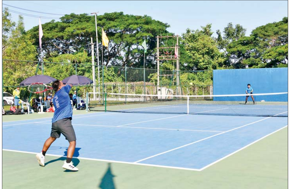
ပြည်နယ်နှင့် တိုင်းဒေသကြီး အသင်းလိုက်တင်းနစ်ပြိုင်ပွဲတွင် ကရင်ပြည်နယ်အသင်းနှင့် ရန်ကုန်တိုင်းဒေသကြီးအသင်းတို့ ယှဉ်ပြိုင်ကစားစဉ်။

ယနေ့ကျင်းပသည့် အားကစားပြိုင်ပွဲများသို့ ပြည်ထောင်စုအဆင့်ပုဂ္ဂိုလ်များ၊ ဒုတိယဝန်ကြီးများ၊ တိုင်းဒေသကြီးနှင့် ပြည်နယ်ဝန်ကြီးများ၊ ဌာနဆိုင်ရာများ၊ အားကစားနည်းအလိုက် အဖွဲ့ချုပ်များမှ တာဝန်ရှိသူများ၊ ဝန်ထမ်းများ၊ ကျောင်းသား ကျောင်းသူများနှင့် အားကစားဝါသနာရှင်ပြည်သူများ စိတ်ပါဝင်စားစွာ လာရောက်ကြည့်ရှု အားပေးခဲ့ကြကြောင်း သိရသည်။ သတင်းစဉ်