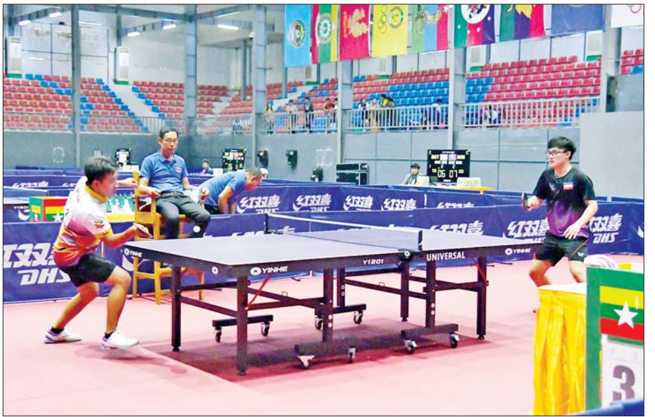
ပြည်နယ်နှင့် တိုင်းဒေသကြီး အမျိုးသား စားပွဲတင်တင်းနစ်ပြိုင်ပွဲတွင် ကရင်ပြည်နယ်အသင်းနှင့် ရှမ်းပြည်နယ်အသင်းတို့ ယှဉ်ပြိုင်ကစားကြစဉ်။

ဝန်ကြီးဌာနပေါင်းစုံ အမျိုးသား ပိုက်ကျော်ခြင်း သုံးယောက်တွဲ ပြိုင်ပွဲတွင် ဆောက်လုပ်ရေး ဝန်ကြီးဌာနအသင်းက ပြည်ထဲရေးဝန်ကြီးဌာနအသင်းကို နှစ်ပွဲ-တစ်ပွဲအားကစားနှင့် လူငယ်ရေးရာဝန်ကြီးဌာနအသင်းက စိုက်ပျိုးရေး၊ မွေးမြူရေးနှင့် ဆည်မြောင်းဝန်ကြီးဌာနအသင်းကို နှစ်ပွဲပြတ်၊ ပို့ဆောင်ရေးနှင့် ဆက်သွယ်ရေးဝန်ကြီးဌာနအသင်းက လူမှုဝန်ထမ်း၊ ကယ်ဆယ်ရေးနှင့် ပြန်လည်နေရာချထားရေးဝန်ကြီးဌာနအသင်းကို နှစ်ပွဲ-တစ်ပွဲ၊ ကာကွယ်ရေးဝန်ကြီးဌာနအသင်းက ဟိုတယ်နှင့် ခရီးသွားလာရေး ဝန်ကြီးဌာနအသင်းကို နှစ်ပွဲပြတ်၊ အမျိုးသား သုံးယောက်တွဲ ပြိုင်ပွဲ ဆီမီးဖိုင်နယ်ပွဲစဉ်တွင် အားကစားနှင့် လူငယ်ရေးရာဝန်ကြီးဌာန အသင်းက ပို့ဆောင်ရေးနှင့် ဆက်သွယ်ရေး ဝန်ကြီးဌာနအသင်းကို နှစ်ပွဲပြတ်၊ ကာကွယ်ရေးဝန်ကြီးဌာနအသင်းက ဆောက်လုပ်ရေးဝန်ကြီးဌာနအသင်းကို နှစ်ပွဲပြတ်ဖြင့်အနိုင်ရရှိခဲ့ကြသည်။