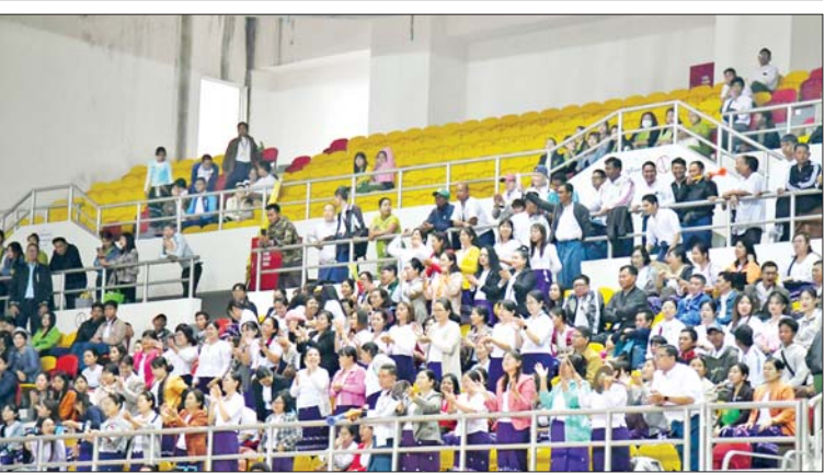
ပဉ္စမအကြိမ် အမျိုးသားအားကစားပွဲတော် အားကစားပြိုင်ပွဲများသို့ လာရောက်ကြည့်ရှုကြသူများကို တွေ့ရစဉ်။