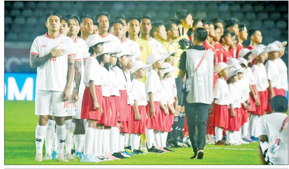
2024 ASEAN Cup ပြိုင်ပွဲယှဉ်ပြိုင်နေသည့် မြန်မာ့လက်ရွေးစင်အသင်း။

ရန်ကုန် ဒီဇင်ဘာ ၁၆ ၂၀၂၄ ASEAN Cup ပြိုင်ပွဲ အုပ်စုစတုတ္ထနေ့ကို ဒီဇင်ဘာ ၁၇ ရက်နှင့် ၁၈ ရက်တို့တွင် ဆက်လက်ကျင်းပမည်ဖြစ်ပြီး ဆီမီးဖိုင်နယ်တက်ရောက်မည့် အသင်းအချို့ ထွက်ပေါ်လာဖွယ်ရှိနေသည်။