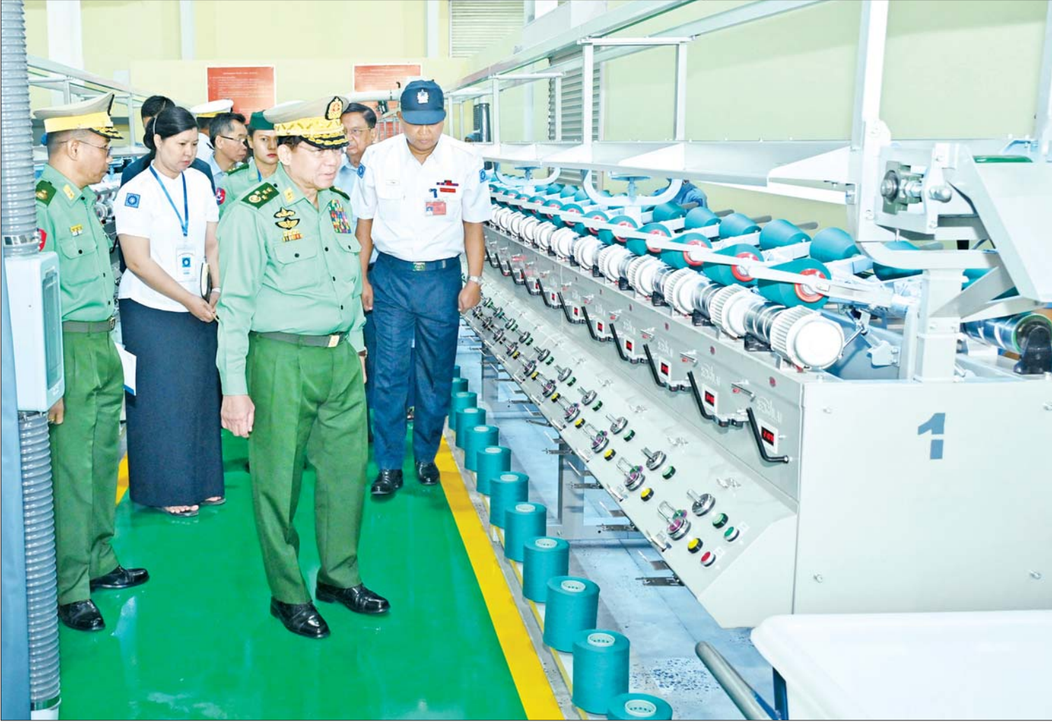
နိုင်ငံတော်စီမံအုပ်ချုပ်ရေးကောင်စီဥက္ကဋ္ဌ တပ်မတော်ကာကွယ်ရေးဦးစီးချုပ် ဗိုလ်ချုပ်မှူးကြီးမင်းအောင်လှိုင် တပ်မတော်ချည်မျှင်နှင့် အထည်စက်ရုံ(မိတ္ထီလာ) ၂/၈၀ ချည်ချောစက်ရုံခွဲအတွင်း ကြည့်ရှုစစ်ဆေးစဉ်။

၂/၈၀ ချည်ချောစက်ရုံခွဲ ဖွင့်လှစ်နိုင်ခြင်းသည် မြန်မာနိုင်ငံ၏ ချည်ထည်ခေတ်တစ်ခေတ်ပြောင်းလဲမှု၏အစဖြစ် အဆင့်မြင့်ချည်ထည်များထုတ်လုပ်နိုင်သည့် ဝါမျိုးကောင်း မျိုးသန့်များကို စိုက်နည်းစနစ်မှန်ကန်စွာဆောင်ရွက်ပြီး ဝါအထွက်နှုန်း တိုးတက်အောင်ဆောင်ရွက်