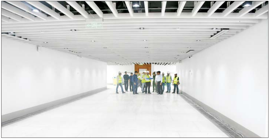
သည် ၂၃ ပေအကျယ်ရှိပြီး တစ်နာရီလျှင် လူဦးရေ ၁၄၀၀၀ ဖြတ်သန်းသွားလာနိုင်ကာ ရွှေလျား စက်လှေကား လေးစင်း၊ သက်ကြီးရွယ်အိုများ၊ မသန်စွမ်းသူများအသုံးပြုရန် ဓာတ်လှေကား ၁၀

ယောက်စီး နှစ်စင်းပါရှိပြီး မကြာမီဖွင့်လှစ်နိုင်ရေး အပြီးသတ်လုပ်ငန်းများ ဆောင်ရွက်လျက်ရှိကြောင်း သိရသည်။