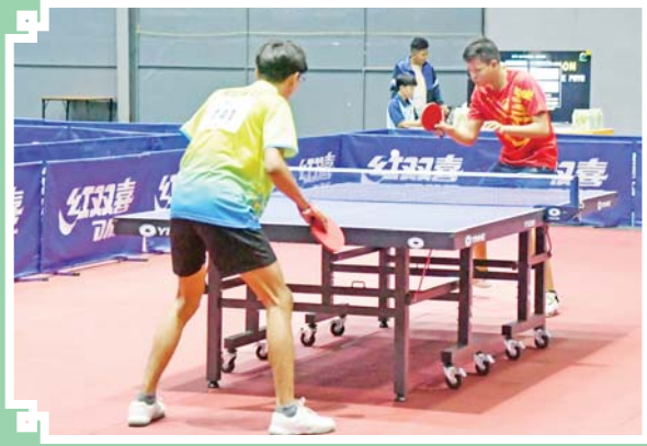
ပြည်နယ်နှင့် တိုင်းဒေသကြီး အမျိုးသား စားပွဲတင်တင်းနစ် ပြိုင်ပွဲတွင် မွန်ပြည်နယ်အသင်းနှင့် မကွေးတိုင်းဒေသကြီးအသင်းတို့ ယှဉ်ပြိုင်ကစားကြစဉ်။