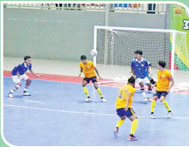
ဝန်ကြီးဌာနပေါင်းစုံ အမျိုးသားဖူဆယ်ပြိုင်ပွဲတွင် လူမှုဝန်ထမ်း၊ ကယ်ဆယ်ရေးနှင့် ပြန်လည်နေရာချထားရေးဝန်ကြီးဌာနအသင်းနှင့် အားကစားနှင့်လူငယ်ရေးရာဝန်ကြီးဌာနအသင်းတို့ ယှဉ်ပြိုင်စဉ်။