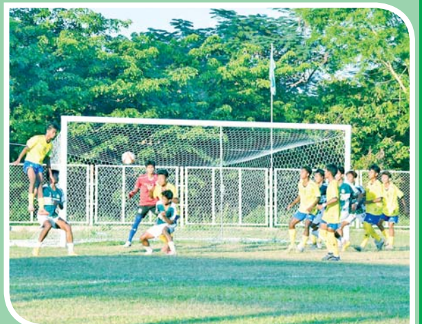
ပြည်နယ်နှင့် တိုင်းဒေသကြီး အမျိုးသားဘောလုံးပြိုင်ပွဲတွင် နေပြည်တော်အသင်းနှင့် ဧရာဝတီတိုင်းဒေသကြီးအသင်းတို့ ယှဉ်ပြိုင်စဉ်။