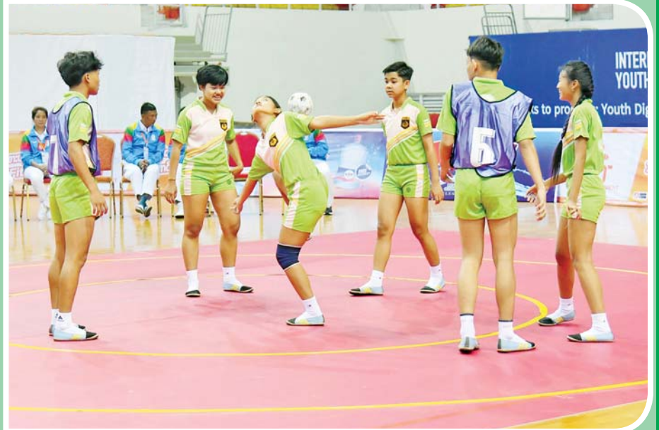
ပြည်နယ်နှင့် တိုင်းဒေသကြီး အမျိုးသမီး ရိုးရာခြင်းခတ်ပြိုင်ပွဲတွင် ပဲခူးတိုင်းဒေသကြီးမှ ပြိုင်ပွဲဝင်များ ယှဉ်ပြိုင်နေစဉ်။