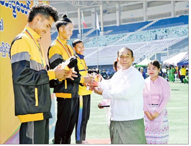
ပြည်ထောင်စုဝန်ကြီး ဦးမြင့်နောင် အမျိုးသား မိတာ ၁၀၀ အပြေးပြိုင်ပွဲတွင် ပထမဆုရရှိသည့် ဆောက်လုပ်ရေးဝန်ကြီးဌာနမှ ထက်ရှိုင်းအောင်အေး ဂုဏ်ပြုဆုတံဆိပ် နှင့် အမျိုးသားအားကစားပွဲတော် အထိမ်းအမှတ်အရုပ်ကို ပေးအပ်ချီးမြှင့်စဉ်။

ဆက်လက်၍ ပြည်ထောင်စု ဝန်ကြီး ဦးမြင့်နောင်က အမျိုးသား မိတာ ၁၀၀ အပြေးပြိုင်ပွဲတွင် ပထမနှင့် ဒုတိယဆုရရှိသည့် ဆောက်လုပ်ရေး ဝန်ကြီးဌာနနှင့် တတိယဆုရရှိသည့် အားကစား နှင့် လူငယ်ရေးရာဝန်ကြီးဌာန အသင်းတို့မှ ပြိုင်ပွဲဝင်များအား လည်းကောင်း၊ အမျိုးသမီး မိတာ ၁၀၀ အပြေးပြိုင်ပွဲတွင် ပထမဆု ရရှိသည့် ကာကွယ်ရေးဝန်ကြီး ဌာန၊ ဒုတိယဆုရရှိသည့် သယံ ဇာတနှင့် သဘာဝပတ်ဝန်းကျင် ထိန်းသိမ်းရေး ဝန်ကြီးဌာနနှင့် တတိယဆုရရှိသည့် ပြည်ထဲရေး ဝန်ကြီးဌာနအသင်းတို့မှ ပြိုင်ပွဲဝင် များအား လည်းကောင်း တစ်ဦးချင်း ဂုဏ်ပြုဆုတံဆိပ်နှင့် အမျိုးသား အားကစားပွဲတော် အထိမ်းအမှတ် အရုပ်ကို ပေးအပ်ချီးမြှင့်ကြသည်။