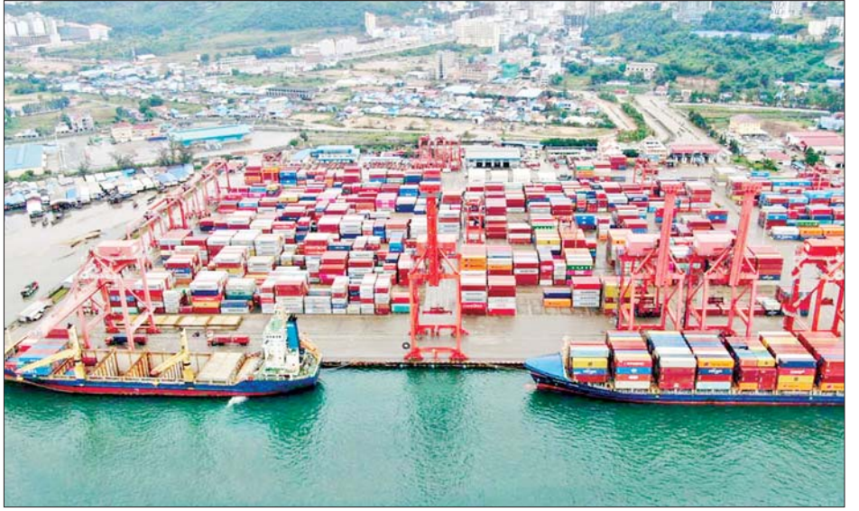
သည် ၂၀၂၅ ခုနှစ်တွင် ၈ ဒသမ ၆ ရာခိုင်နှုန်း ခရီးသွား ရာခိုင်နှုန်းနှင့် စိုက်ပျိုးရေးကဏ္ဍတွင် ၁ ဒသမ ၁ လုပ်ငန်း၊ သယ်ယူပို့ဆောင်ရေး၊ ဆက်သွယ်ရေး၊ ရာခိုင်နှုန်းအသီးသီးမြှင့်တက်လာမည်ဟုခန့်မှန်းထား ကုန်သွယ်မှုနှင့် အိမ်ခြံမြေကဏ္ဍတွင် ၅ ဒသမ ၆ သည်။ ကိုးကား - ဆင်ဟွာ၊ ဘာသာပြန် - စိုးသူရ

၂၀၂၅ ခုနှစ်အတွင်း ကမ္ဘောဒီးယားနိုင်ငံ စီးပွားရေးသည် တိုးတက်မှုနှုန်း ၆ ဒသမ ၃ ရာခိုင်နှုန်း ရောက်ရှိရန် မျှော်မှန်းထားပြီး ပြည်တွင်းအသားတင် ထုတ်လုပ်မှုတန်ဖိုးသည် အမေရိကန်ဒေါ်လာ ၅၁ ဒသမ ၃၉ ဘီလီယံအထိ တိုးမြှင့်လာမည်ဟု မျှော်မှန်းထားကြောင်း ၎င်းကထပ်လောင်းပြောကြားသည်။ နိုင်ငံသားတစ်ဦးချင်းစီ၏ ပြည်တွင်းအသားတင် ထုတ်လုပ်မှုတန်ဖိုးသည် လာမည့်နှစ်တွင် ၂၉၂၄ ဒေါ်လာအထိရှိမည်ဟု ခန့်မှန်းထားကြောင်း ၎င်းက ပြောကြားသည်။ ကမ္ဘောဒီးယားနိုင်ငံ၏ စီးပွားရေးသည် အထည်ချုပ် ဖိနပ်နှင့် ခရီးသွားကုန်ပစ္စည်းများ တင်ပို့မှု၊ ဆောက်လုပ်ရေးနှင့် အိမ်ခြံမြေ၊ ခရီးသွားလုပ်ငန်းနှင့် စိုက်ပျိုးရေးလုပ်ငန်းတို့အပေါ်တွင် အခြေခံထားသည်။ အထည်ချုပ်နှင့် ဆောက်လုပ်ရေးလုပ်ငန်းများ