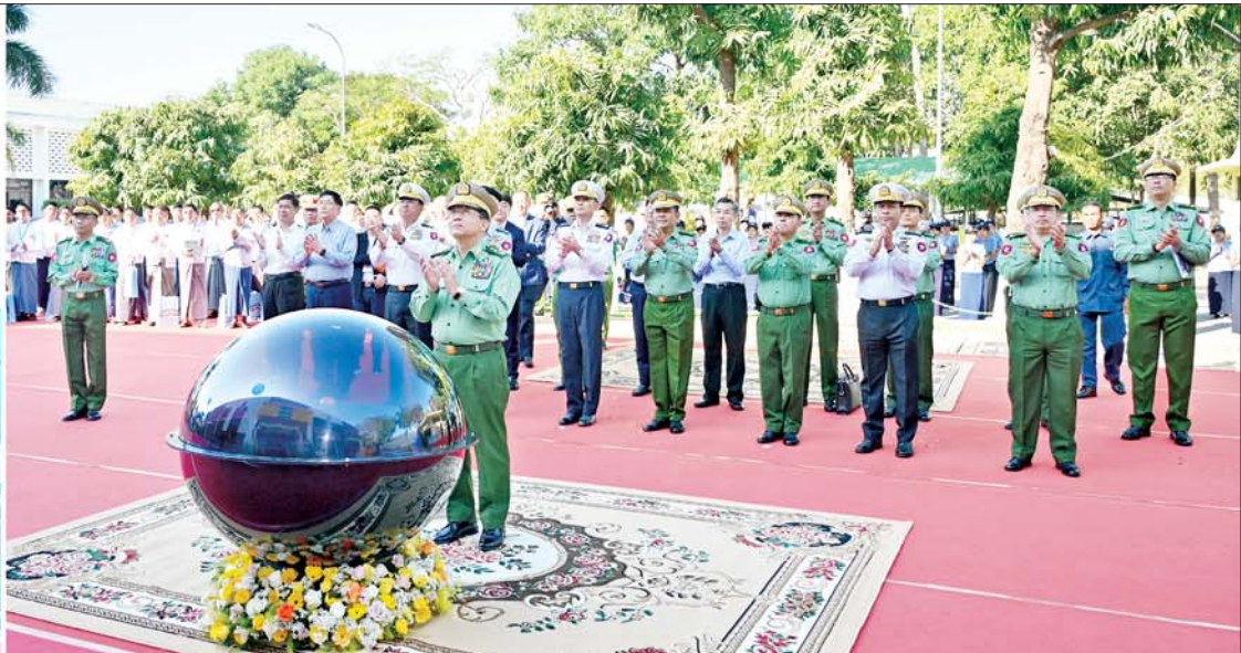
နိုင်ငံတော်စီမံအုပ်ချုပ်ရေးကောင်စီဥက္ကဋ္ဌ တပ်မတော်ကာကွယ်ရေးဦးစီးချုပ် ဗိုလ်ချုပ်မှူးကြီးမင်းအောင်လှိုင် တပ်မတော်ချုပ်ချုပ်ချယ်ရေးနှင့်အထည်စက်ရုံ(မိတ္ထီလာ) ၂/၈၀ ချည်ချောစက်ရုံခွဲဆိုင်ခန်းတော်ကို စက်ခလုတ်နှိပ် ဖွင့်လှစ်ပေးစဉ်။