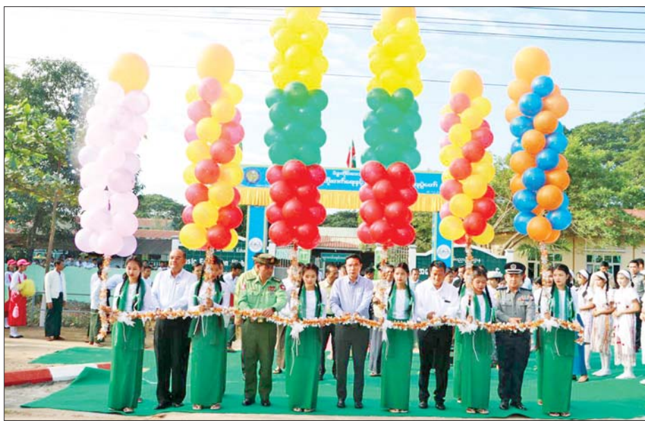
ဝန်ကြီးချုပ်က စာဖတ်ရိုက်မြှင့်တင်ရေးပွဲတော်များကို အခြေခံပညာကျောင်းများ၌ အခြေပြုပြီး စာအုပ် အလေ့အကျင့်များ ဖြစ်လာစေရန်၊ စာဖတ်ခြင်းကို စာပေ၌ နှစ်သက်မှု၊ လျော်ကာ စာဖတ်သည့်လေ့၊ စာကြည့်တိုက်များသို့ ဝင်/ထွက် သွားလာသည့် အလေ့အကျင့်များ ဖြစ်လာစေရန်၊ စာဖတ်ခြင်းကို တန်ဖိုးထားကာ ဉာဏ်ပညာ အတွေးအခေါ်မြှင့်မား

ယင်းနောက်ပဲခူးတိုင်းဒေသကြီးစာကြည့်တိုက် များကြီးကြပ်ရေးကော်မတီ နာယက တိုင်းဒေသကြီး