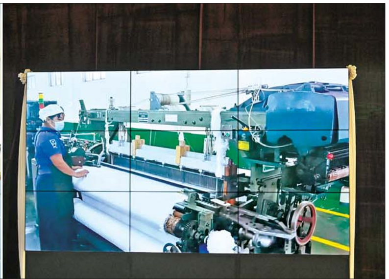
နိုင်ငံတော်စီမံအုပ်ချုပ်ရေးကောင်စီဥက္ကဋ္ဌ တပ်မတော်ကာကွယ်ရေးဦးစီးချုပ် ဗိုလ်ချုပ်မှူးကြီးမင်းအောင်လှိုင်နှင့် အခမ်းအနားတက်ရောက်လာကြသူများ ချည်မျှင်နှင့် အထည်စက်ရုံ (မိတ္ထီလာ) ၂/၈၀ ချည်ချော စက်ရုံခွဲ မှတ်တမ်းရုပ်သံကို ကြည့်ရှုကြစဉ်။

○ ရှေးဦးမှ ယင်းနေ့က နိုင်ငံတော်စီမံ အုပ်ချုပ်ရေးကောင်စီ ဥက္ကဋ္ဌ တပ်မတော်ကာကွယ်ရေးဦးစီးချုပ် နှင့် အခမ်းအနားတက်ရောက် လာကြသူများသည် ချည်မျှင်နှင့် အထည်စက်ရုံ (မိတ္ထီလာ) ၂/၈၀ ချည်ချောစက်ရုံခွဲ မှတ်တမ်းရုပ်သံ ကို ကြည့်ရှုကြသည်။ ပြည်တွင်း၌ စိုက်ပျိုးနေသည့် ဝါမှ တန်ဖိုးမြင့်ကုန်ပစ္စည်းများ အဖြစ်ပြောင်းလဲထုတ်လုပ်နိုင်ရန် ကြိုးစားခဲ့ ထို့နောက် နိုင်ငံတော်စီမံ အုပ်ချုပ်ရေးကောင်စီ ဥက္ကဋ္ဌ တပ်မတော် ကာကွယ်ရေးဦးစီး ချုပ်က အဖွင့်အမှာစကား ပြောကြားရာတွင် လူတို့အနေဖြင့် စတင်ဖြစ်တည်စဉ်ကတည်းကပင် စားရေး၊ ဝတ်ရေး၊ နေရေးဟူသည့် ကိစ္စရပ်ကြီးသုံးခုကို နေ့စဉ် မလွဲ မသွေ ရင်ဆိုင်နေကြရကြောင်း၊ မိမိတို့အစိုးရအနေဖြင့် ယင်း အရေးကိစ္စကို အဆင်ပြေစွာ ဖြေရှင်းနိုင်ရေး နိုင်ငံတော်တာဝန် စတင် ထမ်းဆောင်ချိန်ကတည်း က စိုက်ပျိုးမွေးမြူရေးလုပ်ငန်း များမှ ထွက်ရှိလာသည့် ကုန်ကြမ်း များကို ခိုင်မာသည့်ကုန်ထုတ် လုပ်ငန်းများအဖြစ် ဆောင်ရွက် နိုင်ရန် ရည်ရွယ်ခဲ့ကြောင်း၊ စား၊ ဝတ်၊ နေရေးတွင် ဝတ်ရေးဟူသည့် အဝတ်အထည်သည် လူသားများ