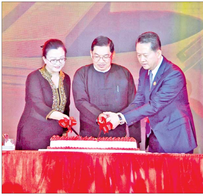
နိုင်ငံတော်စီမံအုပ်ချုပ်ရေးကောင်စီအဖွဲ့ဝင် ဗိုလ်ချုပ်ကြီးညိုစော၊ မြန်မာနိုင်ငံဆိုင်ရာ တရုတ်ပြည်သူ့သမ္မတနိုင်ငံသံအမတ်ကြီး H. E. Ms. Ma Jia နှင့် မြန်မာနိုင်ငံ တရုတ်ကုန်သည် များအသင်းချုပ်ဥက္ကဋ္ဌ ဦးအိုင်ထွန်းတို့ အမှတ်တရကိတ်မုန့် လှီးဖြတ်ပေးကြစဉ်။

ယင်းနောက် နိုင်ငံတော် စီမံအုပ်ချုပ်ရေးကောင်စီ အဖွဲ့ဝင် ဗိုလ်ချုပ်ကြီးညိုစော၊ မြန်မာနိုင်ငံ ဆိုင်ရာ တရုတ်ပြည်သူ့သမ္မတနိုင်ငံ သံအမတ်ကြီးနှင့် မြန်မာနိုင်ငံ တရုတ်ကုန်သည်များအသင်းချုပ် ဥက္ကဋ္ဌတို့က အမှတ်တရကိတ်မုန့် ကို လှီးဖြတ်ပေးခဲ့ကြသည်။ ညစာစားပွဲတွင် မြန်မာ-တရုတ် ချစ်ကြည်ရေး တေးသီချင်းများ၊ ယိမ်းအကများဖြင့် ဖျော်ဖြေ တင်ဆက်ခဲ့ကြကြောင်း သိရ သည်။ သတင်းစဉ်