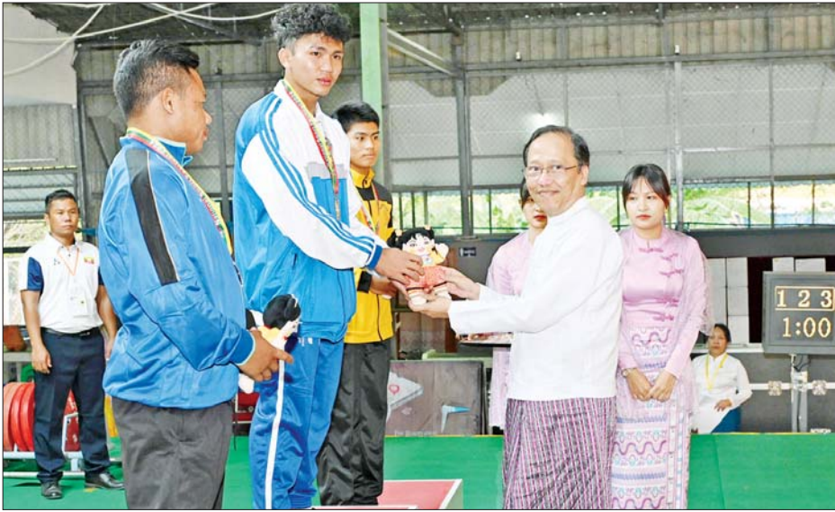
ပြည်ထောင်စုဝန်ကြီး ဒေါက်တာသက်ခိုင်ဝင်း အမျိုးသား ၆၁ ကီလိုနှင့် ၆၇ ကီလို အလေးမပြိုင်ပွဲများ တွင် ဆုရရှိသူများအား တစ်ဦးချင်း ဂုဏ်ပြုဆုတံဆိပ်နှင့် အမျိုးသားအားကစားပွဲတော် အထိမ်းအမှတ် အရုပ်ကို ပေးအပ်ချီးမြှင့်စဉ်။

ဆက်လက်၍ ပြည်ထောင်စု ဝန်ကြီး ဦးမြင့်နောင်က အမျိုးသား မိတာ ၁၀၀ အပြေးပြိုင်ပွဲတွင် ပထမနှင့် ဒုတိယဆုရရှိသည့် ဆောက်လုပ်ရေး ဝန်ကြီးဌာနနှင့် တတိယဆုရရှိသည့် အားကစား နှင့် လူငယ်ရေးရာဝန်ကြီးဌာန အသင်းတို့မှ ပြိုင်ပွဲဝင်များအား လည်းကောင်း၊ အမျိုးသမီး မိတာ ၁၀၀ အပြေးပြိုင်ပွဲတွင် ပထမဆု ရရှိသည့် ကာကွယ်ရေးဝန်ကြီး ဌာန၊ ဒုတိယဆုရရှိသည့် သယံ ဇာတနှင့် သဘာဝပတ်ဝန်းကျင် ထိန်းသိမ်းရေး ဝန်ကြီးဌာနနှင့် တတိယဆုရရှိသည့် ပြည်ထဲရေး ဝန်ကြီးဌာနအသင်းတို့မှ ပြိုင်ပွဲဝင် များအား လည်းကောင်း တစ်ဦးချင်း ဂုဏ်ပြုဆုတံဆိပ်နှင့် အမျိုးသား အားကစားပွဲတော် အထိမ်းအမှတ် အရုပ်ကို ပေးအပ်ချီးမြှင့်ကြသည်။