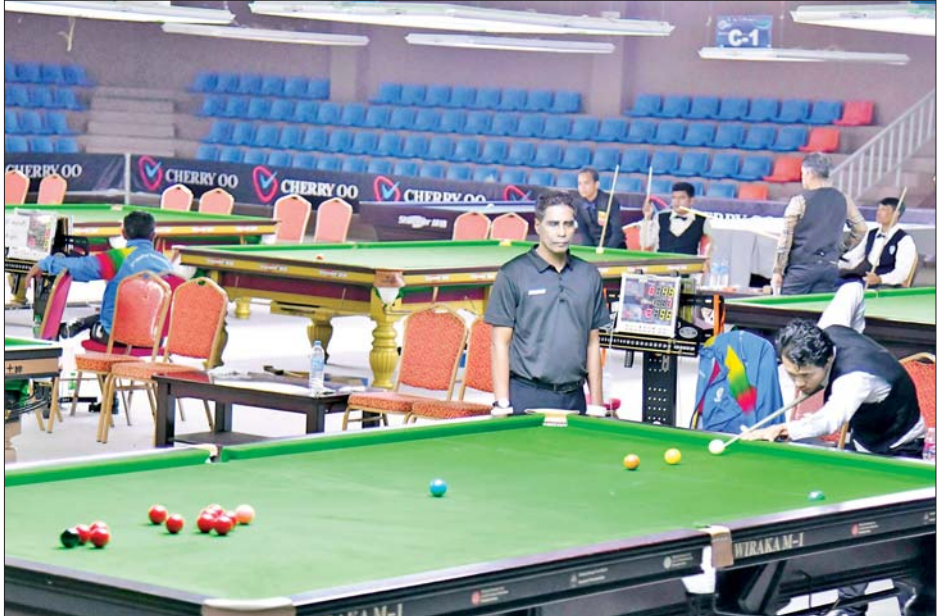
ပြည်နယ်နှင့် တိုင်းဒေသကြီး ဘီလီယက်နှင့် စနုကာပြိုင်ပွဲတွင် ပြိုင်ပွဲဝင်တစ်ဦး ယှဉ်ပြိုင်နေစဉ်။