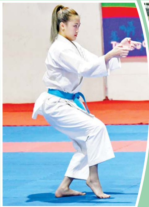
ပြည်နယ်နှင့် တိုင်းဒေသကြီး အမျိုးသမီး ကရာတေးဒိုပြိုင်ပွဲတွင် ရန်ကုန်တိုင်းဒေသကြီးမှ ပြိုင်ပွဲဝင်တစ်ဦး ယှဉ်ပြိုင်စဉ်။