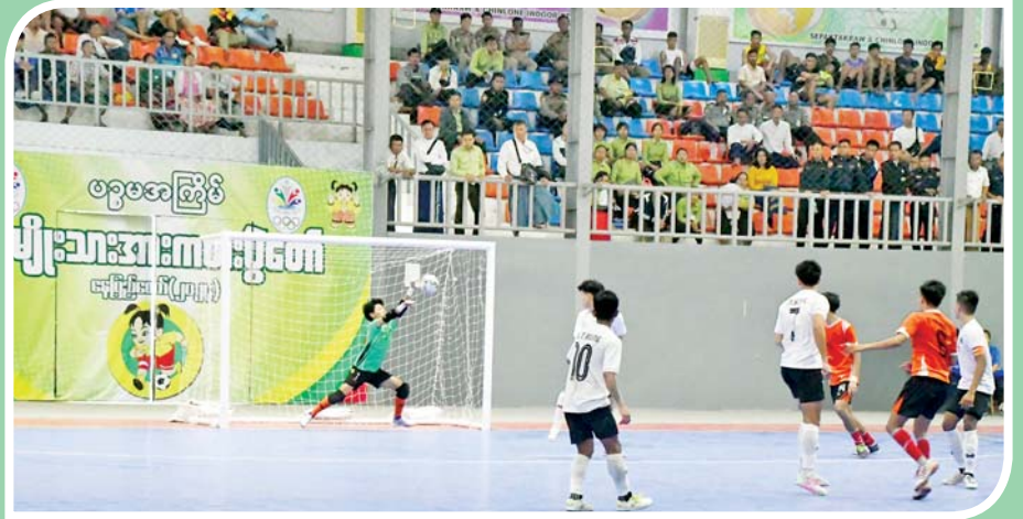
ဝန်ကြီးဌာနပေါင်းစုံ အမျိုးသား ဖူဆယ်ပြိုင်ပွဲတွင် ပြည်ထဲရေးဝန်ကြီးဌာနအသင်းနှင့် ကျန်းမာရေး ဝန်ကြီးဌာနအသင်းတို့ ယှဉ်ပြိုင်ကစားကြစဉ်။