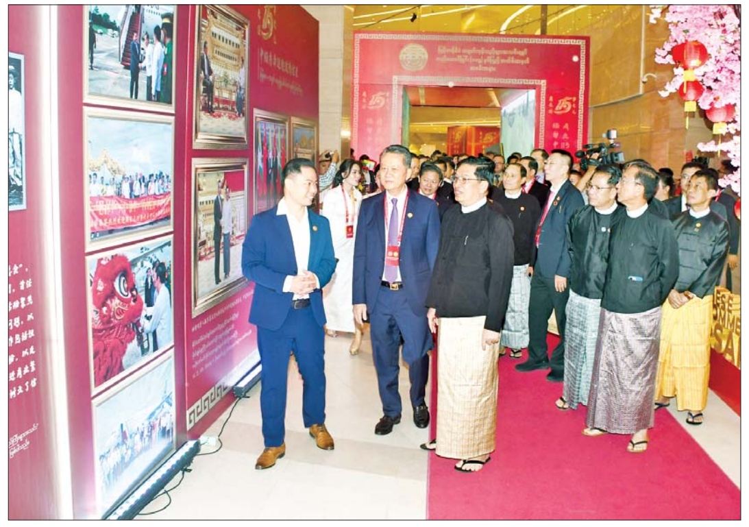
နိုင်ငံတော်စီမံအုပ်ချုပ်ရေးကောင်စီအဖွဲ့ဝင် ဗိုလ်ချုပ်ကြီးညိုစောနှင့် တက်ရောက်လာကြသူများ ခင်းကျင်းပြု ထားသည့် မြန်မာနိုင်ငံ တရုတ်ကုန်သည်များအသင်းချုပ်၏ သမိုင်းကြောင်းမှတ်တမ်းဓာတ်ပုံများကို ကြည့်ရှုလေ့လာစဉ်။