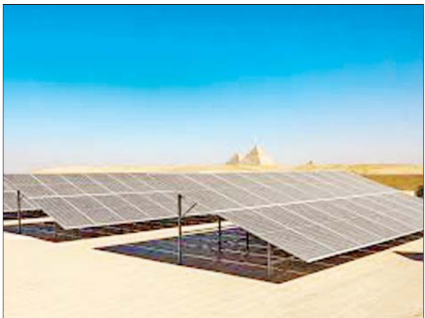
ဖြစ်ပြီး နိုင်ငံ၏ သဘာဝပတ်ဝန်းကျင်နှင့် စီးပွားရေးစဉ်ဆက်မပြတ် ဖွံ့ဖြိုးတိုးတက်ရေး လုပ်ငန်းကို အကောင်အထည်ဖော် ဆောင်ရွက်ခြင်းဖြစ်ကြောင်း ၎င်းက ပြောကြားသည်။ ယခုကဲ့သို့ လျှပ်စစ်

ကိုင်ရို ဒီဇင်ဘာ ၁၆ အီဂျစ်နိုင်ငံတွင် ပြန်လည်ပြည့်ဖြိုးမြဲစွမ်းအင်သုံးစွဲမှု မြှင့်တင်သည့်အနေဖြင့် နေရောင်ခြည်စွမ်းအင်သုံး လျှပ်စစ်ဓာတ်အားပေးစက်ရုံတစ်ရုံကို နိုင်ငံတော်ပိုင်း အက်ဝမ်ဒေသတွင် ဝန်ကြီးချုပ် မူစတာဖာ မတ်ဗော်လီက ဒီဇင်ဘာ ၁၄ ရက်တွင် ဖွင့်လှစ်ခဲ့ကြောင်း ယနေ့ဆင်ဟွာသတင်းတွင် ဖော်ပြသည်။ ၎င်းစက်ရုံ ဖွင့်လှစ်ခြင်းသည် နိုင်ငံ၏ ပြန်လည်ပြည့်ဖြိုးမြဲစွမ်းအင်အသုံးပြုမှု မြှင့်တင်ခြင်းဆိုင်ရာ အရေးကြီးသည့် ခြေလှမ်း