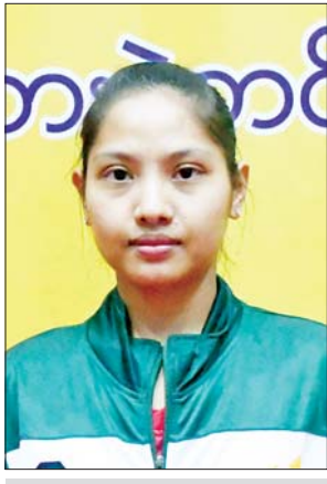
မထက်ထက်ဝေ