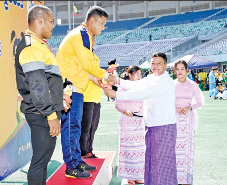
ပြည်ထောင်စုဝန်ကြီး ဦးမင်းသိန်းဇံ အမျိုးသား သံပြားဝိုင်းပစ်ပြိုင်ပွဲတွင် ပထမဆုရရှိသည့် ပြည်ထဲရေးဝန်ကြီးဌာနမှ ထက်ဝေယံအား ဂုဏ်ပြုဆုတံဆိပ်နှင့် အမျိုးသားအားကစားပွဲတော် အထိမ်းအမှတ်အရုပ် ပေးအပ်ချီးမြှင့်စဉ်။