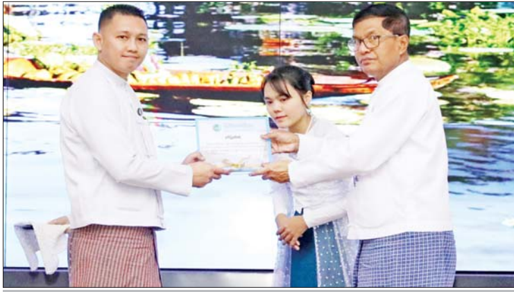
ဒုတိယဝန်ကြီး ဦးရဲတင့် ပထမဆုရရှိသည့် ဦးမျိုးမင်းထိုက် (The Eagle) အား ဆုပေးအပ်ချီးမြှင့်စဉ်။

ဦးစွာ ပြည်ထောင်စုဝန်ကြီး (ကိုယ်စား) ဒုတိယဝန်ကြီး ဦးရဲတင့်က အမှာစကားပြောကြားရာတွင် ပြိုင်ပွဲကို နိုင်ငံတော်၏ ဖွံ့ဖြိုးတိုးတက်မှုများ၊ သာယာလှပမှုများ၊ အေးချမ်းတည်ငြိမ်မှုများ၊ တိုင်းရင်းသားများ၏ စည်းလုံးညီညွတ်မှုများနှင့် ရိုးရာယဉ်ကျေးမှုများ၊ လွတ်လပ်ရေးကြိုးပမ်းမှု၏ ထင်ရှားသည့်သင်္ကေတ၊ နေရာဒေသများနှင့် လူပုဂ္ဂိုလ်များစသည့် လွတ်လပ်ရေး၏အနစ်သာရတို့ကို ပေါ်လွင်စွာ ဖော်ညွှန်းရိုက်ကူးထားသည့် ဓာတ်ပုံများဖြင့် ရိုက်ကူးယှဉ်ပြိုင်စေခဲ့ခြင်းဖြစ်ကြောင်း၊ ပြိုင်ပွဲဝင်ဓာတ်ပုံများကို အက်ဖြတ်ပေးကြသည့် ပညာရှင်ကြီးများက ဓာတ်ပုံတစ်ပုံ၏ ရိုက်ကွင်းရိုက်ကွက်၊ အယူအဆ၊ အလင်းအမှောင်၊ ဖော်ညွှန်းသည့်အကြောင်းအရာ၊ ဓာတ်ပုံကောင်းတစ်ပုံ၏ အင်္ဂါရပ်များနှင့်အညီ အကြိမ်ကြိမ်