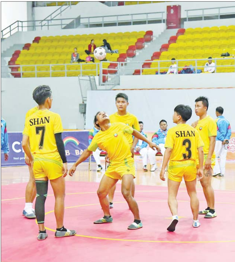
ပြည်နယ်နှင့် တိုင်းဒေသကြီး အမျိုးသား/အမျိုးသမီး မြန်မာ့ရိုးရာ ခြင်းလုံးခတ်ပြိုင်ပွဲတွင် ရှမ်းပြည်နယ်မှ ပြိုင်ပွဲဝင်အားကစားသမားများ ယှဉ်ပြိုင်ကစားကြစဉ်။

ဝန်ကြီးဌာနပေါင်းစုံ အလွတ် တန်း ဘော်လီဘောပြိုင်ပွဲ ကွာတား ဖိုင်နယ် ပွဲစဉ်များကို ဝဏ္ဏသိဒ္ဓိ အားကစားကွင်း ဘော်လီဘော ကျင်းပရာ အမျိုးသား ဘော်လီဘော ပြိုင်ပွဲတွင် ကာကွယ်ရေးဝန်ကြီး ဌာနအသင်းက သယ်ဇာတနှင့် သဘာဝပတ်ဝန်းကျင်ထိန်းသိမ်း ရေးဝန်ကြီးဌာနအသင်းကို သုံးပွဲ ပြတ်၊ ပြည်ထဲရေးဝန်ကြီးဌာန အသင်းက လူဝင်မှုကြီးကြပ်ရေး နှင့် ပြည်သူ့အင်အားဝန်ကြီးဌာန