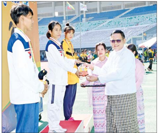
ဒုတိယဝန်ကြီး ဒေါက်တာမျိုးသန့် အမျိုးသမီး မိတာ ၄၀၀ တန်းကျော်ပြိုင်ပွဲတွင် ပထမဆုရရှိသည့် ကာကွယ်ရေးဝန်ကြီးဌာနမှ ပပဦးအေး ဂုဏ်ပြုဆုတံဆိပ်နှင့် အမျိုးသားအားကစားပွဲတော် အထိမ်းအမှတ်အရုပ်ကို ပေးအပ်ချီးမြှင့်စဉ်။

၂၀၂၄ ခုနှစ် ပစ္စမအကြိမ် အမျိုးသား အားကစားပွဲတော် အားကစား နည်းများ အလိုက် ဗိုလ်လုပွဲနှင့် ဆုချီးမြှင့်ပွဲ အခမ်း အနားများကို ဒီဇင်ဘာ ၁၇ ရက် တွင် သက်ဆိုင်ရာ အားကစားရုံ များနှင့် အားကစားကွင်းများ၌ ဆက်လက် ကျင်းပသွားမည်ဖြစ် ကြောင်း သိရသည်။ သတင်းစဉ်