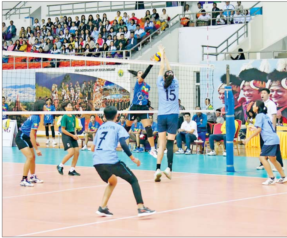
ဝန်ကြီးဌာနပေါင်းစုံ အမျိုးသမီး ဘော်လီဘောပြိုင်ပွဲတွင် အားကစားနှင့် လူငယ်ရေးရာဝန်ကြီးဌာနအသင်းနှင့် သမဝါယမနှင့် ကျေးလက်ဖွံ့ဖြိုးရေးဝန်ကြီးဌာနအသင်းတို့ ယှဉ်ပြိုင်ကစားကြစဉ်။

ပြန်လည်နေရာချထားရေးဝန်ကြီးဌာနအသင်းက အားကစားနှင့် လူငယ်ရေးရာ ဝန်ကြီးဌာနအသင်းကို လေးဂိုး-တစ်ဂိုး၊ ဟိုတယ်နှင့် ခရီးသွားလာရေးဝန်ကြီးဌာနအသင်းက ပြန်ကြားရေးဝန်ကြီးဌာနအသင်းကို ခုနစ်ဂိုး-တစ်ဂိုး၊ ပြည်ထဲရေးဝန်ကြီးဌာနအသင်းက ကျန်းမာရေးဝန်ကြီးဌာနအသင်းကို လေးဂိုး-နှစ်ဂိုး၊ စီမံကိန်းနှင့် ဘဏ္ဍာရေးဝန်ကြီးဌာနအသင်းက နယ်စပ်ရေးရာဝန်ကြီးဌာနအသင်းကို ကိုးဂိုး-တစ်ဂိုးဖြင့် အနိုင်ရရှိခဲ့ကြသည်။ ဝန်ကြီးဌာနပေါင်းစုံ အမျိုးသား ပိုက်ကျော်ခြင်း သုံးယောက်တွဲ ပြိုင်ပွဲ ကွာတားဖိုင်နယ်ပွဲစဉ်များကို ဝဏ္ဏသိဒ္ဓိအားကစားကွင်း (A)ရုံ၌ ကျင်းပရာ အမျိုးသား သုံးယောက်တွဲ ပြိုင်ပွဲတွင် ဆောက်လုပ်ရေး ဝန်ကြီးဌာနအသင်းက ပြည်ထဲရေးဝန်ကြီးဌာနအသင်းကို နှစ်ပွဲ-တစ်ပွဲအားကစားနှင့် လူငယ်ရေးရာဝန်ကြီးဌာနအသင်းက စိုက်ပျိုးရေး၊ မွေးမြူရေးနှင့် ဆည်မြောင်းဝန်ကြီးဌာနအသင်းကို နှစ်ပွဲပြတ်၊ ပို့ဆောင်ရေးနှင့် ဆက်သွယ်ရေးဝန်ကြီးဌာနအသင်းက လူမှုဝန်ထမ်း၊ ကယ်ဆယ်ရေးနှင့် ပြန်လည်နေရာချထားရေးဝန်ကြီးဌာနအသင်းကို နှစ်ပွဲ-တစ်ပွဲ၊ ကာကွယ်ရေးဝန်ကြီးဌာနအသင်းက ဟိုတယ်နှင့် ခရီးသွားလာရေး ဝန်ကြီးဌာနအသင်းကို နှစ်ပွဲပြတ်၊ အမျိုးသား သုံးယောက်တွဲ ပြိုင်ပွဲ ဆီမီးဖိုင်နယ်ပွဲစဉ်တွင် အားကစားနှင့် လူငယ်ရေးရာဝန်ကြီးဌာန အသင်းက ပို့ဆောင်ရေးနှင့် ဆက်သွယ်ရေး ဝန်ကြီးဌာနအသင်းကို နှစ်ပွဲပြတ်၊ ကာကွယ်ရေးဝန်ကြီးဌာနအသင်းက ပို့ဆောင်ရေးနှင့် ဆက်သွယ်ရေး ဝန်ကြီးဌာနအသင်းကို နှစ်ပွဲပြတ်၊ ကာကွယ်ရေးဝန်ကြီးဌာနအသင်းက ပြန်ကြားရေးဝန်ကြီးဌာနအသင်းကို နှစ်ပွဲပြတ်၊ ကာကွယ်ရေးဝန်ကြီးဌာနအသင်းက ဆောက်လုပ်ရေးဝန်ကြီးဌာနအသင်းကို နှစ်ပွဲပြတ်ဖြင့်အနိုင်ရရှိခဲ့ကြသည်။