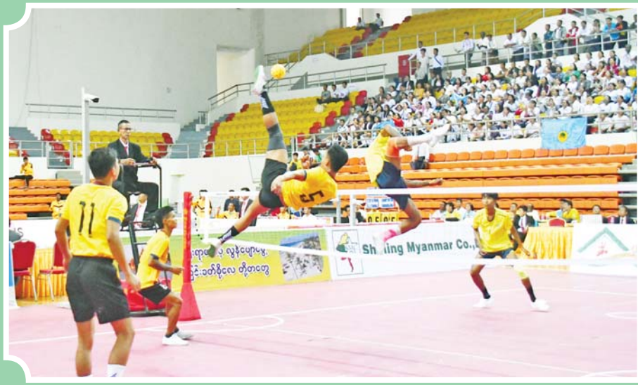
ဝန်ကြီးဌာနပေါင်းစုံ အမျိုးသား ပိုက်ကျော်ခြင်းပြိုင်ပွဲတွင် ဟိုတယ်နှင့် ခရီးသွားလာရေးဝန်ကြီး ဌာနအသင်းနှင့် ကာကွယ်ရေးဝန်ကြီးဌာနအသင်းတို့ ယှဉ်ပြိုင်ကစားကြစဉ်။