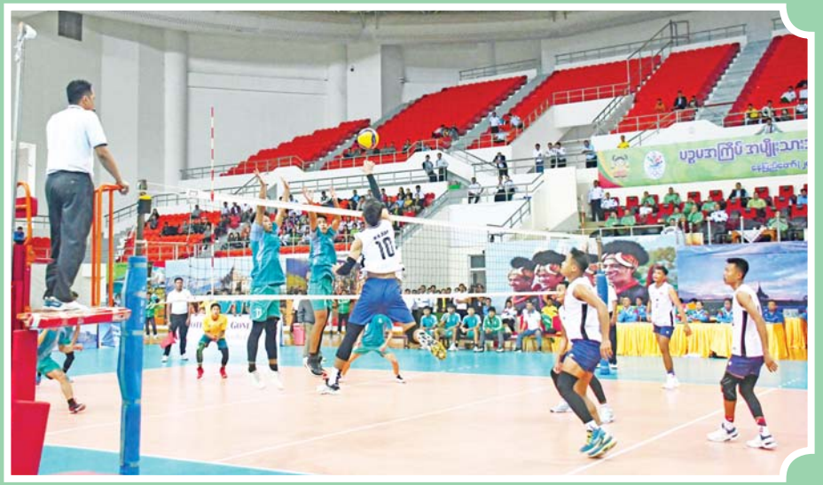
ဝန်ကြီးဌာနပေါင်းစုံ အမျိုးသား ဘော်လီဘောပြိုင်ပွဲတွင် သယံဇာတနှင့် သဘာဝပတ်ဝန်းကျင် ထိန်းသိမ်းရေးဝန်ကြီးဌာနအသင်းနှင့် ကာကွယ်ရေးဝန်ကြီးဌာနအသင်းတို့ ယှဉ်ပြိုင်ကစားကြစဉ်။