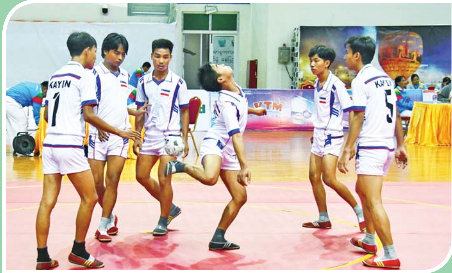
ပြည်နယ်နှင့် တိုင်းဒေသကြီး အမျိုးသား ရိုးရာခြင်းခတ်ပြိုင်ပွဲတွင် ကရင်ပြည်နယ်မှ ပြိုင်ပွဲဝင်များ ယှဉ်ပြိုင်ကစားကြစဉ်။