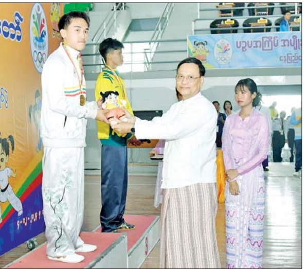
ဒုတိယဝန်ကြီး ဒေါက်တာဇော်မြင့် အမျိုးသား နန်းချွမ်ပြိုင်ပွဲတွင် ပထမဆုရရှိသည့် ရှမ်းပြည်နယ်မှ ပြိုင်ပွဲဝင်တစ်ဦးအား ဂုဏ်ပြု ဆုတံဆိပ်နှင့် အမျိုးသားအားကစားပွဲတော် အထိမ်းအမှတ်အရုပ်ကို ပေးအပ်ချီးမြှင့်စဉ်။