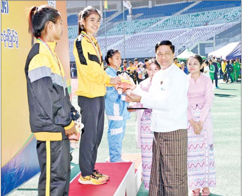
ပြည်ထောင်စုဝန်ကြီး ဒေါက်တာစိုးဝင်း အမျိုးသမီး မိတာ ၈၀၀ အပြေးပြိုင်ပွဲတွင် ပထမဆုရရှိသည့် ပြည်ထဲရေးဝန်ကြီးဌာနမှ မိတ်ဆွေအား ဂုဏ်ပြုဆုတံဆိပ်နှင့် အမျိုးသားအားကစားပွဲတော် အထိမ်းအမှတ်အရုပ် ပေးအပ်ချီးမြှင့်စဉ်။

ယင်းနောက် ပြည်ထောင်စုဝန်ကြီး ဒေါက်တာစိုးဝင်းက အမျိုးသမီး မိတာ ၈၀၀ အပြေးပြိုင်ပွဲတွင် ပထမဆုရရှိသည့် ပြည်ထဲရေးဝန်ကြီးဌာန၊ ဒုတိယဆုရရှိသည့် ဆောက်လုပ်ရေးဝန်ကြီးဌာနနှင့် တတိယဆုရရှိသည့် အားကစားနှင့်လူငယ်ရေးရာဝန်ကြီးဌာန စာမျက်နှာ ၉ သို့ ။