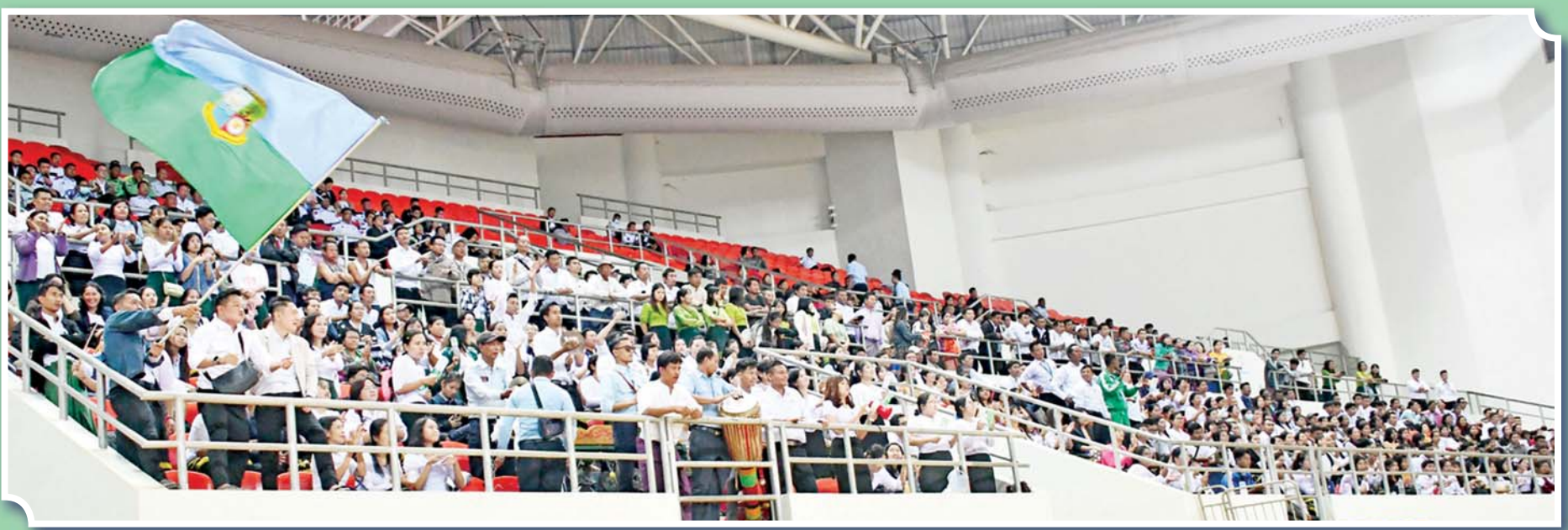
ပဉ္စမအကြိမ် အမျိုးသားအားကစားပွဲတော် အားကစားပြိုင်ပွဲများသို့ လာရောက်ကြည့်ရှုကြသူများကို တွေ့ရစဉ်။