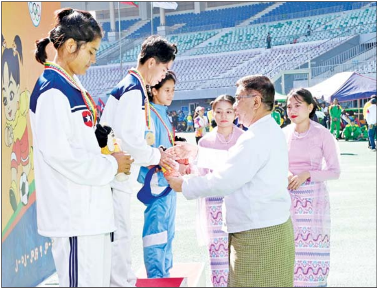
ပြည်ထောင်စုဝန်ကြီး ဒေါက်တာညွန့်ဖေ အမျိုးသမီး မာရသွန်အပြေးပြိုင်ပွဲတွင် ပထမဆုရရှိသည့် ကာကွယ်ရေးဝန်ကြီးဌာနမှ မြင့်မြင့်အေးအေး ဂုဏ်ပြုဆုတံဆိပ်နှင့် အမျိုးသားအားကစားပွဲတော် အထိမ်းအမှတ်အရုပ်ကို ပေးအပ်ချီးမြှင့်စဉ်။

★ စာမျက်နှာ ၈ မှ အသင်းတို့မှ ပြိုင်ပွဲဝင်များအား လည်းကောင်း၊ ပြည်ထောင်စု ဝန်ကြီး ဒေါက်တာညွန့်ဖေက အမျိုးသမီး မာရသွန်အပြေးပြိုင်ပွဲ တွင် ပထမနှင့် ဒုတိယဆုရရှိသည့် ကာကွယ်ရေး ဝန်ကြီးဌာနနှင့် တတိယဆုရရှိသည့် အလုပ်သမား ဝန်ကြီးဌာနအသင်းတို့မှ ပြိုင်ပွဲဝင် များအား လည်းကောင်း တစ်ဦးချင်း ဂုဏ်ပြုဆုတံဆိပ်နှင့် အမျိုးသား အားကစားပွဲတော် အထိမ်းအမှတ် အရုပ်ကို ပေးအပ်ချီးမြှင့်ကြသည်။