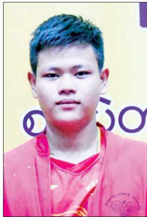
မောင်မြတ်စည်သူ