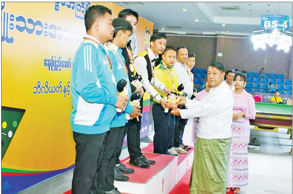
ပြည်ထောင်စုတရားသူကြီးချုပ် ဦးသာဌေး 9 Ball Pool Double နှစ်ယောက်တွဲပြိုင်ပွဲတွင် ပထမဆုရရှိသည့် ရှမ်းပြည်နယ်အသင်းအား တစ်ဦးချင်း ဂုဏ်ပြုဆုတံဆိပ်နှင့် အမျိုးသားအားကစားပွဲတော် အထိမ်းအမှတ်အရုပ် ပေးအပ်ချီးမြှင့်စဉ်။

ထို့နောက် ဒုတိယဝန်ကြီးဒေါက်တာမျိုးသန့်က အမျိုးသမီးမိတာ ၄၀၀ တန်းကျော်ပြိုင်ပွဲတွင် ပထမနှင့် ဒုတိယဆုရရှိသည့် ကာကွယ်ရေးဝန်ကြီးဌာနနှင့် တတိယဆုရရှိသည့် ပြည်ထဲရေးဝန်ကြီးဌာနအသင်းတို့မှ ပြိုင်ပွဲဝင်များအား လည်းကောင်း၊ ဒုတိယဝန်ကြီးဦးအေးကျော်က အမျိုးသမီးသံပြားဝိုင်းပစ်ပြိုင်ပွဲတွင် ပထမဆုရရှိသည့် ပညာရေးဝန်ကြီးဌာန၊ ဒုတိယဆုရရှိသည့် စိုက်ပျိုးရေး၊ မွေးမြူရေးနှင့် ဆည်မြောင်းဝန်ကြီးဌာနနှင့် တတိယဆုရရှိသည့် အားကစားနှင့် လူငယ်ရေးရာဝန်ကြီးဌာနအသင်းတို့မှ ပြိုင်ပွဲဝင်များအား လည်းကောင်း၊ ဒုတိယဝန်ကြီး ဦးဗိုလ်ဗိုလ်ကျော်က အမျိုးသား မာရသွန်အပြေးပြိုင်ပွဲတွင် ပထမဆုရရှိသည့် ကာကွယ်ရေးဝန်ကြီးဌာန၊ ဒုတိယဆုရရှိသည့် အားကစားနှင့်လူငယ်ရေးရာ