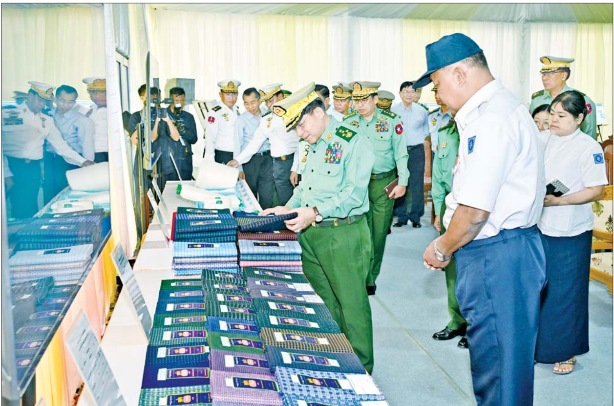
နိုင်ငံတော်စီမံအုပ်ချုပ်ရေးကောင်စီဥက္ကဋ္ဌ တပ်မတော်ကာကွယ်ရေးဦးစီးချုပ် ဗိုလ်ချုပ်မှူးကြီးမင်းအောင်လှိုင် တပ်မတော်ချည်မျှင်နှင့် အထည်စက်ရုံ (မိတ္ထီလာ) ၂/၈၀ ချည်ချောစက်ရုံခွဲမှ ထုတ်လုပ်ထားသည့် ချည်ထည်ပစ္စည်းများကို လှည့်လည်ကြည့်ရှုစဉ်။

○ ရှေးဦးမှ ယင်းနေ့က နိုင်ငံတော်စီမံ အုပ်ချုပ်ရေးကောင်စီ ဥက္ကဋ္ဌ တပ်မတော်ကာကွယ်ရေးဦးစီးချုပ် နှင့် အခမ်းအနားတက်ရောက် လာကြသူများသည် ချည်မျှင်နှင့် အထည်စက်ရုံ (မိတ္ထီလာ) ၂/၈၀ ချည်ချောစက်ရုံခွဲ မှတ်တမ်းရုပ်သံ ကို ကြည့်ရှုကြသည်။ ပြည်တွင်း၌ စိုက်ပျိုးနေသည့် ဝါမှ တန်ဖိုးမြင့်ကုန်ပစ္စည်းများ အဖြစ်ပြောင်းလဲထုတ်လုပ်နိုင်ရန် ကြိုးစားခဲ့ ထို့နောက် နိုင်ငံတော်စီမံ အုပ်ချုပ်ရေးကောင်စီ ဥက္ကဋ္ဌ တပ်မတော် ကာကွယ်ရေးဦးစီး ချုပ်က အဖွင့်အမှာစကား ပြောကြားရာတွင် လူတို့အနေဖြင့် စတင်ဖြစ်တည်စဉ်ကတည်းကပင် စားရေး၊ ဝတ်ရေး၊ နေရေးဟူသည့် ကိစ္စရပ်ကြီးသုံးခုကို နေ့စဉ် မလွဲ မသွေ ရင်ဆိုင်နေကြရကြောင်း၊ မိမိတို့အစိုးရအနေဖြင့် ယင်း အရေးကိစ္စကို အဆင်ပြေစွာ ဖြေရှင်းနိုင်ရေး နိုင်ငံတော်တာဝန် စတင် ထမ်းဆောင်ချိန်ကတည်း က စိုက်ပျိုးမွေးမြူရေးလုပ်ငန်း များမှ ထွက်ရှိလာသည့် ကုန်ကြမ်း များကို ခိုင်မာသည့်ကုန်ထုတ် လုပ်ငန်းများအဖြစ် ဆောင်ရွက် နိုင်ရန် ရည်ရွယ်ခဲ့ကြောင်း၊ စား၊ ဝတ်၊ နေရေးတွင် ဝတ်ရေးဟူသည့် အဝတ်အထည်သည် လူသားများ