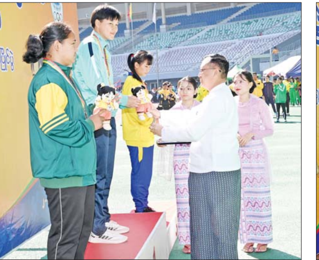
ဒုတိယဝန်ကြီး ဦးအေးကျော်အမျိုးသမီး သံပြားဝိုင်းပစ်ပြိုင်ပွဲတွင် ပထမဆုရရှိသည့် ပညာရေးဝန်ကြီးဌာနမှ နန်းဟွမ်းဆိုင်ခမ်းအေး ဂုဏ်ပြုဆုတံဆိပ်နှင့် အမျိုးသားအားကစားပွဲတော် အထိမ်းအမှတ် အရုပ်ကို ပေးအပ်ချီးမြှင့်စဉ်။