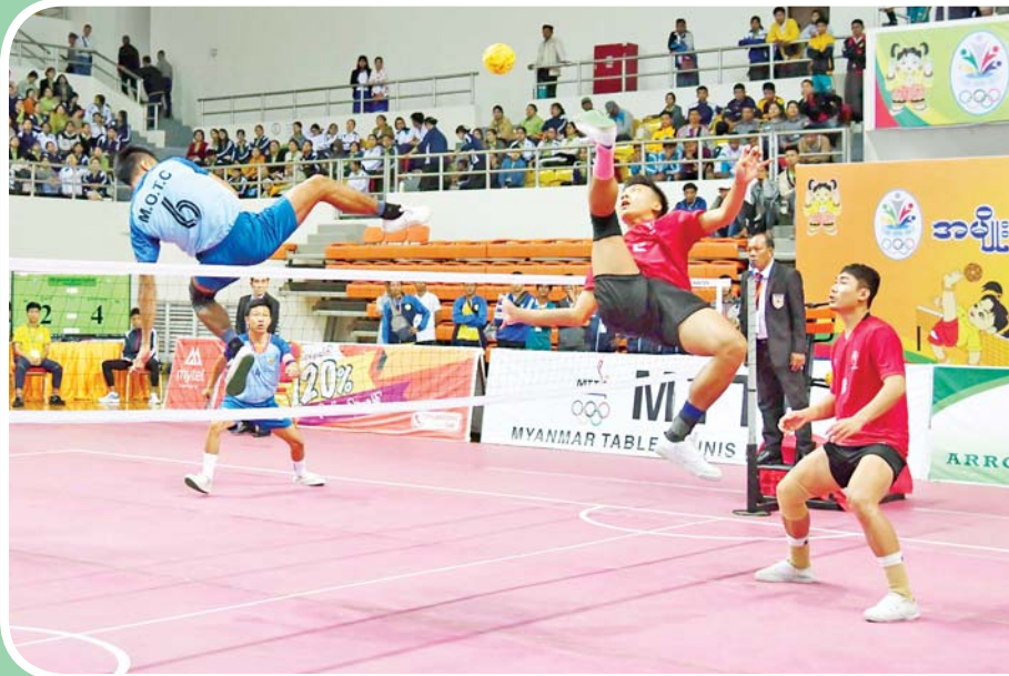
ဝန်ကြီးဌာနပေါင်းစုံ အမျိုးသား ပိုက်ကျော်ခြင်းပြိုင်ပွဲတွင် နယ်စပ်ရေးရာဝန်ကြီးဌာနအသင်းနှင့် ပို့ဆောင်ရေးနှင့် ဆက်သွယ်ရေးဝန်ကြီးဌာနအသင်းတို့ ယှဉ်ပြိုင်ကစားကြစဉ်။