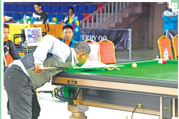
ပြည်နယ်နှင့် တိုင်းဒေသကြီး အမျိုးသား ဘိုလီယက်/ စနူကာ ပြိုင်ပွဲတွင် ပြိုင်ပွဲဝင်တစ်ဦး ယှဉ်ပြိုင်စဉ်။