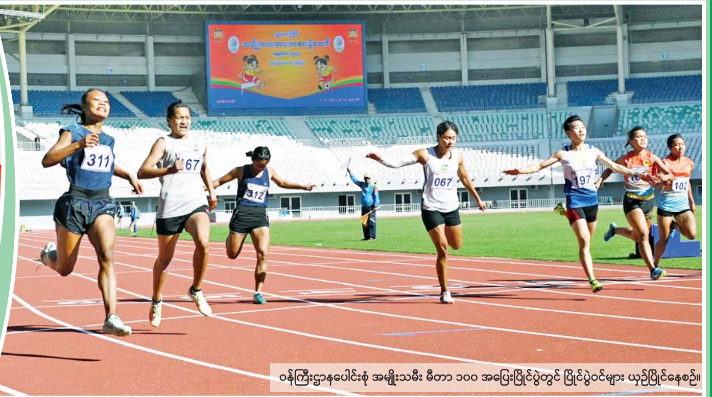
ဝန်ကြီးဌာနပေါင်းစုံ အမျိုးသမီး မီတာ ၁၀၀ အပြေးပြိုင်ပွဲတွင် ပြိုင်ပွဲဝင်များ ယှဉ်ပြိုင်နေစဉ်။