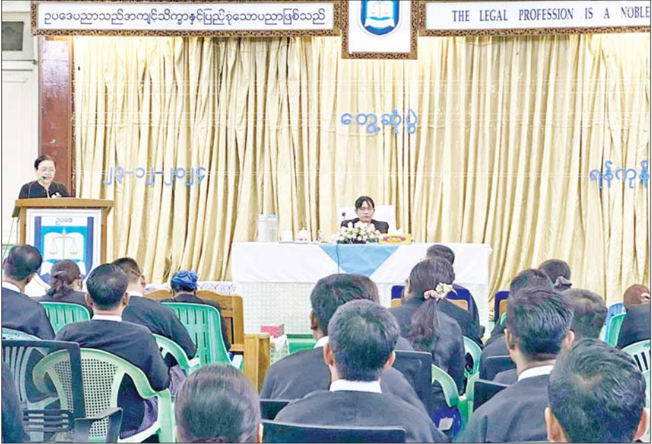
ဆွေးနွေးမှာကြားသည်။ ယနေ့ဖွင့်လှစ်သည့် တရားမမှုလိုက် (လက်တွေ့) ဘာသာရပ်သင်တန်းကို ရက်သတ္တ တစ်ပတ်လျှင် နှစ်ရက်ဖြင့် နှစ်လကြာဖွင့်လှစ်