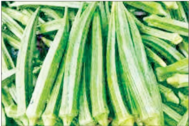
သတင်း ရင်းမြစ်- စီးပွား/ကူးသန်း

ပဲခူး ဒီဇင်ဘာ ၂၃ ပဲခူးတိုင်းဒေသကြီး ပေါက်ခေါင်းမြို့နယ်အတွင်းရှိ ကျေးရွာများသည် လယ်ယာစိုက်ပျိုးရေးလုပ်ငန်းကို လုပ်ကိုင်ကြပြီး သီးနှံမျိုးစုံကိုလည်း စိုက်ပျိုးလျက်ရှိရာ ရုံးပတီသီးနှံကို မိသားစုတစ်နိုင်တစ်ပိုင် အနေဖြင့် တစ်နှစ်ပတ်လုံး စိုက်ပျိုးလျက်ရှိကြောင်း သိရသည်။ ရုံးပတီသီးနှံကို ရာသီမရွေးစိုက်ပျိုးကာ စိုက်ပျိုးပြီး တစ်လခွဲခန့်အကြာတွင် အသီးများစတင် ခူးဆွတ်ရကြောင်း၊ ရုံးပတီမျိုးအနေဖြင့် အပင်ငယ်မျိုးကို စိုက်ပျိုးကြပြီး တစ်ပင်နှင့် တစ်ပင် အကွာအဝေး နှစ်ပေ သုံးပေခြား၍ စိုက်ပျိုးရကြောင်း၊ ရုံးပတီသီးနှံတစ်ဧကလျှင် ရုံးပတီမျိုးစေ့ ၁၀၀ ခန့် စိုက်ပျိုးနိုင်ပြီး မျိုးစေ့၊ သွင်းအားစု၊ အလုပ်သမားခ အပါအဝင် တစ်ဧကလျှင် စုစုပေါင်းငွေကျပ် ရှစ်သိန်းခန့် ကုန်ကျကြောင်း၊ တစ်ဧကလျှင် ရုံးပတီသီး ပိဿာချိန် ၁၀၀၀ ခန့် ထွက်ရှိကြောင်း၊ ဈေးကွက်အနေဖြင့် ပေါက်ခေါင်းမြို့နှင့် ပြည်မြို့ရှိ ကုန်စိမ်းသီးနှံဗိုင်းများသို့ တင်ပို့ရောင်းချ၍ အကျိုးအမြတ်ရလျက်ရှိကြောင်း ရုံးပတီသီးနှံ စိုက်တောင်သူများထံမှ သိရသည်။