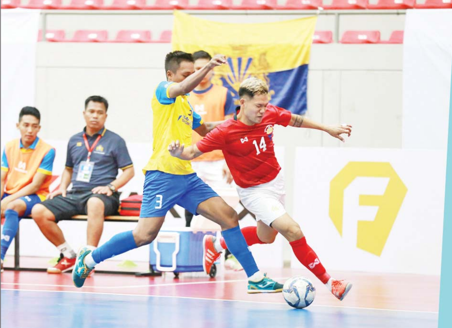
ပြီးခဲ့သည့် MFF ဖူဆယ်လိဂ်-၁ ပြိုင်ပွဲ ကျင်းပစဉ်။

ရန်ကုန် ဒီဇင်ဘာ ၂၃ ၂၀၂၄-၂၀၂၅ ရာသီ MFF ဖူဆယ်လိဂ်-၁ ပြိုင်ပွဲကို ဒီဇင်ဘာ ၂၉ ရက်မှ စတင်၍ ရန်ကုန်မြို့ သုဝဏ္ဏဘောလုံးကွင်းရှိ MFF ဖူဆယ်အားကစားရုံ၌ ကျင်းပမည် ဖြစ်သည်။ လာမည့်ရာသီ MFF ဖူဆယ် လိဂ်-၁ ပြိုင်ပွဲကို နှစ်ကျောစနစ်ဖြင့် ကျင်းပမည်ဖြစ်ပြီး အသင်း ၁၀ သင်း ပါဝင်ယှဉ်ပြိုင်မည်ဖြစ်သည်။ ယင်းပြိုင်ပွဲတွင် လက်ရှိချန်ပီယံ VUC အသင်း အပါအဝင် MIU အသင်း၊ ဖူဆယ်ချစ်သူအသင်း၊ MH Dream Team အသင်း၊ Generations အသင်း၊ YCDC Marga အသင်း၊ Winner Soccer အသင်း၊ M2K အသင်း၊ တန်းတက် နှစ်သင်းဖြစ်သည့် YRG အသင်း၊ စာမျက်နှာ ၂၃ ကော်လံ ၁ သို့ ❖