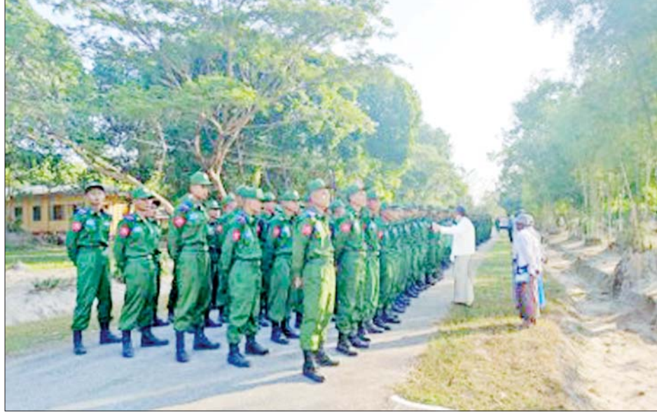
ပြည်သူ့စစ်မှုထမ်းသင်တန်းအမှတ်စဉ်(၈) သင်တန်းဖွင့်ပွဲကျင်းပစဉ်။