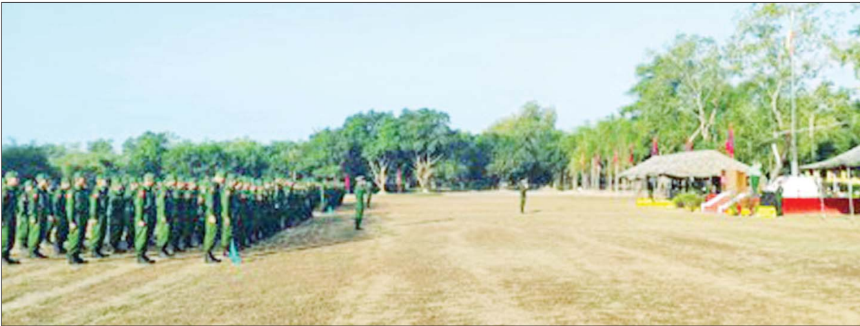
ပြည်သူ့စစ်မှုထမ်းသင်တန်းအမှတ်စဉ်(၈) သင်တန်းဖွင့်ပွဲကျင်းပစဉ်။