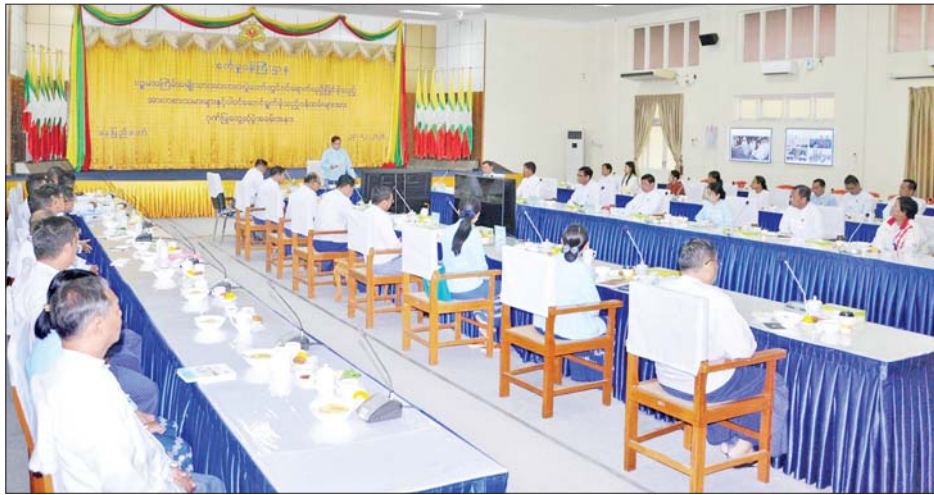
ပြည်ထောင်စုဝန်ကြီး ဒေါက်တာချာလီသန်း ပဉ္စမအကြိမ် အမျိုးသားအားကစားပွဲတော်တွင် ဝင်ရောက် ယှဉ်ပြိုင်ခဲ့သည့် အားကစားသမားများနှင့် ပါဝင်ဆောင်ရွက်ခဲ့သည့်ဝန်ထမ်းများအား တွေ့ဆုံအမှာစကား ပြောကြားစဉ်။

ပဉ္စမအကြိမ် အမျိုးသားအားကစားပွဲတော်တွင် ဝင်ရောက်ယှဉ်ပြိုင်ခဲ့သည့် အားကစားသမားများနှင့် ပါဝင်ဆောင်ရွက်ခဲ့သည့်ဝန်ထမ်းများအား ဂုဏ်ပြု တွေ့ဆုံပွဲအခမ်းအနားကို ယနေ့နံနက်ပိုင်းတွင် စက်မှုဝန်ကြီးဌာန ရုံးအမှတ်(၃၀) အစည်းအဝေးခန်းမ၌ ကျင်းပရာ စက်မှုဝန်ကြီးဌာန ပြည်ထောင်စုဝန်ကြီး ဒေါက်တာ ချာလီသန်း၊ ဒုတိယဝန်ကြီး ဦးရင်မောင်ညွန့်၊ ညွှန်ကြားရေးမှူးချုပ်များ၊ ဦးဆောင်ညွှန်ကြားရေးမှူးများ၊ တာဝန်ရှိသူများ၊ စက်မှုဝန်ကြီးဌာနကိုယ်စားပြု ဝင်ရောက်ယှဉ်ပြိုင်ခဲ့သည့် အားကစားသမားများနှင့် ပါဝင်ဆောင်ရွက်ခဲ့သည့်ဝန်ထမ်းများ တက်ရောက်ကြသည်။