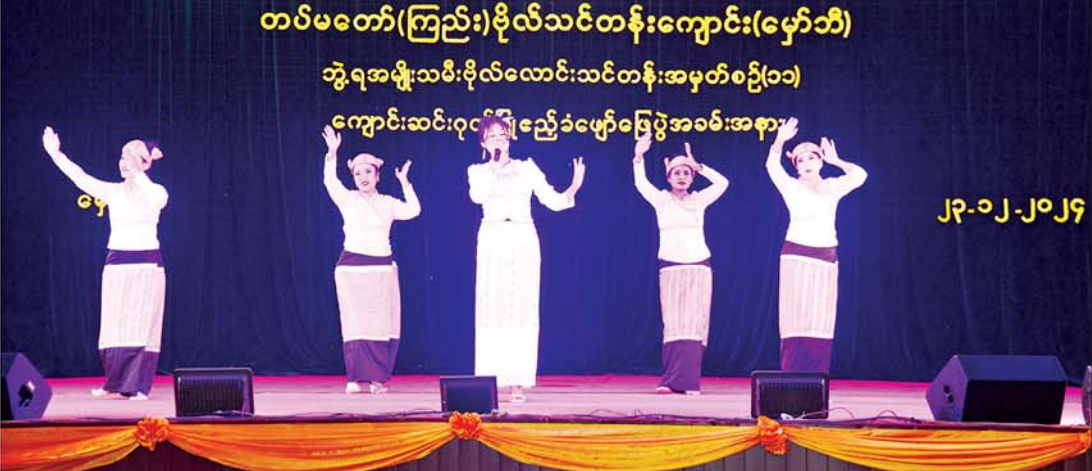
နိုင်ငံတော်စီမံအုပ်ချုပ်ရေးကောင်စီဥက္ကဋ္ဌ တပ်မတော်ကာကွယ်ရေးဦးစီးချုပ် ဗိုလ်ချုပ်မှူးကြီး မင်းအောင်လှိုင် ဇနီးဒေါ်ကြူကြူလှနှင့်အဖွဲ့ဝင်များ သင်တန်းဆင်းအမျိုးသမီးအရာရှိများနှင့်အတူ ပြည်သူ့ဆက်ဆံရေးနှင့် စိတ်ဓာတ်စစ်ဆင်ရေးညွှန်ကြားရေးမှူးရုံး ကွပ်ကဲမှုအောက် မြဝတီတေးဂီတအဖွဲ့၏တေးသီချင်းများဖြင့် ဂုဏ်ပြုဖျော်ဖြေတင်ဆက်မှုကို ကြည့်ရှုအားပေးစဉ်။