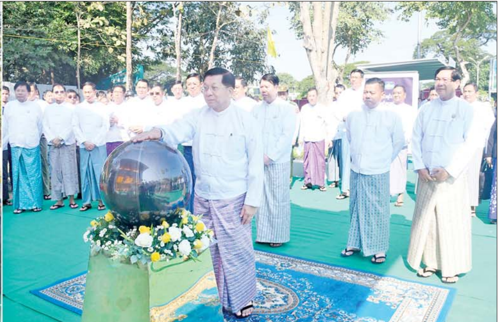
နိုင်ငံတော်စီမံအုပ်ချုပ်ရေးကောင်စီဥက္ကဋ္ဌ နိုင်ငံတော်ဝန်ကြီးချုပ် ဗိုလ်ချုပ်မှူးကြီးမင်းအောင်လှိုင် မြေအောက်လမ်းကူးလူသွားဥမင် အဆောက်အအုံဝင်ပေါက်အား စက်ခလုတ်နှိပ် ဖွင့်လှစ်ပေးစဉ်။

★ ရှေးဦးမှ ဦးစွာ နိုင်ငံတော်စီမံအုပ်ချုပ်ရေးကောင်စီဥက္ကဋ္ဌ နိုင်ငံတော်ဝန်ကြီးချုပ်သည် ဖွင့်ပွဲအခမ်းအနားပြုလုပ်မည့်နေရာသို့ ရောက်ရှိကြရာ တိုင်းဒေသကြီးဝန်ကြီးချုပ်နှင့် တာဝန်ရှိသူများက ကြိုဆိုနှုတ်ဆက်ကြသည်။ ထို့နောက် မြို့တော်ဝန်ဦးဗိုလ်ဌေးက မြေအောက်လမ်းကူးလူသွားဥမင်(Underpass) တည်ဆောက်ခဲ့သည့် ရည်ရွယ်ချက်များ၊ အကျိုးကျေးဇူးများ၊ မြန်မာနိုင်ငံသား အင်ဂျင်နီယာပညာရှင်များဖြင့် တည်ဆောက်ခဲ့မှုများနှင့်