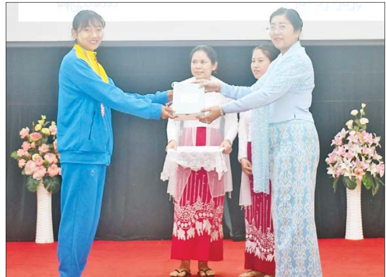
များ၊ အားကစားသမားမောင်/မယ်များ တက်ရောက်ကြပြီး ရန်ကုန်တိုင်းဒေသကြီး၊ ဧရာဝတီတိုင်းဒေသကြီးနှင့် ရှမ်းပြည်နယ် စာရင်းစစ်ချုပ်ရုံးမှ တာဝန်ရှိသူများက အွန်လိုင်းဖြင့် တက်ရောက်ခဲ့ကြကြောင်း သိရသည်။

ထို့နောက် အားကစားသမားအသင်း အုပ်ချုပ်သူက အားကစားပွဲတွင် ဝင်ရောက် ယှဉ်ပြိုင်ခဲ့သည့် အတွေ့အကြုံများကို ရှင်းလင်းတင်ပြသည်။ ယင်းနောက် ပြည်ထောင်စုစာရင်းစစ်ချုပ်က အားကစား နည်းပြသုံးဦးနှင့် တူးချွန်အားကစားသမား များအား ဂုဏ်ပြုချီးမြှင့်ငွေများ ပေးအပ် သည်။ ဂုဏ်ပြုအခမ်းအနားသို့ ဒုတိယစာရင်း စစ်ချုပ်၊ အမြဲတမ်းအတွင်းဝန်၊ ညွှန်ကြား ရေးမှူးချုပ်များနှင့် တာဝန်ရှိသူများ၊ ပြည်ထောင်စုစာရင်းစစ်ချုပ်ရုံး ကိုယ်စားပြု ဝင်ရောက်ယှဉ်ပြိုင်ခဲ့ကြသည့် အားကစား အုပ်ချုပ်သူ၊ နည်းပြ၊ လက်ထောက်နည်းပြ