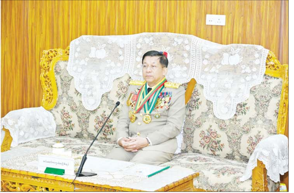
နိုင်ငံတော်စီမံအုပ်ချုပ်ရေးကောင်စီဥက္ကဋ္ဌ တပ်မတော်ကာကွယ်ရေးဦးစီးချုပ် ဗိုလ်ချုပ်မှူးကြီး သတိုးမဟာသရေစည်သူ သတိုးသီရိသုဓမ္မ မင်းအောင်လှိုင် ထူးချွန်ဆုရရှိခဲ့ကြသူများနှင့် ၎င်းတို့၏ မိဘဆွေမျိုးများအား တွေ့ဆုံ၍ ဂုဏ်ပြုအမှာစကားပြောကြားစဉ်။