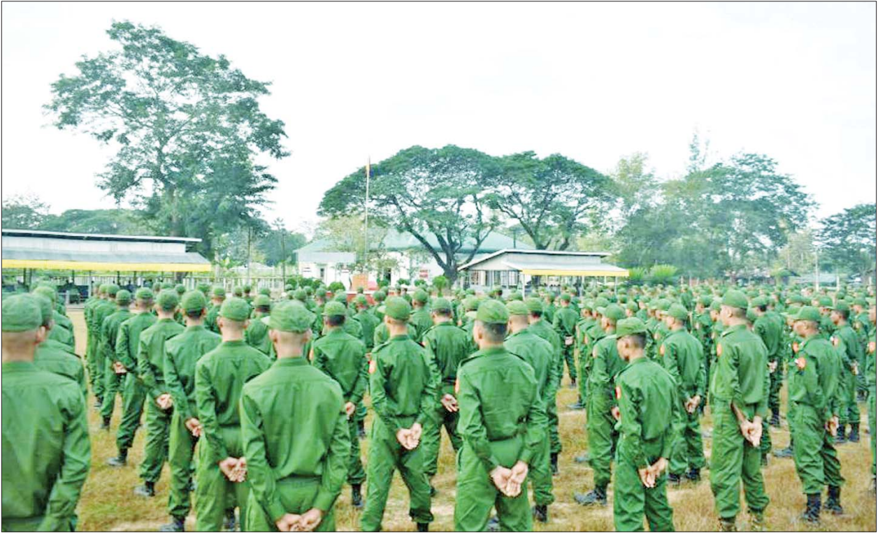
ပြည်သူ့စစ်မှုထမ်းသင်တန်းအမှတ်စဉ်(၈) သင်တန်းဖွင့်ပွဲကျင်းပစဉ်။

ပြည်ထောင်စုမပြိုကွဲရေး၊ တိုင်းရင်းသားစည်းလုံးညီညွတ်မှု မပြိုကွဲရေးနှင့် အချုပ်အခြာအာဏာတည်တံ့ခိုင်မြဲရေးဟူသည့် ဒီမိုကရေစီ အရေးသုံးပါးကို ထိန်းသိမ်းစောင့်ရှောက်ရန် နိုင်ငံသားတိုင်းတွင် တာဝန်ရှိကြသဖြင့် ယင်းတာဝန်များကို ထမ်းဆောင်နိုင်ရေးအတွက် စစ်ပညာသင်ကြားရန်နှင့် နိုင်ငံတော်၏ ကာကွယ်ရေးတာဝန်များကို ထမ်းဆောင်နိုင်ရန်ရည်ရွယ်၍ ပြည်သူ့စစ်မှုထမ်းဥပဒေကို ၂၀၂၄ ခုနှစ် ဖေဖော်ဝါရီ ၁၀ ရက်တွင် စတင်အာဏာတည်စေခဲ့ပြီး ပြည်သူ့စစ်မှုထမ်း သင်တန်းများကို ဖွင့်လှစ်သင်ကြားပေးခဲ့သည်။ ပြည်သူ့စစ်မှုထမ်း သင်တန်း အမှတ်စဉ်(၁)ကို ၂၀၂၄ ခုနှစ် ဧပြီ ၈ ရက်မှစတင်၍ ဖွင့်လှစ် သင်ကြားပေးခဲ့ပြီး သင်တန်းဆင်းခဲ့သည့် ပြည်သူ့စစ်မှုထမ်း နိုင်ငံသား