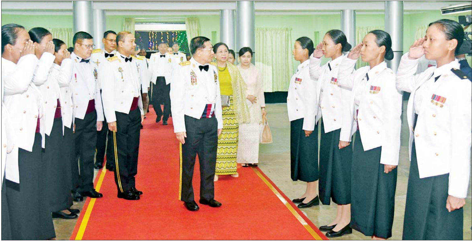
နိုင်ငံတော်စီမံအုပ်ချုပ်ရေးကောင်စီဥက္ကဋ္ဌ တပ်မတော်ကာကွယ်ရေးဦးစီးချုပ် ဗိုလ်ချုပ်မှူးကြီး မင်းအောင်လှိုင် သင်တန်းဆင်းအမျိုးသမီးအရာရှိများအား ရင်းရင်းနှီးနှီးနှုတ်ဆက်စဉ်။

အဆိုပါ သင်တန်းဆင်း ဂုဏ်ပြုညစာစားပွဲအခမ်းအနားသို့ နိုင်ငံတော်စီမံအုပ်ချုပ်ရေးကောင်စီဥက္ကဋ္ဌ တပ်မတော်ကာကွယ်ရေးဦးစီးချုပ်နှင့်အတူ ဇနီးဒေါ်ကြူကြူလှ၊ ကာကွယ်ရေးဦးစီးချုပ်(ရေး) ဗိုလ်ချုပ်ကြီး ထိန်ဝင်းနှင့် ဇနီး၊ ကာကွယ်ရေးဦးစီးချုပ်(လေ)ဗိုလ်ချုပ်ကြီး ထွန်းအောင်နှင့် ဇနီး၊ ကာကွယ်ရေးဦးစီးချုပ်ရုံးမှ အဆင့်မြင့်တပ်မတော်အရာရှိကြီးများနှင့် ဇနီးများ၊ ပြည်ထောင်စုဝန်ကြီးများနှင့် ဇနီးများ၊ ရန်ကုန်တိုင်းဒေသကြီးဝန်ကြီးချုပ်နှင့် ဇနီး၊ ရန်ကုန်တိုင်းစစ်ဌာနချုပ်တိုင်းမှူး၊ တပ်မတော်(ကြည်း) ဗိုလ်သင်တန်းကျောင်း(မှော်ဘီ)ကျောင်းအုပ်ကြီးနှင့် မှော်ဘီတပ်နယ်မှတာဝန်ရှိသူများ၊ ကျောင်းဆင်းဗိုလ်လောင်းများ၏ မိဘဆွေမျိုးများနှင့် ဖိတ်ကြားထားသည့် ဧည့်သည်တော်များ တက်ရောက်ကြသည်။