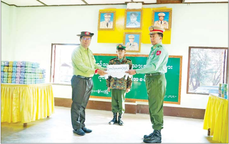
ပြည်သူ့စစ်မှုထမ်းသင်တန်းအမှတ်စဉ်(၈) သင်တန်းဖွင့်ပွဲသို့ ဂုဏ်ပြုချီးမြှင့်ငွေများ ပေးအပ်စဉ်။