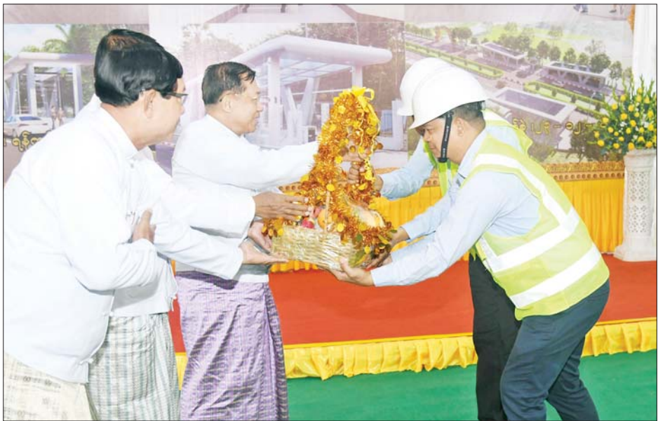
နိုင်ငံတော်စီမံအုပ်ချုပ်ရေးကောင်စီဥက္ကဋ္ဌ နိုင်ငံတော်ဝန်ကြီးချုပ် ဗိုလ်ချုပ်မှူးကြီးမင်းအောင်လှိုင် မြေအောက်လမ်းကူး လူသွားဥမင် တည်ဆောက်ရေးလုပ်ငန်းတွင်ပါဝင်ခဲ့သည့် အင်ဂျင်နီယာများအား အမှတ်တရ ဂုဏ်ပြုလက်ဆောင်ပေးအပ်စဉ်။

လူသွားဥမင်(Underpass) ဖွင့်ပွဲအထိမ်းအမှတ် အမှတ်တရ လက်ဆောင်အား ဂါရဝပြုပေးအပ်သည်။ ထို့နောက် နိုင်ငံတော်စီမံအုပ်ချုပ်ရေးကောင်စီ ဥက္ကဋ္ဌ နိုင်ငံတော်ဝန်ကြီးချုပ်က (Underpass) တည်ဆောက်ရေးလုပ်ငန်းတွင် ပါဝင်ခဲ့သည့် အင်ဂျင်နီယာများအား အမှတ်တရဂုဏ်ပြုလက်ဆောင်ပေးအပ်သည်။ ယင်းနောက် ရန်ကုန်တိုင်းဒေသကြီးဝန်ကြီးချုပ်၊ တိုင်းမှူးနှင့် မြို့တော်ဝန်တို့က မြေအောက်လမ်းကူး လူသွားဥမင်(Under-