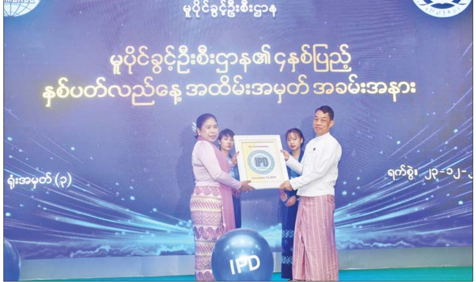
ဆောင်ရွက်ရာတွင် ဥပဒေ၊ နည်းဥပဒေ၊ လုပ်ထုံး လုပ်နည်းများနှင့်အညီ ဆောင်ရွက်ကြရန်လိုအပ်ပါကြောင်း၊ စစ်ဆေးရေးအရာရှိ ဝန်ထမ်းများအတွက် လိုအပ်သော လူ့စွမ်းအားအရင်းအမြစ် ပြုစုပေးထောက်ခြင်းများကို စဉ်ဆက်မပြတ်ဆောင်ရွက်ရန် လိုအပ်မည်ဖြစ်ပြီး ဦးစီးဌာနမှ ဝန်ထမ်းများအနေဖြင့်လည်း

စွမ်းရည်ပြည့်ဝသော ဝန်ထမ်းကောင်းများဖြစ်စေရေး အထူးကြိုးပမ်းဆောင်ရွက်ကြရန် တိုက်တွန်းလိုပါ ကြောင်း၊ ဦးစီးဌာနအနေဖြင့် မူပိုင်ခွင့်ဆိုင်ရာ အသိပညာပေးခြင်းလုပ်ငန်းများကို ပြည်တွင်းတွင်သာမက ပြည်ပနိုင်ငံများအထိ ကျယ်ကျယ်ပြန့်ပြန့်သိရှိစေရန် သက်ဆိုင်ရာဌာနများ၊ အသင်းအဖွဲ့များနှင့် ပူးပေါင်း