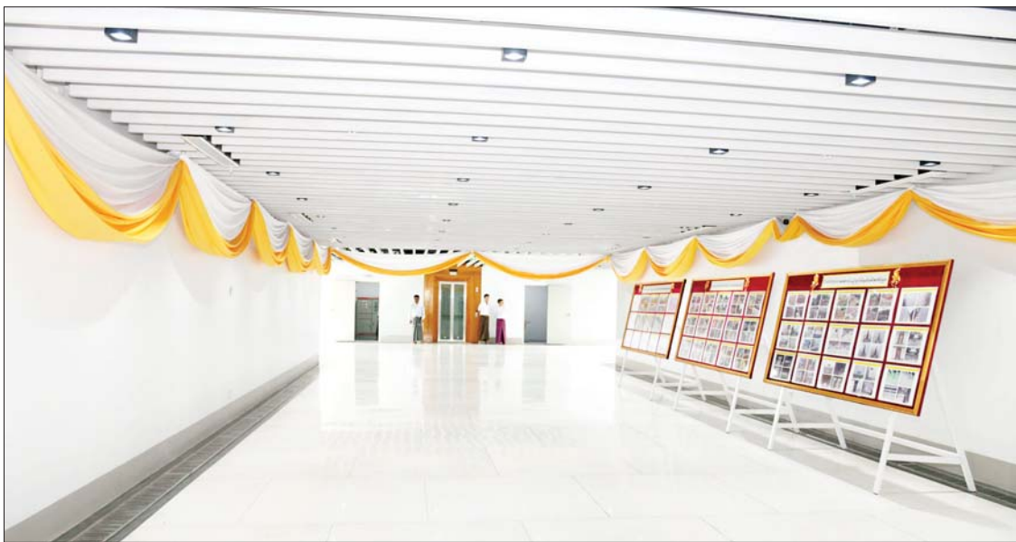
မြေအောက်လမ်းကူး လူသွားဥမင်ကို တွေ့ရစဉ်။

အဆိုပါ မြေအောက်လမ်းကူး လူသွားဥမင်နေရာသည် ရွှေတိဂုံစေတီတော်သို့ ဝင်ရောက်ဖူးမြော်မှုများပြားသည့် နေရာတစ်ခုဖြစ်သဖြင့် ဘုရားဖူးလာပြည်သူများ စိတ်ချမ်းသာစွာဖြင့် ရွှေတိဂုံစေတီတော်နှင့် ပြည်သူ့ရင်ပြင်သို့ သွားရောက်ရာတွင် ယာဉ်အန္တရာယ်ကင်းရှင်းပြီး သက်သောင့်သက်သာ ဖြတ်သန်းသွားလာနိုင်စေရန်နှင့် ခေတ်မီအခြေခံအဆောက်အအုံတစ်ခု ထပ်မံပေါ်ပေါက်လာစေရန် ရည်ရွယ်၍ နိုင်ငံတော်စီမံအုပ်ချုပ်ရေးကောင်စီဥက္ကဋ္ဌ နိုင်ငံတော်ဝန်ကြီးချုပ်၏ လမ်းညွှန်မှုဖြင့် ၂၀၂၃ ခုနှစ် အောက်တိုဘာလတွင် စတင်တည်ဆောက်ခဲ့ခြင်းဖြစ်ကြောင်း၊ မြေအောက်လမ်းကူး လူသွားဥမင်(Underpass) အမျိုးအစား ဖြစ်ပြီး ပင်မဥမင်အမြင့် ၁၁ ပေ၊ အကျယ် ၂၃ ပေ၊ ဥမင်အလျားစုစုပေါင်း ၄၆၁ ပေ ရှိပြီး ဝင်ပေါက်၊ ထွက်ပေါက် လေးခုပါဝင်