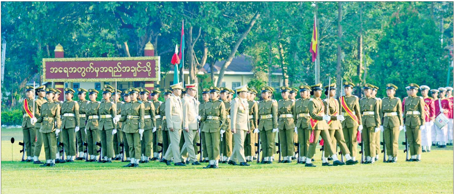
နိုင်ငံတော်စီမံအုပ်ချုပ်ရေးကောင်စီဥက္ကဋ္ဌ တပ်မတော်ကာကွယ်ရေးဦးစီးချုပ် ဗိုလ်ချုပ်မှူးကြီး သတိုးမဟာသရေစည်သူ သတိုးသီရိသုဓမ္မ မင်းအောင်လှိုင် ကျောင်းဆင်းဗိုလ်လောင်းတပ်ခွဲအား စစ်ဆေးစဉ်။

( ၃-၉-၂၀၂၄ ရက်နေ့တွင် နိုင်ငံတော်စီမံအုပ်ချုပ်ရေးကောင်စီဥက္ကဋ္ဌ နိုင်ငံတော် ဝန်ကြီးချုပ် ဗိုလ်ချုပ်မှူးကြီး မင်းအောင်လှိုင် ရှမ်းပြည်နယ် အစိုးရအဖွဲ့ဝင်များ၊ ပြည်နယ်နှင့် ခရိုင်အဆင့် ဌာနဆိုင်ရာတာဝန်ရှိသူများအား ပြောကြားသည့် အမှာ စကားမှ ကောက်နုတ်ချက် )