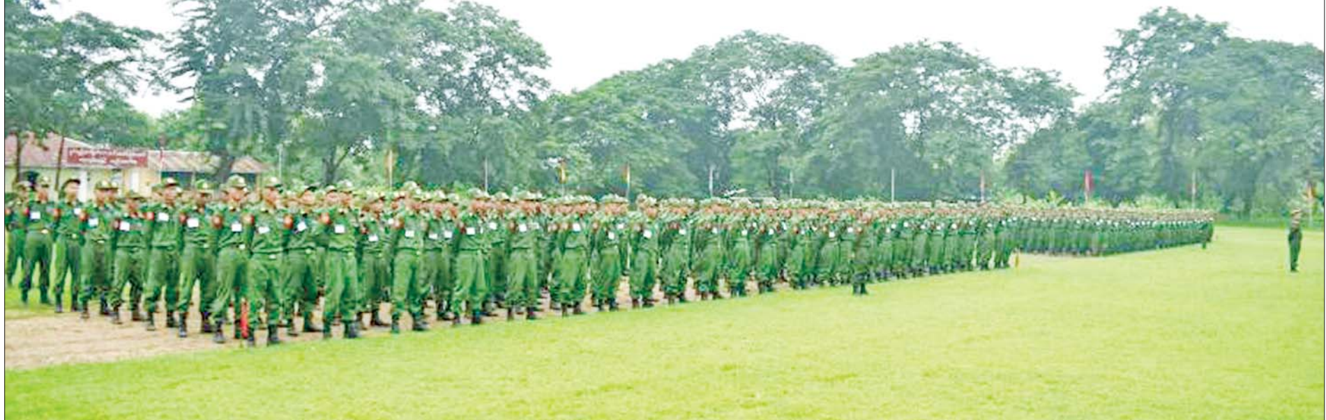
ပြည်သူ့စစ်မှုထမ်းသင်တန်းအမှတ်စဉ်(၈) သင်တန်းဖွင့်ပွဲကျင်းပစဉ်။