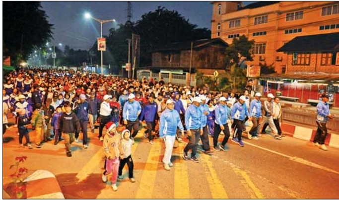
ရပ်ကွက် ပြည်သူ့အားကစားကွင်း အထူးတန်း ပွဲကြည့်စဉ်ရှေ့စုရပ်မှ ရုံးကြီးလမ်း၊ ထိုမှတစ်ဆင့် သခင်နက်ဖေလမ်းအတိုင်း လမ်းလျှောက်ခဲ့ကြပြီး စီတာပုရပ်ကွက် မနောကွင်းရင်ပြင်၌ ကိုယ်ကာယ လေ့ကျင့်ခန်း အတွဲအမှတ် (၁) နှင့် (၂) လေ့ကျင့်ခန်း Fitness Dance တို့ကို အတူတကွလေ့ကျင့်ခဲ့ကြ သည်။ ထိုမှတစ်ဆင့် ပြည်နယ်ဝန်ကြီးချုပ်နှင့် အဖွဲ့ဝင်

မြစ်ကြီးနား ဒီဇင်ဘာ ၂၈ ကချင်ပြည်နယ် မြစ်ကြီးနားမြို့၌ ဒီဇင်ဘာအားကစား လ စတုတ္ထအပတ် လူထုစုပေါင်းလမ်းလျှောက်ပွဲ အခမ်းအနားကို ဒီဇင်ဘာ ၂၈ ရက် နံနက် ၆ နာရီက ပြည်သူ့အားကစားကွင်းရှေ့စုရပ်မှ မြို့တွင်းလမ်း များအတိုင်း မနောကွင်းအထိ စုပေါင်းလမ်းလျှောက် ခဲ့ပြီး မနောကွင်းအတွင်း လေ့ကျင့်ခန်းကို စုပေါင်း ဆောင်ရွက်ခဲ့ကြသည်။ (ယာဝု)