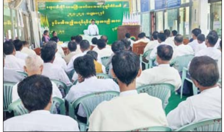
ခရိုင် (ပြန်/ဆက်)

ပတ်တိုက် အမှာစကားများ ပြောကြားပြီးနောက် တိုင်းဒေသ ကြီး သမဝါယမအသင်းစုချုပ် အမှုဆောင်အဖွဲ့၏ လုပ်ငန်း အစီရင်ခံစာ၊ ၂၀၂၃-၂၀၂၄ ဘဏ္ဍာ နှစ်၊ နှစ်ချုပ်ဘဏ္ဍာရေးရှင်းတမ်း များ၊ အသင်းစာရင်းစစ်၏ အစီ ရင်ခံစာများကို ဖတ်ကြားသည်။