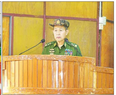
နိုင်ငံတော်စီမံအုပ်ချုပ်ရေးကောင်စီဒုတိယဥက္ကဋ္ဌ ဒုတိယတပ်မတော်ကာကွယ်ရေးဦးစီးချုပ် ကာကွယ်ရေးဦးစီးချုပ်(ကြည်း) ဒုတိယဗိုလ်ချုပ်မှူးကြီး စိုးဝင်း အင်းတိုင်တပ်နယ်ရှိ နယ်မြေခံသင်တန်းကျောင်းများမှ ပြည်သူ့စစ်မှုထမ်းသင်တန်းသားများအား တွေ့ဆုံအမှာစကားပြောကြားစဉ်။