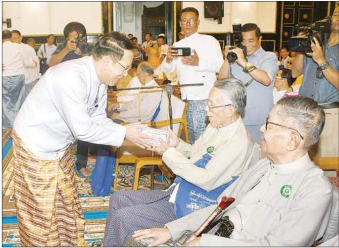
ပြည်ထောင်စုဝန်ကြီး ဦးမောင်မောင်အုန်း ကန်တော့ခံသင်ကြားစာပေပညာရှင်များအား ကန်တော့ပစ္စည်းနှင့် ကန်တော့ငွေများ ပေးအပ်စဉ်။

သက်ကြီးစာပေပညာရှင်များအား ပူဇော်ကန်တော့ပွဲ အခမ်းအနားသို့ ပြန်ကြားရေးဝန်ကြီးဌာန ပြည်ထောင်စုဝန်ကြီး ဦးမောင်မောင်အုန်း၊ ရန်ကုန်တိုင်းဒေသကြီး လူမှုရေးရာဝန်ကြီး ဦးဌေးအောင်၊ မြန်မာနိုင်ငံ စာရေးဆရာအသင်းဥက္ကဋ္ဌနှင့် တာဝန်ရှိသူများ၊ ကန်တော့ခံသင်ကြားစာပေပညာရှင် ဆရာကြီး ဆရာမကြီးများ၊ မြို့နယ်စာရေးဆရာ