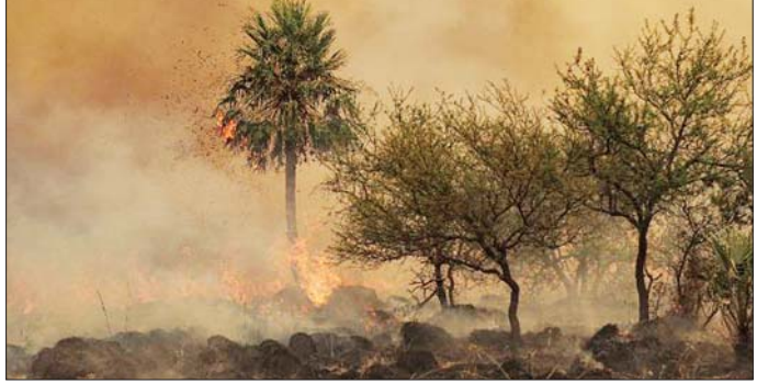
အာဂျင်တီးနားနိုင်ငံ အမျိုးသားဥယျာဉ်၌ တောမီးလောင်မှုကို တွေ့ရစဉ်။

ခါတွန် ဒီဇင်ဘာ ၂၈ ဆူဒန်နိုင်ငံ အနောက်ပိုင်း အယ်ဖာရာရွှေ့ပြောင်းစခန်းနှစ်ခုသို့ အရန် အမြန်ထောက်ပံ့ရေးတပ်ဖွဲ့ (အာအက်စ်အက်စ်) က တိုက်ခိုက်မှု နှစ်ခု ပြုလုပ်သဖြင့် အရပ်သား ၂၀ ထက်မနည်းသေဆုံးပြီး ၁၇ ဦး ဒဏ်ရာရ ရှိကြောင်း ဒေသတွင်းအာဏာပိုင်တစ်ဦးက ဒီဇင်ဘာ ၂၈ ရက်တွင် ပြောကြားသည်။ ဒီဇင်ဘာ ၂၇ ရက်ညပိုင်းက အာအက်စ်အက်စ်မောင်းသူခွဲလေယာဉ် တစ်စင်းက ချေဖိတ်နာစာသင်ကျောင်းသို့ ဗုံးလေးလုံးကြွချခဲ့ရာ အရပ်သား ၁၉ ဦး သေဆုံးပြီး ၁၆ ဦး ဒဏ်ရာရရှိကြောင်း မြောက်ဒါဖာ ပြည်နယ်ညွှန်ကြားရေးမှူးချုပ် အီဘာရာဟင် ခါတီယာက ပြောကြား သည်။ ဒီဇင်ဘာ ၂၈ ရက်နံနက်ပိုင်းက အယ်ဖာရာမြောက်ပိုင်း အာဘူ ရှော့ခဲနေရပ်စွန့်ခွာစခန်းပေါ်သို့ အမြောက်များဖြင့် ပစ်ခတ်သဖြင့် အရပ်သား တစ်ဦးသေဆုံးပြီး မိန်းကလေးတစ်ဦး ဒဏ်ရာရရှိကြောင်း ၎င်းက ပြောကြားသည်။ အဆိုပါ တိုက်ခိုက်မှုများနှင့် ပတ်သက်ပြီး အာအက်စ်အက်စ်က မည်သည့်မှတ်ချက်မျှ မပေးသေးပေ။ ဆူဒန် လက်နက်ကိုင်တပ်ဖွဲ့ (အက်စ်အေအက်စ်) နှင့် အာအက်စ်အက်စ်တို့အကြား မေ ၁၀ ရက်မှစကာ ဆူဒန်နိုင်ငံ မြောက်ဒါဖာပြည်နယ်၏ မြို့တော် အယ်ဖာရာ၌ ပြင်းထန်သည့် တိုက်ပွဲများ ဖြစ်ပွားခဲ့သည်။ ၂၀၂၃ ခုနှစ် မေလလယ်မှစကာ ယင်းအဖွဲ့ နှစ်အကြား ပြင်းထန်သည့် ပဋိပက္ခများ ကြောင့် လူပေါင်း ၂၉၆၈၃ ဦး ထက်မနည်းသေဆုံးပြီး ၁၄ သန်းကျော် ပြည်တွင်းပြည်ပသို့ ပြောင်းရွှေ့ခဲ့ကြောင်း နိုင်ငံတကာအဖွဲ့အစည်းများ ၏ နောက်ဆုံးခန့်မှန်းချက်များ အရ သိရသည်။ ဆင်ဟွာ