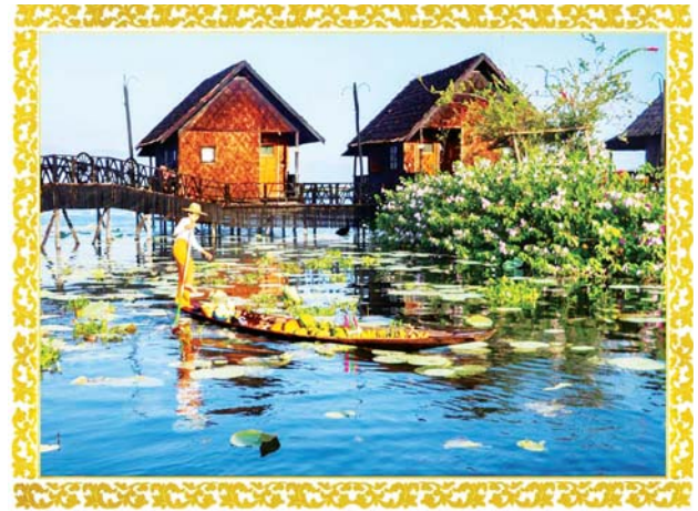
အင်းလေးရွာခင်း

(ဗိုလ်ချုပ်အောင်ဆန်း၏ ၁၉၄၇ ခုနှစ်၊ ဇန်နဝါရီလ ၁ ရက်နေ့တွင် ရေးဒီယိုမှ ထုတ်လွှင့်ခဲ့သည့်မိန့်ခွန်းမှ ကောက်နုတ်ချက်)