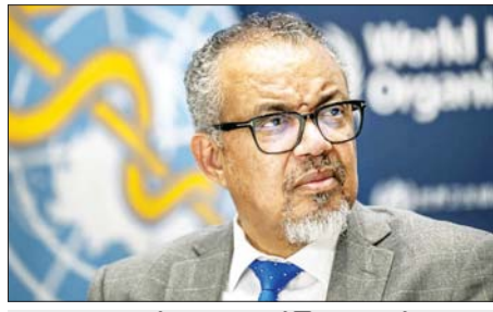
ကမ္ဘာ့ကျန်းမာရေးအဖွဲ့ ညွှန်ကြားရေးမှူးချုပ် တက်ဒရိုစ် အက်ဒါဟာနွန် ကိုဘရီယက်ဆူ။

အမွန် ဒီဇင်ဘာ ၂၈ ကမ္ဘာ့ကျန်းမာရေးအဖွဲ့ကြီး၏ ညွှန်ကြားရေးမှူးချုပ် တက်ဒရိုစ် အက်ဒါဟာနွန် ကို ဝက်ရှီယက်ဆူသည် ယီမင်နိုင်ငံ ဆာနားနိုင်ငံတကာ လေဆိပ်တွင် အစွဲရောဂါ၏ လေကြောင်းတိုက်ခိုက်မှုကြောင့် သောင်တင်နေခဲ့ပြီးနောက် ဒီဇင်ဘာ ၂၇ ရက်တွင် ဒဏ်ရာရရှိထားသည့် ကုလသမဂ္ဂမှ ဝန်ထမ်းတစ်ဦးနှင့်အတူ ယီမင်နိုင်ငံမှ ထွက်ခွာသွားပြီးဖြစ် ကြောင်း သိရသည်။ ယခုအခါ ကျော်ဒန်နိုင်ငံကို ရောက်ရှိနေပြီဖြစ်ပြီး ဒဏ်ရာရရှိသွားသည့် ဝန်ထမ်းကို နောက်ထပ်ဆေးကုသမှုများ ထပ်မံလုပ်ဆောင်ရဦးမည်ဟု တက်ဒရိုစ်က လူမှုကွန်ရက် မီဒီယာစာမျက်နှာပေါ်တွင် ရေးသားခဲ့သည်။ ဒီဇင်ဘာ ၂၆ ရက်က လေဆိပ်၌ လေကြောင်းတိုက်ခိုက်မှုဖြစ်ပွားခဲ့ ခြင်း ဖြစ်သည်။ တက်ဒရိုစ်နှင့် ကုလသမဂ္ဂအရာရှိများ ယီမင်နိုင်ငံ မှ ထွက်ခွာရန် ပြင်ဆင်နေစဉ် လေကြောင်းတိုက်ခိုက်မှု နှင့် ကြုံတွေ့ခဲ့ခြင်းဖြစ်သည်။ တက်ဒရိုစ်သည် ဟူသီသူပုန်များ ဖမ်းဆီးထားသည့် ကုလသမဂ္ဂမှ ဝန်ထမ်း ၁၃ ဦးကို ပြန်လွှတ်ပေးရေးအတွက် ဆွေးနွေးရန် ယီမင်နိုင်ငံ သို့ ရောက်ရှိနေချိန် အဆိုပါ လေကြောင်းတိုက်ခိုက်မှုကို ရွတ်ချခဲ့သည်။ အရပ်သားများအား တိုက်ခိုက်မှုကို ရပ်တန့်ရမည်ဟု ၎င်းက