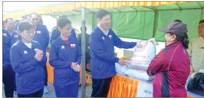
အစီအစဉ်များကို ပြုလုပ်ကြသည်။ ထို့နောက် ပြည်နယ်ဝန်ကြီးချုပ်နှင့် တာဝန် ရှိသူများသည် ရခိုင်ပြည်နယ်အစိုးရအဖွဲ့ ရုံးဝင်း အတွင်း၌ နယ်စပ်ရေးရာဝန်ကြီးဌာနနှင့် သူရိယ စန္ဒာဝင်းကုမ္ပဏီတို့က ရခိုင်ပြည်နယ်ရှိ ဝန်ထမ်း များအတွက် ဆန်၊ ဆီ၊ ပဲနှင့် ဆားများကို ပေးအပ်

စစ်တွေ ဒီဇင်ဘာ ၂၈ ရခိုင်ပြည်နယ်အစိုးရအဖွဲ့၏ ဦးဆောင်မှုဖြင့် ဒီဇင်ဘာလ လူထုအားကစားလှုပ်ရှားမှုကို ယနေ့ နံနက်ပိုင်းက စုပေါင်းဆောင်ရွက်ကြသည်။ စုပေါင်းလမ်းညွှန်ပွဲကို ပြည်နယ်ဝန်ကြီးချုပ် ဦးထိန်လင်းနှင့် အဖွဲ့ဝင်များက စတင်ဖွင့်လှစ် ပေးပြီးနောက် ပြည်နယ်၊ ခရိုင်၊ မြို့နယ်အဆင့် ဌာနဆိုင်ရာများ၊ ဆရာ ဆရာမများနှင့် ကျောင်းသား ကျောင်းသူများ၊ လူမှုရေးအဖွဲ့အစည်းများ၊ ဒေသခံ ပြည်သူများ စုစုပေါင်းအင်အား ၅၀၀ ကျော်တို့က ပြည်နယ်အစိုးရအဖွဲ့ရုံးရှေ့ စုရပ်မှစတင်ကာ မေယု လမ်းတစ်လျှောက် ထိုမှတစ်ဆင့် သတ္တဌာနလမ်းမှ စစ်တွေမြို့၊ ညောင်တီအားကစားကွင်းသို့ စုပေါင်း လမ်းညွှန်ပွဲကြိုပြီး အားကစားကွင်း ပွဲကြည့်စင် ရှေ့၌ စုပေါင်းကိုယ်လက်ကြံ့ခိုင်ရေးလေ့ကျင့်ခန်း