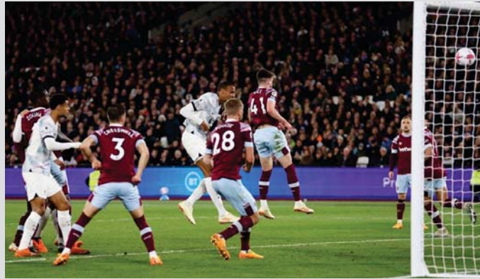
■ ယမန်နှစ်က တွေ့ဆုံခဲ့သည့် ဝက်စ်ဟမ်းနှင့် လီဗာပူးအသင်းပွဲစဉ်တွင် လီဗာပူးအသင်းကစားသမား တစ်ဦး ဝက်စ်ဟမ်းအသင်းဘက်သို့ ရိုးသွင်းယူရန် ကြိုးပမ်းစဉ်။