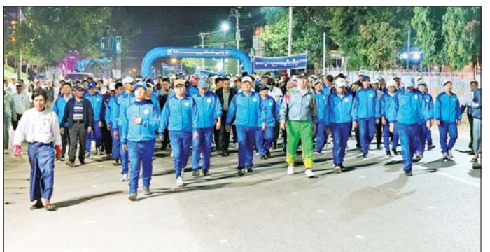
သိုင်ရာ ဝန်ထမ်းများ၊ တက္ကသိုလ်/ ဒီဂရီကောလိပ်များမှ ဆရာ ဆရာမများ၊ ကျောင်းသား ကျောင်းသူများနှင့် ပြည်သူများ အေးချမ်းပျော်ရွှင်စွာ ပါဝင်ဆင်နွှဲ ကြသည်။ (ယာဝု) ဦးစွာ တိုင်းဒေသကြီး ဝန်ကြီး ချုပ်က စုပေါင်းလမ်းလျှောက်ပွဲ ကို ပေးနတ်ပစ်ဖောက်၍ ဖွင့်လှစ် လေးပြီး ကန်သာမင်္ဂလာကန်တော် အတွင်း/အပြင် လျှောက်လမ်း ကို နှစ်ပတ်ပတ်၍ စုပေါင်း

တစ်ဝန်းတွင် ကျင်းပလျက်ရှိသည့် နည်းတူ မကွေးတိုင်းဒေသကြီး ဒီဇင်ဘာအားကစားလ (စတုတ္ထ အပတ်) လူထုစုပေါင်းလမ်းလျှောက် ပွဲကို ယနေ့နံနက် ၅ နာရီခွဲက မကွေးမြို့ ကန်သာမင်္ဂလာ ကန်တော်ရှေ့၌ ကျင်းပရာ စုပေါင်း လမ်းလျှောက်ပွဲသို့ မကွေးတိုင်း ဒေသကြီး ဝန်ကြီးချုပ် ဦးတင်လွင်၊ တိုင်းဒေသကြီး တရားသူကြီးချုပ်၊ တိုင်းဒေသကြီး ဝန်ကြီးများ၊ တိုင်း/ခရိုင်/မြို့နယ်အဆင့် ဌာန