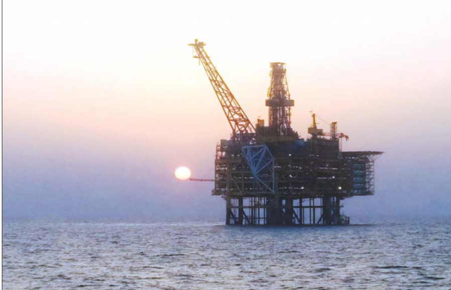
ရခိုင်ကမ်းလွန် Block A-1/A-3 တွင် သဘာဝဓာတ်ငွေ့ထုတ်လုပ်ရေးလုပ်ငန်းများဆောင်ရွက်သည့် Shwe Drilling & Production Platform ကို တွေ့ရပုံ။

“သွေးထိုးလှုံ့ဆော်မှုများသည် တပ်မတော်အပေါ်၌သာမက တစ်မျိုးသားလုံး၏ စည်းလုံးညီညွတ်မှုကိုပါ ထိခိုက်စေပြီး တိုင်းပြည်တည်ငြိမ်အေးချမ်းမှု ပျက်ပြားစေနိုင်သည်ကို သတိပြုရမည်ဖြစ်သည်။ သတင်းတု၊ သတင်းမှားများကြောင့် ယုံကြည်ချက်၊ ခံယူချက်များ ယိမ်းယိုင်မသွားစေရန်၊ စည်းလုံးညီညွတ်မှု ခိုင်မာအားကောင်းစေရန် အစဉ်အမြဲနိုးကြားနေရမည်ဖြစ်သည်။ ဆန့်ကျင်ဘက်အဖွဲ့အစည်းများနှင့် ပြည်ပျက်မီဒီယာများ၏ ဆိုးရွားသည့် လုပ်ရပ်များကို အသိ၊ သတိနှင့် ဆင်ခြင်ပြီး စစ်မှန်သည့် စည်းလုံးညီညွတ်မှုကို တည်ဆောက်သွားရန် လိုအပ်”