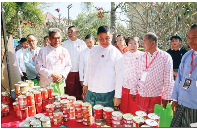
တိုးတက်ရေးအတွက် ပိုင်းဝန်းဆောင်ရွက်ရန် လိုအပ်သလို ဒေသထွက်ကုန်များကို နိုင်ငံတကာသို့ ပို့ဆောင်ဖြန့်ဖြူး ရောင်းချနိုင်ရေး၊ ဈေးကွက်ချိတ်ဆက်နိုင်ရေး ဆောင်ရွက်သွားကြရန် လိုအပ်ကြောင်း၊ မွန်တိုင်းရင်းသား လုပ်ငန်းရှင်များအနေဖြင့် မိမိတို့ပြည်နယ်အတွက် အသေးစား၊ အငယ်စား၊ အလတ်စား လုပ်ငန်းများ ပိုမိုဖြစ်ထွန်းအောင်မြင်ရန်နှင့် ဒေသထွက်ကုန်စည်များကို ပြည်နယ်တွင်သာမက နိုင်ငံတကာသို့ပါ ထိုးဖောက်နိုင်အောင် ဆောင်ရွက်ပေးကြရန် တိုက်တွန်း

ချုပ် ဦးအောင်ကြည်သိန်း၊ မွန်လုပ်ငန်းရှင်များအသင်း တာဝန်ရှိသူများက အခမ်းအနားကို ဖဲကြိုးဖြတ်ဖွင့်လှစ်သည်။ ထို့နောက် ပြည်နယ်ဝန်ကြီးချုပ်က မွန်ပြည်နယ်အတွင်းရှိ တိုင်းရင်းသားညီအစ်ကိုမောင်နှမများ၏ စီးပွားရေးလုပ်ငန်းများ ဖွံ့ဖြိုးတိုးတက်အောင် ဆောင်ရွက်ရာတွင် အထောက်အကူပြုနိုင်ရန် ရည်ရွယ်၍ စီးပွားရေးဆိုင်ရာ ဟောပြောပွဲနှင့် ကုန်စည်ပြပွဲများ ကျင်းပခြင်းဖြစ်ကြောင်း၊ ဒေသအသီးသီးတွင်ရှိနေသည့် မွန်လုပ်ငန်းရှင်များ စုစည်းမှုအားဖြင့် ဒေသအတွင်း စီးပွားဖွံ့ဖြိုး