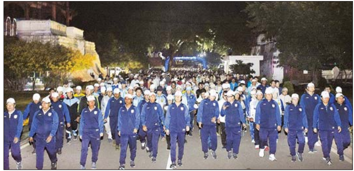
တာလွတ်နေရာ ပြည်သူလူထုစုပေါင်း ၂၅၀၀ ကျော်က ကျေးရွာပြင်ကြားဝက်ထောင်အထိ စုပေါင်းလမ်းလျှောက်ခြင်းကို စည်ကားသိုက်မြိုက် စွာ ပါဝင်ဆင်နွှဲခဲ့ကြပြီး စုပေါင်းကိုယ်လက်ကြံ့ခိုင်မှု ကာယလေ့ကျင့်ခန်းအတွဲ(၁/၂)၊ Myanmar Fitness Dance များဖြင့် တပျော်တပါးလှုပ်ရှား ဆောင်ရွက် ခဲ့ကြကြောင်း သတင်းရရှိသည်။ သတင်းစဉ်

ပျော်ရွှင်စွာဆင်နွှဲလျက်ရှိသည်။ မန္တလေးမြို့တွင် ၂၀၂၄ ခုနှစ် ဒီဇင်ဘာအားကစားလ လူထုစုပေါင်းလမ်းလျှောက်ပွဲကို ယနေ့နံနက် ၆ နာရီ က နန်းမြို့နှင့် ကျေးရွာပြင်ကြား ရတနာပုံဥယျာဉ်၌ ကျင်းပရာ စုပေါင်းလမ်းလျှောက်ပွဲနှင့်အတူ စုပေါင်း ကိုယ်လက်ကြံ့ခိုင်မှု ကာယလေ့ကျင့်ခန်း၊ Myanmar Fitness Dance များဖြင့် လှုပ်ရှားဆောင်ရွက်ကြပြီး မန္တလေးတိုင်းဒေသကြီး ဝန်ကြီးချုပ်ဦးမျိုးအောင်၊ တိုင်းဒေသကြီး ဝန်ကြီးများနှင့် တာဝန်ရှိသူများ တက်ရောက်အားပေးကြပြီး ဌာနဆိုင်ရာများ၊ ဆရာ ဆရာမများ၊ ကျောင်းသား ကျောင်းသူများက တပျော် တပါး အတူဆင်နွှဲခဲ့ကြသည်။ ဦးစွာ တိုင်းဒေသကြီးဝန်ကြီးချုပ်က လူထု စုပေါင်းလမ်းလျှောက်ပွဲကို ရတနာပုံဥယျာဉ်နှင့် ကျေးရွာပြင်ကြား၌ လမ်းကို ဦးထိပ်တံတားထိပ်အနီး ရှိ တာလွတ်နေရာမှ သေနတ်ပစ်ဖောက်၍ စတင်