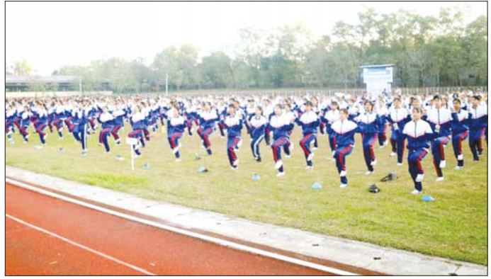
ပါဝင်ဆင်နွှဲခဲ့ကြသည်။ ဆက်လက်၍ စုပေါင်းလမ်းညွှန်ပွဲအပြီးတွင် ပညာရေးဒီဂရီကောလိပ်မှ ကျောင်းသား ကျောင်းသူ များက အုပ်စုများခွဲ၍ လွန်ဆွဲပြိုင်ပွဲကို ပျော်ရွှင်စွာ ပါဝင်ဆင်နွှဲကြရာ ဆုရရှိသည့်အသင်းအား ဆုများ ပေးအပ်ချီးမြှင့်ခဲ့သည်။ တိုင်းဒေသကြီး(ပြန်/ဆက်)

ဆင်နွှဲသူများက ရွှေဝယ်သီရိအားကစားကွင်းအတွင်း ဝိုင်းပတ်၍ တစ်ခိုင်းခွဲ စုပေါင်းလမ်းညွှန်ပွဲကြံက ကိုယ်လက်ကြံ့ခိုင်ရေးလေ့ကျင့်ခန်း အတွဲ(၁) ကို စုပေါင်း၍ ပြုလုပ်ခဲ့ပြီး ကိုယ်လက်ကြံ့ခိုင်ရေးအကကို တပျော်တပါး ဆင်နွှဲခဲ့ကြသည်။ ဒီဇင်ဘာအားကစားလ စုပေါင်းလမ်းညွှန်ပွဲတွင် တိုင်းဒေသကြီးဝန်ကြီးချုပ် ဦးမြတ်ကို၊ တိုင်းဒေသကြီးတရားလွှတ်တော် တရားသူကြီးချုပ် ဒေါ်ပိုက်ပိုက်အေး၊ တိုင်းဒေသကြီးဝန်ကြီးများ၊ ဌာနဆိုင်ရာတာဝန်ရှိသူများ၊ ပညာရေးဒီဂရီကောလိပ် မှ ကျောင်းသား ကျောင်းသူများ၊ အခြေခံပညာ ကျောင်းများမှ ဆရာ ဆရာမများနှင့် ကျောင်းသား ကျောင်းသူများ ဒေသခံပြည်သူများ စုစုပေါင်း ၁၆၄၀