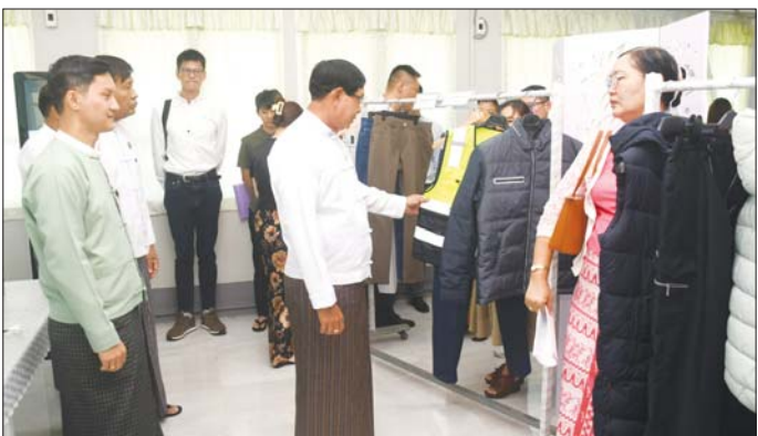
လုပ်ငန်း နှစ်ခုတို့ကို အတည်ပြုပေးခဲ့ပြီး အတည်ပြုပေးခဲ့သည့် လုပ်ငန်းများမှာ ဟိုတယ်ဝန်ဆောင်မှု လုပ်ငန်း၊ CMP စနစ်ဖြင့် အသုံးအဆောင် အမျိုးမျိုးချုပ်လုပ်ခြင်းလုပ်ငန်း၊ CMP စနစ်ဖြင့် အဝတ်အထည် အမျိုးမျိုးချုပ်လုပ်ခြင်းလုပ်ငန်းတို့ ဖြစ်သည်။

ရန်ကုန် ဒီဇင်ဘာ ၂၈ ရန်ကုန်တိုင်းဒေသကြီး ရင်းနှီးမြှုပ်နှံမှုကော်မတီ၏ (၁၂/၂၀၂၄) ကြိမ်မြောက် အစည်းအဝေးကို ဒီဇင်ဘာ ၂၇ ရက်က ရန်ကင်းမြို့နယ် တိုင်းဒေသကြီး ရင်းနှီးမြှုပ်နှံမှုကော်မတီရုံး၌ ကျင်းပသည်။ အစည်းအဝေးသို့ ရန်ကုန်တိုင်းဒေသကြီး ရင်းနှီးမြှုပ်နှံမှုကော်မတီ ဥက္ကဋ္ဌ၊ တိုင်းဒေသကြီး ဝန်ကြီးချုပ် ဦးစိုးသိန်းနှင့် တိုင်းဒေသကြီး ဝန်ကြီး များက ရင်းနှီးမြှုပ်နှံသူလုပ်ငန်းရှင်များ၏ ထုတ်လုပ်သည့် ပစ္စည်းကုန်ပစ္စည်းများကို ကြည့်ရှု စစ်ဆေးသည်။ (ယာပုံ) ထို့နောက် တိုင်းဒေသကြီး ဝန်ကြီးချုပ်က အမှာစကားပြောကြားသည်။ အစည်းအဝေးတွင် ရန်ကုန်တိုင်းဒေသကြီး ရင်းနှီးမြှုပ်နှံမှုကော်မတီသည် ဟိုတယ်နှင့် ခရီးသွားလုပ်ငန်းကဏ္ဍနှင့် စက်မှုကဏ္ဍ တို့တွင် ရာခိုင်နှုန်းပြည့် မြန်မာနိုင်ငံသား ရင်းနှီးမြှုပ်နှံမှုလုပ်ငန်း တစ်ခုနှင့် နိုင်ငံခြားရင်းနှီးမြှုပ်နှံမှု