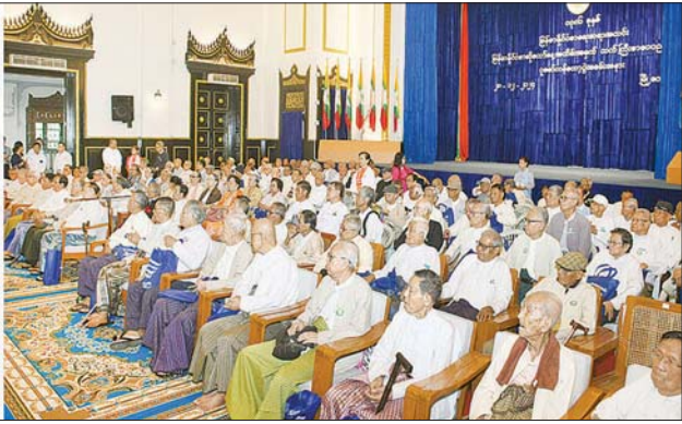
ပြည်ထောင်စုဝန်ကြီး ဦးမောင်မောင်အုန်းနှင့် အခမ်းအနားတက်ရောက်လာကြသူများ ကန်တော့ခံသင်ကြားစာပေပညာရှင်ကြီးများအား ကန်တော့ချီးမြှင့် လက်အုပ်ချိကန်တော့စဉ်။