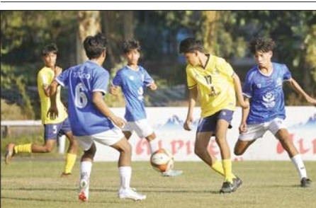
ရွှေပြည်သာအသင်းနှင့် Southern Yangon Star အသင်း ယှဉ်ပြိုင်နေစဉ်။