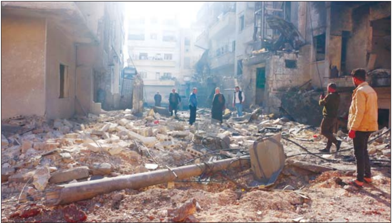
ဆီးရီးယားနိုင်ငံ အနောက်မြောက်ပိုင်း အီလစ်ဘ်မြို့လယ်တွင် ၂၀၂၄ ခုနှစ် ဒီဇင်ဘာ ၁ ရက်က လေကြောင်းတိုက်ခိုက်ခံရမှုကြောင့် ပျက်စီးသွားသည့် လူနေအိမ်ရာများ။

ကြေတစ်လှည့် ကြက်တစ်ခုနဲ့ သူတစ်ပြန် ကိုယ်တစ်ပြန် မပြီးနိုင်မီခိုင်းနိုင် မဆုံးနိုင်တဲ့ အဆိုးအကျော့ သံသရာထဲ ထပ်မံနှစ်ဆဲ မြုပ်ဆဲ အရှေ့အလယ်ပိုင်းဒေသက ဆီးရီးယားပြည်သူတို့ရဲ့ဘဝ။ လက်နက်ကိုင်အဖွဲ့အစည်းပေါင်းစုံနဲ့ နိုင်ငံကမတိုးတက်ပေမယ့် အထိုက်အလျောက်တော့ တည်ငြိမ်မှုရှိခဲ့တဲ့နိုင်ငံ၊ အိမ်နီးချင်း တူကီယံနဲ့ အစ္စရေး၊ အဝေးက အင်အားကြီးနိုင်ငံများရဲ့ စစ်ရေး၊ နိုင်ငံရေး ဖိအားတွေအောက်မှာ (Weak State) အားနည်းနိုင်ငံအခြေအနေကနေ (Fail State) ကျဆုံးနိုင်ငံအဖြစ်ကိုကျော်ပြီး ယခုတော့ (Collapse State) ပြိုလဲပျက်သုဉ်းတဲ့ဘဝ အလျင်အမြန်ရောက်သွားရပါပြီ။ အာဏာရှင်တိုက်ဖျက်ရေးခေါင်းစဉ် အောက်မှာ အာဆတ်ခေါင်းဆောင်တဲ့ ဆီးရီးယားခေတ်တစ်ခေတ်ကို HTS ဆိုတဲ့ အကြမ်းဖက်ညွှန်ပေါင်း လက်နက်ကိုင်အဖွဲ့တွေက အဆုံးသတ်ခဲ့တဲ့နေ့ပေမယ့် အတွင်းမှာ နိုင်ငံရေးချိန်မီလွန်းလှတဲ့ ဆီးရီးယားပြည်သူတွေဟာ အာဏာရှင်ပြုတ်ကျပြီးဆိုပြီး အပျော်ကြီးပျော်ခဲ့ကြတယ်။ ဒါပေမယ့် သူတို့ရဲ့ အပျော်တွေက ရေဖျက်ပမာ - ခဏတာဆိုသလို တာရှည်ခံပုံမလား။ သုံးပိုင်းကွဲထွက်တော့မယ့် ဆီးရီးယားချက်ချင်းဆိုသလို အစ္စရေးကပါးအစည်းပြေသလို ပြိုကွဲနေတဲ့ ဆီးရီးယားနေရာအနှံ့ အပြင်းအထန် ပုံကြဲပြီး ဆီးရီးယား - အစ္စရေးနယ်စပ်က ဆီးရီးယားပိုင် ဂိုလမ်းတောင်ကုန်းကို အပြီးသိမ်းပိုက်လိုက်တယ်။ ယခုအချိန်မှာ အစ္စရေးမြေပြင်တပ်တွေဟာ ဆီးရီးယားအတွင်းပိုင်းအထိ ဝင်ရောက်တိုက်ခိုက်သိမ်းပိုက်ပြီး ဆီးရီးယားမြေတွေကို ဖွဲ့သုနေပါပြီ။ ဆီးရီးယားသမ္မတ