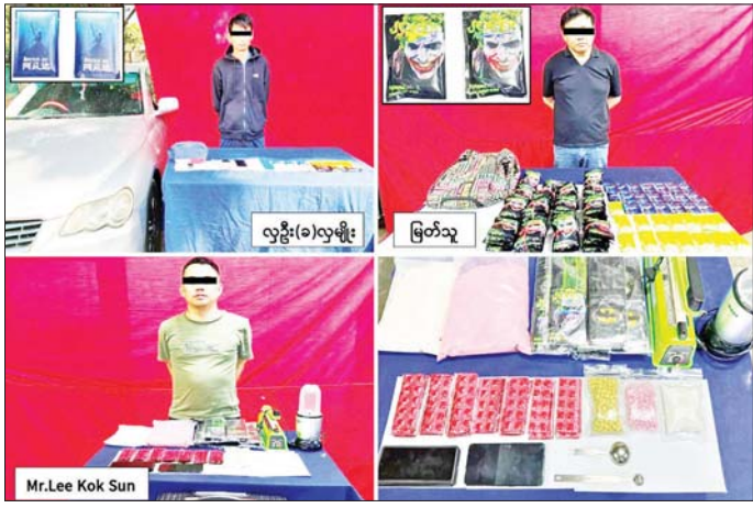
ဖမ်းဆီးရမိသူများကို သိမ်းဆည်းရမိသည့် စိတ်ပြောင်းဆေးဝါးများနှင့်အတူ တွေ့ရစဉ်။

နေပြည်တော် ဒီဇင်ဘာ ၂၈ ရန်ကုန်မြို့ပေါ်တွင် မူးယစ်ဆေးဝါးများဖြန့်ဖြူးရောင်းချသူ မြန်မာနိုင်ငံသား နှစ်ဦးနှင့် မလေးရှားနိုင်ငံသား တစ်ဦးတို့အား ငွေကျပ်သိန်း ၂၇၈၀ ကျော် တန်ဖိုးရှိ စိတ်ပြောင်းဆေးဝါးများနှင့်အတူ ဖော်ထုတ်ဖမ်းဆီးရမိခဲ့ကြောင်း မြန်မာနိုင်ငံရဲတပ်ဖွဲ့မှ သိရသည်။ မူးယစ်ဆေးဝါး တားဆီးနှိမ်နင်းရေးရဲတပ်ဖွဲ့မှ တပ်ဖွဲ့ဝင်များပါဝင်သော မူးပေါင်းအဖွဲ့သည် ဒီဇင်ဘာ ၂၂ ရက် ည ၁၀ နာရီတွင် ရန်ကုန်တိုင်းဒေသကြီး ဗိုလ်တထောင်မြို့နယ် (၈) ရပ်ကွက် ဗိုလ်အောင်ကျော်လမ်းမပေါ်တွင် စိတ်ပြောင်းဆေးဝါးများ စာမျက်နှာ ၁၉ ကော်လံ ၃