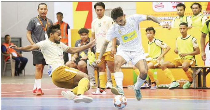
Yangon အသင်းက လက်ဝဲသူနွရ အသင်းကို သုံးဂိုး-နှစ်ဂိုးဖြင့် အနိုင် ရရှိပြီး Gold Dream အသင်းနှင့် YCDC Marga Youth အသင်းတို့ နှစ်ဂိုးစီ သရေကျခဲ့သည်။ လိင်-၂ ပြိုင်ပွဲတွင် အသင်း စုစုပေါင်း ၁၂ သင်း ဝင်ရောက် ယှဉ်ပြိုင်နေပြီး အပတ်စဉ် စနေနေ့နှင့် ဗုဒ္ဓဟူးနေ့တို့တွင် ပြုလုပ် သွားမည်ဖြစ်သည်။ ရဲရင့်လွင် ဓာတ်ပုံ- MFF

ရန်ကုန် ဒီဇင်ဘာ ၂၈ ၂၀၂၄-၂၀၂၅ ရာသီ MFF ဖူဆယ် လိင် - ၂ ပြိုင်ပွဲ ပွဲစဉ် (၁) ကို ဒီဇင်ဘာ ၂၈ ရက်က ရန်ကုန်မြို့ သုဝဏ္ဏဘေသာလမ်းကွင်းရှိ MFF ဖူဆယ်အားကစားရုံ၌ စတင် ကျင်းပရာ အသင်းအများစု အနိုင် ရခဲ့သည်။ ပွဲစဉ် (၁) တွင် TG United အသင်းက Black Cross အသင်း ကို ငါးဂိုး - နှစ်ဂိုး၊ 7 Brother အသင်းက Maryar အသင်းကို ခြောက်ဂိုး-နှစ်ဂိုး၊ KKY အသင်းက 7 Dragon အသင်းကို လေးဂိုး- တစ်ဂိုး၊ Pacific Sun Far အသင်း က ရှေ့ပြည်သာယူနိုက်တက် အသင်းကို ၁၀ ဂိုး - နှစ်ဂိုး၊ JZ