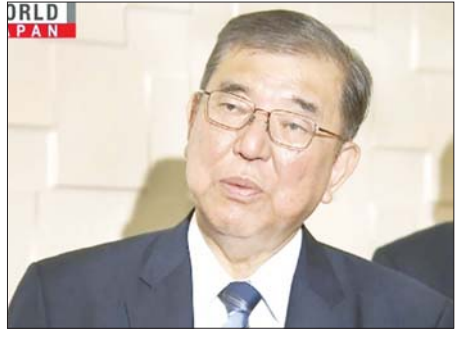
ဂျပန် ဝန်ကြီးချုပ် အိရှိတာ ရှိဂရူ။

လျှော့ချသွားရန်တောင်းဆို ၇၃ ရာခိုင်နှုန်း ပူးပေါင်းလုပ်ဆောင်မှု၏ အရေးပါ မှုကို အလေးပေးပြောကြားသည်။ ထို့အပြင် အစီအမံများကို စဉ်ဆက်မပြတ် ပြန်လည်သုံးသပ် ပြီး အကောင်အထည်ဖော် ဆောင်ရွက်ပေးရန် အစိုးရအဖွဲ့ ဝန်ကြီးများကိုလည်း ညွှန်ကြား ထားသည်။ အင်နိုအိတ်ချ်ကေ