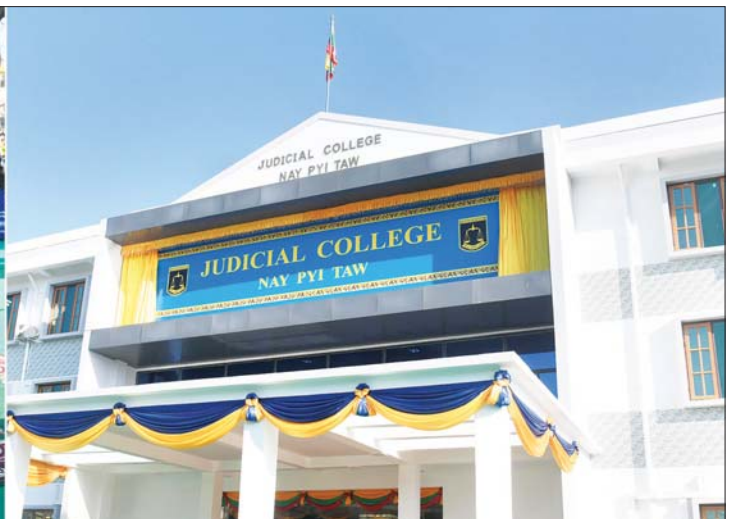
နိုင်ငံတော်စီမံအုပ်ချုပ်ရေးကောင်စီဥက္ကဋ္ဌ နိုင်ငံတော်ဝန်ကြီးချုပ် ဗိုလ်ချုပ်မှူးကြီး မင်းအောင်လှိုင် ကိုယ်စား နိုင်ငံတော်စီမံအုပ်ချုပ်ရေးကောင်စီ အတွင်းရေးမှူး ဗိုလ်ချုပ်ကြီး အောင်လင်းဌေး Judicial College အဆောက်အဦးသစ်ဆိုင်းဘုတ်ကို စက်ခလုတ်နှိပ်ဖွင့်လှစ်ပေးစဉ်။