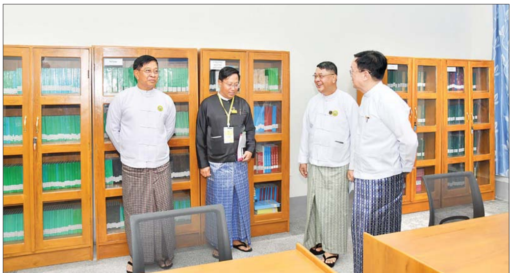
နိုင်ငံတော်စီမံအုပ်ချုပ်ရေးကောင်စီ အတွင်းရေးမှူး ဗိုလ်ချုပ်ကြီး အောင်လင်းဒွေးနှင့်အဖွဲ့ဝင်များ Judicial College အဆောက်အအုံအသစ်အတွင်း လှည့်လည်ကြည့်ရှုစဉ်။

ဆက်လက်၍ အခမ်းအနားဒုတိယပိုင်းကို ကျင်းပပြုလုပ်ရာ နိုင်ငံတော်စီမံအုပ်ချုပ်ရေးကောင်စီအတွင်းရေးမှူးနှင့် အခမ်းအနားတက်ရောက်လာကြသူများသည် Judicial College နှင့်စပ်လျဉ်းသည့်