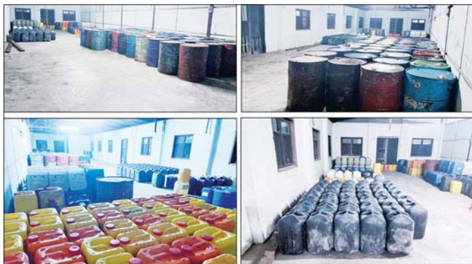
ဖမ်းဆီးရမိစက်သုံးဆီများအား ထိန်းသိမ်းထားရှိမှု မှတ်တမ်းဓာတ်ပုံများ။

စစ်ကိုင်းတိုင်းဒေသကြီး၊ မန္တလေးတိုင်းဒေသကြီးရှိ အချို့နေရာဒေသများတွင် လုံခြုံရေးဆိုင်ရာကန့်သတ်ချက်ရှိမှုအပေါ် အခွင့်ကောင်းယူ၍ ရောင်းကွင်းလမ်းများ အသုံးပြုကာ နည်းလမ်းမျိုးစုံဖြင့် သယ်ဆောင်ပြီး စစ်ကိုင်းတိုင်းဒေသကြီးအတွင်းရှိ အချို့သောကျေးရွာများတွင် ဆီသိုလှောင်ထားရှိရာ နေရာများပြုလုပ်၍ စစ်ကိုင်းတိုင်းဒေသကြီး၊ ကချင်ပြည်နယ်နှင့် ရှမ်းပြည်နယ် (မြောက်ပိုင်း)ဒေသများသို့ ပို့ဆောင်ကာ ဈေးနှုန်းအဆမတန် မြင့်တင်ရောင်းချလျက် ရှိကြောင်း တာဝန်ခံသိပြည်သူများ၏ သတင်းပေးပို့မှုအရ သိရှိရသည်။