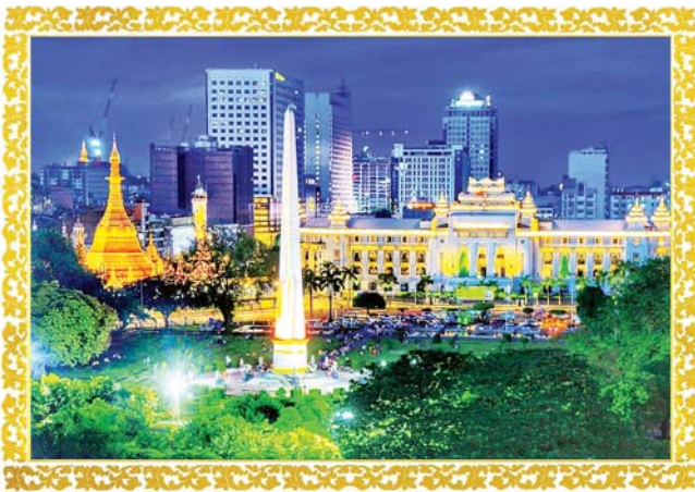
ရန်ကုန်မြို့၊ နီညအလှ