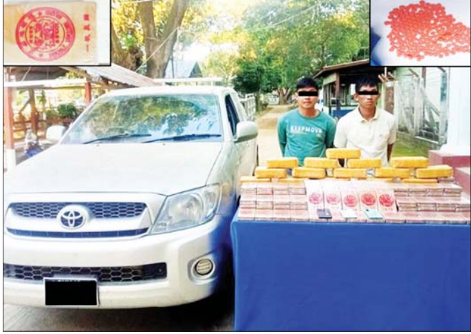
ဖမ်းဆီးရမိသူများအား သိမ်းဆည်းရမိသည့် မူးယစ်ဆေးဝါးများနှင့်အတူ တွေ့ရစဉ်။