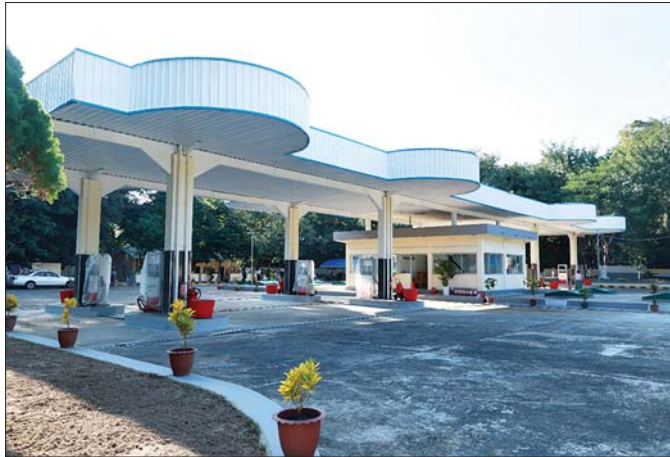
၂၀၂၅ ခုနှစ် ဇန်နဝါရီလ ၄ ရက်နေ့တွင် ဖွင့်လှစ်ရောင်းချမည့် ပြည်ထောင်စုနယ်မြေ နေပြည်တော် မြေဦးရိပ်မြို့နယ်ရှိ စက်သုံးဆီအရောင်းဆိုင်အမှတ် (၀၃၅၄)

ယင်းသို့ဆောင်ရွက်ရာတွင် အရည်အသွေးမြင့် စက်သုံးဆီ (ဒီဇယ်၊ ဓာတ်ဆီ) များ စီးပွားဖြစ်ထုတ်လုပ်ဖြန့်ဖြူးရောင်းချပေးနိုင်ရေးအတွက် ရေနံချက်စက်ရုံအသစ်များ တည်ဆောက်ခြင်း၊ စက်ရုံအဟောင်းများ Upgrade ပြုလုပ်၍ စက်စွမ်းအားပြည့် လည်ပတ်ခြင်းများ ပါဝင်လာရာ သန့်လျင်ရေနံချက်စက်ရုံအား စက်ရုံအသစ်တည်ဆောက်ရေးလုပ်ငန်းများ စတင်ဆောင်ရွက်နေခြင်း၊ ပြည်တွင်းရေနံစီမံခန့်ခွဲမှုကို တိုးမြှင့်ထုတ်လုပ်ရန်လျာထားချက်များ ချမှတ်ပြီး တိုးမြှင့်ရရှိလာသော ရေနံစီမံခန့်ခွဲမှုဓာတ်ငွေစက်ရုံစု(သံပရာကန်)နှင့် ချောက်ရေနံချက်စက်ရုံတို့တွင် ချက်လုပ်ခြင်းနှင့် ရေနံဓာတ်ငွေစက်ရုံစု(သံပရာကန်) ရေနံချက်စက်ရုံအနီး Euro V အဆင့်ရှိဓာတ်ဆီ၊ ဒီဇယ်များ ထုတ်လုပ်နိုင်မည့် ရေနံချက်စက်ရုံအသစ် တည်ဆောက်ခြင်း စသည့် ပြည်တွင်း ပြည်ပစွမ်းအင်ကုမ္ပဏီများနှင့် အကျိုးတူပူးပေါင်းလုပ်ကိုင်ခြင်းဖြင့် Energy Strategy အလှည့်အပြောင်းတစ်ခုကို အကောင်အထည်ဖော် ဆောင်ရွက်လျက်ရှိပါသည်။