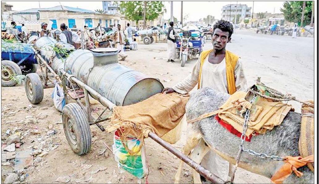
ရေစဉ်လှည်းများဖြင့် ရေသယ်ယူနေသည့်ကို တွေ့ရစဉ်။