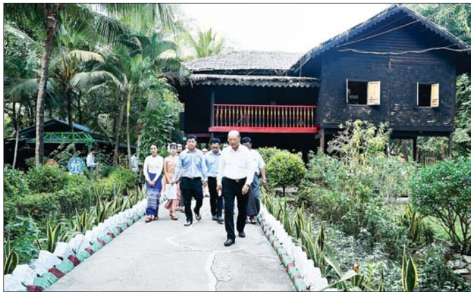
ကြည့်ရှုစစ်ဆေးမှုကြားသည်။

ရန်ကုန် ဇန်နဝါရီ ၂ တိုင်းရင်းသားလူမျိုးများရေးရာ ဝန်ကြီးဌာန ပြည်ထောင်စုဝန်ကြီး Jeng Phang နော်တောင်သည် ဒုတိယဝန်ကြီး ဦးစောအေးမောင် တာဝန်ရှိသူများနှင့်အတူ ယမန်နေ့မုန့်လှပိုင်က ပြည်ထောင်စုတိုင်းရင်းသားကျေးရွာ(ရန်ကုန်)သို့ သွားရောက်ပြီး ရုံးလုပ်ငန်းဆောင်ရွက်နေမှု ၂၀၂၄-၂၀၂၅ ဘဏ္ဍာရေးနှစ် စီမံကိန်းပါ ပြုပြင်ထိန်းသိမ်းရေးလုပ်ငန်းများ အကောင်အထည်ဖော်ဆောင်ရွက်ပြီးစီးမှုနှင့် ၂၀၂၅-၂၀၂၆ ဘဏ္ဍာရေးနှစ်တွင် ပြည်ထောင်စုဘဏ္ဍာရန်ပုံငွေနှင့် တိုင်းဒေသကြီးဘဏ္ဍာရန်ပုံငွေတို့ဖြင့် ဆောင်ရွက်မည့်လုပ်ငန်းများ ကြိုတင်ပြင်ဆင်ဆောင်ရွက်ထားရှိမှုများကို လိုက်လံကြည့်ရှုစစ်ဆေးသည်။ ဦးစွာ ပြည်ထောင်စုဝန်ကြီးနှင့်အဖွဲ့သည် ၂၀၂၄-၂၀၂၅ ဘဏ္ဍာရေးနှစ်အတွင်း တင်ဒါခေါ်ယူဆောင်ရွက်လျက်ရှိသည့် ပြည်ထောင်စုခန်းမပြုပြင်ခြင်းလုပ်ငန်းများ၊ အုပ်ချုပ်မှုရုံးအဆောက်အအုံများ၊ ကပွဲခန်းမပြုပြင်ခြင်းလုပ်ငန်း၊ ရေ မီးရရှိရေးစသည့် ဆောက်ရွက်ဆဲလုပ်ငန်းများကို လှည့်လည်ကြည့်ရှုစစ်ဆေးပြီး ပြည်ထောင်စုဝန်ကြီးက လုပ်ငန်းများ အရည်အသွေးပြည့်မီစေရန် အချိန်မီပြီးစီးအောင် ဆောင်ရွက်ကြရန်နှင့် လိုအပ်သည်များကို အသေးစိတ်