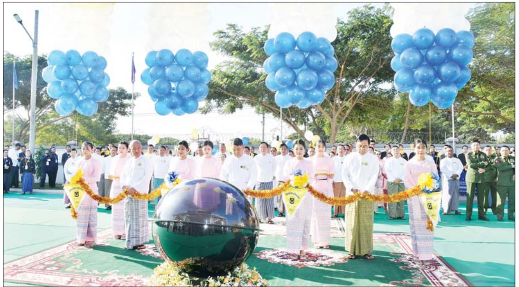
ပြည်ထောင်စုတရားသူကြီးချုပ် ဦးသာဌေး၊ နိုင်ငံတော်ဖွဲ့စည်းပုံအခြေခံဥပဒေဆိုင်ရာခုံရုံးဥက္ကဋ္ဌ ဦးအောင်ဇော်သိန်းနှင့် ပြည်ထောင်စုဝန်ကြီး ဦးမျိုးသန့်တို့ Judicial College အဆောက်အအုံသစ်ကို ဖဲကြိုးဖြတ်ဖွင့်လှစ်ပေးစဉ်။

ယနေ့အချိန်အခါတွင် နိုင်ငံတော်စီမံအုပ်ချုပ် ရေးကောင်စီက နိုင်ငံတော်၏ တာဝန်အရပ်ရပ်ကို ဖွဲ့စည်းပုံအခြေခံဥပဒေနှင့်အညီ ထိန်းသိမ်းဆောင်ရွက် လျက်ရှိပြီး ရှေ့လုပ်ငန်းစဉ် (၅)ရပ်၊ ဦးတည်ချက် (၉) ရပ်တို့ကို ချမှတ်ဆောင်ရွက်လျက်ရှိကြောင်း၊ အဆိုပါ ရှေ့လုပ်ငန်းစဉ်(၅)ရပ်နှင့်ဦးတည်ချက် (၉)ရပ် တို့တွင် “တရားဥပဒေစိုးမိုးရေး” ကို အလေးထား ဆောင်ရွက်သွားမည်ဖြစ်ကြောင်းကို အတိအလင်း ထုတ်ပြန်ကြေညာထားပြီးဖြစ်ကြောင်း၊ တရားဥပဒေ စိုးမိုးရေး အပြည့်အဝရရှိစေရန် အကောင်အထည်