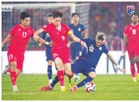
ဗီယက်နမ်အသင်းနှင့် ထိုင်းအသင်း ယှဉ်ပြိုင်စဉ်။

၆ လက်မရှိပြီး ကျေးရွာဖွံ့ဖြိုးတိုးတက်ရေးလုပ်ငန်း စီမံကိန်းပံ့ပိုးရန်ပုံငွေကျပ်သိန်း ၁၅၀၊ ပြည်သူထည့်ဝင်ငွေကျပ် ၁၅ သိန်းစုစုပေါင်းရန်ပုံငွေ ၁၆၅ သိန်းကို အသုံးပြုကာ မြို့နယ်ဦးစီးဌာန ဝန်ထမ်းများ၏ နည်းပညာပံ့ပိုးမှု၊ အနီးကပ်ကြည့်ရှုမှုဖြင့် ကျေးရွာသူ ကျေးရွာသားများက ၂၀၂၄ ခုနှစ် နိုဝင်ဘာလ တတိယအပတ်က စတင်အကောင်အထည်ဖော်ဆောင်ရွက်ခဲ့ရာ ယခုခေါ်လုပ်ငန်းများအားလုံး ရာနန်းပြည့်ပြီးစီးခဲ့ကြောင်း သိရသည်။