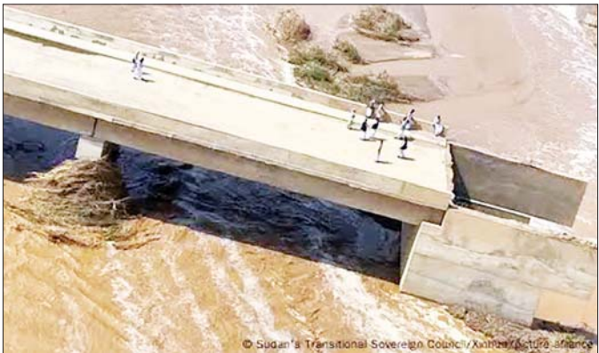
ဆည်ကျိုးမှုကြောင့် ပျက်စီးသွားသည့် တံတားတစ်စင်းကိုတွေ့ရစဉ်။