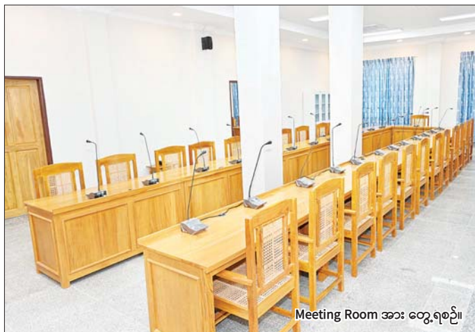
Meeting Room အား တွေ့ရစဉ်။