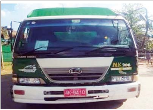
မရမ်းချောင်းမြို့နယ်စစ်ဆေးရေးစခန်း၌ ဖမ်းဆီးရမိမှု။

စီမံခန့်ခွဲမှုဖြင့် တာဝန်ကျပူးပေါင်းအဖွဲ့က စစ်ဆေးမှုများ ဆောင်ရွက်ခဲ့ရာ ပဲခူးခရိုင်၊ တောင်ငူခရိုင်နှင့် သာယာဝတီခရိုင်တို့အတွင်း၌ တရားမဝင်မီးသွေး ၁၁ ဒသမ ၈၄၀ တန်၊ ကျွန်းသစ် ၅ ဒသမ ၈၉၆ တန် စုစုပေါင်းခန့်မှန်းတန်ဖိုးငွေကျပ် ၄၃၆၂၈၀ ကို ဖမ်းဆီးရမိခဲ့ပြီး သစ်တောဥပဒေနှင့်အညီ အရေးယူဆောင်ရွက်လျက်ရှိသည်။ ၂၀၂၄ ခုနှစ် ဒီဇင်ဘာ ၂၈ ရက်၊ ၂၀၂၅ ခုနှစ် ဇန်နဝါရီ ၁ ရက်နှင့် ၂ ရက်တို့တွင် ဖမ်းဆီးရမိမှု စုစုပေါင်းမှာ အမှုတွဲရက်စွဲ ခန့်မှန်းတန်ဖိုးငွေကျပ် ၅၁၁၈၉၇၁၃ ကို ဖမ်းဆီးရမိခဲ့သည်။ တရားမဝင်ကုန်သွယ်မှုများကြောင့် အသေးစား၊ အငယ်စားနှင့် အလတ်စား ပြည်တွင်းစီးပွားရေးလုပ်ငန်းများမှ ထုတ်လုပ်သည့်ကုန်ပစ္စည်းများ ဈေးကွက်အတွင်း မျှတစွာ ယှဉ်ပြိုင်နိုင်မှုမရှိခြင်းနှင့် ဈေးကွက်ပျောက်ဆုံးခြင်းတို့ဖြစ်ပေါ်စေပြီး ပြည်တွင်းကုန်ထုတ်လုပ်ငန်းများ ရေရှည်ရပ်တည်နိုင်ရေးအတွက် ကြီးမားသည့်မြို့မခြောက်မှုများကို ဖြစ်ပေါ်စေသည်။ သို့ဖြစ်၍ သက်ဆိုင်ရာတာဝန်ရှိသူများမှ ယခုထက် ပိုမို၍ တားဆီးစစ်ဆေး ကြပ်မတ်ဆောင်ရွက်သွားမည်ဖြစ်ပါကြောင်း တရားမဝင်ကုန်သွယ်မှုတိုက်ဖျက်ရေးဦးဆောင်ကော်မတီမှ သိရသည်။ သတင်းစဉ်