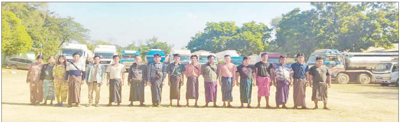
ဖမ်းဆီးရမိစက်သုံးဆီသယ်ဆောင်သည့် မော်တော်ယာဉ်များနှင့် တရားခံများ မှတ်တမ်းဓာတ်ပုံ။