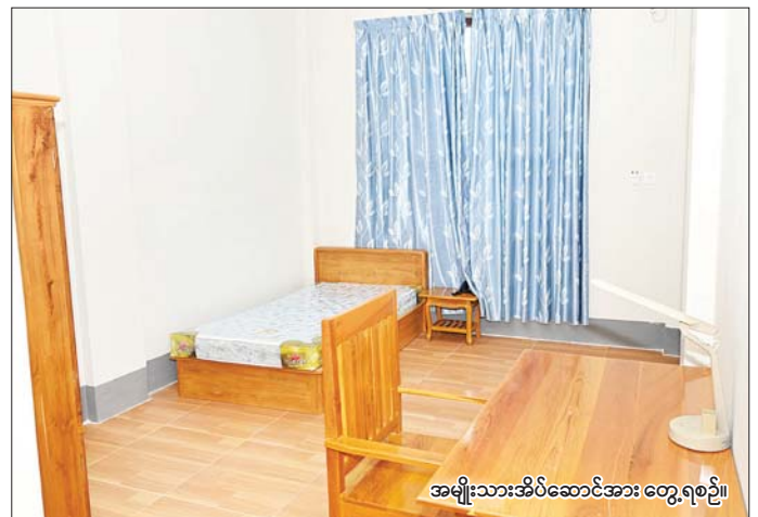
အမျိုးသားအိပ်ဆောင်အား တွေ့ရစဉ်။