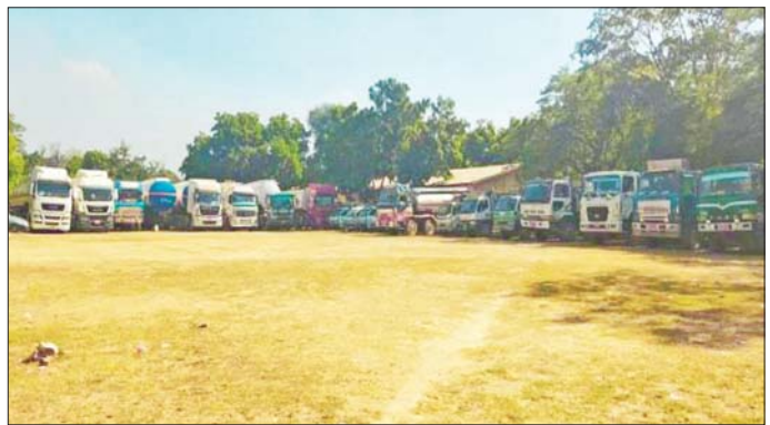
ဖမ်းဆီးရမိစက်သုံးဆီသယ်ဆောင်သည့် မော်တော်ယာဉ်များ မှတ်တမ်းဓာတ်ပုံ။

သည့်ယာဉ်များ စသည့်နေရာ ငါးနေရာမှ တရားခံ ၁၇ ဦးအား ၂၂ ဘီး ဆီသယ်ယာဉ်လေးစီး၊ ဆီနောက်တွဲယာဉ်တစ်စီး၊ ၂၀ ဘီး ဆီသယ်ယာဉ်သုံးစီး၊ ၁၂ ဘီး ဆီသယ်ယာဉ်တစ်စီး၊ ၁၀ ဘီး ဆီသယ်ယာဉ် သုံးစီး၊ ရှစ်ဘီးဆီသယ်ယာဉ် တစ်စီး၊ မြောက်ဘီးဆီသယ်ယာဉ် သုံးစီး၊ Light Truck ယာဉ်ငါးစီး၊ Toyota Van တစ်စီး စုစုပေါင်းယာဉ် ၂၂ စီး၊ ပရိမီယမ်ဒီဇယ် ၃၀၀၈၃ ဂါလန်၊ အောက်တိုနီး 92 ဓာတ်ဆီ ၃၀၄၆၂ ဂါလန် စုစုပေါင်းစက်သုံးဆီမျိုးစုံ ၆၀၅၅၅ ဂါလန်နှင့် တရားမဝင်စက်သုံးဆီများ အရောင်းအဝယ်ပြုလုပ်ရာတွင် အသုံးပြုသည့်ငွေများနှင့်အတူ ဖော်ထုတ်ဖမ်းဆီးရမိခဲ့သည်။