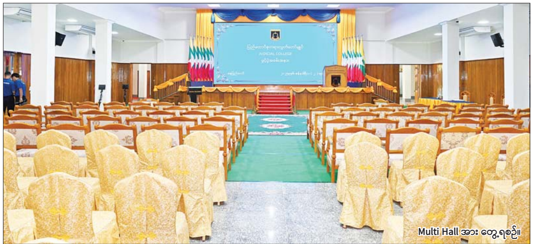
Multi Hall အား တွေ့ရစဉ်။