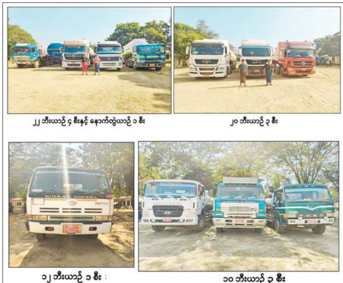
၂၂ ဘီးယာဉ် ၄ စီးနှင့် နောက်တွဲယာဉ် ၁ စီး