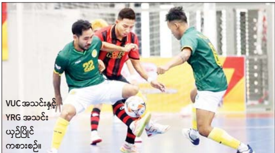
VUC အသင်းနှင့် YRG အသင်း ယှဉ်ပြိုင် ကစားစဉ်။

၂၀၂၄-၂၀၂၅ ရာသီ MFF ဖူဆယ်လိဂ်-၁ ပြိုင်ပွဲ ပွဲစဉ်(၂)ကို ဇန်နဝါရီ ၂ ရက်က ရန်ကုန်မြို့၊ သုဝဏ္ဏဘောလုံးကွင်းရှိ MFF ဖူဆယ်အားကစားရုံ၌ ဆက်လက်ကျင်းပရာ MIU အသင်း နိုင်ပွဲဆက်ပြီး ပွဲစဉ်အများစု သရေပွဲဖြစ်ခဲ့သည်။ စာမျက်နှာ ၁၇ ကော်လံ ၁