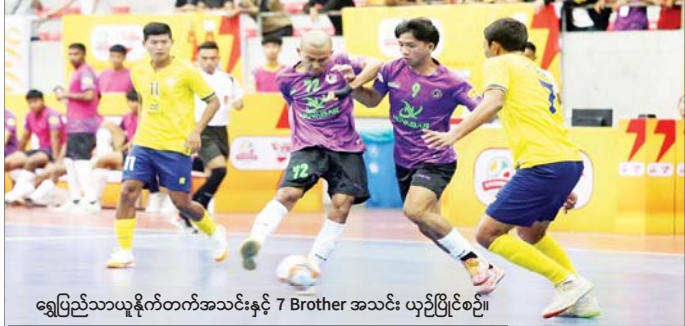
ရွှေပြည်သာယူနိုက်တက်အသင်းနှင့် 7 Brother အသင်း ယှဉ်ပြိုင်ပွဲစဉ်။

ရန်ကုန် ဇန်နဝါရီ ၈ ၂၀၂၄-၂၀၂၅ ရာသီ MFF ဖူဆယ်လိင်-၂ ပြိုင်ပွဲ ပွဲစဉ် (၄) ကို ဇန်နဝါရီ ၈ ရက်က ရန်ကုန်မြို့၊ သုဝဏ္ဏဘောလုံးကွင်းရှိ MFF ဖူဆယ်အားကစားရုံ၌ ဆက်လက်ကျင်းပရာ ထိပ်ဆုံးနေရာ အပြောင်းအလဲဖြစ်ပေါ်ခဲ့သည်။ ပွဲစဉ် (၄) တွင် 7 Dragon အသင်းက Pacific Sun Far အသင်းကို နှစ်ဂိုး-ဂိုးမရှိ၊ ရွှေပြည်သာ စာမျက်နှာ ၁၅ ကော်လံ ၅ ❖