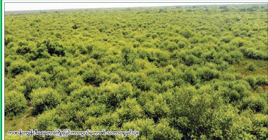
ကဏန်းကျွန်းဒီရေတောကြီးပြင်ကာကွယ်တော၏ သဘာဝရှုခင်းပုံ။

(နိုင်ငံတော်စီမံအုပ်ချုပ်ရေးကောင်စီဥက္ကဋ္ဌ နိုင်ငံတော်ဝန်ကြီးချုပ် ဗိုလ်ချုပ်မှူးကြီး မင်းအောင်လှိုင်၏ ၂၀၂၄ခုနှစ် ဧပြီလ ၂၂ ရက်နေ့တွင် ပြုလုပ်သော ပြည်ထောင်စုအစိုးရအဖွဲ့ အစည်းအဝေးအမှတ်စဉ် (၄/၂၀၂၄) သို့ တက်ရောက် အမှာစကားပြောကြားမှုမှ ကောက်နုတ်ချက်)