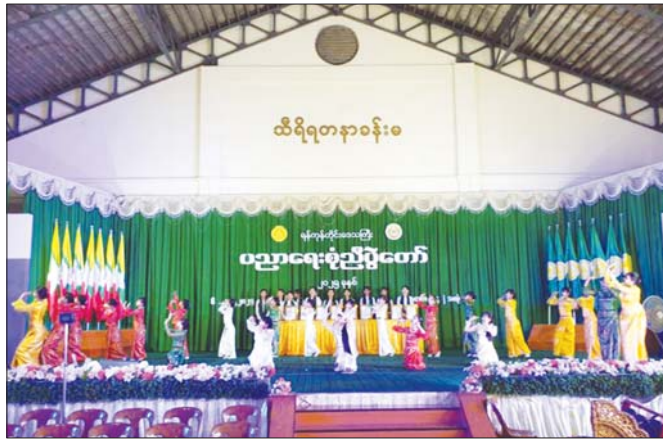
အလုပ်ဖြူနယ်၌ ဇန်နဝါရီ ၆ ရက်က ရန်ကုန်တိုင်းဒေသကြီးအဆင့် ၂၀၂၄-၂၀၂၅ ပညာသင်နှစ် ပညာရေးစုံညီပွဲတော်ကျင်းပစဉ်။

အထူးသဖြင့် ပညာရေးစုံညီပွဲတော်များကျင်းပလာသဖြင့် ဘာသာရပ်အလိုက် ထူးချွန်ဆု