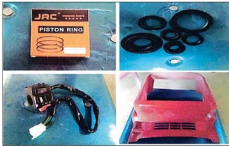
ကချင်ပြည်နယ်၌ ဖမ်းဆီးရမိမှု။

နေပြည်တော် ဇန်နဝါရီ ၈ တရားမဝင်ကုန်သွယ်မှုတိုက်ဖျက်ရေးဦးဆောင်ကော်မတီ၏ ကြီးကြပ် ကွပ်ကဲမှုဖြင့် တရားမဝင်ကုန်သွယ်မှုများကို ဥပဒေနှင့်အညီ ထိရောက်စွာ တားဆီးအရေးယူနိုင်ရေးအောင်ရွက်လျက်ရှိရာ ဇန်နဝါရီ ၆ ရက်တွင် မကွေးတိုင်းဒေသကြီး တရားမဝင်ကုန်သွယ်မှုတိုက်ဖျက်ရေး အထူးအဖွဲ့၏ စီမံခန့်ခွဲမှုဖြင့် တာဝန်ကျပူးပေါင်းအဖွဲ့များက စစ်ဆေးမှုများ ဆောင်ရွက်ခဲ့ရာ မကွေးမြို့နယ်နှင့် မင်းလှမြို့နယ်တို့၌ လိုင်စင်မဲ့ ဖော်တော်ယာဉ်တစ်စီးနှင့် ဖော်တော်ဆိုင်ကယ်တစ်စီး (ခန့်မှန်းတန်ဖိုး ငွေကျပ် ၆၀၀၀၀၀) ကို ပို့ကုန်သွင်းကုန်ဥပဒေအရလည်းကောင်း၊ မင်းသွားမြို့ မနန်းရေခံမြေဝင်းအတွင်း၌ တရားမဝင် ရေနံစိမ်း ၂၃ ဂါလန် (ခန့်မှန်းတန်ဖိုးငွေကျပ် ၈၅၅၀၀) ကို ပြည်သူပိုင်ပစ္စည်းကာကွယ်ရေးဥပဒေအရလည်းကောင်း စုစုပေါင်း ခန့်မှန်းတန်ဖိုးငွေကျပ် ၆၂၆၀၅၀၀ ကို ဖမ်းဆီးအရေးယူဆောင်ရွက်လျက်ရှိသည်။