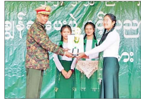
အားပေးခဲ့ကြပြီး သင်ထောက်ကူ များအား လှည့်လည်ကြည့်ရှုခဲ့ကြ ပြခန်းနှင့် သိပ္ပံပြခန်းများအတွင်း ခင်းကျင်းပြသထားသည့် ပစ္စည်း သတင်းစဉ်

သီချင်းဖြင့်အခမ်းအနားကို ဖွင့် လှုပ်ခဲ့သည်။ ထို့နောက် တိုင်းမှူး က အဖွဲ့အမှတ်စကားပြောကြားပြီး ပညာရေး စုံညီပွဲတော်အတွက် ချီးမြှင့်ငွေများပေးအပ်ရာ တာဝန် ရှိသူတစ်ဦးက လက်ခံရယူခဲ့ သည်။ ယင်းနောက် တိုင်းမှူးနှင့် တာဝန်ရှိသူများက ပြည်နယ် အဆင့် ထူးချွန်ဆုရရှိသူများ၊ တက္ကသိုလ်ဝင်တန်းတွင် ဂုဏ်ထူး ရရှိခဲ့သူများ၊ ၂၀၂၃-၂၀၂၄ ပညာ သင်နှစ်တွင် အတန်းအလိုက် ပညာရည်ချွန် ဆုရရှိသူများနှင့် မြို့နယ်အဆင့် ထူးချွန်ဆုရရှိသူ ကျောင်းသား ကျောင်းသူများကို ဆုများ အသီးသီးပေးအပ်ချီးမြှင့်ခဲ့ ကြသည်။ ယင်းနောက် တိုင်းမှူး နှင့် တက်ရောက်လာကြသူများက ကျောင်းသား ကျောင်းသူများ၏ ကပြဖျော်ဖြေမှုများကို ကြည့်ရှု