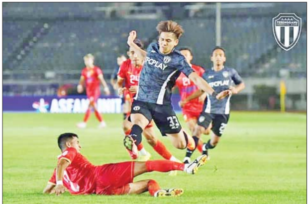
ဇန်နဝါရီ ၈ ရက်က မြန်မာကလပ် ရှမ်းယူနိုက်တက်နှင့် မလေးရှား ကလပ် တီရန်ဂါနူးအသင်းတို့ ယှဉ်ပြိုင်နေစဉ်။