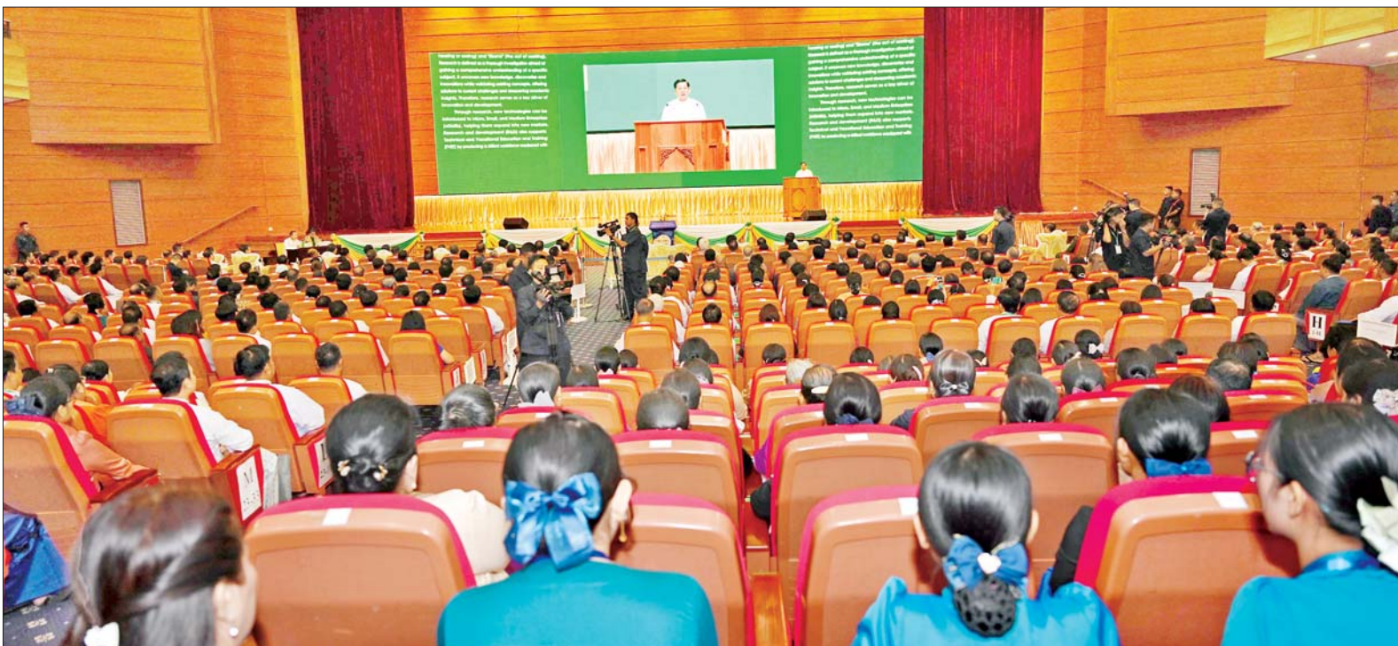
နိုင်ငံတော်စီမံအုပ်ချုပ်ရေးကောင်စီဥက္ကဋ္ဌ နိုင်ငံတော်ဝန်ကြီးချုပ် ဗိုလ်ချုပ်မှူးကြီး မင်းအောင်လှိုင် ပညာရေးဆိုင်ရာအသုံးချသုတေသန နိုင်ငံတကာညီလာခံ (၂၀၂၅) ဖွင့်ပွဲအခမ်းအနားတွင် မိန့်ခွန်းပြောကြားစဉ်။

ဖဲကြိုးဖြတ်ဖွင့်လှစ် ဦးစွာ နိုင်ငံတော်စီမံအုပ်ချုပ်ရေးကောင်စီ ဒုတိယဥက္ကဋ္ဌ ဒုတိယဝန်ကြီးချုပ် ဒုတိယဗိုလ်ချုပ်မှူးကြီး စိုးဝင်း၊ ကောင်စီတွဲဖက်အတွင်းရေးမှူး ဗိုလ်ချုပ်ကြီး ရဲဝင်းဦး၊ ကောင်စီဝင်ဗိုလ်ချုပ်ကြီးမြထွန်းဦး၊ ပညာရေးဝန်ကြီးဌာန ပြည်ထောင်စုဝန်ကြီး ဒေါက်တာညွန့်ဖေနှင့် သိပ္ပံနှင့် နည်းပညာဝန်ကြီးဌာန ပြည်ထောင်စုဝန်ကြီး ဒေါက်တာမျိုးသိန်းကျော်တို့က အခမ်းအနားကို ဖဲကြိုးဖြတ်ဖွင့်လှစ်ပေးကြသည်။