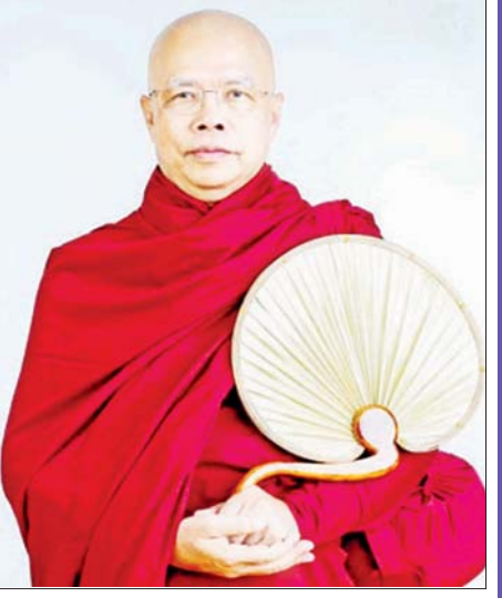
အလုပ်ကို ကြိုးစားစမ်းပါ။ တရားလက်ကိုင်ထားကြ စမ်းပါ။

ဘာလို့ ဟိုလူကိုချစ်လိုက်၊ ဒီလူကိုချစ်လိုက်နဲ့ ဟိုလိုလို ဒီလိုလိုနေမှာလဲ။ သမထဝိပဿနာဘာဝနာ