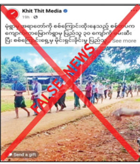
လက်နက်ကြီးများဖြင့် ပစ်ခတ်တိုက်ခိုက်ခြင်းများ လုပ်ဆောင်

ရှိသည်ကို တွေ့ရသည်။ မှန်ကန်မှုမရှိ အဆိုပါ သတင်းနှင့်ပတ်သက်၍ သက်ဆိုင်ရာလုံခြုံရေး တာဝန်ရှိသူ တစ်ဦး၏ ပြောကြားချက်အရ ၎င်းဖြစ်စဉ်မှာ မှန်ကန်မှုမရှိကြောင်း၊ အကြမ်းဖက် သမားများကသာ အစိုးရ၏ အုပ်ချုပ်မှုယန္တရားများ ပျက်ပြားစေရန်အတွက် ဌာနဆိုင်ရာ အဆောက်အအုံများကို Drop Bomb ချတိုက်ခိုက်ခြင်း၊