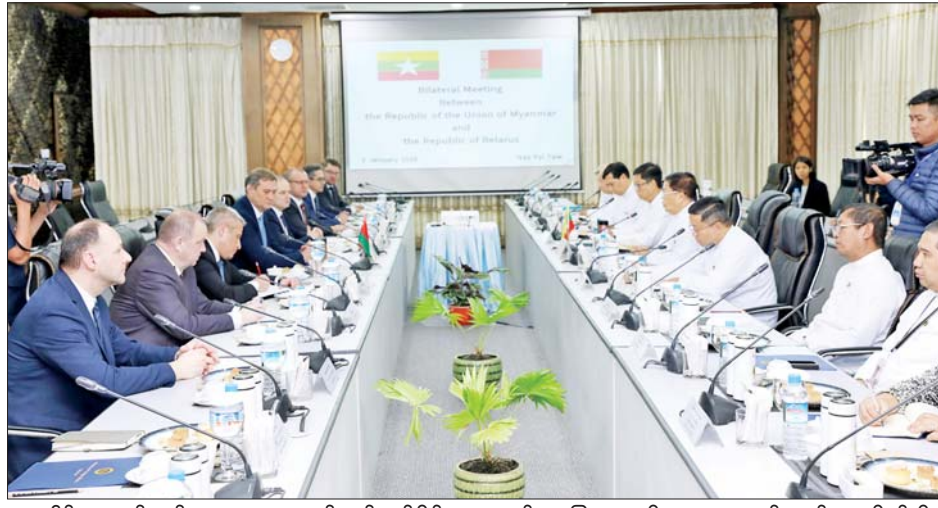
ပူးပေါင်းဆောင်ရွက်ရေး၊ ၂၀၂၄ ခုနှစ်တွင် နှစ်နိုင်ငံ သံတမန်ဆက်ဆံရေးထူထောင်မှု (၂၅) နှစ်ပြည့် မြောက်ခဲ့သည့် အခါသမယ၌ နှစ်နိုင်ငံပူးပေါင်းဆောင် ရွက်ရေးနယ်ပယ်များတွင် အောင်မြင်မှုများ ရရှိခဲ့ သည့်အခြေအနေ၊ စီးပွားရေး၊ ကုန်သွယ်ရေး၊ စိုက်ပျိုး ရေးနှင့် မွေးမြူရေး၊ ပညာရေးနှင့် ကာကွယ်ရေးကဏ္ဍ များအပါအဝင် နှစ်နိုင်ငံပြည်သူအချင်းချင်း ထိတွေ့ ဆက်ဆံမှုနှင့် နှစ်နိုင်ငံအကြား အပြန်အလှန်အကျိုး

နေပြည်တော် ဇန်နဝါရီ ၉ ဒုတိယဝန်ကြီးချုပ်နှင့် နိုင်ငံခြားရေးဝန်ကြီးဌာန ပြည်ထောင်စုဝန်ကြီး ဦးသန်းဆွေနှင့် ဘယ်လာရစ် သမ္မတနိုင်ငံ နိုင်ငံခြားရေးဝန်ကြီးဌာန ဝန်ကြီး H.E. Mr. Maxim RYZHENKOV တို့ တွေ့ဆုံဆွေးနွေးပွဲကို ယနေ့နံနက် ၉ နာရီတွင် နေပြည်တော်ရှိ နိုင်ငံခြားရေး ဝန်ကြီးဌာန၌ ကျင်းပသည်။ ဆွေးနွေးပွဲသို့ နိုင်ငံခြားရေးဝန်ကြီးဌာန ဒုတိယ ဝန်ကြီးနှင့် ဌာနဆိုင်ရာတာဝန်ရှိသူများ၊ မြန်မာနိုင်ငံ ဆိုင်ရာ ဘယ်လာရစ်သံအမတ်ကြီး၊ ဘယ်လာရစ် စက်မှုဝန်ကြီးဌာန၊ ကျန်းမာရေးဝန်ကြီးဌာန၊ စိုက်ပျိုး ရေးနှင့်စားနပ်ရိက္ခာဝန်ကြီးဌာနတို့မှ ဒုတိယဝန်ကြီး များ၊ ဘယ်လာရစ် တက္ကသိုလ်၏ ဒုတိယပါမောက္ခချုပ် နှင့် ဘယ်လာရစ် နိုင်ငံခြားရေးဝန်ကြီးဌာနမှ တာဝန် ရှိသူများ တက်ရောက်ကြသည်။ ဆွေးနွေးပွဲတွင် မြန်မာ-ဘယ်လာရစ်နှစ်နိုင်ငံ နိုင်ငံခြားရေးဝန်ကြီးဌာနများအကြား ပိုမို နီးကပ်စွာ