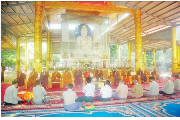
ရေးကော်မတီဥက္ကဋ္ဌ၊ ဘဏ္ဍာတော်ကြီး ဂေါပကဥက္ကဋ္ဌနှင့် အဖွဲ့ဝင် ထိန်းဂေါပကအဖွဲ့၊ စေတီတော်များ၊ စေတနာရှင် အလှူရှင်များ

မြောက်ဥက္ကလာပ ဇန်နဝါရီ ၉ ရန်ကုန်တိုင်းဒေသကြီး မြောက်ဥက္ကလာပမြို့၌ ဆုတောင်းပြည့် မယ်လမုစေတီတော် ဘဏ္ဍာတော် ထိန်းဂေါပကအဖွဲ့က ဦးစီးကျင်းပ သော(၅၅)ကြိမ်မြောက်ဗုဒ္ဓပူဇော်ပွဲ တော် ဗုဒ္ဓါဘိသေက အနေကဇာ တင်အခမ်းအနားကို ယနေ့ နံနက် ၅ နာရီက ဆုတောင်းပြည့် မယ်လမုစေတီတော်ကြီး၌ ကျင်းပ သည်။