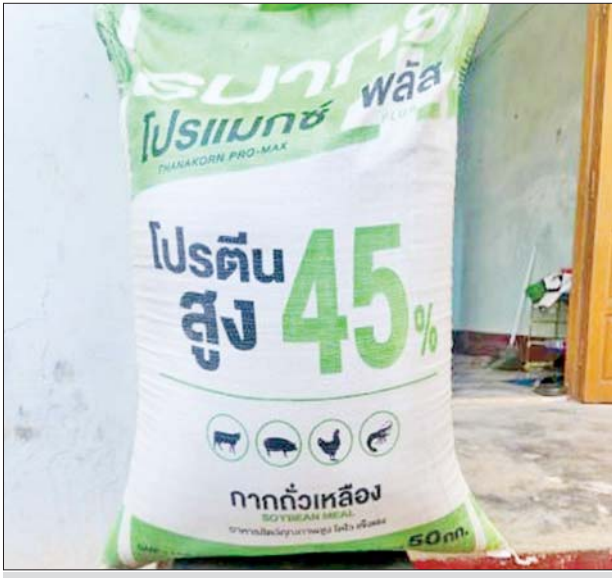
ပဲခူးတိုင်းဒေသကြီး၌ သိမ်းဆည်းရမိမှု။

နေပြည်တော် ဇန်နဝါရီ ၉ တရားမဝင်ကုန်သွယ်မှု တိုက်ဖျက်ရေး ဦးဆောင်ကော်မတီ၏ ကြီးကြပ်ကွပ်ကဲမှုဖြင့် တရားမဝင်ကုန်သွယ်မှုများကို ဥပဒေနှင့်အညီ ထိရောက်စွာ တားဆီးအရေးယူနိုင်ရေး ဆောင်ရွက်လျက်ရှိရာ ဇန်နဝါရီ ၇ ရက်တွင် မကွေးတိုင်းဒေသကြီး တရားမဝင်ကုန်သွယ်မှု တိုက်ဖျက်ရေးအထူးအဖွဲ့၏ စီမံခန့်ခွဲမှုဖြင့် တာဝန်ကျပူးပေါင်းအဖွဲ့က စစ်ဆေးမှုများ ဆောင်ရွက်ခဲ့ရာ မင်းဘူးမြို့ ရွာသစ်ကျေးရွာအနီး၌ တရားမဝင်ရေနံစိမ်း ၄၆၈ ဂါလန်နှင့် ဆက်စပ်ပစ္စည်းတစ်မျိုးစုစုပေါင်း (ခန့်မှန်းတန်ဖိုးငွေကျပ် ၁၇၂၅၀၀၀)ကို သိမ်းဆည်းရမိခဲ့ပြီး ပြည်သူ့ဝင်ပစ္စည်း ကာကွယ်ရေးအင်္ဂါအဖွဲ့နှင့်အညီ အရေးယူဆောင်ရွက်လျက်ရှိသည်။ ဇန်နဝါရီ ၈ ရက်တွင် စစ်ကိုင်းတိုင်းဒေသကြီး တရားမဝင်ကုန်သွယ်မှုတိုက်ဖျက်ရေး အထူးအဖွဲ့၏ စီမံခန့်ခွဲမှုဖြင့် တာဝန်ကျပူးပေါင်းအဖွဲ့က စစ်ဆေးမှုများ ဆောင်ရွက်ခဲ့ရာ စစ်ကိုင်းမြို့ ရတနာပုံတံတား ပူးပေါင်းစစ်ဆေးရေးဂိတ်နှင့် ကံတလူပူးပေါင်းစစ်ဆေးရေးဂိတ်တို့၌ လိုင်စင်မဲ့ Nissan Note ယာဉ်တစ်စီးနှင့် Nissan AD Van ယာဉ်တစ်စီး (ခန့်မှန်း တန်ဖိုးငွေကျပ် ၁၉၀၀၀၀၀)ကို ပို့ကုန်သွင်းကုန် ဥပဒေအရလည်းကောင်း၊ စစ်ကိုင်းမြို့ ရတနာပုံတံတားပူးပေါင်းစစ်ဆေးရေးဂိတ်၌ တရားမဝင် စက်သုံးဆီ ဒီဇယ်ဆီ ၁၁ ပီပီ၊ ဓာတ်ဆီ ပီပီ ၇၀ (ခန့်မှန်းတန်ဖိုးငွေကျပ် ၄၅၀၀၀၀)ကို ရေနံနှင့် ရေနံထွက်ပစ္စည်းဆိုင်ရာ ဥပဒေအရလည်းကောင်း (စုစုပေါင်း ခန့်မှန်း တန်ဖိုးငွေကျပ် ၅၉၅၀၀၀၀)ကို သိမ်းဆည်းအရေးယူ ဆောင်ရွက်လျက်ရှိသည်။ ထို့ပြင် ပဲခူးတိုင်းဒေသကြီး တရားမဝင်ကုန်သွယ်မှု တိုက်ဖျက်ရေးအထူးအဖွဲ့၏ စီမံခန့်ခွဲမှုဖြင့် တာဝန်ကျ ပူးပေါင်းအဖွဲ့များက