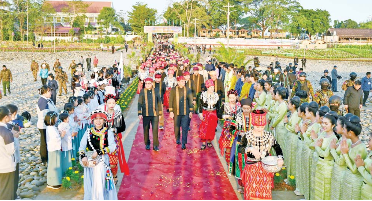
ရောဝတီရှုခင်းသာ အပန်းဖြေစခန်း ဖွင့်ပွဲအခမ်းအနားကျင်းပစဉ်။

ထို့နောက် ဒုတိယဝန်ကြီးချုပ် နှင့် ပြည်ထောင်စုဝန်ကြီးနှင့် အဖွဲ့ဝင်များသည် ပြည်နယ် ဝန်ကြီးချုပ်နှင့်အတူ (၇၇)နှစ် မြောက် ကချင်ပြည်နယ်နေ့ အထိမ်းအမှတ် မြစ်ကြီးနားမြို့ ရောဝတီကွက်ရှိ ကချင်ပြည်နယ် ယဉ်ကျေးမှုပြတိုက် အဆောင်သစ် ပထမအဆင့် ဖွင့်ပွဲအခမ်းအနားသို့ တက်ရောက်ကြသည်။