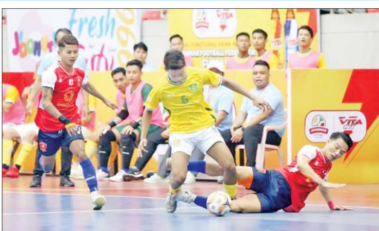
MH Dream Team အသင်းနှင့် YRG အသင်းတို့ ယှဉ်ပြိုင်ကစားကြစဉ်။

ပွဲစဉ်(၄)တွင် MIU အသင်းက Winner Soccer အသင်းကို နှစ်ဂိုး-တစ်ဂိုး၊ ဖူဆယ်ချစ်သူအသင်းက SGF အသင်းကို ခြောက်ဂိုး-ဂိုးမရှိ Generations အသင်းက VUC အသင်းကို သုံးဂိုး-နှစ်ဂိုးဖြင့် အနိုင်ရပြီး MH Dream Team အသင်းနှင့် စာမျက်နှာ ၂၀ ကော်လံ ၁ သို့