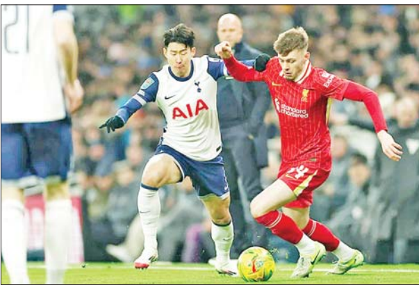
စပါးအသင်းနှင့် လီဗာပူးအသင်းတို့ ယှဉ်ပြိုင်ကစားကြစဉ်။