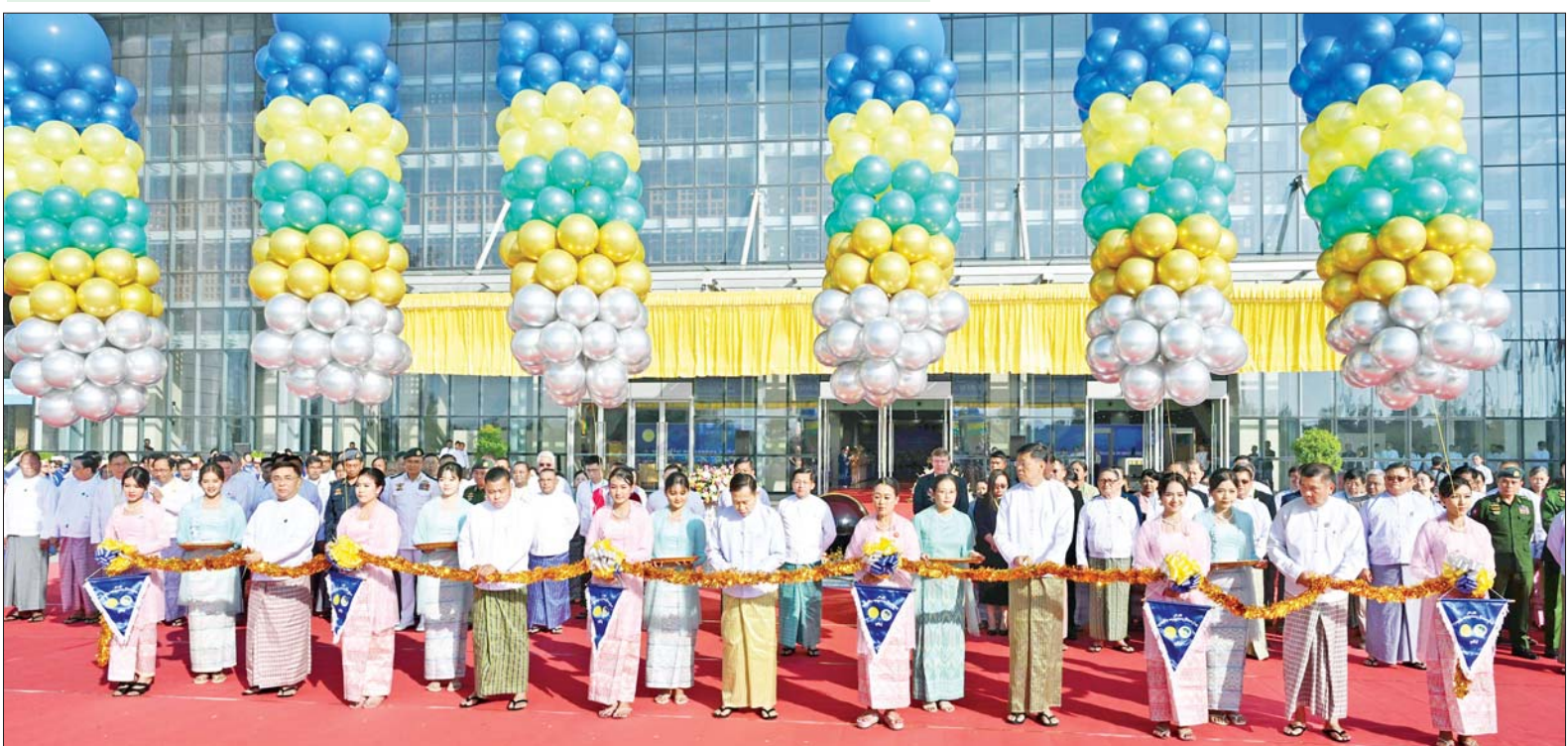
နိုင်ငံတော်စီမံအုပ်ချုပ်ရေးကောင်စီ ဒုတိယဥက္ကဋ္ဌ ဒုတိယဝန်ကြီးချုပ် ဒုတိယဗိုလ်ချုပ်မှူးကြီး စိုးဝင်း၊ ကောင်စီတွဲဖက်အတွင်းရေးမှူး ဗိုလ်ချုပ်ကြီးရဲဝင်းဦး၊ ကောင်စီဝင်ဗိုလ်ချုပ်ကြီးမြထွန်းဦး၊ ပြည်ထောင်စုဝန်ကြီး ဒေါက်တာညွန့်ဖေနှင့် ပြည်ထောင်စုဝန်ကြီး ဒေါက်တာမျိုးသိန်းကျော်တို့က ပညာရေးဆိုင်ရာ အသုံးချသုတေသန နိုင်ငံတကာညီလာခံ (၂၀၂၅) ဖွင့်ပွဲအခမ်းအနားကို ဖဲကြိုးဖြတ်ဖွင့်လှစ်ပေးကြစဉ်။

ကျွမ်းကျင်လုပ်သားများ မွေးထုတ်ပေးနိုင်မည် သုတေသန လုပ်ငန်းများ ကြောင့် အသေးစား၊ အငယ်စားနှင့် အလတ်စား စီးပွားရေးလုပ်ငန်းများအတွက် နည်းပညာသစ်များ ဖော်ထုတ်ပြီး ဈေးကွက်သစ်များ ချဲ့ထွင်နိုင်မည် ဖြစ်သကဲ့သို့ နည်းပညာ၊ သက်မွေးပညာရေးနှင့် လေ့ကျင့်ရေးအတွက် ကျွမ်းကျင်မှု အရည်အသွေးများနှင့် ပြည့်စုံသည့် ကျွမ်းကျင်လုပ်သားများကို မွေးထုတ်ပေးနိုင်မည်ဖြစ်ကြောင်း၊ ယနေ့ကျင်းပသည့် နိုင်ငံတကာ သုတေသနညီလာခံကြီးမှ သုတေသနနှင့် ဖွံ့ဖြိုးတိုးတက်မှုအတွက် အရေးပါသည့် ပူးပေါင်းဆောင်ရွက်မှုတံခါးသစ်ကို ဖွင့်လှစ်ပေးသွားလိမ့်မည်ဟု ယုံကြည်ကြောင်း။