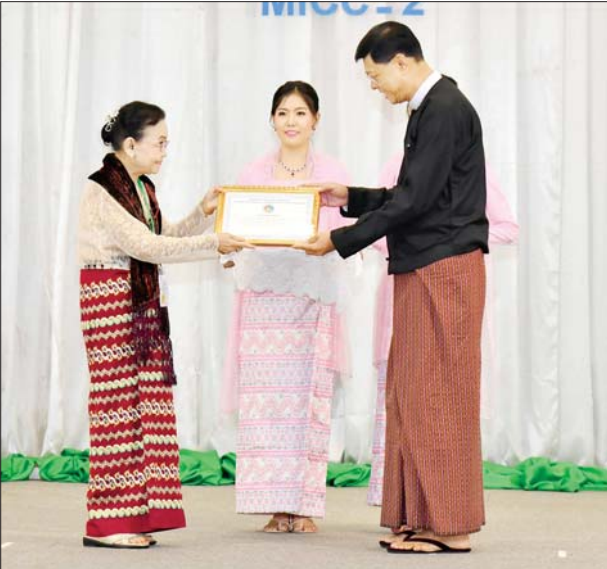
နိုင်ငံတော်စီမံအုပ်ချုပ်ရေးကောင်စီအဖွဲ့ဝင် ဒုတိယဝန်ကြီးချုပ် နှင့် ပြည်ထောင်စုဝန်ကြီး ဗိုလ်ချုပ်ကြီး မြထွန်းဦးက စာတမ်း ဖတ်ပွဲတွင် ပါဝင်ဆောင်ရွက်ခဲ့ကြသည့် ကိုယ်စားလှယ်တစ်ဦးအား ဂုဏ်ပြုလက်မှတ် ပေးအပ်ချီးမြှင့်စဉ်။

ကောင်စီ ဒုတိယဥက္ကဋ္ဌ ဒုတိယ ဝန်ကြီးချုပ်သည် ဖျော်ဖြေ တက်ရောက် လာကြသူများအား တင်ဆက်ခဲ့ကြသူများကို ဂုဏ်ပြု ရင်းရင်းနှီးနှီးနုတ် ဆက်ခဲ့ကြောင်း ပန်းခြင်းနှင့် ဂုဏ်ပြုချီးမြှင့်ငွေ သိရသည်။ သတင်းစဉ်