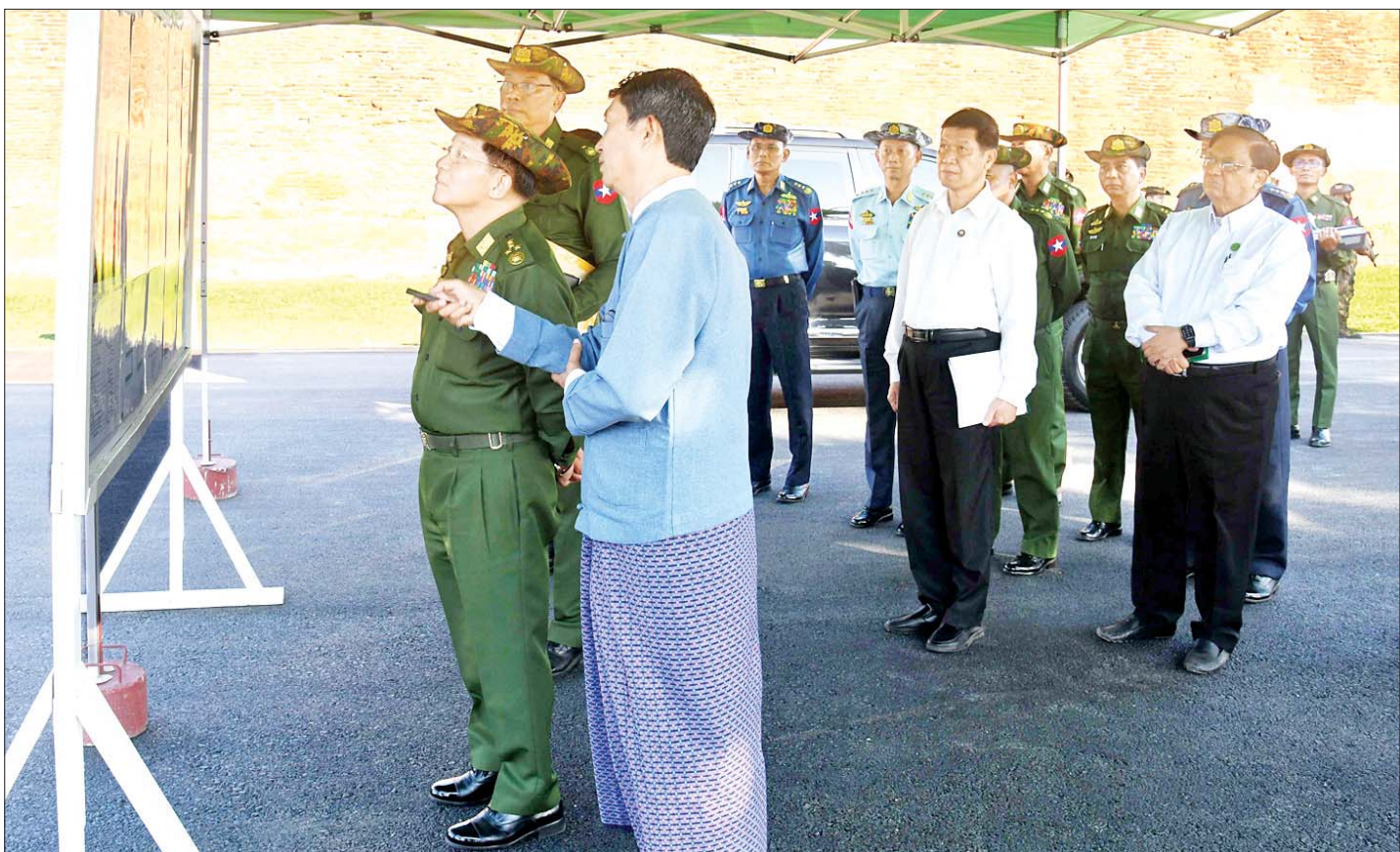
နိုင်ငံတော်စီမံအုပ်ချုပ်ရေးကောင်စီဥက္ကဋ္ဌ နိုင်ငံတော်ဝန်ကြီးချုပ် ဗိုလ်ချုပ်မှူးကြီး မင်းအောင်လှိုင်အား မန္တလေးနန်းမြို့အနောက်ဘက်ရှိ စည်ရှည်တံတား ပြန်လည်တည်ဆောက်ရေးလုပ်ငန်းဆောင်ရွက်နေမှုများကို တာဝန်ရှိသူတစ်ဦးက ရှင်းလင်းတင်ပြစဉ်။

တပ်မတော်အနေဖြင့် ဒို့တာဝန်အရေးသုံးပါးဖြစ်သည့် ပြည်ထောင်စုမပြိုကွဲရေး၊ တိုင်းရင်းသားစည်းလုံးညီညွတ်မှု မပြိုကွဲရေး၊ အချုပ်အခြာအာဏာ တည်တံ့ခိုင်မြဲရေးကို အထူးအလေးထား ဆောင်ရွက်သွားရမည်ဖြစ်ကြောင်း၊ စုစည်းညီညွတ်သည့် အင်အားဖြင့် ဆောင်ရွက်ရမည်ဖြစ်ပြီး တပ်မတော်သားတိုင်းအနေဖြင့် နိုင်ငံတော်ကာကွယ်ရေးနှင့် ပတ်သက်ပါက စစ်သားစိတ်မွေး၍ ဆောင်ရွက်သွား