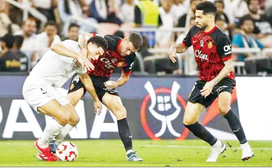
ရီးယဲလ်မက်ဒရစ်အသင်းနှင့် မာယော့ကာအသင်းတို့ ယှဉ်ပြိုင်ကစားကြစဉ်။