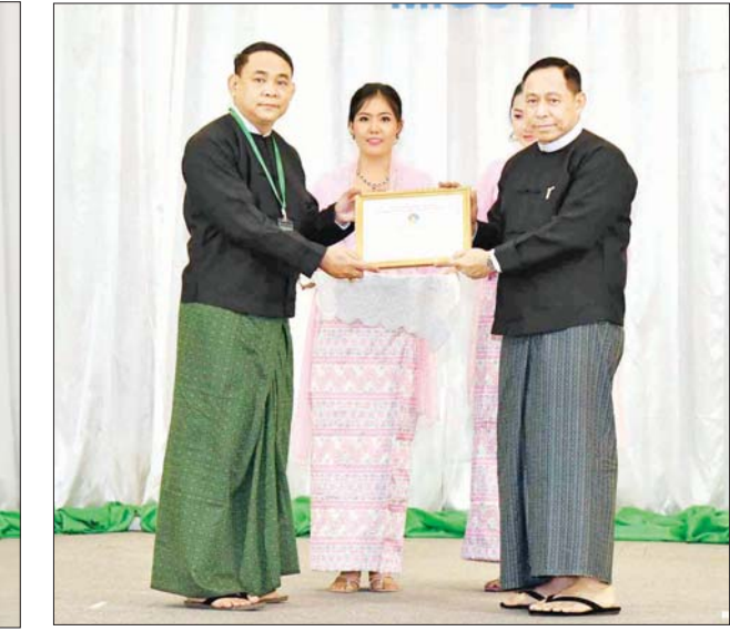
နိုင်ငံတော်စီမံအုပ်ချုပ်ရေးကောင်စီအဖွဲ့ဝင် ပြည်ထောင်စု ဝန်ကြီး ဒုတိယဗိုလ်ချုပ်ကြီးရာပြည့်က စာတမ်းရှင်များကိုယ်စား စာတမ်းရှင်တစ်ဦးအား ဂုဏ်ပြုလက်မှတ်ပေးအပ်ချီးမြှင့်စဉ်။