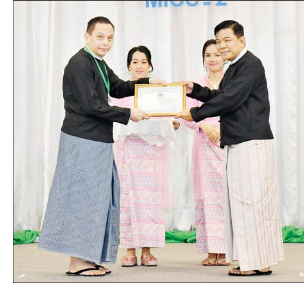
နိုင်ငံတော်စီမံအုပ်ချုပ်ရေးကောင်စီအဖွဲ့ဝင် ဒုတိယ ဝန်ကြီးချုပ်နှင့် ပြည်ထောင်စုဝန်ကြီး ဗိုလ်ချုပ်ကြီး မောင်မောင်အေးက စာတမ်းရှင်များကိုယ်စား စာတမ်းရှင်တစ်ဦးအား ဂုဏ်ပြုလက်မှတ် ပေးအပ်ချီးမြှင့်စဉ်။