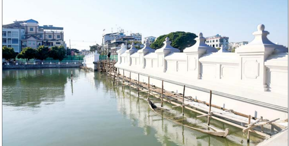
မန္တလေးနန်းမြို့အနောက်ဘက်ရှိ စည်ရှည်တံတား ပြန်လည်တည်ဆောက်နေမှုကို တွေ့ရစဉ်။

ယင်းနောက် နိုင်ငံတော်စီမံအုပ်ချုပ်ရေးကောင်စီဥက္ကဋ္ဌ တပ်မတော်ကာကွယ်ရေးဦးစီးချုပ်နှင့်အဖွဲ့ဝင်များသည် မန္တလေးနန်းမြို့ရိုးတစ်လျှောက် မော်တော်ယာဉ်များဖြင့် လိုက်လံကြည့်ရှုစစ်ဆေးခဲ့ကြောင်း သိရသည်။ သတင်းစဉ်