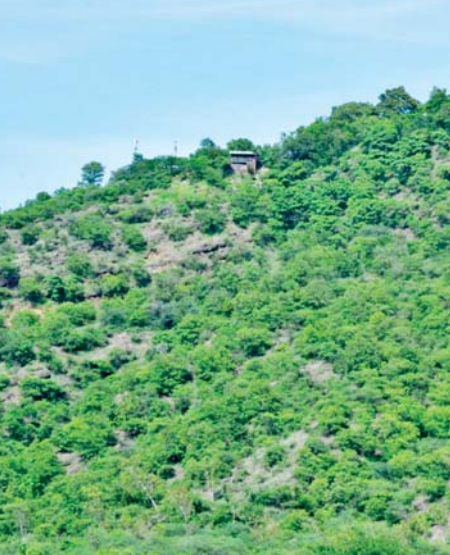
တုရင်တောင်ကြိုးပြင်ကာကွယ်တော၏ သဘာဝရှုခင်းကို တွေ့ရစဉ်။

ပြည်ထောင်စု သမ္မတမြန်မာ ထိန်းသိမ်းရေး ဝန်ကြီးဌာနသည် အရ အပင်နှင့်ထားသော လုပ်ပိုင် နိုင်ငံတော်အစိုးရ၊ သယံဇာတ ၂၀၁၈ ခုနှစ်တွင် ပြဋ္ဌာန်းထားသည့် ခွင့်များကိုကျင့်သုံးလျက် မန္တလေး နှင့် သဘာဝပတ်ဝန်းကျင် သစ်တောဥပဒေပုဒ်မ ၆၊ ပုဒ်မခွဲ(င) တိုင်းဒေသကြီး သောင်ဦးခရိုင်