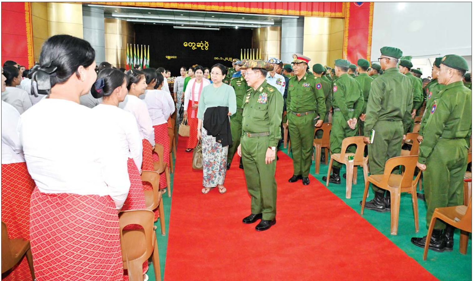
နိုင်ငံတော်စီမံအုပ်ချုပ်ရေးကောင်စီဥက္ကဋ္ဌ တပ်မတော်ကာကွယ်ရေးဦးစီးချုပ် ဗိုလ်ချုပ်မှူးကြီးမင်းအောင်လှိုင်နှင့်ဇနီး ဒေါ်ကြူကြူလှ မန္တလေးတပ်နယ်ရှိ အရာရှိ၊ စစ်သည်၊ မိသားစုများအား ရင်းရင်းနှီးနှီးနှုတ်ဆက်စဉ်။