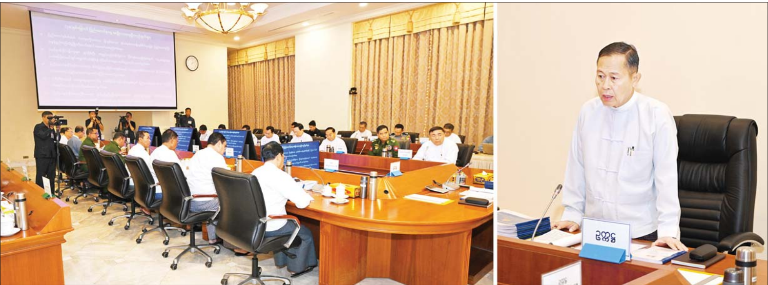
နိုင်ငံတော်စီမံအုပ်ချုပ်ရေးကောင်စီဒုတိယဥက္ကဋ္ဌ ဒုတိယဝန်ကြီးချုပ် ဒုတိယဗိုလ်ချုပ်မှူးကြီးစိုးဝင်း (၇၈)နှစ်မြောက် ပြည်ထောင်စုနေ့ကျင်းပရေးဗဟိုကော်မတီ ပထမအကြိမ် ညှိနှိုင်းအစည်းအဝေးတွင် အမှာစကားပြောကြားစဉ်။

နေပြည်တော် ဇန်နဝါရီ ၁၀ ၂၀၂၅ ခုနှစ် (၇၈)နှစ်မြောက် ပြည်ထောင်စုနေ့ကျင်းပရေး ဗဟိုကော်မတီ ပထမအကြိမ် ညှိနှိုင်းအစည်းအဝေးကို ယနေ့မွန်းလွဲပိုင်းတွင် နေပြည်တော်ရှိ နိုင်ငံတော် စီမံအုပ်ချုပ်ရေးကောင်စီဥက္ကဋ္ဌရုံး အစည်းအဝေးခန်းမ၌ ကျင်းပရာ ၂၀၂၅ ခုနှစ် (၇၈)နှစ်မြောက် ပြည်ထောင်စုနေ့ ကျင်းပရေးဗဟိုကော်မတီ ဥက္ကဋ္ဌ နိုင်ငံတော်စီမံအုပ်ချုပ်ရေးကောင်စီဒုတိယဥက္ကဋ္ဌ ဒုတိယဝန်ကြီးချုပ် ဒုတိယဗိုလ်ချုပ်မှူးကြီးစိုးဝင်း တက်ရောက်အမှာစကား ပြောကြားသည်။ စာမျက်နှာ ၉ ကော်လံ ၁ သို့ ၀