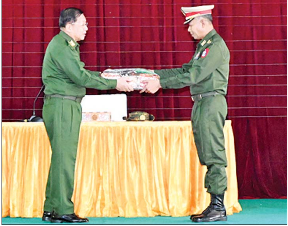
နိုင်ငံတော်စီမံအုပ်ချုပ်ရေးကောင်စီဥက္ကဋ္ဌ တပ်မတော်ကာကွယ်ရေးဦးစီးချုပ် ဗိုလ်ချုပ်မှူးကြီး မင်းအောင်လှိုင် မိတ္ထီလာတပ်နယ်ရှိ အရာရှိ၊ စစ်သည်၊ မိသားစုများအတွက် စားသောက်ဖွယ်ရာပစ္စည်းများ ပေးအပ်စဉ်။

တပ်မတော်ပိုင်းနှင့်ပတ်သက်၍ ခေတ်အဆက် ဆက်တွင် နိုင်ငံရေးအရ စစ်ရေးအရဖြစ်ပေါ်လာသည့် ပြည်တွင်းပြည်ပ အန္တရာယ်များကြား၌ မိမိတို့ တပ်မတော်သားများသည် နိုင်ငံနှင့်ပြည်သူအကျိုး အတွက် စွန့်လွှတ်စွန့်စားခြင်းများစွာဖြင့် ပေးအပ် လာသည့်တာဝန်များကို ကျေပွန်အောင်ထမ်းဆောင် ခဲ့ကြကြောင်း၊ လွတ်လပ်ရေးနှင့်အတူ ပေါ်ပေါက်ခဲ့ သည့် ပြည်တွင်းသောင်းကျန်းမှုများ၊ ဝါဒစွဲ ဂိုဏ်းဂဏစွဲကြောင့် ဖြစ်ပေါ်လာသည့် ထိုးနှက် တိုက်ခိုက်မှုများကြားတွင် တပ်မတော်အနေဖြင့် စစ်မှန်သည့် အမျိုးသားရေးတာဝန်ကိုသာ ရှေးရှုပြီး တိုင်းပြည်နှင့်လူမျိုးအကျိုး သယ်ပိုးခဲ့သည်မှာ သမိုင်း သက်သေရှိပြီးဖြစ်ကြောင်း၊ ယခုမိမိတို့တပ်မတော်၏ နိုင်ငံရေးတာဝန်များကို ထမ်းဆောင်နေမှုများသည် လည်း သမိုင်းများပင်ဖြစ်သဖြင့် သမိုင်းမှတ်တမ်းကောင်း ကို ရေးထိုးနိုင်ရမည်ဖြစ်ကြောင်း၊ လက်ရှိ ပြည်တွင်း ပြည်ပ အန္တရာယ်များ၊ ဝင်ရောက်စွက်ဖက်မှုများဖြင့် ကြုံတွေ့နေရချိန်တွင် နိုင်ငံတော်ကာကွယ်ရေးနှင့် လုံခြုံရေးတာဝန် ထမ်းဆောင်နေကြသူများအားလုံး၏