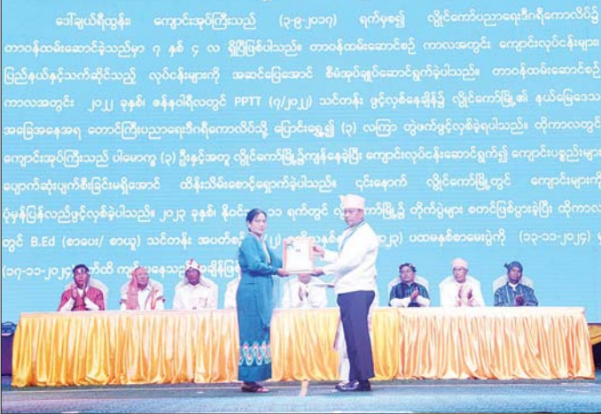
နိုင်ငံတော်စီမံအုပ်ချုပ်ရေးကောင်စီအဖွဲ့ဝင် ဒုတိယဝန်ကြီးချုပ်နှင့် ပြည်ထောင်စုဝန်ကြီး ဗိုလ်ချုပ်ကြီး တင်အောင်စန်း (၇၃)နှစ်မြောက် ကယားပြည်နယ်နေ့အထိမ်းအမှတ် ဂုဏ်ထူးဆောင်ဆု ရရှိသူတစ်ဦးအား ဂုဏ်ပြုဆု ပေးအပ်စဉ်။

※ ရှေးမှူးမှ ပြည်နယ်ဝန်ကြီးချုပ်နှင့် ဒေသ တင်အောင်စန်းက အထိမ်းအမှတ် အခမ်းအနားတွင် နိုင်ငံတော် ကွက်ကရေးမှူးတို့က ကယား မုခ်ဦးကို စက်ခလုတ်နှိပ်၍ စီမံအုပ်ချုပ်ရေးကောင်စီ အဖွဲ့ဝင် ပြည်နယ်နေ့အထိမ်းအမှတ် မုခ်ဦး ဖွင့်လှစ်ပေးသည်။ ပိုးရယ်အောင်သိန်း၊ ပြည်ထောင်စု ကို ဖဲကြီးမြတ်ဖွင့်လှစ်ပေးပြီး ထို့နောက် အခမ်းအနားကို ဝန်ကြီး ဒုတိယဗိုလ်ချုပ်ကြီး ဒုတိယဝန်ကြီးချုပ်နှင့် ပြည် ပြည်နယ်ခန်းမ၌ ဆက်လက် ထွန်းထွန်းနေ့နှင့် ဦးညောင်ထွန်း၊ ထောင်စုဝန်ကြီး ဗိုလ်ချုပ်ကြီး ကျင်းပရာ သဘာပတိအဖွဲ့ဝင်များ