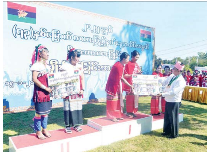
နိုင်ငံတော်စီမံအုပ်ချုပ်ရေးကောင်စီအဖွဲ့ဝင် ဒုတိယဝန်ကြီးချုပ်နှင့် ပြည်ထောင်စုဝန်ကြီး ဗိုလ်ချုပ်ကြီး တင်အောင်စန်း (၇၃)နှစ်မြောက် ကယားပြည်နယ်နေ့အထိမ်းအမှတ် အားကစားပြိုင်ပွဲတွင် ဆုရရှိသူများ အား ဆုပေးအပ်စဉ်။

※ ရှေးမှူးမှ ပြည်နယ်ဝန်ကြီးချုပ်နှင့် ဒေသ တင်အောင်စန်းက အထိမ်းအမှတ် အခမ်းအနားတွင် နိုင်ငံတော် ကွက်ကရေးမှူးတို့က ကယား မုခ်ဦးကို စက်ခလုတ်နှိပ်၍ စီမံအုပ်ချုပ်ရေးကောင်စီ အဖွဲ့ဝင် ပြည်နယ်နေ့အထိမ်းအမှတ် မုခ်ဦး ဖွင့်လှစ်ပေးသည်။ ပိုးရယ်အောင်သိန်း၊ ပြည်ထောင်စု ကို ဖဲကြီးမြတ်ဖွင့်လှစ်ပေးပြီး ထို့နောက် အခမ်းအနားကို ဝန်ကြီး ဒုတိယဗိုလ်ချုပ်ကြီး ဒုတိယဝန်ကြီးချုပ်နှင့် ပြည် ပြည်နယ်ခန်းမ၌ ဆက်လက် ထွန်းထွန်းနေ့နှင့် ဦးညောင်ထွန်း၊ ထောင်စုဝန်ကြီး ဗိုလ်ချုပ်ကြီး ကျင်းပရာ သဘာပတိအဖွဲ့ဝင်များ