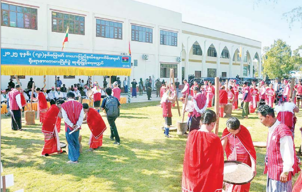
(၇၃)နှစ်မြောက် ကယားပြည်နယ်နေ့အထိမ်းအမှတ် ကယားရိုးရာ စပါးထောင်းပြိုင်ပွဲတွင် တိုင်းရင်းသားလူငယ်များ ပျော်ရွှင်စွာ ဝင်ရောက်ယှဉ်ပြိုင်နေမှုကို တွေ့ရစဉ်။

ဂျပန်လဆင်းယာဉ်တစ်စင်း ပတ်လမ်း အတွင်းသို့ အောင်မြင်စွာ ဝင်ရောက်