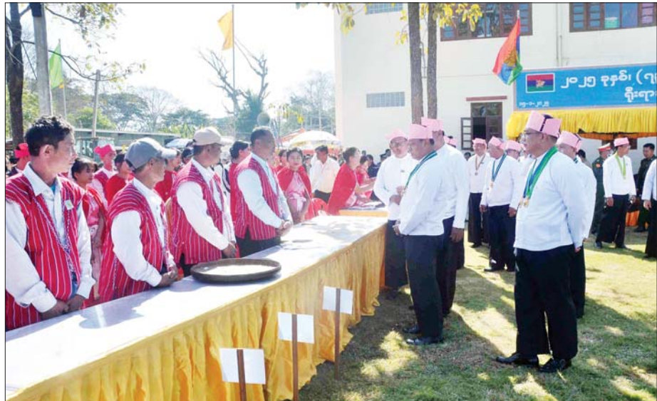
နိုင်ငံတော်စီမံအုပ်ချုပ်ရေးကောင်စီအဖွဲ့ဝင် ဒုတိယဝန်ကြီးချုပ်နှင့် ပြည်ထောင်စုဝန်ကြီး ဗိုလ်ချုပ်ကြီး တင်အောင်စန်း (၇၃)နှစ်မြောက် ကယားပြည်နယ်နေ့ အခမ်းအနား တက်ရောက်လာကြသည့် ဒေသခံတိုင်းရင်းသားများအား ရင်းရင်းနီးနီးနှုတ်ဆက်စဉ်။

နှင့် ဒေါတမရပ်ကွက်ရှိ ဘူတာ လမ်း ကတ္တရာကွန်ကရစ်လမ်းသစ် ဖွင့်ပွဲသို့ တက်ရောက်ရာ ဒုတိယ ဝန်ကြီးချုပ်နှင့် ပြည်ထောင်စု ဝန်ကြီးက ဘူတာလမ်း ကတ္တရာ ကွန်ကရစ်လမ်းသစ် ဖွင့်ပွဲမှစဉ်း ကို စက်လှေတံတိုင်းပွင့်လှစ်ပေးပြီး အကအဖွဲ့များကို ဂုဏ်ပြုချီးမြှင့် ငွေများ ပေးအပ်၍ လမ်းသစ်ကို ဖြတ်သန်းကြည့်ရှုကာတက်ရောက် လာသော တိုင်းရင်းသားရိုးရာ အကအဖွဲ့များနှင့် ဒေသခံပြည်သူ များအား ရင်းရင်းနီးနီးနှုတ်ဆက် ကြသည်။ ယင်းနေ့က လှိုင်ကော်မြို့ တည်ဆောက်ဆဲ သီရိမင်္ဂလာ ဈေးသစ်လုပ်ငန်းများ ဆောင်ရွက် နေမှု၊ လုပ်ငန်းပြီးစီးမှုအခြေအနေ များကို လှည့်လည်ကြည့်ရှုပြီး ဒုတိယဝန်ကြီးချုပ်နှင့် ပြည် ထောင်စုဝန်ကြီးက အဆင့်မြင့် ဈေးသစ် တည်ဆောက်ခြင်းနှင့် စပ်လျဉ်း၍ လိုအပ်သည်များ မှာကြားသည်။ ဆက်လက်၍ လှိုင်ကော်မြို့ ခုတင် ၅၀၀ ဆံ့ ပြည်နယ်ပြည်သူ့ ဆေးရုံကြီး၌ ကျန်းမာရေးဝန်ထမ်း များနှင့်တွေ့ဆုံပြီး ဒုတိယဝန်ကြီး ချုပ်နှင့် ပြည်ထောင်စုဝန်ကြီးနှင့် တာဝန်ရှိသူများက ဆေးပဒေသာ