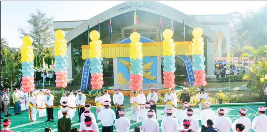
နိုင်ငံတော်စီမံအုပ်ချုပ်ရေးကောင်စီ အဖွဲ့ဝင် ပိုးရယ်အောင်သိန်း၊ ပြည်ထောင်စုဝန်ကြီး ဒုတိယဗိုလ်ချုပ်ကြီး ထွန်းထွန်းနေ့နှင့် ဦးညောင်ထွန်း၊ ပြည်နယ်ဝန်ကြီးချုပ်နှင့် ဒေသကွပ်ကဲရေးမှူးတို့ ကယားပြည်နယ်နေ့အထိမ်းအမှတ်မုခ်ဦးကို ဖဲကြီးမြတ်ဖွင့်လှစ်ပေးစဉ်။

ရောက်ရှိနေရာယူပြီး နိုင်ငံတော် အလံနှင့် ကျဆုံးလေပြီးသော ခေါင်းဆောင်ကြီးများနှင့် ရဲဘော် အပေါင်းကို အလေးပြုကြသည်။ ယင်းနောက် နိုင်ငံတော်စီမံ အုပ်ချုပ်ရေးကောင်စီဥက္ကဋ္ဌ နိုင်ငံ တော်ဝန်ကြီးချုပ် ဗိုလ်ချုပ်မှူးကြီး သတိုးမဟာသရေစည်သူ သတိုး သီရိသူဓမ္မ မင်းအောင်လှိုင် ထံမှ ထို့နောက် ပြည်ထောင်စု ပေးပို့သော (၇၃) နှစ်မြောက် ကယားပြည်နယ်နေ့ အထိမ်း အမှတ်သံဝင်ကဏ္ဍကို ဒုတိယ ဝန်ကြီးချုပ်နှင့် ပြည်ထောင်စု ဝန်ကြီး ဗိုလ်ချုပ်ကြီး တင်အောင် စန်းက ဖတ်ကြားပြီး ပြည်နယ် ဝန်ကြီးချုပ်က ကယားပြည်နယ် နေ့ အထိမ်းအမှတ် နှုတ်ခွန်းဆက် အမှာစကား ပြောကြားသည်။ ဆက်လက်၍ (၇၃)နှစ်မြောက် ကယားပြည်နယ်နေ့ အထိမ်း အမှတ် ဂုဏ်ထူးဆောင်လက်မှတ် နှင့် ဂုဏ်ထူးဆောင်ဆုရရှိသူများ၊ ပဉ္စမအကြိမ်အမျိုးသားအားကစား ပြိုင်ပွဲနှင့် (၂၅) ကြိမ်မြောက် အဆို ဆုရရှိသူများအား ဒုတိယဝန်ကြီး ချုပ်နှင့် ပြည်ထောင်စုဝန်ကြီး နှင့် နိုင်ငံတော်စီမံအုပ်ချုပ်ရေး ကောင်စီအဖွဲ့ဝင်များ၊ ပြည်ထောင်စု ဝန်ကြီးများ၊ ပြည်နယ်ဝန်ကြီး ချုပ်နှင့် ဒေသကွပ်ကဲရေးမှူးတို့က ရုတ်ပြုဆုများ ချီးမြှင့်ပေးအပ် သည်။ ထို့နောက် ပြည်ထောင်စု ဝန်ကြီး ဒုတိယဗိုလ်ချုပ်ကြီး ထွန်းထွန်းနေ့က နယ်စပ် ရေးရာဝန်ကြီးဌာနမှပေးအပ်သည့် 50 KW ဆိုလာအစုံ ၁၀၀ နှင့် ကယားပြည်နယ်အတွင်း တာဝန် ထမ်းဆောင်လျက်ရှိသော ဝန်ထမ်း များအတွက် ငွေကျပ် ၁၅၀ သိန်း တန်ဖိုးရှိ အခြေခံစားသောက် ကုန်များကို လည်းကောင်း၊ ပြည်ထောင်စုဝန်ကြီး ဦးညောင် ထွန်းက ပြန်ကြားရေးဝန်ကြီးဌာန မှ ပေးအပ်သည့် DTH စလောင်အစုံ ၅၀ နှင့် Set Top Box အစုံ ၅၀ တို့ကိုလည်းကောင်း ပေးအပ် ရာ ပြည်နယ်အစိုးရအဖွဲ့ဝင်များက လက်ခံရယူကြသည်။ ယင်းနောက် ဒုတိယဝန်ကြီး ချုပ်နှင့် ပြည်ထောင်စုဝန်ကြီးနှင့် ဧည့်သည်တော်များသည် အခမ်း အနားသို့ တက်ရောက်လာကြသူ များ၊ ဆုရရှိသူများနှင့်အတူ