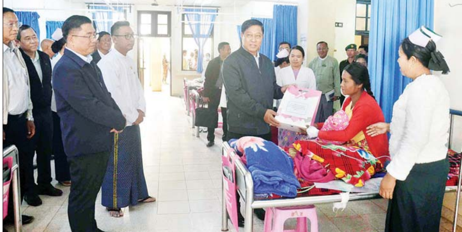
နိုင်ငံတော်စီမံအုပ်ချုပ်ရေးကောင်စီအဖွဲ့ဝင် ဒုတိယဝန်ကြီးချုပ်နှင့် ပြည်ထောင်စုဝန်ကြီး ဗိုလ်ချုပ်ကြီး တင်အောင်စန်း၊ လှိုင်ကော်မြို့၊ ဒုတင် ၅၀၀ ဆံ့ ပြည်နယ်ပြည်သူ့ဆေးရုံကြီး၌ ဆေးကုသသည့်လူနာများအား အာဟာရဖြည့်စွက်စာနှင့် ချီးမြှင့်ငွေပေးအပ်စဉ်။

ရွှေတောင် သိန်း ၁၅၀ ကို နိုင်ငံတော် စီမံအုပ်ချုပ်ရေးကောင်စီအဖွဲ့ဝင် ပိုးရယ်အောင်သိန်းနှင့် ဦးရွှေကြိမ်း တို့က ပေးအပ်ရာ သက်ဆိုင်ရာ တာဝန်ရှိသူများက လက်ခံရယူကြ သည်။