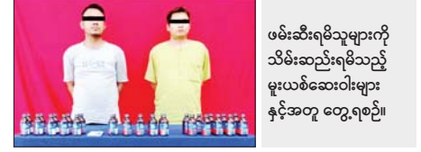
ဖမ်းဆီးရမိသူများကို သိမ်းဆည်းရမိသည့် မူးယစ်ဆေးဝါးများ နှင့်အတူ တွေ့ရစဉ်။