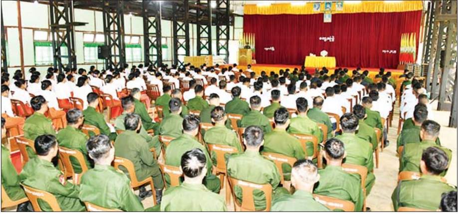
ဆေးရုံတက်ရောက်ကုသနေသည့် စစ်သည်များအား ရင်းရင်းနှီးနှီး (ကြည်း)မှ ဒုတိယဗိုလ်ချုပ်ကြီး စိုးတင်နိုင်နှင့်အတူ လဟယ်မြို့ တွေ့ဆုံအားပေးစကားပြောကြားကာ အာဟာရဖြည့်စွက်စာများ ပေးအပ်သည်။ မိသားစုများအား ရင်းရင်းနှီးနှီးနှီးနှီးတွေ့ဆုံဆက်ကာ စားသောက်ဖွယ်ရာများ ပေးအပ်ခဲ့ကြောင်းသတင်းရရှိသည်။ သတင်းစဉ်

ဆက်လက်၍ ပြည်ထောင်စုဝန်ကြီးသည် တပ်နယ်အတွင်း လှည့်လည် ကြည့်ရှုစစ်ဆေးပြီး နယ်မြေခံတပ်မတော်ဆေးရုံသို့ သွားရောက်၍