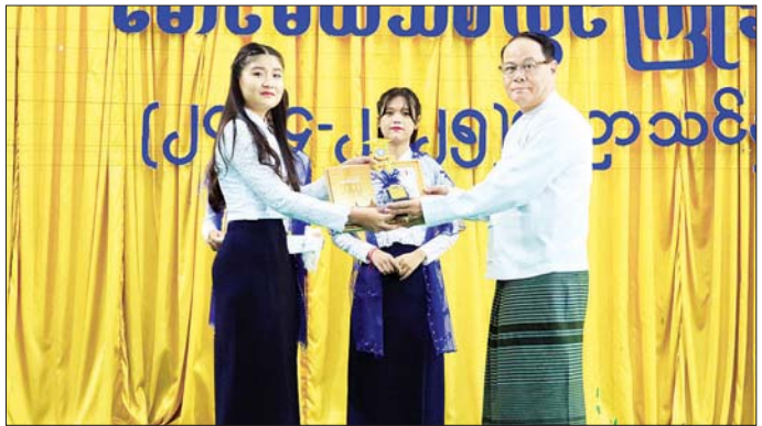
ပြောကြားပြီး ပြည်နယ်ဝန်ကြီးချုပ်နှင့် တာဝန်ရှိသူ စွာ တွေ့ဆုံနှုတ်ဆက်၍ အားပေးစကားများများသည် မောင်မယ်သစ်လွင် ကျောင်းသား ပြောကြားခဲ့ကြောင်း သိရသည်။ ကျောင်းသူများအား ရင်းနှီးနှေးနှေး စောမျိုးမင်းသိန်း(ပြန်/ဆက်)

ပါမောက္ခချုပ် ဒေါက်တာအောင်စော်လတ်က သင်ကြားသင်ယူနေမှု အခြေအနေများကို ရှင်းလင်းတင်ပြပြီး နည်းပညာတက္ကသိုလ်ကျောင်းသားကျောင်းသူများက တိုင်းရင်းသားတို့၏ ရိုးရာယဉ်ကျေးမှုအကအလှများဖြင့် သီဆိုကပြပျော်မြေကြကတက္ကသိုလ် King & Queen ကို ရွေးချယ်ကြသည်။ ယင်းနောက် ပြည်နယ်ဝန်ကြီးချုပ်၊ ပြည်နယ်တရားလွှတ်တော်တရားသူကြီးချုပ် ဦးညွန့်လင်း၊ ပြည်နယ်အစိုးရအဖွဲ့ဝင်များနှင့် တာဝန်ရှိသူများက ၂၀၂၃-၂၀၂၄ ပညာသင်နှစ်မှ ပထမနှစ်၊ ဒုတိယနှစ်၊ တတိယနှစ်၊ စတုတ္ထနှစ် အောင်မြင်ခဲ့ကြသော ထူးချွန်ကျောင်းသား ကျောင်းသူများနှင့် တက္ကသိုလ် King & Queen ရရှိကြသူများအား ဆုများ ပေးအပ်ချီးမြှင့်ကြသည်။ (ယာဝု) ဆက်လက်၍ ၂၀၂၄-၂၀၂၅ ပညာသင်နှစ်မှ ပထမနှစ်ကျောင်းသား ကျောင်းသူများကိုယ်စား ကျောင်းသူတစ်ဦးက ကျေးဇူးတင်စကား ပြန်လည်