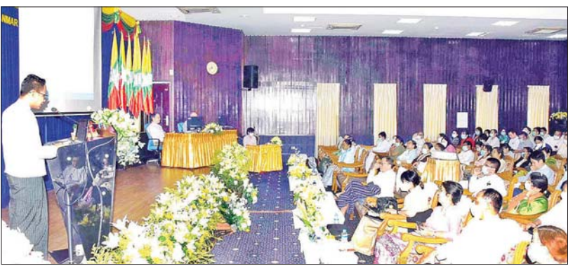
(၅၃)ကြိမ်မြောက် မြန်မာနိုင်ငံ ကျန်းမာရေးဆိုင်ရာသုတေသနညီလာခံ စာတမ်းဖတ်ပွဲကျင်းပစဉ်။

ကျန်းမာရေးဝန်ကြီးဌာန၏ ပင်မမဏ္ဍိုင် လုပ်ငန်းကြီးတစ်ရပ်ဖြစ်သော ကျန်းမာရေး သတင်းအချက်အလက်များကို ဖြန့်ဝေရာတွင် အရေးပါသောလုပ်ငန်းစဉ်တစ်ရပ်ဖြစ်သည့် “မြန်မာနိုင်ငံကျန်းမာရေးဆိုင်ရာ သုတေသနညီလာခံ”ကို နှစ်စဉ် ဇန်နဝါရီလတွင် ကျင်းပလာခဲ့သည်မှာ ယခုအခါ (၅၃)ကြိမ်တိုင်ခဲ့ပြီဖြစ်ပါသည်။ ကျန်းမာရေးဝန်ကြီးဌာနက ကြီးမှူး၍ “သုတေသနညီလာခံများ အစဉ်အလာမပျက် ကျင်းပခြင်းအားဖြင့် ကျန်းမာရေးဆိုင်ရာအသိပညာများ တိုးတက်လာပြီး ကျန်းမာရေးစောင့်ရှောက်မှုအဆင့်အတန်းမြင့်မားလာစေရန်” နှင့် “သုတေသနတွေ့ရှိချက်များကို လက်တွေ့အသုံးပြုမည့် ကျန်းမာရေးပညာရှင်များ သိရှိဆွေးနွေးနိုင်စေရန်” စသည့် ရည်ရွယ်ချက်များဖြင့် “(၅၃)ကြိမ်မြောက် မြန်မာနိုင်ငံကျန်းမာရေးဆိုင်ရာ သုတေသနညီလာခံ” ကို ၂၀၂၅ ခုနှစ် ဇန်နဝါရီလ ၂၀ ရက်နေ့မှ ၂၄ ရက်နေ့အထိ ရန်ကင်းမြို့၊ ဒဂုံမြို့နယ် အမှတ်-၅ ဇီဝကလမ်းရှိ ဆေးသုတေသနဦးစီးဌာန (ရုံးချုပ်) တွင် ကျင်းပမည်ဖြစ်ပါသည်။ မြန်မာ့သုတေသီများ၏ ကျန်းမာရေး သုတေသနလုပ်ငန်းများမှာ တွေ့ရှိချက်ရလဒ်များကို သုတေသနစာတမ်းများဖြင့် ဖတ်ကြားတင်သွင်းခြင်း၊ ပုံစံတူများပြသခြင်းတို့ဖြင့် ညီလာခံကို ကျင်းပဆောင်ရွက်သွားမည်ဖြစ်ပါသည်။ ၁၉၆၅ ခုနှစ်မှစ၍ ပထမအကြိမ် ညီလာခံကြီးကို စတင်ကျင်းပခဲ့ရာ သမိုင်းကြောင်းကို လေ့လာကြည့်ပါက စတင်ကျင်းပခဲ့သော နှစ်များတွင် သုတေသနစာတမ်းများကိုသာ တင်သွင်းဖတ်ကြားခဲ့သော်လည်း ၁၉၉၁ ခုနှစ်မှစ၍ သုတေသနပုံစံတူပြပွဲကို ထည့်သွင်းခဲ့ပြီး ထပ်မံ၍ ၂၀၀၂ ခုနှစ်မှ စတင်ကာ ပညာရှင်ဆိုင်ရာ နှီးနှောဖလှယ်ဆွေးနွေးပွဲ (Symposium) များကိုလည်း ကျယ်ကျယ်ပြန့်ပြန့် ထည့်သွင်းကျင်းပခဲ့ပါသည်။ တစ်ဖန် သုတေသီပညာရှင်များ၏ သုတေသနအရည်အသွေးများ ပိုမိုတိုးတက်ကောင်းမွန်လာစေရန်နှင့်