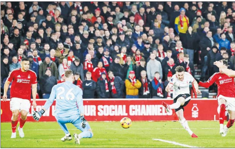
လီဗာပူးအသင်းမှ လူစားဝင်တိုက်စစ်ကစားသမား ဂျီတာ နော်တင်ဟမ်အသင်းဘက်သို့ ဂိုးသွင်းယူရန် ကြိုးပမ်းစဉ်။

ပရီမီယာလိဂ်ပွဲစဉ် (၂၁) မှ စိတ်ဝင်စားဖွယ်ရာ အကောင်းဆုံးပွဲစဉ်တစ်ပွဲဖြစ်သည့် နော်တင်ဟမ်ဖော့ရက်စ်နှင့် လီဗာပူးအသင်းပွဲစဉ်ကို ဇန်နဝါရီ ၁၅ ရက် နံနက် ၂ နာရီခွဲက ယှဉ်ပြိုင်ကစားခဲ့ရာ တစ်ဖက်တစ်ရိုးစီဖြင့် ပွဲပြီးဆုံးခဲ့သည်။ ယခုနှစ်ရာသီတွင် ပုံမှန်ခြေစွမ်းပြသထားနိုင်သည့် နော်တင်ဟမ်အသင်းသည် အသင်းကြီး လီဗာပူးကို အကောင်းဆုံးတုံ့ပြန်ကစားကာ ပွဲကစားချိန် ၆ မိနစ်တွင် ရရှိခဲ့သော အဓိက တိုက်စစ်ကစားသမား ခရစ္စတိုဇ်၏ သွင်းဂိုးဖြင့် မိနစ် ၆၀ ကျော်အထိ ဦးဆောင်ကစားနိုင်ခဲ့သည်။ လီဗာပူးအသင်းသည် နော်တင်ဟမ်အသင်းကို ဘောလုံးပိုင်ဆိုင်မှုအသွား၊ ဂိုးပေါက် ခြိမ်းခြောက်မှုအသွားဖြင့် တစ်ဖက်သတ်ဖိအားပေးကစားနိုင်ခဲ့သော်လည်း ရရှိလာသည့် အပိုင်အခွင့်အရေးများကို အသင်းကစားသမားများ ဂိုးအဖြစ် စာမျက်နှာ ၁၃ ကော်လံ ၅ ၀