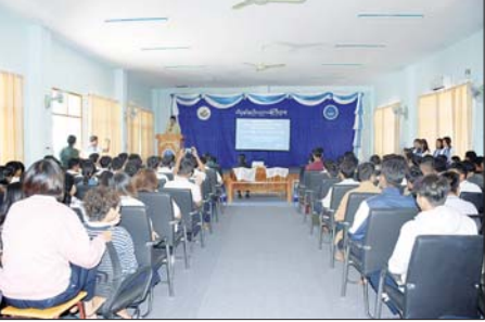
ဂုဏ်ပြုမှတ်တမ်းလွှာများ ပေးအပ် သည့် အစိုးရစက်မှုလက်မှု သိပ္ပံ (တောင်ငူ) ၌ လက်သမားအတတ် ပညာ ကာလတိုသင်တန်းကို ဇန်နဝါရီ ၁၇ ရက်မှ ၂၆ ရက်အထိ စာတွေ့လက်တွေ့ အခမဲ့ ပို့ချ သင်ကြား ပေးသွားမည်ဖြစ်ပြီး တောင်ငူခရိုင်အတွင်းရှိ မြို့နယ် များမှ သင်တန်းသား ၂၀ တက် ရောက် သင်ကြားလျက်ရှိကြောင်း သိရသည်။ ဇော်ကိုကို (တောင်ငူ)

သိပ္ပံ (တောင်ငူ) ကျောင်းအုပ်ကြီး က သင်တန်းဖွင့်လှစ်ခြင်း ရည်ရွယ်ချက်ကို ပြောကြားကာ မြို့ပြအင်ဂျင်နီယာဌာန ဌာနမှူး ဒေါ်ဆုလဒါဒိန်းက သင်ထောက် ကူပစ္စည်းများ ပေးအပ်သည်။ ထို့နောက် အစိုးရစက်မှုလက်မှု သိပ္ပံ (တောင်ငူ) မှ ဖွင့်လှစ်ခဲ့သည့် ကာလတိုသင်တန်းနှင့် National Grassroots Innovation Competition ပြိုင်ပွဲမှ မှတ်တမ်း ဗီဒီယိုကိုပြသပြီး တာဝန်ရှိသူများ က National Grassroots Inno- vation Competition ပြိုင်ပွဲတွင် Winner နှင့် First Runner Up ရရှိခဲ့သော ဆရာ ဆရာမများနှင့် ကျောင်းသား ကျောင်းသူများအား