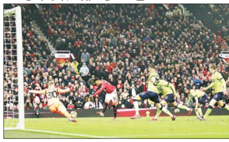
မန်ယူတောင်ပံတိုက်စစ်ကစားသမား ဒီယယ်လို ဆောက်သစ်တန် အသင်းဘက်သို့ ဂိုးသွင်းယူစဉ်။

သည် ယခုပွဲစဉ် ရုံးနိမ့်ခဲ့သည့် အတွက် ပရီမီယာလိဂ်တွင် ၂၁ ပွဲ ကစားပြီး ရုံးပွဲ ၁၇ ပွဲရှိလာပြီ ဖြစ် သည်။ မန်ယူအသင်းက ၂၁ ပွဲ ကစားပြီး နိုင်ပွဲ ၁၃ ပွဲ၊ ပွဲရိုက်ပွဲ ၆ ပွဲ၊ ပွဲရှုံးပွဲ ၂ ပွဲ ရှိခဲ့သည်။ အခြားပွဲစဉ် ရလဒ်တွင် ခြေစွမ်း ထက်မြက်မှုရှိသည့် ဘရိုက်တန်က တန်းဆင်းစုနိမ့် အစီဆွဲစက်ကို နှစ်ဂိုးပြတ် နိုင်ပွဲရရှိ ခဲ့သည်။ အောင်ဇော်