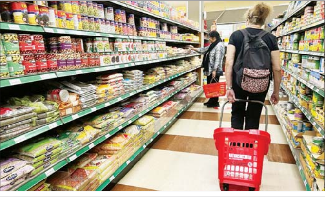
ကနေဒါနိုင်ငံ အွန်တေရီယိုပြည်နယ်ရှိ ကုန်စုံဆိုင်တစ်ခုတွင် ဈေးဝယ်သူများကို တွေ့ရစဉ်။

အော့တဝါ ဇန်နဝါရီ ၁၇ အမေရိကန်သမ္မတအဖြစ် ရွေးကောက်ခံထားရသည့် ဒေါ်နယ် ထရမ်က ၎င်း၏ကတိအတိုင်း ကနေဒါ ကုန်ပစ္စည်းများအပေါ် အခွန်စည်းကြပ်မှု ၂၅ ရာခိုင်နှုန်းပြုလုပ်ပါက ကနေဒါနိုင်ငံသည်လည်း လက်တုံ့ပြန်အခွန်စည်းကြပ်မှု ပြုလုပ်ရန် ပြင်ဆင်ထားကြောင်း သိရသည်။ ကနေဒါဒေါ်လာ၁၅၀၀၀၀၀၀၀ တန်ကြေးရှိ အမေရိကန် ကုန်ပစ္စည်းအပေါ် အခွန်စည်းကြပ်မှု သက်ရောက်မှုရှိမည်။ အဆိုပါပဏာမသည် အမေရိကန်ဒေါ်လာ ၁၀၀ ဘီလီယံရှိပြီး ကနေဒါ၏ အိမ်နီးချင်းနိုင်ငံဆီက တင်သွင်းမှု သုံးပုံတစ်ပုံနှင့် ညီမျှသည်။ အခွန်စည်းကြပ်မှု ပြုလုပ်နိုင်ခြေရှိသည့် အမေရိကန် ကုန်ပစ္စည်းစာရင်းအကြမ်းကို ကနေဒါက စာရင်းပြုစုထားသည်ဟု