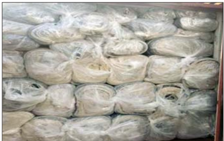
သီလဝါဆိပ်ကမ်း၌ ဖမ်းဆီးရမိမှု။

ဇန်နဝါရီ ၁၆ ရက်တွင် စစ်ကိုင်းတိုင်းဒေသကြီး တရားမဝင်ကုန်သွယ်မှုတိုက်ဖျက်ရေးအဖွဲ့အဖွဲ့၏ စီမံခန့်ခွဲမှုဖြင့် တာဝန်ကျပူးပေါင်းအဖွဲ့က စစ်ဆေးမှုများ ဆောင်ရွက်ခဲ့ရာ စစ်ကိုင်းမြို့ ရတနာပုံတံတား ပူးပေါင်းစစ်ဆေးရေးဂိတ်၌ တရားဝင်စာရွက်စာတမ်းအထောက်အထား တင်ပြနိုင်ခြင်းမရှိသည့် လုပ်ငန်းသုံးပစ္စည်း သုံးမျိုး စုစုပေါင်း