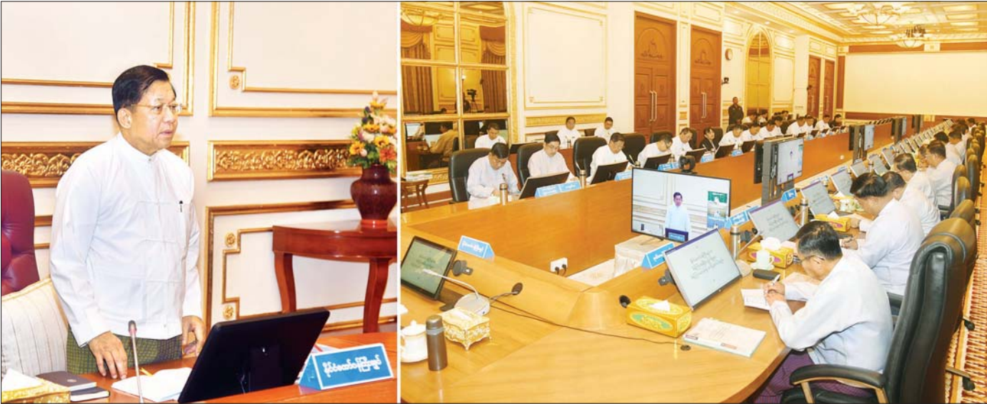
နိုင်ငံတော်စီမံအုပ်ချုပ်ရေးကောင်စီဥက္ကဋ္ဌ နိုင်ငံတော်ဝန်ကြီးချုပ် ဗိုလ်ချုပ်မှူးကြီး မင်းအောင်လှိုင် ပြည်ထောင်စုအစိုးရအဖွဲ့အစည်းအဝေးတွင် အမှာစကားပြောကြားစဉ်။

နိုင်ငံတော်စီမံအုပ်ချုပ်ရေးကောင်စီဥက္ကဋ္ဌ နိုင်ငံတော်ဝန်ကြီးချုပ် ဗိုလ်ချုပ်မှူးကြီး မင်းအောင်လှိုင် ပြည်ထောင်စုအစိုးရအဖွဲ့အစည်းအဝေးသို့ တက်ရောက်အမှာစကားပြောကြား အကြမ်းဖက်သမားများ၏ တိုက်ခိုက်မှုများကြောင့် ယာယီနေရပ်စွန့်ခွာနေကြရသည့် ပြည်သူများအတွက် အမျိုးသားသဘာဝဘေးအန္တရာယ်ဆိုင်ရာစီမံခန့်ခွဲရေးရန်ပုံငွေမှ လိုအပ်သည့်ထောက်ပံ့မှုများ ဆောင်ရွက်ပေးရန်စီစဉ်ဆောင်ရွက်