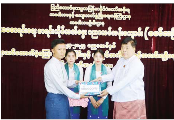
အသင်းများက မိမိတို့ လုပ်ငန်းခွင်အလိုက် အလုပ်အကိုင်ရရှိရေး ဆောင်ရွက်ပေးနိုင်မည့် အခြေအနေများကို မိတ်ဆက်ရှင်းလင်း ဆွေးနွေးပြီး ကျောင်းသား ကျောင်းသူများ ကိုယ်စား ကျောင်းသူတစ်ဦးက သင်ကြား တတ်မြောက်မှုနှင့် စပ်လျဉ်း၍ ရင်းလင်းတင်ပြ သည်။ ခရိုင်(ပြန်/ဆက်)

မော်လမြိုင် ဇန်နဝါရီ ၁၇ မွန်ပြည်နယ် မော်လမြိုင်မြို့ သမဝါယမ စာရင်းရေးစာရင်းကိုင် သက်မွေးပညာ သင်တန်းကျောင်း၏ ၂၀၂၄ - ၂၀၂၅ ပညာသင် နှစ်တွင် တက်ရောက်ပညာသင်ကြားလျက် ရှိသော ကျောင်းသား ကျောင်းသူများအား ပညာသင်ကြေးပေးအပ်ခြင်းနှင့် ဒုတိယနှစ် ကျောင်းသား ကျောင်းသူများအား အလုပ် အကိုင်အခွင့်အလမ်းရရှိရေး မိတ်ဆက် အခမ်း အနားကို သက်မွေးပညာသင်တန်းကျောင်း ခန်းမ(ရာမညဆောင်)၌ ဇန်နဝါရီ ၁၆ ရက်က ကျင်းပသည်။ အခမ်းအနားတွင် ပြည်နယ် လမ်းပန်း ဆက်သွယ်ရေးဝန်ကြီး ဦးတင်စန်းနိုင်က အမှာစကားပြောကြားပြီး ပညာသင်ကြေး များ ပေးအပ်ရာ ကျောင်းသားတစ်ဦးက လက်ခံယူသည်။ ဆက်လက်ပြီး မွန်ပြည်နယ်အတွင်းရှိ စီးပွားရေးလုပ်ငန်းရှင်များနှင့် သမဝါယမ