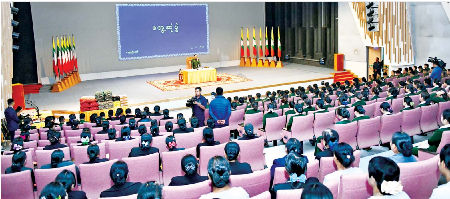
နိုင်ငံတော်စီမံအုပ်ချုပ်ရေးကောင်စီဥက္ကဋ္ဌ တပ်မတော်ကာကွယ်ရေးဦးစီးချုပ် ဗိုလ်ချုပ်မှူးကြီးမင်းအောင်လှိုင် တပ်မတော်ရုပ်မြင်သံကြားထုတ်လွှင့်ရေးတပ်(တောင်ညို)၌ တာဝန်ထမ်းဆောင်လျက်ရှိသည့် အရာရှိ၊ စစ်သည်များနှင့် ဝန်ထမ်းများအား တွေ့ဆုံအမှာစကားပြောကြားစဉ်။

ယနေ့ခေတ်သည် ပညာခေတ် ဖြစ်ပြီး အတန်းပညာတတ်မြောက်မှသာလျှင် အတတ်ပညာများကို သင်ယူ တတ်မြောက်နိုင်မည် ဖြစ်ကြောင်း၊ တပ်မတော်အနေဖြင့် တပ်မတော်သားများ၏ ပညာရည် မြင့်မားရေးအတွက် ပညာရေး သင်တန်းကျောင်းများ ဖွင့်လှစ်၍ မြှင့်တင်ပေးလျက် ရှိကြောင်း၊ ထို့ပြင် တပ်မတော်သားမိသားစုဝင် သားသမီးများ၏ ပညာရေးကို အမြဲမပြတ် အားပေးလျက်ရှိပြီး ထူးချွန်စွာ အောင်မြင်သူများကို လည်း ဂုဏ်ပြုချီးမြှင့်ခြင်းများ ပြုလုပ်ပေးလျက်ရှိကြောင်း။ သက်သာ ချောင်ချီရေးနှင့်