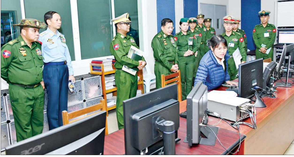
နိုင်ငံတော်စီမံအုပ်ချုပ်ရေးကောင်စီဥက္ကဋ္ဌ တပ်မတော်ကာကွယ်ရေးဦးစီးချုပ် ဗိုလ်ချုပ်မှူးကြီးမင်းအောင်လှိုင် တပ်မတော် ရုပ်မြင်သံကြား ထုတ်လွှင့်ရေးတပ်(တောင်ညို)တွင် ကြည့်ရှုစစ်ဆေးစဉ်။

★ ရှေ့ဖို့မှ ရှင်းလင်းတင်ပြမှုများ အပေါ် နိုင်ငံတော်စီမံအုပ်ချုပ်ရေးကောင်စီ ဥက္ကဋ္ဌ တပ်မတော်ကာကွယ်ရေး ဦးစီးချုပ်က သင်တန်းသားများကို သင်ကြားလေ့ကျင့်ပေးရာ၌စာပေ ပိုင်းဆိုင်ရာများကို အမှန်တကယ် သိရှိနားလည်မှုရှိအောင် သင်ကြား ပေးရမည်ဖြစ်သကဲ့သို့ လက်တွေ့ လေ့ကျင့်မှုများကိုလည်း ကျွမ်းကျင် ပိုင်နိုင်စွာ ဆောင်ရွက်နိုင်ရေး လေ့ကျင့်ပေးရမည် ဖြစ်ကြောင်း၊ ကြံ့ခိုင်ရေးလေ့ကျင့်မှုများ ဆောင် ရွက်ရာတွင် အသက်အရွယ် အဆင့်အလိုက် သတ်မှတ်ထား သည့် စံချိန်စံနှုန်းများအတိုင်း ပြည့်မီအောင် လေ့ကျင့်ပေးရန် လိုကြောင်း၊ ခေတ်နှင့်အညီ ပြောင်းလဲ တိုးတက်လာသည့် စစ်နည်းဗျူဟာများ၊ စစ်လက်နက် ပစ္စည်းများ၊ စစ်အတတ်ပညာများ ကို စဉ်ဆက်မပြတ် သုတေသနပြု လေ့လာ၍ သင်ခန်းစာများ တိုးချဲ့သင်ကြား ပို့ချပေးသွားရန် လိုကြောင်း၊ အရည်အချင်းပြည့်ဝ ပြီး လက်တွေ့နယ်ပယ်တွင် ကာကွယ်ရေးနှင့် လုံခြုံရေးတာဝန် များကို ပိုင်နိုင်စွာ ထမ်းဆောင်နိုင် ရေး သင်တန်းသားများကို စနစ် တကျလေ့ကျင့် မွေးထုတ်ပေးနိုင် ရမည်ဖြစ်ကြောင်း မှာကြားသည်။ ထို့နောက် နိုင်ငံတော်စီမံ