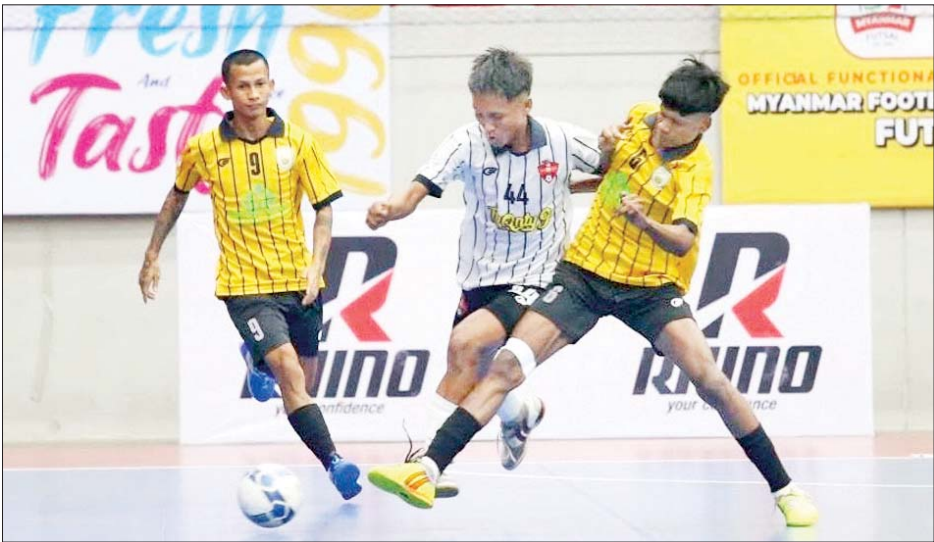
TG United အသင်းနှင့် Gold Dream အသင်းတို့ ယှဉ်ပြိုင်ကစားကြစဉ်။

ပွဲစဉ် (၆) တွင် 7 Dragon အသင်းက 7 Brother အသင်းကို လေးဂိုး-သုံးဂိုး၊ KKY အသင်းက လက်ဝဲသန္ဓေအသင်းကို ငါးဂိုး- သုံးဂိုး၊ Black Cross အသင်းက Maryar အသင်းကို ငါးဂိုး-တစ်ဂိုး၊ YCDC Marga Youth အသင်းက ရွှေပြည်သာ ယူနိုက်တက်အသင်း ကို ငါးဂိုး-နှစ်ဂိုး၊ JZ Yangon အသင်းက Pacific Sun Far အသင်းကို လေးဂိုး-သုံးဂိုး၊ TG United အသင်းက Gold Dream အသင်းကို ငါးဂိုး-တစ်ဂိုးဖြင့် အနိုင် ရရှိသည်။ ပွဲစဉ် (၆)အပြီးတွင် TG United အသင်းက ၁၅ မှတ်ဖြင့် စာမျက်နှာ ၁၅ ကော်လံ ၁ သို့ *