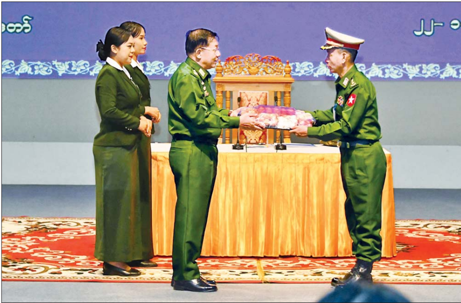
နိုင်ငံတော်စီမံအုပ်ချုပ်ရေးကောင်စီဥက္ကဋ္ဌ တပ်မတော်ကာကွယ်ရေးဦးစီးချုပ် ဗိုလ်ချုပ်မှူးကြီးမင်းအောင်လှိုင် တပ်မတော် ရုပ်မြင်သံကြားထုတ်လွှင့်ရေးတပ်(တောင်ညို)တွင် တာဝန်ထမ်းဆောင်လျက်ရှိသည့် အရာရှိ၊ စစ်သည်၊ ဝန်ထမ်းများအတွက် စားသောက်ဖွယ်ရာပစ္စည်းများ ပေးအပ်စဉ်။

ရုပ်မြင်သံကြား ထုတ်လွှင့်ခြင်း လုပ်ငန်းများသည် လူထုဆက်ဆံရေးလုပ်ငန်းတစ်ခုပင်ဖြစ်ကြောင်း၊ ပြည်သူ့ဆက်ဆံရေးနှင့် စိတ်ဓာတ်စစ်ဆင်ရေး ညွှန်ကြားရေးမှူးရုံး၏ ရည်ရွယ်ချက်မှာ “ပြန်ကြားပေးရန်၊ ဖျော်ဖြေပေးရန်၊ ပညာပေးရန်နှင့် စည်းရုံးရန်” ဖြစ်ကြောင်း၊ နည်းမှန်လမ်းမှန် ပြန်ကြားပေးခြင်း၊ ဖျော်ဖြေပေးခြင်းနှင့် ပညာပေးခြင်းတို့ကို ဆောင်ရွက်မှုသည် စည်းရုံးရေးကို ဆောင်ရွက်ခြင်းပင်ဖြစ်ကြောင်း၊ ထို့ကြောင့် အကျိုးရှိအောင် ဆောင်ရွက်ရန်နှင့် အကျိုးပြုသည့်လုပ်ငန်းတစ်ရပ်ဖြစ်အောင် ဆောင်ရွက်ရန်လိုကြောင်း၊ မိမိတို့မသိရှိသေးသည့် အကြောင်းအရာနှင့် အသိပညာဗဟုသုတများကို ထုတ်လွှင့်ပေးခြင်းသည် ပညာပေးခြင်းပင်ဖြစ်ကြောင်း၊ အလားတူကျန်းမာရေး အသိပညာပေးခြင်းသည်လည်း အရေးကြီးသဖြင့် ကျန်းမာရေး အသိပညာပေးအစီအစဉ်များကို အလေးထားထုတ်လွှင့်ပေးရန်လိုပြီး အရွယ်သုံးပါးစလုံး သာမန်အားဖြင့် နားလည်နိုင်သည့် အစီအစဉ်များ