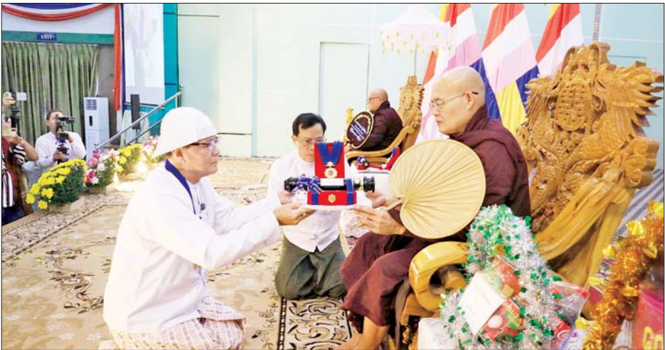
ဌာနဆိုင်ရာ၊ ဆရာတော်ကြီးများ၏ တပည့်ဒါယကာ ဒါယိကာမများ တက်ရောက်ကြသည်။ ဦးစွာ နမောတဿ သုံးကြိမ်ရွတ်ဆိုဘုရားကန်တော့၍ အခမ်းအနားကိုဖွင့်လှစ်ပြီး ဒုတိယ မြိုင်ကြီးငူဆရာတော် ဘဒ္ဒန္တဉာဏိကထံမှ ငါးပါးသီလခံယူဆောက်တည်ကြကာ ဆရာတော်အရှင်သူမြတ်တို့ထံမှ ပရိတ်တရားတော်များကို နာယူကြည်ညိုကြသည်။

ဘားအံ ဇန်နဝါရီ ၂၂ နိုင်ငံတော်စီမံအုပ်ချုပ်ရေးကောင်စီက ၂၀၂၅ ခုနှစ် (၇၇)နှစ်မြောက် လွတ်လပ်ရေးနေ့ အထိမ်းအမှတ် ဂုဏ်ထူးဆောင်ဘွဲ့များ ချီးမြှင့်အပ်နှင်းရာတွင် ပါဝင်ခဲ့သော ကရင်ပြည်နယ်မှ ဆရာတော်ကြီးနှစ်ပါးအား ယနေ့မွန်းလွဲ ၂ နာရီက ဘားအံမြို့ ဇွဲကပင်ခန်းမ၌ ကရင်ပြည်နယ်အစိုးရအဖွဲ့က သီရိပျံချီဂုဏ်ထူးဆောင်ဘွဲ့ကို ဆက်ကပ်ချီးမြှင့်အပ်နှင်းသည်။ ဂုဏ်ထူးဆောင်ဘွဲ့ ဆက်ကပ်ခြင်းမင်္ဂလာအခမ်းအနားသို့ မြိုင်ကြီးငူနန်းဦးဘေးမဲ့ကျောင်းတိုက် ဦးစီးပဓာန နာယက ဒုတိယမြိုင်ကြီးငူဆရာတော် ဘဒ္ဒန္တဉာဏိက၊ လမင်းပရိယတ္တိစာသင်တိုက်ဆရာတော် ဘဒ္ဒန္တကေသရိန္ဒ၊ ကရင်ပြည်နယ် ဝန်ကြီးချုပ် သီရိပျံချီဦးစောမြင့်ဦး၊ ပြည်နယ်အမျိုးသမီးရေးရာအဖွဲ့ နာယက၊ ပြည်နယ်တရားလွှတ်တော်တရားသူကြီးချုပ်၊ ပြည်နယ်အစိုးရအဖွဲ့ဝင်များ၊ ပြည်နယ်အဆင့်