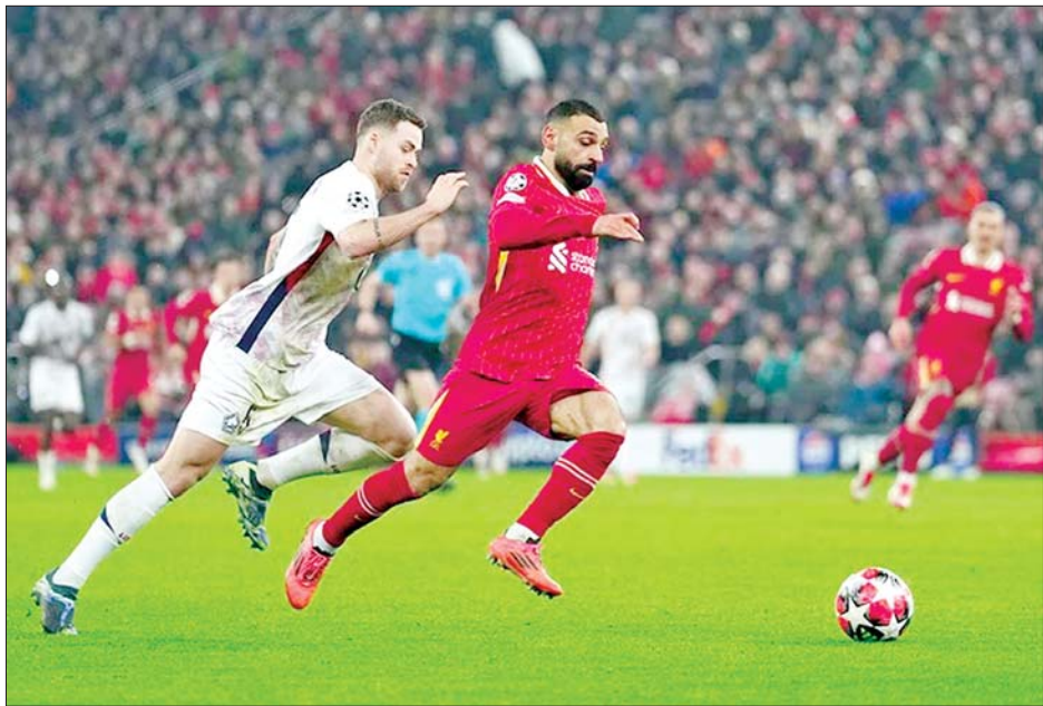
လီဗာပူးအသင်းနှင့် လိုင်လီအသင်းတို့ ယှဉ်ပြိုင်ကစားကြစဉ်။

လီဗာပူးအသင်းဟာ ဇန်နဝါရီ ၂၂ ရက် နံနက် ပိုင်းက ယှဉ်ပြိုင်ကစားခဲ့တဲ့ လိုင်လီအသင်းနဲ့ပွဲစဉ်မှာ နှစ်ဂိုး-တစ်ဂိုးနဲ့အနိုင်ရရှိခဲ့တာကြောင့် ချန်ပီယံလိဂ် ၁၆ သင်းအဆင့်ကို တက်လှမ်းခွင့်ရရှိခဲ့ပြီ ဖြစ်ပါတယ်။