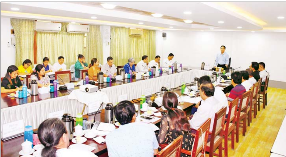
ပြည်ထောင်စုဝန်ကြီး ဦးမောင်မောင်အုန်း ၂၀၂၄ ခုနှစ်အတွက် မြန်မာ့ရုပ်ရှင်ထူးချွန်ဆုချီးမြှင့်ပွဲအခမ်းအနားကျင်းပရေးနှင့်ပတ်သက်၍ လုပ်ငန်းညှိနှိုင်းအစည်းအဝေးတွင် အမှာစကားပြောကြားစဉ်။

ရန်ကုန် ဇန်နဝါရီ ၂၂ ပြန်ကြားရေးဝန်ကြီးဌာန ပြည်ထောင်စုဝန်ကြီး ဦးမောင်မောင်အုန်းသည် ယနေ့နံနက် ၁၀ နာရီတွင် ရန်ကုန်မြို့ အင်းစိန်မြို့နယ် အောင်ဆန်းဒေသရှိ ပုံနှိပ်ရေးနှင့် ထုတ်ဝေရေးဦးစီးဌာန ပုံနှိပ်စက်ရုံများ၌ ကျောင်းသုံးစာအုပ်များ ရိုက်နှိပ်နေမှုကို သွားရောက် ကြည့်ရှုစစ်ဆေးသည်။ ဦးစွာ ပြည်ထောင်စုဝန်ကြီးအား ဂျီတီစီပုံနှိပ်စက်ရုံအစည်းအဝေးခန်းမ၌ ပုံနှိပ်ရေးနှင့်ထုတ်ဝေရေး ဦးစီးဌာန ညွှန်ကြားရေးမှူးချုပ်က အောင်ဆန်းဒေသရှိ ပုံနှိပ်ရေးနှင့် ထုတ်ဝေရေးဦးစီးဌာန အောင်ဆန်းပုံနှိပ်စက်ရုံ၊ ဂျီတီစီပုံနှိပ်စက်ရုံနှင့် စာပေဗိမာန်ပုံနှိပ်စက်ရုံတို့မှ ပုံနှိပ်လုပ်ငန်းများ ဆောင်ရွက်နေမှုအခြေအနေများကို ရှင်းလင်းတင်ပြသည်။ ထို့နောက် ပြည်ထောင်စုဝန်ကြီးက ပုံနှိပ်လုပ်ငန်းနှင့်ပတ်သက်၍ ပညာရေးဝန်ကြီးဌာနက ပုံနှိပ်ရန် အပ်နှံထားသည့် ကျောင်းသုံးစာအုပ်များ အပြင် ဝန်ကြီးဌာနအသီးသီးကလည်း ပုံနှိပ်ရန် အမှာစာများ ရရှိထားပြီးဖြစ်သဖြင့် လုပ်ငန်းများအားလုံး သတ်မှတ်ထားသည့်အချိန်ပြီးစီးရန် လိုအပ်ကြောင်း၊ လုပ်ငန်းခွင်တွင် အခက်အခဲစိန်ခေါ်မှုများ ရှိပါက ပေါင်းစပ်ညှိနှိုင်း ဆောင်ရွက်သွားရမည်ဖြစ်ကြောင်း၊ ဝန်ထမ်းများအနေဖြင့် အဆင့်ဆင့်တာဝန်ယူမှု၊ တာဝန်ခံမှု နားလည်မှု၊ ယုံကြည်မှုတို့ဖြင့် လုပ်ဆောင်ရန် လိုအပ်ကြောင်း၊ ဝန်ထမ်းများသည် ယနေ့နိုင်ငံတွင် ဖြစ်ပေါ်နေသည့်အခြေအနေမှန်များကို သိရှိနားလည်ရန် လိုအပ်ကြောင်း ပြောကြားသည်။ ယင်းနောက် ပြည်ထောင်စုဝန်ကြီးသည် ဂျီတီစီပုံနှိပ်စက်ရုံ၊ အောင်ဆန်းပုံနှိပ်စက်ရုံနှင့် စာပေဗိမာန်