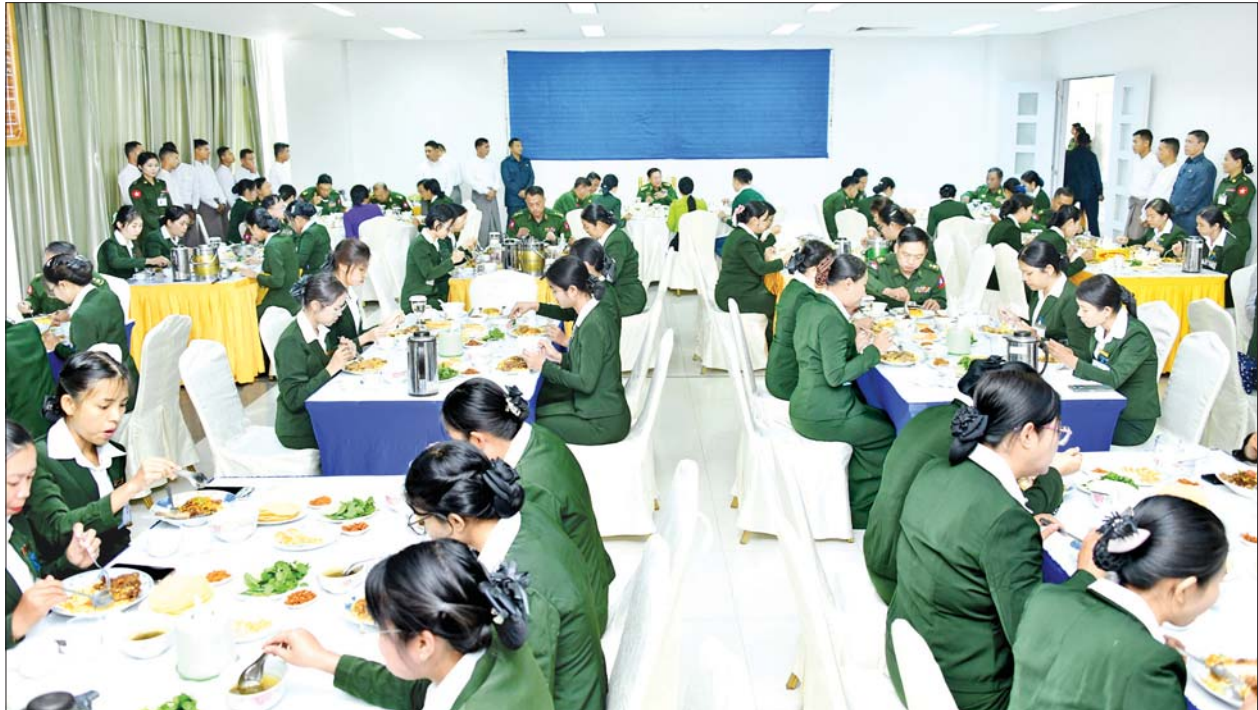
နိုင်ငံတော်စီမံအုပ်ချုပ်ရေးကောင်စီဥက္ကဋ္ဌ တပ်မတော်ကာကွယ်ရေးဦးစီးချုပ် ဗိုလ်ချုပ်မှူးကြီးမင်းအောင်လှိုင်နှင့်အဖွဲ့ဝင်များ တပ်မတော်ရုပ်မြင်သံကြားထုတ်လွှင့်ရေးတပ်(တောင်ညို)၌ အရာရှိ၊ စစ်သည်များ၊ ဝန်ထမ်းများနှင့်အတူ နေ့လယ်စာသုံးဆောင်စဉ်။

သုံးဆောင်ကြသည်။ ယင်းနောက် အစည်းအဝေးခန်းမတွင် တပ်မတော် ရုပ်မြင်သံကြား ထုတ်လွှင့်ရေးတပ် (တောင်ညို)တပ်မှူးက တပ်သမိုင်းအကျဉ်း၊ နိုင်ငံတော်စီမံအုပ်ချုပ်ရေးကောင်စီဥက္ကဋ္ဌ တပ်မတော် ကာကွယ်ရေးဦးစီးချုပ်၏လမ်းညွှန် မှာကြားချက်များအပေါ် အကောင်အထည်ဖော် ဆောင်ရွက်ပြီးစီးမှု၊ နေ့စဉ် ပြည်တွင်း၊ ပြည်ပသတင်းများအပါအဝင် အခြားသော ဗဟုသုတဖြစ်ဖွယ်၊ စိတ်ဝင်စားဖွယ်အစီအစဉ်များစွာကို ထုတ်လွှင့်ပေးလျက်ရှိမှုတို့နှင့် ပတ်သက်၍ ရှင်းလင်းတင်ပြကြသည်။ ရှင်းလင်းတင်ပြမှုများ အပေါ် နိုင်ငံတော် စီမံအုပ်ချုပ်ရေးကောင်စီဥက္ကဋ္ဌ တပ်မတော် ကာကွယ်ရေးဦးစီးချုပ်က ရုပ်သံထုတ်လွှင့်မှုလုပ်ငန်းများ ဆောင်ရွက်ရာတွင် အခြားပြည်တွင်း၊ ပြည်ပ သတင်းဌာနများမှ ထုတ်လွှင့်နေမှုများကို ကြည့်ရှုလေ့လာ၍ မိမိတို့ရုပ်သံထုတ်လွှင့်မှုများ၏ အားနည်းချက်၊ အားသာချက်များကို သင်ခန်းစာဖော်ထုတ်ပြီး စာမျက်နှာ ၅ သို့ ★