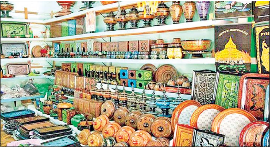
ခရီးသွားများအား ဆွဲဆောင်လျက်ရှိသည့် ပုဂံမြို့မှ ယွန်းထည်ပစ္စည်းများကို တွေ့ရစဉ်။

ယနေ့ကာလတွင် နိုင်ငံတော်က MSME ဟု ခေါ်သော အသေးစား၊ အငယ်စားနှင့် အလတ်စား စီးပွားရေးလုပ်ငန်းများနှင့် ၎င်းတို့၏ ထုတ်ကုန်များကို အထူးအားပေးလျက်ရှိသည်။