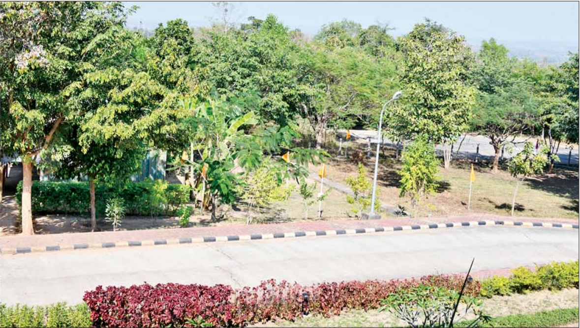
နိုင်ငံတော်စီမံအုပ်ချုပ်ရေးကောင်စီဥက္ကဋ္ဌ တပ်မတော်ကာကွယ်ရေးဦးစီးချုပ် ဗိုလ်ချုပ်မှူးကြီးမင်းအောင်လှိုင် တပ်မတော် ရုပ်မြင်သံကြားထုတ်လွှင့်ရေးတပ်(တောင်ညို)၌ ရုပ်သံပြတိုက်တည်ဆောက်ရန် မြေနေရာလျာထားမှုအား ကြည့်ရှုစစ်ဆေးစဉ်။

★ ရှေ့ဖို့မှ ရှင်းလင်းတင်ပြမှုများ အပေါ် နိုင်ငံတော်စီမံအုပ်ချုပ်ရေးကောင်စီ ဥက္ကဋ္ဌ တပ်မတော်ကာကွယ်ရေး ဦးစီးချုပ်က သင်တန်းသားများကို သင်ကြားလေ့ကျင့်ပေးရာ၌စာပေ ပိုင်းဆိုင်ရာများကို အမှန်တကယ် သိရှိနားလည်မှုရှိအောင် သင်ကြား ပေးရမည်ဖြစ်သကဲ့သို့ လက်တွေ့ လေ့ကျင့်မှုများကိုလည်း ကျွမ်းကျင် ပိုင်နိုင်စွာ ဆောင်ရွက်နိုင်ရေး လေ့ကျင့်ပေးရမည် ဖြစ်ကြောင်း၊ ကြံ့ခိုင်ရေးလေ့ကျင့်မှုများ ဆောင် ရွက်ရာတွင် အသက်အရွယ် အဆင့်အလိုက် သတ်မှတ်ထား သည့် စံချိန်စံနှုန်းများအတိုင်း ပြည့်မီအောင် လေ့ကျင့်ပေးရန် လိုကြောင်း၊ ခေတ်နှင့်အညီ ပြောင်းလဲ တိုးတက်လာသည့် စစ်နည်းဗျူဟာများ၊ စစ်လက်နက် ပစ္စည်းများ၊ စစ်အတတ်ပညာများ ကို စဉ်ဆက်မပြတ် သုတေသနပြု လေ့လာ၍ သင်ခန်းစာများ တိုးချဲ့သင်ကြား ပို့ချပေးသွားရန် လိုကြောင်း၊ အရည်အချင်းပြည့်ဝ ပြီး လက်တွေ့နယ်ပယ်တွင် ကာကွယ်ရေးနှင့် လုံခြုံရေးတာဝန် များကို ပိုင်နိုင်စွာ ထမ်းဆောင်နိုင် ရေး သင်တန်းသားများကို စနစ် တကျလေ့ကျင့် မွေးထုတ်ပေးနိုင် ရမည်ဖြစ်ကြောင်း မှာကြားသည်။ ထို့နောက် နိုင်ငံတော်စီမံ