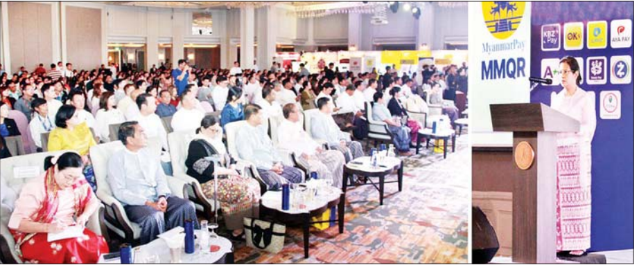
မြန်မာနိုင်ငံတော်ဗဟိုဘဏ်ဥက္ကဋ္ဌ MMQR အသုံးပြုပြီး မတူညီသည့် ဒစ်ဂျစ်တယ်ငွေပေးချေမှုများကို အပြန်အလှန်ချိတ်ဆက်ပေးချေနိုင်ခြင်းဆိုင်ရာ အသိပညာပေး မိတ်ဆက်စဉ်။

လုပ်ငန်းရှင်အသင်း၊ မြန်မာနိုင်ငံဆေးနှင့် ဆေးပစ္စည်းလုပ်ငန်းရှင်များအသင်း၊ မြန်မာစီးပွားရေးလုပ်ငန်းရှင် အမျိုးသမီးများကွန်ရက်၊ မြန်မာနိုင်ငံကွန်ပျူတာအသင်းချုပ်၊ ဘဏ်များနှင့် မိုဘိုင်းငွေကြေးရေးဝန်ဆောင်မှုလုပ်ငန်းများ၊ ရောင်းချသူကိုယ်စား ငွေကောက်ခံရင်းလင်းသည့် ဝန်ဆောင်မှုလုပ်ငန်းများ၊ မိတ်ဖက်ကုန်သည်များ၊ System Operator နှင့် နည်းပညာအကူအညီပေးသည့် ပြည်တွင်း၊ ပြည်ပအဖွဲ့အစည်းများမှ တာဝန်ရှိပုဂ္ဂိုလ်များ တက်ရောက်ကြသည်။ ဦးစွာ မြန်မာနိုင်ငံတော်ဗဟိုဘဏ်ဥက္ကဋ္ဌက MMQR အသုံးပြုခြင်းဖြင့် မည်သည့် Mobile Wallet (မိုဘိုင်းပိုက်ဆံအိတ်)ကိုမဆို အပြန်အလှန် ချိတ်ဆက်ပေးချေနိုင်သည့် လုံခြုံစွမ်းရည်ပြည့်ဝသော ငွေပေးချေမှုစနစ်တစ်ရပ် ပေါ်ပေါက်လာမည်ဖြစ်ပြီး ငွေသားကိုယ်လုံးစွဲမှုကို လျှော့ချနိုင်မည်ဖြစ်ကြောင်း၊