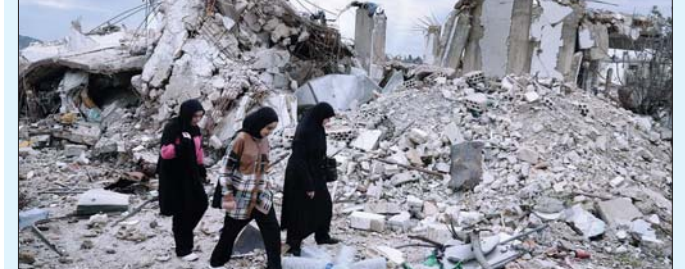
အစ္စရေးနှင့် လက်ဘနွန်နယ်စပ်ရှိ ကျေးရွာတစ်ရွာ၌ ပဋိပက္ခဖြစ်ပွားမှုကြောင့် ထိခိုက်ပျက်စီးသွားသော နေအိမ်များအားမှ လက်ဘနွန်ဒေသခံများ ဖြတ်သန်းသွားလာမှုကို ဇန်နဝါရီ ၂၆ ရက်က တွေ့ရစဉ်။

ဝါရှင်တန် ဇန်နဝါရီ ၂၇ အစ္စရေးနှင့် လက်ဘနွန်ရှိ ရှီယိုက်မှတ်စလင်အဖွဲ့ ဟစ်ဇ်ဘိုလာတို့အကြား ပစ်ခတ်တိုက်ခိုက်မှုရပ်စဲ ရေး သဘောတူညီချက်သည် ဖေဖော်ဝါရီ ၁၈ ရက် အထိ ဆက်လက်အသက်ဝင်နေမည်ဖြစ်ကြောင်း အိမ်ဖြူတော်က ပြောကြားလိုက်သည်။ အိမ်ဖြူတော်သည် အဆိုပါကြေညာချက်ကို ဇန်နဝါရီ ၂၆ ရက်တွင် ထုတ်ပြန်ခဲ့သည်။ ပြီးခဲ့သည့် နှစ် နိုဝင်ဘာလတွင် စတင်အသက်ဝင်ခဲ့သော အပစ်အခတ်ရပ်စဲရေး သဘောတူညီချက်တွင် လက်ဘနွန်တပ်မတော်သည် နိုင်ငံတောင်ပိုင်းတွင် ရက်ပေါင်း ၆၀ အတွင်း တပ်ဖြန့်ချိထားရမည်ဖြစ်ပြီး အစ္စရေးနှင့် ဟစ်ဇ်ဘိုလာတပ်ဖွဲ့တို့က အဆိုပါဒေသ မှ ဆုတ်ခွာရမည်ဖြစ်ကြောင်း ဖော်ပြထားသည်။ သို့သော်လည်း လက်ဘနွန်ဘက်က သဘော တူညီချက်ကို အပြည့်အဝအကောင်အထည် ဖော်ခြင်းမရှိဟုဆိုကာ နောက်ဆုံးသတ်မှတ်ထား သည့်ရက် နောက်ပိုင်းတွင် အစ္စရေးတပ်မတော် သည် အဆိုပါဒေသ၌ ဆက်လက်တပ်စွဲထား ကြောင်း ပြောသည်။ ထို့ကြောင့် အပစ်အခတ်ရပ်စဲရေးသဘော တူညီချက် ဆက်လက်စွဲတွင်ထားနိုင်ဦးမည်လား ဆိုသည့်အပေါ် စိုးရိမ်မှုများ မြင့်တက်လျက် ရှိသည်။ အင်န်အိတ်ချ်ကော