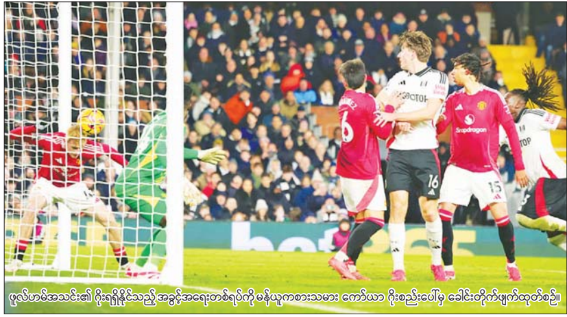
ဖူလ်ဟမ်အသင်း၏ ဂိုးရရှိနိုင်သည့် အခွင့်အရေးတစ်ရပ်ကို မန်ယူကစားသမား ကော်ယာ ဂိုးစည်းပေါ်မှ ခေါင်းတိုက်ဖျက်ထုတ်စဉ်။