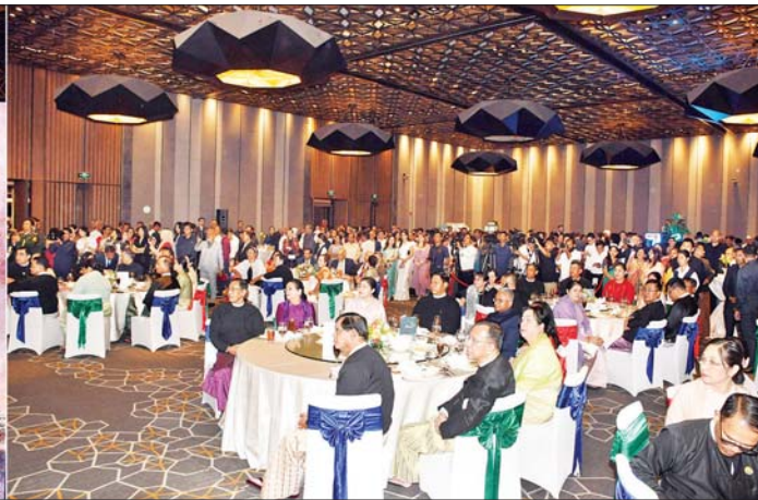
နိုင်ငံတော်စီမံအုပ်ချုပ်ရေးကောင်စီအဖွဲ့ဝင် ဒုတိယဝန်ကြီးချုပ်နှင့် နိုင်ငံတော်ဝန်ကြီးချုပ်ရုံး ပြည်ထောင်စုဝန်ကြီး ဗိုလ်ချုပ်ကြီး တင်အောင်စန်းနှင့်ဇနီး၊ အိန္ဒိယနိုင်ငံ သံအမတ်ကြီး H.E.Mr.Abhay Thakurနှင့် ဇနီး၊ အခမ်းအနားတက်ရောက်လာကြသူများ အိန္ဒိယနိုင်ငံယဉ်ကျေးမှုအဖွဲ့က ရိုးရာယဉ်ကျေးမှုအကများဖြင့် ကပြဖျော်ဖြေနေမှုကို ကြည့်ရှုအားပေးစဉ်။