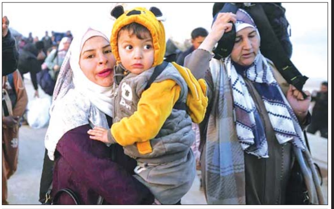
ဂါဇာကမ်းမြောင် မြောက်ပိုင်းရှိ နေအိမ်များသို့ ပြန်လာကြသော နေရပ်စွန့်ခွာ ပါလက်စတိုင်းလူမျိုးများကို ဇန်နဝါရီ ၂၇ ရက်က တွေ့ရစဉ်။

ဂါဇာ ဇန်နဝါရီ ၂၇ ၁၅ လအကြာ ဘေးလွတ်ရာ တိမ်းရှောင်ပြီးနောက် ပါလက်စတိုင်းလူမျိုး သောင်းနှင့်ချီ ဂါဇာမြို့ရှိ ၎င်းတို့၏ နေအိမ်များနှင့် ဂါဇာမြောက်ပိုင်းဒေသ များသို့ ဇန်နဝါရီ ၂၇ ရက်တွင် နေရပ်ပြန်သွားကြပြီ ဖြစ်ကြောင်း သိရသည်။ ဟားမားစ်နှင့် အစ္စရေးတို့အကြား ဇန်နဝါရီ ၃၁ ရက်မတိုင်မီ အစ္စရေးစားစာခံ အာဘဲလ် ရေဟုဒ် နှင့် နောက်ထပ်နှစ်ဦး ပြန်လွှတ်ပေးရေး သဘော တူညီမှုရရှိခဲ့သည်ဟု ကာတာနိုင်ငံက ဇန်နဝါရီ ၂၆ ရက် ညနေပိုင်းတွင် ထုတ်ပြန်ကြေညာပြီး နောက် ထိုက်သို့ ပါလက်စတိုင်းလူမျိုးများ နေရပ် ပြန်မှု ထွက်ပေါ်လာခြင်းဖြစ်သည်။ ဟားမားစ်တို့က ဖေဖော်ဝါရီ ၁ ရက်တွင် နောက်ထပ်စားစာခံသုံးဦး လွှတ်ပေးသွားဖွယ် ရှိသည်။ သဘောတူညီချက်အရ အစ္စရေးသည် ဇန်နဝါရီ ၂၇ ရက် နံနက်ပိုင်းမှစတင်ကာ ဂါဇာ ကမ်းမြောင်မြောက်ပိုင်းသို့ ဒေသခံများ နေရပ်ပြန် ရေးကို ခွင့်ပြုပေးထားသည်။ ဟားမားစ်အဖွဲ့သည် စားစာခံများ လွှတ်ပေး ရေး နောက်ထပ်အဆင့်တစ်ခုကို ဆက်လက် လုပ်ဆောင်ရန် လက်ခံသဘောတူညီကြောင်း အစ္စရေးဝန်ကြီးချုပ် ဘင်ဂျမင်နေတန်ယာဟု၏ ရုံးက ဇန်နဝါရီ ၂၇ ရက် အစောပိုင်းတွင် ထုတ်ဖော် ပြောကြားသည်။ ဆင်ဟွာ