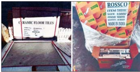
အေးရှားဝေါလ်ကုန်သွယ်မှုစစ်ဆေးရေးစခန်း၌ ဖမ်းဆီးရမိမှု။

ယင်းနောက် ဇန်နဝါရီ ၂၄ ရက်တွင် နေပြည်တော်တရားမဝင် ကုန်သွယ်မှုတိုက်ဖျက်ရေးအဖွဲ့၏ စီမံခန့်ခွဲမှုဖြင့် တာဝန်ကျ