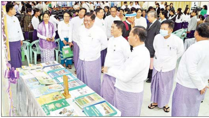
စိုက်ပျိုးရေး၊ မွေးမြူရေးနှင့် ဆည်မြောင်းဝန်ကြီးဌာန ပြည်ထောင်စုဝန်ကြီး ဦးမင်းဇော် စိုက်ပျိုးရေး သုတေသနဦးစီးဌာန၏ လုပ်ငန်းဆောင်ရွက်ချက်များကို ကြည့်ရှုအားပေးစဉ်။

စိုက်ပျိုးရေးကဏ္ဍ တိုးတက်ဖွံ့ဖြိုးစေရေး၌ အဓိကသော့ချက်ဖြစ်သည့် စိုက်ပျိုးရေးသုတေသန လုပ်ငန်းကို လွတ်လပ်ရေးမတိုင်မီ ၁၉၀၈ ခုနှစ်ခန့်မှ စ၍ စိုက်ပျိုးနည်းစနစ် သုတေသနလုပ်ငန်းများ စတင်ဆောင်ရွက်ခဲ့သည်ကို မှတ်တမ်းများအရ သိရှိရပြီး ၁၉၅၄ ခုနှစ် ဇူလိုင် ၂၅ ရက်တွင် အင်းစိန် မြို့နယ် ကြို့ကုန်း၌ စိုက်ပျိုးရေးသုတေသန ဗိမာန်