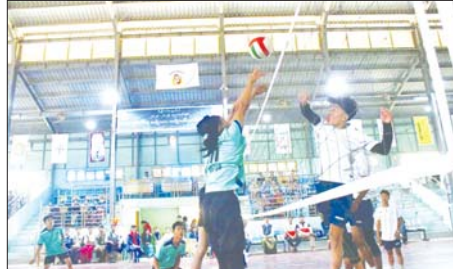
ကိုးသင်းနှင့် အမျိုးသမီး ကိုးသင်းကျင်းပမည်ဖြစ်ကြောင်း သိရသည်။ ချမ်းသာ(မိတ္ထီလာ)

အဆိုပါ ဖွင့်ပွဲအခမ်းအနားတွင် ပါမောက္ခချုပ်ဒေါက်တာ ဘဟနံက အမှာစကားပြောကြားသည်။ ထို့နောက် အမျိုးသား ဘော်လီဘောပြိုင်ပွဲကို ဆက်လက်ကျင်းပရာ ရူပဗေဒအသင်းနှင့် ဝိဇ္ဇာညွှန်ပေါင်းအသင်းတို့၏ ယှဉ်ပြိုင်ကစားမှုကို ပါမောက္ခချုပ် ဒေါက်တာဟန်၊ ဒုတိယပါမောက္ခချုပ် ဒေါက်တာကျော်လင်းနှင့် တာဝန်ရှိသူများ ဆရာ ဆရာမများ ကျောင်းသူကျောင်းသားများ ကြည့်ရှုအားပေးကြသည်။ အဆိုပါ အမျိုးသား၊ အမျိုးသမီး ဘော်လီဘောပြိုင်ပွဲတွင် အမျိုးသားအသင်း