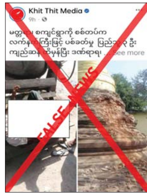
များရေးသား ဖြန့်ဝေခြင်းသာဖြစ်ကြောင်း သတင်းရရှိသည်။ သတင်းစဉ်

နှင့်အညီ ဆောင်ရွက်လျက်ရှိပြီး ကျေးရွာ များအတွင်းသို့ အကြောင်းမဲ့ တစ်စုံတစ်ရာ ပစ်ခတ်ခဲ့မှုမရှိကြောင်း၊ အကြမ်းဖက်သမား များအနေဖြင့် နယ်မြေတည်ငြိမ်အေးချမ်းမှု ပျက်ပြားစေရန်နှင့် ၎င်းတို့အပေါ် အားပေး ထောက်ခံမှုမရှိသည့် ကျေးရွာများအား အကြောက်တရား လွှမ်းမိုးစေရန် ကျေးရွာများ အတွင်းသို့ လက်နက်ကြီးများဖြင့် ပစ်ခတ်ခြင်း များ လုပ်ဆောင်လျက်ရှိရာ လူနေအိမ်များ ပျက်စီးပြီး အပြစ်မဲ့အရပ်သားပြည်သူများ သေဆုံး၊ ထိခိုက်၊ ဒဏ်ရာရရှိမှုများ လည်းရှိ ကြောင်း၊ ထိုသို့ အကြမ်းဖက်သမားများ၏ လုပ်ရပ်များကို ဖုံးကွယ်ရန်နှင့် လုံခြုံရေး တပ်ဖွဲ့ဝင်များအပေါ် ပြည်သူ့လူထုမှ အထင် အမြင်လွှဲမှားလာစေရန် ပြည်ပျက်မီဒီယာ များက လူမှုကွန်ရက်တွင် မဟုတ်မမှန်သတင်း