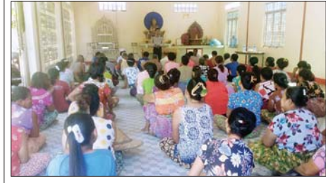
သစ်တောထိန်းသိမ်းရေး၊ ရေသယံဇာတထိန်းသိမ်းရေးနှင့် မီးခိုးမြို့ငွေလျှော့ချရေးဆိုင်ရာ အသိပညာပေးဟောပြော

ကျောင်းသား ကျောင်းသူများ အားလုံး ကျန်းမာသန်စွမ်းပြီး အာဟာရပြည့်ဝစေရေး၊ ကျန်းမာရေးနှင့် ညီညွတ်သော အမူအကျင့် များ စွဲမြဲကျင့်သုံးတတ်စေရန်အတွက် ပညာ ရေးနှင့် ကျန်းမာရေးအပေါ်အဝင် ကဏ္ဍပေါင်းစုံ ပူးပေါင်းဆောင်ရွက်ရန် မူလတန်း ကျောင်းသား ကျောင်းသူများ၏ ကြီးထွား ဖွံ့ဖြိုးကျန်းမာမှုနှင့် ပညာရေးတိုးတက်မှုများ အတွက် ကျန်းမာရေးနှင့် ညီညွတ်သော အစားအသောက်ပုံစံများ မြှင့်တင်ရန် ရည်ရွယ်ချက်ဖြင့် ကျောင်းတွင်း အာဟာရ ကျွေးမွေးခြင်း၊ သန့်ချဆေးတိုက်ကျွေးခြင်း၊ အာဟာရမူနာ ဖြည့်စွက်တိုက်ကျွေးခြင်း၊ အာဟာရအခြေတင် အသိပညာပေးခြင်း၊ အာဟာရပြည့်ဝမှုတည်ဆောက် အစားအစာများ ပြင်ဆင်ချက်ပြုတ်ပြသခြင်း၊ ကျန်းမာရေးနှင့် ညီညွတ်စေရန် ကျောင်းမှန်ဈေးတန်းများ စစ်ဆေးခြင်း၊ စနစ်တကျ လက်ဆေးခြင်းနှင့် နေ့လယ်စာ စားပြီး သွားတိုက်ခြင်းနှင့် ပတ်သက်၍ အသိပညာပေးခြင်းဆောင်ရွက် ပေးခဲ့ကြောင်း သိရသည်။ ခရိုင်(ပြန်/ဆက်)