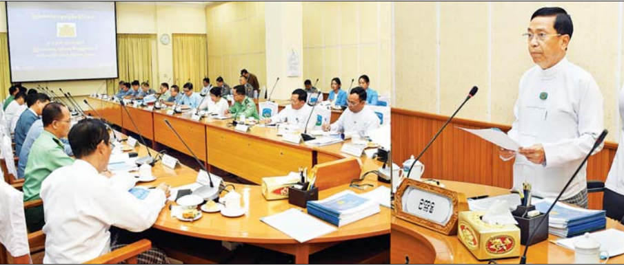
များမှ ဥက္ကဋ္ဌများ၊ အတွင်းရေးမှူးများ၊ အဖွဲ့ ဝင်များနှင့် တာဝန်ရှိသူများ တက်ရောက်ကြ သည်။

အစည်းအဝေးသို့ ပြည် ထောင်စုနေ့ကျင်းပရေး စီမံခန့်ခွဲမှု ကော်မတီဥက္ကဋ္ဌ နေပြည်တော် ကောင်စီဥက္ကဋ္ဌ ဦးသန်းထွန်းဦး၊ ပြည်ထောင်စုနေ့ ကျင်းပရေး စီမံ ခန့်ခွဲမှုကော်မတီနှင့် ဆက်ဆံရေးကော်မတီ