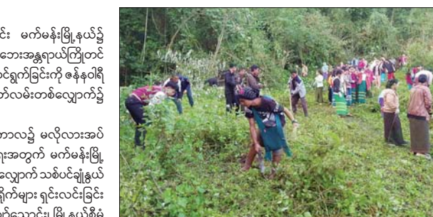
မက်မန်းမြို့ပေါ်ရှိ ဒေသခံပြည်သူများ စုစုပေါင်း ၁၅၀ တို့က စုပေါင်း၍ မီးတားလမ်းများ ဆောင်ရွက်ခဲ့ကြောင်း သိရသည်။