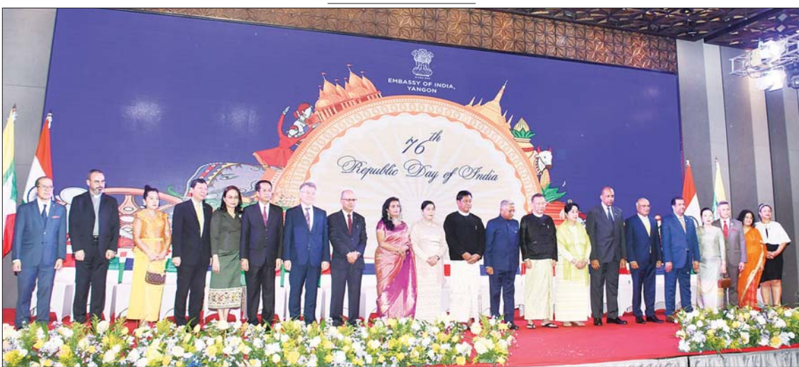
နိုင်ငံတော်စီမံအုပ်ချုပ်ရေးကောင်စီအဖွဲ့ဝင် ဒုတိယဝန်ကြီးချုပ်နှင့် နိုင်ငံတော်ဝန်ကြီးချုပ်ရုံး ပြည်ထောင်စုဝန်ကြီး ဗိုလ်ချုပ်ကြီး တင်အောင်စန်းနှင့်ဇနီး၊ အိန္ဒိယနိုင်ငံ သံအမတ်ကြီး H.E.Mr.Abhay Thakurနှင့် ဇနီး၊ အခမ်းအနားတက်ရောက်လာကြသူများ စုပေါင်းမှတ်တမ်းတင်ဓာတ်ပုံရိုက်စဉ်။

ဦးစွာ မြန်မာနိုင်ငံဆိုင်ရာ အိန္ဒိယနိုင်ငံ သံအမတ်ကြီး H.E.Mr.Abhay Thakurနှင့် ဇနီးနှင့် တာဝန်ရှိသူများက အခမ်းအနားသို့ တက်ရောက်လာကြသော နိုင်ငံတော်စီမံအုပ်ချုပ်ရေးကောင်စီအဖွဲ့ဝင် ဒုတိယဝန်ကြီးချုပ်နှင့် နိုင်ငံတော်ဝန်ကြီးချုပ်ရုံး ပြည်ထောင်စုဝန်ကြီးဗိုလ်ချုပ်ကြီး တင်အောင်စန်းနှင့်ဇနီး၊ ရင်းနှီးမြှုပ်နှံမှုနှင့် နိုင်ငံခြားစီးပွားဆက်သွယ်ရေး ဝန်ကြီးဌာန ပြည်ထောင်စုဝန်ကြီး ဒေါက်တာကဝေနှင့် ဇနီး၊ မြန်မာနိုင်ငံ အမျိုးသားလူ့အခွင့်အရေးကော်မရှင်ဥက္ကဋ္ဌ ဦးပေါ်လွင်စိန်နှင့် ဇနီး၊ ဒုတိယဝန်ကြီးများနှင့် ၎င်းတို့၏ ဇနီးတို့အား ရင်းရင်းနှီးနှီးကြိုဆိုနှုတ်ဆက်ကြသည်။