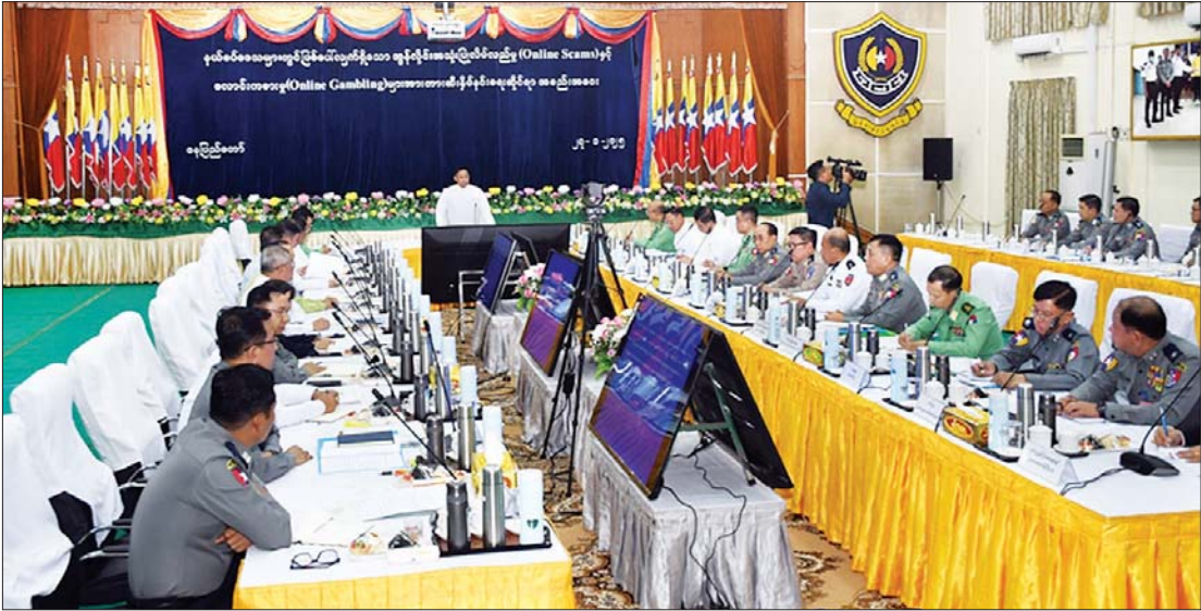
ပြည်ထောင်စုဝန်ကြီး ဒုတိယဗိုလ်ချုပ်ကြီးရာပြည့် နယ်စပ်ဒေသများတွင် ဖြစ်ပေါ်လျက်ရှိသော အွန်လိုင်းအသုံးပြုလိမ်လည်မှု (Online Scam)နှင့် လောင်းကစားမှု (Online Gambling)များအား တားဆီးနှိမ်နင်းရေးဆိုင်ရာ အစည်းအဝေးတွင် အမှာစကားပြောကြားစဉ်။

နေပြည်တော် ဇန်နဝါရီ ၂၇ နယ်စပ်ဒေသများတွင် ဖြစ်ပေါ်လျက်ရှိသော အွန်လိုင်းအသုံးပြုလိမ်လည်မှု (Online Scam)နှင့် လောင်းကစားမှု (Online Gambling)များအား တားဆီးနှိမ်နင်းရေးဆိုင်ရာ အစည်းအဝေးကို ယနေ့ မွန်းလွဲ ၃ နာရီတွင် နေပြည်တော်ရှိ မြန်မာနိုင်ငံ ရဲတပ်ဖွဲ့ဌာနချုပ် အရိန္ဒမာခန်းမ၌ ကျင်းပသည်။