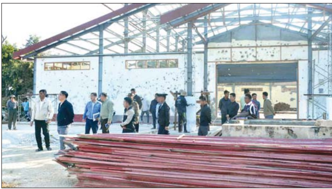
အဆိုများနှင့် အုတ်တံတိုင်းခြံစည်းရိုးများ ပြုပြင် ဆောင်ရွက်ပြီးစီးမှု အခြေအနေများကို ကြည့်ရှု စစ်ဆေးပြီး ဌာနများအနေဖြင့် သက်ဆိုင်ရာရုံးနေရာ များ၌ ပြန်လည်ဖွင့်လှစ်၍ ပုံမှန်ရုံးလုပ်ငန်းများ စနစ်တကျဆောင်ရွက်ရန် တာဝန်ရှိသူများအား မှာကြားခဲ့သည်။

လွိုင်ကော် ဇန်နဝါရီ ၂၇ ကယားပြည်နယ်အစိုးရအဖွဲ့အနေဖြင့် ဒေသဖွံ့ဖြိုး တိုးတက်ရေးနှင့် ပြန်လည်ထူထောင်ရေးလုပ်ငန်းများ ကို အရှိန်အဟုန်ဖြင့် အလေးထားအကောင်အထည် ဖော်ဆောင်ရွက်လျက်ရှိရာ ပြည်နယ်ဝန်ကြီးချုပ် ဦးဇော်မျိုးတင်သည် ပြည်နယ်အစိုးရအဖွဲ့ဝင်များနှင့် အတူ ယနေ့နံနက်ပိုင်းက ဌာနဆိုင်ရာ ရုံးအဆောက် အအုံများနှင့် ဝန်ထမ်းအိမ်ရာများ၊ အားကစားကွင်း၊ အားကစားရုံများ ပြန်လည်ပြုပြင်ဆောင်ရွက်နေမှု များကို ကြည့်ရှုစစ်ဆေးသည်။