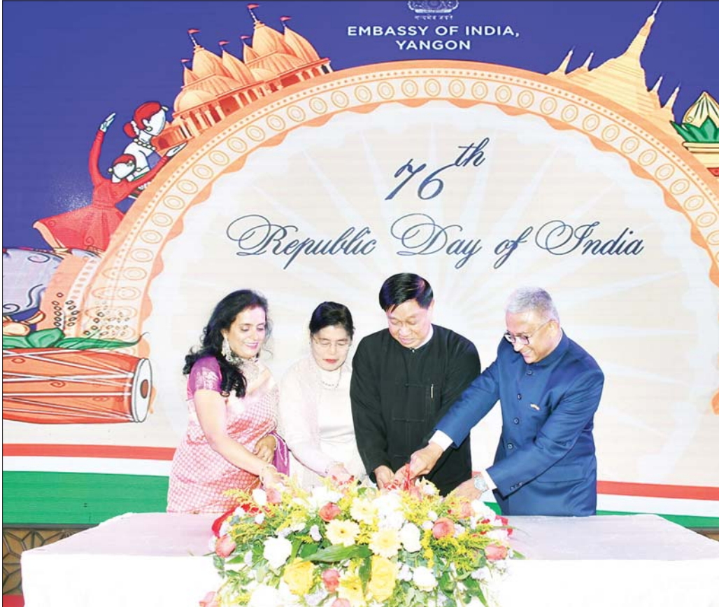
နိုင်ငံတော်စီမံအုပ်ချုပ်ရေးကောင်စီအဖွဲ့ဝင် ဒုတိယဝန်ကြီးချုပ်နှင့် နိုင်ငံတော်ဝန်ကြီးချုပ်ရုံး ပြည်ထောင်စုဝန်ကြီး ဗိုလ်ချုပ်ကြီး တင်အောင်စန်းနှင့် ဇနီးနှင့် အိန္ဒိယနိုင်ငံ သံအမတ်ကြီး H.E.Mr.Abhay Thakurနှင့် ဇနီးတို့ အိန္ဒိယသမ္မတနိုင်ငံ၏ (၇၆) နှစ်မြောက် အမျိုးသားနေ့အထိမ်းအမှတ် ကိုတံဆိပ်ကို လှီးဖြတ်ပေးစဉ်။