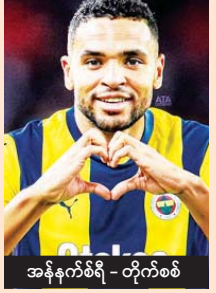
အန်နက်စ်ရီ - တိုက်စစ်

ဒိန်းမတ်ကလပ် မစ်ဂျေးလန်းရော တူကီယံကလပ် ဖီနာဘာချီအသင်းပါ ရှုံးထွက်အဆင့် တက်လှမ်းနိုင်ရေးကိုသာ အဓိကယှဉ်ပြိုင်ကစားသွားရမှာဖြစ်တယ်။ နှစ်သင်းစလုံး ဒီပွဲစဉ်နိုင်ပွဲရရှိမှသာ ရှုံးထွက်အဆင့်တက်လှမ်းဖို့ မျှော်လင့်နိုင်မှာ ဖြစ်တယ်။ ဖီနာဘာချီအသင်းကို မန်ယူနည်းပြဟောင်း မော်ရင်ဟို တာဝန်ယူတိုင်တွယ်နေပေမယ့် ယူရိုပါလိဂ်မှာ ရလဒ်ပိုင်းကောင်းမွန်မှုမရှိဘဲ ရုန်းကန်နေရတဲ့ အသင်းဖြစ်တယ်။ ဒါကြောင့် မစ်ဂျေးလန်းအသင်းထက် မော်ရင်ဟိုရဲ့ ဖီနာဘာချီအသင်း နိုင်ပွဲရဖွယ်ရှိတယ်။