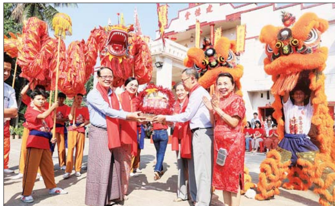
ရီသူများက နှစ်သစ်ကူးအံပေါင်း များ ပေးအပ်ချီးမြှင့်ကြသည်။ ယင်းနောက် ပြည်နယ်ဝန်ကြီး ချုပ်နှင့် တာဝန်ရှိသူများက ကျန်တိုက် ဘုံကျောင်းအတွက် ငွေကျပ် ၁၀ သိန်းနှင့် နှစ်သစ်ကူး အထိမ်းအမှတ်လက်ဆောင်များ ကို ဘုံကျောင်းတာဝန်ရှိသူများ ထံ ပေးအပ်ချီးမြှင့်ရာ ဘုံကျောင်း တာဝန်ရှိသူများက နှစ်သစ်ကူး အထိမ်းအမှတ် လက်ဆောင်များ အပြန်အလှန် ပေးအပ်ချီးမြှင့် ကြသည်။ (အပေါ်ပုံ) စည်ကားသိုက်မြိုက်စွာကျင်းပ တရုတ်မြေနှစ်သစ် ညဇာတ် မဟာဗျူဟာပြောင်းလဲခြင်း၊ အသစ်တစ်ဖန် ပြန်လည်ဖွဲ့စည်းခြင်း၊ တိုးတက်ကြီးပွားခြင်း၊

ဘားအံ ဇန်နဝါရီ ၂၉ ရုံးရာနစ်သစ်ကူးခံများဖြင့် ဂါရဝ ၂၀၂၅ ခုနှစ် မြေနှစ် တရုတ်နှစ်သစ် ကူးအထိမ်းအမှတ် စုပေါင်း ကန်တော့ခြင်းနှင့် နှစ်သစ်ကူး မင်္ဂလာအခမ်းအနားကို ယနေ့ နံနက်ပိုင်းက ဘားအံမြို့ အမှတ် (၁)ရပ်ကွက်ရှိ ဘားအံကျွန်းတိုက် ပုဒ္ဓဘာသာ ဘုရားကျောင်း၌ ကျင်းပရာ ကရင်ပြည်နယ်ဝန်ကြီး ချုပ် ဦးစောမြင့်ဦး၊ ပြည်နယ် တရားလွှတ်တော် တရားသူကြီး ချုပ် ဦးညွန့်လင်း၊ ပြည်နယ်အစိုးရ အဖွဲ့ဝင်များနှင့် တာဝန်ရှိသူများ တက်ရောက်ချီးမြှင့်ကြသည်။ စုပေါင်းကန်တော့ ဦးစွာ နှစ်သစ်ကူးမင်္ဂလာ အခမ်းအနားသို့တက်ရောက်လာ သော ပြည်နယ်ဝန်ကြီးချုပ်နှင့် တာဝန်ရှိသူများအား ဘုံကျောင်း တာဝန်ရှိသူများက လှိုက်လှ နွေးထွေးစွာကြိုဆိုကြပြီး တရုတ်