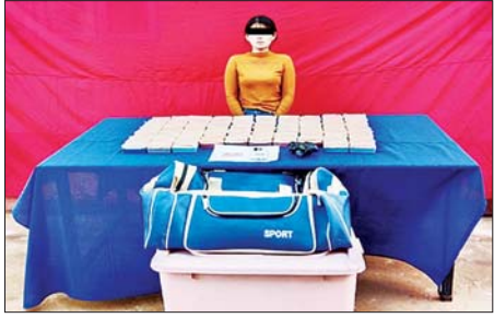
မကြာကြာဌေးအား သိမ်းဆည်းရမိသည့် ဘိန်းဖြူများနှင့်အတူ တွေ့ရစဉ်။