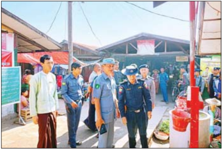
အောင်နှင့် ပူးပေါင်း အဖွဲ့တို့က မီးဘေးအန္တရာယ် ကြိုတင် ကာကွယ်ရေး ဆိုင်ရာများကို မြို့နယ် (ပြန်/ဆက်)

ကြံခင်း ဇန်နဝါရီ ၂၉ ဧရာဝတီတိုင်းဒေသကြီး ကြံခင်း မြို့၌ မီးဘေးအန္တရာယ် မကျရောက် စေရန်နှင့် ကြိုတင် ကာကွယ်မှုများ ပြုလုပ်နိုင်ရန်အတွက် မြို့နယ် မီးသတ်ဦးစီးဌာနနှင့် ဌာနဆိုင်ရာ များပူးပေါင်းကာ ယနေ့နံနက်ပိုင်း က မြို့မစည်ပင်သာယာဈေးကြီး ၌ မီးဘေးအန္တရာယ် ကြိုတင် ကာကွယ်ရေး လုပ်ငန်းများ ဆောင်ရွက်ထားရှိမှု အခြေအနေ ကို ကွင်းဆင်းစစ်ဆေးခဲ့ကြောင်း သိရသည်။ ထိုသို့ ဆောင်ရွက်ရာတွင်