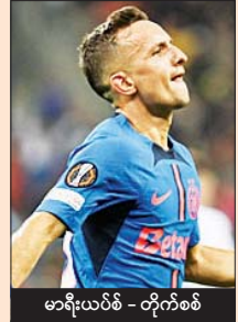
မာရီးယပ်စ် - တိုက်စစ်