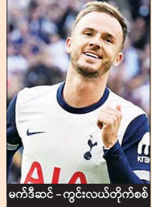
မက်ဒီဆင် - ကွင်းလယ်တိုက်စစ်