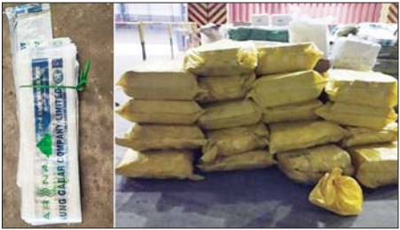
မြန်မာ့စက်မှုဆိုင်ကမ်း၌ ဖမ်းဆီးရမိမှု။

တစ်စီးပေါ်မှ တရားဝင်စာရွက်စာတမ်းအထောက်အထား တင်ပြနိုင်ခြင်း မရှိသည့် လုပ်ငန်းသုံးပစ္စည်း နှစ်မျိုး၊ လူသုံးကုန်ပစ္စည်းတစ်မျိုး (ခန့်မှန်း တန်ဖိုးငွေကျပ် ၂၀၀၀၀၀၀)နှင့် အဆိုပါပစ္စည်းများ တင်ဆောင်လာ သည့် စက်မှုဇုန်ထုတ် Pyay Truck တစ်စီး (ခန့်မှန်းတန်ဖိုးငွေကျပ် ၂၅၀၀၀၀၀) စုစုပေါင်း ခန့်မှန်းတန်ဖိုးငွေကျပ် ၄၅၀၀၀၀၀)ကို ဖမ်းဆီးရမိခဲ့ပြီး အကောက်ခွန်လုပ်ထုံးလုပ်နည်းများနှင့်အညီ အရေးယူ ဆောင်ရွက်လျက်ရှိသည်။