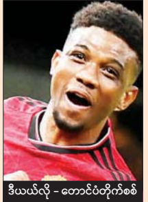
ဒီယယ်လို့ - တောင်ပံတိုက်စစ်

အုပ်စုပွဲစဉ် ခုနစ်ပွဲကစားပြီးချိန်မှာ မန်ယူက ရမှတ် ၁၅ မှတ်နဲ့ နောက်တစ်ဆင့်ကို တိုက်ရိုက်တက်လှမ်းခွင့်ရဖို့ နီးစပ်နေသလို ပြိုင်ဘက်အက်ဖ်စီအက်စ်ဘီအသင်းကလည်း ရမှတ် ၁၄ မှတ်နဲ့ တိုက်ရိုက်တက်လှမ်းခွင့်ရဖို့ အခြေအနေကောင်းနေပါတယ်။ သို့သော်ငြား နှစ်သင်းစလုံး ရမှတ် လိုအပ်ချက်ရှိနေသေးတဲ့အတွက် နိုင်ပွဲရရေး ဦးတည်လာမှာဖြစ်တာကြောင့် ပြိုင်ဆိုင်မှုပြင်းထန်လာမှာ သေချာတယ်။ ခြေစွမ်းပြသနိုင်တဲ့အသင်းထက် ရရှိလာမယ့် အခွင့်အရေးကို ဂိုးအဖြစ်ပြောင်းလဲနိုင်စွမ်းရှိတဲ့ အသင်းနိုင်ပွဲရမယ်။