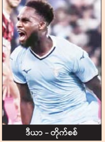
ဒီယာ - တိုက်စစ်

လာဇီယိုက ဒီပွဲစဉ်မတိုင်မီ နောက်တစ်ဆင့်ကို တိုက်ရိုက်တက်လှမ်းထားနိုင်ပြီဖြစ်လို့ လူစုံထုတ်လာဖွယ်မရှိဘူး။ ပေါ်တူဂီကလပ် ဘရာဂါက လာဇီယိုကို နိုင်ပွဲရမှသာလျှင် ရှုံးထွက်အဆင့်တက်လှမ်းနိုင်ရေး မျှော်လင့်နိုင်မှာ ဖြစ်တယ်။ ဘရာဂါက တိုက်စစ် ခံစစ်ဆိုးရွားတဲ့အသင်းထဲ ပါဝင်နေတယ်။ မဖြစ်မနေနိုင်ပွဲရဖို့ လိုအပ်နေတယ်ဆိုသော်ငြား ယူရိုပါလိဂ်မှာ တိုက်စစ်၊ ခံစစ်အကောင်းဆုံးအသင်းအဖြစ် ရပ်တည်နေတဲ့ လာဇီယိုကို အခက်တွေ့အောင်သာ ကစားနိုင်ဖွယ်ရှိပြီး နိုင်ပွဲရတဲ့အထိ စွမ်းဆောင်နိုင်ဖွယ်မရှိဘူး။