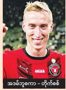
အဒမ်ဘူစကာ - တိုက်စစ်