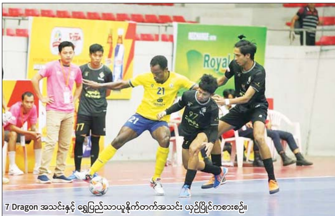
7 Dragon အသင်းနှင့် ရွှေပြည်သာယူနိုက်တက်အသင်း ယှဉ်ပြိုင်ကစားစဉ်။

ကို လေးဂိုး-နှစ်ဂိုး၊ Black Cross အသင်းက 7 Brother အသင်းကို ခုနစ်ဂိုးပြတ်၊ 7 Dragon အသင်းက ရွှေပြည်သာယူနိုက်တက်အသင်းကို သုံးဂိုး - နှစ်ဂိုး၊ Pacific Sun Far အသင်းက TG United အသင်းကို လေးဂိုး-နှစ်ဂိုး၊ YCDC Marga Youth အသင်းက လက်ဝဲသုနရအသင်းကို နှစ်ဂိုး - ဂိုးမရှိ၊ JZ Yangon အသင်းက Maryar အသင်းကို ခုနစ်ဂိုး - လေးဂိုးဖြင့် အနိုင်ရရှိသည်။ ပွဲစဉ် (၈) အပြီးတွင် TG United အသင်းက ၁၈ မှတ်၊ စာမျက်နှာ ၃၃ ကော်လံ ၅ ■