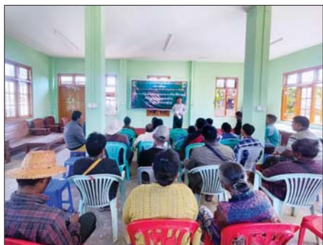
ဟိုပုံးမြို့နယ်၌ သစ်တောထိန်းသိမ်းရေး၊ ရေသယံဇာတထိန်းသိမ်းရေးနှင့် မီးခိုးမြှူငွေ့ လျှော့ချရေးဆိုင်ရာ အသိပညာပေးဟောပြောပွဲကျင်းပ

ဟင်္သာတ ဇန်နဝါရီ ၂၉ ဟင်္သာတအကျဉ်းထောင်တွင် အကျဉ်းသား/အချုပ်သားများအား ကျန်းမာရေးအသိပညာပေးခြင်းနှင့် ရှာဖွေကုသခြင်းလုပ်ငန်းများကို ခရိုင်ပြည်သူ့ကျန်းမာရေးဦးစီးဌာနက ကွင်းဆင်းဆောင်ရွက်ခဲ့သည်။