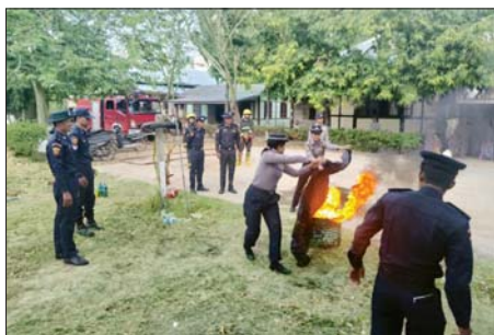
ဖြင့် မီးငြိမ်းသတ်ခြင်း၊ ဆီမီးသရုပ်ပြ လေ့ကျင့်ခဲ့ကြောင်း လောင်းခြင်း ငြိမ်းသတ်နည်း စသည်တို့ကို လက်တွေ့ငြိမ်းသတ်ခရိုင် (ပြန်/ဆက်)

ရမည်းသင်း ဇန်နဝါရီ ၂၉ မန္တလေးတိုင်းဒေသကြီး ရမည်းသင်းခရိုင်အတွင်း မီးဘေးအန္တရာယ် ကင်းဝေးရေးအတွက် ခရိုင်မီးသတ်ဦးစီးဌာနနှင့် ခရိုင်ရဲတပ်ဖွဲ့မှူးများ တို့ပူးပေါင်း၍ မီးဘေးအန္တရာယ် ကြိုတင်ကာကွယ်ရေး အသိပညာပေးဟောပြောပွဲနှင့် သရုပ်ပြလေ့ကျင့်ခြင်းကို ယနေ့နံနက် ၉နာရီက ခရိုင်ရဲတပ်ဖွဲ့မှူးရုံး၌ ဆောင်ရွက်သည်။