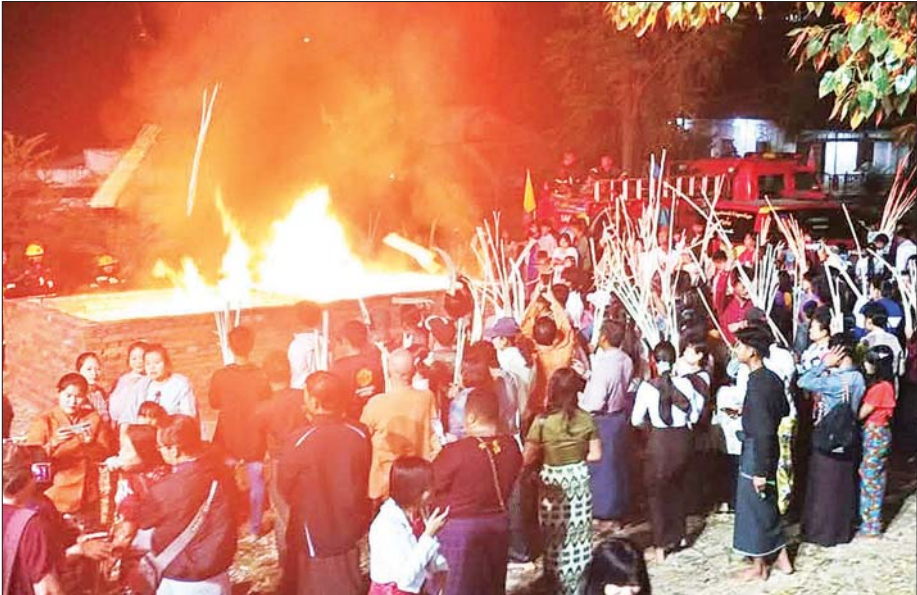
ပြည်မြို့၊ လေးဆူဓာတ်ပျော်ရွှေဆံတော်စေတီတော်မြတ်ကြီး၌ အကြိမ် (၁၀၀)မြောက် ညရိုးမီးပူဇော်ပွဲကို ယမန်နံနက် စည်ကားသိုက်မြိုက်စွာ ကျင်းပခဲ့မှုကို တွေ့ရစဉ်။