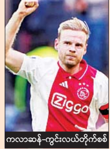
ကလာဆန် - ကွင်းလယ်တိုက်စစ်