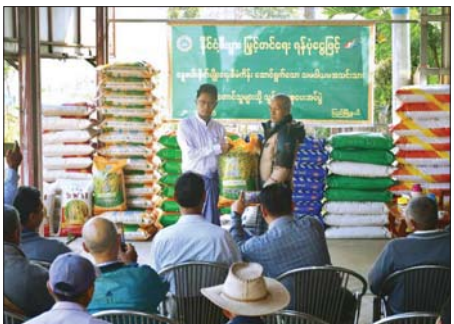
ဦးစော်မင်းသိန်းနှင့် မြို့နယ် ၂၀၂၅) ဘဏ္ဍာနှစ် နွေစပါးစိုက်ပျိုးသည့် အခြေခံသမဝါယမအသင်းသား သွင်းအားစုပေးအပ်ပုံအခမ်းအနားကို ပြည်မြို့နယ်၌ (ပြန်/ဆက်)

ပြည် ဇန်နဝါရီ ၂၉ ပဲခူးတိုင်းဒေသကြီး ပြည်မြို့နယ်၌ သမဝါယမကဏ္ဍမှ နိုင်ငံစီးပွားဖြင့်တင်ရေးရန်ပုံငွေဖြင့် (၂၀၂၄-၂၀၂၅) ဘဏ္ဍာနှစ် နွေစပါး စိုက်ပျိုးသည့် သမဝါယမအသင်းသား တောင်သူများအတွက် သွင်းအားစုပေးအပ်ပုံအခမ်းအနားကို ယနေ့နံနက်ပိုင်းက ပြည်မြို့ ရွှေတံခါးရပ်တွင် တာဝလမ်းဆုံအနီးရှိ (သမာဓိ) မြို့စေ့နှင့်စိုက်ပျိုးရေးသုံးဆေးပစ္စည်း အရောင်းဆိုင်၌ ကျင်းပသည်။