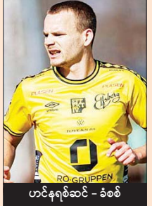
ဟင်နရစ်ဆင် - ခံစစ်

ရှုံးထွက်အဆင့်တက်လှမ်းဖို့ မြေကုန်ထုတ်လာမယ့် အက်ဖ်စီဘော့ဂ်အသင်းက နောက်တစ်ဆင့်ကို တိုက်ရိုက်တက်လှမ်းဖို့ ရမှတ်လိုအပ်ချက်ရှိနေသေးတဲ့ စပါးအသင်းကို ခက်ခက်ခဲခဲ ယှဉ်ပြိုင်ကစားရဖယ်ရှိတယ်။ ရမှတ်လိုအပ်ချက်ရှိတဲ့ အသင်းနှစ်သင်း တွေ ဆုံမှုဖြစ်တဲ့အတွက် ပြိုင်ဆိုင်မှု ပြင်းထန်လာမှာ သေချာတယ်။ မည်သို့ပင်ဆိုစေ အက်ဖ်စီဘော့ဂ်အသင်း ကစားပုံထက်မြက်မှုရှိသော်ငြား ခြေစွမ်းသာလွန်မှုရှိတဲ့ စပါးအသင်းသာ နိုင်ပွဲရပြီး နောက်တစ်ဆင့်ကို တိုက်ရိုက်တက်လှမ်းခွင့်ရမယ်။